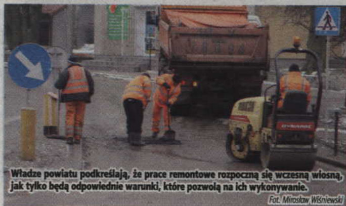
Władze powiatu podkreślają, że prace remontowe rozpoczną się wczesną wiosną, jak tylko będą odpowiednie warunki, które pozwolą na ich wykonywanie.

Kolejny przetarg ma dotyczyć pielęgnacji poboczy dróg powiatowych. Na razie nie wiadomo ile pieniędzy zostanie przeznaczonych na przeprowadzenie wszystkich zabiegów na drogach powiatowych w tym roku. Zależać to będzie od środków, które uda się zaoszczędzić na zimowym utrzymaniu dróg. (jk)