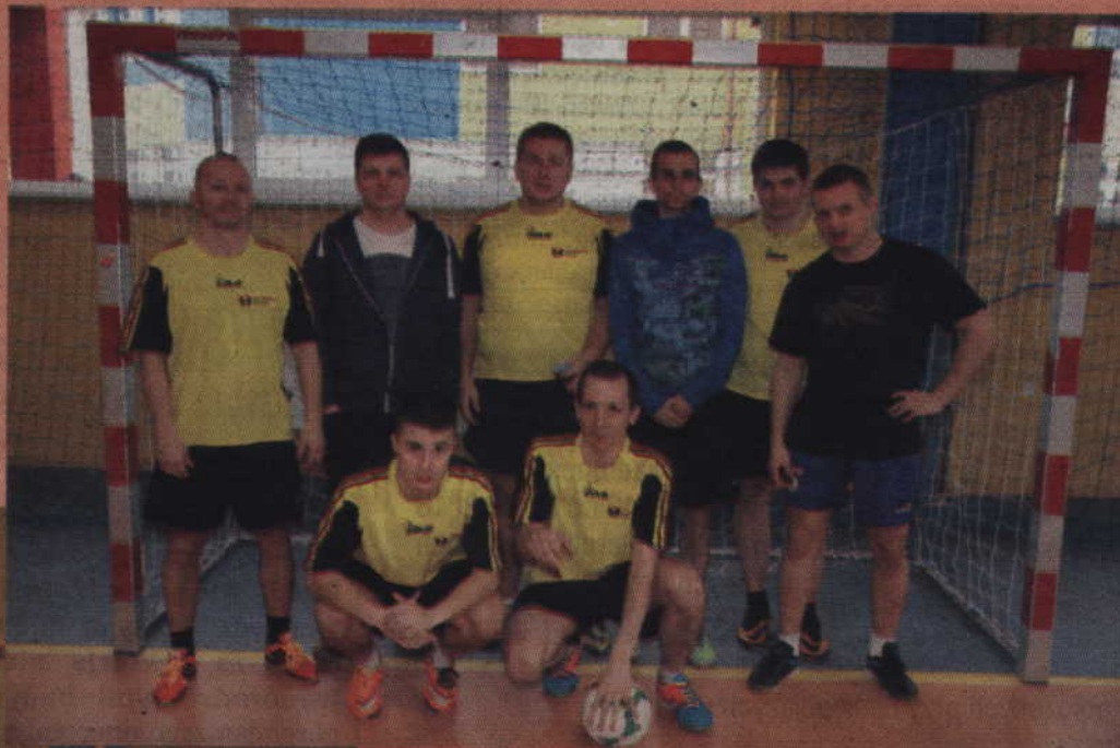
Zwycięska drużyna turnieju piłkarskiego - Futsal Prabuty.

„Działając razem tak naprawdę nikt nikomu nie przeszkadza. Organizując tegoroczną edycję mogliśmy zaangażować więcej organizacji. To pozwoliło na przysłowiowe wyciągnięcie z domu większej liczby osób. Jako klubowi właśnie o to nam chodziło. Pogoń Prabuty to przecież nie tylko