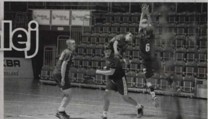
Zawodnicy MTS Kwidzyn, po ciężkiej walce, awansowali do ćwierćfinału mistrzostw Polski juniorów.

Już na początku drugiej połowy meczu Ciechanów odrobił straty i doprowadził do remisu 14:14. Potem jednak ponownie do ataku przystąpili kwidzynianie, którzy w 40 minucie gry prowadzili 19:15. Mniejsza lub większa przewaga MTS utrzymywała