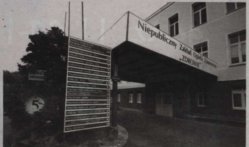
Spółka EMC Instytut Medyczny zarządza kwidzyńskim szpitalem od 2013 roku.