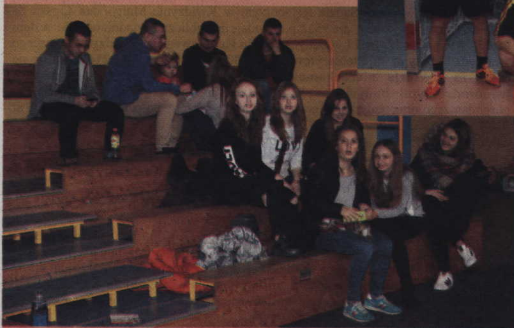
Organizatorzy zachęcali młodzież do przyścia na halę.