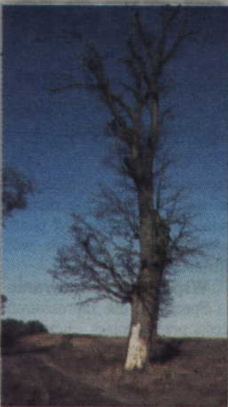
Wiekowy dąb rośnie przy drodze polnej Nowa Wioska - Otoczyn.

Przed kilkudziesięciu laty dawni gospodarze tych ziem obsadzali drzewami nie tylko drogi główne, ale również i polne. Powstawały w ten sposób aleje złożone z samych lip czy kasztanowców. Drzewa przetrwały czasy zawieruchy wojennej, lata budowania demokracji ludowej, ale na pewno nie przetrwały zderzenia z czasami współczesnymi. Zdrowe drzewa są bowiem często celowo niszczone, aby usychały i