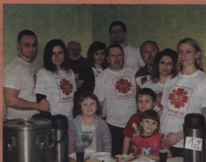
Caritas Prabuty zadbał o stoisko kulinarne.