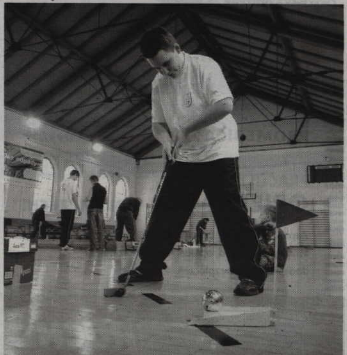
Halowe Mistrzostwa Kwidzyna od lat skupiają sympatyków minigolfa nie tylko z województwa pomorskiego.

Więcej informacji na temat turnieju będzie udziela Marek Sroka, pod nr tel. 55 279 38 66 lub 509 393 979. (fox)