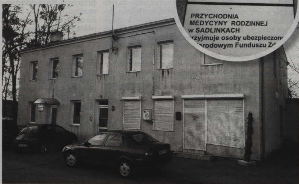
Małżeństwo straciło przytomność w sadlińskiej przychodni. Stąd oboje trafili do kwidzyńskiego szpitala.

-We wstępnej rozmowie z pacjentami pojawiła się informacja, że obydwójce zjedli owoce kiwi. Nie wiadomo jednak czy doszło do zatrucia tymi owocami. Jest to na razie tylko hipoteza. Na tym etapie trudno wyrokować. Obydwójce zostali przewiezieni na