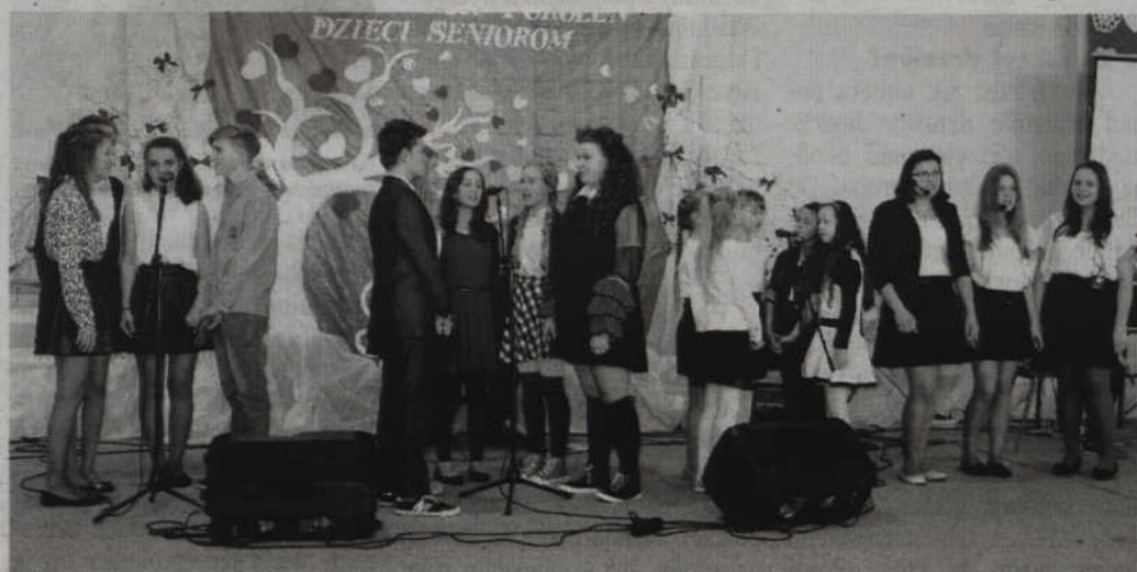
Uczniowie zaprezentowali gościom specjalny program artystyczny.

Specjalnie dla zaproszonych gości przedszkolacy i uczniowie szkoły zaprezentowali przygotowany program artystyczny, w którym nie zabrakło inscenizacji, wierszy, tańców i wesołych piosenek. Po zakończonej oficjalnej części uroczystości przyszedł natomiast czas na wspólne biesiadowanie. Wyśmienite dania przygotowali rodzice oraz panie z Koła Gospodyń Wiejskich z Nebrowa Wielkiego. Jako, że spotkanie wypadło w Tłusty Czwartek, na stołach nie mogło zabraknąć również słodkich smakołyków. Wspólna zabawa, śpiew, wspomnienia wypełniały salę gimnastyczną jeszcze przez kilka godzin. (RB)