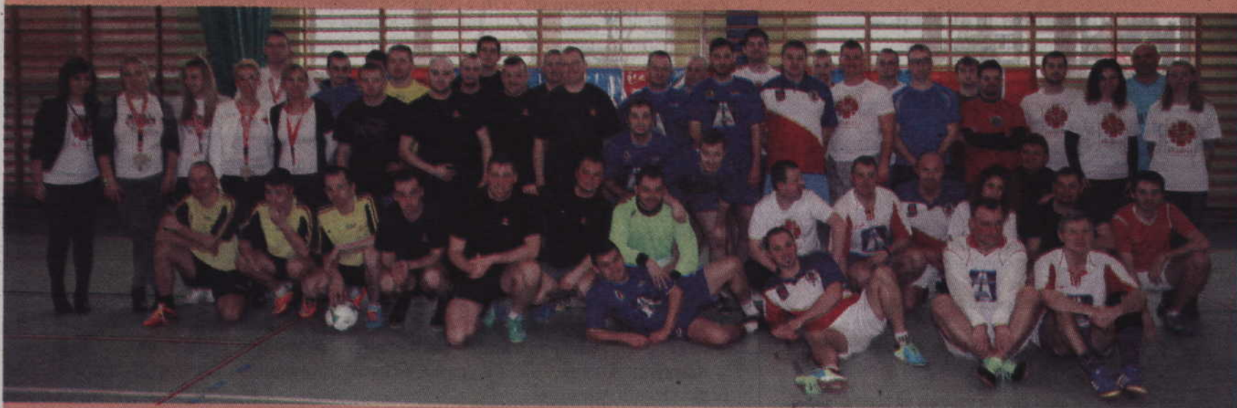
Wspólne zdjęcie zawodników i organizatorów imprezy „Pogoń uczy pomagać”.

Można powiedzieć, że stało się już pewną tradycją, że za organizację turnieju piłkarskiego odpowiada trener drużyny seniorów. Zapraszając do akcji fundację DKMS pokazaliśmy jednak