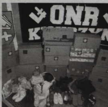
Niektóre rzeczy zgromadzone dzięki zbiórce kwidzyńskiego oddziału ONR.

KWIDZYN. Obóz Narodowo-Radykalny oddział Kwidzyn przeprowadził trzecią już zbiórkę ubrań. Dzięki zaangażowaniu mieszkańców udało się zebrać sporą ilość ubrań damskich, męskich oraz dziecięcych. Były to m.in. dobrej jakości spodnie, koszulki, bluzki, kurtki, buty, torebki czy zabawki dla najmłodszych. Wszystkie rzeczy, za pośrednictwem kwidzyńskiego Caritasu przy parafii św. Jana Ewangelisty w najbliższym czasie trafią do potrzebujących mieszkańców Kwidzyna. -Podziękowania dla wszystkich darczyńców, którzy wcielając w życie ideę narodowego solidaryzmu, zdecydowali się wziąć udział w naszej akcji, przekazać ubrania, a tym samym wesprzeć potrzebujących kwidzyńców - podkreślają organizatorzy akcji. (n)