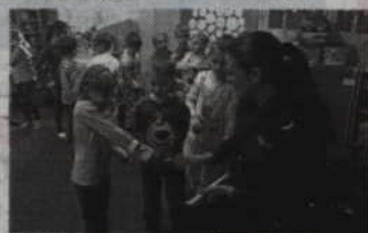
Na koniec dzieci otrzymały w prezencie opaski odblaskowe.

baw w domu i na podwórku oraz dlaczego trzeba być ostrożnym w kontaktach z osobami obcymi i jak należy się zachować, gdy taka