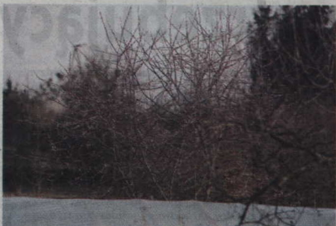
W Gardeji wiosna daje o sobie znać - pojawił się bazie i przebiśniegi.