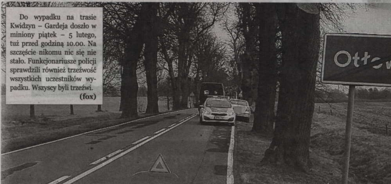
Do wypadku doszło na trasie Kwidzyn – Gardeja, tuż za wyjazdem z Ottowca..