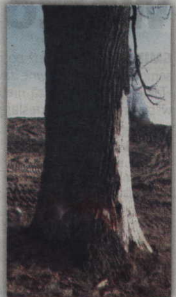
Na zdjęciu widać ślady na pniu drzewa spowodowane uderzeniami siekiarą.