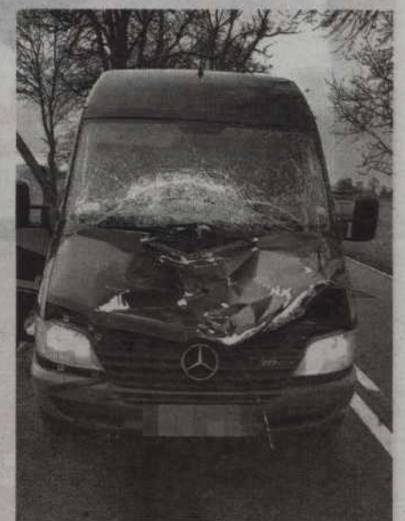
Tak wygląda maska mercedesa sprintera po uderzeniu koła zapasowego ciężarówki.