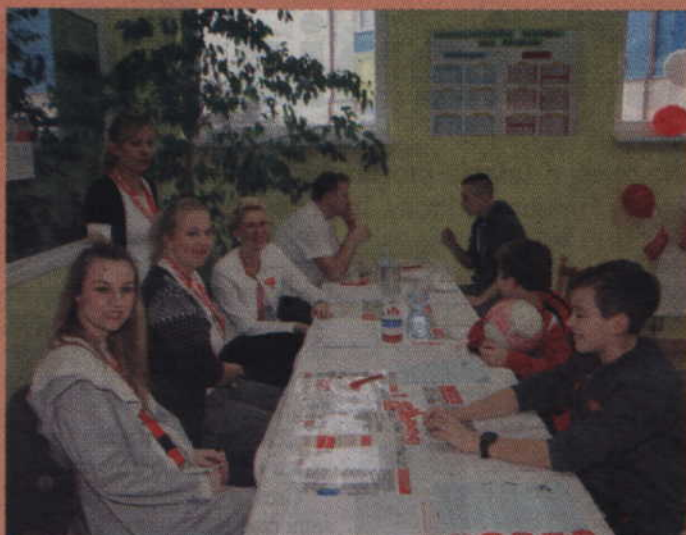
33 osoby zarejestrowały się w bazie potencjalnych dawców szpiku kostnego.