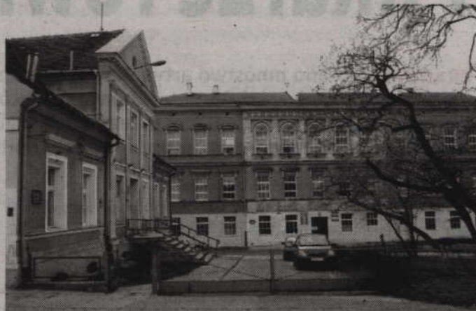
(jk) W ramach projektu władze powiatu chcą przeprowadzić modernizację gmachu Zespołu Szkół Ponadgimnazjalnych nr 2.

Projekt dotyczy także tzw. części „miękkiej”, obejmującej dofinansowania szkoleń, kursów oraz zakupu wyposażenia szkolnych pracowni.