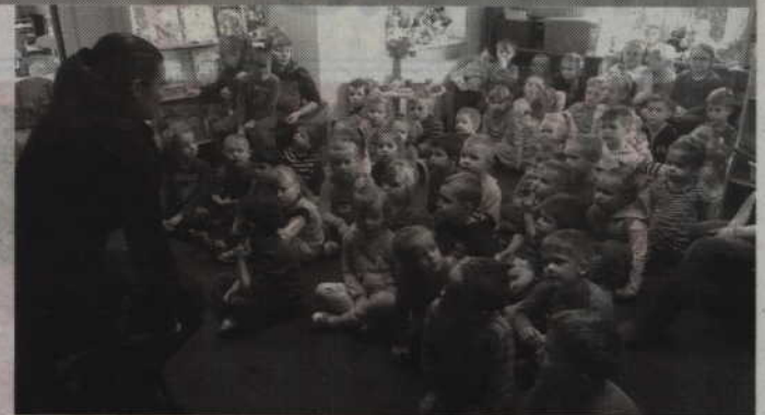
Przedszkolaki z uwagą słuchały uwag policjantki.

osoba zaczepi dziecko. Utrwalono również informacje dotyczące numerów alarmowych oraz kontaktu z obcymi zwierzętami. -Maluchy pochwaliły się także swoją wiedzą na temat takich zachowań. Wiedziały na jakim świetle należy przechodzić przez jezdnię, a także którą stroną ulicy należy iść, gdy nie ma chodnika. Wiedziały także, że po zmroku należy być wyposażonym w elementy odblaskowe – wyjaśnia