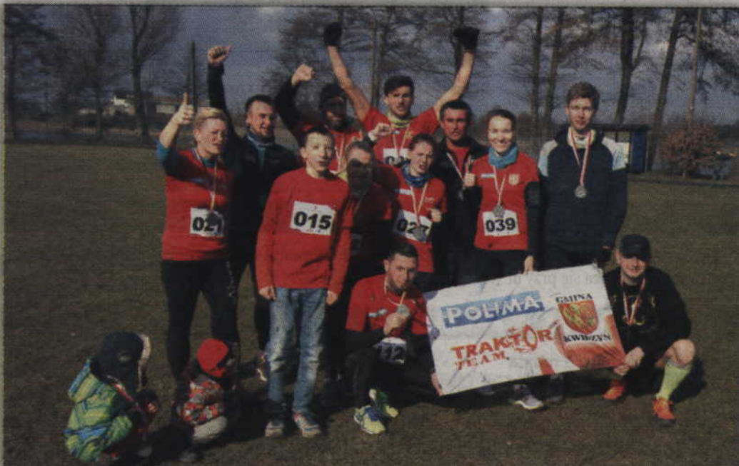
Zadowoleni biegacze z „Traktor Team”.