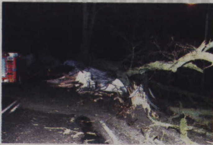
Drzewo wskutek uderzenia zostało dosłownie ściana.