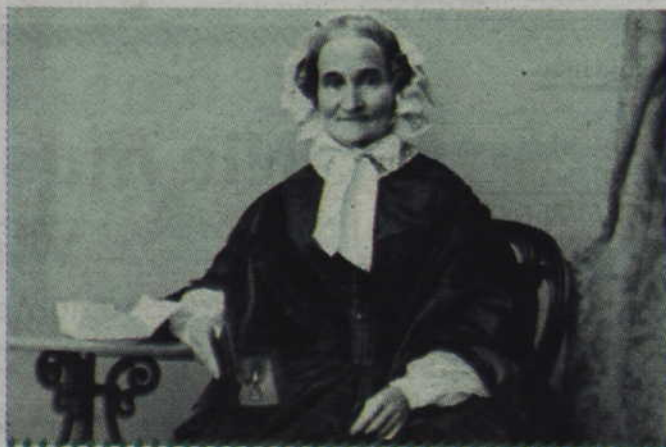
Wystawa od 18.03.2016 do 13.06.2016 Oddział Etnografii (Spichlerz Opacki) Cystersów 19, Gdańsk

Na ekspozycji znajdziemy zatem drewniane obiekty z bogato zdobioną snycerką, przykłady codziennego i odświętnego podhalańskiego stroju ludowego z przełomu XIX - XX wieku z biżuterią oraz sprzęty niezbędne w każdym szałasie podczas wypasu owiec. Górale są znani ze swojego zamiłowania do muzyki, dlatego na wystawie nie może zabraknąć różnych instrumentów takich jak: basy,