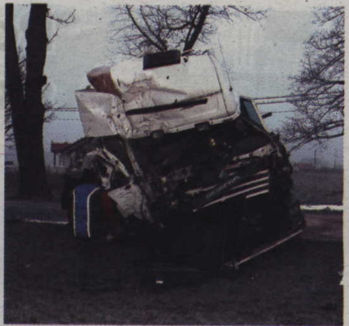
Kabina ciężarówki została zniszczona przez uderzenie w przydrożną lipę.