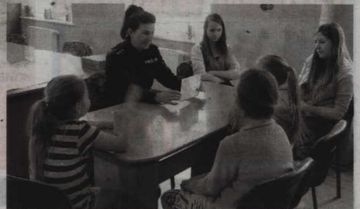
Podczas rozmowy z dziećmi mówiono m.in. o zasadach bezpieczeństwa w ruchu drogowym.

Spotkania przeprowadzono w ramach działań podejmowanych przez policjantów na rzecz poprawy bezpieczeństwa dzieci i