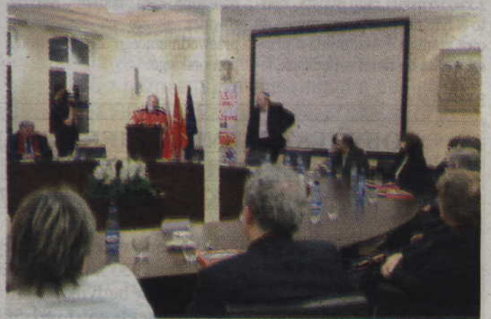
Radni powiatowi w rozmowie z protestującymi.