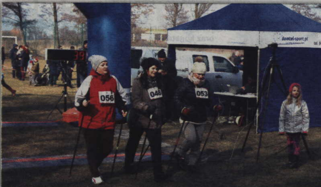
Na zawodach pojawili się również sympatycy nordic-walking.