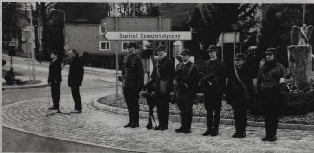
Uroczystościom towarzyszyli uczniowie z Susza, którzy wcieliłi się w role żołnierzy V Wileńskiej Brygady Armii Krajowej.