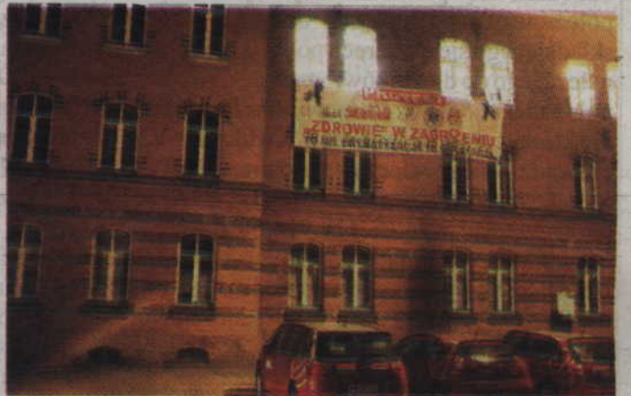
Protestujący na budynku starostwa wywiesili również baner informujący o prowadzonej akcji.