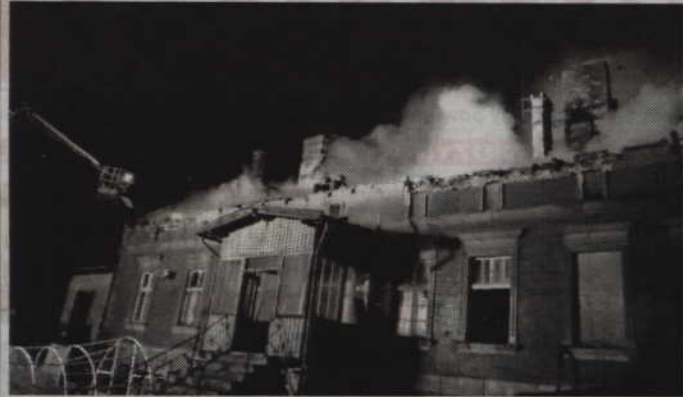
Na ok. 400 tys. zł oszacowano straty jakie spowodował pożar budynku mieszkalnego w Szatwinku.

GMINA KWIDZYN. Pięć jednostek straży pożarnej walczyło z pożarem, który wybuchł w budynku mieszkalnym w Szatwinku. Zgłoszenie o pojawieniu się ognia wpłynęło do Stanowiska Kierowania Komendanta Powiatowego w Kwidzynie o godz. 02.40 nad ranem. W czasie akcji dowożona była woda. Ogień gaszono między innymi z podnośnika.