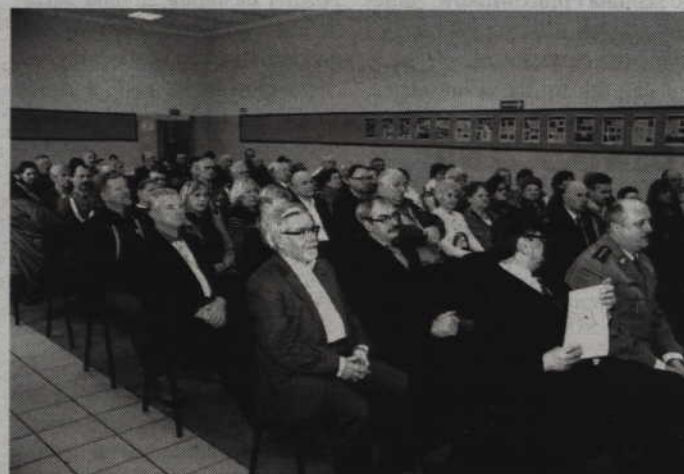
Po uroczystości na rondzie zebrani przenieśli się do PCKIS.