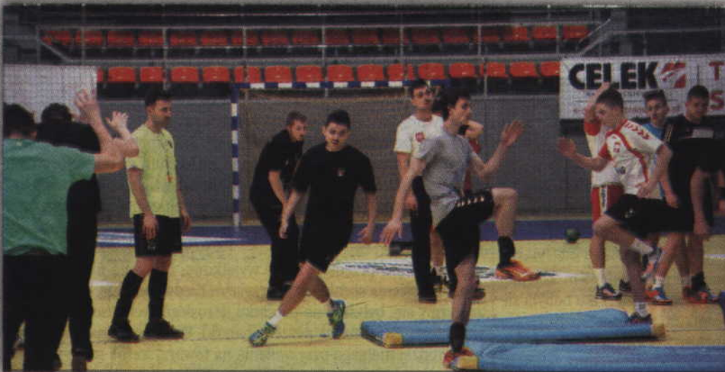
Zawodnicy MTS Kwidzyn solidnie przygotowują się do tego turnieju.

PIĘKA RĘCZNA. Szczypiorniści MTS Kwidzyn rozpoczynają walkę w półfinale Mistrzostw Polski juniorów. W turnieju odbywającym się w najbliższy weekend (4-6 marca) w Kwidzynie zmierzą się zespoły gospodarzy, Kielc, Wągrowca i Piekary Śląskich. Stawką są dwa mecze premiowane awansem do turnieju Final 4.