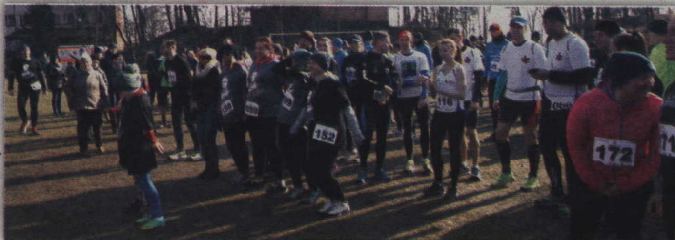
Przygotowania przed startem w gardejskich zawodach.