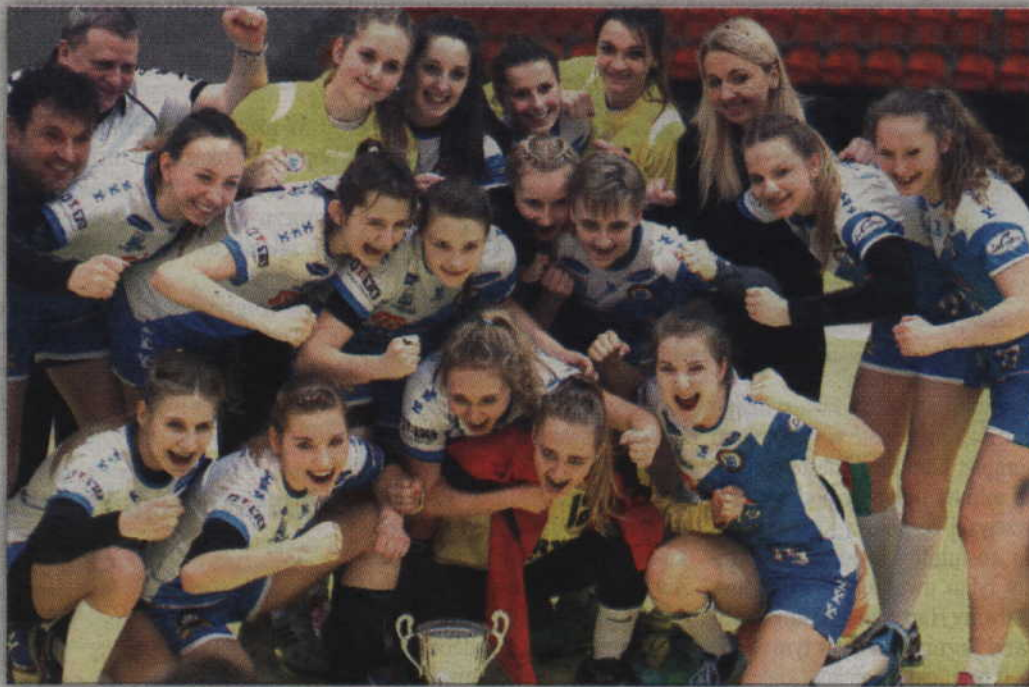
Zawodniczki MTS Kwidzyn powalczą o medale Mistrzostw Polski Juniorek.

Przypomnijmy, że kwidzynieczki pewnie przechodziły