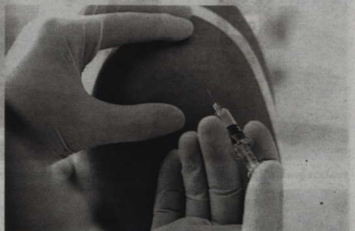
Dotychczas zaszczepiono 1138 dziewcząt z roczników 2001, 2002, 2003 i 2004. Szczepieniami objęte też 205 dorosłych kobiet oraz 157 chłopców z rocznika 2003.

Szacuje się, że wirus HPV około 70 proc. przypadków raka jest odpowiedzialny za rozwój szyjki macicy. (jk)