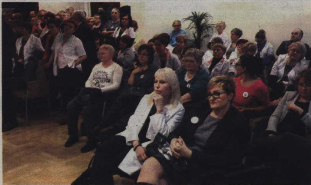
Pielęgniarki i pracownicy medyczni od poniedziałku zajmują salę narad kwidzyńskiego starostwa.

to nie jest przecież fabryka – mówił radny.