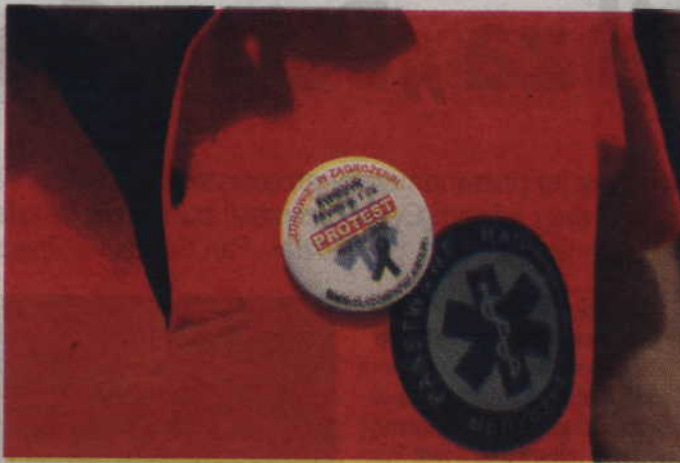
Protestujący zadbałi nawet o znaczki i aktualizowaną stronę internetową.

Okazuje się, że w szpitalu jest problem z zakupem czegokolwiek. Zarówno tych droższych, jak i tańszych jak piloty do łóżek. Pielęgniarka z oddziału wewnętrznego podkreśliła, że w