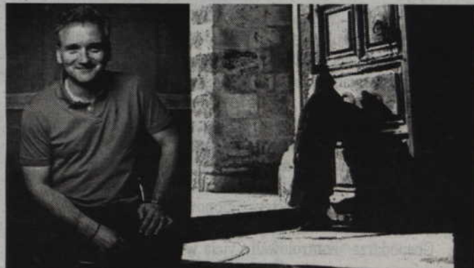
Podczas spotkania Jarosław Kret opowie o swej podróży do Ziemi Świętej.

Jarosław Kret znany jest przede wszystkim jako prezenter pogody. Od 2002 roku prowadzi prognozę w TVP, początkowo w TVP 3, a od 2004 roku w Wiadomościach TVP1. To jednak również dziennikarz telewizyjny, fotoreporter oraz autor licznych reportaży i filmów dokumentalnych. Z wykształcenia jest egiptologiem, należał również do pierwszego składu redakcyjnego polskiego wydania magazynu „National Geographic”. Jest także autorem książek: „Kret na pogodę”, „Wyprawy marzeń. Ziemia Święta”, „Wyprawy marzeń. Madagaskar”, „Moja Ziemia