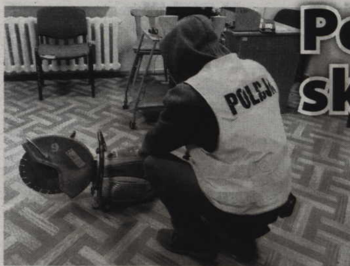
Policjanci odzyskali skradziony sprzęt, który w międzyczasie znalazł już nowego właściciela.