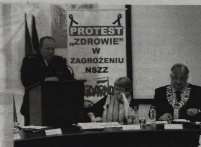
-W 2015 roku był znaczny spadek osób poszkodowanych w wyniku zatrucia tlenkiem węgla - stwierdził Sławomir Bogiel z PSP Kwidzyna. -Mieliśmy 13 takich zdarzeń, w których 9 osób zostało poszkodowanych.

-Doposażamy jednostki położone na terenie gmin nadwiślańskich. Szczególne te, które są