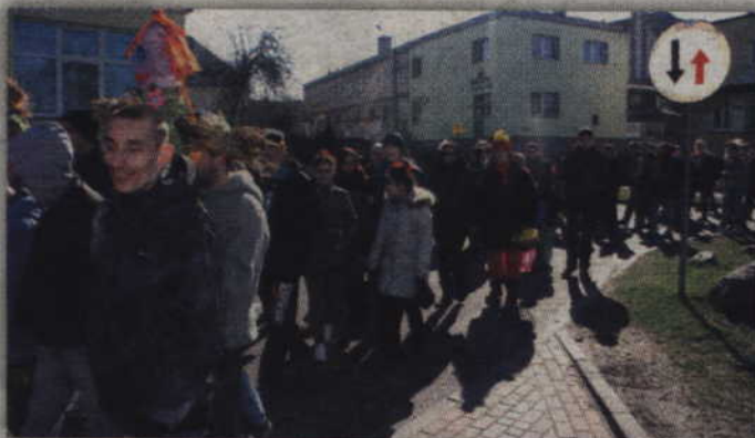
Barwny orszak wyruszył spod budynku Zespołu Szkół Specjalnych.

Impreza rozpoczęła się na placu przed budynkiem Zespołu Szkół Specjalnych, skąd uczniowie