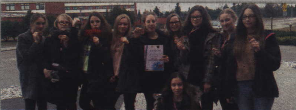
Brązowe medalistki gimnazjady - sztafeta Gimnazjum nr 2 w Kwidzynie.

- Drużynę stanowiło 9 osób: po trzy osoby z klasy I, II i III. Każdy z