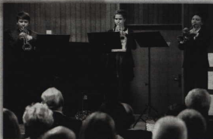
Uczestnicy spotkania wysłuchali koncertu uczniów i absolwentów kwidzyńskiej szkoły muzycznej.