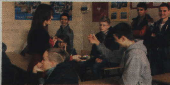
Na zajęciach „Kreatywnego Hiszpańskiego” uczniowie opanowali nazwy kolorów w języku hiszpańskim i angielskim.