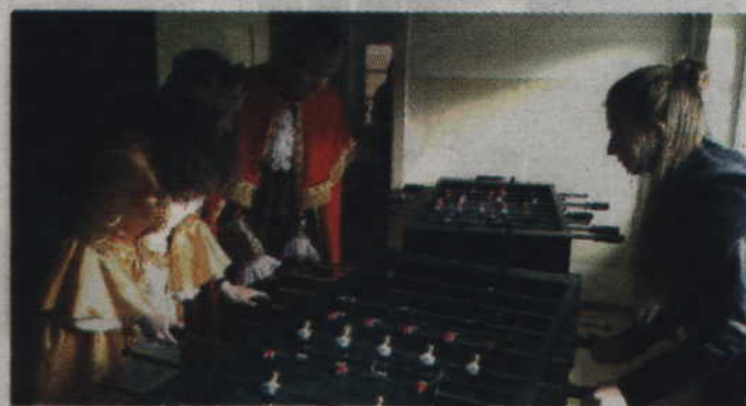
Podczas Dni Otwartych w I LO można było także pograć z Kwidyną i Kwidynową w piłkarzyki.

ślano, że w przyszłym roku szkolnym uczniowie będą mogli wybrać kilka nowych przedmiotów, których nie ma w ofercie innych szkół ponadgimnazjalnych w powiecie kwidzyńskim. Pierwszą innowacją jest „Kreatywny Hiszpański”, autorski, dwujęzyczny program do nauczania języka hiszpańskiego za pomocą języka angielskiego, z wykorzystaniem komunikacyjnych gier edukacyjnych, nowoczesnych technologii, a zwłaszcza współczesnych aplikacji internetowych