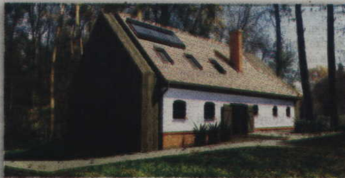
Tak wyglądać będzie wyremontowany budynek gospodarczy znajdujący się przy budynku stowarzyszenia.