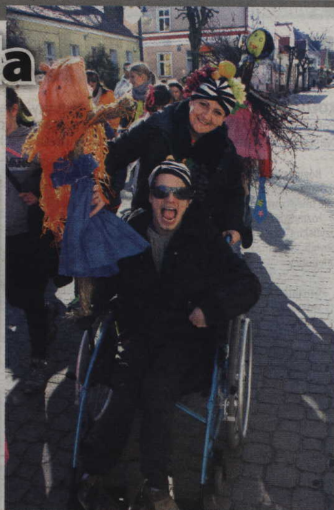
Dobre humory nie opuszczały wszystkich uczestników zabawy.

wie tej placówki oraz zaproszeni goście przemarszerowali, ze śpiewem i okrzykami, ulicami miasta. Metą przemarszu był plac Jana Pawła II, gdzie odbyły się muzyczne prezentacje. W wydarzeniu tym wzięli udział: Przedszkole Niepubliczne „Chatka Puchatka”, Przedszkole „Gama”, Przed-