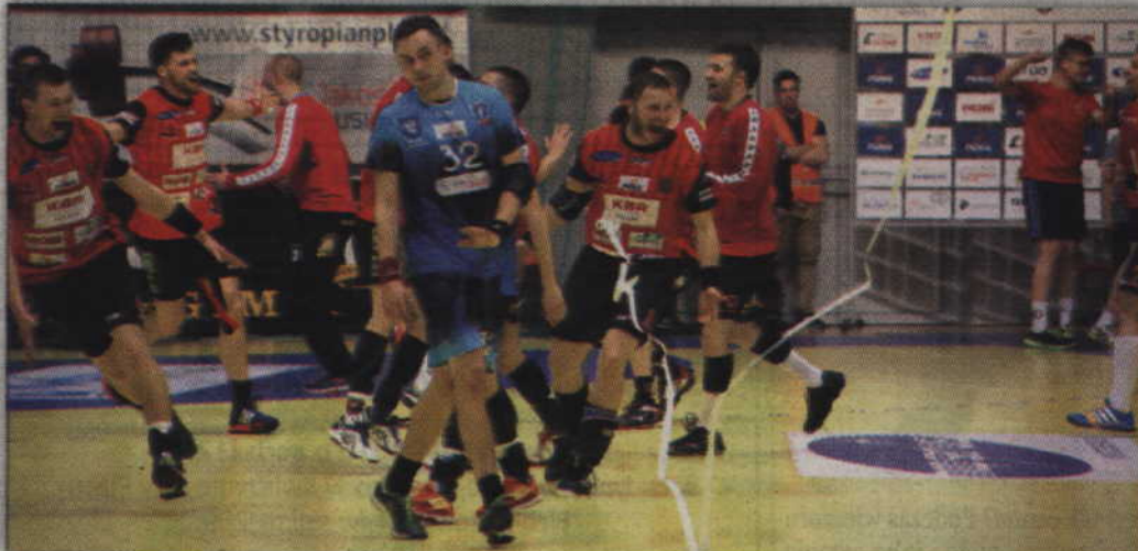
Radość graczy MMTS po końcowym gwizdku sędziego.