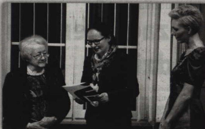
Bankowcy podziękowali klientom banku, a także wieloletnim pracownikom kwidzyńskiego Oddziału.