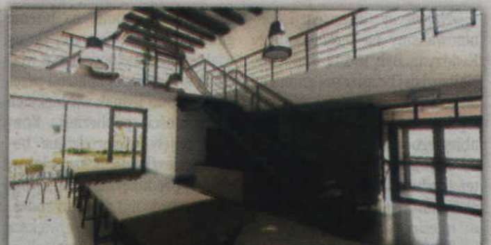
Wewnątrz powstanie sala edukacyjna i przestrzeń do prowadzenia zajęć.

kwalifikował się w typie projektów na budowę bądź rozbudowę, modernizację Centrów Edukacji Ekologicznej.