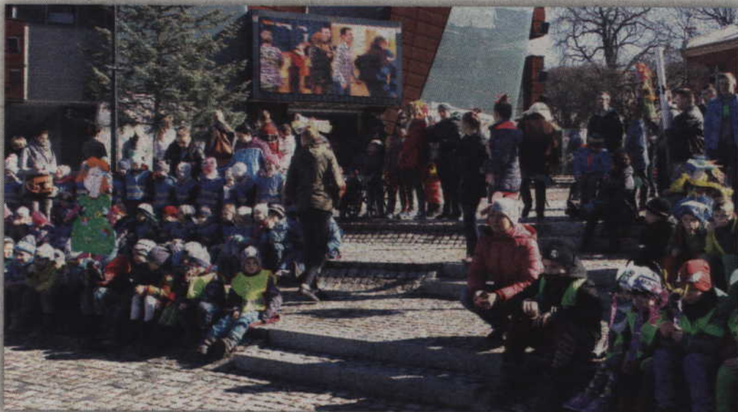
Uczestnicy zgromadzeni na placu Jana Pawła II.

Do konkursu zgłosiło się zaledwie 9 osób!