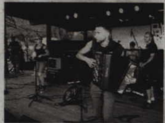
Grupa „Troty” wystąpi w kwidzyńskim Spichlerzu w najbliższą niedzielę - 3 kwietnia

cyjnej celebracji cotygodniowego święta jakim jest Vinyl Party. Tam dwóch przedstawicieli niższych warstw społecznych postanawia założyć formację folkowopunkową. Wkrótce z duetu rozrasta się do składu sześciuosobowego, który na pełnej parze rozpoczyna pierwsze próby. Jest listopad 2010 roku. W lutym 2011 amatorskim sposobem przy użyciu kaseciaka rejestrują pierwszy