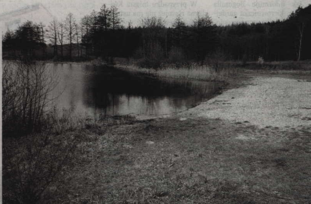
Osiem lat temu w tym miejscu doszło do nieszczęśliwego wypadku.

-Warto podjąć jeszcze próbę obniżenia zasądzonej kwoty. Wójt gminy podjął decyzję o zaskarżeniu kwoty 200 tys. zł. tytułem zadośćuczynienia. Taką apelacja została do Sądu Okręgowego w Gdańsku już wysłana. Prawdopodobnie, w okresie od pół roku do roku sprawę sąd rozsądzi ostatecznie. Co do szans powodzenia i jakie są możliwości realne ciężko jest mi się wypowiadać. Konkretnie argumenty zostały przedstawione sądowi. Mamy nadzieję, że sąd wyższej instancji podzieli naszą argumentację, a kwota zadośćuczynienia jest rzeczywiście wysoka