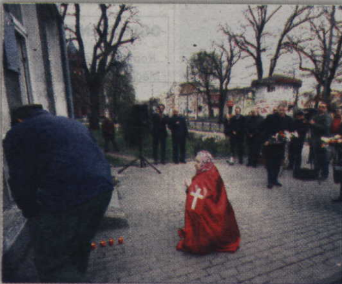
Mieszkańcy oddali cześć ofiarom katastrofy pod Smoleńskiem.