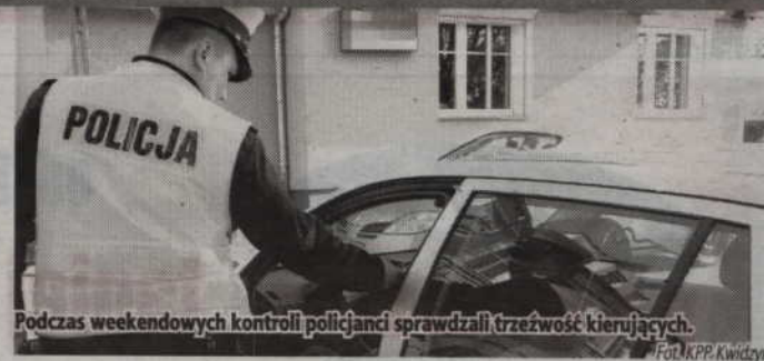
Podczas weekendowych kontroli policjanci sprawdzali trzeźwość kierujących.

Ostatnie kierowca prowadzący auto po spożyciu alkoholu zatrzymany został na ulicy Młynarskiej w Kwidzynie. Funkcjonariusze zatrzymali prowadzącego