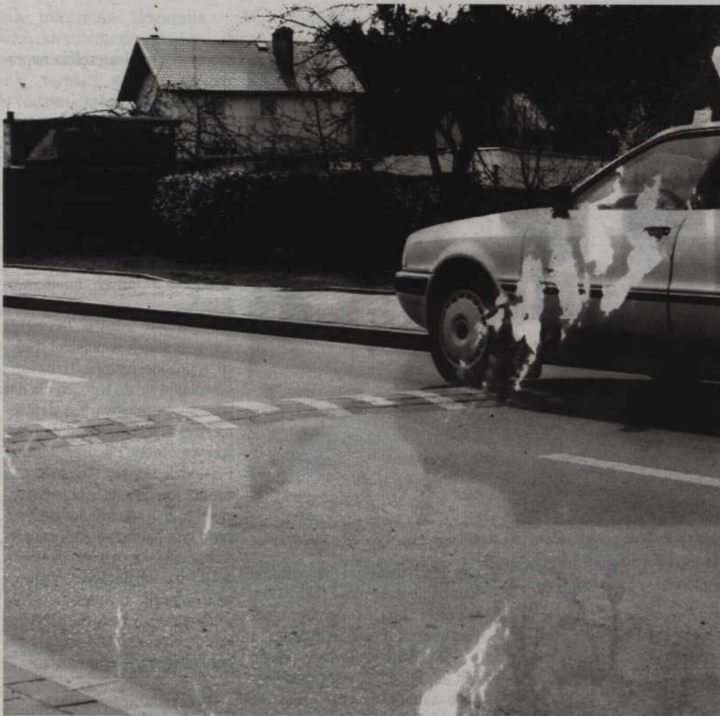
Kierowcy zamiast zwalniać bardzo często pokonują ustawione progi z dużym hałasem.

PRABUTY. Progi zwalniające, ułożone na ulicy Chodkiewicza miały przyczynić się do poprawy bezpieczeństwa pieszych. Wbrew pozorom, dla wielu kierowców, zwłaszcza wieczorami i nocą, nie stanowią one jednak problemu. Kierowcy rozpędzają swoje samochody i z hukiem pokonują ustawione przeszkody. Okoliczni mieszkańcy skarżą się, że dość wysokie progi zwalniające są dla nich przekleństwem a nie dobrodziejstwem.