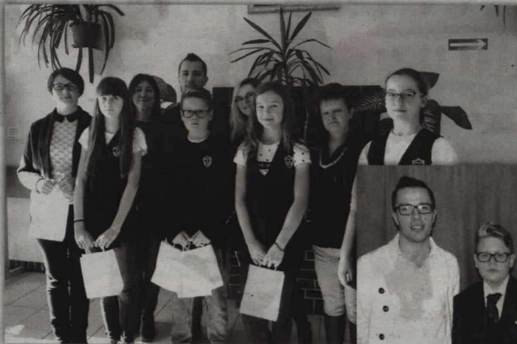
Grupa finalistów wojewódzkich konkursów przedmiotowych z kwidzyńskiej „czwórki”.