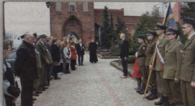
Prabuckie uroczystości rozpoczęły się przed Pomnikiem Pamięci.