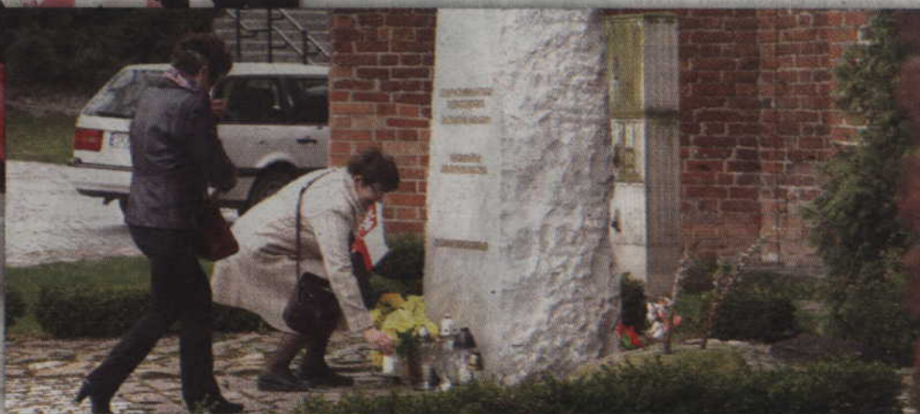
Orszak zatrzymał się także pod obeliskiem Jana Pawła II.