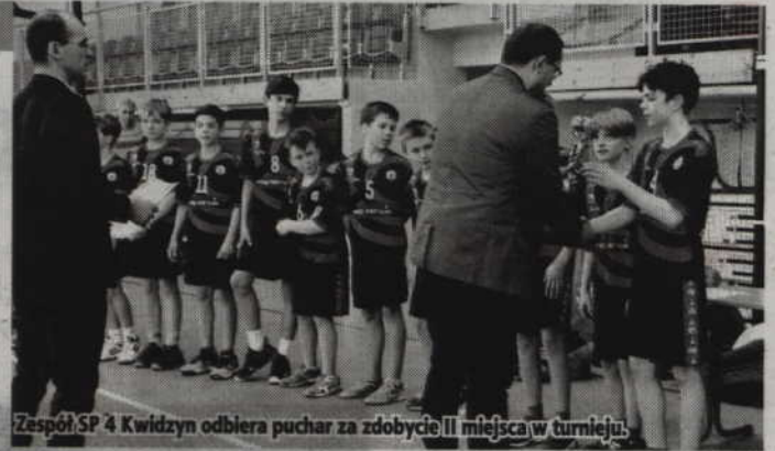
Zespół SP 4 Kwidzyna odbiera puchar za zdobycie II miejsca w turnieju.

nie zmierzli się z faworyzowanym zespołem SP 92 Gdańsk, który wygrał grupę B. Po zaciętym meczu uczniowie SP 4 przegrali 15:12 (4:9) i musieli zadowolić się drugim miejscem końcowej klasyfikacji. Trzecią lokatę wywalczyli gospodarze, którzy po rzutach karnych pokonali Tczew. W regulaminowym cza-