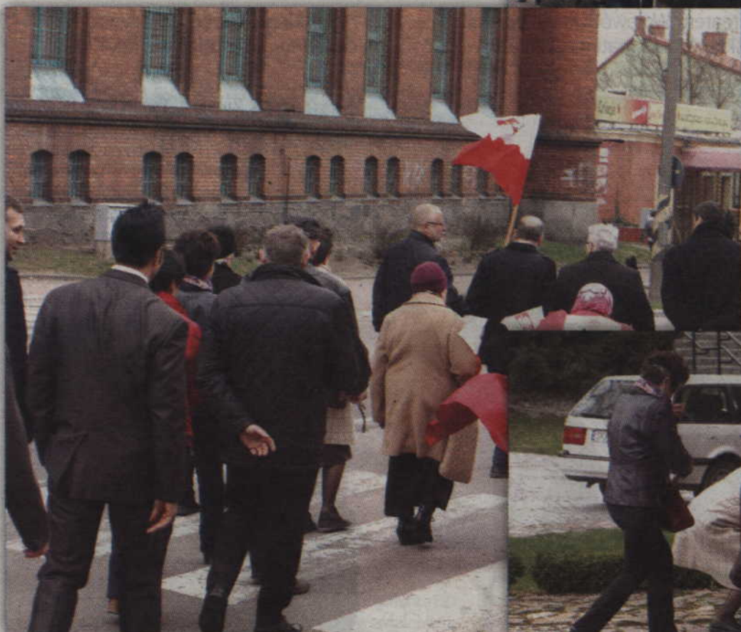
Niektórzy maszerowali w milczeniu, a niektórzy z modlitwą na ustach.