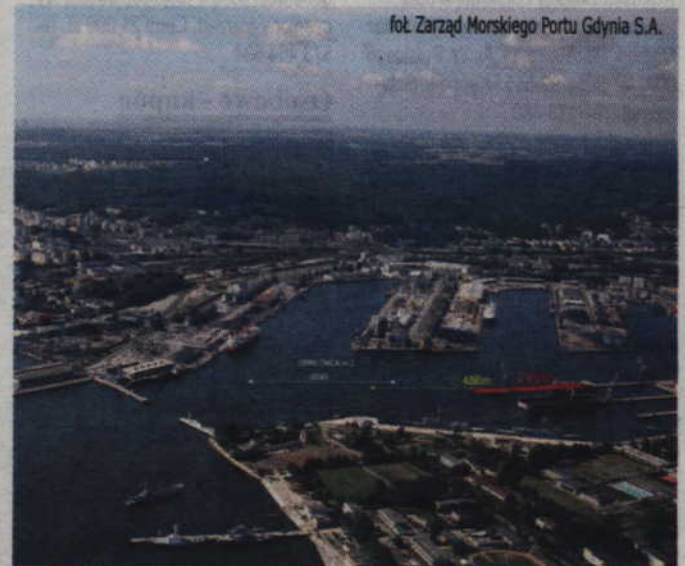
fol. Zarząd Morskiego Portu Gdynia S.A.

Jeszcze niedawno w branży morskiej aktualne było powiedzenie, że największym polskim portem jest Hamburg, ponieważ to właśnie stamtąd trafiała do Polski lądem, z pominięciem polskich portów, ponad połowa kontenerów transportowanych morzem. Ten stan rzeczy oczywiście zmienia się dynamicznie od kilku lat i dzisiaj szacuje się, że jest to mniej niż jed-