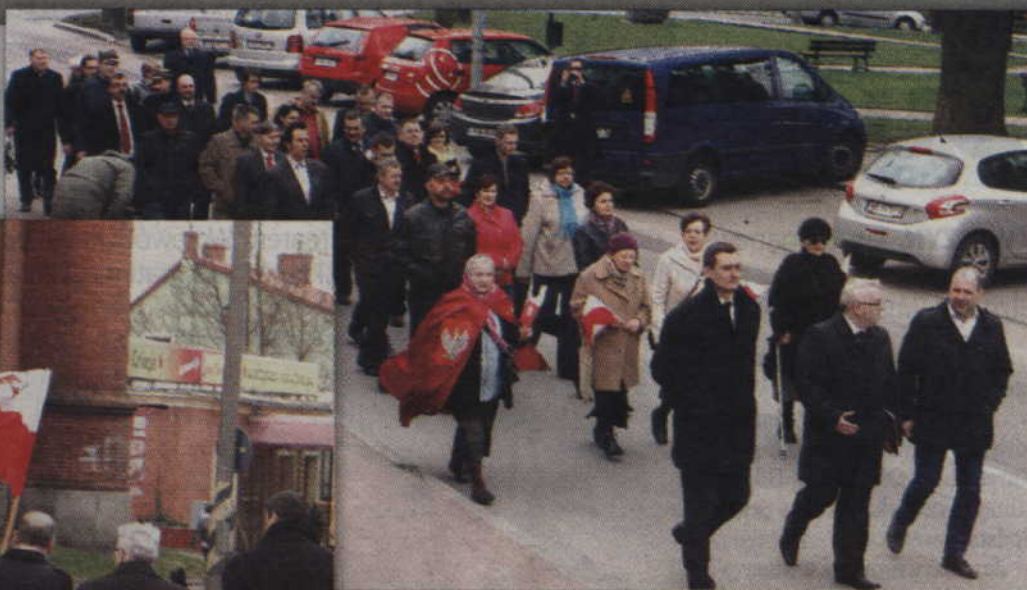
Po zakończeniu pierwszej części uroczystości uczestnicy przeszli ulicami miasta do Katedry.