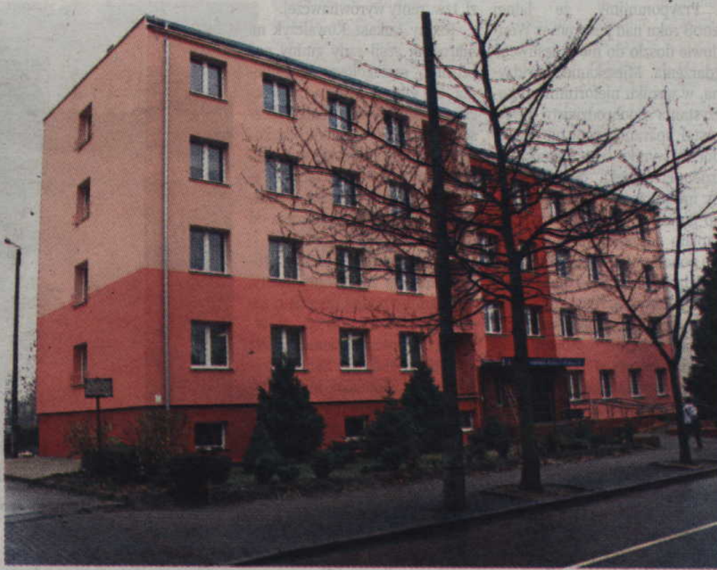
Do MOPS w Kwidzynie wnioski złożyła już praktycznie połowa uprawnionych rodzin.

-Wypłata pierwszych wniosków została zaplanowana na 26 kwietnia. Wypłaty będą przelewane na rachunki bankowe. W GOPS-ie nie mamy wypłat gotówkowych, ale są rodziny, które nie posiadają kont bankowych. W takich przypadkach będziemy starali się znaleźć inne rozwiązania. Do tej pory we wszystkich złożonych wnioskach były podane numery kont bankowych. Wpłynęło ponad 600 wnio-