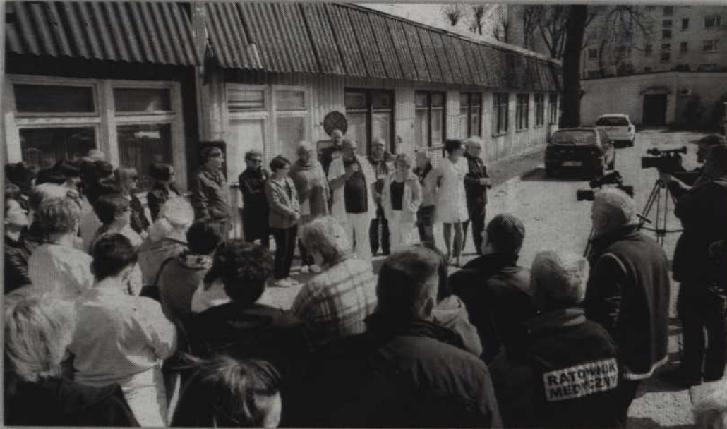
Wiec zorganizowany przed kwidzyńskim szpitalem rozpoczął strajk pracowników spółki „Zdrowie”.

Strajkujący domagają się opracowania i przedstawienia