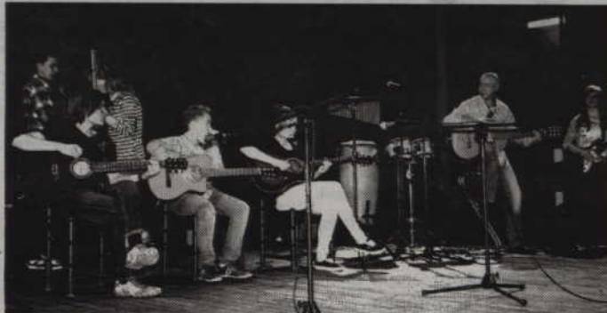
Mała Orkiestra Gitarowa podczas jednego z cyklicznych występów.