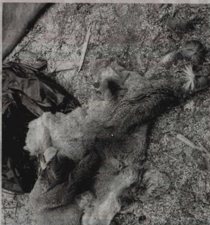
Na terenie posesji 59-latka znaleziono m.in. skórę z nielegalnie upolowanej sarny.

-Mężczyzna przyznał się do zarzucanych mu czynów i niebawem odpowie przed sądem za kłusownictwo – sierż. Anna Filar z Komendy Powiatowej Policji w Kwidzynie. -Za kłusownictwo oraz posiadanie narzędzi służących do kłusownictwa grozi mu kara do pięciu lat pozbawienia wolności. (fox)