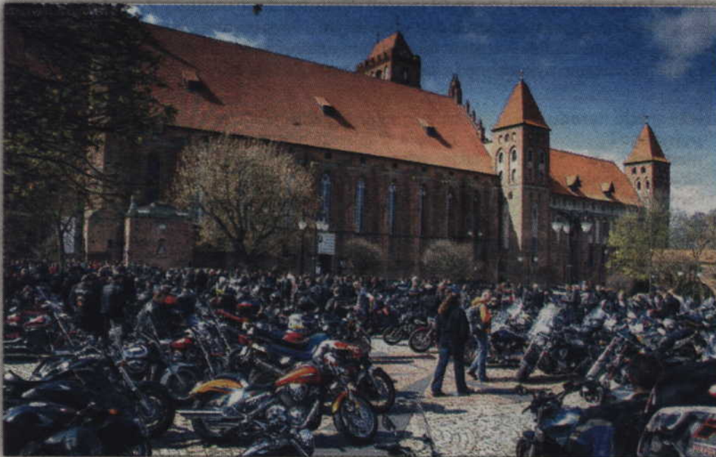
Na otwarciu sezonu zobaczyć można było ponad 600 motocykli.