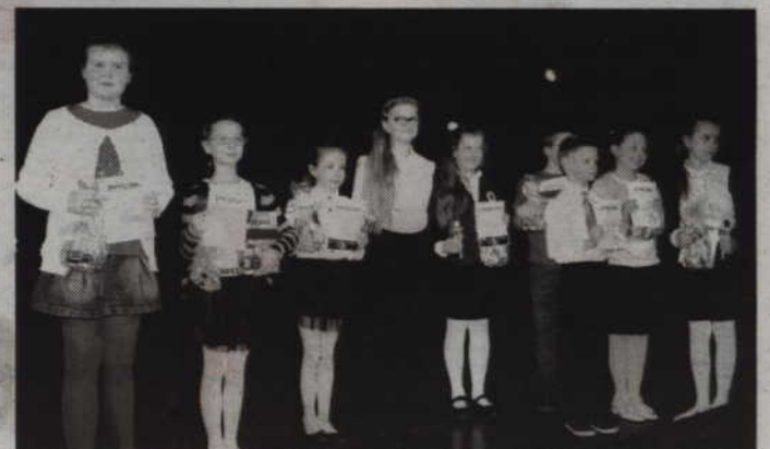
Najlepsi w poszczególnych kategoriach otrzymali pamiątkowe dyplomy oraz słodycze.