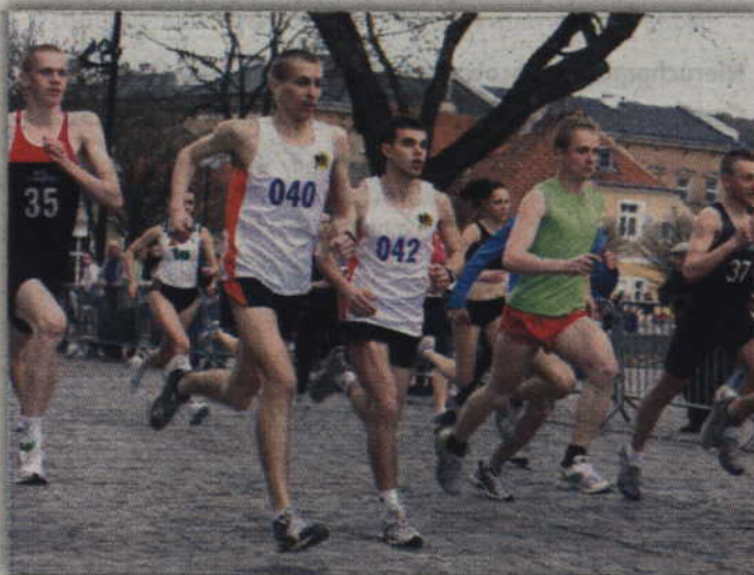
Rywalizacja w Biegu Unijnym odbędzie się już po raz trzynasty.