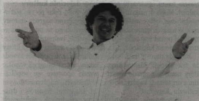
Podczas koncertu usłyszymy m.in. największe przeboje Jacka Wójcickiego.

największe przeboje Jacka Wójcickiego, które artysta wykona z towarzyszeniem orkiestry symfonicznej. Muzyki orkiestry wykonają także przeboje muzyki kla-