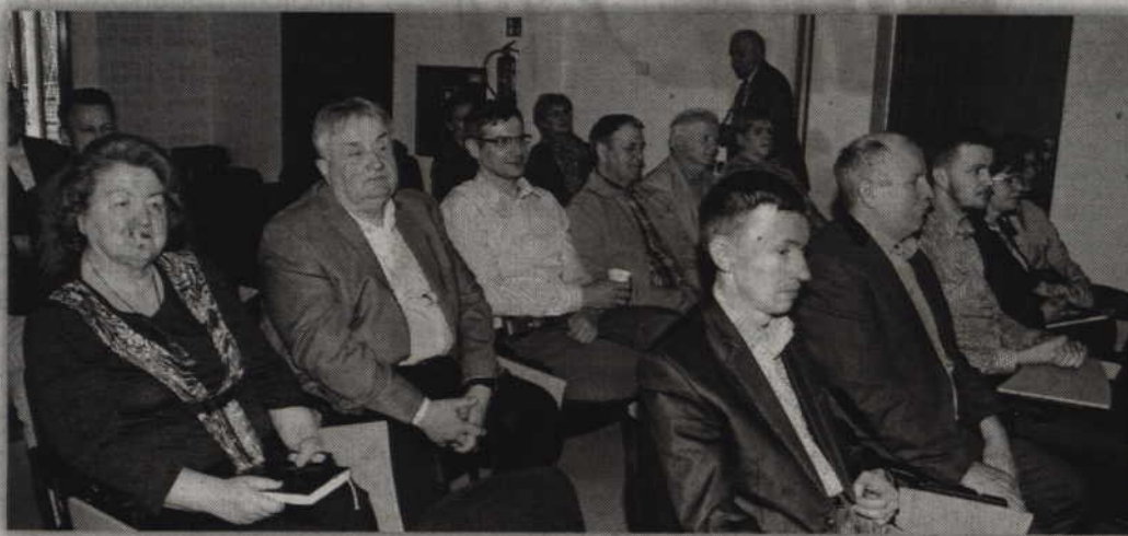
Opóźnienia związane z wypłatami dopłat bezpośrednich dla rolników oraz planowane zmiany w ustawie o kształtowaniu ustroju rolnego, w tym ograniczeń związanych z kupowaniem ziemi przez obcokrajowców zdominowały posiedzenie Zespołu Problemowego do Spraw Rolnictwa.

- Projekt jest przyjęty przez sejm i został skierowany do prac w senacie. Jeżeli ta ustawa ma wpłynąć korzystnie na poczucie bezpieczeństwa polskiego rolnika, to należy ją uchwalić i takie stanowisko prezentujemy. Nasze