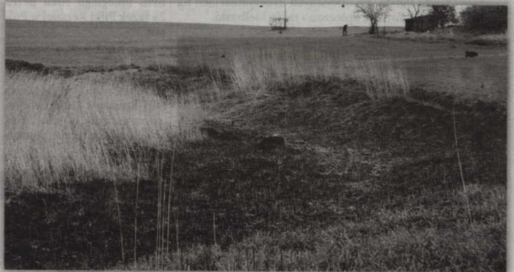
Częściowo wyschnięty niewielki staw to miejsce, gdzie odnaleziono ludzką czaszkę.

GARDEJA. Do makabrycznego znaleziska doszło w miniony poniedziałek w Gardai. W niedalekiej odległości od ulicy Osiedlowej, na terenie częściowo wyschniętego stawu, mieszkańcy znaleźli ludzką czaszkę. Przybyli na miejsce policjanci zabrali znalezisko do dalszych badań. O nietypowym znalezisku redakcję „Kuriera Kwidzyńskiego” poinformowali Czytelnicy.