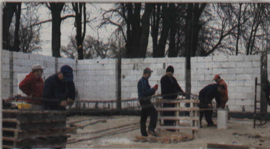
Mury nowej remizy OSP w Kołodziejach są już postawione.

Każdy, kto przejeżdża przez Kołodziej, nie może nie zauważyć pnących się ku górze murów przyszłej remizy strażackiej. Każdego dnia, głównie po południu, bez względu na warunki atmosferyczne, można tam zobaczyć kilka osób ubranych w robocze ubrania. Nie jest to jednak żadna firma budowlana, ale miejscowi strażacy, mieszkańcy Kołodziej, Pólka czy Gilwy, którzy sami budują remizę strażacką.