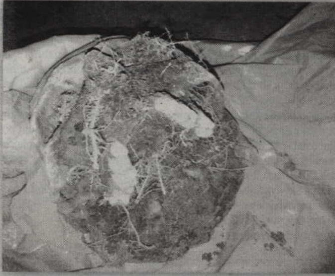
Znaleziona czaszka została zabezpieczona do dalszych badań.

Niewielki zbiornik wodny, w którym część wody już dawno wyschła, odsłonił swoją tajemnicę. Na jego dnie znaleziono bardzo dobrze zachowaną ludzką czaszkę. Osoby, które ją znalazły przyznają, że początkowo nie wiedziały, że to co wykopano z ziemi to fragment ludzkiego ciała. Dopiero po częściowym oczyszczeniu okazało się, że to ludzka czaszka. Według świadków znaleziska, w części użębienia zachowały się jeszcze plomby dentystyczne. O makabrycznym