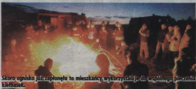
Skoro ognisko już zapłonęło to mieszkańcy wykorzystali je do wspólnego pieczenia kielbasek.

Szef radlińskich strażaków dodaje również, że skoro ognisko już zapłonęło, to wykorzystano je także do wspólnego upieczenia kielbasek. (RB)