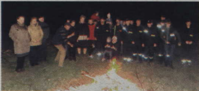
Ognisko w Bronisławowie zapłonęło punktualnie o godz. 20.25.

BRONISŁAWOWO (GM. SADLINKI). Strażacy z OSP w Nebrowie Wielkim i OSP w Bronisławowie przyłączyli się do ogólnopolskiej akcji „Ognisk Ducha Świętego”. Akcją zorganizowaną przez Związek Podhalan i Związek Ochotniczych Straży Pożarnych Rzeczypospolitej Polski, uczczono 1050 rocznicę Chrztu Polski. Po oficjalnych uroczystościach na ognisku w Bronisławowie upieczono także kielbaski.