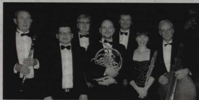
Muzycy zespołu „Passion Septet Ensemble”.

Zespół „Passion Septet Ensemble” tworzą muzycy Filharmonii Kameralnej im. Witolda Lutosławskiego w Łomży, których połączyła miłość do muzyki kameralnej. Repertuar zespołu obejmuje wszystkie epoki mu-