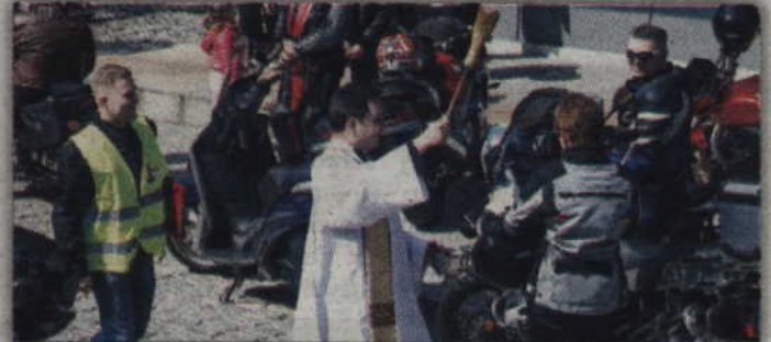
Na początku poświęcono maszyny.

KWIDZYN. Ponad 600 motocykli oglądać można było podczas otwarcia sezonu motocyklowego w Kwidzynie. Motocykliści poświęcili swoje maszyny podczas uroczystości zorganizowanej przed Kinoteatrem, po czym przejechali ulicami miasta do Miłosnej. Jedno jest pewne, taka ilość maszyn zgromadzona w jednym miejscu robiła ogromne wrażenia na każdym, a mieszkańcy z zacięciem przyglądali się ciągnącej się ulicami kawalkadzie motocykli.