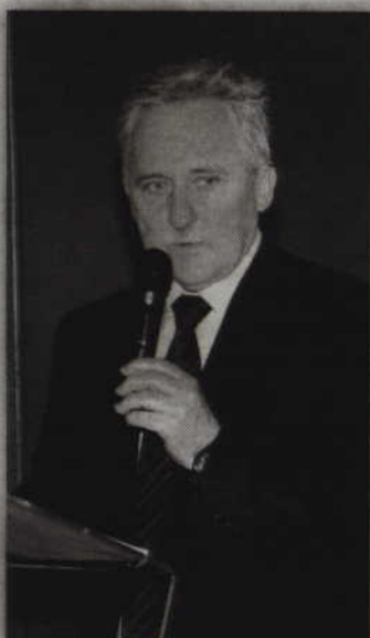
Senator Leszek Czarnobaj (PO) poruszył planowane zmiany w ustawie o ustroju rolnym.