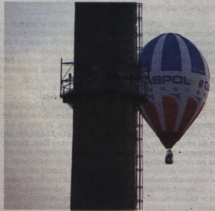
Jedna z załóg mijająca komin „Warmińskich”.