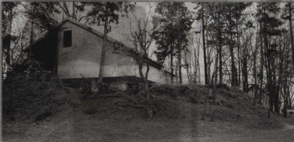
W miejscu żydowskiego cmentarza stoi dziś budynek po dawnej dyskotekce.