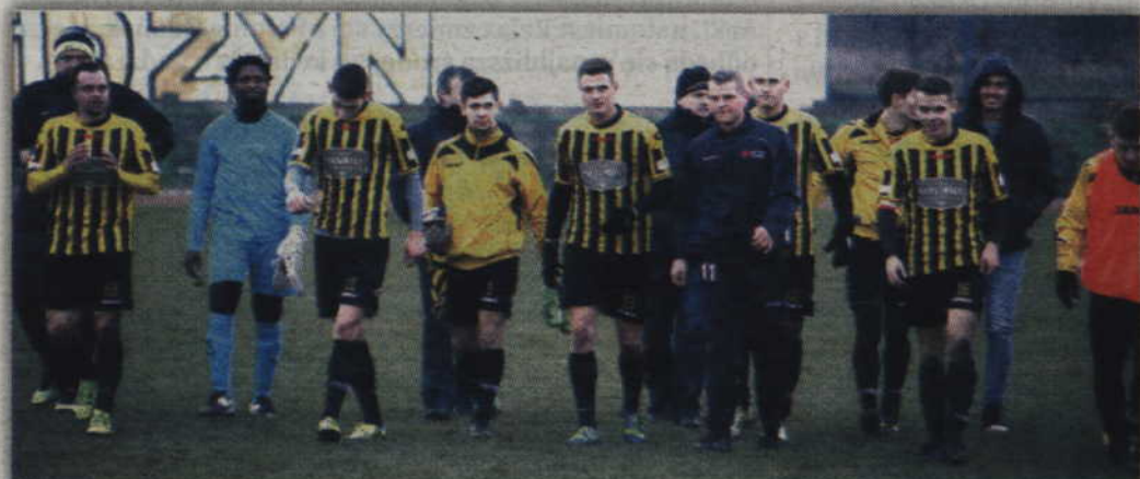
Rodło po raz kolejny zremisowało spotkanie ligowe. Choć kwidzynianie grali w przewadze to nie potrafili przekuć to na końcowy sukces.