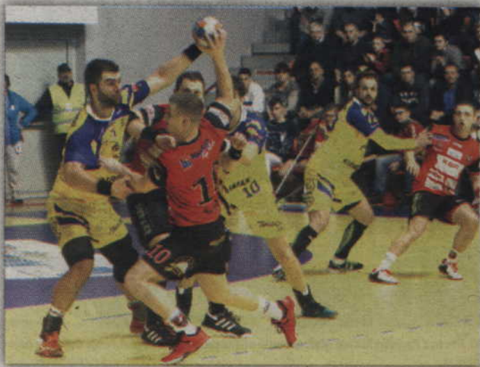
W tym sezonie MMTS spotykał się z kielczanami już pięciokrotnie. Za każdym razem czerwono-czarni musieli jednak pogodzić się z porażką z silnym rywalem.