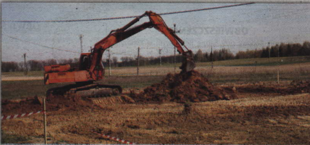
W pobliżu oczyszczalni powstaje nowy PSZOK.

ogrodzony. Powstanie zaplecze biurowe zapewniające pracownikowi poprawne warunki pracy. Oprócz tego, część punktu gdzie zostaną ustawione kontenery będzie zadaszona albowiem nie wszystkie odpady komunalne mogą być składowane pod gołym niebem. Jeśli w trakcie realizacji inwestycji nie pojawią się nieprzewidziane opóźnienia, nowy punkt zbiórki odpadów zostanie oddany do użytku w połowie lipca. (RB)