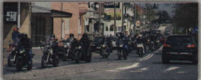
Motocykliści przejechali ulicami miasta na Miłosną, gdzie odbywał się festyn.