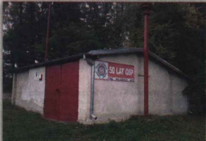
Stary budynek remizy był niestety zbyt mały.

- Za te pieniądze dokupiliśmy sporo nowego sprzętu, który systematycznie uzupełniamy. Jako jednostka OSP wyjeżdżamy niewiele, czasami 10 razy w ciągu roku. Działo się tak jednak tylko dlatego, że nasz stary żuk nie przystawał już do dzisiejszych realiów. Dzięki temu, że z własnych środków kupiliśmy sporo nowych strażackich węzów bardzo często w trakcie pożarów zabezpieczaliśmy jednak wodę innym jednostkom. Choć tych wyjazdów mamy mało to jednak jesteśmy cały czas obecni w naszym lokalnym społeczeństwie. Organizuje-