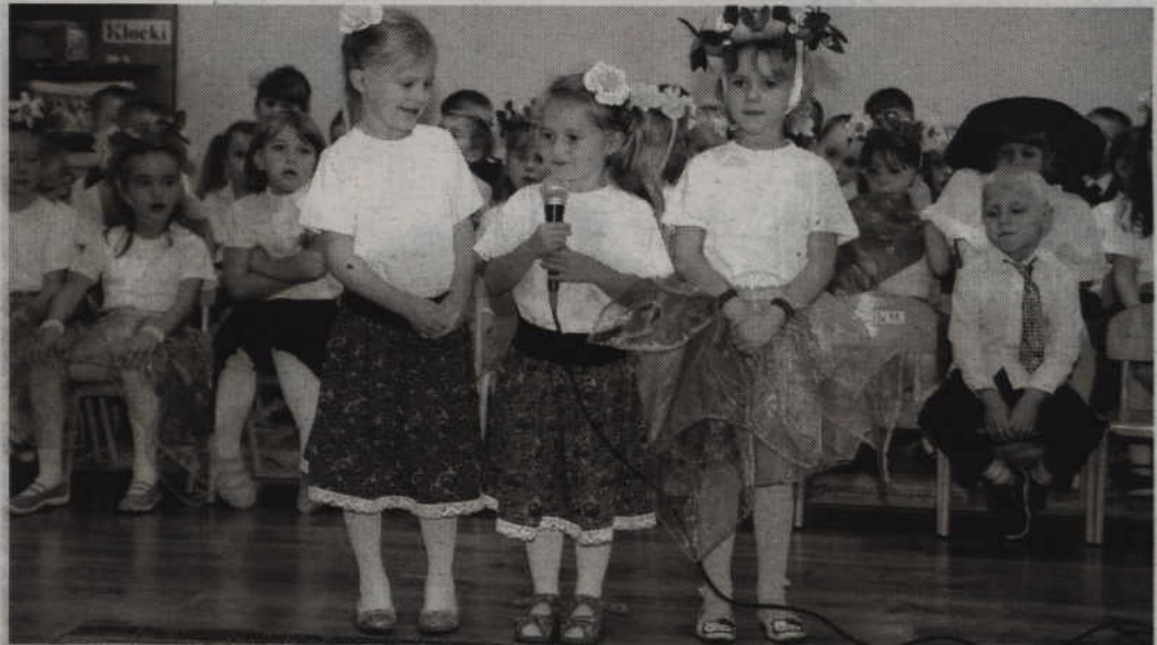
Choć niektóre szkoły mają problemy z utworzeniem klas pierwszych, to w żadnej z gmin nie ma problemów z zapisaniem dziecka do przedszkola.

-W obecnym roku szkolnym naukę w pierwszych klasach rozpoczęła bardzo duża liczba dzieci 6-letnich. Tych, które zostały w oddziałach przedszkolnych jest niewiele. Do urzędu trafiły wykazy dzieci, które przygotowali dyrektorzy poszczególnych szkół. Czekaliśmy na decyzje rodziców do 31 marca. W tej chwili rozważana jest decyzja czy w szkole w Gardei powstaną dwie klasy pierwsze czy tylko jedna. Według wykazów, którymi dysponujemy, w gardejskiej szkole może powstać tylko jeden oddział. W szkole w Cyganach naukę rozpocznie prawdopodobnie 20, w Morawach 10 pierwszoklasistów. W tej ostatniej szkole istniała obawa, że oddział w ogóle nie powstanie, ale ostatecznie rodzice zdecydowali się zapisać dwójkę dzieci ponownie do pierwszej klasy. Najgorzej przedstawia się sytuacja w Szkole Podstawowej w Trumiejkach, gdzie do pierwszej klasy jest zgłoszone tylko jedno dziecko. W tej sytuacji pierwsza klasa tam nie powstanie, a wspomniany uczeń będzie prawdopodobnie dowożony do innej szkoły. Czy wśród nauczycieli dojdzie do zwolnień nauczycieli, trudno o tym jeszcze mówić. Dyrektorzy mają czas do końca maja. Natomiast jeśli chodzi o przedszkola, to w dwóch placówkach funkcjonujących w gminie nie ma problemów z miejscami dla dzieci –