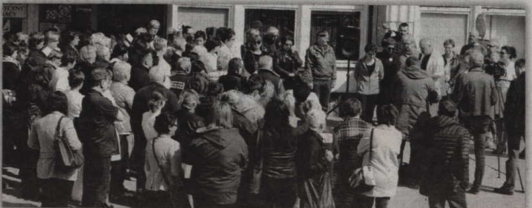
Protestujący zawiesili strajk czynny do 25 kwietnia. Co stanie się dalej zależy od wyników kolejnego spotkania Komitetu Strajkowego z władzami spółki EMC.

Wykazy wywieszono na tablicy ogłoszeń w Zespole ds. Geodezji i Gospodarki Nieruchomościami Urzędu Miejskiego w Kwidzynie, z siedzibą przy ul. Warszawskiej 19 oraz umieszczone na stronie internetowej urzędu www.bip.kwidzyn.pl . Bliższe informacje można uzyskać pod nr tel. (55) 64 64 739.