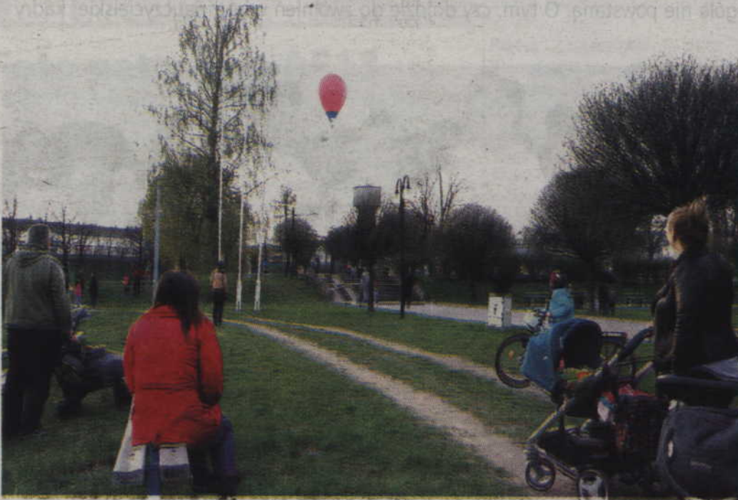
Mieszkańcy przybyli na stadion, aby obejrzeć start balonów. Niestety zawiedli się, bowiem ekipy zdecydowały się na start z podmiejskich pól.

KWIDZYN. Po raz kolejny mieszkańcy Kwidzyna i okolic mogli podziwiać piękno balonów. Wszystko dzięki XIV Wielkanocnym Zawodom Balonowym organizowanym o puchar prezydenta Grudziądza, które odbywały się w podgrudziądzkich Lisich Kątach. Tradycją już jest, że jeden dzień zawodów organizowanych przez Aeroklub Nadwiślański odbywa się w Kwidzynie. Tak było również w tym roku, a na niebie obserwować można było około 30 załóg. (fox)