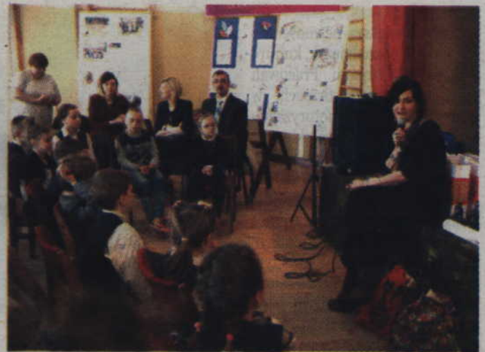
Spotkanie z autorką książek dla dzieci to najlepsza forma promocji czytelnictwa wśród najmłodszych.

-Pomysły przychodzą niespodziewanie tak jak w przypadku książki opowiadającej o przygodach Florentynki – opowiadała