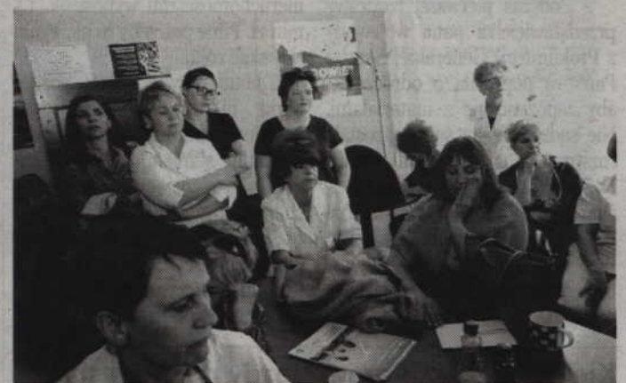
Protestujący przysłuchiwali się wypowiedziom kierownictwa spółki EMC.