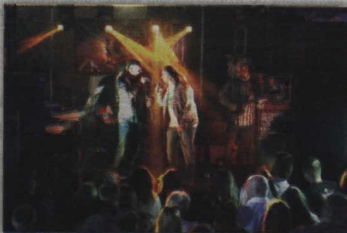
Energetyczny koncert porwał nie tylko stałych sympatyków ZKS Squad.

KWIDZYN. Niezwykle ciepło przyjęty został nowy materiał nagrany przez kwidzyńsko-prabucką formację ZKS Squad. Koncert promujących ich najnowszą Ep-kę odbył się w minioną sobotę, w pubie „Music”. Można było nie tylko posłuchać dobrej i energetycznej muzyki, ale również kupić lub też otrzymać wspomnianą płytę zatytułowaną „Możliwości”.