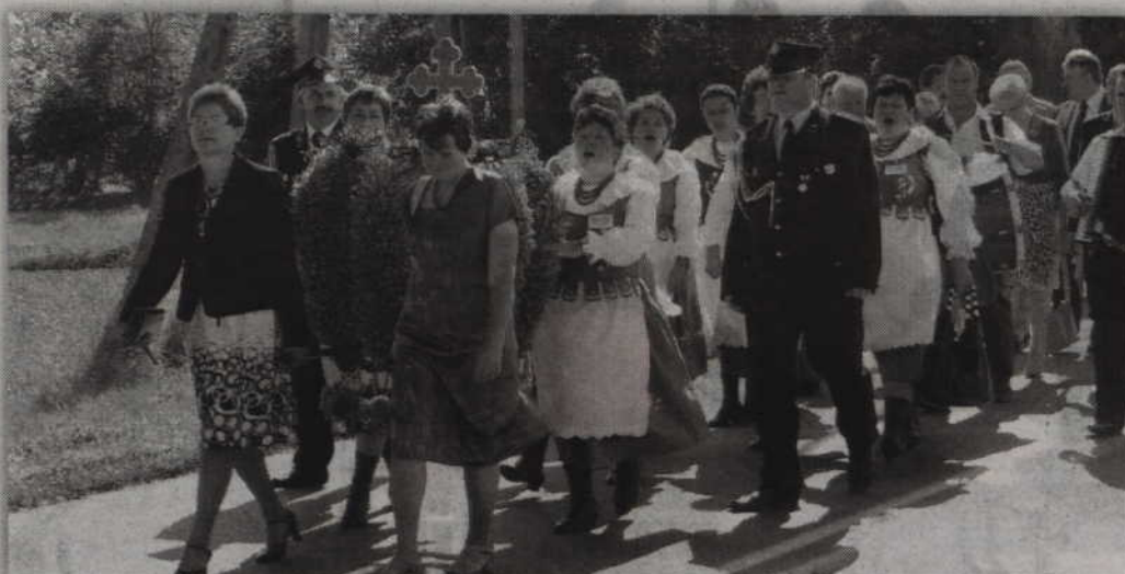
Powiatowe dożynki odbędą się w tym roku po raz szesnasty. red. tech. BR

POWIAT. Gmina Kwidzyn będzie organizatorem tegorocznych dożynek powiatowych. Święto plonów odbędzie się we wrześniu. Początkowo pojawiła się data 11 września, ale ze względu na możliwe skojarzenia z atakiem terrorystycznym na WTC, prawdopodobnie będzie to inny termin.