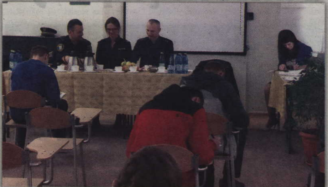
(f) Zmagania rozpoczęły się od testu ze znajomości przepisów ruchu drogowego.