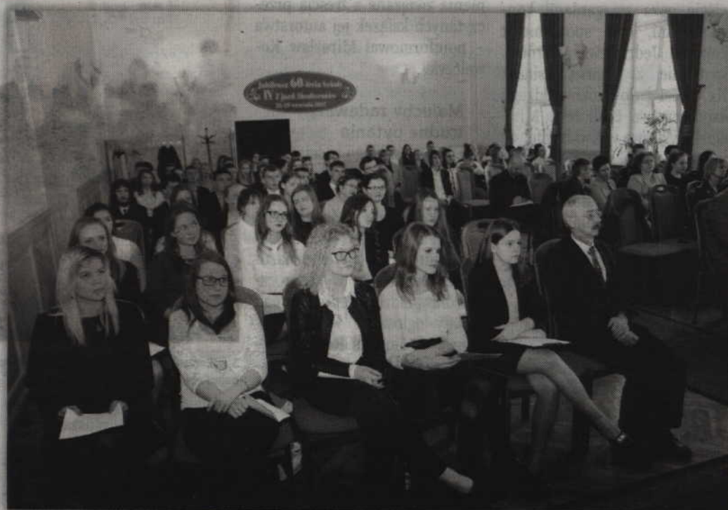
Podsumowanie projektu „Erasmus+” odbyło się w auli ZSP nr 1.