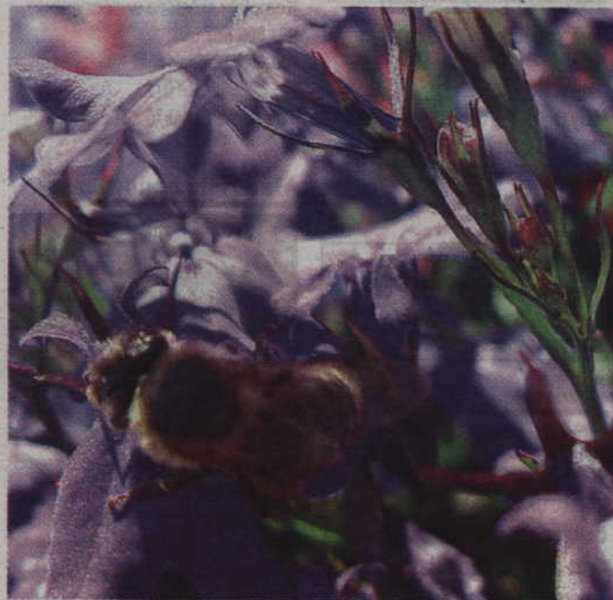
Bardzo ważnym elementem ekosystemu są pszczoły. Ponad 80 proc. roślin jest uzależnionych od zapylenia przez te pracowite owady. Trudno sobie wyobrazić, co by się stało, gdyby pszczoły wyginęły.

Aleksandretty świetnie przystosowały się do chłodniejszego klimatu, bez problemu wyprowadzają legi oraz są w stanie przetrwać miesiące zimowe. Wyrządzają przy tym poważne szkody w ekosystemie, zajmując dziuple