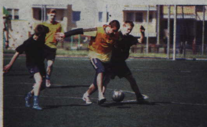
W finale grupy starszej „100 Twarzy Złomiarzy” zmierzyło się z „Wachlarzami Turboptysia”.