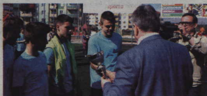
Kapitan „100 Twarzy Złomiarzy” odbiera główną nagrodę za zwycięstwo w kategorii rocznika 2003 i starszych.

czono natomiast tradycyjne pamiątkowe koszulki.