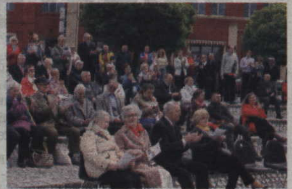
Kwidzianie od kilku lat świętują rocznicę Konstytucji 3 Maja m.in. spotkaniem na placu Jana Pawła II.