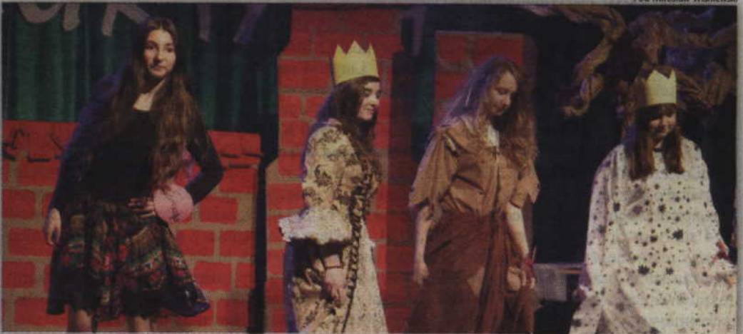
Jedno z przyznanych wyróżnień trafiło do grupy młodych aktorów z Nowego Dworu.