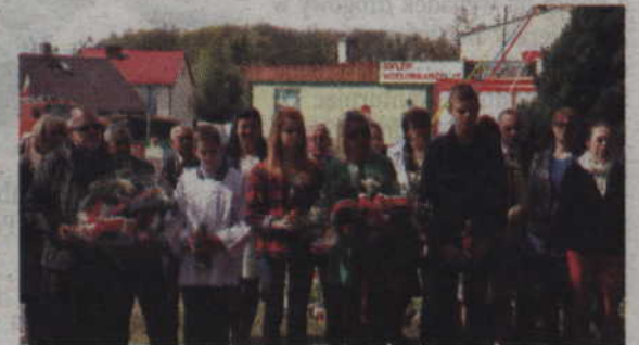
Delegacje i mieszkańcy złożyli kwiaty oraz znicze pod tablicą upamiętniającą walczących za Ojczyznę.

czwarty odbyły się bowiem biegi przełajowe rozgrywane o puchar wójta gminy Gardeja. Rywalizowano w