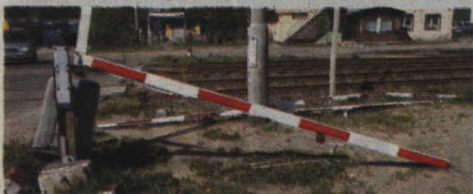
Pijany kierowca zniszczył zamknięte roгатki przejazdu kolejowego w Ryjewie.

RYJEWO. Policjanci z Posterunku Policji w Ryjewie zatrzymali pijanego kierowcę, który uderzył w zamknięte roгатki przejazdu kolejowego. Kierowca opla miał prawie 2,5 promila alkoholu w organizmie. Teraz 26-latek za swój czyn może trafić nawet na 2 lata do więzienia.