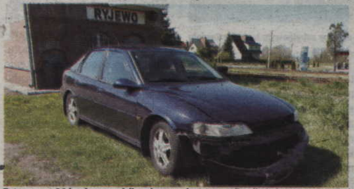
Zatrzymany 26-latek prowadził mając prawie 2,5 promila alkoholu w swym organizmie.

W świetle obowiązujących przepisów za kierowanie samochodem pod wpływem alkoholu grozi kara do 2 lat więzienia. Kierowca może także stracić prawo jazdy na 10 lat – dodaje rzecznik KP Kwidzyn. (fox)