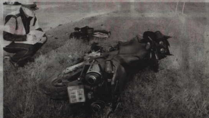
Do zderzenia golfa z motocyklem honda doszło na skrzyżowaniu przy ul. Parkowej.