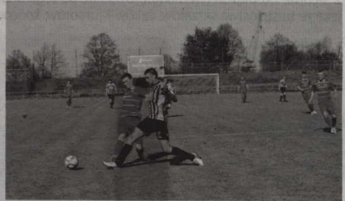
Kwidzyńskie tym razem nie mieli kłopotów z pokonaniem rywali, zwyciężając w Tczewie aż 1:8.

dziesiątkę tczewianie całkowicie pogubili się w grze, a kwidzyńskie wykorzystywali pojawiające się okazje do zdobywania bramek.