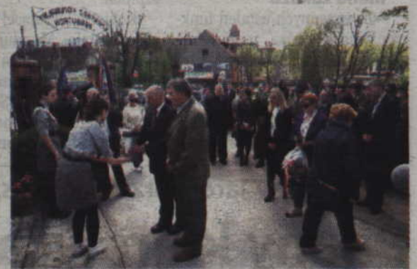
Delegacje złożyły kwiaty pod Pomnikiem Pamięci Pomordowanych na Kresach Wschodniej Rzeczypospolitej.

stry Dętą „Helikon”, zebrani przemaszewali ulicami miasta pod Pomnik Pamięci znajdujący się przy ulicy Kwidzyńskiej. Tam również