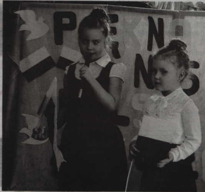
Przedszkolaki miały wyrecytować z pamięci jeden wiersz poezji dziecięcej.