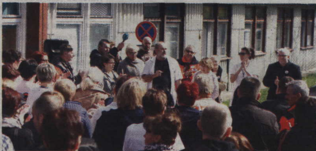
Zawarte porozumienie zakończyło protest pracowników kwidzyńskiego szpitala.

Początkowo dyrektor szpitala w Kwidzynie poinformował protestujących o wstępnej deklaracji gotowości poniesienia przez Spółkę „Zdrowie” dodatkowych kosztów 500 000 zł, z przeznaczeniem na fundusz wynagrodzeń pracowników w roku 2016. Szczegółowy podział tej kwoty miał zostać uzgodniony z przedstawicielami związków zawodowych. W związku z tym protestujący wstrzymali zaplanowane na dziś rozpoczęcie strajku czynnego. We wtorek, 10 maja, spółka EMC wydała natomiast komu-