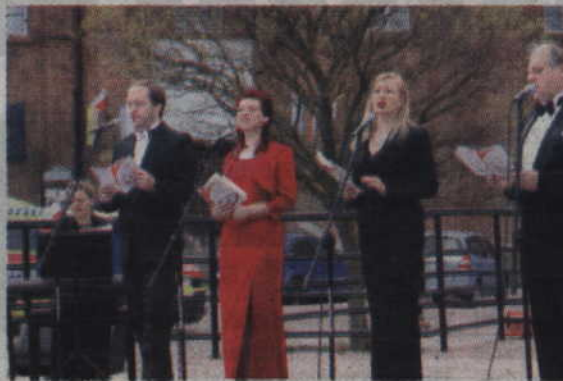
(fox) Do wspólnego śpiewania zachęcali artyści Polskiej Sceny Operowo-Koncertowej.

Po nabożeństwie na Placu Jana Pawła II odbył się natomiast koncert pieśni patriotycznych, a do wspólnego śpiewania zachęcali mieszkańców artyści Polskiej Sceny Operowo-Koncertowej.