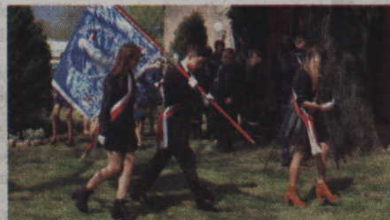
W uroczystościach wzięły udział poczty sztandarowe szkół oraz instytucji z terenu gminy.

Po uroczystościach w centrum Gardei, na kilkadziesiąt minut, został wstrzymany ruch na drodze krajowej nr 55, aby delegacje gminnych instytucji, władz samorządowych oraz mieszkańcy bezpiecznie mogli przejść na stadion przy Sportowej. Na stadionowej płycie boiska odbył się bowiem pokaz musztry paradnej w wykonaniu Orkiestry Dętą „Helikon”. Uroczystości rocznicowe zakończyła natomiast rywalizacja sportowa. Już po raz