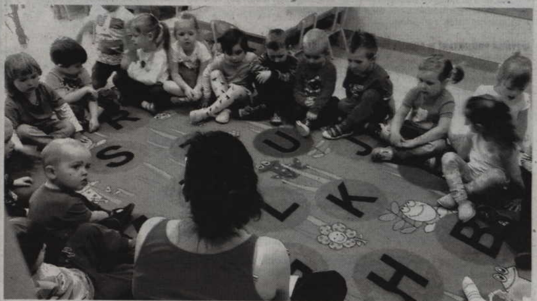
Podczas Dnia Przedsiębiorczości uczniowie sprawdzali m.in. jak wygląda praca nauczyciela wychowania przedszkolnego.

-Co roku szukamy dla naszych uczniów takich firm, aby spełnia-