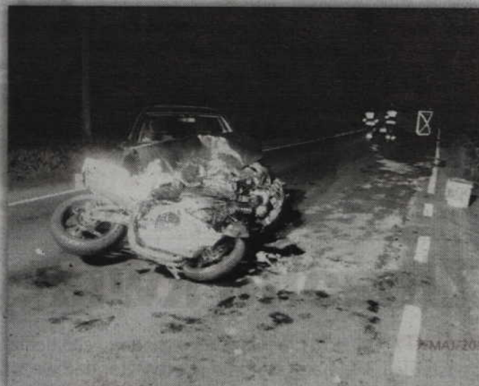
Do śmiertelnego wypadku doszło w pobliżu jednego z ośrodków wypoczynkowych w Jaromierzu.

- Sezon motocyklowy można uznać za rozpoczęty. Na wielu polskich drogach w całym kraju pojawili się fani jednośladów. Policjanci apelują o zachowanie szczególnej ostrożności wszystkich uczestników ruchu drogowego. Analizując statystyki wypadków, w których biorą udział motocykliści nasuwa się wniosek,