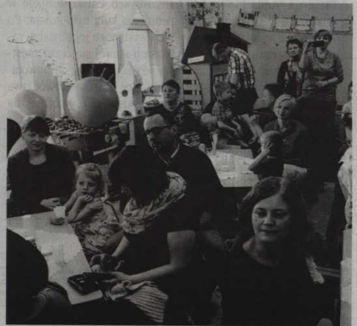
Występom maluchów z przejęciem przyglądali się rodzice.

-Wszyscy uczestnicy wykazali się ogromnymi zdolnościami recytatorskimi i doskonale wydeklamowali swoje utwory za co otrzymali dyplomy, nagrody książkowe oraz słodycze