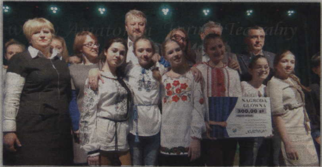
Nagroda Główna i 300 zł trafiła do zespołu „Swija” z Zaporozia.