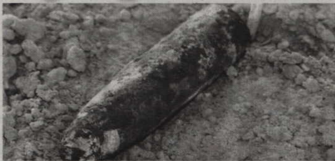
W pełni uzbrojony pocisk artyleryjski znaleziony na polu w pobliżu Pawłowa stanowił śmiertelne zagrożenie.