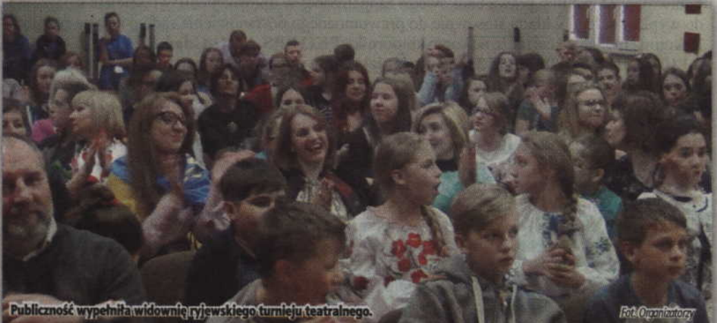
Publiczność wypełniła widowiskowo ryjewskiego turnieju teatralnego.