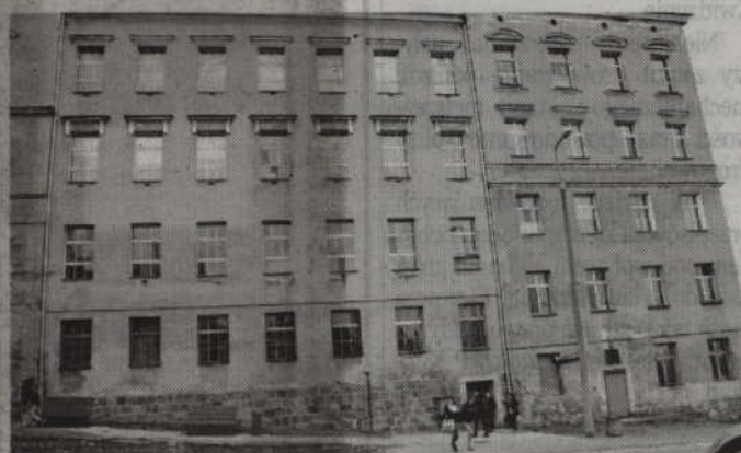
Szacuje się, że samo dokończenie wymiany okien w zabytkowym budynku Zespołu Szkół Ponadgimnazjalnych nr 2 wyniesie ok. 2,5 mln zł.

POWIAT. Samorząd powiatu jest coraz bliżej uzyskania pieniędzy na realizację projektu edukacyjnego, który przewiduje modernizację gmachów szkół, zakup wyposażenia pracowni oraz sfinansowanie szkoleń i kursów. Zakończyła się właśnie preselekcja zgłoszonych wniosków.