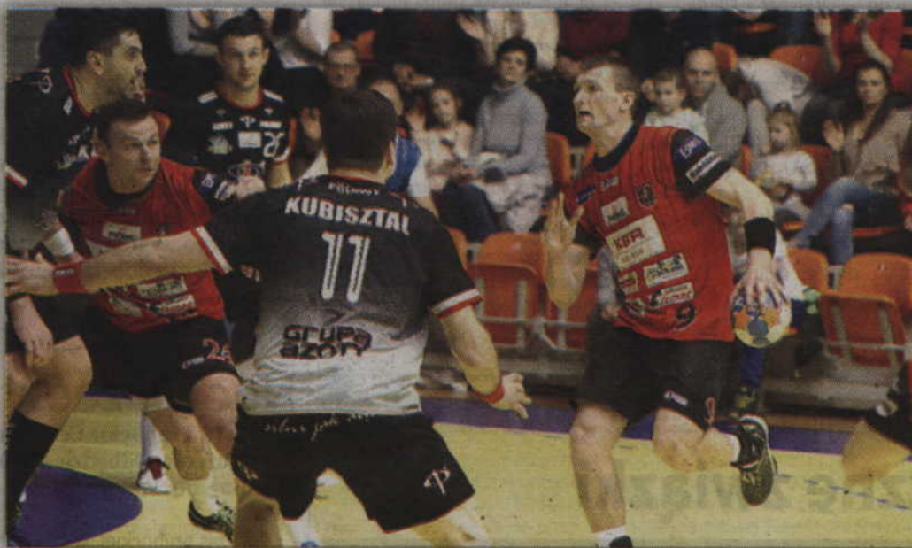
Pod dwóch meczach rywalizacji o brąz MMTS remisuje z Azotami 1:1. W najbliższy weekend dwa kolejne mecze rozegrane zostaną w kwidzyńskiej hali.