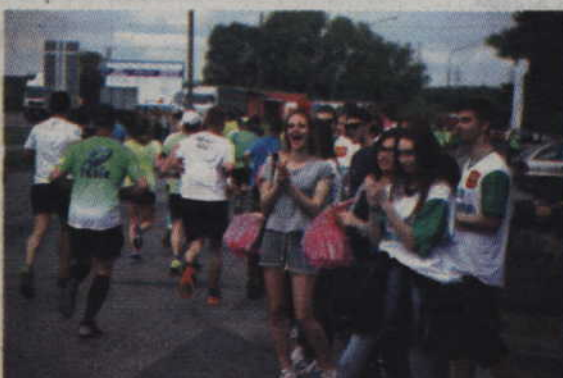
Startujących na trasie dopingowały reprezentacje kwidzyńskich szkół.