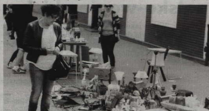
Wystawcy zaprezentują swoje kolekcje na deptaku przy ul. Piłsudskiego.