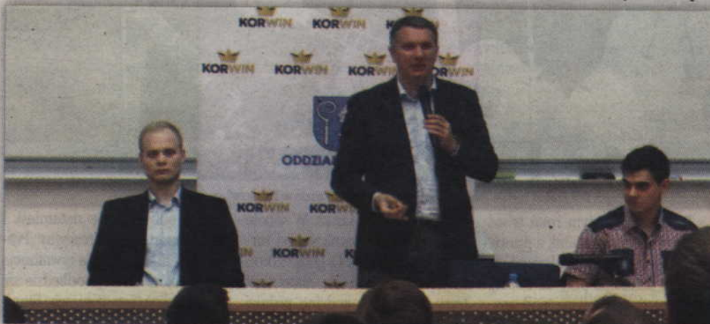
Przemysław Wipler podczas spotkania z mieszkańcami Kwidzyna.