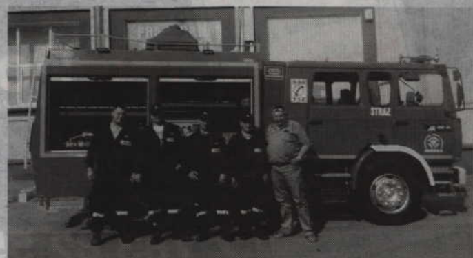
Strażacy-ochotnicy przed zakupionym wozem bojowym.

GMINA PRABUTY. Nie dość, że własnymi siłami budują strażacką remizę to teraz mogą również pochwalić się kolejnym sukcesem. Ochotnicy z OSP w Kołodziejach odebrali bowiem wóz bojowy, który zastąpi poczeiowego i wysłużonego Żuka. Chociaż samochód ma już kilkanaście lat, to dla kołodziejskich strażaków jest doskonałym nabytkiem. Warto przypomnieć, że wóz ten strażacy kupili za zarobione przez siebie pieniądze. Samochód wcześniej został sprowadzony do Polski, a przez kilka tygodni był uzbrajany w podstawowy sprzęt do niesienia pomocy. Dziś już