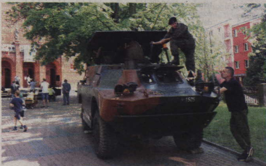
Wojskowy wóz bojowy to jednak z atrakcji tegorocznego festynu.