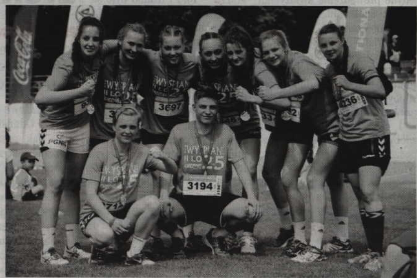
Silna ekipa II LO w Kwidzynie.

wówczas woda. Najlepszy moment to natomiast ostatnia prosta, od ronda w dół. Wówczas nogi same niosą i z całych sił biegnie się do mety. I jest kolejny medal, który zawsze witam mocnym całusem. Po-