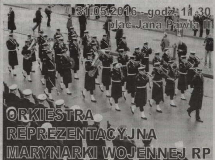
ORKIESTRA REPREZENTACYJNA MARYNARKI WOJENNEJ RP