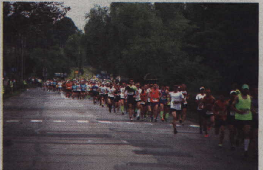
W tegorocznych zawodach wzięło udział 3398 osób.