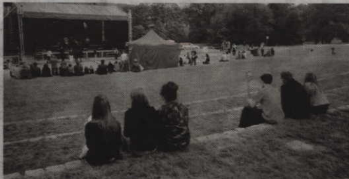
Scena koncertowa tradycyjnie pojawi się na terenach rekreacyjnych nad Liwą.