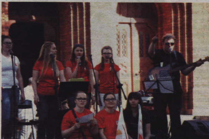
Podczas występu muzycy zespołu „Trishagion” zachęcali wszystkich do wspólnego śpiewania.