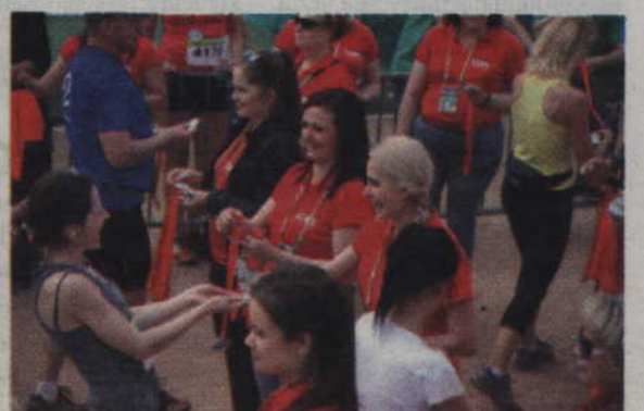
Zdobycie medalu cieszy każdego zawodnika.