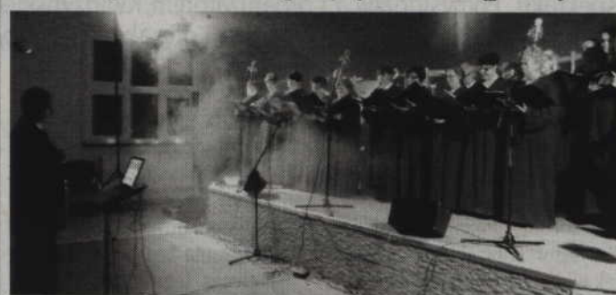
Ryjewski chór „Lira” zaśpiewa w sali GOK.

GINA RYJEWO. Gminny Ośrodek Kultury w Ryjewie zaprasza na specjalny koncert zorganizowany z okazji Dnia Matki oraz Dnia Ojca. Z tej okazji, w najbliższą środę, 25 maja, w sali miejscowego ośrodka kultury wystąpi chór „Lira”. Chórzystom towarzyszyć będą także wokaliści z Gdyni. Początek koncertu przewidziano na godzinę 18.00. Wstęp wolny.