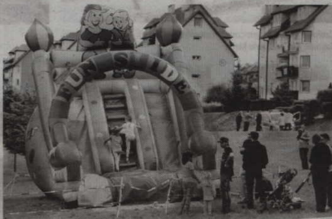
Podczas festynu najmłodszy będą mogli skorzystać m.in. z dmuchanych zjeżdżalni.

Organizatorzy informują, że festyn trwać będzie w godzinach 11.00-15.00. W programie przewidziano m.in. konkursy dla dzieci, konkursy rodzinne, zabawy, animacje, malowanie twarzy, warsztaty z bańkami mydlanymi, kącik malucha z zabawkami, zjeżdżalnia oraz darmowa wata cukrowa. (fox)