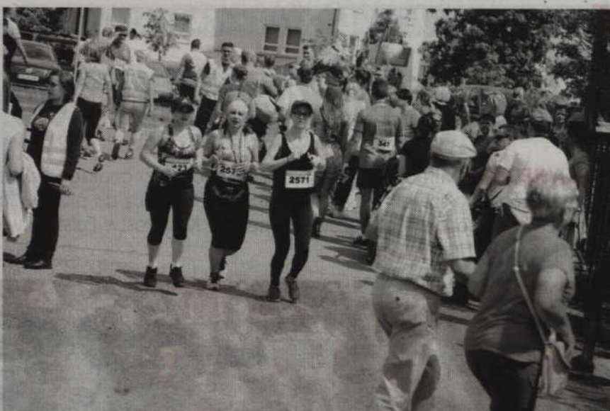
Niestety zawodnicy dobiegający na końcu musieli przeciskać się przez tłumy przechodzących mieszkańców.

-W głowie kłębią się wówczas myśli „nie dasz rady”. Do tego skwar leje się z nieba, a w wokół biegną ludzie sapiący z wycieńczenia i pocieszający siebie nawzajem słowami: „to już z górki”, „ostatnie kilometry”, „damy radę”. Jedynym ratunkiem jest