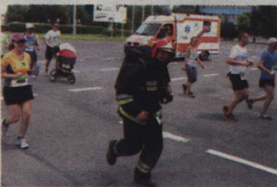
Przebiec 10 km, w upalny dzień, w takim stroju, z butlą na plecach – to dopiero wyczyn.