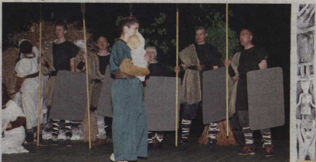
Na deskach kwidzyńskiego teatru wystąpili młodzi aktorzy, reprezentujący różne placówki kształcenia specjalnego z województw: pomorskiego, kujawsko-pomorskiego i warmińsko-mazurskiego.

Podczas tegorocznej imprezy na scenie zaprezentowało się szesnaście zespołów z różnych ośrodków, z całego województwa. Wśród nich, poza gospodarzami z MOW Kwidzyn, pojawiły się także inne ośrodki reprezentujące powiat kwidzyński. Zespół Szkół Specjalnych w Kwidzynie przedstawił teatr cienia „Arka Noego”. Ośrodek Rehabilitacyjno-Edukacyjno-Wychowawczy w Prabutach zaprezentował pantomimę „Calineczka”, Ośrodek Rehabilitacyjno-Edukacyjno-Wychowawczy w Okrągłej Łące przygotował