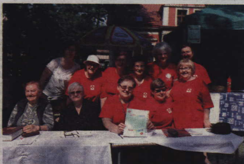
Dzięki paniom z caritasu można było zjeść m.in. bigos, karkówkę czy też napić się kawy.