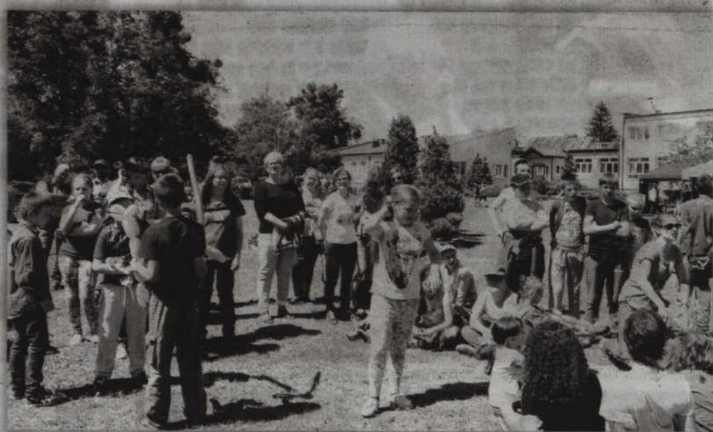
Festyn „Barcickie Lasy” odbył się już po raz dziesiąty.

także nauczyć się modelowania balonów. Można było również korzystać ze zjeżdżalni, czy też tworzyć bardzo duże bańki mydlane. Nie mogło oczywiście zabraknąć tradycyjnych już wędrówek dzieci i młodzieży po lesie. Po leśnych podchodach wręczone zostały nagrody. Przygotowano także obiad i grill dla wszystkich uczestników naszego festynu. Z okazji jubileuszu został przygotowany również tort - informuje