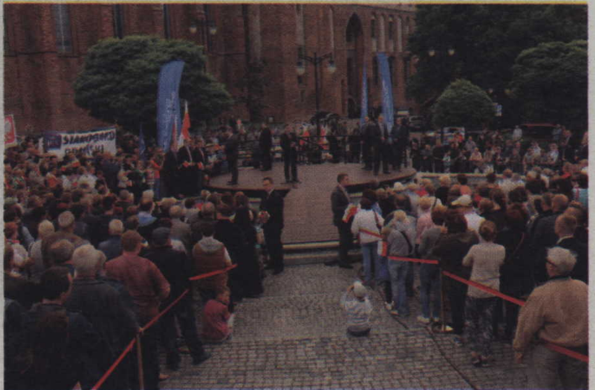
Licznie zgromadzona widownia na Placu Jana Pawła II.