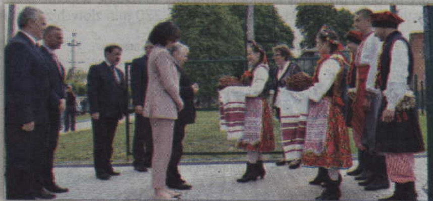
Senator Leszek Czarnobaj (po lewej) podczas uroczystego otwarcia Domu.