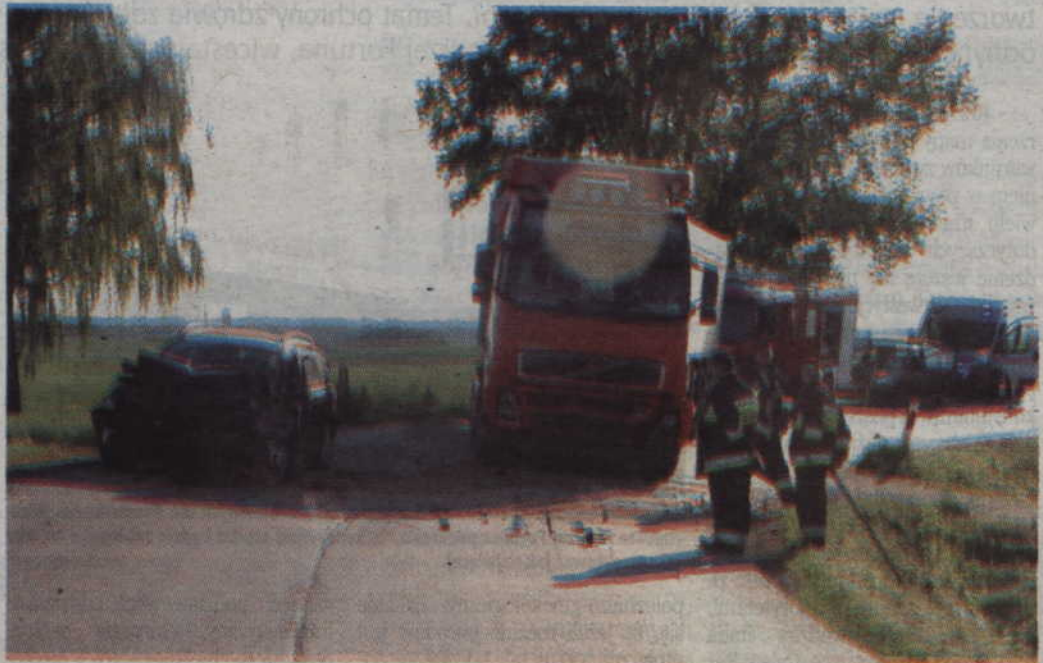
Prowadząca volvo 34-latka zjechała na drugi pas i zderzyła się z ciężarówką.