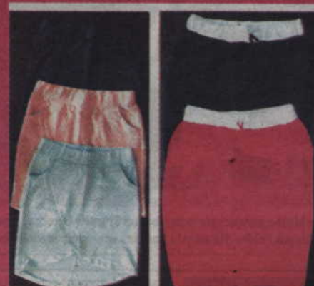
Spódniczki damskie -M do 2 XL 25 zł/szt.