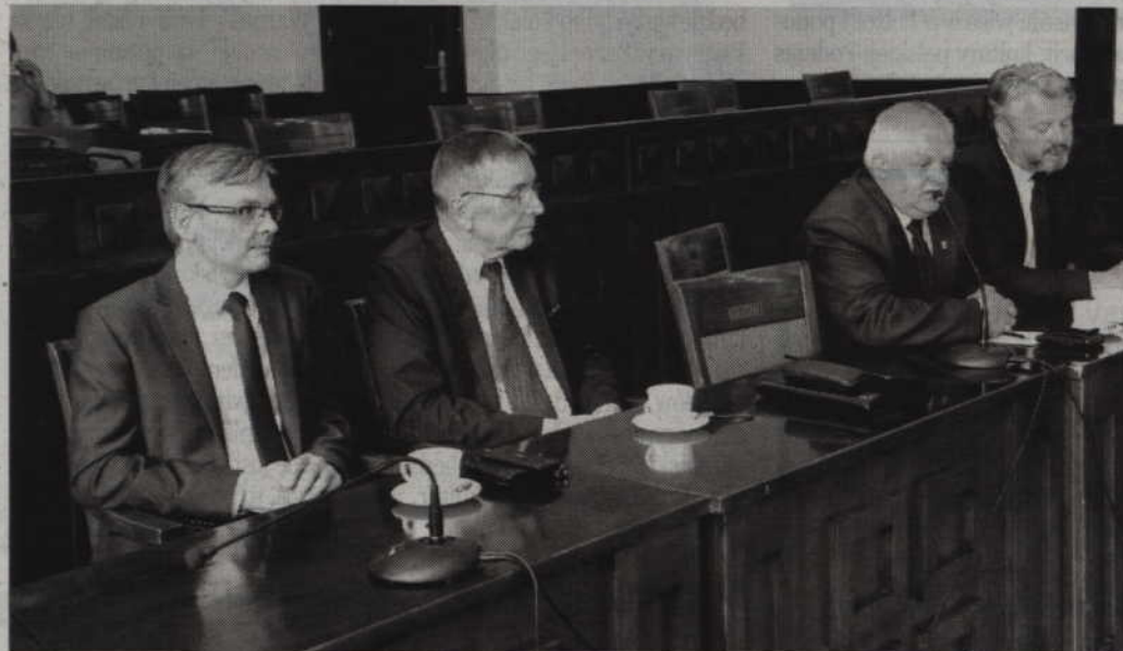
W spotkaniu uczestniczyli również samorządowcy z powiatu kwidzyńskiego.