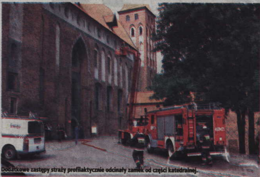
Dodatkowe zastępy straży profilaktycznie odcinały zamek od części katedralnej.