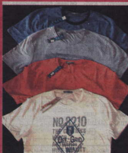
T-shirty męskie od M do 2XL 19 zł/szt.