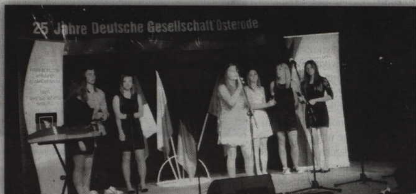
Wyróżniony w Ostródzie zespół wokalny z Wandowa