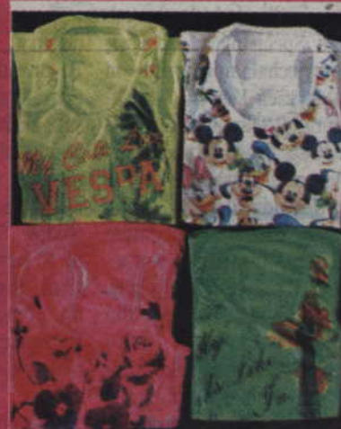
Bluzka ramiączka/ młodzieżowa/ 12 zł/szt.