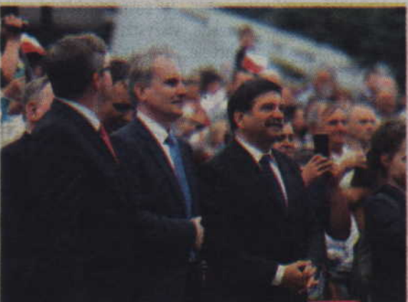
Wśród osób towarzyszących znalazł się m.in. Janusz Śniadek, szef NSZZ „Solidarność”.