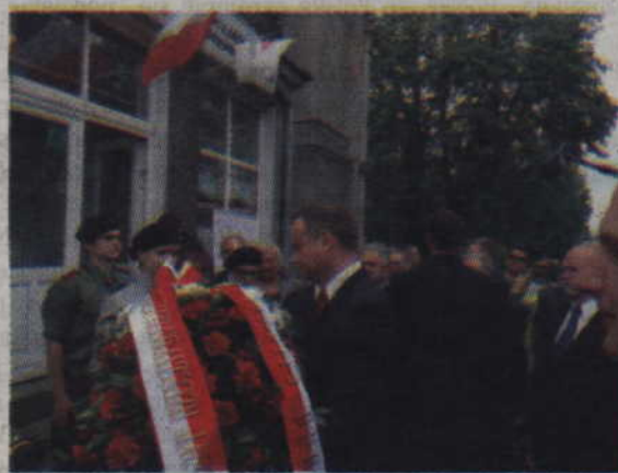
Andrzej Duda złożył wieniec pod tablicą upamiętniającą Izabelę Tomaszewską.