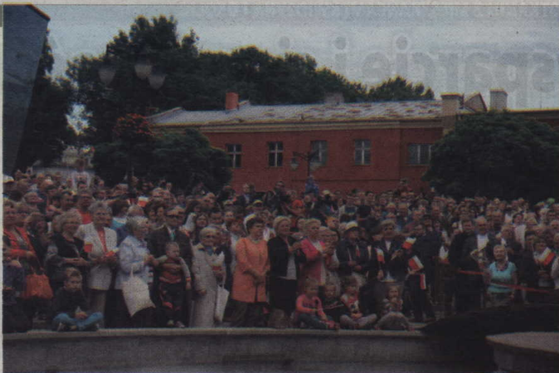
Mieszkańcy cierpliwie czekali na spotkanie z najważniejszą osobą w państwie.