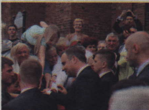
Niekiedy trzeba było się sporo natrudzić, aby choć musnąć prezydencką dłoń.