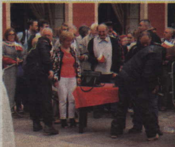
Przed wejściem na Plan Jana Pawła II należało poddać się kontroli.