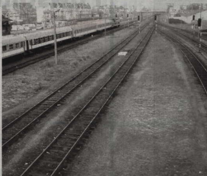
Modernizacja linii kolejowej zakończyć się ma w roku 2020.