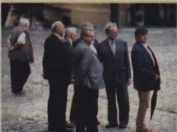
Lokalni samorządowcy z PO i SLD obserwowali przebieg wydarzeń z bezpiecznej odległości.