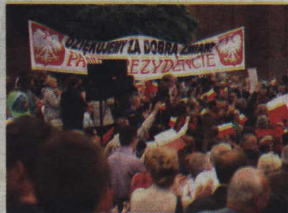
Andrzej Duda nawiązał do hasła znajdującego się na widocznym banerze.