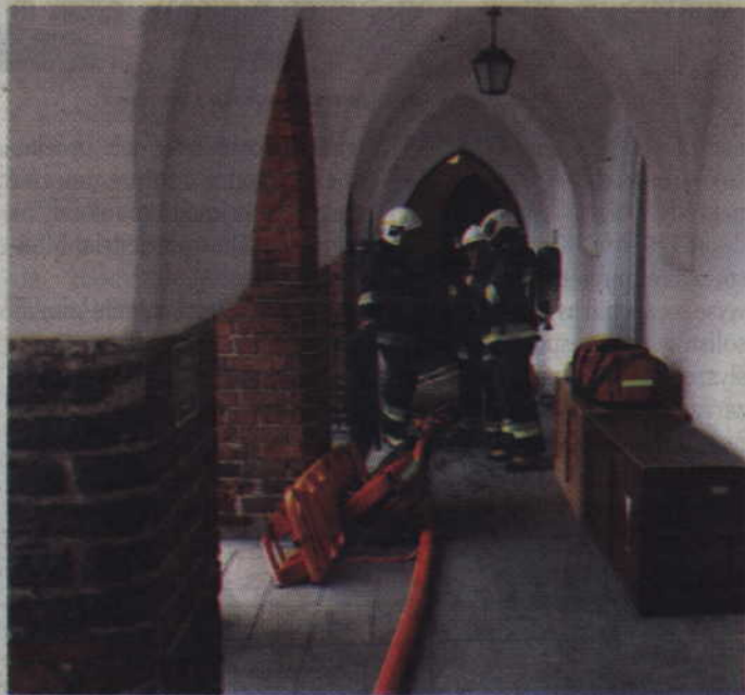
Strażacy po wyjściu z sal kwidzińskiego zamku.

tyczącą transportu uszkodzonych. Po raz pierwszy jesteśmy w takim miejscu, gdzie specyfika podłoża wyklucza transportowanie wózkiem. Mogłoby to ra-