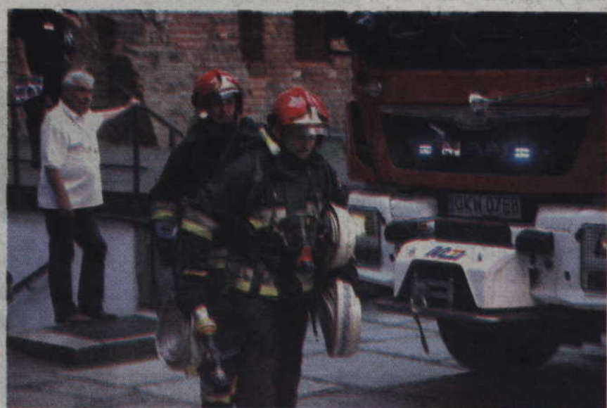
Strażacy starali się ugasić ogień w jak najkrótszym czasie.