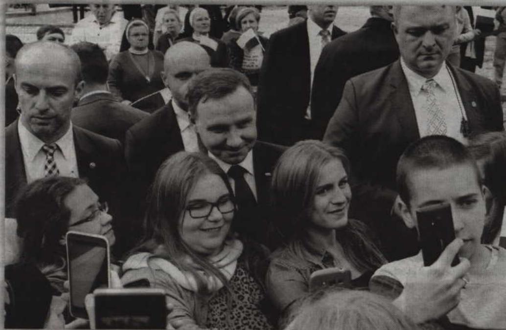
Po spotkaniu Prezydent cierpliwie pozował do zdjęć, rozmawiał i rozdawał autografy.

Wierzę w to, że teraz do programu „500+”, który ma dwie funkcje. Ma z jednej strony funkcję zachęty demograficznej, żeby w Polsce rodziło się więcej dzieci. Że Państwo wspiera ten proces i w związku z tym wspiera rodziny po to, żeby nie musiały się one martwić o swoją przyszłość. Wierzę w to, że także będzie to prowadzić jednocześnie do podniesienia poziomu życia Polaków, Państwa, nas. To niezwykle ważne, żeby rodziny mogły żyć godnie. Zwłaszcza te, które znajdują się w trudniejszej sytuacji, ale nie tylko. Wszystkie. Także te którym