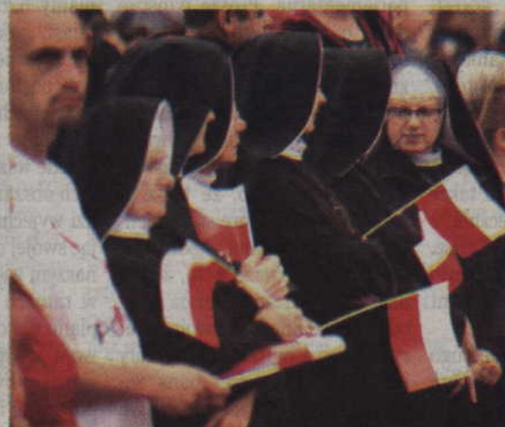
Wśród zgromadzonych nie zabrakło także sióstr zakonnych.