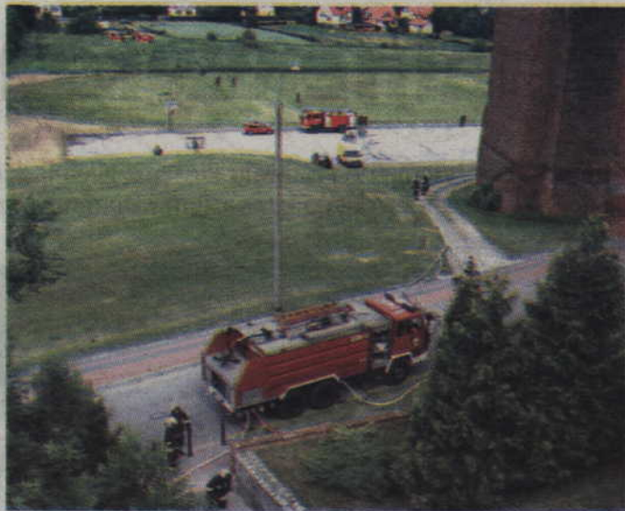
W sytuacji krytycznej jednostki straży przepompowywały wodę z pobliskiej Liwy.

-Drobne usterki zdarzają się zawsze. Ja mam jedną uwagę do-