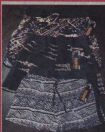
Spodenki damskie - 15 zł/szt.