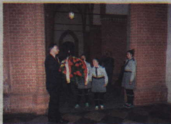
Andrzej Duda złożył również kwiaty pod tablicą znajdującą się w Katedrze, upamiętniającą zmarłą Parę Prezydencką i pozostałe ofiary Katastrofy Smoleńskiej.