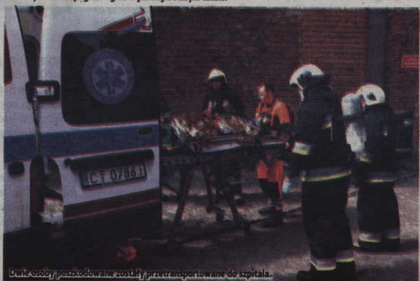
Dwie osoby poszkodowane zostały przetransportowane do szpitala.