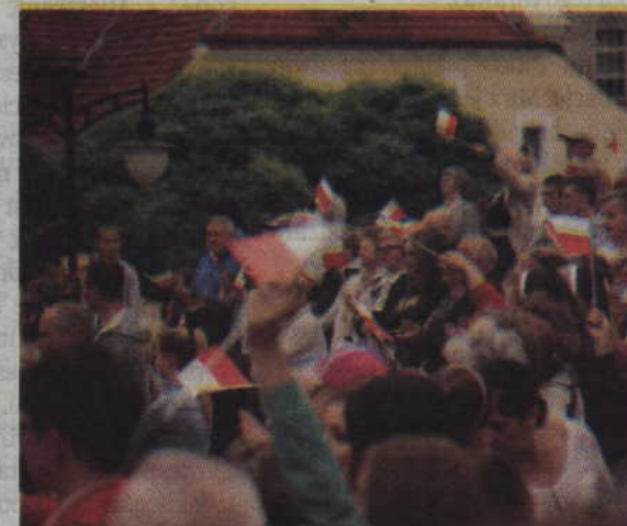
Mieszkańcy powitali Prezydenta bardzo gorąco.