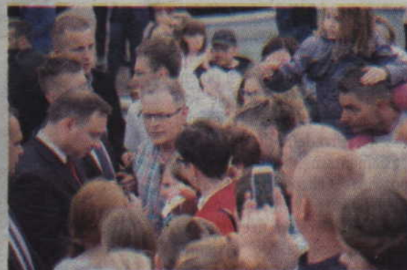
Chętnych do wzięcia prezydenckiego autografu nie brakowało.