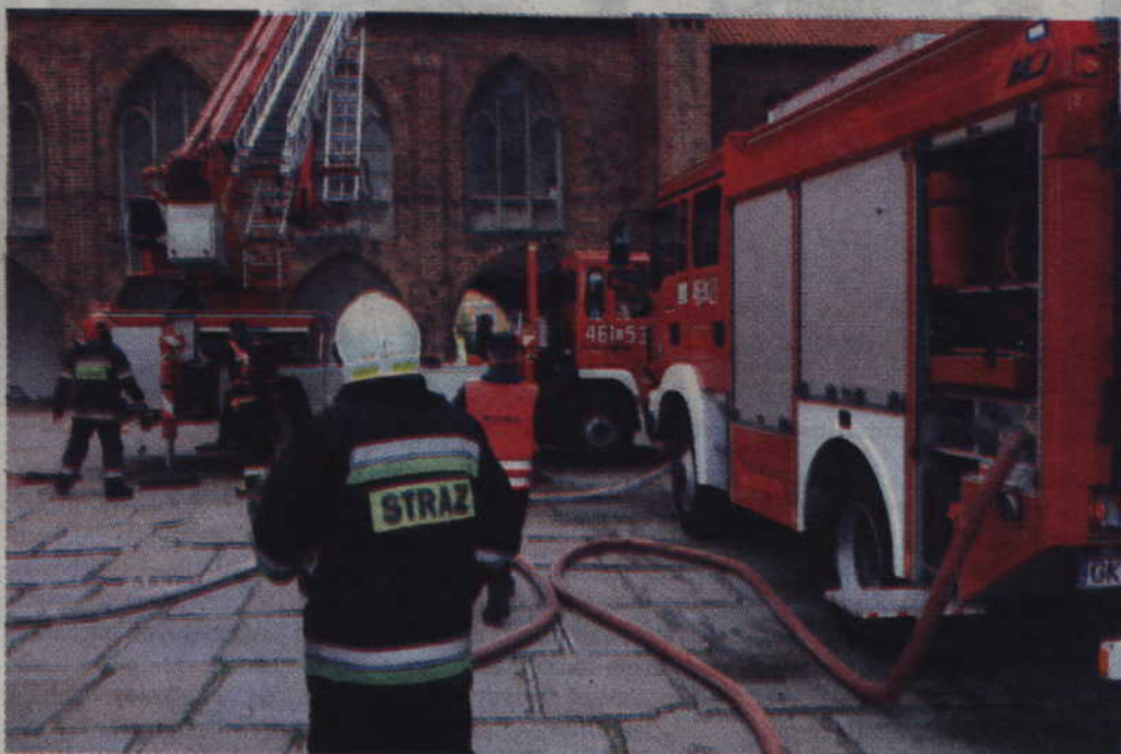
Początkowo w akcji brały udział trzy zastępy straży pożarnej.

W pierwszej fazie do akcji włączono trzy zastępy Państwowej Straży Pożarnej, które pojawiły się na dziedzińcu zamkowym. W międzyczasie kierownik muzeum ogłosił natomiast ewakuację kwidzińskiego zamku. Budynek opuścili pracownicy oraz wszyscy zwiedzający. Po sprawdzeniu okazało się jednak, że w budynku nadal pozostali dwaj pracownicy muzeum. Podjęto więc próbę wejścia do płonącego budynku, a w międzyczasie rozpoczęto także akcję gaszenia prowadzoną ze strażackiego pod-