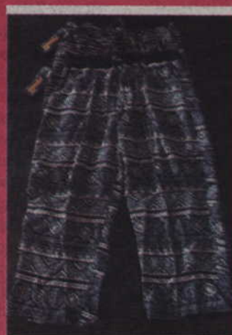
Rybaczki damskie 20 zł/szt.