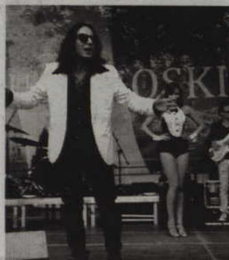
Jedną z gwiazd festynu będzie Marco Bocchino.

To jednak nie jedyne atrakcje tego dnia. Jak podkreślają organizatorzy dostępne będą m.in. dmuchane zjeżdżalnie, samochody, kule wodne czy euro-bunge. Chętni będą mogli również skosztować grochówki czy też potraw i wypieków przygotowanych przez koła gospodyń wiejskich. (fox)