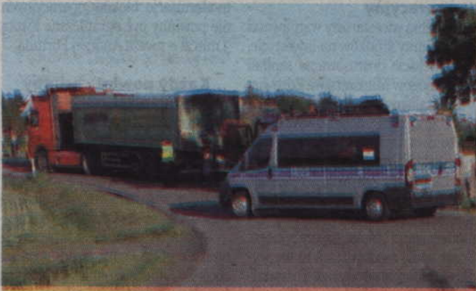
Do wypadku doszło na drodze w Stańkowie.

-Ze wstępnych policyjnych ustaleń wynika, że 34-letnia kobieta kierująca osobowym volvo, z niewyjaśnionych przyczyn, na łuku drogi, zjechała na pas ruchu przeciwnego i zderzyła się czołowo z samochodem ciężarowym - wyjaśnia mł. asp. Bożena Schab, rzecznik prasowy Komendy Powiatowej Policji w Kwidzynie. -W wyniku wypadku kobieta została przetransporto-