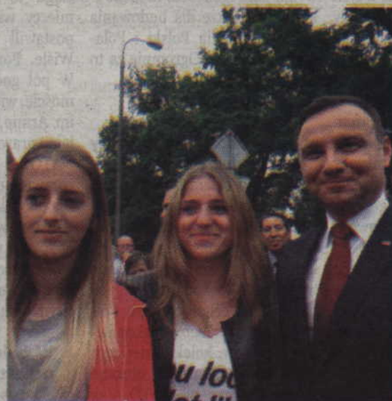
Wspólne zdjęcie z Prezydentem cieszyło każdego szczęśliwca.