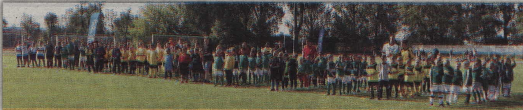
W piłkarskiej rywalizacji uczestniczyło 18 zespołów.

PIŁKA NOŻNA. Około dwustu zawodników wzięło udział w turnieju DSPN Kwidzyn Cup zorganizowanym na kwidzyńskim stadionie. Młodzi piłkarze rywalizowali w trzech grupach rocznikowych: 2004-2005, 2007-2008 oraz 2009 i młodszy. Łącznie na stracie turnieju stanęło 18 zespołów z Kwidzyna, Prabut, Rakowca, Ryjewa, Grudziądza, Pelplina oraz Gdańska.