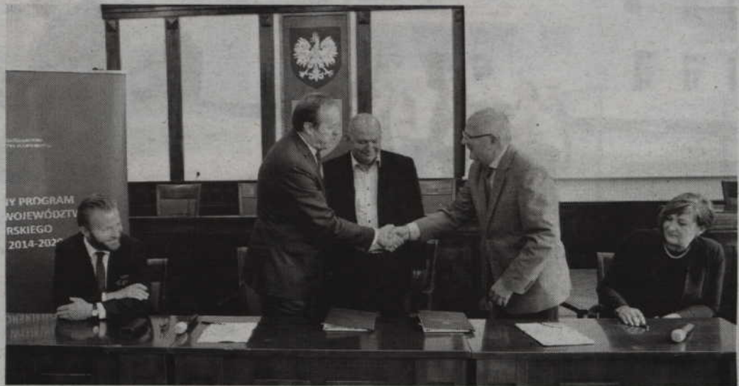
Marszałek Województwa Pomorskiego i PKP Polskie Linie Kolejowe S.A. podpisały porozumienie o modernizacji linii kolejowej Malbork - Grudziądz.