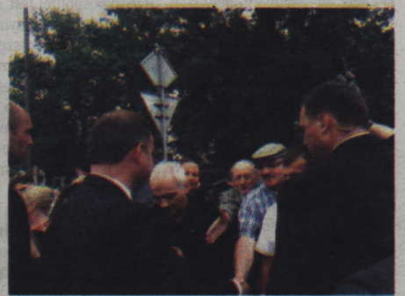
Mieszkańcy przybyli na ul. Grudziądzką, aby choć na moment uściśnąć rękę Głowy Państwa.