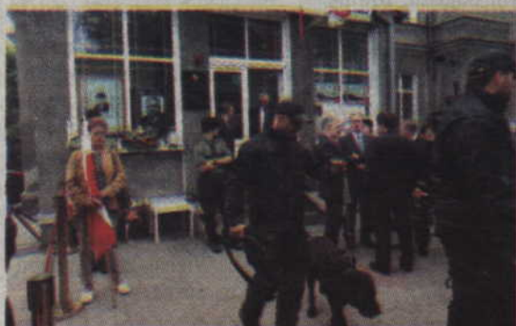
Przed przyjazdem Prezydenta RP okolica kwidzyńskiej siedziby Solidarności została dokładnie sprawdzona.