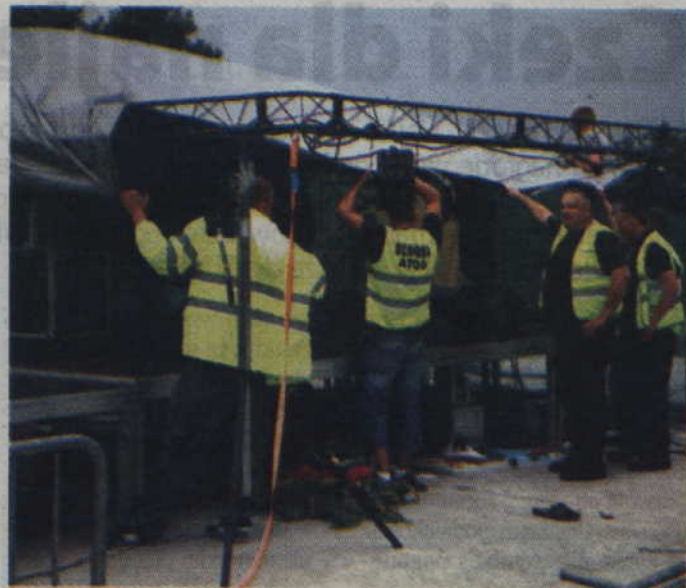
Po silnym podmuchu wiatru uszkodzona została jedna ze ścian sceny.

–Zaczął się chmurzyć, ale nic nie wskazywało na to, że pogoda tak radykalnie się popsuje. W pewnej chwili zaczęło jed-