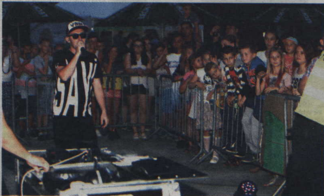
Publiczność doskonale bawiła się przy muzyce zespołu „Gesek”.

GARDEJA. O wyjątkowym pechu mogą mówić organizatorzy tegorocznej Nocy Świętojańskiej w Gardei: Imprezę popsuta bowiem pogoda, a silny podmuch wiatru złamał także ścianę ustawionej sceny. Mimo tych nieprzychylnych zdarzeń, część zaplanowanych imprez odbyła się bez przeszkód.