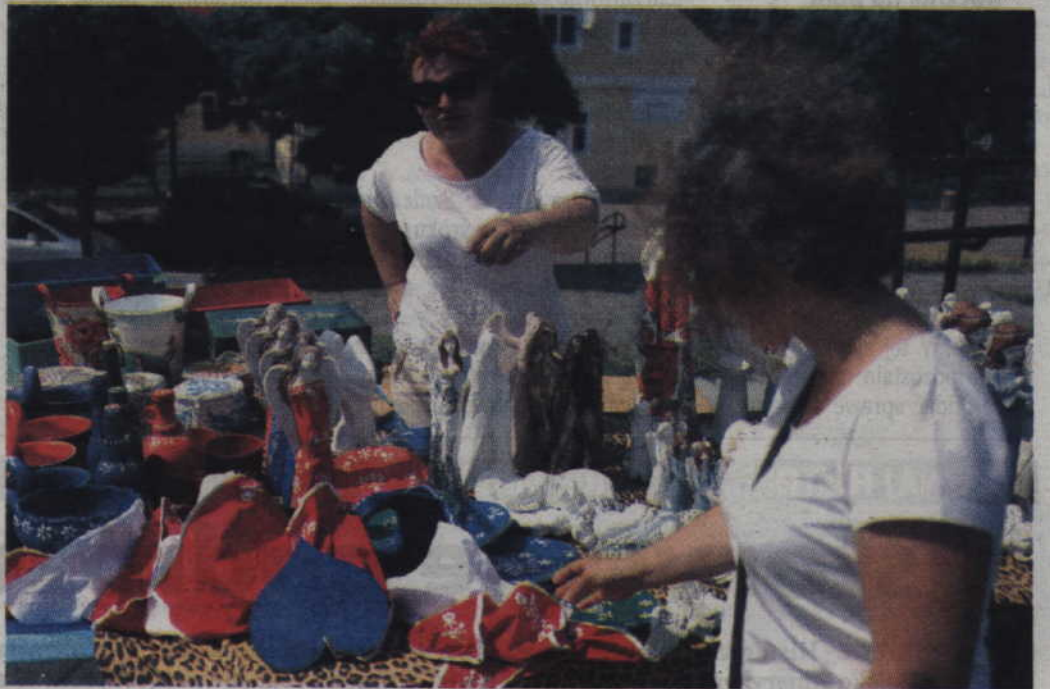
Na jednym ze stoisk można było m.in. podziwiać zdobienia haftem powiślańskim.