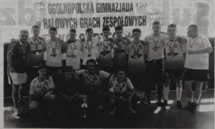
Zespół Gimnazjum nr 2 w Kwidzynie - srebrni medalisci XII Ogólnopolskiej Gimnazjady w piłce ręcznej mężczyzn.