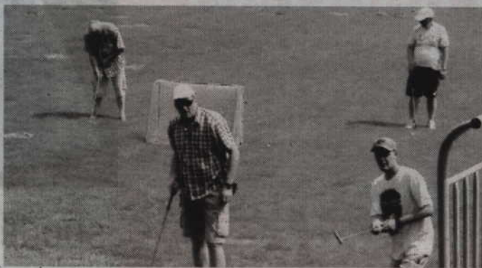
Zawody w minigolf crossie wymagają od uczestników nie tylko precyzji, ale również pokonywania dość znacznych odległości w terenie.

Dzień później, w sobotę - 2 lipca, na polu do minigolfa odbędą się natomiast XVIII Indywidualne Mistrzostwa Kwidzyna. Tym razem zawodnicy zdobywać będą punkty na własny rachunek, a rywalizacja rozpocznie się o godz. 10.00. Turniej również przeprowadzony zostanie w kategorii Open, jednak jeśli do rywalizacji stanie minimum pięć pań to organizatorzy zapowiadają również rywalizację w kategorii kobiet. Warto też dodać, że do klasyfikacji końcowej liczona będzie suma punktów uzyskanych