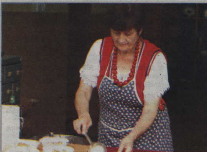
Panie z Koła Gospodyń Wiejskich z Benowa serwowały pyszny bigos.