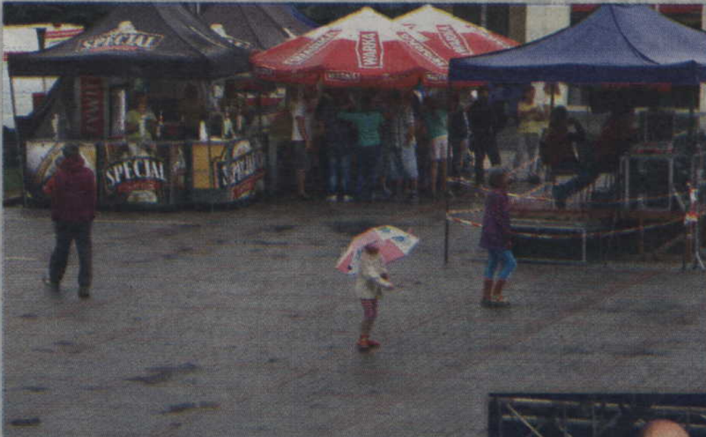
Padający deszcz sprawiał, że mieszkańcy słuchali występów scenicznych schowani pod parasolami.