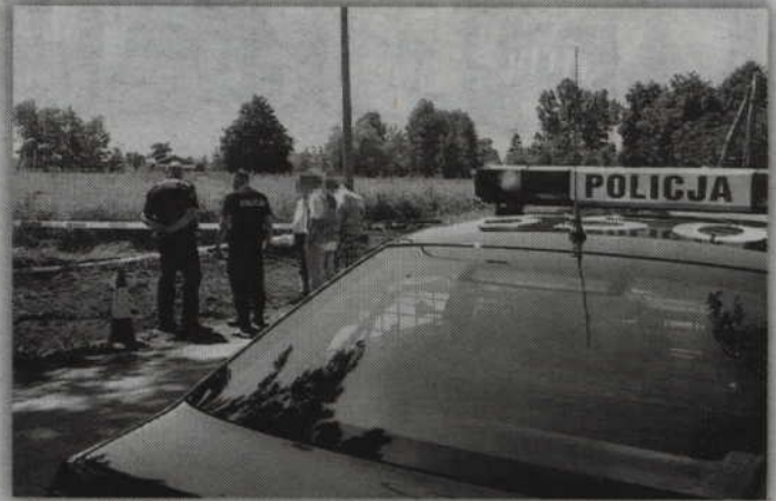
Miejsce znalezienia niewybuchu zostało zabezpieczone przez kwidzyńską policję.