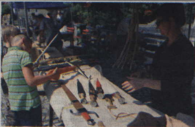
Oreż od zawsze fascynował młodych mężczyzn.