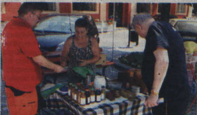
Syropy z lipy, jeczyny czy bzu – to tylko niektóre z produktów, które można było kupić podczas jarmarku.

– Niektóre dzieci zrobiły wówczas po 4 różne wazon, kubki czy miski. Miały z tego wielką frajdę, a przy okazji podpatrzyły jak to rzemiosło wyglądało dawniej.