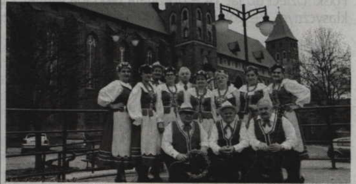
Gospodarzem kwidzyńskich spotkań z muzyką ludową będzie zespół „Powiślanki”.

KWIDZYN. Kwidzyńskie Centrum Kultury zaprasza na IX Ogólnopolskie Spotkania Kapel i Zespołów Ludowych „Folklor i Biesiada”. Impreza odbędzie się 2 lipca na Placu Jana Pawła II, a prezentacje zespołów trwać będą od godziny 10.00 do godz. 17.00. Wcześniej uczestnicy kwidzyńskiego przeglądu przejdą ulicami miasta zachęcając mieszkańców do wspólnej zabawy. Wstęp wolny. (fox)