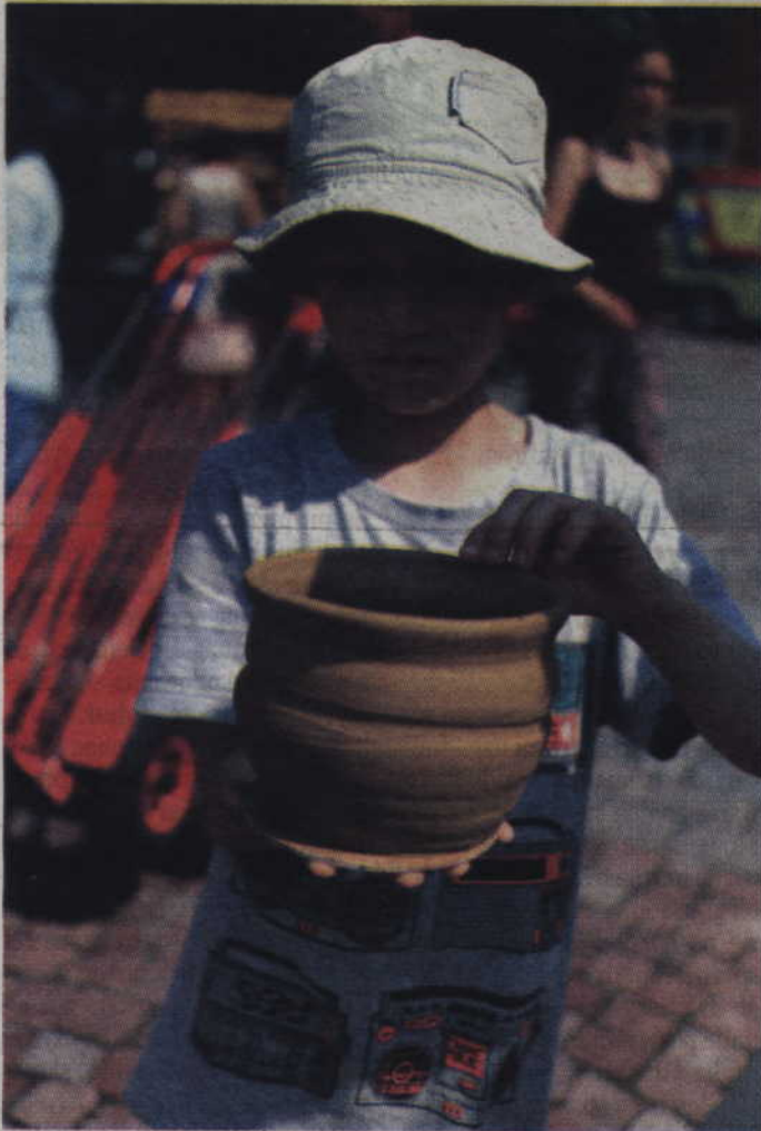
Na stoisku garncarskim można było własnoręcznie wykonać m.in. wazon, kubek lub miskę.

W homilii przypomniał, że w 1976 roku Stolica Apostolska oficjalnie uznała i potwierdziła ist-