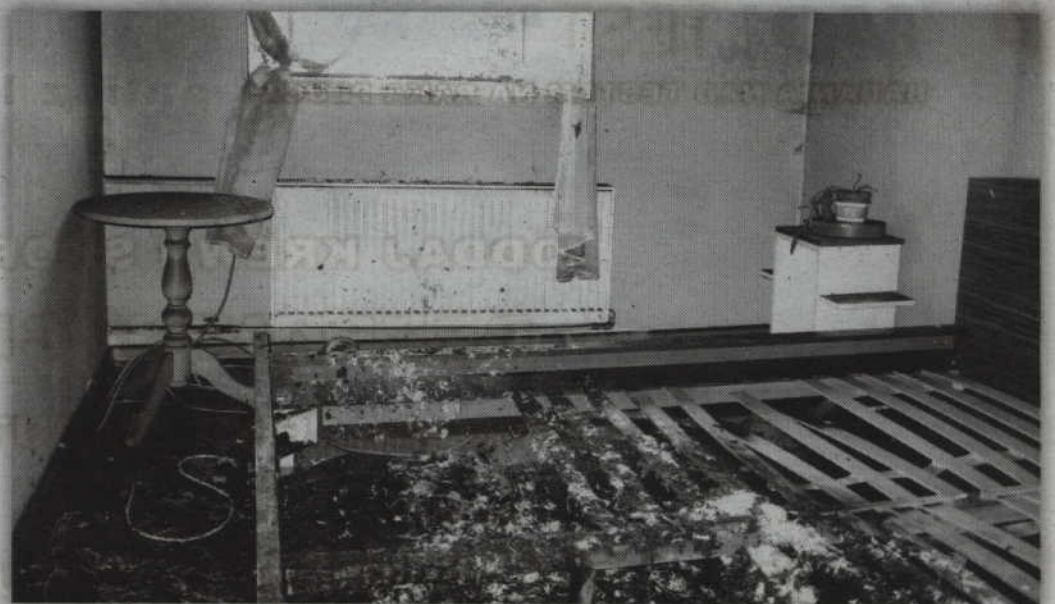
Ze wstępnych informacji wynika, że pożar nastąpił w wyniku zaproszenia ognia.

W prowadzonej akcji uczestniczyły trzy zastępy z jednostki Ratowniczo-Gaśniczej z Kwidzyna oraz dwa zastępy ochotniczej Straży Pożarnej z Ryjewa. Jak dodaje rzecznik prasowy Komendy Po-