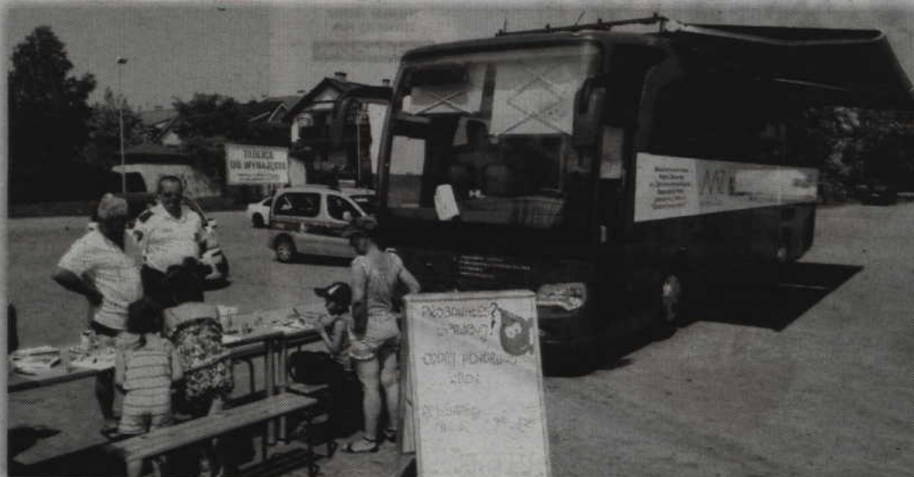
Podczas kwidzyńskiej akcji ambulans RCKiK odwiedziło 13 osób, jednak krew oddała zaledwie siódemka z nich. Obok odbywały się m.in. konkursy plastyczne dla dzieci.

Niestety upał, a także perspektywa transmisji spotkania Polska – Szwajcaria na Euro 2016 spowodowały, że niewiele osób zde-