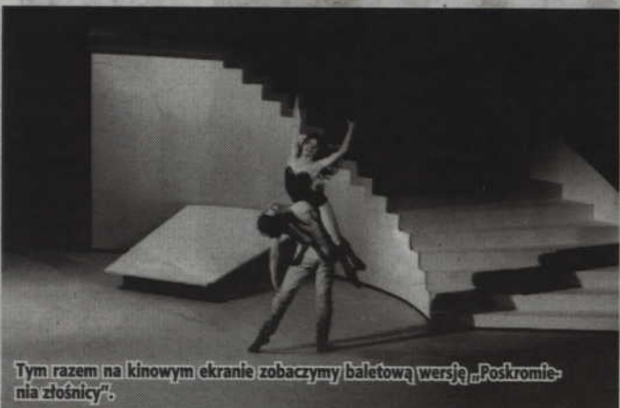
Tym razem na kinowym ekranie zobaczymy baletową wersję „Poskromienia złościcy”.

KWIDZYN. Kwidzyńskie Centrum Kultury zaprasza na retransmisję baletu Teatru „Bolszoi” z Moskwy. Tym razem w ramach cyklu „Na dużym ekranie” zobaczymy szekspirowską komedię „Poskromienie złościcy”. Widowisko będzie można obejrzeć w kwidzyńskim Kinoteatrze, w piątek, 8 lipca o godz. 20.00. Bilety w cenie: 28 zł - normalny i 24 zł - ulgowy, nabywać można w kasie KCK. (fox)