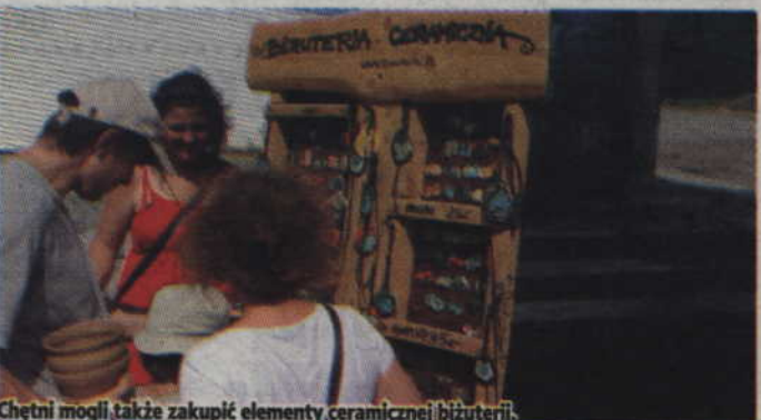
Chętni mogli także zakupić elementy ceramicznej biżuterii.