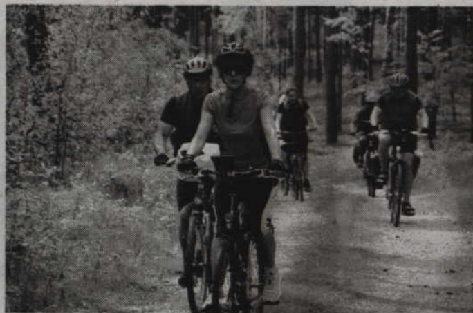
Druga edycja rajdu rozpocznie się po powiślańskiej stronie Wisły.

W tym roku start jest po powiślańskiej stronie Wisły, a więc zgodnie z umową, i nazwa adekwatna: powiślańsko-kociewski. Rajd ruszy z Kwidzyna o godz. 10:00. Pierwszego dnia do przejechania będzie nieco ponad 50 km, nocleg w warunkach turystycznych (należy posiadać karimatę i śpiwór - bagaże będą przewożone) przewidziany jest w szkole w Nowem. Trasa powiezie przez Leśnictwo Bogusze-