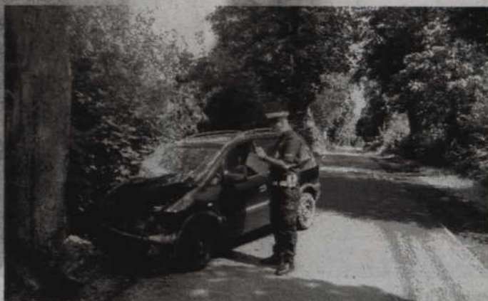
Samochód uderzył w jedno z przydrożnych drzew w Trumiejach (gm. Gardeja).

-Ze wstępnych policyjnych ustaleń wynika, że 28-letnia mieszkanka powiatu iławskiego kierująca oplem zafira, jadąc w kierunku Jaromierza, prawdopodobnie straciła panowanie nad pojazdem, zjechała z drogi i uderzyła w przydrożne drzewo. W wyniku zdarzenia ranna została kierująca oraz trójka jej pasażerów: 8-letnie dziecko, 65-let-