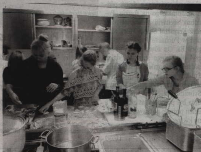
Gimnazjaliści z Kwidzyna podczas przygotowywania pierogów.