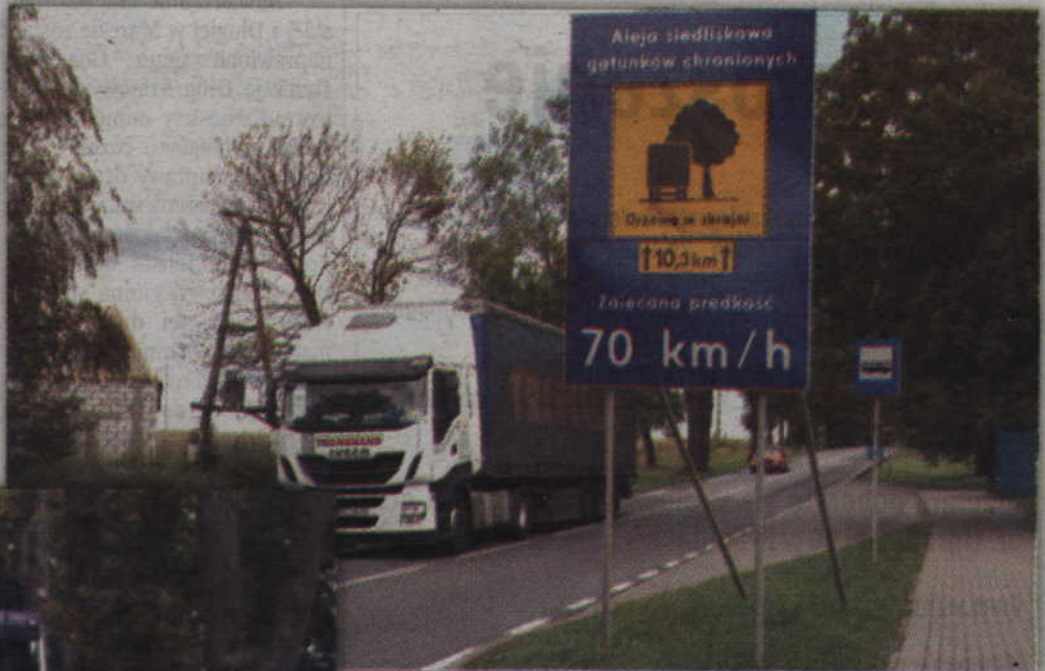
Fragment drogi krajowej nr 55 na odcinku Kwidzyn – Gardeja jest aleją gatunków chronionych.

muających się ochroną przyrody, bowiem fragment drogi krajowej nr 55 na odcinku Kwidzyn – Gardeja jest aleją gatunków chronionych. W takich przypadkach ostateczna decyzja o wydaniu zgody na wycinkę drzew musi być podparta pozytywną opinią m.in. regionalnej dyrekcji ochrony środowiska. Musimy uzyskać zgodę na odstępstwa w stosunku do gatunków chronionych. Nie możemy mówić, że drzewa znikną w ciągu najbliższego miesiąca czy dwóch. Są terminy, które nas zobowiązują zgodnie z ustawą o