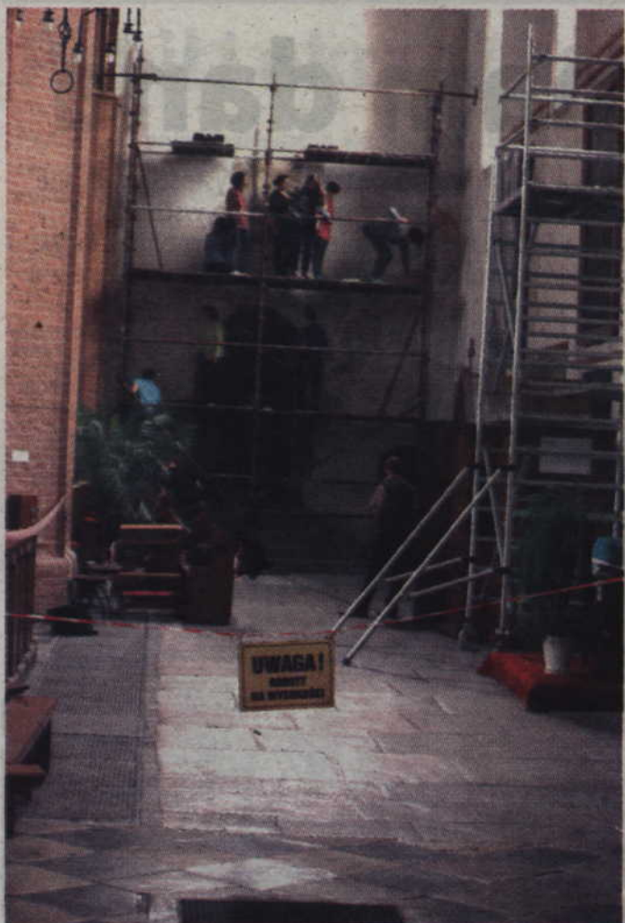
Prace wykonywane są na zamalowanych dotychczas ścianach nawy południowej.