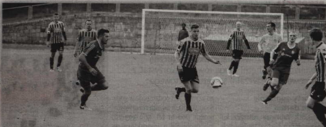
Choć na własnym boisku kwidzynianie ograli Lębork 2:0, to z awansu do III ligi ostatecznie cieszyli się gracze Pogoni.