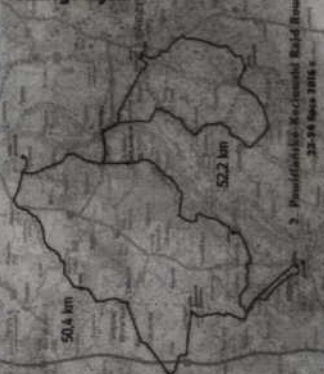
Tak wygląda trasa tego rocznego rajdu.

Zapisów na Rajd można dokonać telefonicznie - tel. 58 531 37 41 lub mailowo pod adresem info@kociewie.eu. (n)