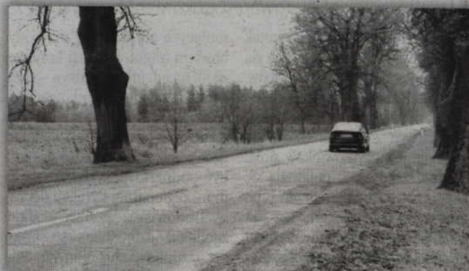
Zniszczona droga Mareza - Korzeniewo w końcu doczeka się modernizacji.

- Lada dzień wykonawca rozpocznie przebudowę drogi. To odcinek o długości ok. 4,3 km. Przebudową zostanie objęty cały odcinek drogi Mareza - Korzeniewo. Położona zostanie nowa nawierzchnia składająca się z