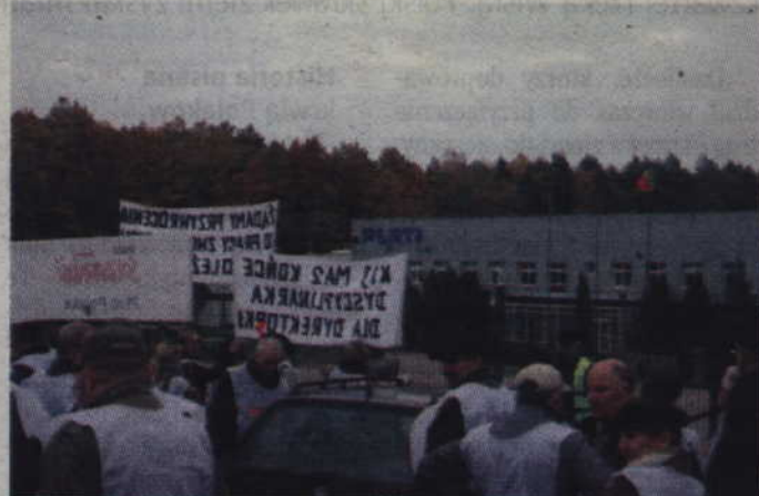
To nie pierwszy protest dotyczący kwidzyńskiego zakładu firmy „Plati”. Tym razem pracownicy zakładu żądają podwyżek w wysokości 150 zł.

-Przeprowadziliśmy wśród załogi referendum, którego wynik okazał się dla zarządu druzgocący. Aż 98 procent załogi opowiedziało się za rozpoczęciem strajku czynnego. Co roku prowadzimy rozmowy z zarządem firmy i właściwie za każdym razem jest to „wyrwanie” podwyżek. Ciągle słyszymy, że za mało pracujemy, firma jest w kryzysie i mamy pracować jeszcze więcej, przy czym normy są systematycznie podnoszone. Nie jest żadną tajemnicą, że średnia płaca w „Plati” to najniższa krajowa i nie przekracza 1,5 tys. zł. Jeżeli pracownik po 10-15 latach pracy zarabia najniższą krajową to chyba jest coś nie tak. Najniższa krajowa wzrasta od nowego roku i jeśli do firmy przyjdzie ktoś nowy to będzie zarabiał tyle samo co pracownik