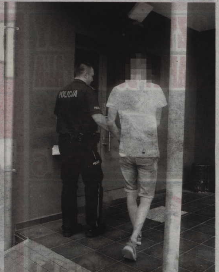
Zatrzymani wandalę to dobrze znani policji dwaj 19-latkowie z Prabut.

-Wandale podczas zatrzymania byli pod wpływem alkoholu. Badanie alkomatem wykazało 1,2 promila u jednego i 0,4 promila alkoholu w organizmie u drugiego ze sprawców. Wczoraj śledczy przesłuchali 19-latków i przedstawili im zarzuty zniszczenia mienia. Grozi im kara do 5 lat