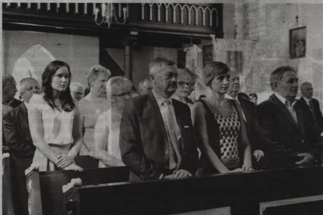
W Janowie uczczono 96 rocznicę plebiscytu na Powiślu, Warmii i Mazurach. Miał on zdecydować czy tereny położone po wschodniej stronie Wisły zostaną przyłączone do Polski lub do Niemiec.

Henryk Ordon przypomniał też słowa Jana Pawła II, które zdaniem przewodniczącego mogą stanowić motto ko-