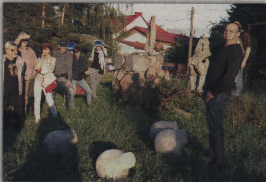
Mariusz Burdek i jego „Program 500+”.