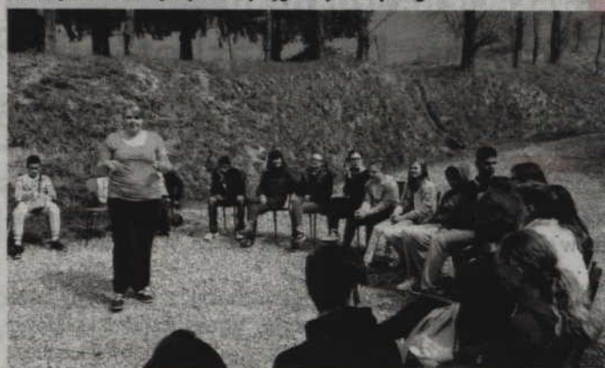
Niektóre zajęcia odbywały się na świeżym powietrzu.