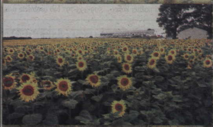
Uprawa słoneczników w naszych okolicach to prawdziwa rzadkość.

Widok pola pełnego kwitnącego rzepaku nikogo z nas nie dziwi. Nie byłoby prawdziwej wiosny gdybyśmy nie mogli podziwiać pól z tą rośliną. W tym roku uważni obserwatorzy mogli dostrzec także w okolicach Górek kwitnącą na fioletowo facelię. Jednak pole, gdzie kwitną dziesiątki tysięcy słoneczników to nie codzienność a nawet można rzec, iż prawdziwa rzadkość w naszych stronach. A takie właśnie pole, gdzie po horyzont rosną te piękne rośliny można było w tym roku zobaczyć w okolicy Gardei.