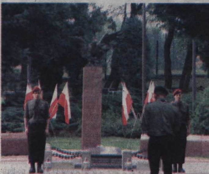
Hufiec ZHP Kwidzyna uczcił pamięć powstańców Apielem na Skwerze Kombatantów.