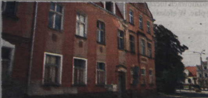
W kamienicy przy ulicy Słowiańskiej 29 powstaną 3 mieszkania. zd. rysunki Bartośk

- Mam nadzieję, że program ten nie zostanie zlikwidowany i uda się nam uzyskać dofinansowanie, wówczas od razu przystąpimy do realizacji zadania. Możemy uzyskać dofinansowanie do 30-35 proc. kosztów całego przedsięwzięcia. Gdybyśmy jednak rozpoczęli pracę przed rozpatrzeniem wniosku o dofinansowanie, stracilibyśmy taką możliwość. Warto więc zaczekać i skorzystać z dofinansowania, o