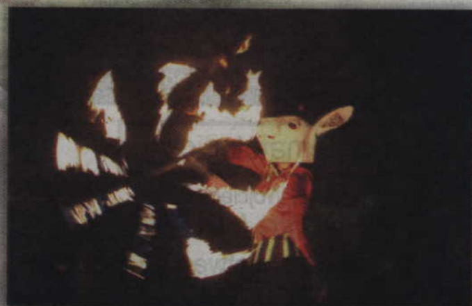
Grupa Mamadoo zaprosiła wszystkich na spektakl „Playing with fire”.

Tegoroczny festiwal to jednak nie tylko spektakle. Funkcjonowały także: „Second hand”, pracownia rzeźby czy kącik poezji. Warto również dodać, że czas umiłał wszystkim muzykujący jazzband, ale nie brakowało również płynącej z głośników muzyki disco-polo.