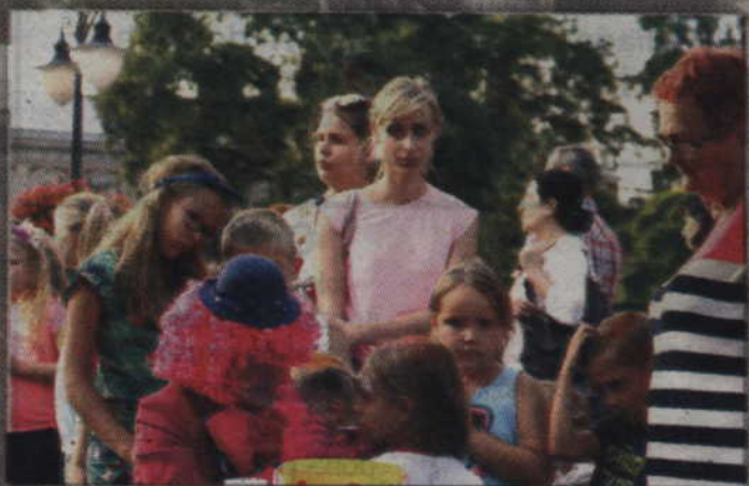
Chętnych do pomalowania sobie twarzy nie brakowało.