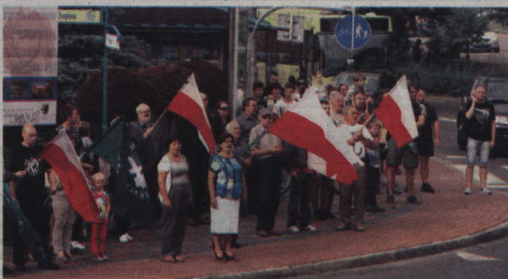
Oddając cześć powstańcom mieszkańcy odśpiewali Mazurka Dąbrowskiego.

U SCHYŁKU ŻYCIOWEJ DROGI POWSTAŃCY ŻYJĄ W WOLNEJ POLSCE