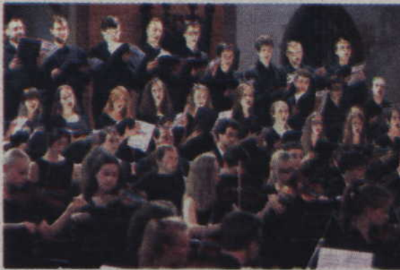
Podczas wyjątkowego koncertu słuchaczom zaprezentował się ponad stuosobowy zespół muzyczny.

KWIDZYN. Ponad stuosobowy zespół muzyczny wystąpił w kwidzyńskiej Katedrze, w specjalnym koncercie zorganizowanym z okazji 10-lecia partnerstwa powiatu kwidzyńskiego i niemieckiego powiatu Osterholz. Artyści zaprezentowali słuchaczom utwory Henryka Mikołaja Góreckiego i Wolfganga Amadeusza Mozarta. Przed koncertem można było natomiast obejrzeć wystawę zdjęć przedstawiających powiat Osterholz.