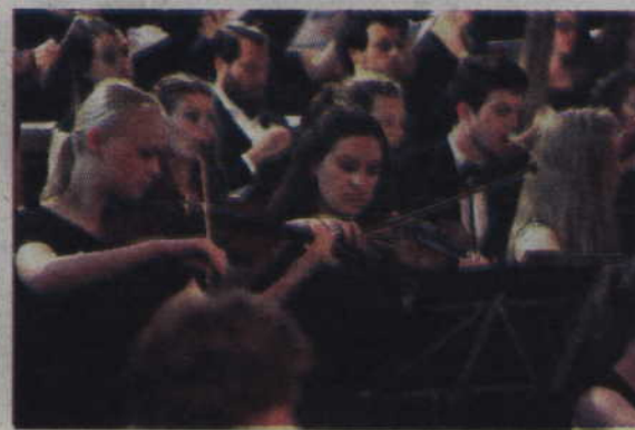
Trzon zespołu tworzyli muzycy orkiestry młodzieżowej z Bremy.