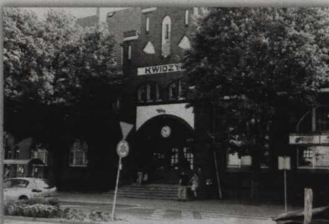
Dzięki środkom unijnym kwidzyński dworzec odzyska swój dawny blask

- Wniosek wraz z kompletem dokumentów złożyliśmy już do