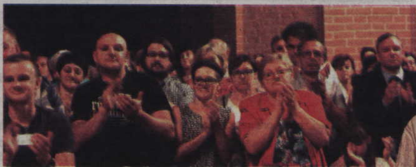
Kwidzyńska publiczność zgotowała muzykom owację na stojąco.