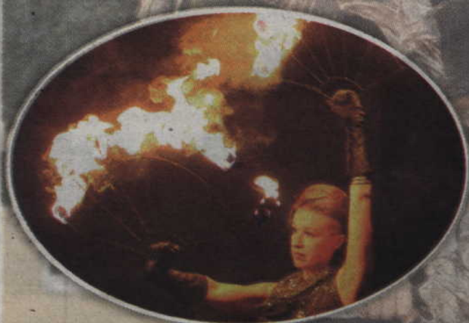
Kwidzynie uwielaiają nocne prezentacje z użyciem ognia.