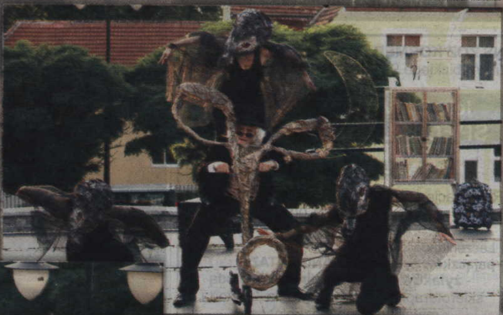
„Siódme zaćmienie księżycy” w wykonaniu Teatru Nikoli.