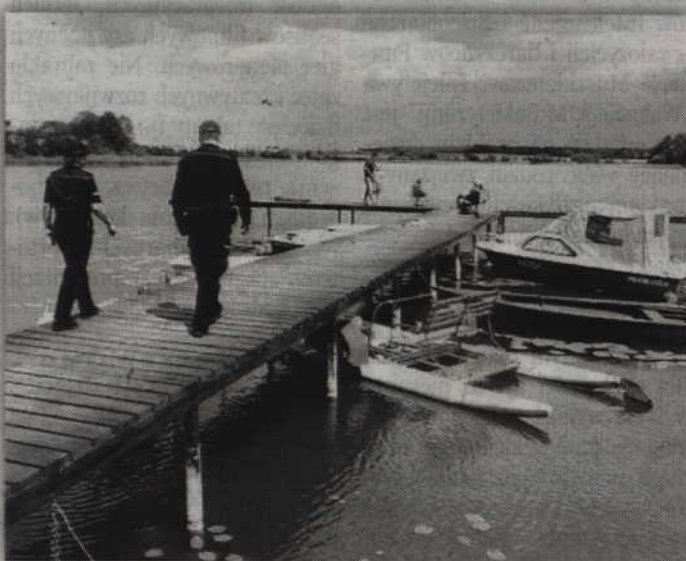
Policjanci kontrolowali kąpieliska i dzikie plaże.

Po 10 dniach strajku (27 lipca) porozumienie pomiędzy stronami zostało jednak zawarte, a firma „Plati” przystąpiła na propozycje strajkujących. W efekcie pracownicy otrzymają podwyżkę pensji w wysokości 150 zł, z wyrównaniem od kwietnia tego roku. (RB)