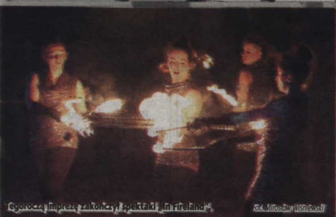
Tegoroczną imprezę zakończył spektakl „In Fireland”.