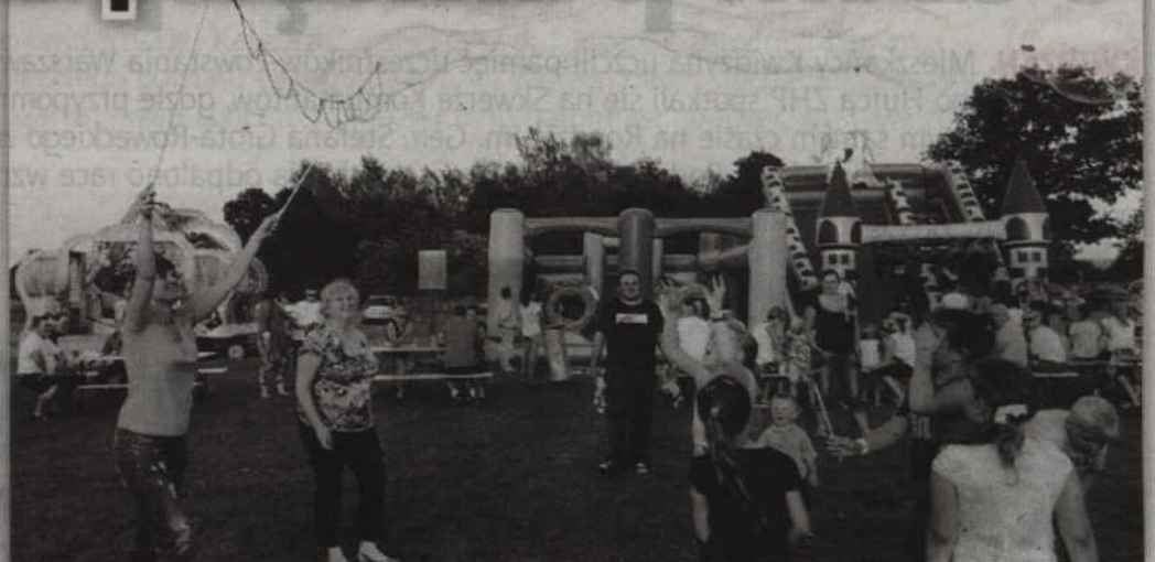
Mega mydlane bańki podobały się dzieciom.

Okres wakacyjny to czas organizowania najróżniejszych imprez na wolnym powietrzu. Nie można się więc dziwić, że nie ma praktycznie weekendu, ażeby taki festyn gdzieś