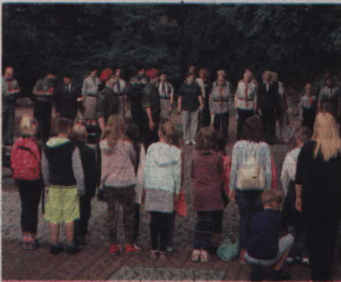
W spotkaniu uczestniczyli harcerze, kombatanci oraz najmłodsi mieszkańcy Kwidzyna.