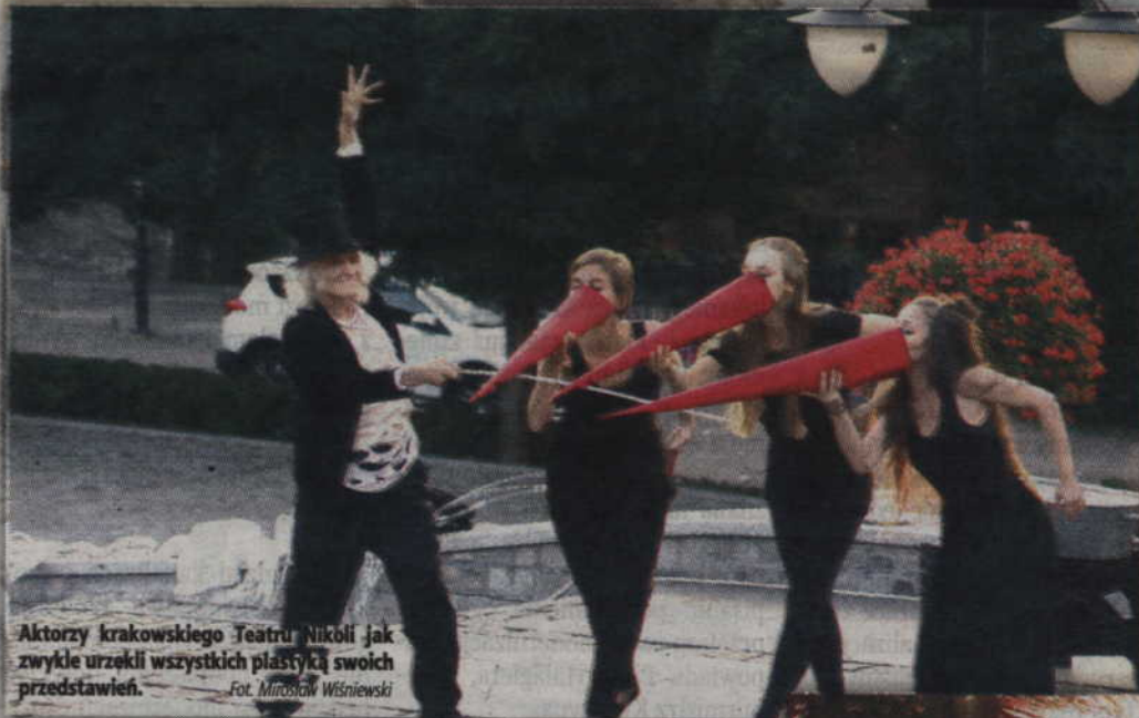
Aktorzy krakowskiego Teatru Nikoli jak zwykle urzekli wszystkich plastyką swoich przedstawień.