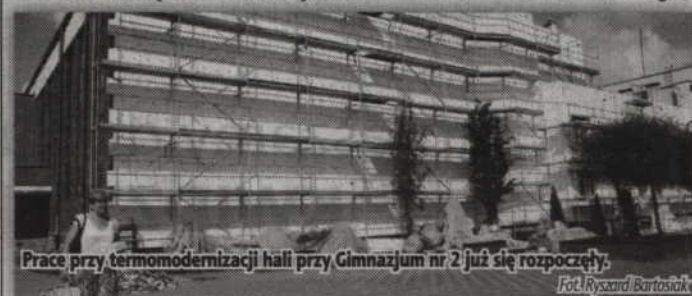
Prace przy termomodernizacji hali przy Gimnazjum nr 2 już się rozpoczęły.