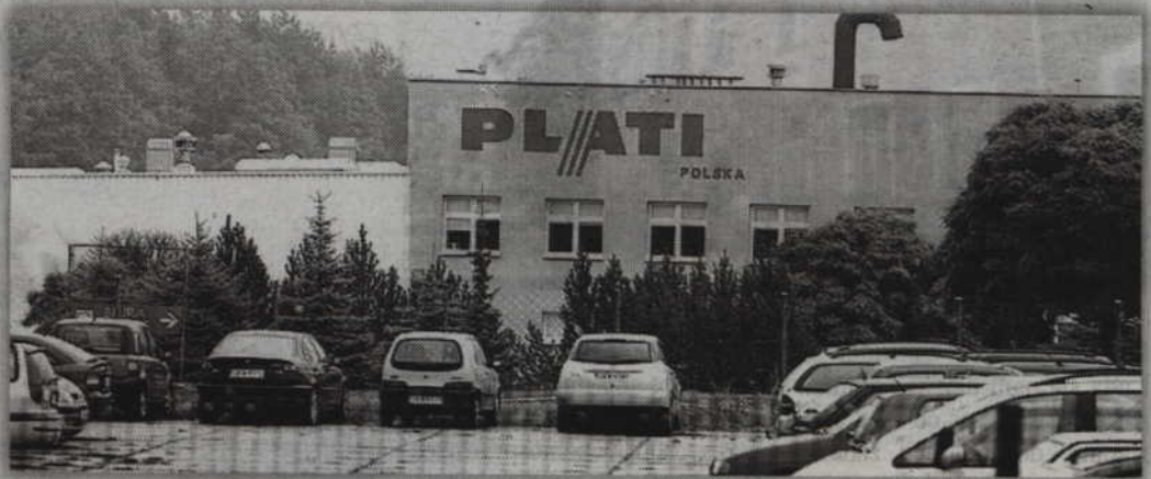
Strajk w kwidzyńskiej firmie „Plati” zakończył się po 10 dniach protestu.