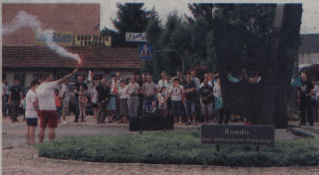
Członkowie Obozu Narodowo-Radykalnego oraz sympatycy prawicy spotkali się na Rondzie Gen. Stefana Gęta-Roweckiego.