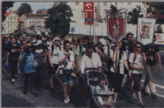
Połączona grupa pielgrzymów ze Sztumu i Nowego Dworu Gdańskiego.