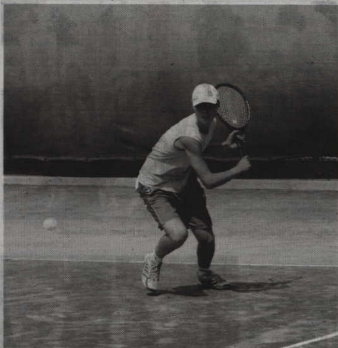
KCSiR zachęca do korzystania z kortów tenisowych przy ul. Sportowej i ul. Baczyńskiego.

Kwidzyńskie Centrum Sportu i Rekreacji zaprasza również do wypożyczalni sprzętu sportowego. W sierpniu ze sprzętu korzystać będzie można natomiast w godz. 12.00-20.00. Wystarczy przejść się do kasy w hali sportowej przy ul. Wiejskiej, Warto do-