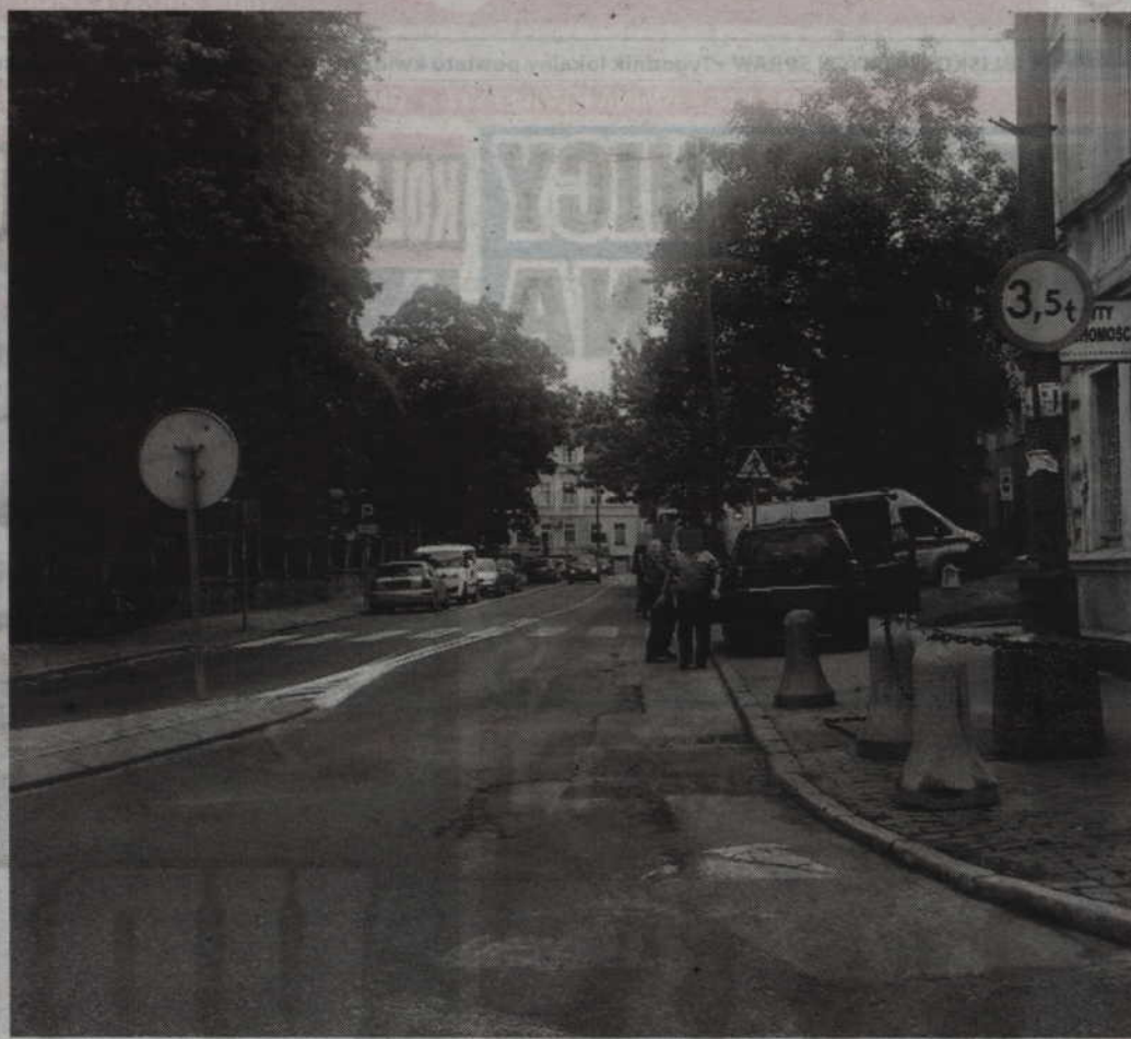
Do potrącenia pieszej doszło w okolicy kościoła pw. Św. Trójcy.

KWIDZYN. Kierowca opla potrącił 75-latkę, która wtargnęła na jezdnię w pobliżu skrzyżowania ulic Grudziądzkiej i Hallera. Poszkodowana doznała złamania kości stopy.