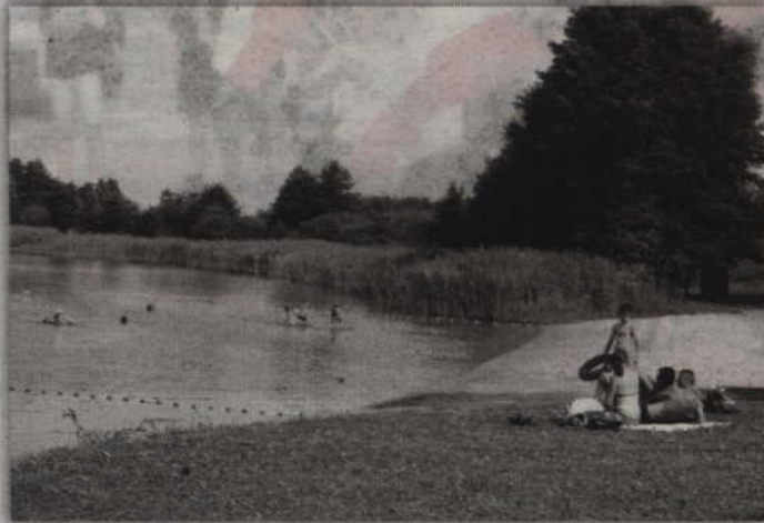
Kąpielisko jest dobrze przygotowane ale kąpiących jest mniej niż w ubiegłym roku.