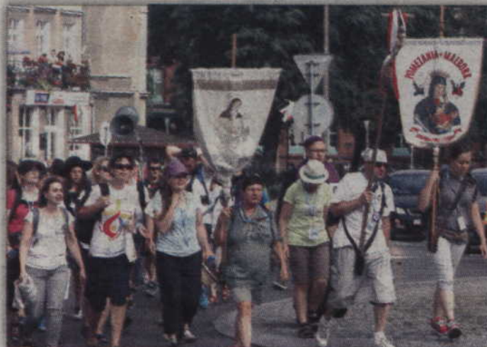
Pielgrzymi z Malborka na trasie pielgrzymki.