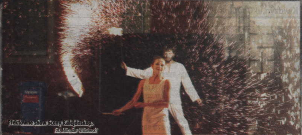
Efektowne show sceny Kalejdoskop.