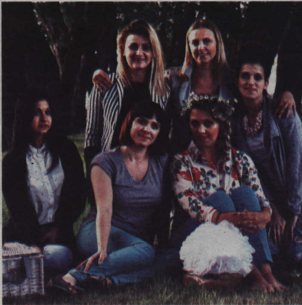
Pomysłodawczynie kosmetycznej zabawy już myślą o kolejnym konkursie tym razem jesienią

spory sukces sprawił, że organizatorki „wakacyjnej metamorfozy” już myślą o kolejnej edycji.