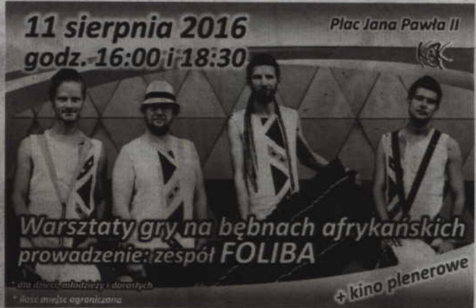
Przed prezentacjami filmowymi odbędą się warsztaty z zespołem „Foliba”.

KWIDZYN. Kwidzyńskie Centrum Kultury zaprasza na kolejne prezentacje kina plenerowego. Filmy obejrzyć będzie można w najbliższy czwartek, 11 sierpnia, na Placu Jana Pawła II. O godz. 17.00 zobaczymy kolejną część Epoki Lodowcowej, natomiast na godz. 20.00 przewidziano projekcję polskiej komedii „7 rzeczy, których nie wiecie o faceciach”. KCK informuje również, że przed filmowymi pokazami na Placu Jana Pawła II odbędą się również warsztaty bębniarskie z zespołem „Foliba”. W zajęciach zaplanowanych na godz. 16.00 i 18.30 uczestniczyć mogą dzieci, młodzież oraz dorośli. Liczba miejsc jest jednak ograniczona. Wstęp wolny. (fox)