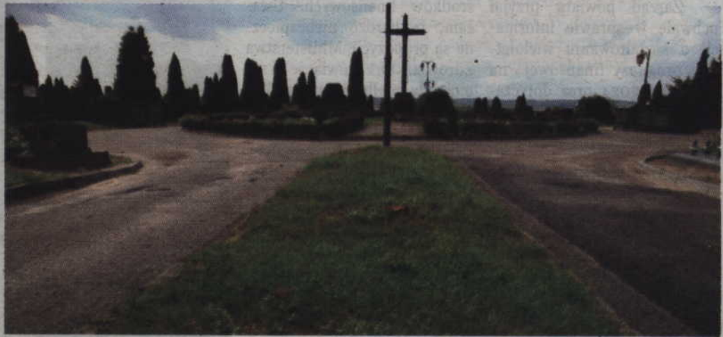
W miejsce usuniętych sumaków zostaną posadzone iglaki.

Z prośbą o wyjaśnienie sprawy zwróciliśmy się do zarządcy Cmentarza Komunalnego w Kwidzynie, Zakładu ds. Infrastruktury