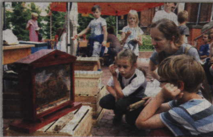
W specjalnym ulu można było zobaczyć jak pracują pszczoły.