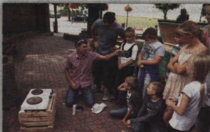
W zajęciach uczestniczyły dzieci ze świetlicy środowiskowej.