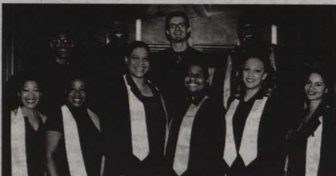
Artyści z B.I.G.S. zaśpiewają w kwidzyńskim kościele pw. Św. Trójcy.

Muzyka „B.I.G.S.” charakteryzuje się dominacją wokalu z tekstami chrześcijańskimi. Pochodząca ze staroangielskiego języka nazwa gospel (od słów god spell) oznacza dobrą nowinę. Gospel jako gatunek muzyczny wiąże się ściśle z „negro spirituals”