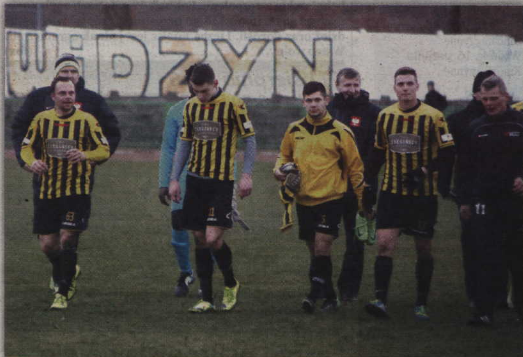
Rodło Kwidzyn zamiast o awans powalczy w tym sezonie o utrzymanie w IV lidze.