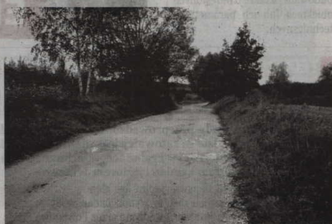
Za kilkanaście dni droga gminna będzie wyremontowana

Jak wyglądają nasze drogi każdy widzi i czasami odczuwa ich stan techniczny jadąc samochodem. Dlatego każda inwestycja drogowa czy to na drogach gminnych czy powiatowych cieszy mieszkańców. Podobnie będzie w przypadku drogi gminnej na odcinku Czarne Małe 1 – jezioro Kuchnia. Przez najbliższe trzy tygodnie, będą tam pojawiały się utrudnienia związane z jej remontem. W uchwale budżetowej na remont drogi gminnej zaplanowano 200 tys. zł. Pó przetargu okazało się, że jej wykonanie będzie tańsze o 30 tys. zł. Za te pieniądze zostanie wyremontowany 650-metrowy odcinek drogi. Nawierzchnia będzie po-