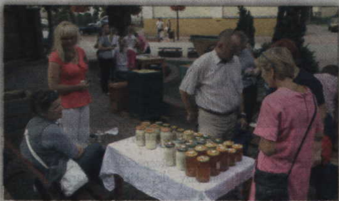
Podczas festynu można było kupić miód z tegorocznych zbiorów.