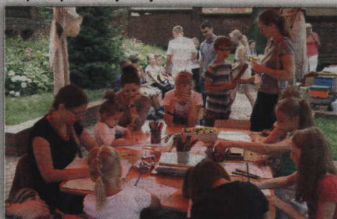
Pracownicy biblioteki przygotowali specjalne stanowiska gdzie przeprowadzano grę terenową.