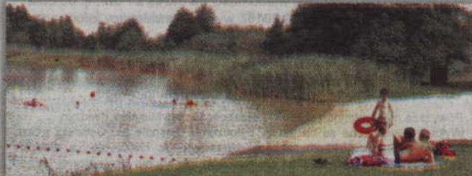
Pięć kąpielisk strzeżonych w powiecie jest wolnych od glonów.