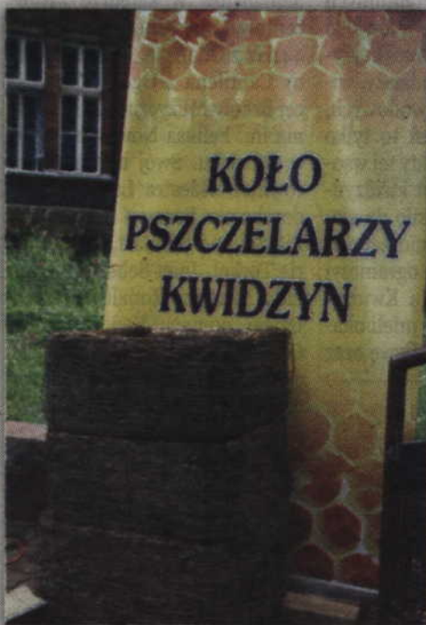
Stuletni słomiany ul to cenny eksponat.

- Pomyśleliśmy, że warto byłoby do tej akcji przystąpić. Biblioteka do tej pory nie brała udziału w takiej akcji więc też musieliśmy się do tej imprezy przygotować. Nie byłoby wspólnej zabawy gdyby nie pomoc zaprzyjaźnionych pszczelarzy. Jako