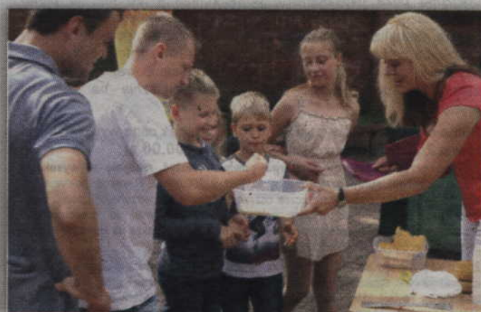
Miód prosto z plastra smakuje inaczej.