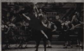
Spektakl w wykonaniu artystów Teatru Bolszoi obejrzyć będzie można w najbliższy czwartek, 12 sierpnia o godz. 18.30.

KWIDZYN. Kwidzyńskie Centrum Kultury zaprasza na kolejną retransmisję baletu Teatru Bolszoi z Moskwy. Tym razem w ramach cyklu „Na dużym ekranie” zaprezentowany zostanie „Don Kichot”. Spektakl obejrzyć będzie można w kwidzyńskim kinie w najbliższy piątek, 12 sierpnia o godz. 18.30. Bilety w cenach: 28 zł - normalny i 24 zł - ulgowy, nabywać można w kasie KCK.