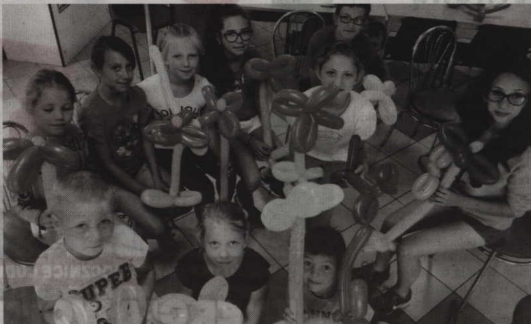
Skręcanie balonów wymaga umiejętności

Powyższe nieruchomości stanowią własność Gminy Miejskiej Kwidzyna. Wykazy wywieszone są na tablicy ogłoszeń w Zespole ds. Geodezji i Gospodarki Nieruchomościami Urzędu Miejskiego w Kwidzynie, z siedzibą przy ul. Warszawskiej 19 oraz umieszczony na stronie internetowej urzędu www.bip.kwidzyn.pl . Bliższe informacje można uzyskać pod nr tel. (55) 64 64 739.