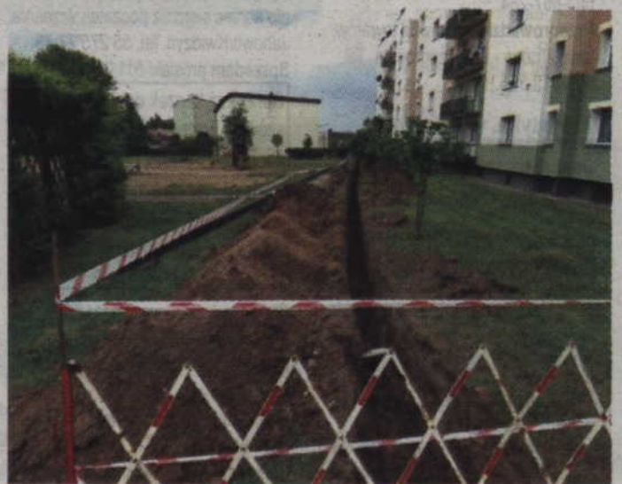
Kościerzyna sięgała wcześniej po pieniądze z programu KAWKA. Przyłączenie do miejskiej sieci ciepłowniczej oznaczało likwidację lokalnych źródeł ciepła, a więc i zmniejszenie emisji spalin.

Jednym z miast, które korzystały z KAWKI, była Kościerzyna. To tam Wojewódzki Inspektorat Ochrony Środowiska co roku określa jakość powietrza jako złą i stwierdza m.in. obecność pyłu zawieszonego PM10. To pył o bardzo małych rozmiarach średnicy ziaren - do 10 mikrometrów. Ziarna są wystarczająco małe, aby mogły przeniknąć głęboko do płuc. Mogą stanowić poważny czynnik chorobotwórczy, osiada-