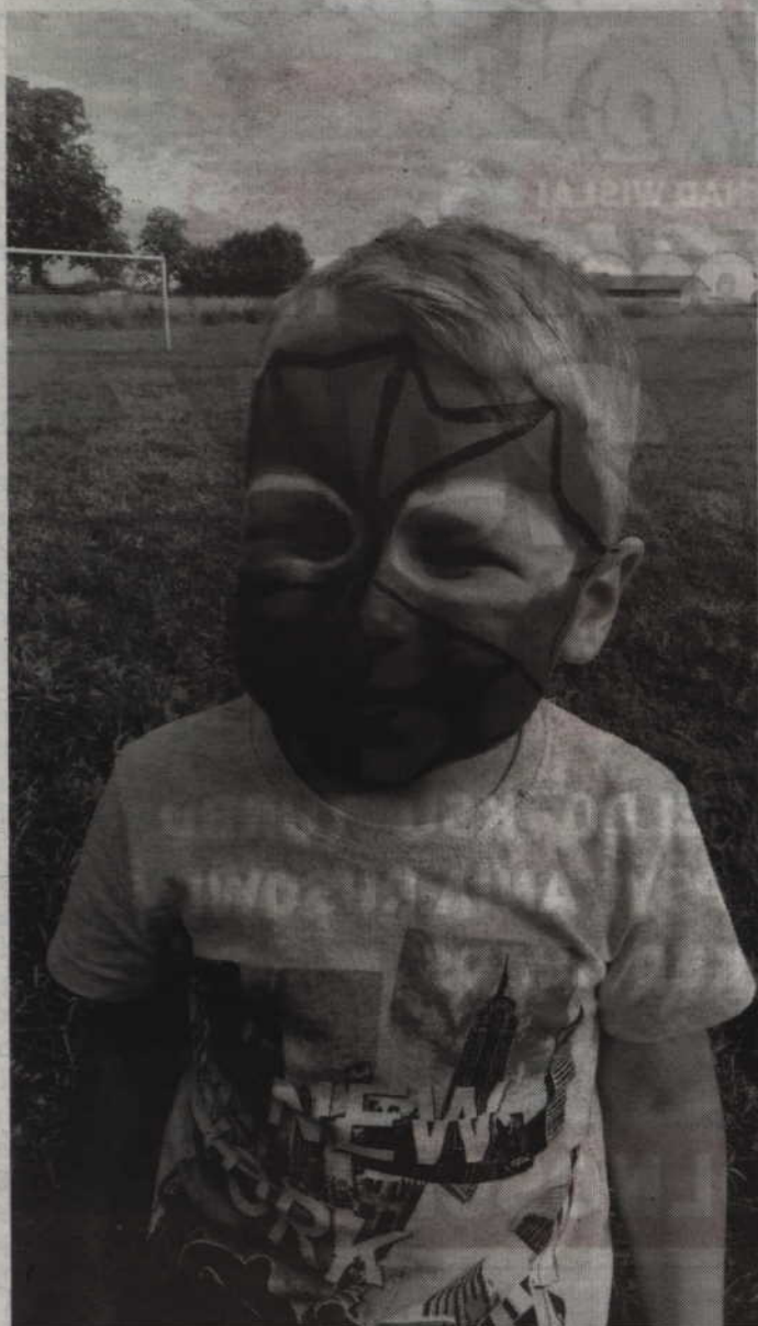
Podczas wakacyjnych zajęć można bez obaw malować sobie twarze OGŁOSZENIA

matorka kultury. Zajęcia odbywały się na terenie wszystkich sołectw gminy, w świetlicach wiejskich oraz na terenie boisk. Uczestniczyć w zajęciach mogli wszyscy chętni i zainteresowani taką formą spędzania czasu wolnego. Pierwsza część spotkań, która odbywała się w lipcu trwała