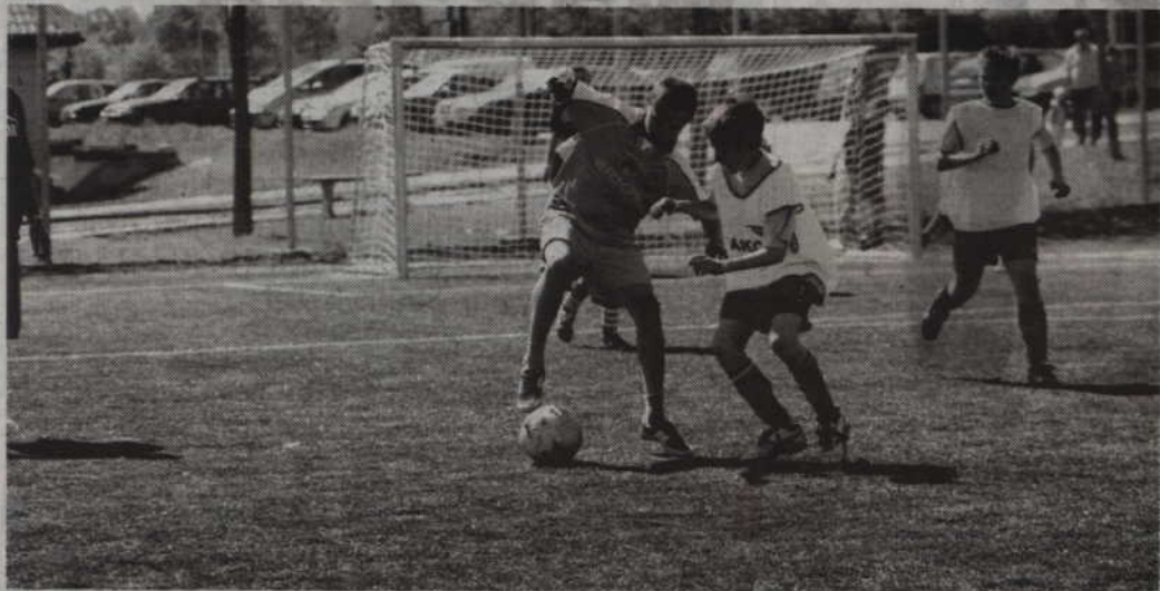
KCSiR zachęca do korzystania z czterech boisk piłkarskich ze sztuczną trawą.

REKREACJA. Kwidzyńskie Centrum Sportu i Rekreacji zaprasza do wakacyjnego korzystania z bazy sportowo-rekreacyjnej. Bezpłatnie lub też za niewielką odpłatnością korzystać można z kortów tenisowych, pola do minigolfa oraz boisk piłkarskich i boisk do koszykówki/siatkówki ze sztuczną nawierzchnią. Chętni mogą również skorzystać z darmowej wypożyczalni sprzętu sportowego.