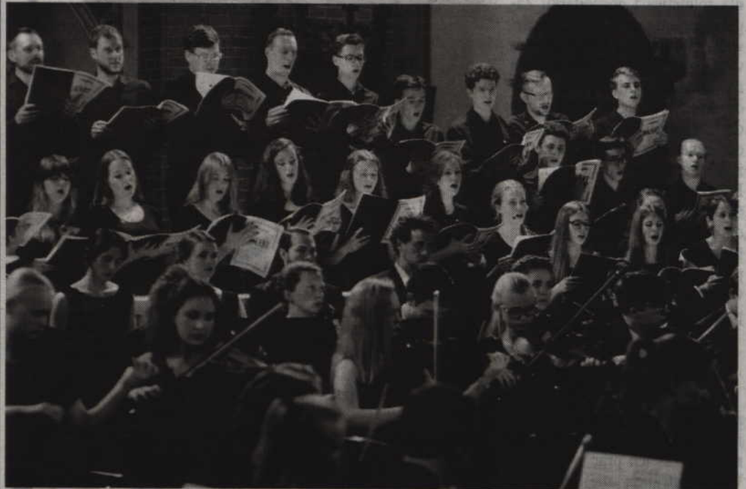
Koncertem w kwidzyńskiej katedrze uczczono dekadę współpracy dwóch samorządów

KWIDZYN. Dziesięć lat współpracy świętowały powiaty Osterholz i powiat kwidzyński. Z tej okazji odbyło się kilka ciekawych imprez w tym kulturalnych. Były także wizyty polskich samorządowców w Osterholz i niemieckich w Kwidzynie.