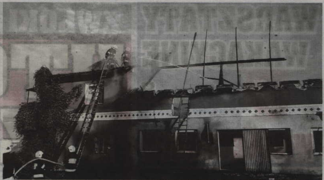
Budynek gospodarczy poważnie ucierpiał w trakcie pożaru.

Na ok. 150 tys. zł oszacowano wstępnie straty jakie spowodował pożar obory w Gardei. Zawiadomienie o pojawieniu się ognia wpłynęło 7 sierpnia o godz. 4.38 do stanowiska kierowania Komendanta Powiatowego PSP w Kwidzynie. Po ugaszeniu ognia strażacy rozgarnęli i dogasili słomę oraz spalone elementy konstrukcyjne dachu. Usunęli też niestabilne elementy konstrukcji budynku. Pogorzelisko zostało sprawdzone kamerą termowizyjną. W trakcie akcji strażacy musieli dowozić wodę. W akcji gaszenia ognia uczestniczyli strażacy z Jednostki Ratowniczo-Gaśniczej z Kwidzyna oraz ochotniczych straży pożarnych z Gardei, Rozajna i Czarnego Dolnego. Akcję gasniczą strażacy zakończyli około godziny 8.35. (jk)