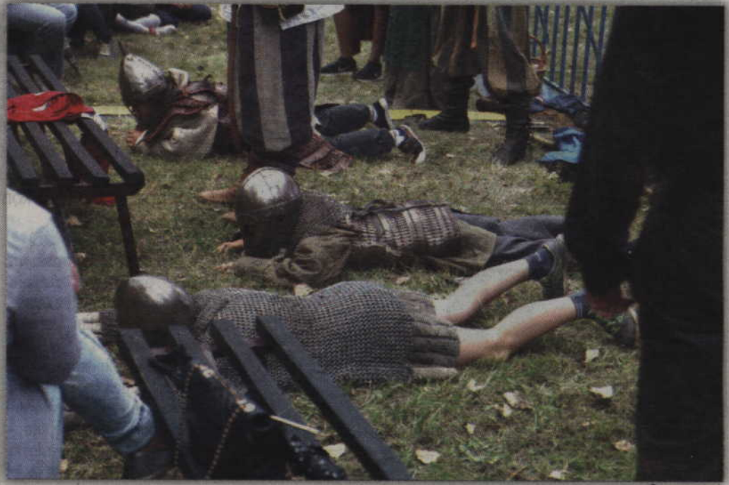
Zbroje wojów z czasów pierwszych Piastów do lekkich nie należały.