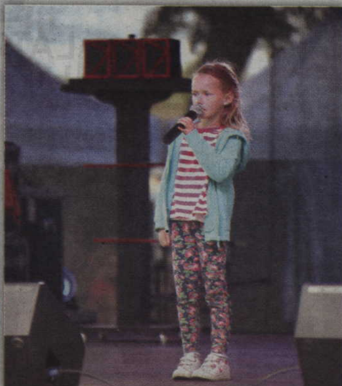
Najmłodsza publiczność mogła spróbować swych sił na scenie.