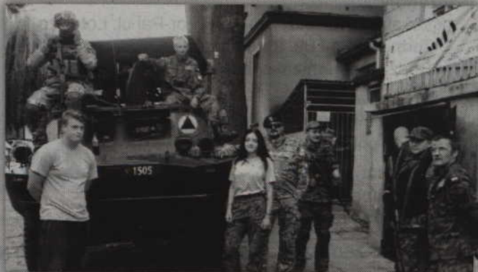
Idąc ulicą Warszawską nie można było nie zauważyć BRDM-a i umundurowanych członków stowarzyszenia GWARD.