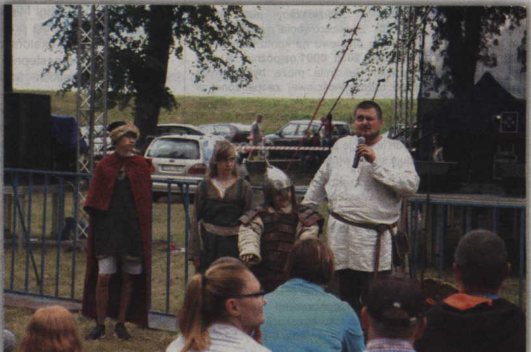
Bractwo Kerin przeniosło publiczność w czasy Mieszka I i księżniczki Dobrawy.