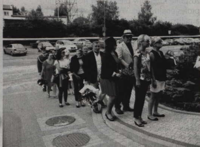
Delegacje kwidzyńskich komisji zakładowych NSZZ Solidarność oddały hołd bohaterom buntu internowanych

Przypominał także wydarzenia z Ilawy, gdzie znęcano się nad