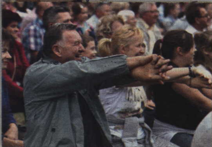
Podczas występu Łukasza Podymskiego publiczność doskonale się bawiła.