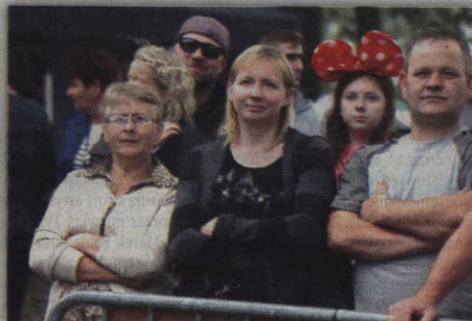
Publiczność z zainteresowaniem oglądała występy na scenie.

- Bardzo często słyszę pytania jak się nazywa ta artystyczna dziedzina którą się na co dzień zajmuję. Nazywają mnie iluzjonistą, magikiem a nawet czarodziejem. Oczywiście to czym się zajmuje to iluzja czyli dziedzina sztuki mająca sporo z magii. Ale jak każdy artysta ja również mam swoją ulubioną nazwę tego czym się zajmuję i wolę siebie nazywając czarodziejem. Na scenie jest