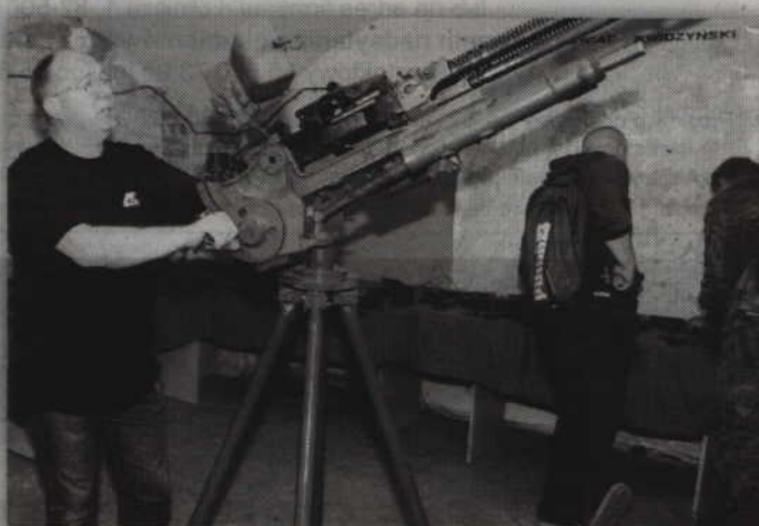
Stowarzyszenie w swoich zbiorach posiada używane współcześnie w armii polskiej karabiny maszynowe

Można głosować na zwycięskie projekty grantowe