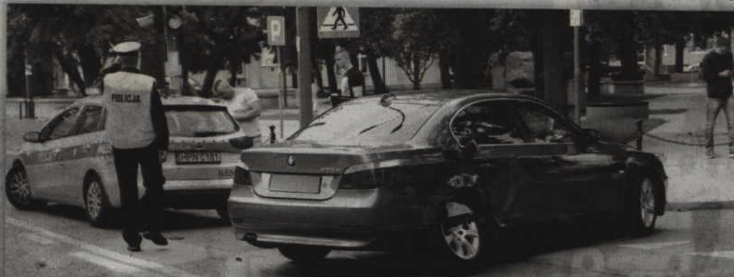
Uszkodzone bmw nie nadawało się do dalszej jazdy.

12 sierpnia o godz. 16.20 na ul. Chopina kierująca fordem nie ustąpiła pierwszeństwa przejazdu kierującemu bmw w wyniku czego doszło do bocznego zderzenia pojazdów. Funkcjonariusze zatrzymali dwa dowody rejestracyjne. Sprawczyni została ukarana mandatem karnym. W tym samym dniu ale w Prabutach o godz. 18.10 na ul. Jagielly 56-letni obywatel Niemiec nie zachował należytej ostrożności podczas cofania i najechał na samochód marki opel astra. 13 sierpnia o godz. 17.50 w Ryjewie na ul. Grunwaldzkiej 17-letni mieszkaniec tej miejscowości nie zachował bezpiecznej odległości pomiędzy pojazdami w wyniku