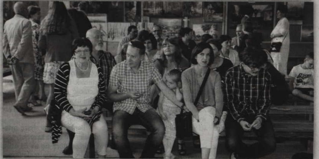
Publiczność na podsumowaniu pleneru dopisała.