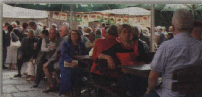
Organizatorzy spotkania byli bardzo zadowoleni z bardzo dużej frekwencji.