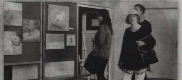
Zakończeniu pleneru towarzyszyła wystawa obrazów.