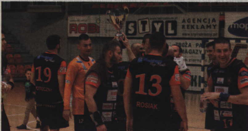
Kwidzynianie cieszyli się z wywalczenia pucharu prezesa.

KPR: Krekora, Stojković - Brinovec 1, Kasprzak 8, Łucak 1, Gumiński 3, Gawęcki 4, Titow 4, Kowalik, Prądnicki 4, Suliński 1, Mochocki 3.