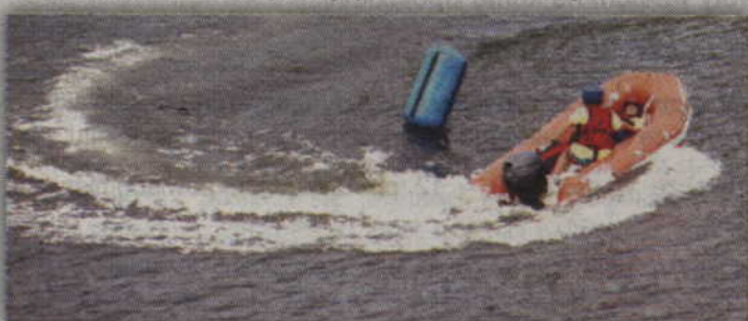
Podczas festynu w Korzeniewie publiczność mogła obserwować zawody motoro-wodne ratowników.