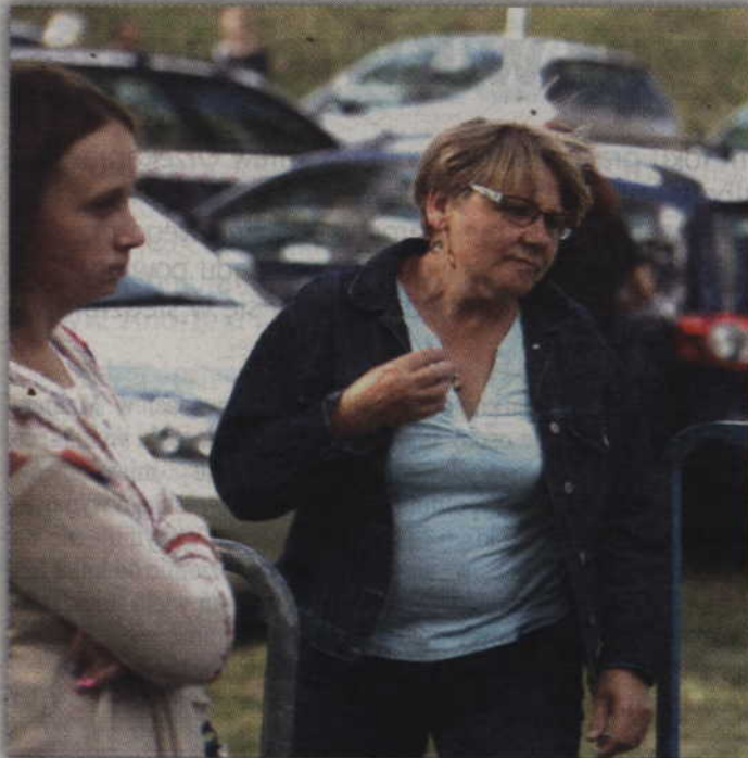
Podczas występu Łukasza Podymskiego publiczność doskonale się bawiła.