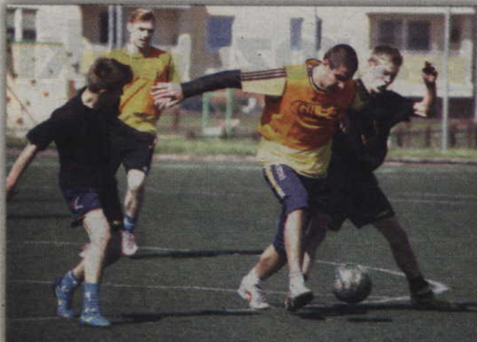
Osiedlowy turniej piłkarski „Renawa” odbywa się na Orliku przy ul. Kazimierza Wielkiego.

W dniach 15-16 września rozegrane zostaną kwalifikacje do fazy finałowej, która odbędzie się 17 września. Zmagania trzyczynnie już przeprowadzone zostaną w dwóch kategoriach