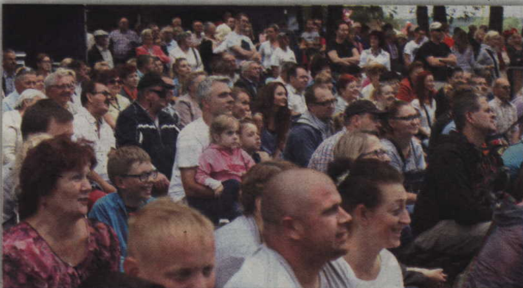
Publiczność z zainteresowaniem oglądała występy na scenie.