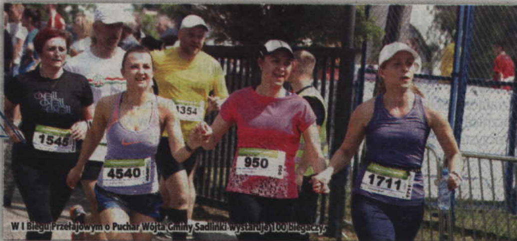
W I Biegu Przełajowym o Puchar Wójta Gminy Sadlinki wystartuje 100 Biegaczy

SADLINKI. Już w najbliższą sobotę, 20 sierpnia zostanie rozegrany pierwszy w historii gminy profesjonalny bieg. Wystartuje w nim stu biegaczy a najlepsi będą rywalizować o puchar wójta gminy. Dorośli biegacze będą rywalizować na dystansie 5 km.