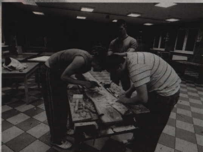
Plener rzeźbiarski w Rakowcu trwać będzie do 19 sierpnia.

GMINA KWIDZYN. Gminny Ośrodek Kultury w Kwidzynie oraz Pracownia Rzeźby w Rakowcu zapraszają na III Ogólnopolski Plener Rzeźbiarski „Orkiestra gra”. Jak informują organizatorzy impreza odbędzie się w miejscowej pracowni rzeźby w dniach 16-20 sierpnia. Wstęp wolny.