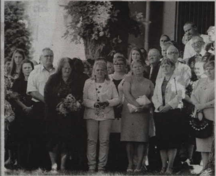
Mieszkańcy gminy Gardeja oddali hołd polskim żołnierzom