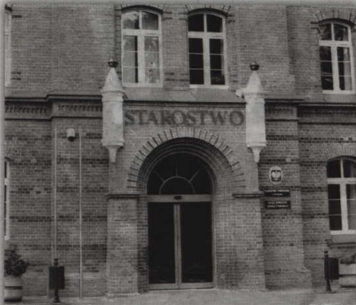
Kolejne dyżury Zespołu do Spraw Orzekania o Niepełnosprawności odbędą się 15 września, 20 października, 17 listopada i 15 grudnia.