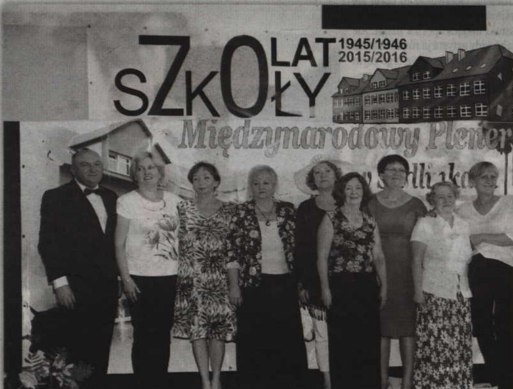
Stowarzyszenie Kontrasty od 12 organizuje plener malarski w Sadlinkach.