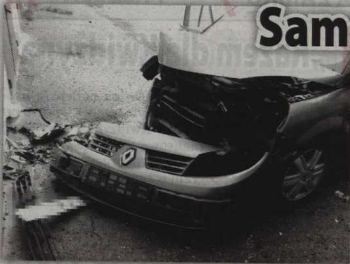
Przed samochodem nie wytrzymał kontaktu z murem budynku.