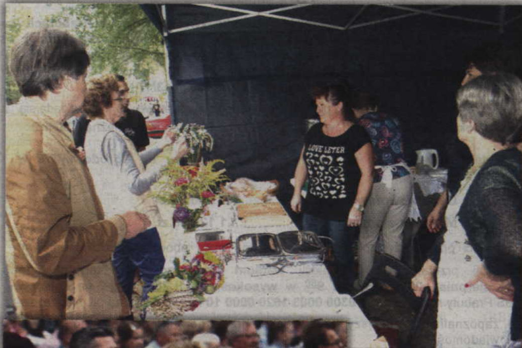
Panie z KGW w Tychnowach przygotowały stoisko z domowymi wypiekami.