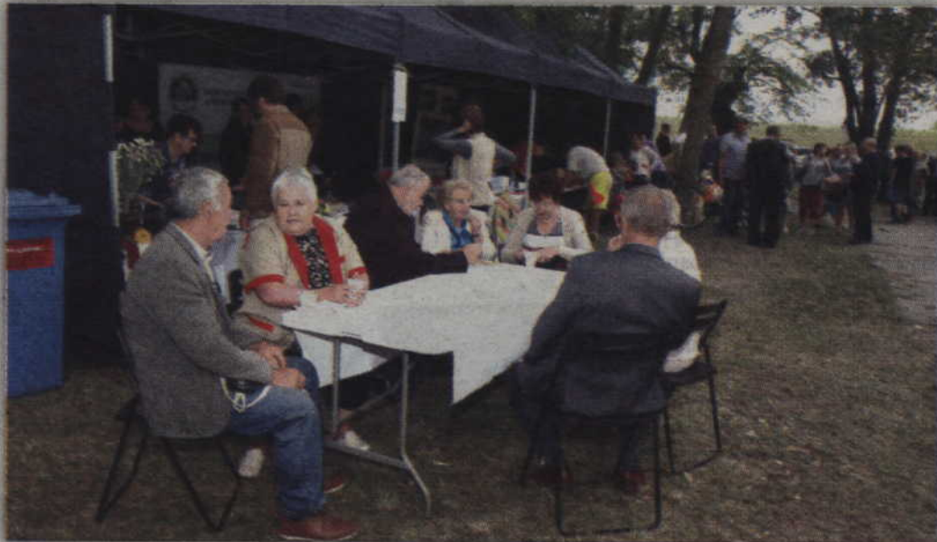
Przy stoisku KGW w Tychnowach można było zjeść domowe wypieki.

KORZENIEWO(GM. KWIDZYN). Mszą świętą rozpoczęło się świętowanie „Cudu nad Wisłą”. Tradycyjnie, miejscem gdzie od godzin południowych bawiono się była przystań promowa. Pogoda tym razem nie kaprysiła więc publiczność dopisała. Organizatorzy Gminny Ośrodek Kultury w Kwidzynie i kwidzyński CKJ przygotowali szereg atrakcji.