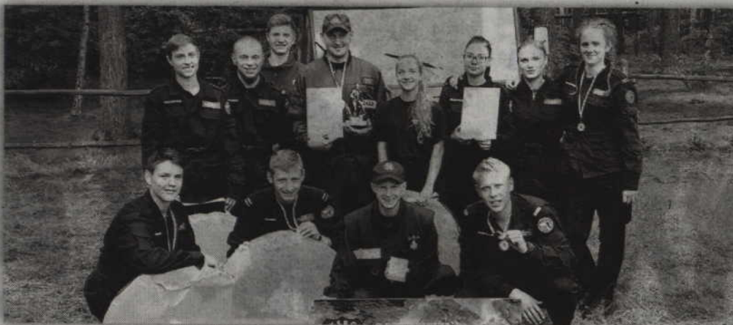
Uczniowie II LO reprezentowali swoją szkołę oraz OSP Pastwa.

KWIDZYN. Od sukcesu i udanej zabawy rozpoczęli rok szkolny uczniowie klas o profilu Bezpieczeństwo Publiczne w Zespole Szkół Ogólnokształcących nr 2 w Kwidzynie. Mundurowi wygrali odbywający się na początku września IX Wojewódzki Marsz Na Orientację Młodzieżowych Drużyn Pożarniczych w Czarnej Wodzie.