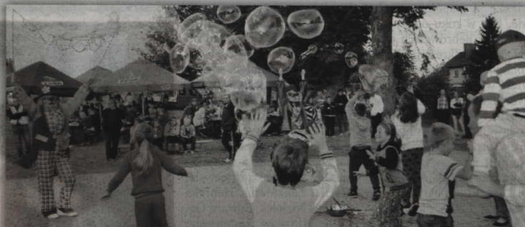
Panie z koła gospodyń wiejskich zachęcały najmłodszych do tworzenia wielkich, mydlanych bańki.

Zmiana kategorii na odcinku Mareza-Korzeniewo