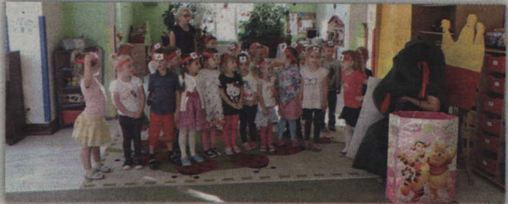
Jubilatka witana była przez dzieci piosenką oraz prezentami.