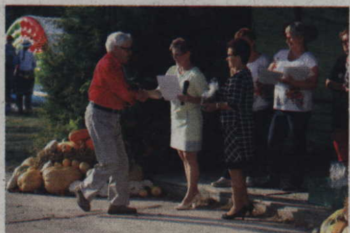
Publiczność miała także okazję wysłuchania szkolnego zespołu wokalnego.