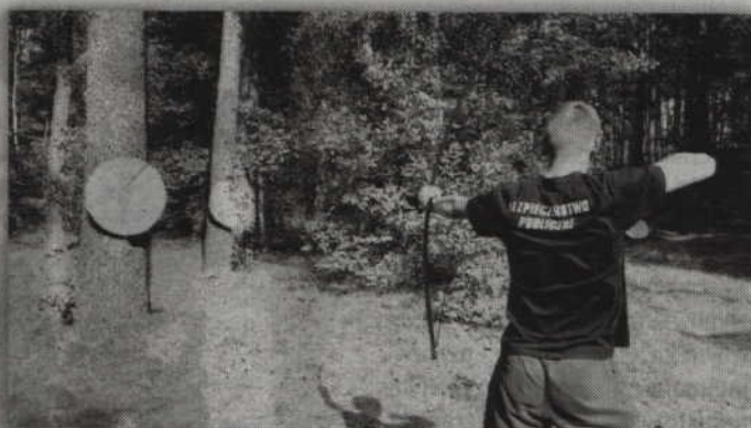
Jedna z konkurencji zawodów w Czarnej Wodzie.

- Nasi uczniowie oraz absolwenci Bezpieczeństwa Publicznego pomagali także gospodarzom w organizacji tzw. Minimarszu - dodaje K. Skoczek. - Za rok natomiast X edycja Marszu w Czarnej Wodzie i nas również nie może tam zabraknąć.