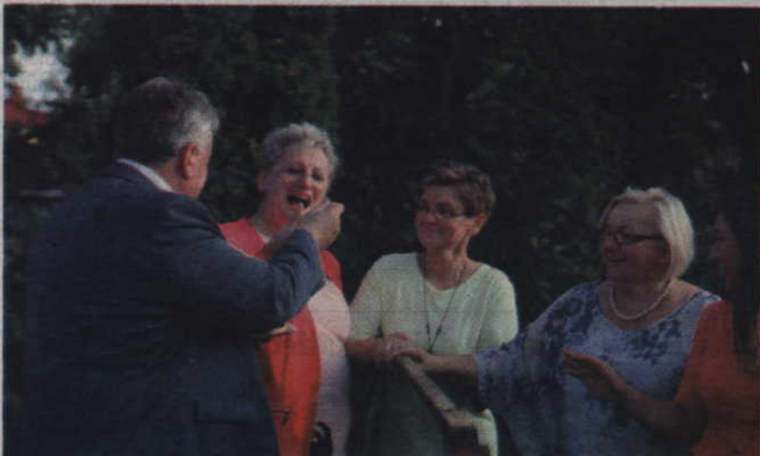
To jest „Nebrowianka”, miejscowy specjal!