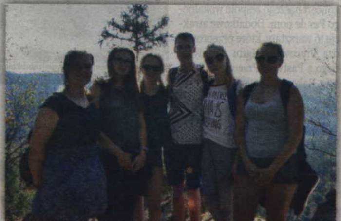
Młodzież z I LO uczestniczyła również w kilku wycieczkach zwiedzając Hamburg, Marienborn oraz góry Harz.

Warto dodać, że w tegorocznej edycji projektu wzięło udział dwunastu uczniów z I Liceum Ogólnokształcącego. Celem wymiany jest natomiast poznanie kultury i