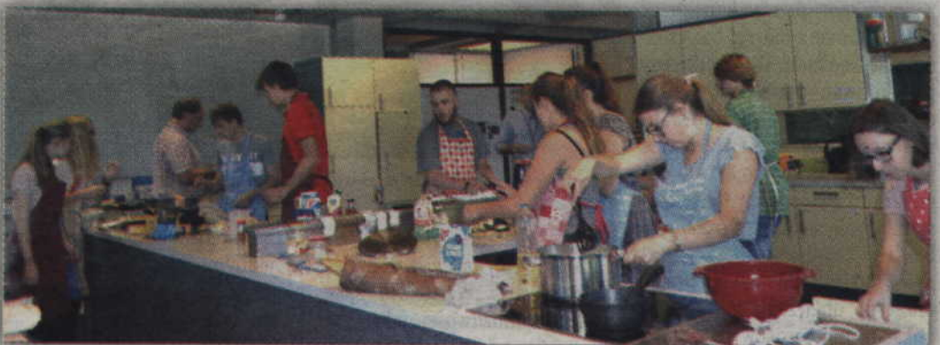
Polsko-niemieckie grupy pracowały nad przygotowaniem trzydaniowego posiłku.