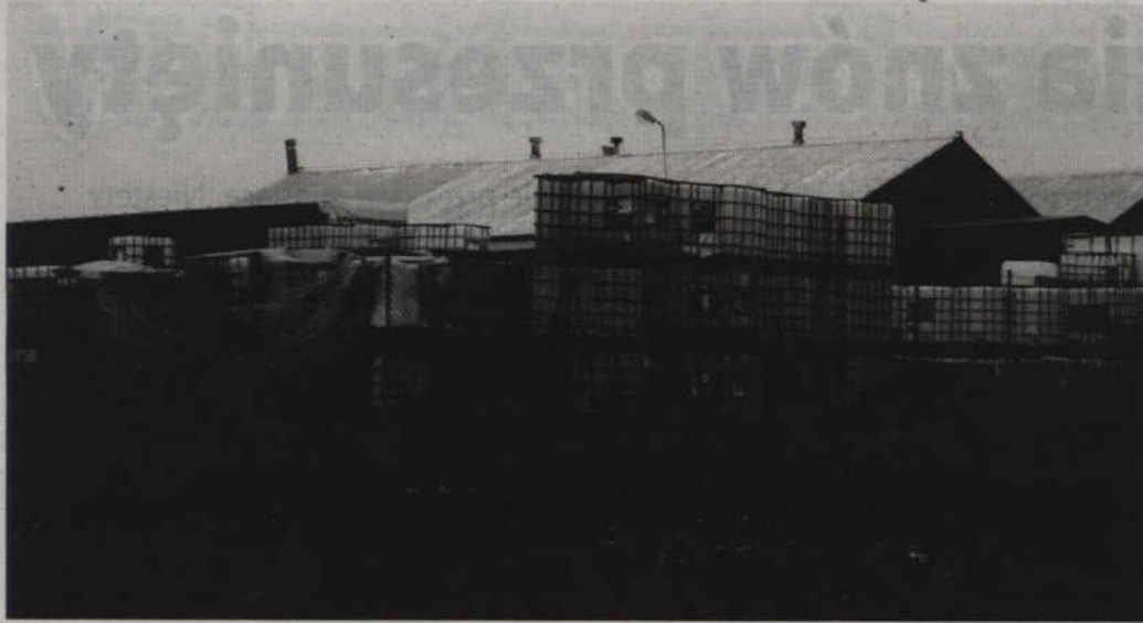
W ubiegłym tygodniu doszło do wycieku kwasu azotowego składowanego na terenie zakładu w Karpinach.

-W tę noc, kiedy doszło do wycieku kwasu, po wyjeździe strażaków, do rana trwała tam praca. Nie zapalali światła na placu, a samochody jeździły przy wyłączonych reflektorach. Domyśliłyśmy się, że coś było wywożone. Słyszeliśmy również cały czas szum wody, więc prawdopodobnie pracownicy prowadzili tam intensywne płukania - mówił mieszkaniec Karpin.