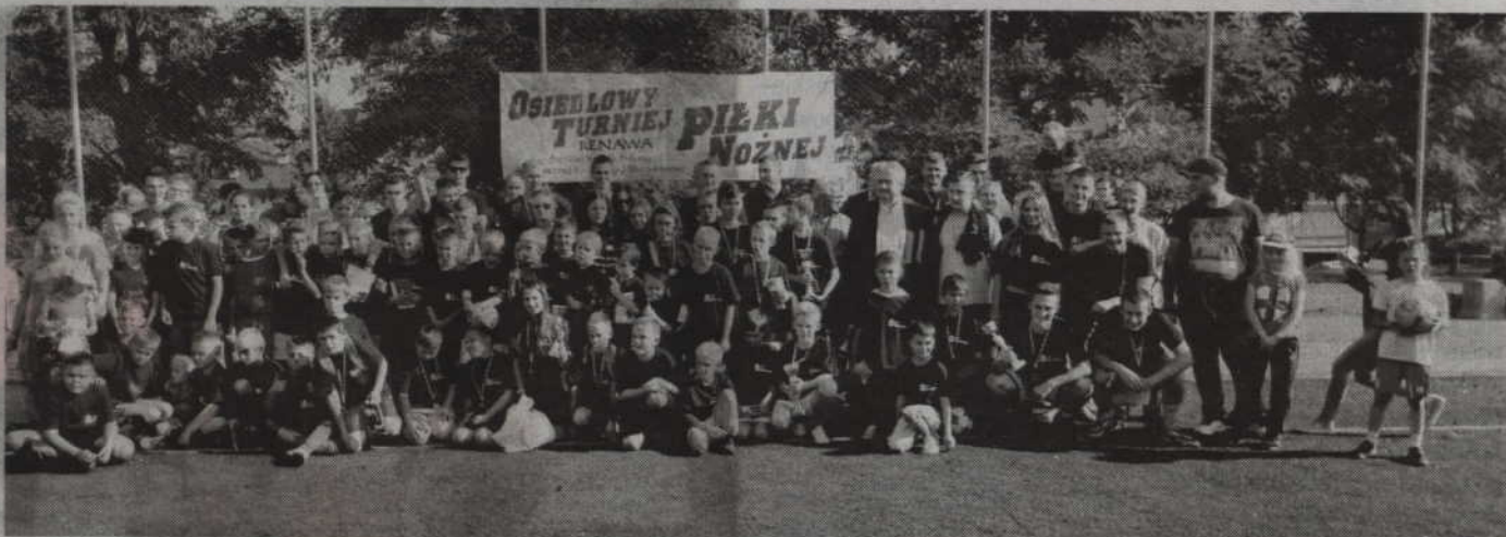
Wspólne zdjęcie uczestników tegorocznego turnieju.

Podczas sobotnich rozgrywek na sąsiednim boisku przeprowadzono konkurs „strzał do bramki”, a najskuteczniejszym wręczono nagrody ufundowane przez „Spizarnię smaków” Wojciecha Szpittera. Następnie członkowie Ochotniczej Straży Pożarnej z Pastwy we współpracy z grupą uczniów z klasy maturalnej o profilu bezpieczeństwa publicznego dla wszystkich chętnych przeprowadzili konkurencje sprawnościowe. Ponadto można było spróbować swoich sił w udzielaniu pierwszej pomocy na manekinach do nauki resuscytacji.