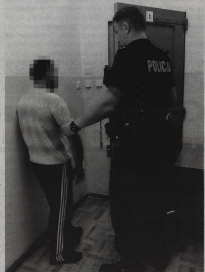
Wobec zatrzymanego obcokrajowca Sąd Rejonowy w Kwidzynie zastosował trzymiesięczny areszt.