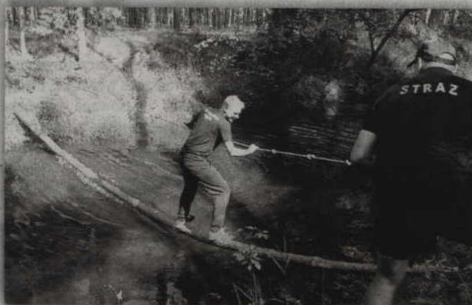
(n) Podczas pokonywania trasy trzeba było wykazać się m.in. kondycją fizyczną.