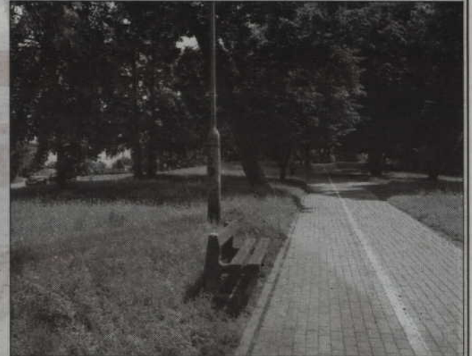
Ogłoszony został przetarg na przebudowę parku przy ul. Mostowej. Inwestycja rozpocznie się jeszcze w tym roku.

Ogłoszony został przetarg na przebudowę parku przy ul. Mostowej. Inwestycja rozpocznie się jeszcze w tym roku. Koszty przebudowy szacowane są na ponad 1,2 mln zł.