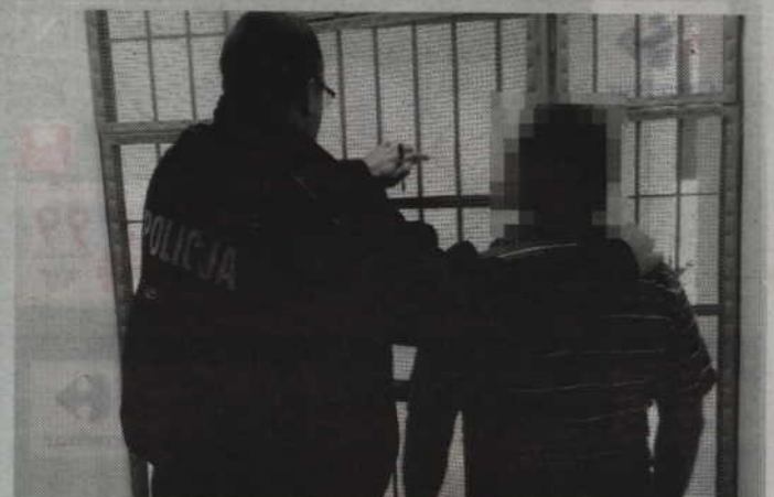
Mieszkaniec Prabut trafił do policyjnego aresztu mając w swym organizmie 1,2 promila alkoholu.

Kiedy po chwili był już w radiowozie i trochę się opanował, postanowił „przekonać” poli-