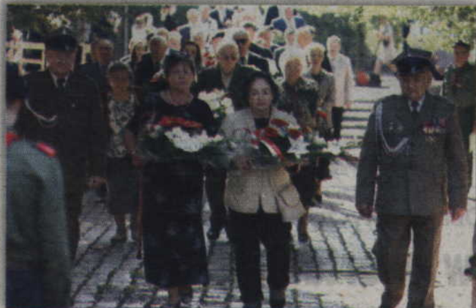
Delegacje złożyły wieńce i kwiaty na grobie nieznanego żołnierza.