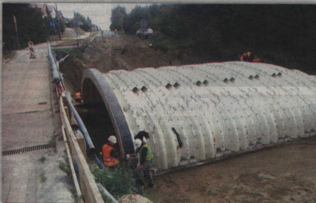
Drogowcy intensywnie pracują przy budowie mostu na rzece Liwie, ale opóźnienie w zakończeniu inwestycji sięga już prawie miesiąca.

Dziś wiemy jednak, że i te zapewnienia stały się nieaktualne. Z nieoficjalnych informacji wiemy, że firma budująca most ma