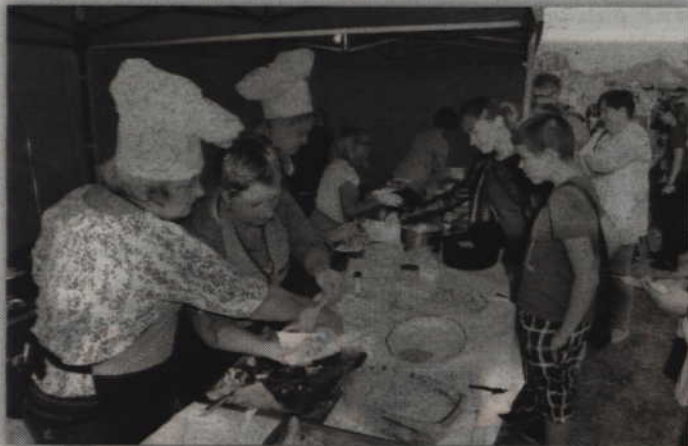
Organizatorzy przygotowali specjalne stoiska z potrawami.