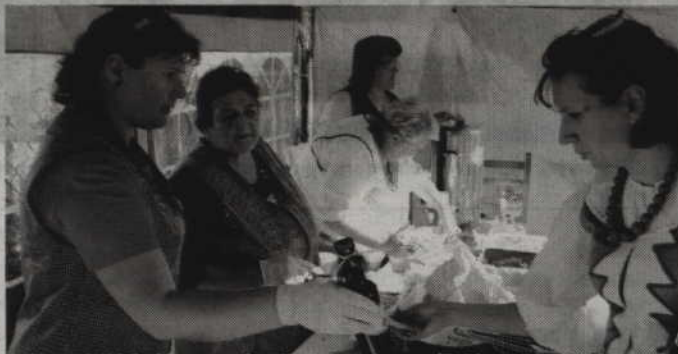
Podczas niedzielnej imprezy nie zabraknie potraw ze śliwki, a także słodkich wypieków oraz bigosu myśliwskiego.

W programie zaplanowano także występ kabaretu EWG-