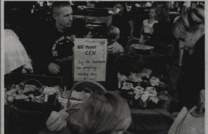
Na poszczególnych stoiskach swoje wyroby prezentować będą m.in. kwidzyńskie placówki oświatowe.

W programie imprezy znalazły się prezentacje artystyczne dzieci i młodzieży, a także konkurs plastyczny, dziecięcy „Pchli targ”, Targi Staroci, Święto Chleba, Jesienne Przymaki, ciasta oraz przetwory. Swoje stoiska zaprezentują także kwidzyńskie placówki oświatowe: SP 2, SP 4, SP 5 i SP 6, Katolicka Sportowo-Językowa Szkoła Podstawowa, Gimnazjum nr 2, Gimnazjum nr 3, Kwidzyńskie Szkoły Społeczne, Zespół Szkół Ponadgimnazjalnych nr 2 oraz I Liceum Ogólnokształcące. Gwiazdą imprezy będzie natomiast grupa „Czerwony Tulipan”, która zagra dla odwiedzających deptak o godz. 12.00. (fox)