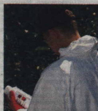
Sprawdzając piktogramy na etykiecie dowiesz się, które opakowania należy zwrócić

Należy pamiętać, że rolnik ma ustawowy obowiązek zwrotu opako-