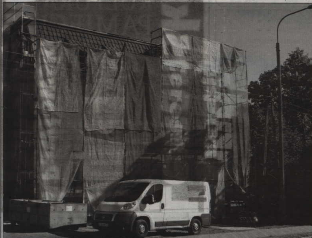
Termomodernizacja kamienicy przy ul. Warszawskiej 75.

335 tys. zł przeznaczono w tym roku na termomodernizację budynków komunalnych. Prace obejmują budynki, które w 100 proc. są własnością miasta.