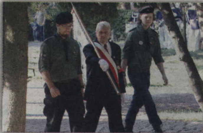
Uroczystości rozpoczęły się od wprowadzenia pocztów sztandarowych.

- 77 lat temu na rubież II Rzeczypospolitej wkroczyła, bez wypowiedzenia wojny, armia sowiecka. Na mocy porozumienia z 23 sierpnia 1939 roku ministrowie spraw zagranicznych hitlerowskich Niemiec i Związku Sowieckiego podpisali układ czyli IV rozbiór Polski. Na ziemi wschodniej, w sile dwóch dywizji, weszła armia radziecka. Szybciutko przygotowano ludność, którą mieli wysiedlić. Najpierw zaczęto od mundurów, pograniczników, policjantów, a