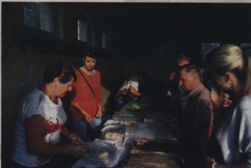
Przygotowane stoisko kulinarne cieszyło się ogromną popularnością.