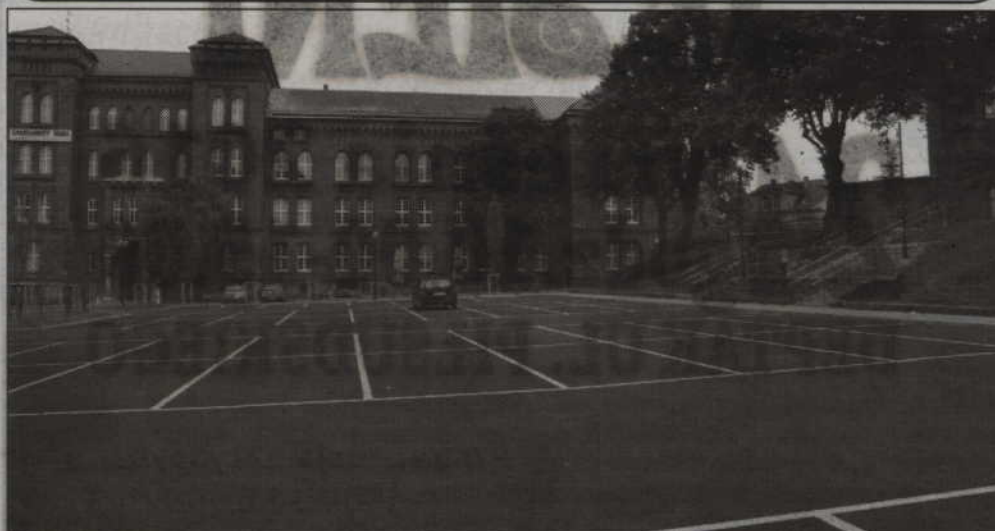
Warto skorzystać z parkingów na terenie byłej jednostki, gdyż tylko kilka minut spaceru potrzeba aby dojść do targowiska przy ul. Kopernika czy też na zakupy do sklepów w centrum miasta. W centrum nie zawsze jest możliwość zaparkowania pojazdu.

Zakończyła się przebudowa terenu dawnej jednostki wojskowej przy ulicach Grudziądzkiej i 11 Listopada. Inwestycja była realizowana w kilku etapach. Jej celem było uporządkowanie ruchu. Powstało też wiele miejsc do parkowania pojazdów.