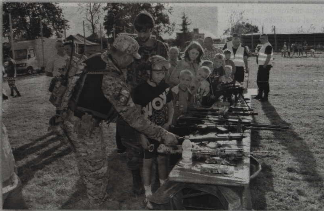
Członkowie kwizyńskiego stowarzyszenia „Gward” przygotowali specjalne stoisko z militariami.

- Z myślą o najmłodszych i nieco starszej młodzieży przygotowaliśmy najróżniejsze konkurencje, gdzie motywem przewodnim były ziemniaki. Były więc konkurencje zręcznościowe związane z rzucaaniem ziemniakami do celu