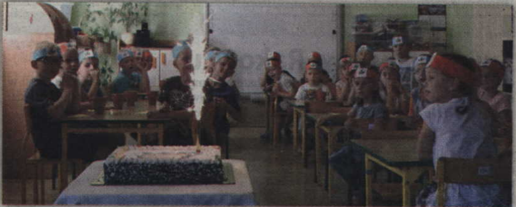
Jak każde urodziny, także te obchodzone przez przedszkole, nie mogły odbyć się bez tortu.