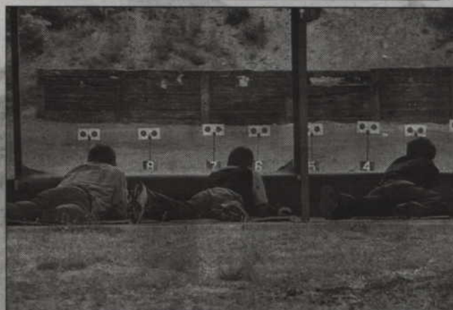
Wybrany został wykonawca modernizacji strzelnicy miejskiej przy ul. Strumykowej.

Wybrany został wykonawca modernizacji strzelnicy miejskiej przy ul. Strumykowej. Pierwszy przetarg nie przyniósł rozstrzygnięcia, więc został powtórzony. Inwestycja, która zostanie wykonana w ramach budżetu obywatelskiego, ma przede wszystkim poprawić standardy bezpieczeństwa obiektu.