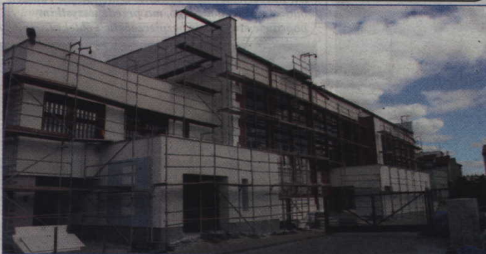
W tym tygodniu powinna zostać dokończona termomodernizacja hali sportowej przy Gimnazjum nr 2.

Dobiega końca termomodernizacja hali sportowej przy Gimnazjum nr 2. Inwestycja rozwiąże problem niedogrzanania obiektu podczas zimy. Zdarzało się, że w sali nie można było z powodu zimna prowadzić zajęć z wychowania fizycznego.