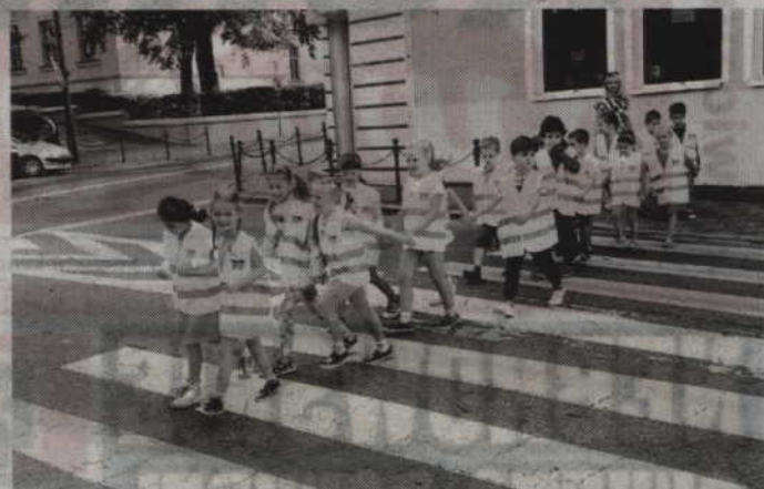
Przez cały okres trwania nauki strażnicy miejscy będą czuwać nad bezpieczeństwem dzieci w ramach akcji „Bezpieczna droga do szkoły”.

także regularnie przypominać zanych z ruchem drogowym. dzieciom o zagrożeniach zwią-