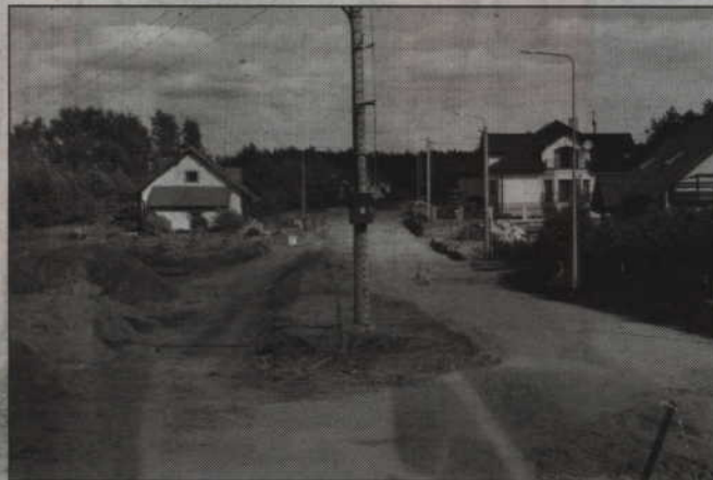
Podłoże jest już ustabilizowane i można na nim budować nawierzchnię ulicy

- Całe podłoże ulicy zostało już wykonane. Wykonawca przystąpi do układania krawężników. Nie wykluczamy zakończenia prac jeszcze w tym roku, mimo trudnego podłoża z jakim musiał się zmagać wykonawca. Trzeba było wzmacniać podłoże na odcinku ulicy od skrzyżowania z ul. Sosnową w kierunku obwodnicy. Warstwa torfu na tym terenie ma ok. 14 metrów. Ze względu na budynki przy ulicy nie można było wybrać inne rozwiązanie. Torf w górnych warstwach został odsączony z wody. Grunt został ustabilizowany za pomocą specjalnych siatek