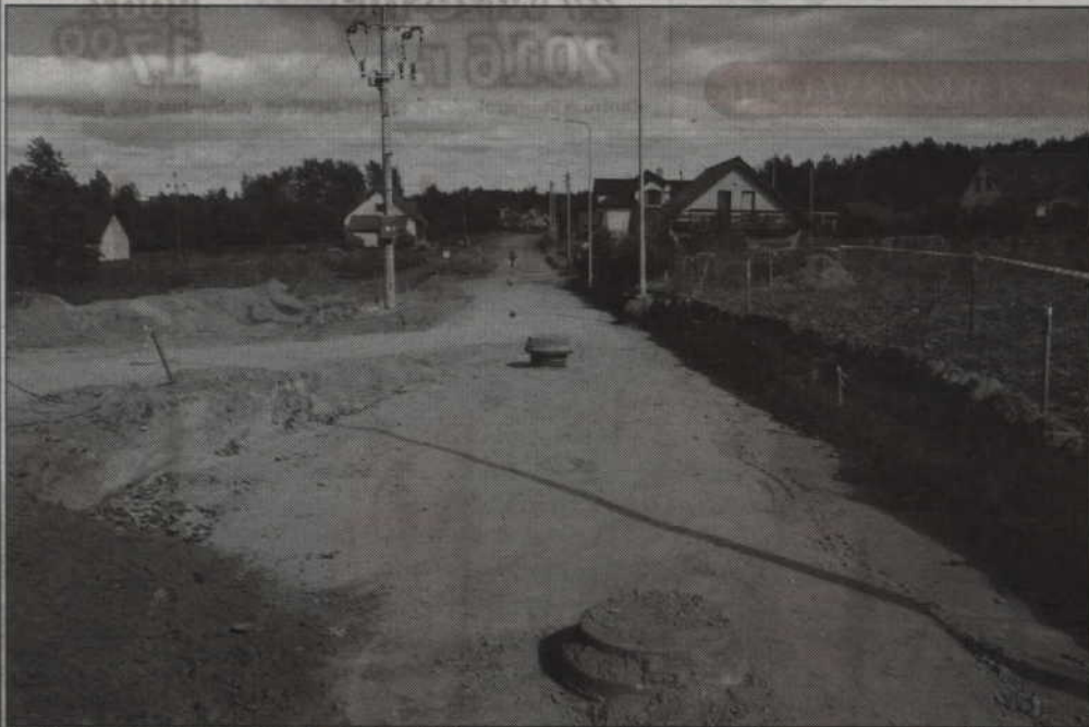
Zgodnie z planem przebiega modernizacja ulicy Chmielnej. Zakończenie prac planowane jest w przyszłym roku.

Zgodnie z planem przebiega modernizacja ulicy Chmielnej. Zakończenie prac planowane jest w przyszłym roku. Piotr Halagiera, wiceburmistrz Kwidzyna, nie wyklucza jednak, że inwestycja może zakończyć się wcześniej, mimo że wykonawca, ze względu na pokłady torfu, musiał ustabilizować grunt pod ulicą.