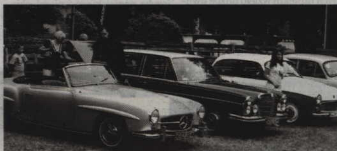
Tegoroczny zlot pojazdów zabytkowych i ciekawych odbędzie się na torze crossowym w Bądkach.

-Zbiórka wszystkich uczestników zlotu zaplanowana jest na godz. 10.00 na parking przy Urzędzie Miejskim w Kwidzynie. Z parking, przejeżdżając przez miasto, udamy się na tor crossowy w Bądkach. Tam będziemy prezentować swoje pojazdy, zachowane w oryginale, odrestaurowane, odnowione i wykonane według własnego projektu. Podczas zlotu wybierzemy także najstarszy, najciekawszy oraz najbardziej oryginalny pojazd. Zapraszamy do udziału w zlocie oraz do obejrzenia zawodów i pokazów motocrossowych - mówi Rafał Borzyszkowski z Kwidzyń-