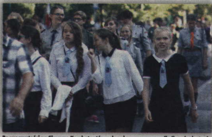
Po uroczystości na Skwerze Kombatantów zebrani przemaszerowali ulicami miasta do kwidzyńskiej katedry.