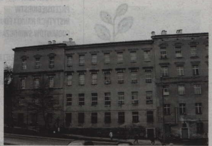
Pieniądze unijne pozwolą między innymi na gruntowną modernizację gmachu Zespołu Szkół Ponadgimnazjalnych nr 2.

trudno sobie wyobrazić sytuację, w której nie byłoby unijnych pieniędzy.