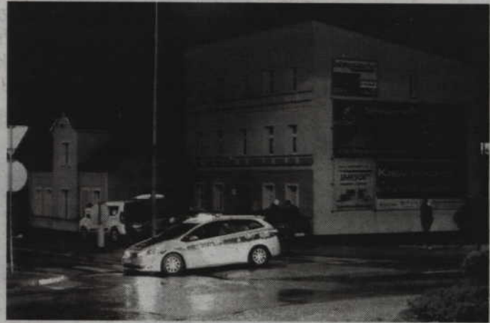
Do postrzelenia 20-letniego mieszkańca Kwidzyna doszło na ulicy Warszawskiej.

Trzej mężczyźni zostali zatrzymani w Niemczech w wyniku Europejskiego Nakazu Aresztowania. Cała trójka trafi do Polski jednak dopiero za kilka tygodni, po uprawomocnieniu się decyzji sądu, który zdecyduje o ich