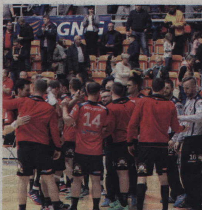
Po 8 kolejkach kwidzynianie mają na swoim koncie aż 7 wygranych.