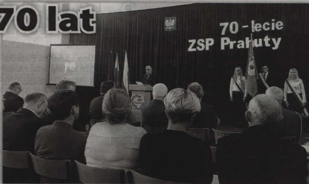
Podczas jubileuszu 70-lecia szkoły był czas zarówno na wspomnienia, jak i wyróżnienia.