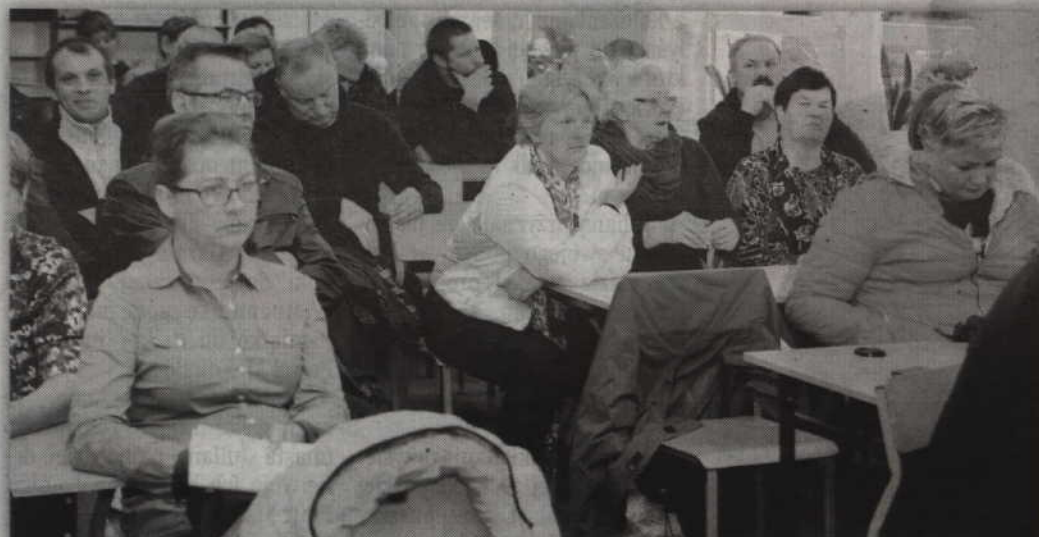
Mieszkańcy zarzucali dyrekcji dróg wojewódzkich brak inwestycji, które poprawiłyby komfort jazdy na drodze.