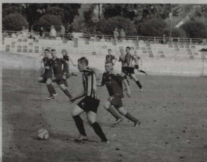
Kwidzińskie Rodło zanotowało już 9 porażek w tym sezonie.