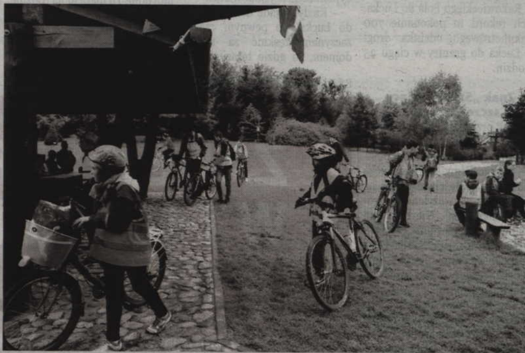
Na metę rajdu, do Ogródu Dendrologicznego w Leśnictwie Miłosna, dotarło 117 rowerzystów.

W konkursie o puchar Kwidzyńskiego Towarzystwa Rowerowego „Ventus”, gdzie liczone są punkty zdobyte przez poszczególne ekipy w całym sezonie, końcowa kolejność wygląda-