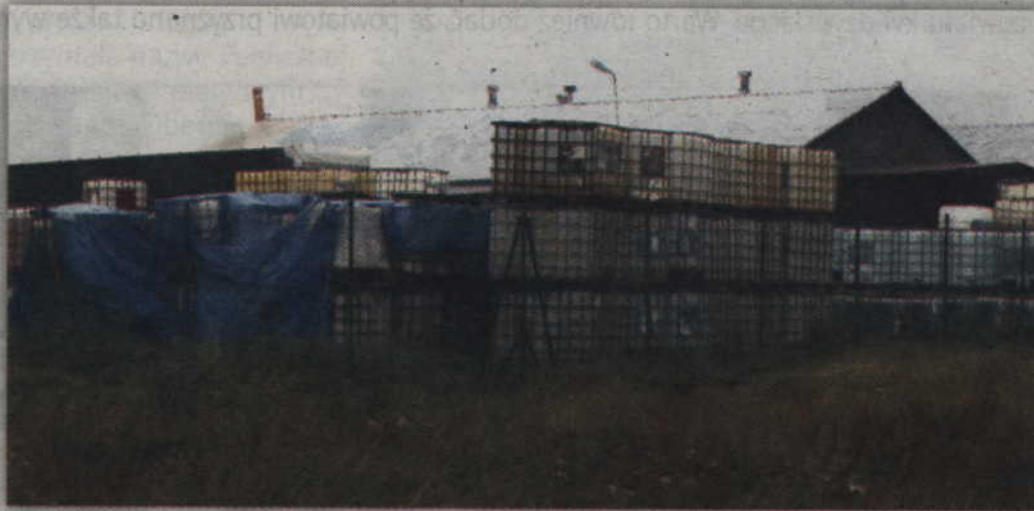
Po wycieku kwasu azotowego, do którego doszło na terenie zakładu w Karpinach, ewakuowano 7 osób.