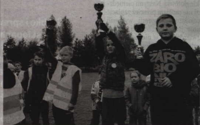
Po podliczeniu zdobytych punktów nagrodzono najlepszych uczestników „Roweriady”.

zimy. Firmy, które wygrają przetargi, muszą mieć przygotowany odpowiedni sprzęt, w tym także dostęp do sprzętu ciężkiego w razie intensywnych opadów śniegu (jk)