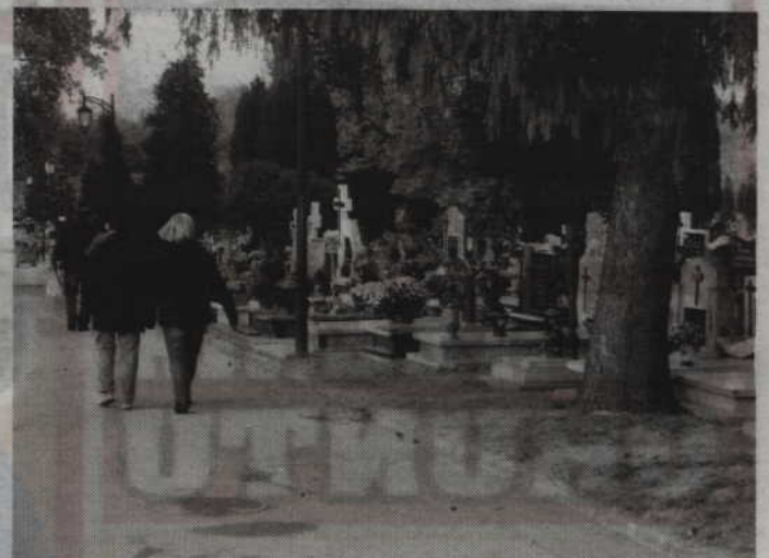
Policjanci apelują, aby podczas odwiedzin grobów bliskich nie zapominać o swoim bezpieczeństwie oraz pozostawianiu mienia bez nadzoru.