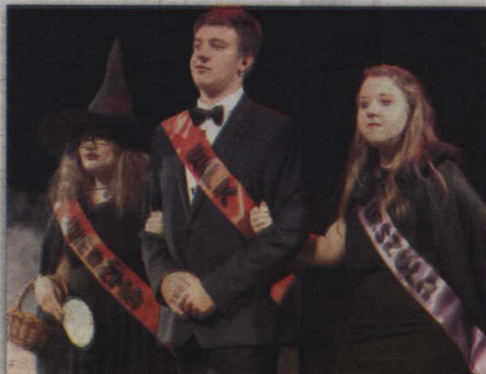
„Wybory miss” to propozycja grupy „Chochoły”.