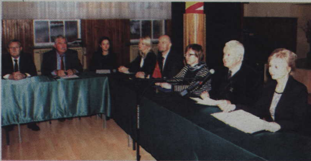
Podczas konferencji prasowej, która odbyła się w auli Zespołu Szkół Ponadgimnazjalnych nr 2 w Kwidzynie, samorząd powiatu pochwalił się uzyskaniem kwoty w wysokości ponad 18 mln ze środków unijnych na edukację, w tym także na modernizację budynków szkolnych.