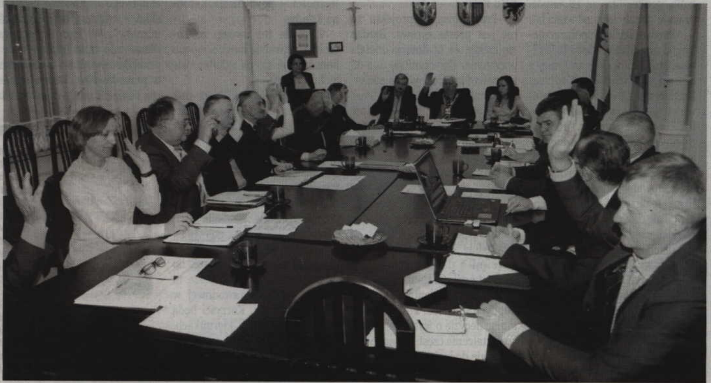
Radni gminy zdecydowali się na obniżenie czterech stawek podatkowych.

Ponadto kwidzyńscy radni podjęli uchwałę w sprawie zwol-