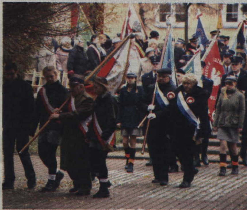
Poczty sztandarowe zebrały się na Skwerze Kombatantów.