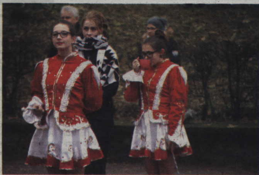
Zimno doskwierało przede wszystkim mażoretkom.