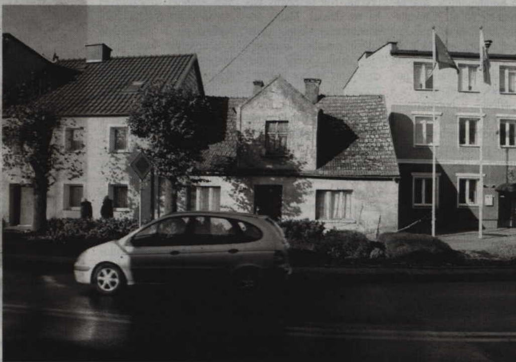
Stan techniczny budynku przy ulicy Kwidzyńskiej 25 nadal jest fatalny, a część chodnika od pół roku jest zamknięta.

-Gmina Gardeja nie podjęła działań zmierzających do uregulowania sytuacji prawnej budynku mieszkalnego, położonego w Gardej przy ul. Kwidzyńskiej 25, bo nie jest właścicielem tej nieruchomości. W dniu 15.04.2016r. wystąpiłem do Powiatowego Inspektoratu Nadzoru Budowlanego w Kwidzynie przy ul. Grudziądzkiej 8 z pismem o podjęcie działań przez organ właściwy do interwencji i prowadzenia postępowania administracyjnego w stosunku do właścicieli nieruchomości, którego stan techniczny stwarza niebezpieczeństwo dla otoczenia, ludzi i osób zamieszkałych w tym budynku. Powiatowy Inspektorat Nadzoru Budowlanego w Kwidzynie pismem z dnia 19.05.2016r. zwrócił się do wójta z prośbą o podjęcie działań polegających na wydzieleniu strefy niebezpiecznej przy wyżej wymienionym budynku o szerokości 1,5m od strony elewacji frontowej, tak by pozostała możliwość przechodzenia skrajem chodnika, a PINB w Kwidzynie będzie prowadził dalsze czynności administracyjne dotyczące stanu technicznego przedmiotowego budynku. Zgodnie z wyżej wymienionym pismem w dniu 20.05.2016 r. podjąłem natychmiastowe działania polegające na wydzieleniu strefy niebezpiecznej przy tym budynku poprzez ustawie-