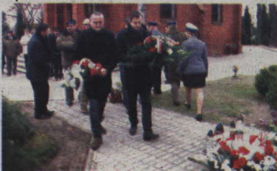
Kwiaty od przedstawicieli prabuckich instytucji.