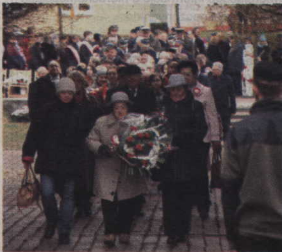
Delegacje złożyły kwiaty na Grobie Nieznanego Żołnierza.