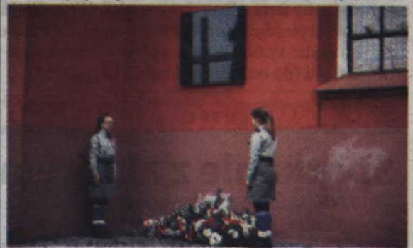
Wartę honorową przy pamiątkowej tablicy zaciągnęli harcerze ze szkoły w Gardei.