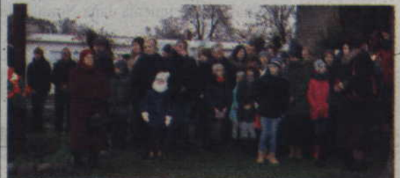
Po mszy świętej, jej uczestnicy przeszli pod tablicę poświęconą obrońcom Rzeczypospolitej.