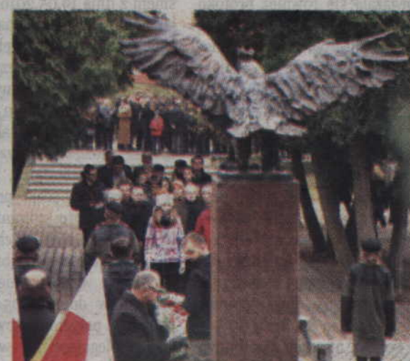
Skwer Kombatantów to stałe miejsce kwidzyńskich uroczystości patriotycznych.