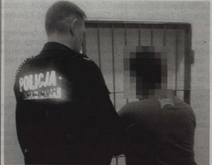
Zatrzymany mieszkaniec Kwidzyna miał w swym organizmie ponad 2,5 promila alkoholu.

RYJEW. Policjanci zatrzymali pijanego 44-letniego kierowcę bmw. Dodatkowo podczas kontroli mieszkaniec Kwidzyna zachowywał się wulgarnie i agresywnie, a także próbował dusić jednego z interweniujących funkcjonariuszy. Za swoje czyny odpowie teraz przed sądem.