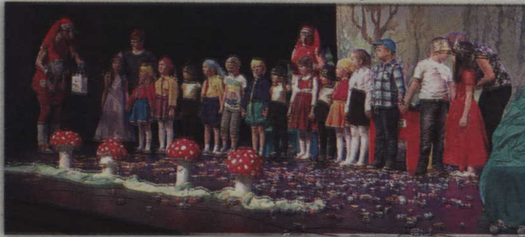
Przyjaciele Misia Uszatka zostali obsypani masą cukierków.