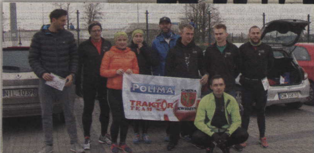
Podczas suskich zawodów silną drużynę wystawił także Traktor Team Gmina Kwidzyn.