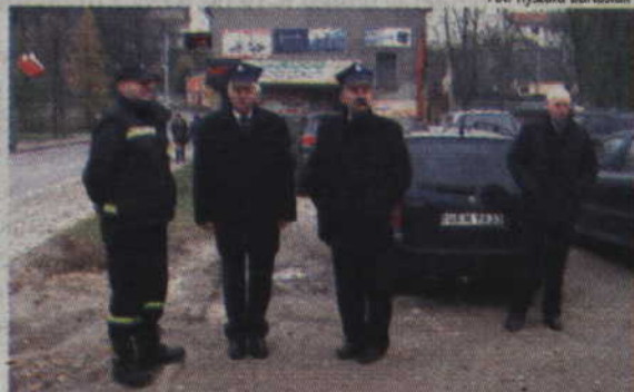
W niepodległościowych uroczystościach uczestniczyli strażacy-ochotnicy.