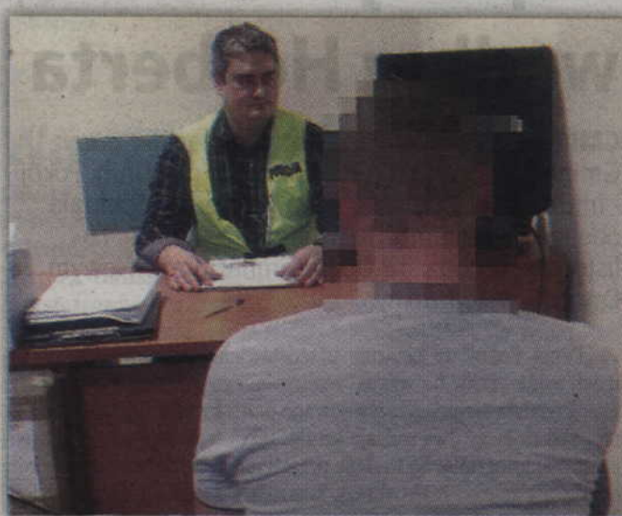
Mężczyzna przyznał, że widząc pozostawioną torebkę postanowił wykorzystać „okazję”.

- Kwidzińscy kryminalni ustalili, że sprawcą kradzieży może być 32-letni mieszkaniec Kwidzyna, który również bawił się na tej imprezie. Funkcjonariusze zatrzymali go i przewieźli