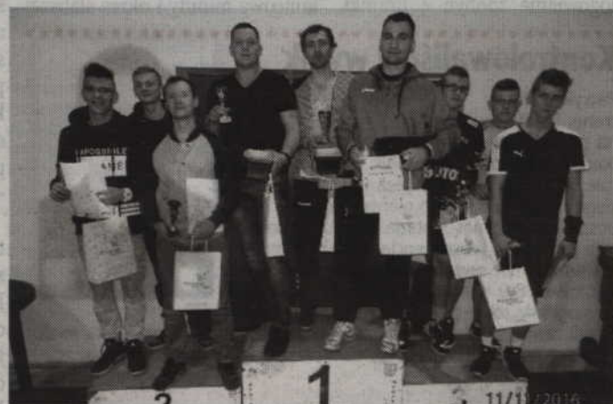
Rywalizację open wśród mężczyzn wygrała Niezła Drużyna, przed Januszami oraz ZSP Prabuty.

W kategoriach open, w których rywalizowali zawodnicy mający więcej niż 15 lat, również chętniej rywalizowali mężczyźni. Zmagania w kategorii open zgromadziły bowiem 10 drużyn, które podzielono na trzy grupy eliminacyjne. Po rozegraniu wszyst-