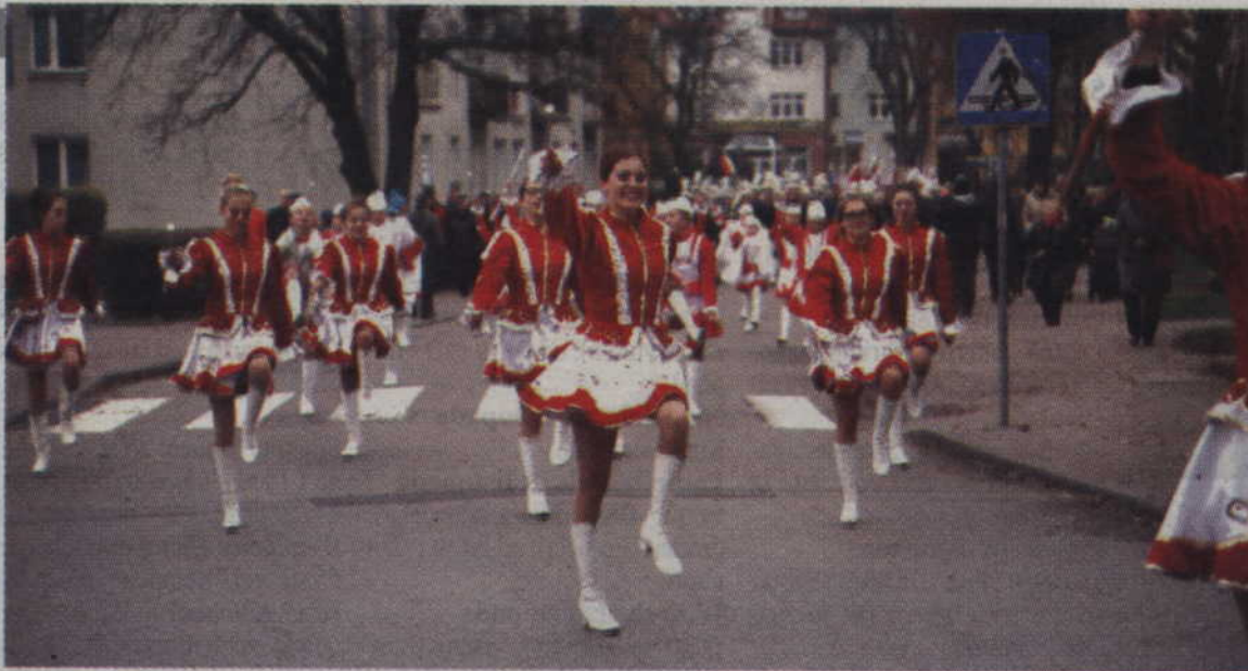
Uroczysty przemarsz ulicami miasta prowadziły mażoretki Orkiestry Dętej „Helikon”.