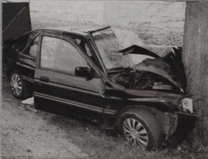
W wypadku śmierć poniosły dwie osoby. Trzecia z obrażeniami ciała trafiła do szpitala.

GMINA PRABUTY. Dwie osoby zmarły, a trzecia trafiła do szpitala w wyniku wypadku do którego doszło w Kołodziejach. Na drodze wojewódzkiej nr 522 kierująca fordem escortem 30-latkka z niewyjaśnionych powodów zjechała na przeciwny pas ruchu i uderzyła w drzewo.