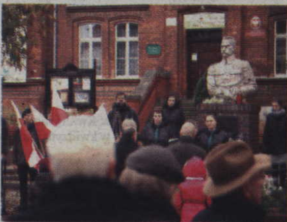
Mieszkańcy oddali także cześć Marszałkowi Józefowi Piłsudskiemu.