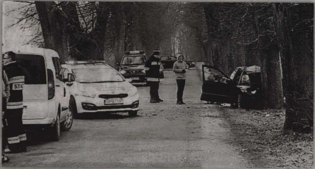
Do tragedii doszło na drodze wojewódzkiej nr 522 w Kołodziejach.