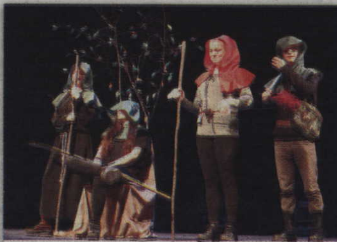
Uczniowie Zespołu Szkół Gimnazjalnych w Kwidzynie przedstawili drugą zmianę w działalności Robin Hooda.