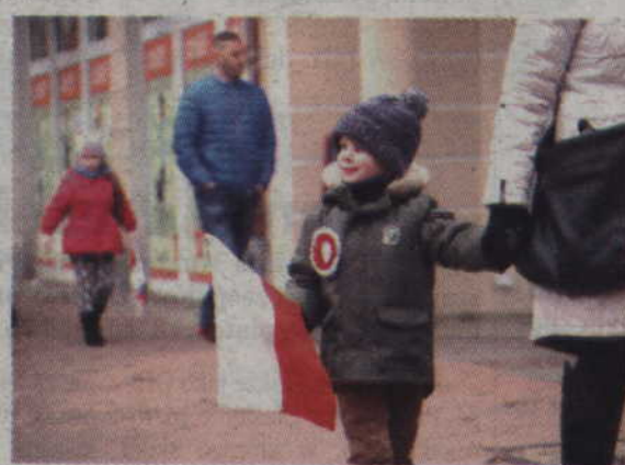
Maluchy przybyły na uroczystość udekorowane w elementy patriotyczne.