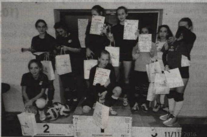
Laureatki rywalizacji w kategorii dziewcząt rocz. 2001-2003: Pączusie, Dzikie Foki oraz Sportowe Świry.

W kategorii 2001-2003 zdecydowanie więcej zespołów zgłosiło się do rywalizacji chłopców. Siedem zgłoszonych ekip podzielono na trzy grupy, w których rozgrywano spotkania systemem każdy z każdym. Po za-