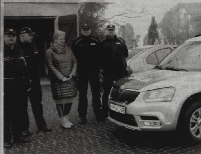
Symboliczne przekazanie nowego radiowozu odbyło się w miniony czwartek, 10 listopada.

SADLINKI. Po gminach Ryjewo, Gardeja i Prabuty teraz przyszedł czas na gminę Sadlinki. Policjanci z tamtejszego posterunku mogą już korzystać z nowego radiowozu. Sadlińscy samorządowcy przekazali na jego zakup 42,5 tys. zł. Uroczyste przekazanie policyjnej skody odbyło się w ubiegłym tygodniu.