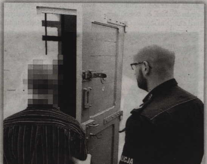
Po kłótni policjanci najpierw zatrzymali 25-latkę prowadzącą auto po alkoholu, po czym do aresztu trafił jej 37-letni chłopak. Jak się okazało był poszukiwany listem gończym do odbycia kary więzienia.