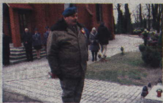
Hołd kombatantom oddali również byli żołnierze zawodowi.