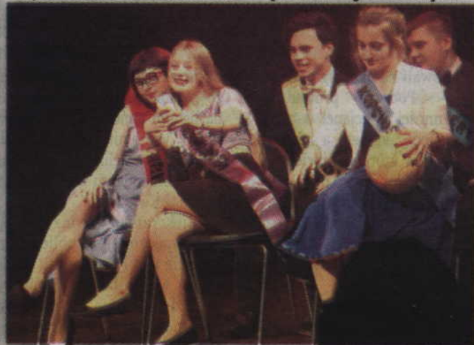
Prezentacja Zespołu Szkół Ogólnokształcących nr 2 zakończyła tegoroczne Teatralia.