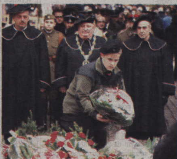
Kwiaty złożyli również przedstawiciele rzemieślników.