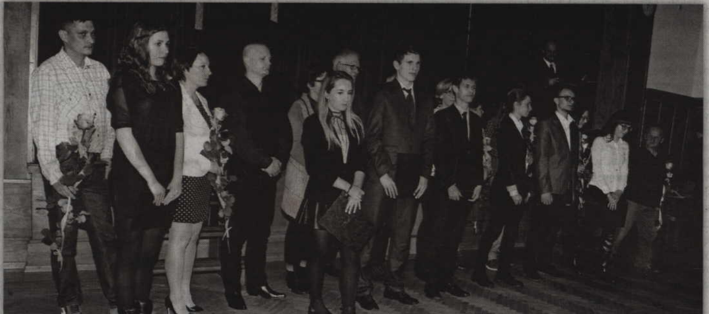
Najlepsi uczniowie oraz absolwenci szkół ponadgimnazjalnych otrzymali stypendia starosty kwidzyńskiego za osiągnięcia w roku szkolnym 2015/2016.

- Dziękuję przedstawicielom firm, którzy są razem z nami i pomagają nam w trudnym procesie edukacji. Dzięki uzyskanym wynikom mamy także osiągnięcia finansowe, bo w projektach europejskich dostaliśmy bardzo potężne pieniądze, które od 2017 roku zainwestujemy w szkoły. Jest to ok. 19 mln zł. Do tego dochodzą