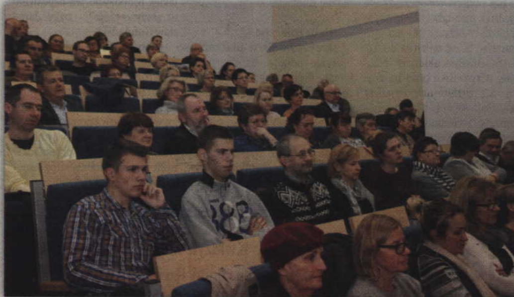
Sala audytoryjna KCK wypełniła się do ostatniego miejsca.

- Spotykamy na swojej drodze ludzi, których kompletnie nie możemy zrozumieć. Niech przykładem będzie wybór Donalda Trumpa na prezydenta USA. Słyszymy głosy – jak to było możliwe, że jego wybrano. Na naszym polskim podwórku też mamy tego doskonały przykład. Dla jednych zwycięstwo PiS-u jest czymś niezrozumiałym, a dla kolejnej grupy osób rządu PO to największe zło. Przekonanie jakiegokolwiek człowieka z tych grup jest praktycznie niemożliwe. Oni są jakby z innej planety. I tu się właśnie pojawia pytanie – jak z takimi ludźmi rozmawiać? Doskonałym tego przykładem jest także „Tygodnik Powszechny”, w którym pracowałem. Widzi-