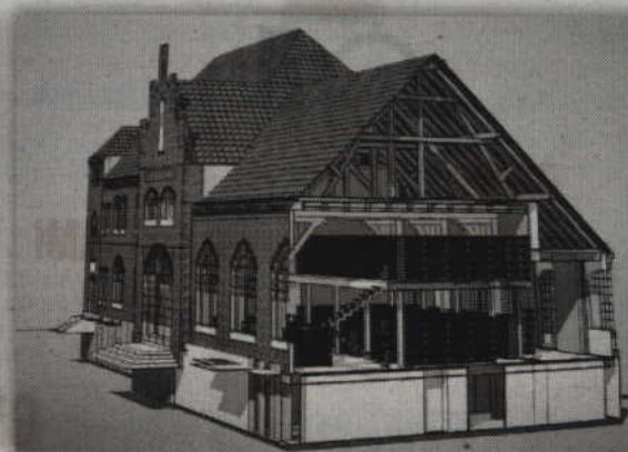
Zmodernizowany gmach dworca pomieszczenia m.in. bibliotekę miejsko-powiatową.

Projekt zakłada m.in. budowę dużych parkingów wzdłuż torów kolejowych, a zabytkowemu budynkowi dworca ma zostać przywrócona dawna świetność. Do gmachu dworca ma zostać przeniesiona biblioteka miejsko-powiatowa, jednak znajdą się w nim także kasy biletowe.