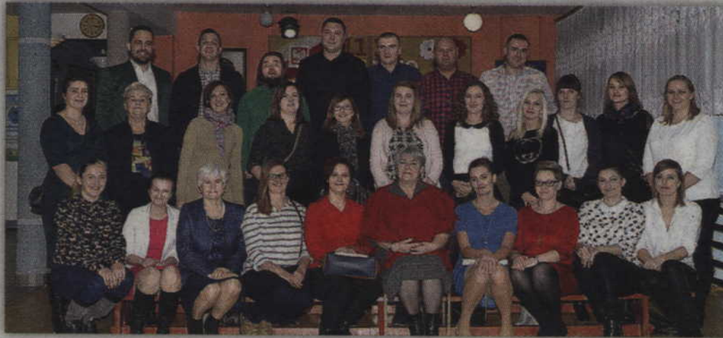
Do wspólnej, pamiątkowej fotografii zasiedli absolwenci, którzy odebrali świadectwa ukończenia szkoły podstawowej w latach 1998-2000.

- Jak przystało na powrót do szkolnych ław spotkanie rozpo-