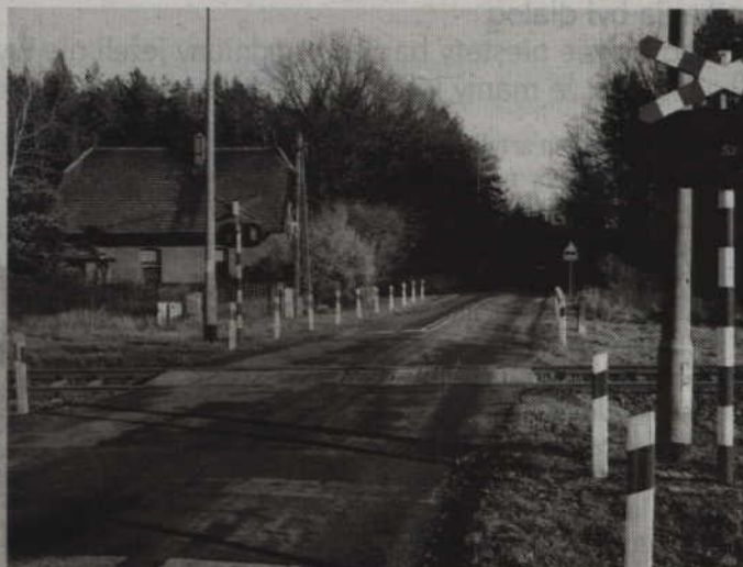
W 2017 roku ZDW w Gdańsku zamierza wykonać dokumentację na remont drogi na odcinku Dziwno - Gardeja.

natężenie, w porównaniu z drogą nr 521 czyli Kwidzyn - Prabuty, jest znikome. Tamta droga ma natomiast znaczenie strategiczne dla ruchu samochodowego. Dla nas podstawową przeszkodą są jednak pieniądze, a właściwie ich brak. W przyszłym roku możecie więc liczyć tylko na doraźne uzupełnianie ubytków w asfalcie. W tym roku tylko na drogę nr 611 zostało wysypanych 17 ton gryzu. Rejonu nie stać bowiem na wyremontowanie jakiegokolwiek większego odcinka dróg w gminie Sadlinki. Remont kilometra drogi to 500 tys. zł, a cały nasz budżet na ten rok to 2,3 mln. zł. Wiem, że państwo chce-