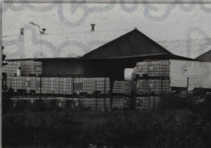
- Trudno mi dziś powiedzieć, czy to wszystko będzie trwało pół roku czy rok. Wierzę jednak w to, że ten zakład prędzej czy później zostanie zamknięty i niebezpieczeństwo zniknie - stwierdziła wójt Elżbieta Krajewska.

Wójt gminy Sadlinki dodaje, że wszyscy mieli ogromne szczęście, że w tym wypadku nie doszło do niczego poważniejszego. Wrześnieowy wyciek kwasu był