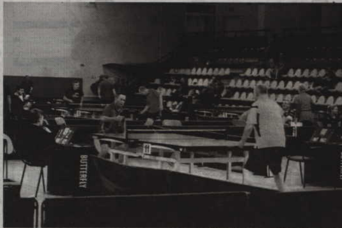
Dwudniowa rywalizacja tenisowych weteranów odbywała się w hali przy ul. Mickiewicza.

W kwietniu rywalizować będą żacy M. Schaefer podkreśla, że aby