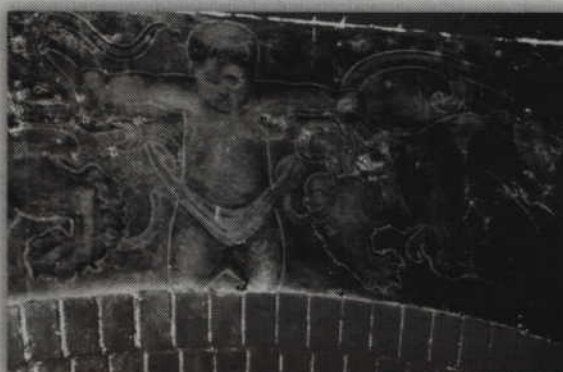
Kosztowne będzie zwłaszcza odkrycie i zabezpieczenie zabytkowych malowideł znajdujących się w holu dworca.