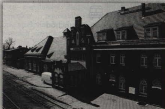
Samorząd miasta otrzymał ponad 7 mln zł z funduszy unijnych. Środki te pomogą w budowie węzła integracyjnego wraz z rewitalizacją zabytkowego dworca PKP.

- To będzie ogromny plac budowy. Będzie to druga pod względem wielkości inwestycja, którą zrealizujemy jako samorząd – podkreśla burmistrz Andrzej Krzysztofiak.