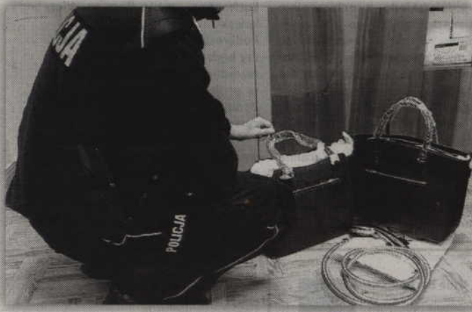
Zatrzymana 47-latką zwróciła wyłudzone rzeczy i dobrowolnie poddała się karze.