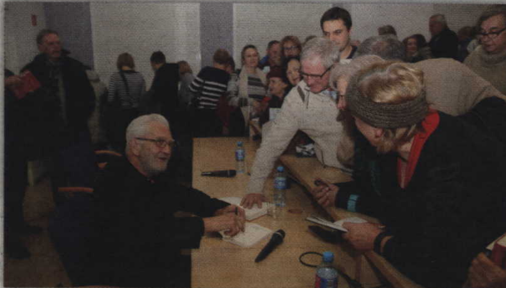
Po spotkaniu ks. Adam Boniecki podpisywał książki swojego autorstwa. Niektórzy zdołali także przez chwilę porozmawiać z byłym szefem „Tygodnika Powszechnego”.