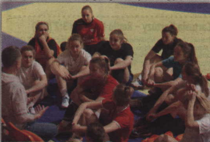
Podopieczne trenera Roberta Majdzińskiego jak dotąd nie przegrały jeszcze żadnego meczu i z dorobkiem 11 punktów zajmują trzecie miejsce w lidze.