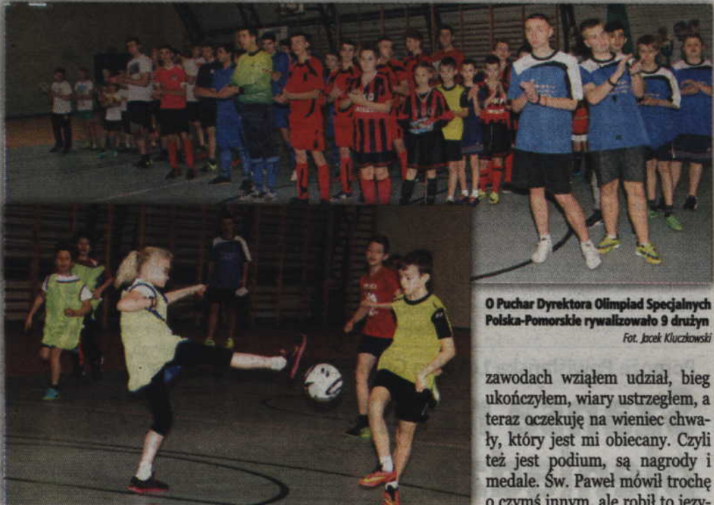
O Puchar Dyrektora Olimpiad Specjalnych Polska-Pomorskie rywalizowało 9 drużyn

KWIDZYN. Dziewięć drużyn wzięło udział w Integracyjnym Turnieju Piłki Nożnej rozgrywanym o Puchar Dyrektora Olimpiad Specjalnych Polska-Pomorskie. Rywalizacja odbywała się w hali sportowej II LO w Kwidzynie, a w glorii zwycięstwa zmagania opuszczali piłkarze z parafii Św. Anny ze Sztumu oraz drużyna Parafii Miłosierdzia Bożego w Kwidzynie.