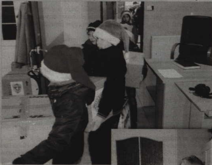
Paczki do siedziby stowarzyszenia wnoszą uczniowie Szkoły Podstawowej nr 4.