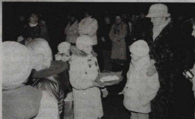
Podczas spotkania na Placu Jana Pawła II zebrani m.in. podzielili się oplatkiem i złożyli sobie życzenia.

O godz. 19.00 uroczystości przeniosą się już na Plac Jana Pawła II, na które wstęp jest już wolny. Podczas spotkania oplatkowego odbędzie się m.in. przekazanie Światła Betlejemskiego przez harcerzy, zapalenie świec na miejskiej choince.