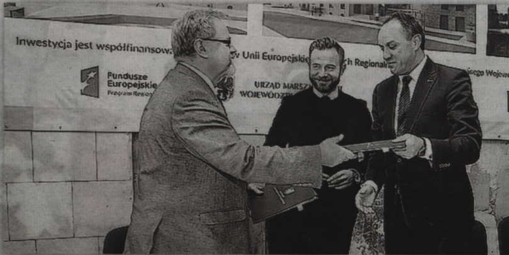
Do podpisania stosownej umowy o dofinansowaniu modernizacji kwidzyńskiego dworca doszło podczas spotkania w Starogardzie Gdańskim.

Inwestycja miałaby zostać zrealizowana w ciągu dwóch lat. Najkosztowniejszą jej częścią będzie