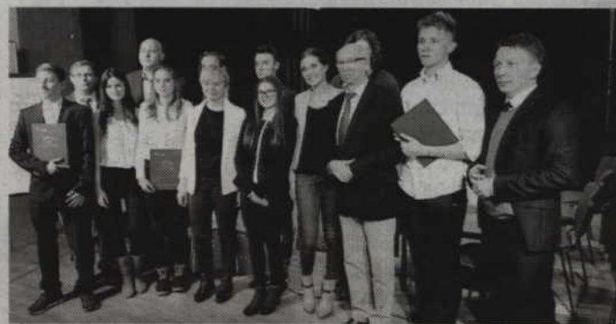
Finałisti turnieju debat wraz z europosełem Januszem Lewandowskim.