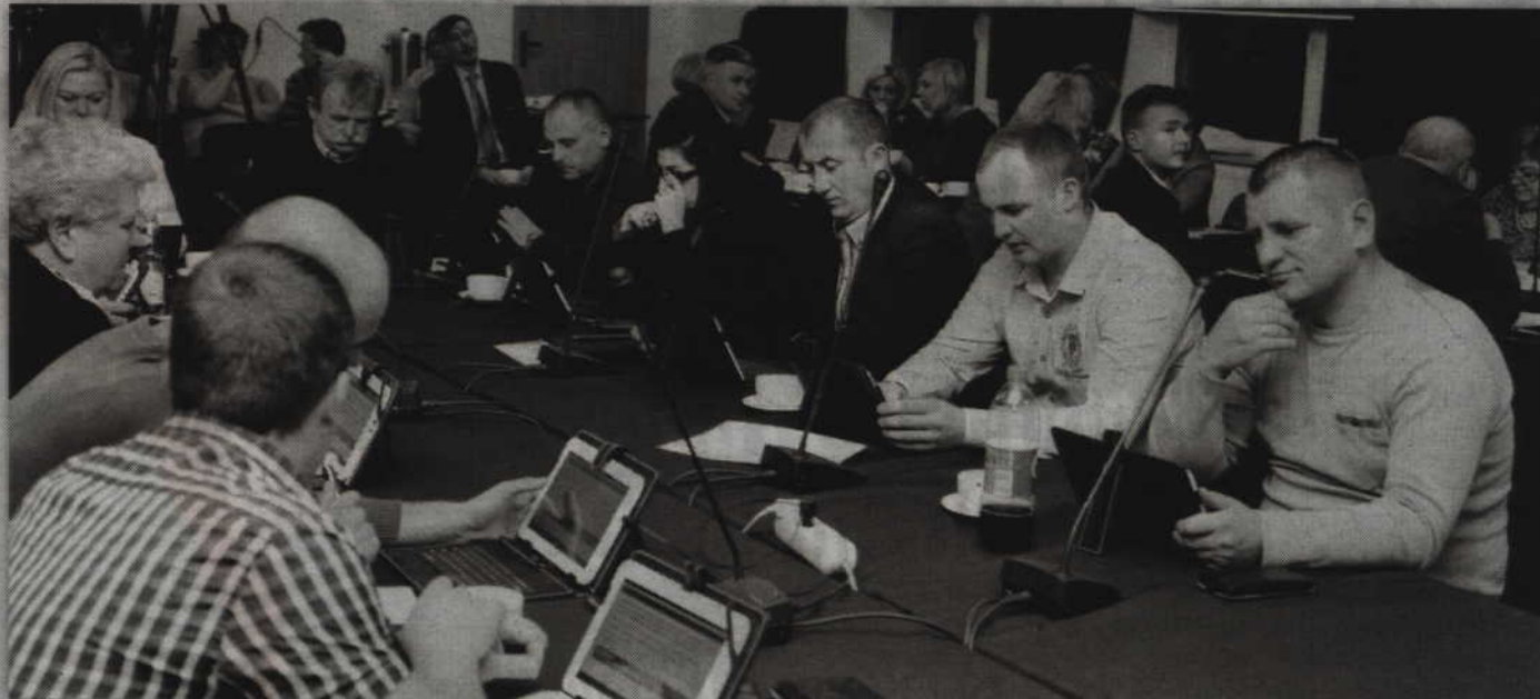
Gardejscy radni nie dowiedzieli się o ile wzrośnie cena wody i ścieków dla firm.