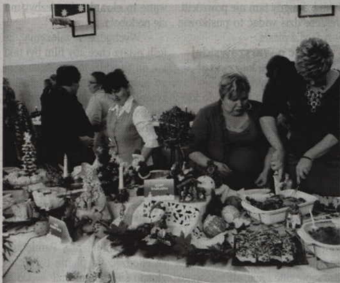
Gospodarzami Powiślańskiego Stola Bożonarodzeniowego będzie gmina Sadlinki.