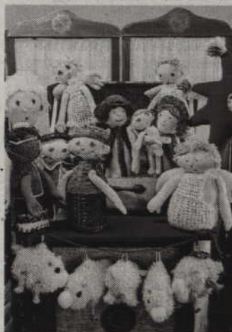
„Szydełkową Szopkę Babci Klary” będzie można obejrzeć w najbliższy piątek, 16 grudnia.

KWIDZYN. Scena Lalkowa im. Jana Wilkowskiego w Kwidzynie zaprasza na ostatnią w tym roku Dobranockę Teatralną. W najbliższy piątek, 16 grudnia o godz. 18.00, zobaczymy „Szydełkową Szopkę Babci Klary” przygotowaną przez Teatr Małe Mi. Spektakl tradycyjnie odbędzie się w Czarnej Sali Kwidzyńskiego Centrum Kultury przy ul. Słowiańskiej. Bilety, w cenie 10 zł, nabywać można przed wejściem na widownię.