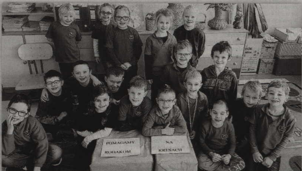
Na pomoc mieszkańcom Kresów zdecydowali się m.in. uczniowie SP 6 w Kwidzynie.