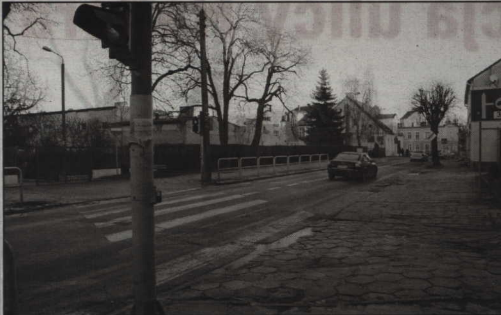
Rozpoczyna się modernizacja ulicy Hallera. W związku z rozpoczęciem prac kierownicy muszą zwrócić uwagę na zmianę organizacji ruchu. Utrudniony będzie także dojazd do Szkoły Podstawowej nr 5. Rodzice, którzy dowożą dzieci, zostaną poinformowani o zmianach w organizacji ruchu za pomocą dzienników elektronicznych.

Rozpoczyna się modernizacja ulicy Hallera. W związku z rozpoczęciem prac kierownicy muszą zwrócić uwagę na zmianę organizacji ruchu. Utrudniony będzie także dojazd do Szkoły Podstawowej nr 5. Rodzice, którzy dowożą dzieci, zostaną poinformowani o zmianach w organizacji ruchu za pomocą dzienników elektronicznych. To wspólna inwestycja samorządu województwa pomorskiego oraz miasta. Ulica administrowana jest bowiem przez Zarząd Dróg Wojewódzkich w Gdańsku. Latem zostało podpisane porozumienie w tej sprawie. Prace wykonane zostaną na odcinku od skrzyżowania z ulicą Batalionów Chłopskich do skrzyżowania z ul. Łużycką. Finansowy udział miasta w modernizacji ulicy to kwota 2,7 mln zł. Kwota ta obejmuje rok bieżący oraz przyszły.