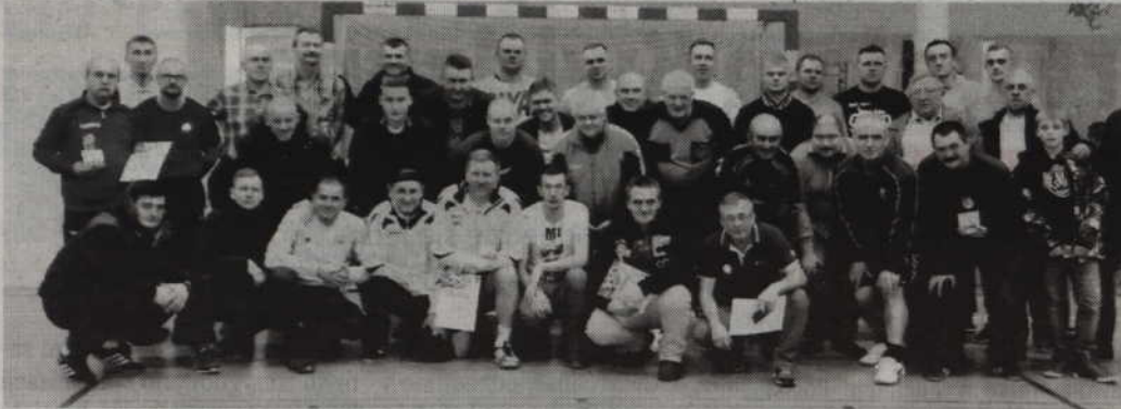
Wspólne zdjęcie uczestników gardejskiego turnieju oldboy'ów.

PIĘKA NOŻNA. Byli piłkarze Rodła Kwidzyn wygrali turniej piłki nożnej o puchar wójta gminy Gardeja. W zmaganiach zorganizowanych w hali ZS w Gardei nie mieli sobie równych pokonując wszystkich rywali.