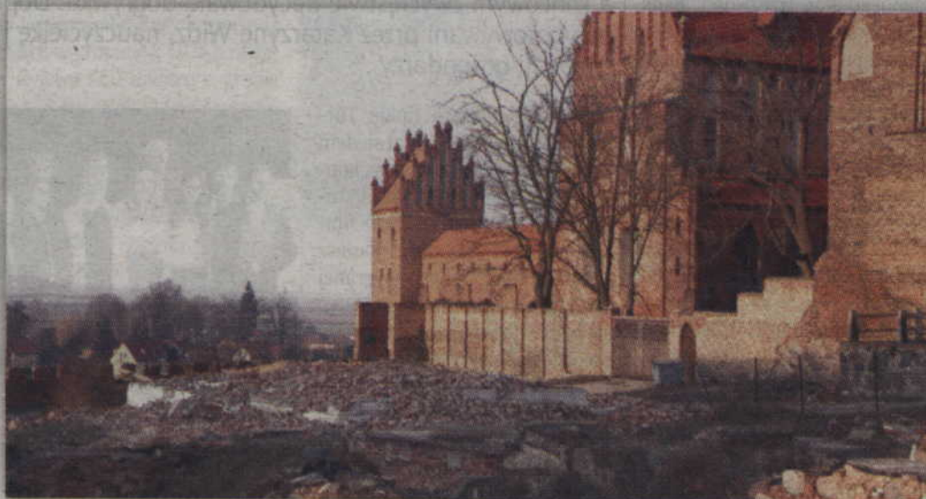
Zanim rozpoczną się prace budowlane teren po zburzonej kamienicy zbadają archeolodzy.

Zburzona kamienica była częścią tego kompleksu, ale była w bardzo złym stanie. Dlatego została podjęta decyzja o jej wyburzeniu. Zanim na terenie całego kwartału pojawią się ekipy budowlane, w miejscu zburzonej