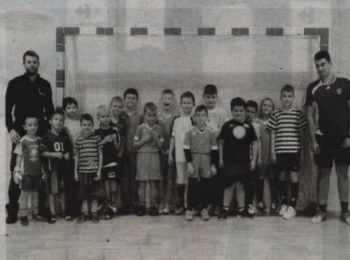
Wspólne zdjęcie policjantów z młodymi piłkarzami „Wisły”.

-Chłopcy sami chwalili się znajomością wielu poruszanych zagadnień, m.in. wymieniali telefon alarmowe, mówili kiedy