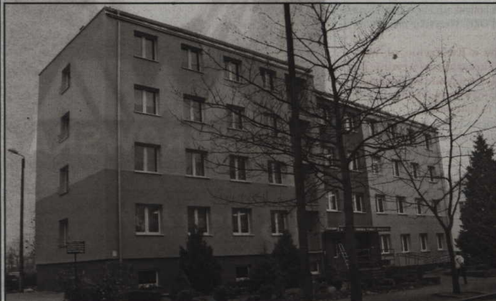
W razie zauważenia osoby bezdomnej potrzebującej pomocy można powiadomić pracowników Miejskiego Ośrodka Pomocy Społecznej. Tel. 55 646 16 24.