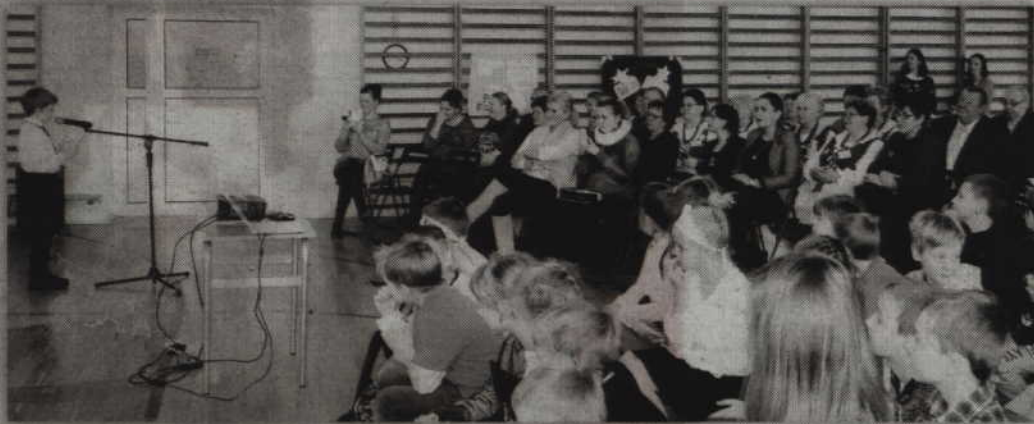
Podsumowanie projektu odbyło się sali gimnastycznej Szkoły Podstawowej w Korzeniewie.

- Goście obejrzeli prezentację multimedialną na temat naszego projektu. Zobaczyli również in-