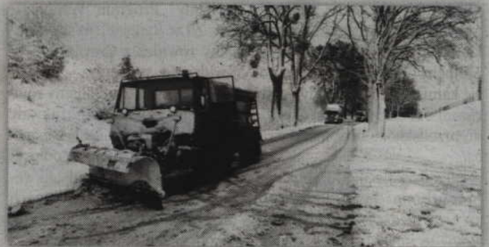
Na odśnieżanie dróg starostwo powiatowe wydało już ponad 150 tys. zł.

- Trudne miejsca do utrzymania są w okolicy Cygan w gminie Gardeja czy Watkowic w gminie