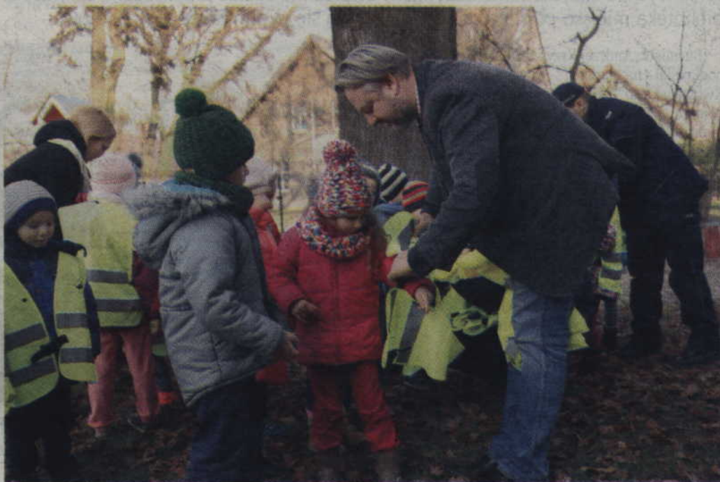
Wójt Sławomir Słupczyński pomaga maluchom w ubraniu zakupionych kamizelek.

Przedszkole przystąpiło również do programów ogólnopolskich, takich jak „Pocztówkowe Przedszkole” i „Mały Miś w świecie wielkiej literatury”. Wraz z wychowankami i rodzicami przedszkole zaangażowało