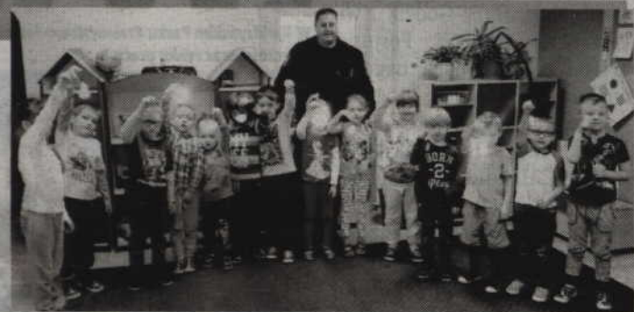
Akacja „Strażnik Odblasku” odbyła się w Przedszkolu Integracyjnym w Kwidzynie oraz w Ośrodku Szkolno Wychowawczym w Barcicach.

Według danych Komendy Głównej Policji, w pierwszych dziewięciu miesiącach tego roku, na 100 wypadków z udziałem pieszych śmierć poniosły 34