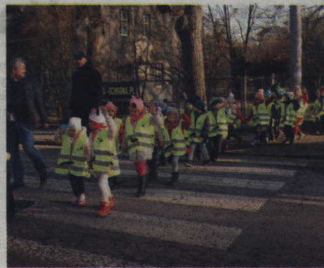
Odziani w kamizelki, a także w asyście wójta oraz policji, maluchy przeszły przez przejście dla pieszych.