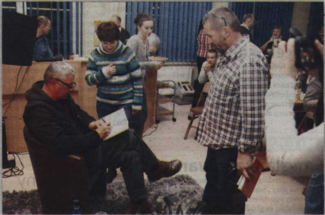
Autograf i dedykacja pisarza to cenna pamiątka.