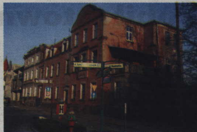
Po remoncie w budynku u zbiegu ulic Słowiańskiej i Kościelnej powstaną 13 lokali mieszkalnych.

Samorząd miasta planował rozpoczęcie inwestycji jeszcze w tym roku. Gdyby ją jednak rozpoczął straciłby możliwość zabiegania o środki z budżetu państwa, w ramach rządowego programu, który wspiera samorządy w tego typu budownictwie. (jk)