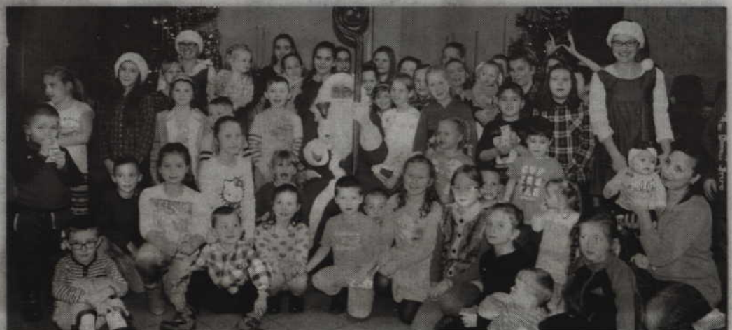
Wspólne zdjęcie z Mikołajem jest zawsze miłą pamiątką.

uczestniczyć w mikołajkowej imprezie, to przekazała wszystkim życzenia udanej zabawy. Warto również dodać, że w organizacji spotkania ze świętym Mikołajem pomagali także mieszkańcy Bronisławowa. (RB)