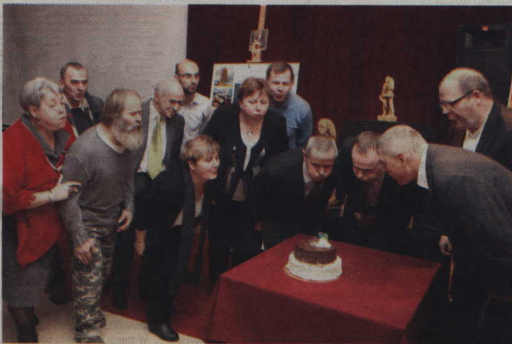
Tegoroczni plenerowicze wspólnie zdmuchnęli świeczki na jubileuszowym torcie.

-Jesteśmy pod dużym wrażeniem tego co robicie. W imieniu stowarzyszenia „Kontrasty” składamy wam życzenia dalszej wy-