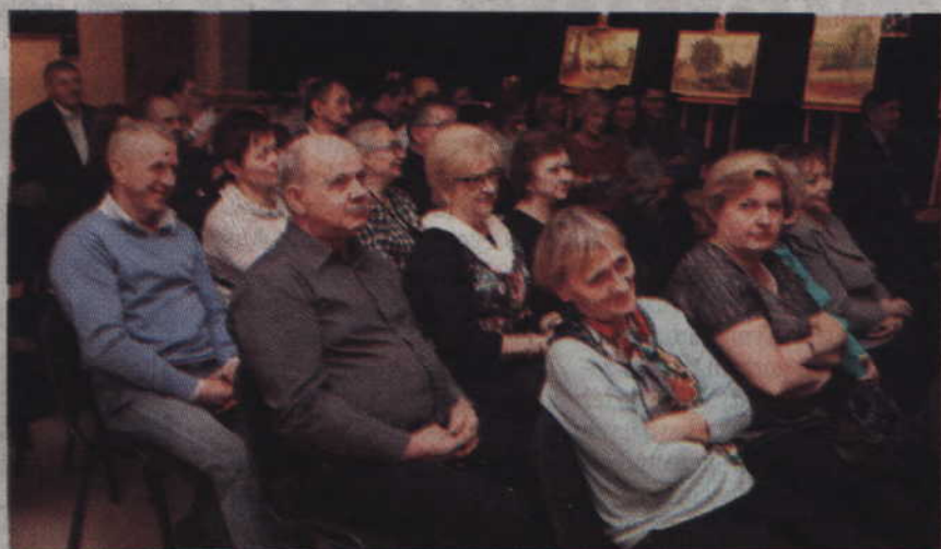
Mieszkańcy jak zwykle licznie przybyli na otwarcie wystawy.