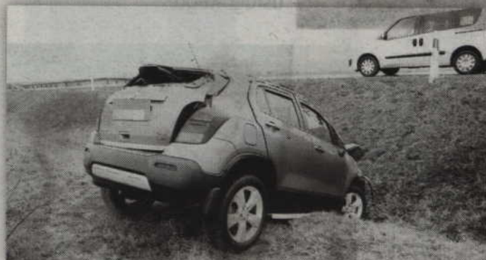
Po wypadku kierowca i pasażerka chevroleta przewiezieni zostali do szpitala.