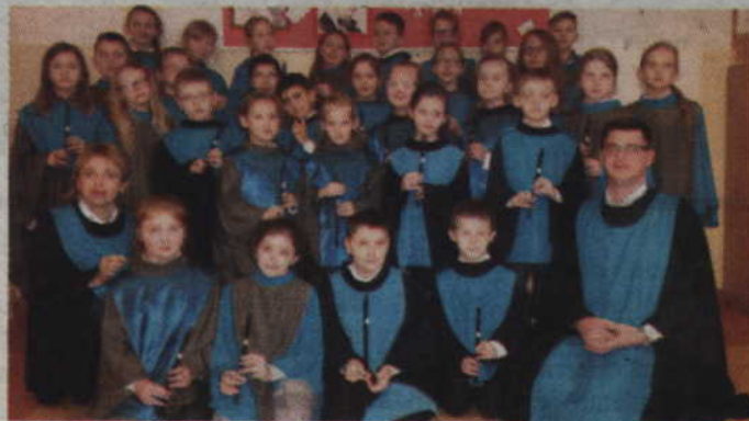
W styczniu zespół „Flauto Dolce” zagra w Cyganach oraz na kwidzyńskiej akcji WOŚP.