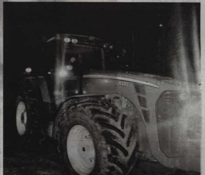
Skradziony ciągnik odnaleziono w pobliskiej miejscowości.