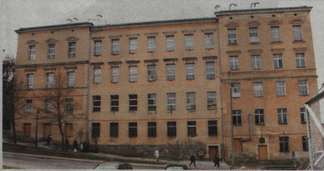
W ramach pozyskanych środków wyremontowany zostanie m.in. zabytkowy budynek Zespołu Szkół Ponadgimnazjalnych nr 2.