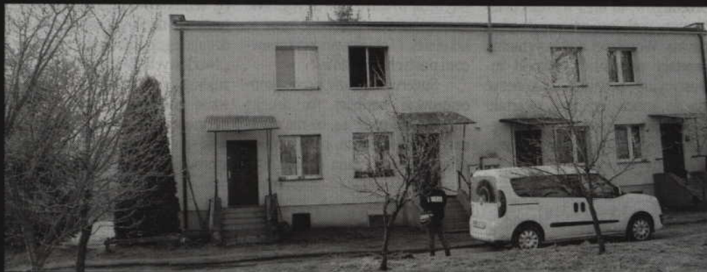
Ogień pojawił się w jednym z mieszkań bloku znajdującego się przy ul. Młynarskiej.