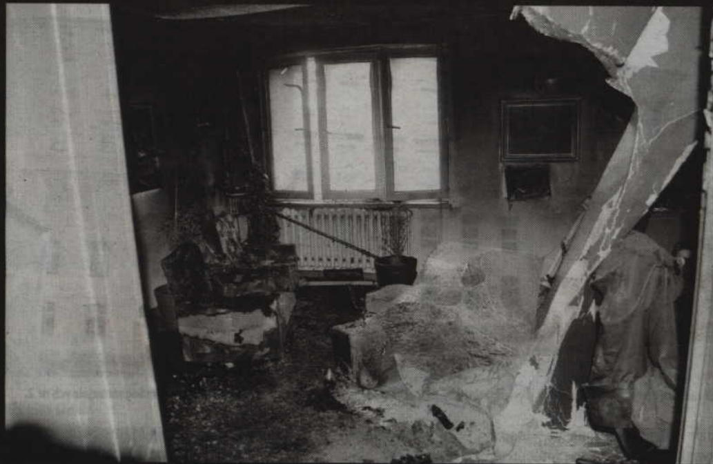
Straty, które spowodował pożar, oszacowano natomiast wstępnie na ok. 100 tys. zł.

Działania strażaków polegały na zabezpieczeniu miejsca zdarzenia oraz podaniu jednego prądu gaśniczego wody na palące się wyposażenie pomieszczenia – mówi st. kpt. Jan Chodkiewicz, zastępca komendanta powiatowego Państwowej Straży Pożarnej w Kwidzynie. - Równocześnie przeszukano pomieszczenia mieszkania oraz poinformowano o zaistniałej sytuacji wszystkich mieszkańców obiektu. W jednym z pomieszczeń, które nie było objęte pożarem, znaleziono nieprzytomnego mężczyznę, który został ewakuowany na