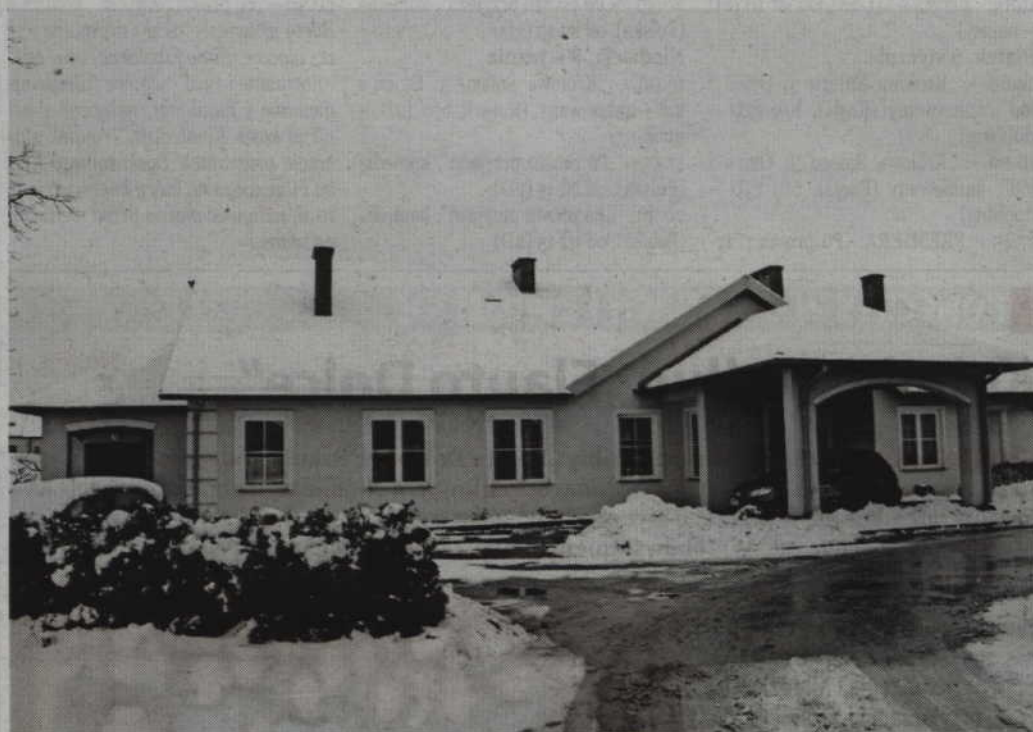
Obecny budynek hospicjum posiada tylko 11 miejsc. Po rozbudowie liczba ta wzrośnie do 21.

KWIDZYN. Pół miliona złotych zamierza przeznaczyć w tym roku samorząd powiatu na rozbudowę budynku Hospicjum im. św. Wojciecha w Kwidzynie. Placówka prowadzona jest przez Kwidzińskie Towarzystwo Przyjaciół Chorych. Obecnie obiekt posiada sześć sal dla pacjentów, w których może przebywać 11 osób.