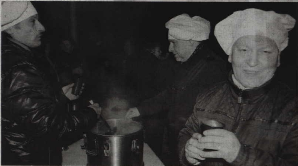
Współorganizatorem spotkania na przykatedralnym placu był prabucki oddział Akcji Katolickiej.

PRABUTY. Pasterka to nierozzerwalny element bożonarodzeniowej tradycji. W prabuckiej Konkatedrze nie skończyło się jednak tylko na samej mszy. Na placu przy kościele rozpalono ognisko, wystąpił chór parafialny, a wierni dzielili się opłatkiem i grzonym winem.