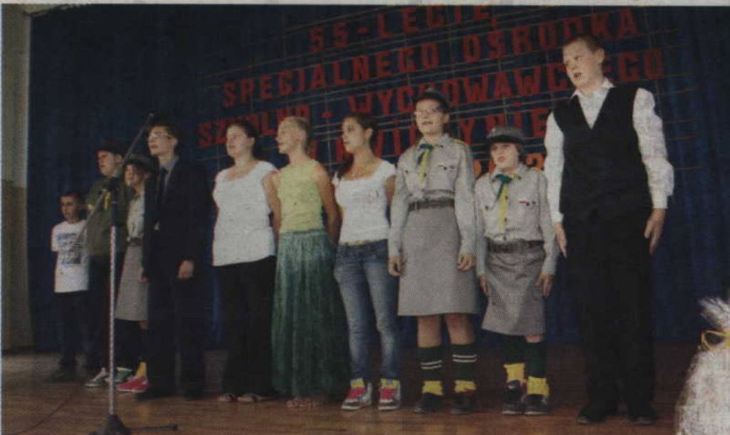
Samorząd powiatu zdecydował, że przeznaczy 60 tys. zł na budowę podestu, który umożliwi dotarcie na scenę niepełnosprawnym uczniom ZSS w Kwidzynie.

KWIDZYN. Z auli Zespołu Szkół Specjalnych przy ul. Ogrodowej zniknie uciążliwa bariera architektoniczna. Samorząd powiatu zdecydował bowiem, że przeznaczy 60 tys. zł na budowę podestu, który umożliwi dotarcie na scenę niepełnosprawnym uczniom.