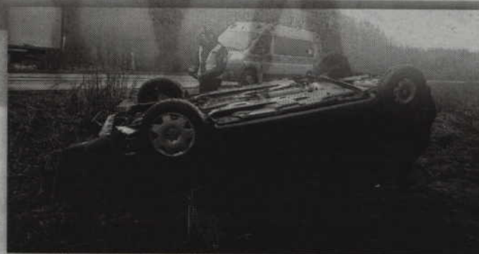
Tego samego dnia dachowaniem zakończył się także wypadek na trasie Licze-Prabuty.

Policjanci przebadali kierowcę alkołotestem i ustalili, że był