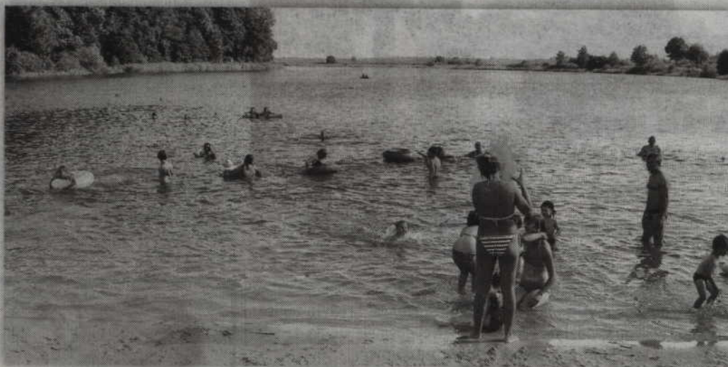
Zasądzone odszkodowanie to pokłosie nieszczęśliwego wypadku do którego doszło nad jeziorem w Wandowie.

Tuż przed świętami gardejscy radni spotkali się na nadzwyczajnej sesji. Głównym jej tematem było podjęcie uchwały w sprawie zmian w budżecie, aby gmina do końca roku mogła wypłacić zasądzone odszkodowanie. Przypomnijmy, że sprawa dotyczy nieszczęśliwego wypadku do którego doszło przed kilku laty nad jeziorem w Wandowie. Młody mężczyzna, mieszkaniec Kwidzyna, złamał wówczas w wodzie kręgosłup. Jego adwokaci wystąpili z pozwem przeciwko gardejskiemu samorządowi, w którym zażądali odszkodowania w wysokości 1 miliona zł. Proces przed Sądem Okręgowym w Gdańsku rozpoczął się w 2013 roku, a wyrok zapadł na początku 2016 roku.