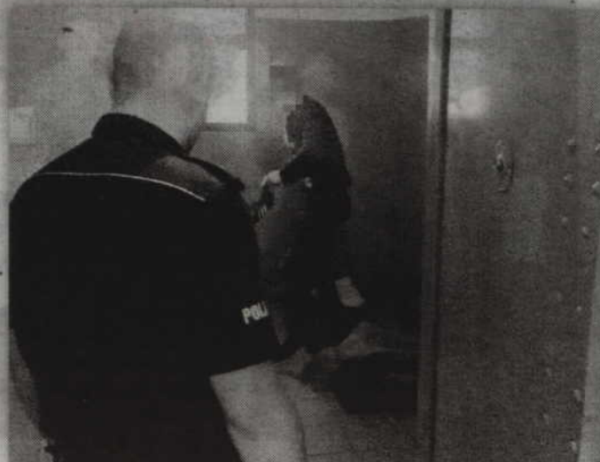
(fox) Zatrzymany 17-latek spędził noc w policyjnej celi.

Przypomnijmy, że za dokonanie rozboju kodeks karny przewiduje karę od 2 do 12 lat pozbawienia wolności.