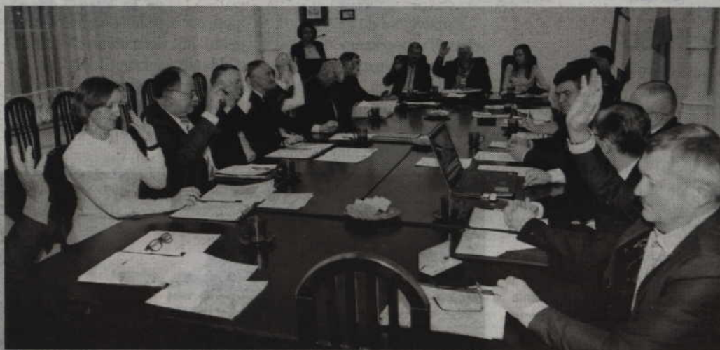
Decyzją radnych gminy Kwidzyn cena za wodę i ścieki pozostanie nadal na tym samym poziomie.

Prezes PWiK przypomniał również o tym, że w minionym roku pojawiły się doniesienia medialne informujące o pomysle powołania nowej instytucji pod nazwą „Wody Polskie”. Ten nowy twór miałby pobierać wysokie stawki opłat za korzystanie z zasobów środowiska naturalnego, a więc również z podziemnych