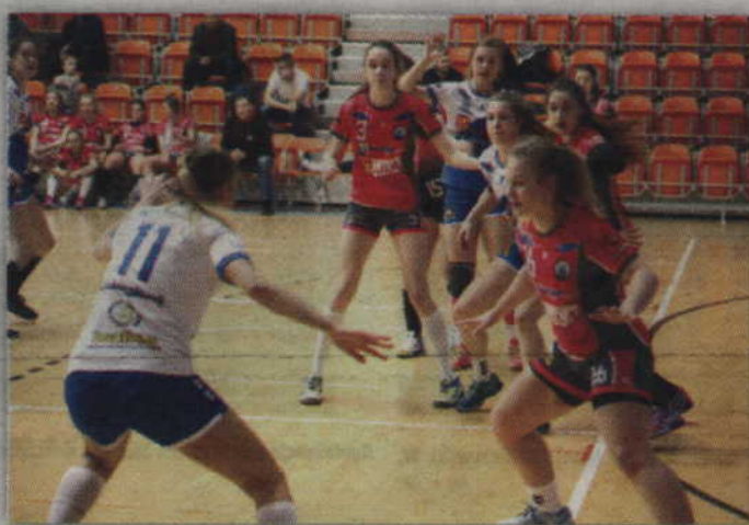
Pojedynek dwóch zespołów z Kwidzyna zakończył się zwycięstwem pierwszej ekipy juniorek MTS.