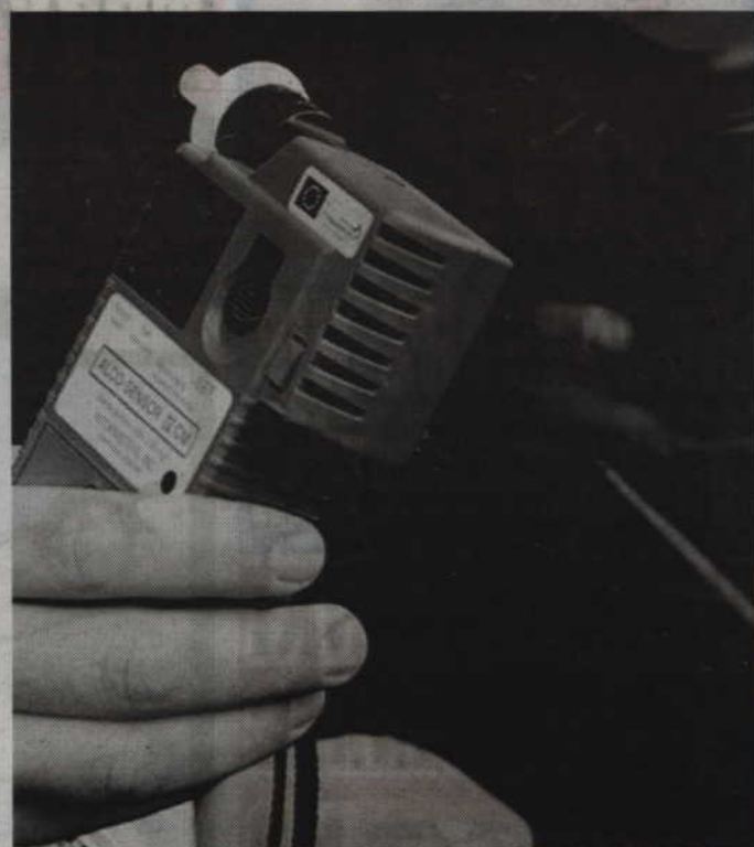
W miniony weekend policjanci zatrzymali 3 nietrzeźwych kierowców.

Podczas badania na trzeźwość okazało się, że mężczyzna kierował mając ponad półtora promila alkoholu w organizmie – mówi mł. asp. B. Schab.