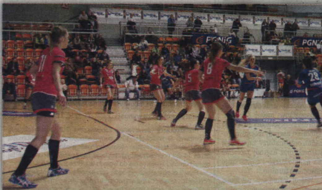
Juniorki grające w MTS Kwidzyn uległy silniejszemu rywalowi z Gdańska 26:33.