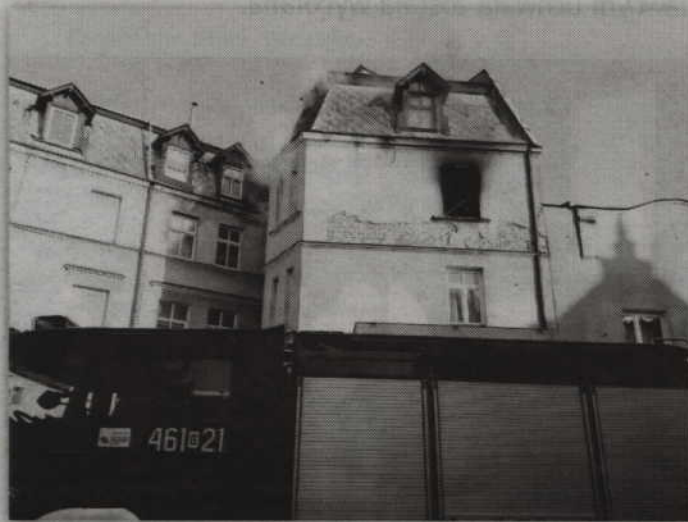
Z mieszkania na II piętrze wydostawał się dym. Widoczne były również języki ognia.

- Ze wstępnych ustaleń straży pożarnej i pracujących na miejscu policjantów wynika, że do pożaru doszło najprawdopodobniej w wyniku zaprószenia ognia. Dokładne przyczyny będą znane jednak dopiero po przeprowadzonym postę-