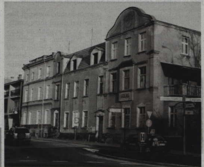
W zmodernizowanej kamienicy u zbiegu ulic Słowiańskiej i Kościelnej powstaną 13 lokali czynszowych.