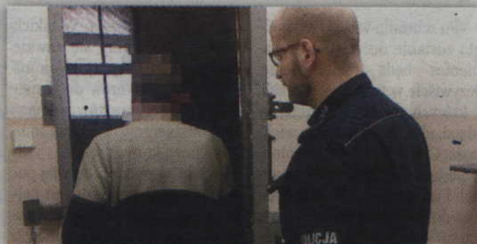
Zatrzymanemu 35-latkowi grozi do 3 lat pozbawienia wolności.

Mieszkaniec powiatu kwidzyńskiego został zatrzymany w policyjnym areszcie. Za jazdę