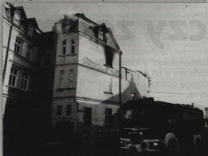
Po przybyciu strażacy odłączyli dopływ gazu oraz zasilanie energii elektrycznej.