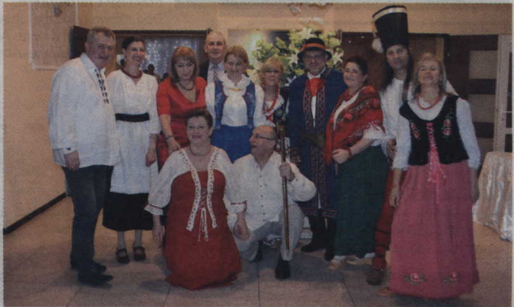
Podczas III Charytatywnego Balu Karnawałowego bawiono się „na ludową nutę”.

Uczestnicy każdego balu charytatywnego, którego organizatorem jest prabucka „Akcja Katolicka” wiedzą doskonale, że trakcie zabawy organizatorzy przeprowadzają licytację najróżniejszych przedmiotów. Podczas tegorocznego balu można było więc kupić m.in. piernikowe serca i chatki, obrazy, serca wykonane z papieru, ręcznie zrobione karty okolicznościowe czy też karafki. Niezwykłą ciekawostką była natomiast sowa zrobiona na szydełku. Prawdziwym hitem okazała się jednak koszulka reprezentacji Polski z autografem Jakuba Błaszczykowskiego. Nasz czołowy piłkarz trenował