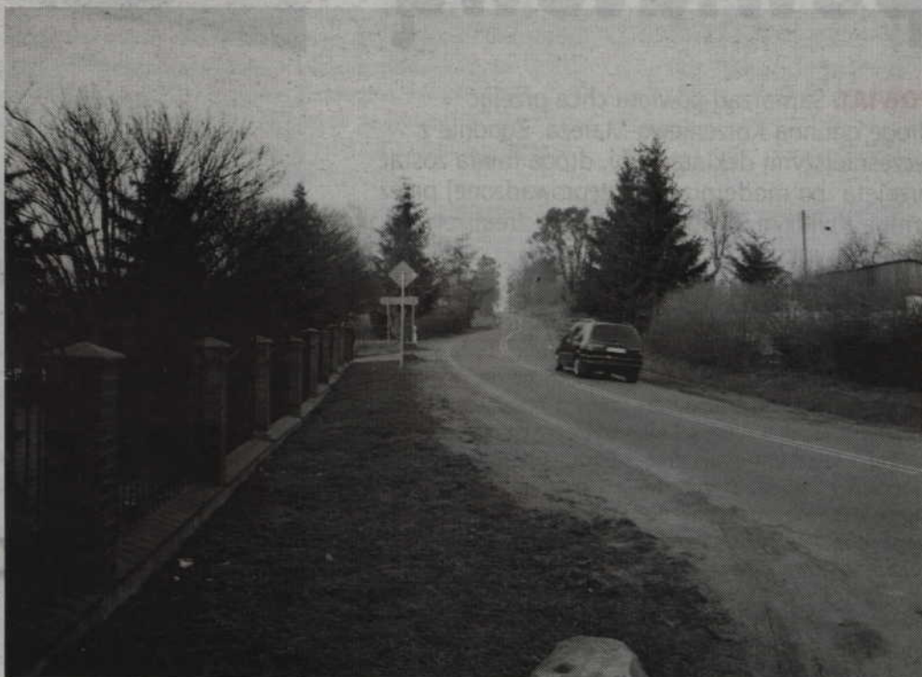
Przyszła ulica Kwidzyńska