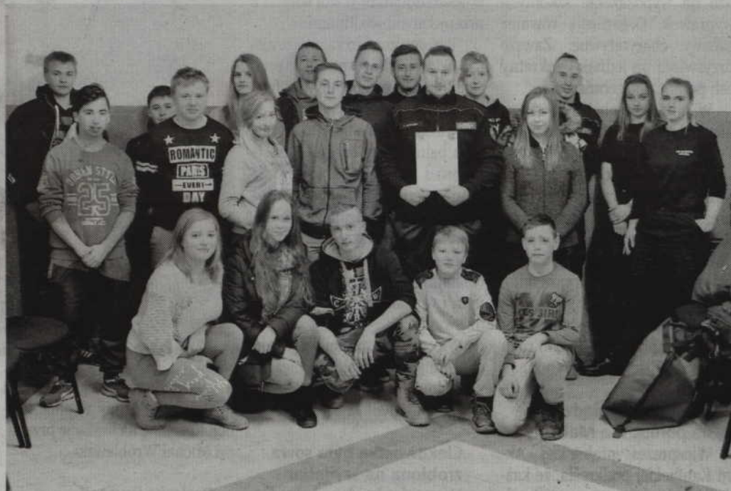
W szkoleniu wzięli udział członkowie Młodzieżowej Drużyny Pożarniczej.

GMINA GARDEJA. Członkowie Młodzieżowej Drużyny Pożarniczej, działającej przy OSP Czarne Dolne, szkolili się z pierwszej pomocy przedmedycznej. Dodatkowo młodzi druhowie, dziewczęta i chłopcy, zapoznali się ze sposobami używania defibrylatora. Automatyczny defibrylator (AED), w stanach zagrożenia życia może osobie poszkodowanej uratować życie.