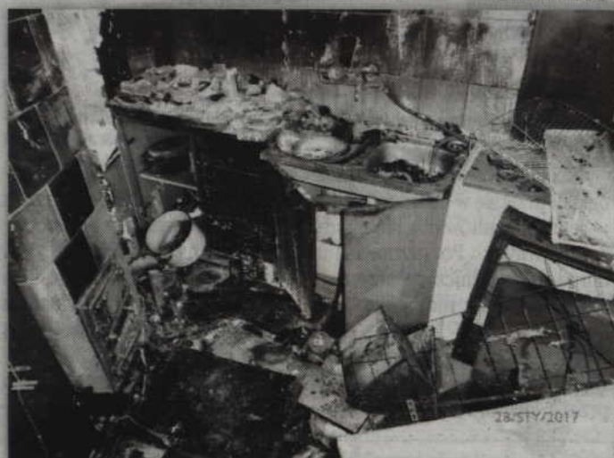
Straty wstępnie oszacowano na ok. 150 tys. zł.