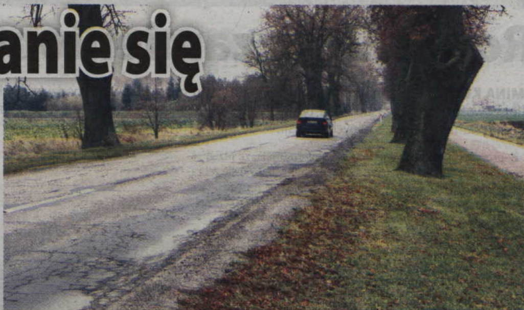
Samorząd powiatu przejmie drogę Mareza - Korzeniewo. W zamian gmina Kwidzyn przejmie jedną z dróg powiatowych o charakterze lokalnym.