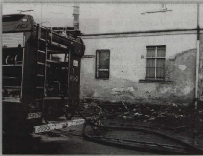
Na zewnątrz budynku usunięto nadpalone elementy wyposażenia mieszkania w celu ich dogaszenia.

- Trzy osoby na razie zostały przewiezione do Hoteliku