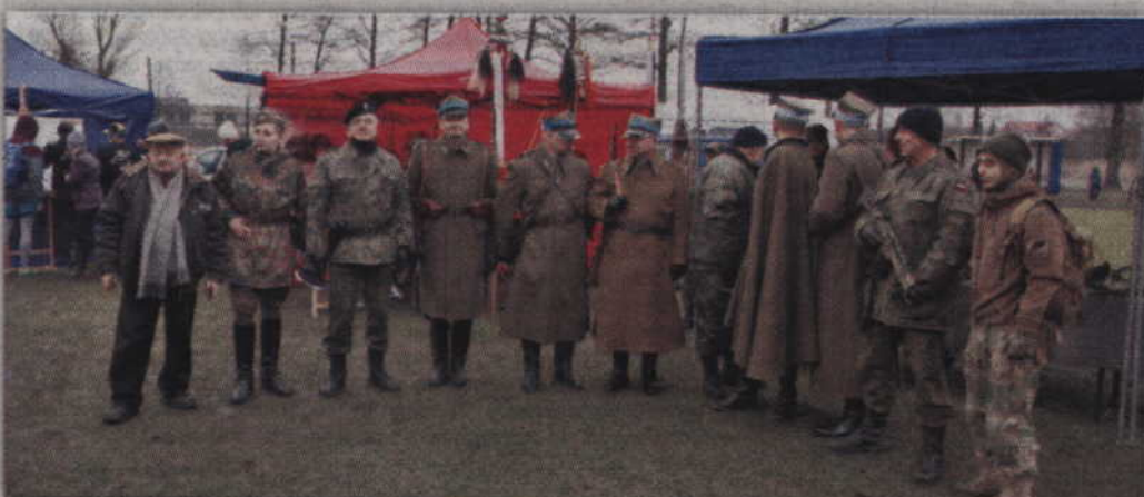
Imprezę uświetnili także kwidzyńscy rekonstruktorzy. red tech. BR

- Bieg w Gardei nie jest moim debiutem - wyjaśnia w rozmowie z „Kurierem Kwidzyńskim”.