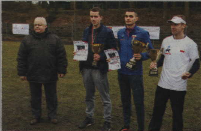
Wójt gminy Gardeja w towarzystwie zwycięzców rywalizacji mężczyzn na 10 km.