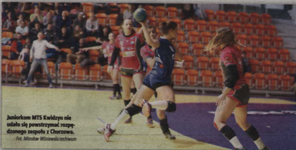
Juniorkom MTS Kwidzyn nie udało się powstrzymać rozgrywanego zespołu z Chorzowa.