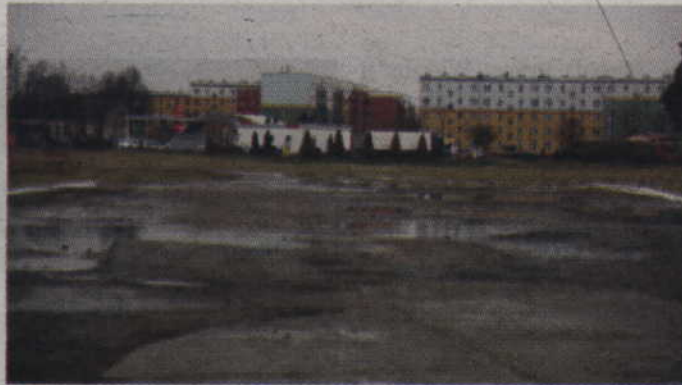
Obecnie tzw. „plac buraczany” to prawdziwe pustkowie.

Burmistrz przypomina, że część tych działek została już sprzedana i obecny właściciel tego terenu chce dokupić pozostałą część owego „placu buraczanego”. Jeśli tak się stanie, będzie właścicielem placu od po-