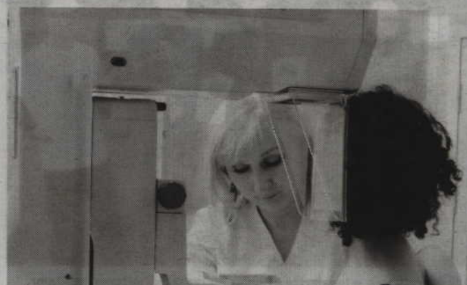
Badanie mammograficzne polega na zrobieniu 4 zdjęć rentgenowskich.

Niestety zadowalający wynik poprzedniego badania nie zawsze gwarantuje, że obecnie naszemu zdrowiu nie zagraża niebezpieczeństwo: nowotwór piersi. Czasami kobiety rezygnują z kolejnych badań, ułatwiając tym samym rozwój choroby. Rak nie boli, w początkowym stadium nie wpływa źle na nasze samopoczucie,