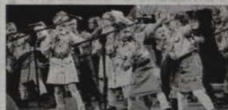
Kwidzyński festiwal „Szałamaja” odbędzie się już po raz 33.