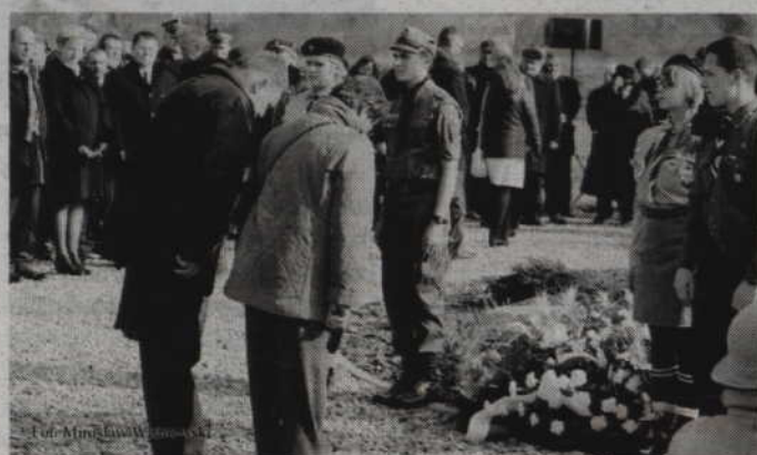
Uroczystości rozpoczną się od apelu i złożenia kwiatów pod tablicą pamiątkową znajdującą się w Marezie.

Uroczystości rozpoczną się od apelu i złożenia kwiatów pod tablicą pamięci Konfederacji Obrony Wiary i Ojczyzny umiejscowioną w Marezie (gm. Kwidzyn). Następnie wianki kwiatów złożone zostaną także pod tablicą pamięci Organizacji Młodzieży Demokratyczno-Katolickiej, znajdującej się na budynku I LO w Kwidzynie oraz na Skwerze im. Niezłomnych znajdującym się przy ul. Grudziądzkiej. Uroczystości zwieńczy natomiast Msza św. sprawowana w intencji żołnierzy wyklętych oraz koncert przygotowany przez uczniów Szkoły Podstawowej w Janowie. Warto również dodać, że organizatorami uroczystości są: Starostwo Powiatowe, Urząd Miasta w Kwidzynie, Urząd Gminy Kwidzyn oraz Kwidzyńskie Stowarzyszenie Wspierania Samorządności. (fox)