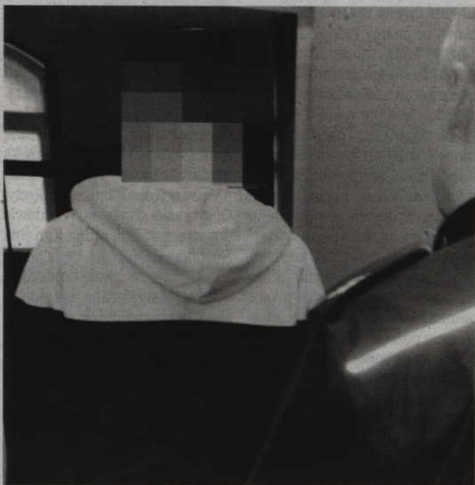
Mężczyzna zdążył sprzedaż telefon komórkowy w lombardzie.

Wczoraj (poniedziałek, 28 lutego) wieczorem dzielnicy z kwidzińskiej Komendy zatrzymali mężczyznę podejrzanego o popełnienie kradzieży. Zatrzymany 25-letni mieszkaniec gminy Kwidzyn przyznał się, a także wskazał lombard w którym sprzedał „komórkę”. Funkcjonariusze odzyskali skradziony telefon. Mężczyzna trafił do policyjnego aresztu.