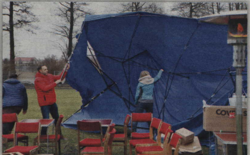
Wiatr sprawiał trudności nie tylko biegaczom, ale także organizatorom.

Bieg „Tropem Wilczym” to największa otwarta impreza sportowo-rekreacyjna towarzysząca obchodom Narodowego Dnia Pamięci „Żołnierzy Wyklętych”. W tym roku odbyła się 26 lutego, a biegacze rywalizowali nie tylko w Polsce, ale także w Londynie, Żytomierzu (Ukraina), Wilnie, Nowym Jorku czy Chicago. Łącznie, w zawodach organizowanych przez Fundację Wolność i Demokracja, wzięło udział 60 tys. osób.