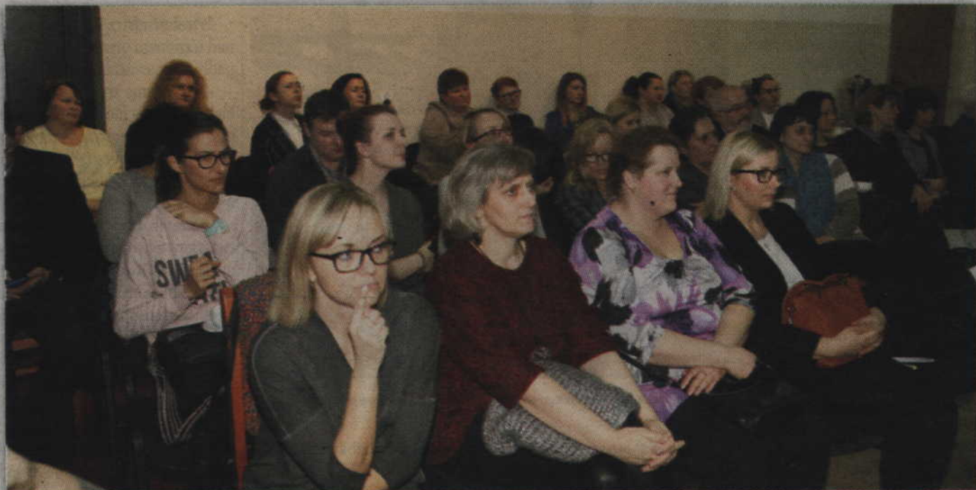
Na sesję dotyczącą oświaty przyjechało kilkudziesięciu nauczycieli z Wandowa, Cygan, Moraw, Ołtowa, Czarnego Dolnego i Trumiej.