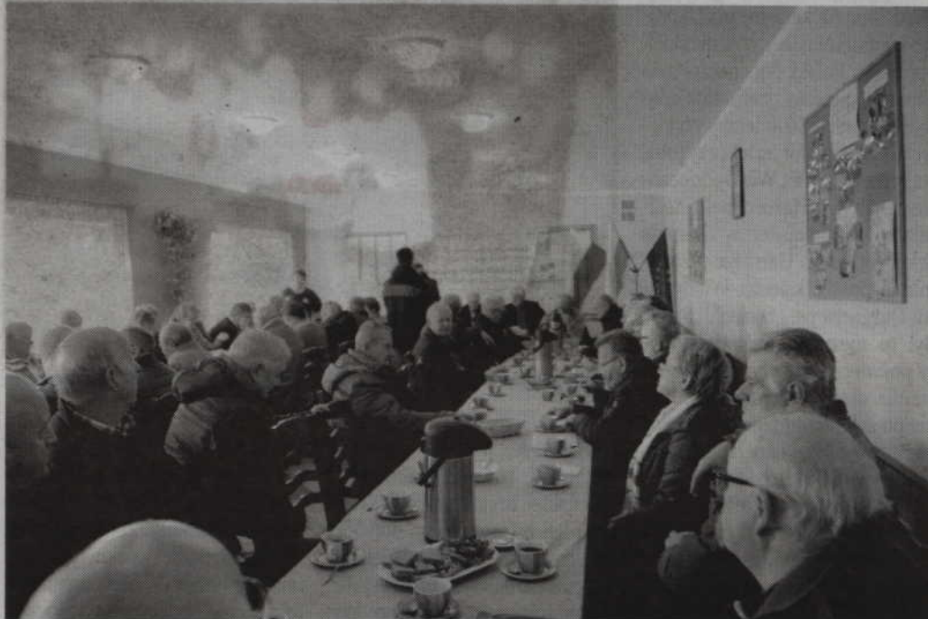
W konferencji wzięło udział 51 delegatów.

-Warto wspomnieć, że ogrody utrzymują się z własnych opłat ogrodowych, wspomagane dotacjami na inwestycje i remonty z funduszy Okręgowego Zarządu i Krajowej Rady PZD. Po wejściu w życie nowej ustawy o ROD z 13 grudnia 2013 roku, mogą jednak sięgać też po fundusze UE i powinny być wspierane z budżetów lokalnych.