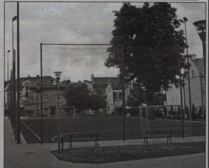
Skontrolowany zostanie stan wszystkich urządzeń na boiskach i placach zabaw.

Roman Bera, wiceburmistrz miasta, zapowiada skontrolowanie wszystkich bramek na boiskach oraz elementów placów zabaw po okresie zimowym. Wiceburmistrz podkreśla, że sprawy związane z bezpieczeństwem dzieci i młodzieży są absolutnym priorytetem.