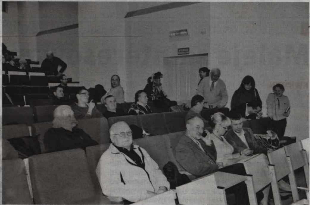
W spotkaniu wzięli udział nie tylko zawodowi pszczelarze, ale również miłośnicy tych pożytecznych owadów.