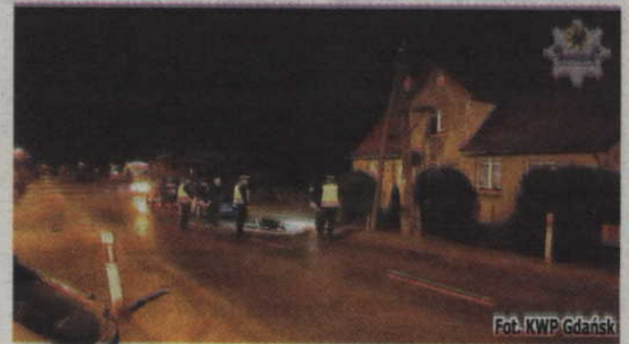
Fot. KWP Gdańsk

W piątek wieczorem po godzinie 19-tej dyżurny sztumskiej Policji odebrał zgłoszenie, że w miejscowości Stare Miasto doszło do potrącenia pieszego. Na miejsce natychmiast zostali skierowani policjanci ruchu drogowego, którzy zabezpieczyli miejsce zdarzenia. Pracujący na miejscu wypadku funkcjonariusze wstępnie ustalili, że 80-letni kierowca samochodu potrącił pieszego, który prawdo-