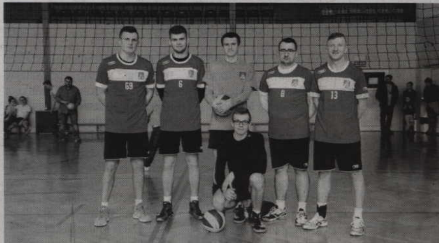
W finale gospodarze pokonali drużynę ASiMP Prabuty

REKREACJA. Zespół „Black Team” Sadlinki zwyciężył w I Amatorskim Powiatowym Turnieju w siatkówce. W zawodach rozegranych w hali sportowej Zespołu Szkół w Sadlinkach rywalizowało sześć drużyn.