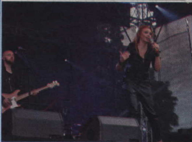
Dni Kwidzyna odbędą się w trzeci weekend czerwca.

Od 16 do 18 czerwca odbędą się tegoroczne Dni Kwidzyna. Podobnie jak w roku ubiegłym nie zabraknie gwiazd oraz innych atrakcyjnych propozycji dla mieszkańców miasta.