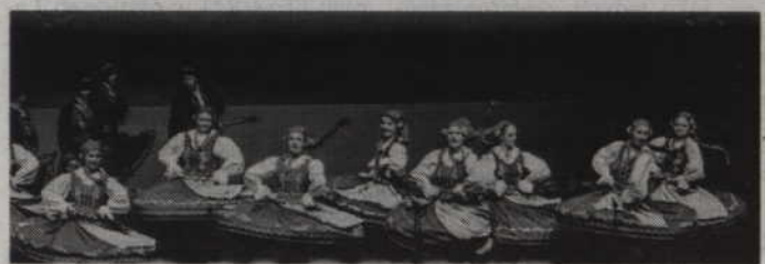
red tech. KG

KWIDZYN. Kwidzińskie Centrum Kultury zaprasza na koncert wiosenny Zespołu Pieśni i Tańca „Powiśle”. Koncert odbędzie się w kwidzińskim teatrze już w najbliższą niedzielę, 19 marca o godz. 17.00. Bilety, w cenie 5 zł, nabywać można w kasie teatralnej lub na stronie www.kck.ckj.edu.pl. (fox)