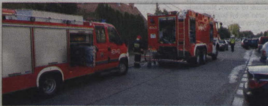
W ubiegłym roku strażacy z PSP w Kwidzynie interweniowali 717 razy.