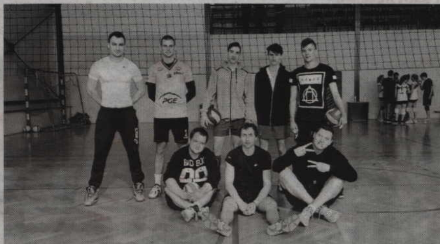
Trzecią lokatę w turnieju wywalczyli „Ziomale” z Kwidzyna.

Jako ciekawostkę można dodać, że podczas imprezy zarów-