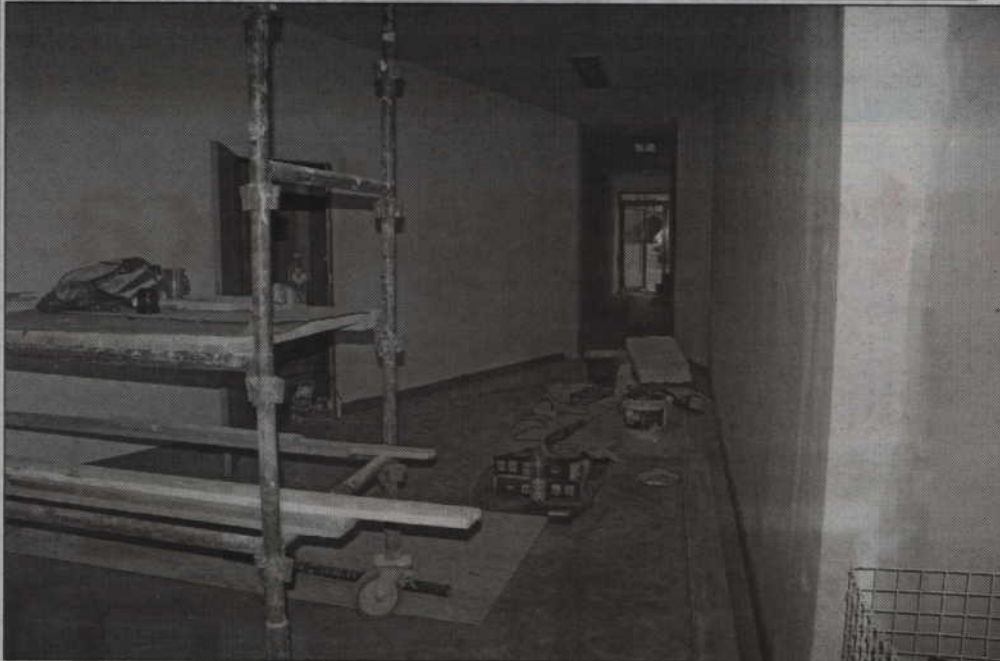
Dobiega końca budowa przejścia, które połączy parkink przy Starostwie Powiatowym z targowiskiem przy ul. Kopernika.

Dobiega końca budowa pasaży, który połączy miejsca do parkowania z gmachem Starostwa Powiatowego przy ul. Kościuszki z terenem targowiska przy ul. Kopernika. Dzięki niemu nie będzie potrzeby parkowania przy samym targowisku.