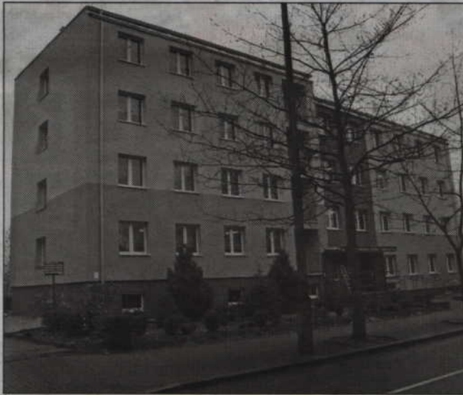
Świadczenie jest realizowane w Miejskim Ośrodku Pomocy Społecznej w Kwidzynie przy ul. Grudziądzkiej 6.

Program Rodzina 500+, to świadczenie wychowawcze, które jest wypłacane w wysokości 500 zł mie-