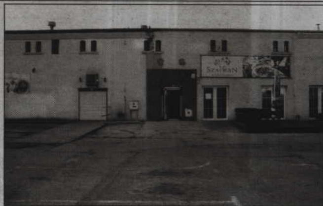
Dzięki przejściu będzie można zostawić samochód na parkingu przy starostwie i przejść się pasażem na teren targowiska.

Burmistrz zachęca także do korzystania z nowych parkingów na terenie byłej jednostki wojskowej przy ul. Grudziądzkiej. Z parkingu na teren targowiska jest bardzo blisko i trzeba bezskutecznie szukać miejsca do parkowania