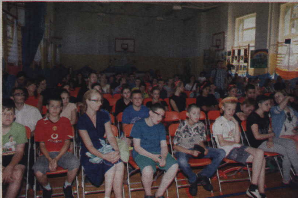
Poprawka mówiąca o przekształceniu gimnazjum działającego w ramach ZSS w Kwidzynie w ośmioklasową szkołę podstawową została odrzucona.

-Dotyczyć to będzie tylko nauczycieli zatrudnianych w pełnym wymiarze czasu pracy, a obowiązek ten ma spowodować uwolnienie miejsc pracy dla nauczycieli gimnazjów. Kolejny zapis mówi, że liczba uczniów przypadających na jeden etat pedagoga, psychologa lub logopedy, czyli specjalistów nielekcyjnych, nie może być wyższa niż liczba przypadająca na