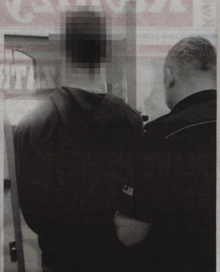
(fox) Zatrzymanemu mężczyźnie grozi do 12 lat więzienia.

W poniedziałek, 6 marca, mężczyzna został zatrzymany i trafił do policyjnego aresztu. Jest nim 26-letni mieszkaniec Kwidzyna. Zgromadzony materiał dowodowy pozwolił policjantom na przedstawienie podejrzanemu zarzutu rozboju. Za to przestępstwo kodeks karny przewiduje karę nawet do 12 lat pozbawienia wolności.