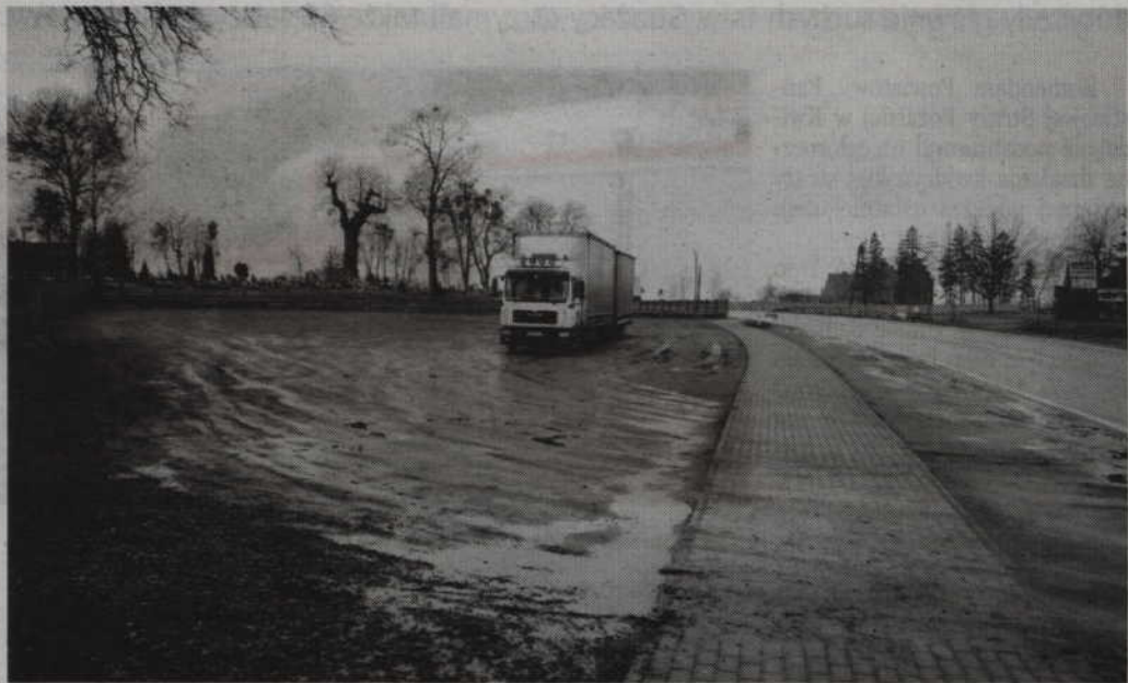
Na placu w pobliżu cmentarza wbrew przepisom parkują samochody.

Plac w pobliżu cmentarza to nie jest parking dla samocho-