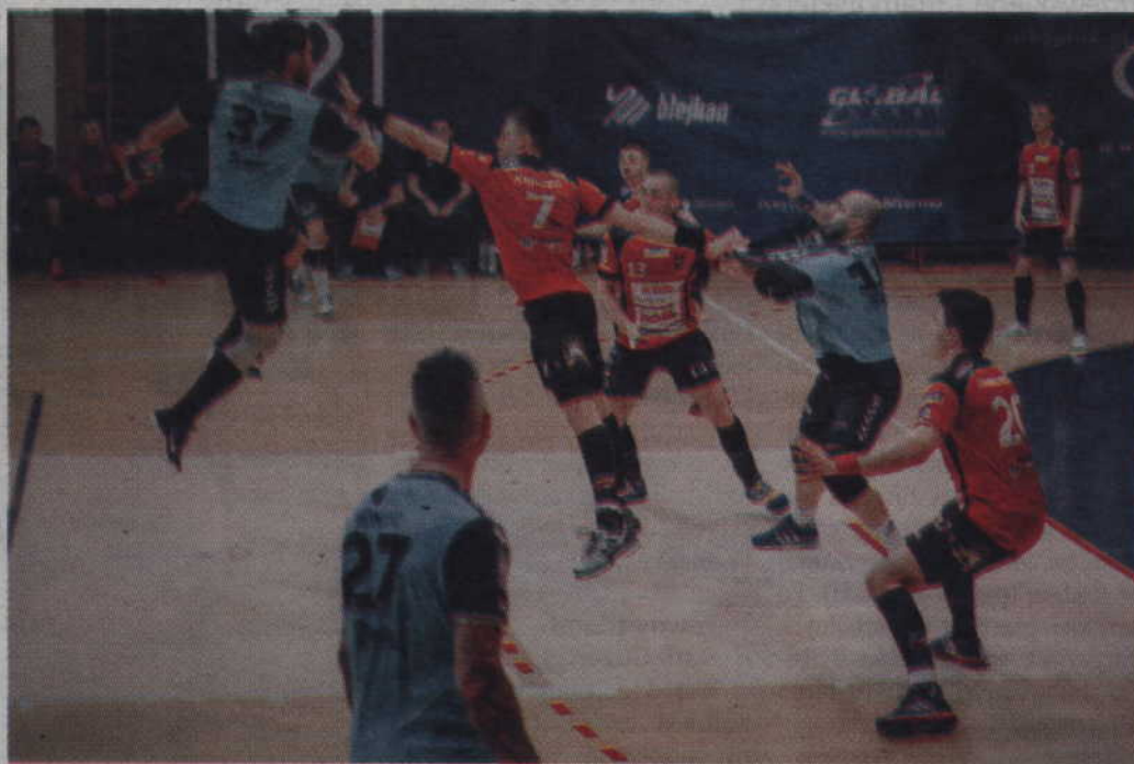
Czerwono-czarni nie zdołali powstrzymać ataków Pogoni. W efekcie komplet 3 punktów pozostał w Szczecinie.

To będzie trudny okres dla szczypiornistów MMTS Kwidzyn. W najbliższym tygodniu kwidzynianie rozegrają bowiem trzy mecze ligowe, grając w odstępie 3 dni. Pierwsze spotkanie MMTS zagra już dziś - we środę, 15 marca o godz. 18.00, a rywalem czerwono-czarnych będą piłkarze Zagłębia Lubin. Trzy dni później, w sobotę, 18 marca o godz. 13.00, kwidzynianie podejmą Chrobrego Głogów. We wtorek 21 marca zmierzą się natomiast w wyjazdowym starciu z Vive Tauron Kielce.