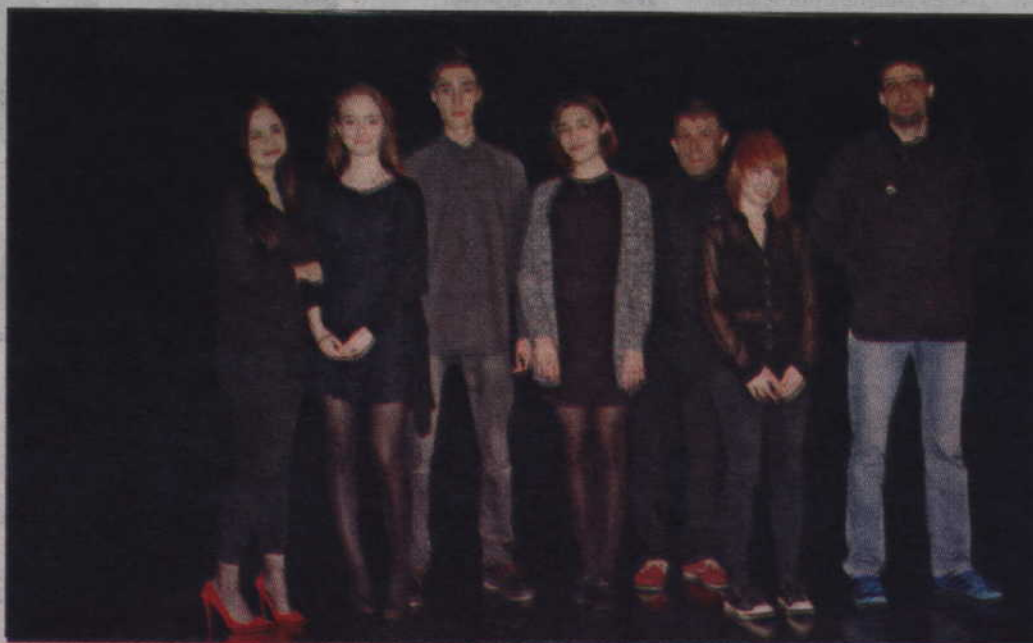
Uczestnicy etapu powiatowego Ogólnopolskiego Konkursu Recytatorskiego.