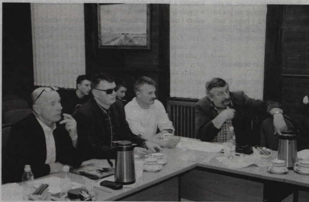
Prabucy radni podjęli uchwałę, która jest początkiem reformy oświaty.

-Mamy też świadomość tego, że w środku miasta do zagospodarowania jest duży obiekt. Do tego dochodzi duża liczba nauczycieli przygotowanych do pracy z dziećmi. Przeniesienie czterech oddziałów do budynku gimnazjum daje szansę na zapewnienie pracy zatrudnionym tam nauczycielom. W najbliższych dwóch latach nie będzie obniżenia etatów w szkołach w Rodowie i Trumiejkach. Problem pojawia się z perspektywy gminy dopiero w roku szkolnym 2019/20. Ubędzie nam jeden rocznik czyli 200 dzieci i sześć oddziałów. To jest ta zniżka w wyniku reformy oświaty. Oprócz tego, w wyniku demografii, ubywają nam również dwa oddziały. Trzeba uczciwie sobie powiedzieć, że obydwa te czynniki się zsumują i stoimy