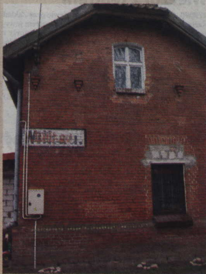
24 stycznia 1945 roku niemieckie natarcie zostało powstrzymane przez Rosjan w okolicach dworca kolejowego w Wilkowie.

„Tych dwanaście dni walk w trakcie wycofywania się - pisał major Keller - pełnych niepewności i z nieustannie zmieniającą się sytuacją, zmusiło wszyst-