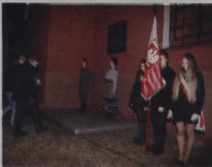
Cześć bohaterom sprzed lat oddali także samorządowcy.

O WOLNĄ POLSKĘ WALCZYŁO OKOŁO 200 TYS. ŻOŁNIERZY