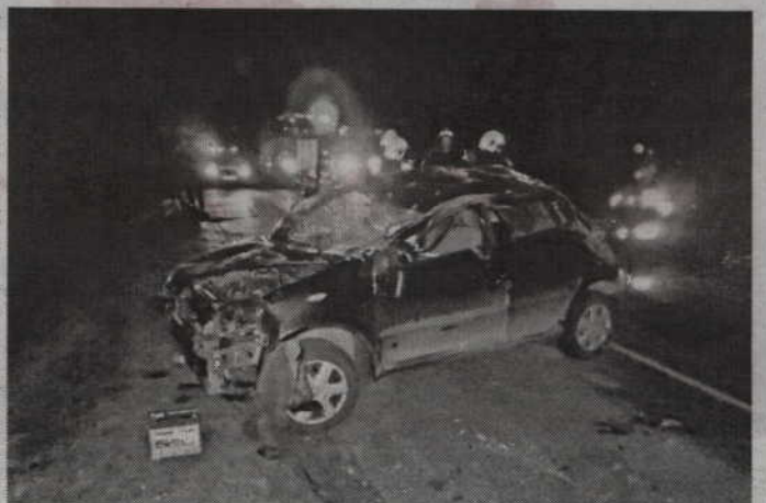
(jk) Nagłe wtargnięcie zwierzęcia na jezdnię było przyczyną wypadku w Liczu.

GMINA KWIDZYN. W Liczu, na drodze wojewódzkiej Kwidzyn-Prabuty, dachował samochód osobowy marki toyota. Strażacy z Jednostki Ratowniczo-Gaśniczej z Kwidzyna oraz Ochotniczej Straży Pożarnej w Gardei ustawili pojazd na kołach, odłączyli akumulator i uprzątnęli jezdnię. Przypuszczalną przyczyną zdarzenia było nagłe wejście dzikiego zwierzęcia na jezdnię. Straty oszacowano wstępnie na ok. 9 tys. zł.