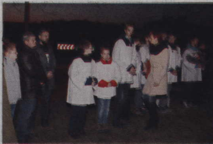
Po mszy św. odprawionej w Dużym Kościele mieszkańcy zgromadzili się przed świątynią.