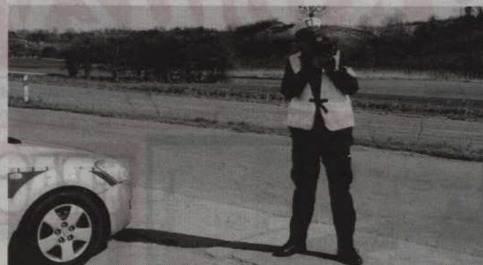
Najwięcej zgłoszeń dotyczyło przekraczania przez kierowców dozwolonej prędkości.

Najwięcej, bo 33 zgłoszenia dotyczyły przekraczania przez kierowców dozwolonej prędkości. Kolejne na liście jest nieprawidłowe parkowanie - 27 takich przypadków. Dwanaście zgło-