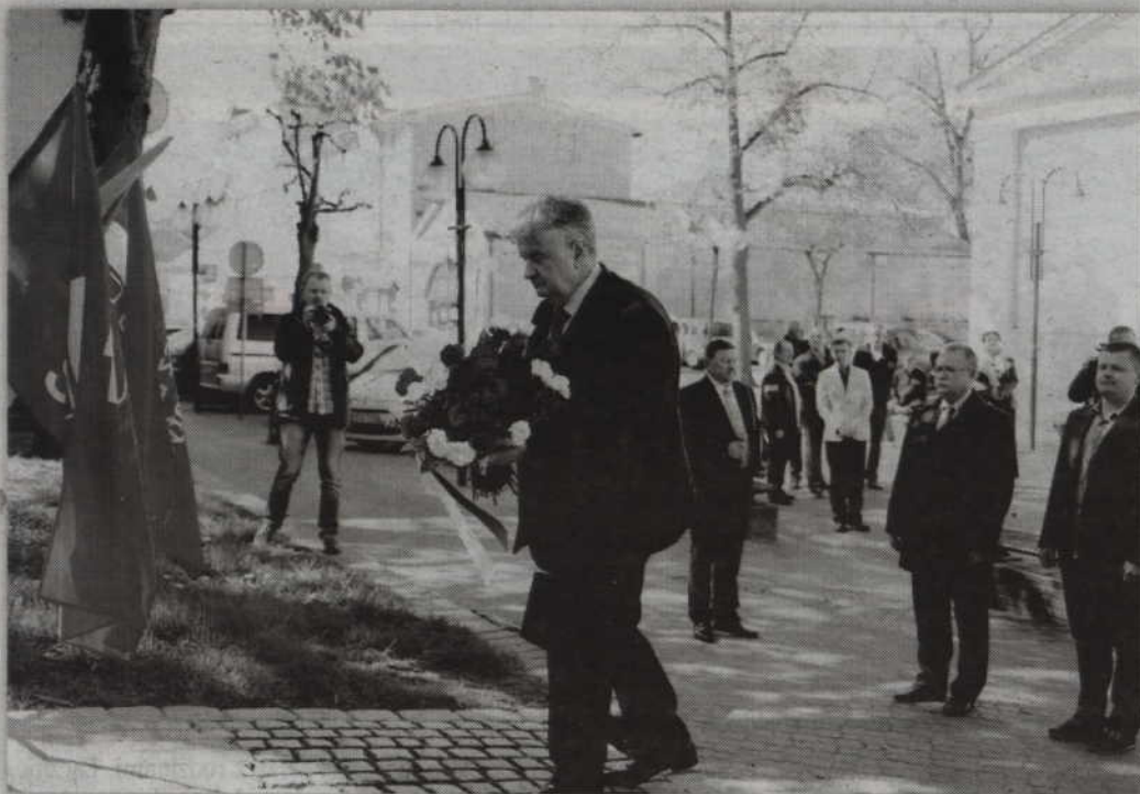
Działacze i sympatycy kwidzyńskiej Lewicy co roku spotykają się przed pomnikiem Marszałka Józefa Piłsudskiego.