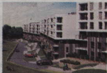
Osiedle Młoda Morena w Gdańsku od 200 tyś / 2 pokoje