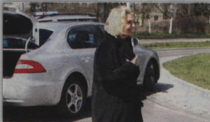
Senator RP Anna Maria Anders.