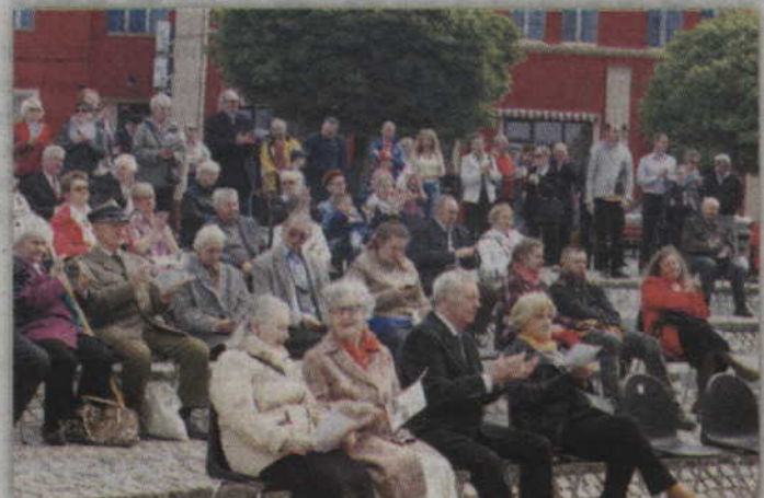
Kwidzyńskie uroczystości zakończy wspólne śpiewanie pieśni patriotycznych, które co roku odbywa się na placu Jana Pawła II.