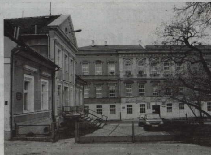
Zaproponowany przez wykonawców koszt modernizacji wyniósł więcej niż środki przewidziane na ten cel w budżecie powiatu.