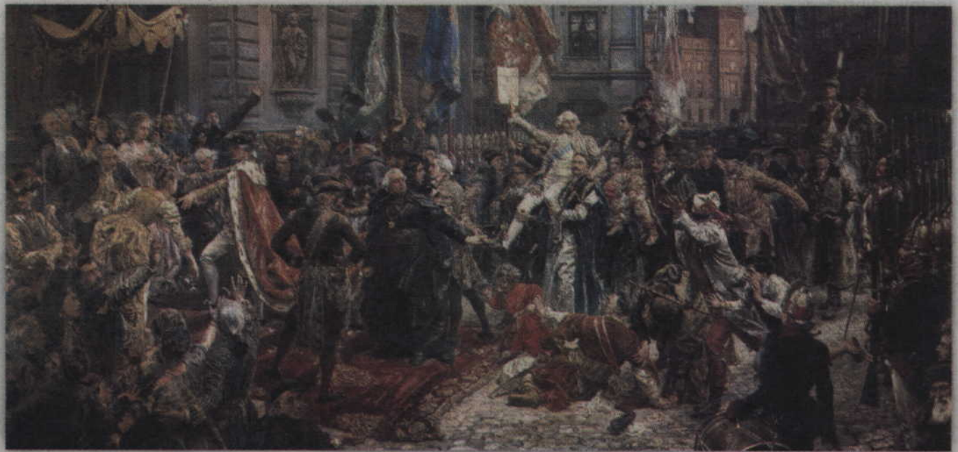
Najbardziej znanym obrazem przedstawiającym uchwalenie Konstytucji 3 Maja jest dzieło Jana Matejki.

Konstytucja przetrwała zaledwie czternaście miesięcy, a prawa które wprowadzała były nie do zaakceptowania przez warstwę magnacką. To oni obok szlachty zagrodowej stracili najwięcej. Z dniem kiedy tzw. „goło-