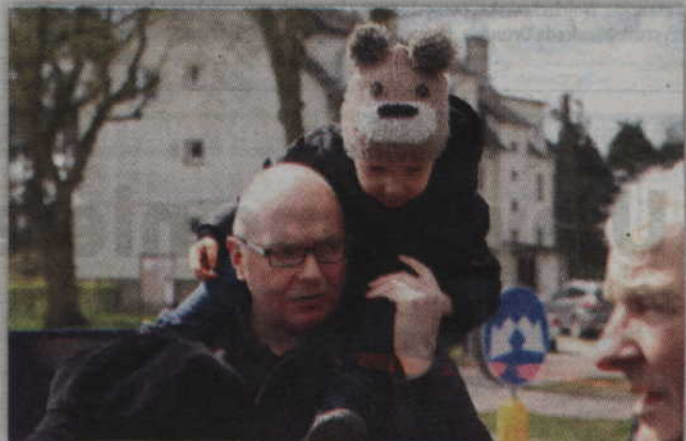
Podczas uroczystego nadania ronda nazwy nie brakowało rodziców z dziećmi.