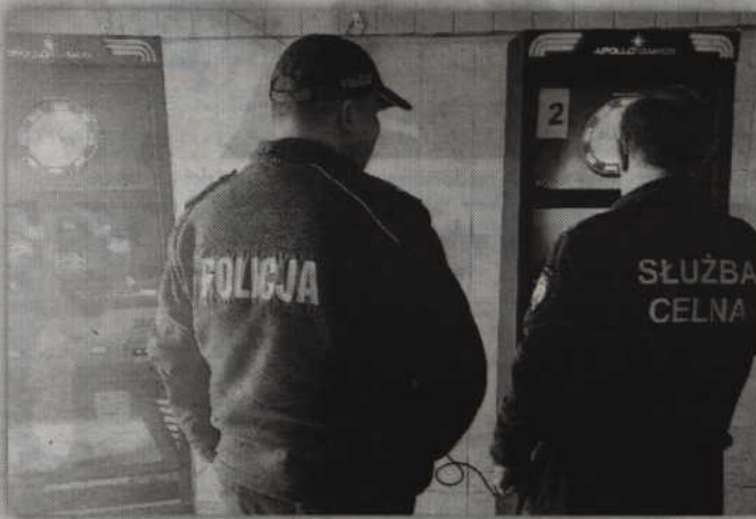
Dzięki wspólnej akcji policjantów i celników ujawniono dwie maszyny do gier działające bez zezwoleń.