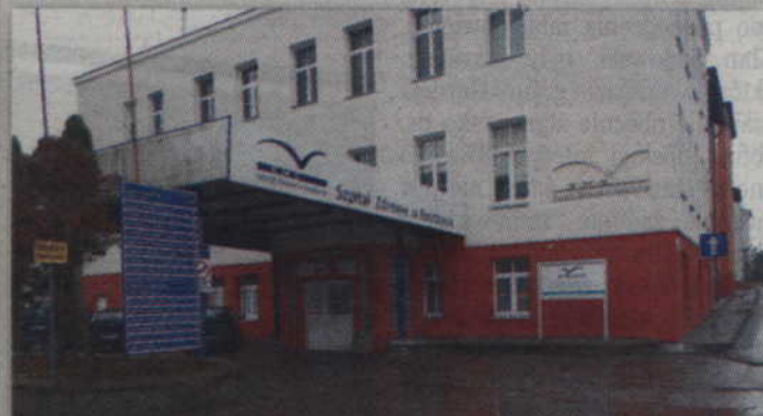
Pacjenci oddziału wewnętrznego nie zostaną pobawieni opieki. Lekarze zakończyli bożym spór z dyrekcją kwidzyńskiego szpitala.

KWIDZYN. Szpital w Kwidzynie zapewni ciągłość opieki na oddziale wewnętrznym. Po negocjacjach zarówno ordynator, jego zastępca, jak i lekarz specjalista, zadeklarowali, że będą kontynuowali swoją pracę w tym ośrodku. Spór medyków z dyrekcją szpitala został zatem zakończony i pacjenci nie zostaną pozostawieni opieki.