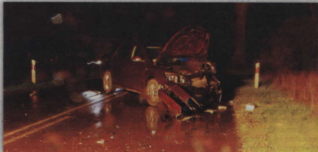
Pijany kierowca skody wyszedł z wypadku bez szwanku.