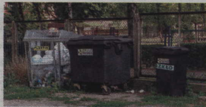
Zgodnie z obowiązującym prawem, takie pojemniki będą musiały zniknąć z naszego krajobrazu. Do 30 czerwca 2022 r. zastąpią je kontenery w pięciu kolorach.

Resort wprowadził również pięcioletni okres przejściowy na wprowadzenie nowych pojemni-