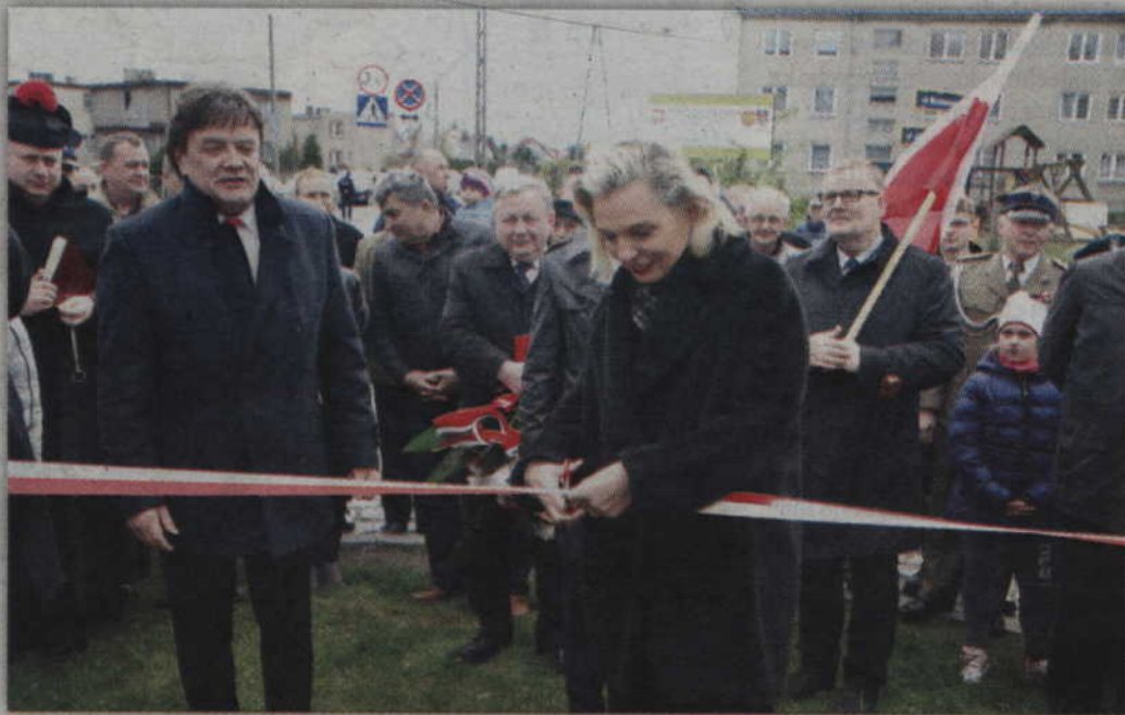
To była historyczna chwila, biało-czerwoną wstęgę przecięła córka generała Andersa.