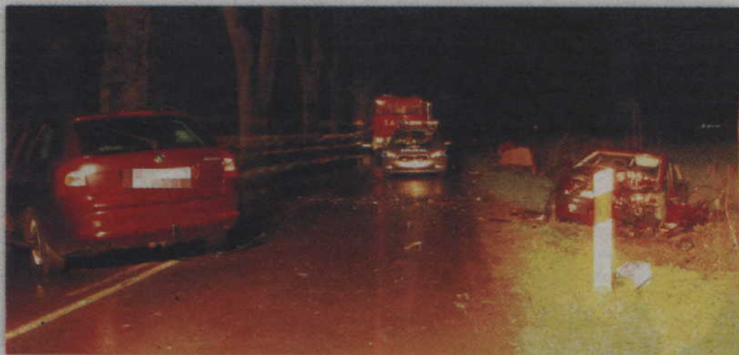
Do wypadku doszło na drodze nr 521, na wysokości Górek.

GMINA KWIDZYN. Pijany kierowca skody octavii stracił panowanie nad autem i czołowo uderzył w jadącego prawidłowo opla astrę. W wyniku wypadku do szpitala trafili podróżujący oplem: 26-letni kierowca i 18-letnia pasażerka, będąca w zaawansowanej ciąży. Niestety lekarzom nie udało się uratować dziecka.