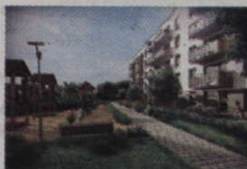
Osiedle Zielone w Gdańsku od 185 tyś / 2 pokoje