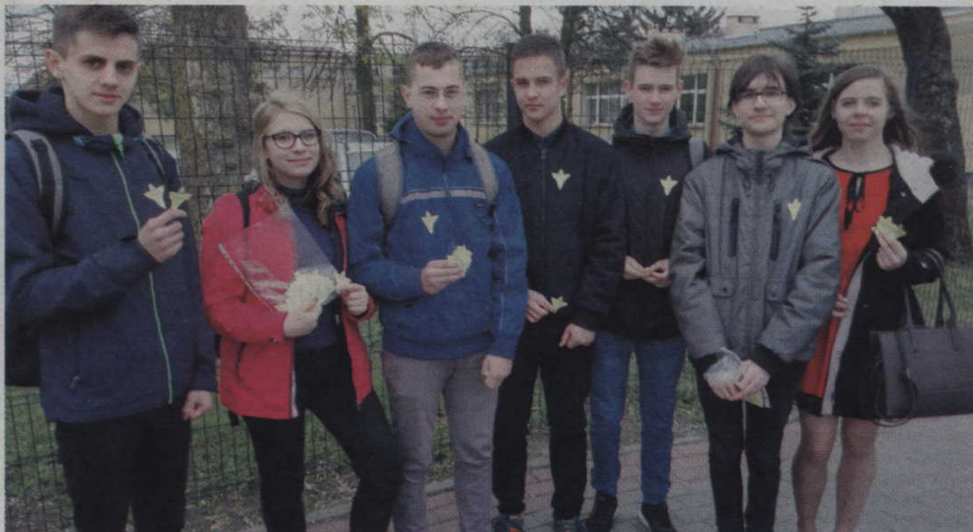
Papierowe żonkile rozdawali uczniowie I TB z Centrum Kształcenia Zawodowego i Ustawicznego w Kwidzynie.

-Chodzimy ulicami miasta i jeśli kogoś spotkamy to wręczamy mu powycinane wcześniej