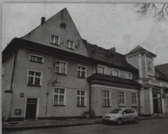
Za dwa lata dworzec w Prabutach zmieni całkowicie swoje oblicze.

Dworzec w Tczewie to obiekt, który powstał w 1949 roku. Tam prace będą polegać m.in. na poprawie wizerunku, estetyki, standardu oraz układu funkcjonalno-przestrzennego. W wyniku przebudowy powinno nastąpić usprawnienie ruchu podróżnych na trasie hol główny – kładka piesza. Celem przebudowy jest