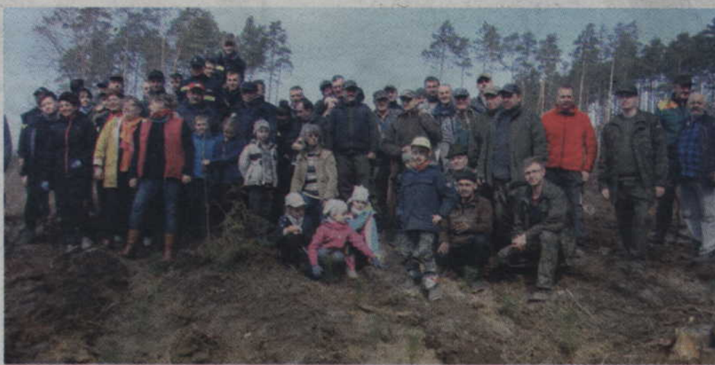
W kwietniowej akcji sadzenia lasu wzięło udział ok. 335 osób.

rak, Daniel, Odynec i Darz Bór. Od kilku lat w akcji sadzenia lasu uczestniczą także strażacy ochotnicy. Przykładem tego są strażacy zrzeszeni w jednostkach OSP działających na terenie gminy Sadlinki. Nie mogło zabraknąć także członkini kół gospodyń wiejskich.