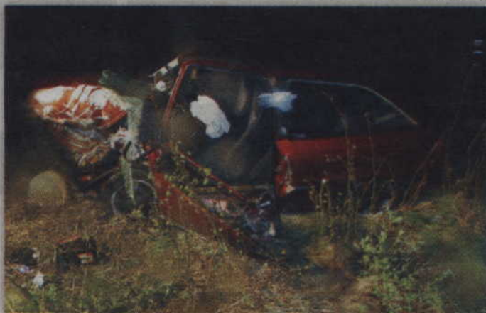
Zniszczona astra wylądowała na poboczu drogi.

- Ze wstępnych ustaleń funkcjonariuszy wynika, że 49-latek kierujący skodą octavią, jadąc w kierunku Kwidzyna, zjechał na pas ruchu przeciwnego i zderzył się czołowo z jadącym prawidłowo oplem astrą. Astrą podróżował 26-letni mieszkaniec powiatu kwidzyńskiego i 18-letnia kobieta w siódmym miesiącu ciąży. W wyniku wypadku, ze złamaniem obu nóg i ręki, do szpitala przewieziony został kierowca opla oraz jego ciężarna pasażerka,