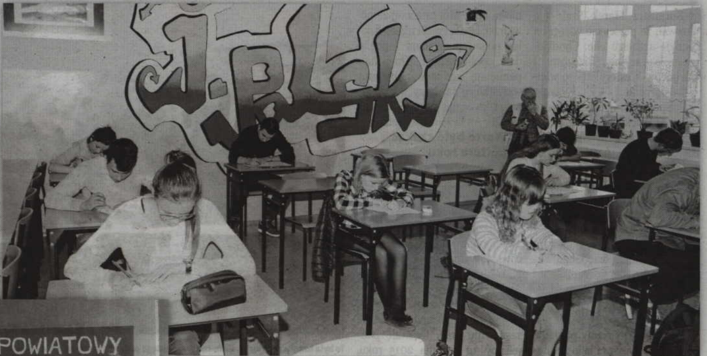
Uczestnicy Powiatowego Konkursu Wiedzy o Niemczech próbowali odpowiedzieć na 100 pytań dotyczących Niemiec.

- Kolejny rok wspieramy organizację tego konkursu. W tym roku dla uczniów ufundowaliśmy trzydniowy wyjazd do Niemiec, z którego skorzystają laureaci pierwszych pięciu miejsc w konkursie. Jesteśmy w trakcie przygotowań wycieczki i jeszcze