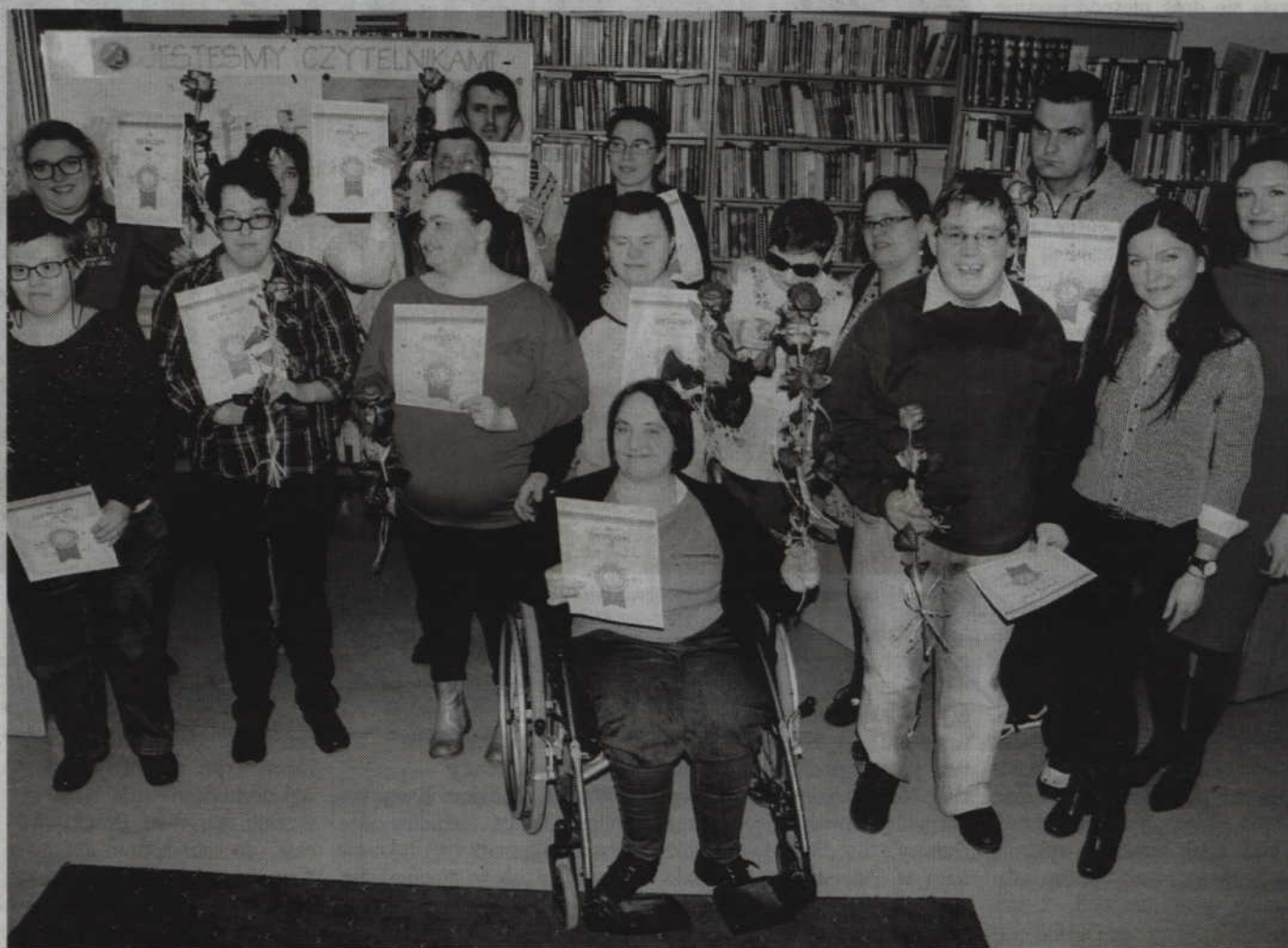
Uczestnicy biblioterapii nagrodzeni zostali kwiatami oraz pamiątkowymi dyplomami.

Warto dodać, że filia nr 2 posiada nie tylko tradycyjne książki, ale także na płytach CD (także w formacie mp3), przeznaczone m.in. dla osób niewidomych i słabo widzących. Ze zbiorów biblioteki