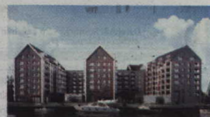
Apartamenty hotelowe z gwarancją stałego dochodu na Wyspie Spichrzów