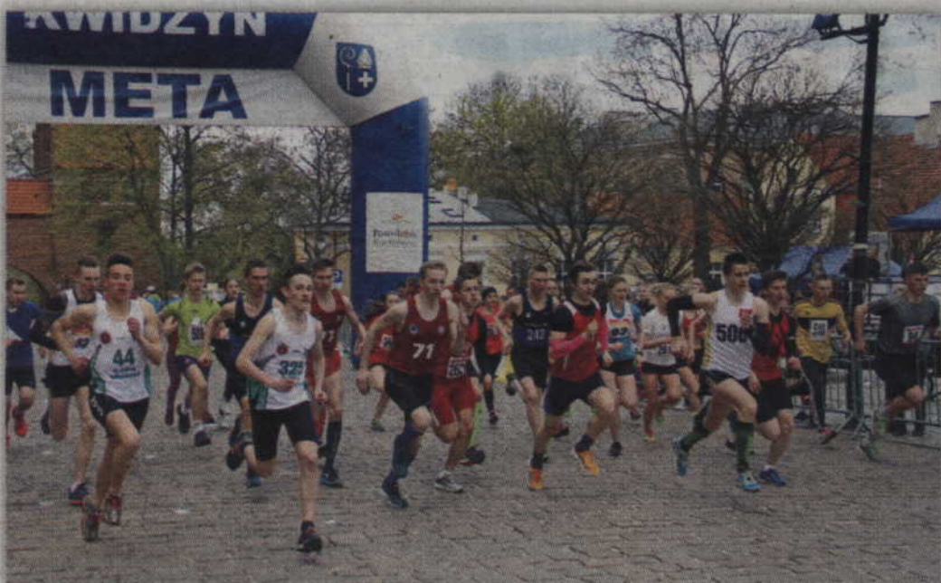
Uczestnicy zawodów rywalizować będą na czterech dystansach: 600, 700, 1100 i 2000 metrów.

BIEGI. Kwidzyński Klub Lekkoatletyczny „Rodło” zaprasza na XIV Ogólnopolski Bieg Unijny oraz XII Bieg Osób Niepełnosprawnych. Zawody odbędą się w najbliższą niedzielę, 30 kwietnia (początek godz. 12.00) a start i meta ponownie umiejscowione zostaną na Placu Jana Pawła II.