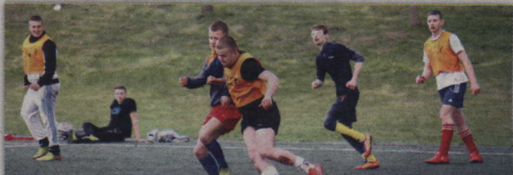
W finale rywalizacji w Grupie Starszej „Dzieci Gorszego Boga” pokonały ekipę „Power Rangers”.

Podczas podsumowania wręczono nagrody najlepszym drużynom w każdej z kategorii. Wszyscy uczestnicy otrzymali także pamiątkowe koszulki, tym razem koloru białego. (fox)