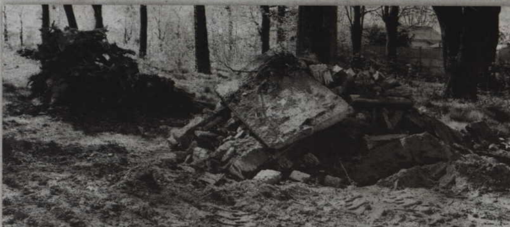
Z resztek grobowców, tablic z imionami i nazwiskami spoczywających na cmentarzu ludzi oraz kamieni usypano dużą hałdę.