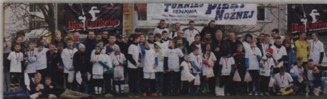
W tegorocznych wiosennych rozgrywkach wzięło udział 29 zespołów.

PIŁKA NOŻNA. Drużyny „Black Lion” oraz „Dzieci Gorszego Boga” wygrały 24 Osiedlowy Turniej Piłki Nożnej organizowany przez PSM „Renawa”. Tym razem do rywalizacji zgłosiło się 29 drużyn, z czego przeważającą większość stanowili zawodnicy z grupy starszej. Czterodniowa rywalizacja piłkarska zakończyła się finałem zorganizowanym w niedzielę, 30 kwietnia.