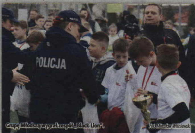
Grupa Młodsza wygrał zespół „Black Lion”.

Zwycięzcą Grupy Starszej została ekipa „Dzieci Gorszego Boga”, który w finale pokonał ekipę „Power Rangers”. Trzecią lokatę zajęli „Niepokromione Lwy”, które w bezpośrednim pojedynku ograli „Awanturników”.