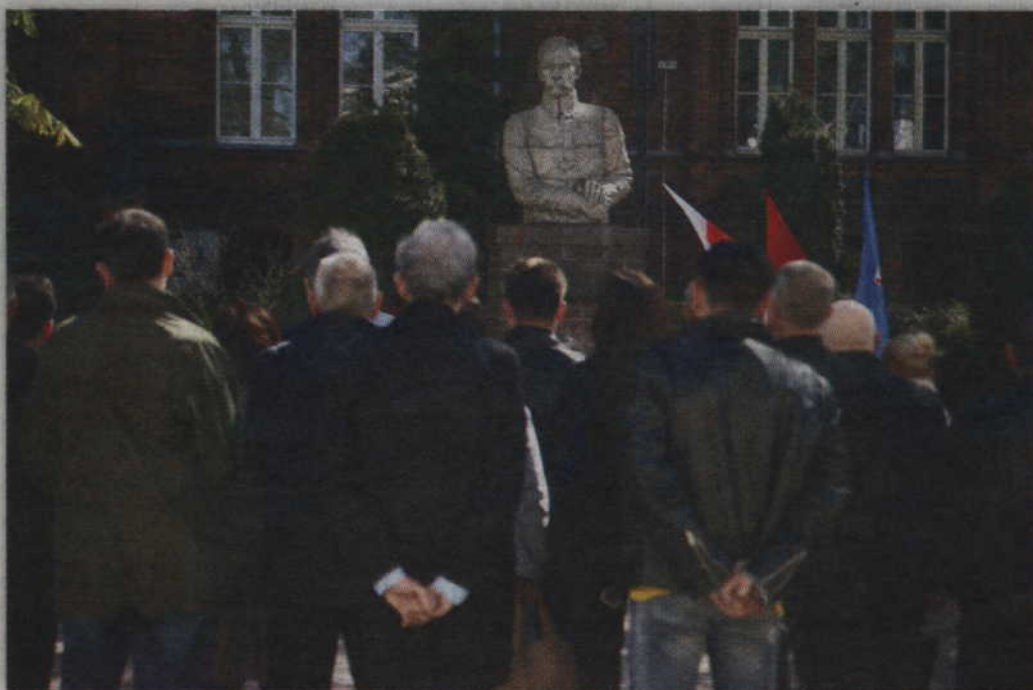
Kwidzyńska Lewica od lat obchodzi Święto Pracy spotkaniem przed pomnikiem Józefa Piłsudskiego.