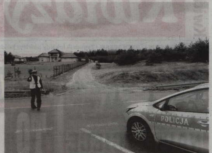
Najwięcej zgłoszeń dotyczyło przekraczania dozwolonej prędkości.

-To, że jakieś zgłoszenie na mapie zostało przez funkcjonariuszy potwierdzone, nie oznacza jednak, że praca Policji w tej sprawie i w tym momencie się kończy. To tak naprawdę początek. Jeżeli jakieś zgłoszenie zostało potwierdzone, policjanci podejmują wszelkie działania