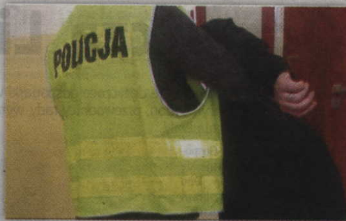
Trzej mężczyźni najbliższe 3 miesiące spędzą w areszcie.