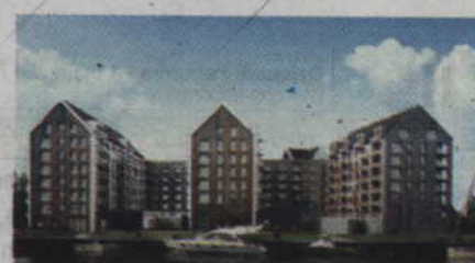
Apartamenty hotelowe z gwarancją stałego dochodu na Wyspie Spichrzów