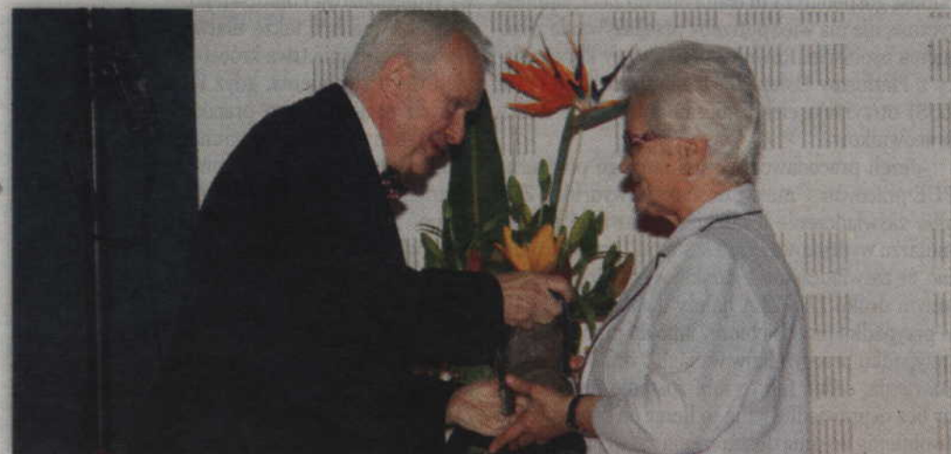
Nagrodę starosty otrzymał także Samodzielny Klub Seniora w Ryjewie.