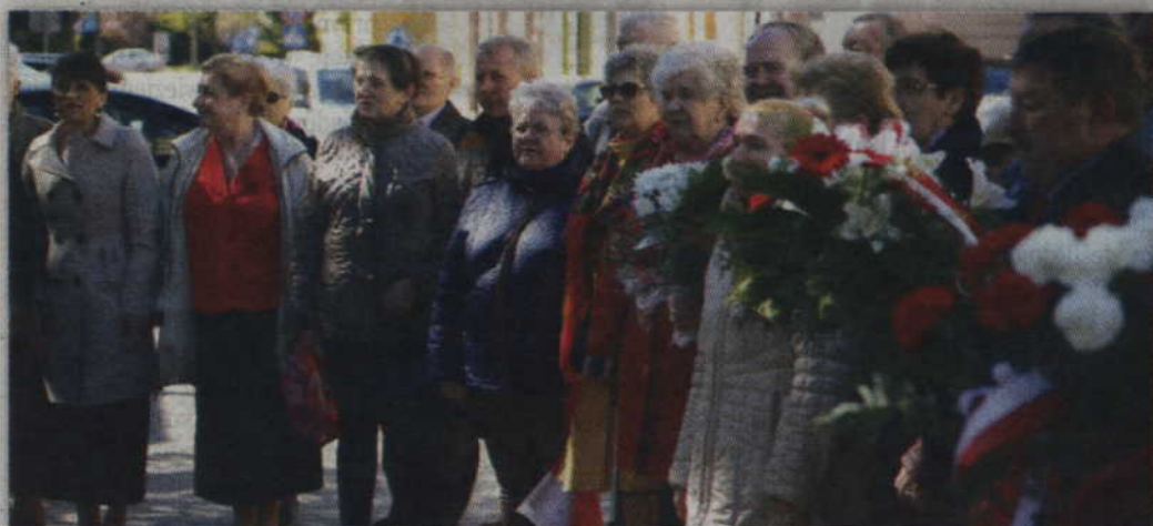
1 maja na deptaku zgromadzili się kwidzyńscy działacze oraz sympatycy Lewicy.