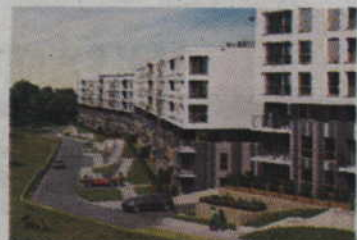
Osiedle Młoda Morena w Gdańsku od 200 tyś / 2 pokoje