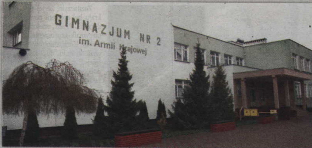
Najwięcej środków trafi do Gimnazjum nr 2, gdzie zgodnie z zapowiedziami będzie przeprowadzonych najwięcej prac.