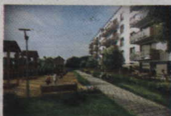
Osiedle Zielone w Gdańsku od 185 tyś / 2 pokoje