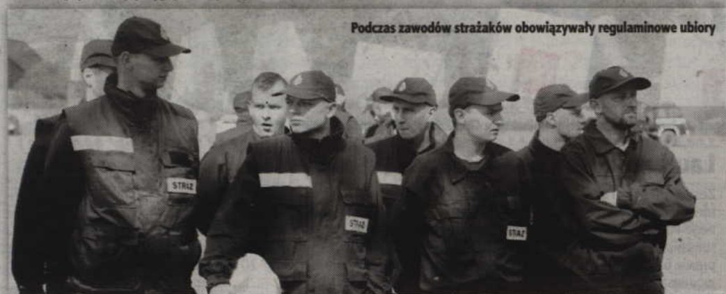
Podczas zawodów strażaków obowiązywały regulaminowe ubiory