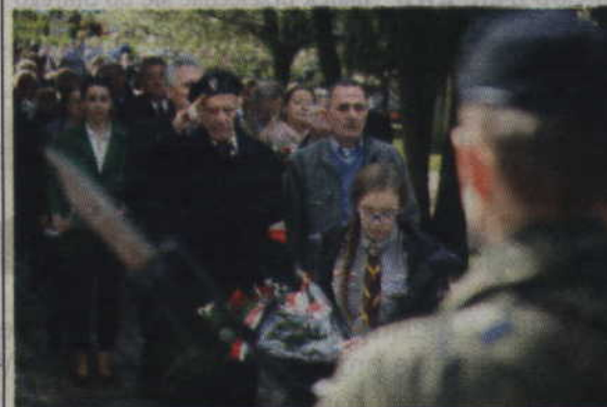
Delegacje złożyły kwiaty na Grobie Nieznanego Żołnierza.