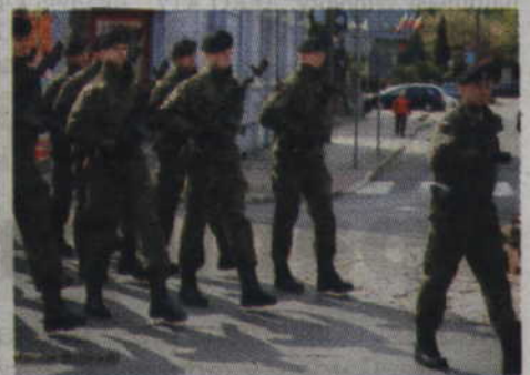
Kolorytu uroczystościom dodawał udział Kompanii Honorowej Batalionu Rozpoznania z 9 Brygady Kawalerii Pancernej z Braniewa.