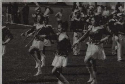
Występ mażorettek i Orkiestry Dętej „Helikon” uświetnił tegoroczne obchody święta Konstytucji 3 Maja.