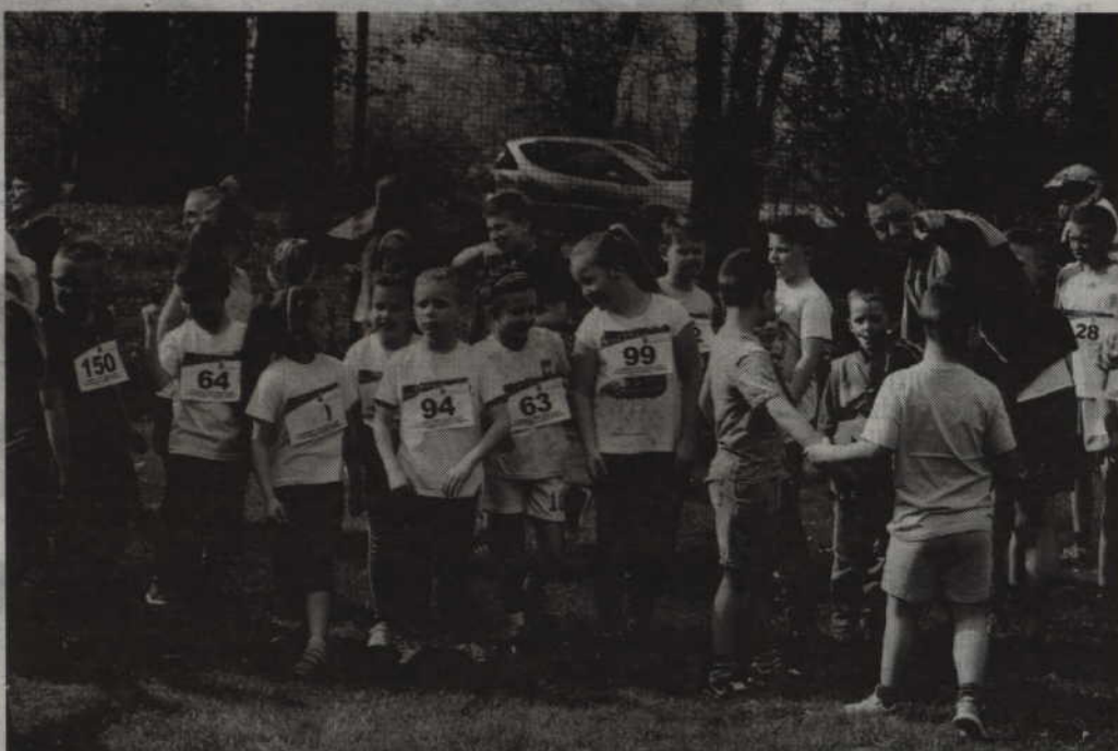
Ostatnie uwagi taty przed biegiem.

ścigali się uczniowie klas IV – VI szkoły podstawowej. Trasę 2 km mieli do przebiegnięcia gimnazjaliści. Na koniec rozegrano natomiast główny bieg na dystansie 10 kilometrów. Na starcie stanęło 40 zawodników. Wśród ko-