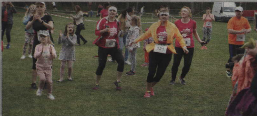
Wspólna rozgrzewka przed biegiem.

było dla nich dużym sukcesem. Niebawem ponownie zawiążą do powiatu kwidzyńskiego, bowiem wezmą również udział w zbliżającym się kwidzyńskim Biegu Papiernika.