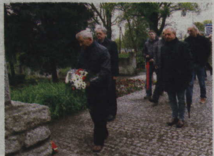
Najpierw działacze SLD złożyli kwiaty na cmentarzu żołnierzy radzieckich.

Działacze kwidzyńskiego SLD przypomnieli, że ustawa z 2015 roku zniosła wcześniejsze Święto Zwycięstwa i Wolności przypadające na 9 maja. Obchodzony dzień wcześniej Narodowy Dzień