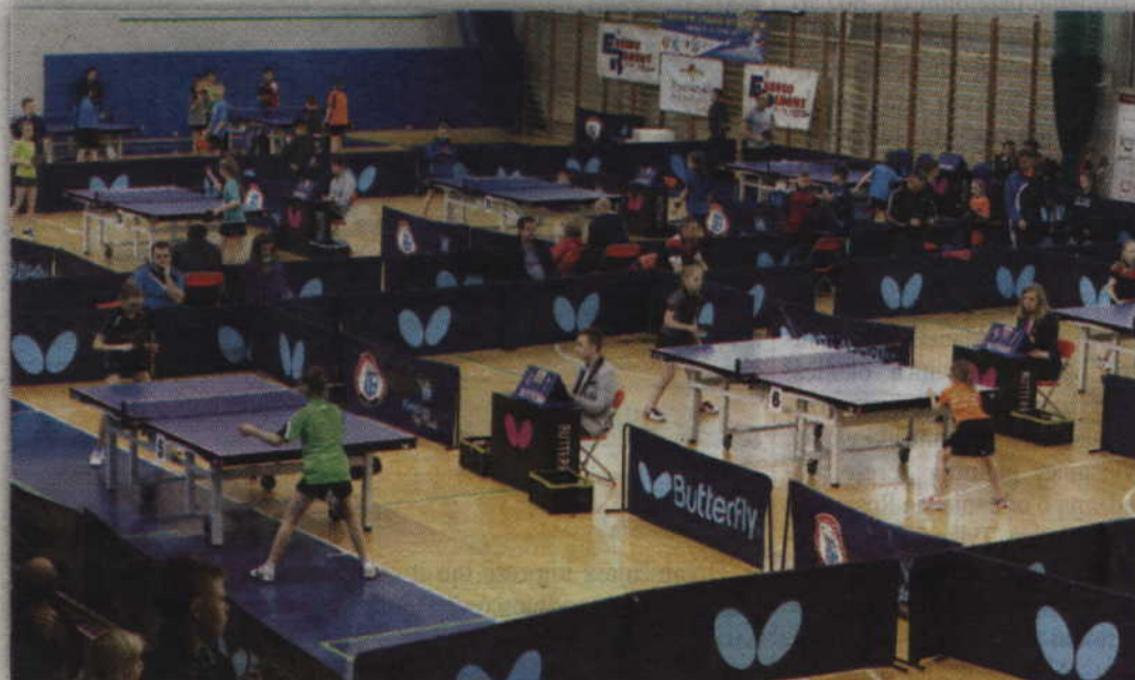
W kwidzińskim turnieju GP Polski żaków wystąpiło 167 najlepszych graczy w tej kategorii wiekowej.