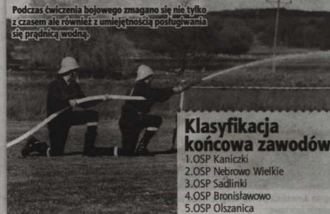
Podczas ćwiczenia bojowego zmagano się nie tylko z czasem ale również z umiejętnością posługiwania się prądnicą wodną.