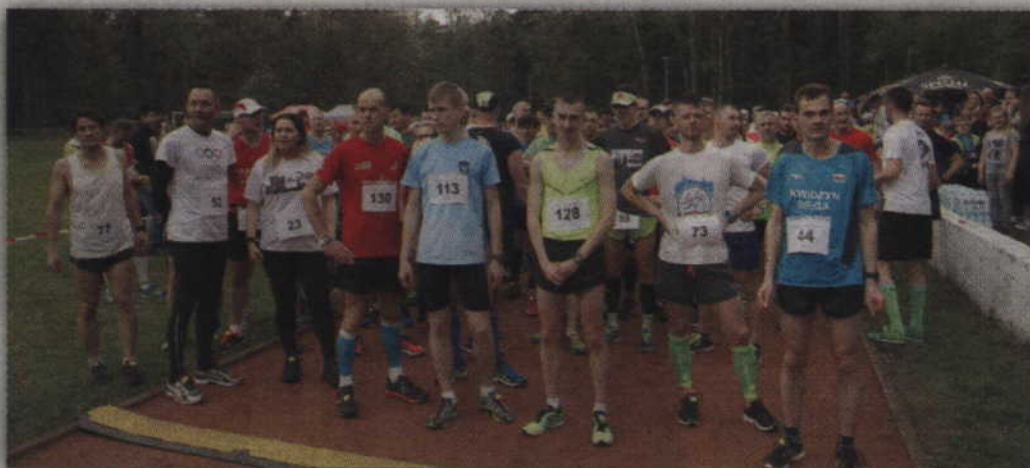
Na linii startu stanęło 126 biegaczy.

- Wrażenia zawodników po ukończonym biegu były bardzo pozytywne, co nas, jako organizatorów, bardzo ucieszyło. Pogo-