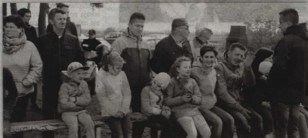
Strażackiej rywalizacji przyglądała się też publiczność.