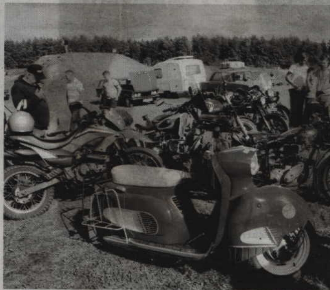
Tegoroczny zlot rozpocznie się na parking przy kwidzyńskim urzędzie miasta, po czym przeniesie się na tor motocrossowy w Bądkach.

KWIDZYN. Po raz szósty miłośnicy motoryzacji spotkają się w Kwidzynie na zlocie pojazdów zabytkowych i ciekawych. W najbliższą niedzielę - 14 maja, od godz. 10.00, na parking przy Urzędzie Miejskim będzie można podziwiać nie tylko zabytkowe, ale także nietypowe pojazdy. Organizatorem zlotu jest sekcja Miłośników Zabytkowych Pojazdów Kwidzyńskiego Klubu Motorowego.