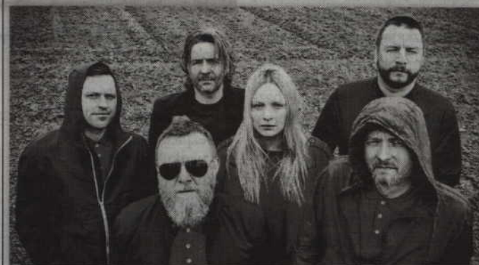
Gwiazdą wieczoru będzie zespół Hey.

oraz całych rodzin, na stadionie miejskim w Kwidzynie, czekać będzie ogrom atrakcji. Wśród nich m.in. zjeżdżalnie, zabawki dmuchane, karuzele i malowanie buziek. Uczestnicy wspólnego świętowania będą mogli wysłać „wiadomość do przyszłości”, która w specjalnie przygotowanej kapsule czasu odbędzie swą podróż do przyszłych pokoleń. Stowarzyszenie „Eko-Inicjatywa” zaprosi na rodzinne warsztaty ekologiczne oraz czerpanie papieru. Lubiący historię będą mogli pojechać zabytkowym „ogórkiem” na wycieczkę do fabryki International Paper – Kwidzyn oraz na jubileuszową wystawę poczytać o dokonaniach firmy w ciągu minionego ćwierćwiecza. W trosce o zdrowie zapewnimy także konsultacje medyczno-edukacyjne, w tym badanie składu masy ciała, konsultacje z dietetykiem i specjalnie dla pań możliwość wykonania bezpłatnej mammografii.