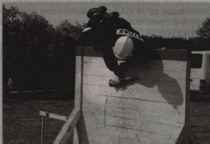
Pokonanie toru przeszkód wymagało od strażaków dobrej kondycji fizycznej.