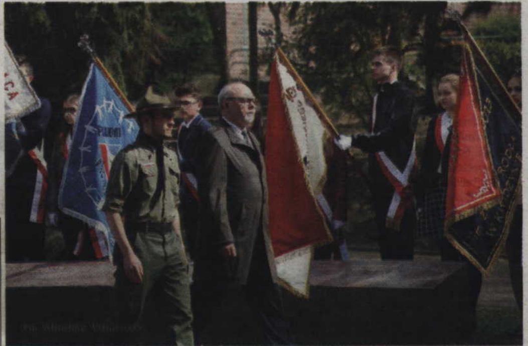
W uroczystościach wzięły udział poczty sztandarowe szkół, organizacji i stowarzyszeń.