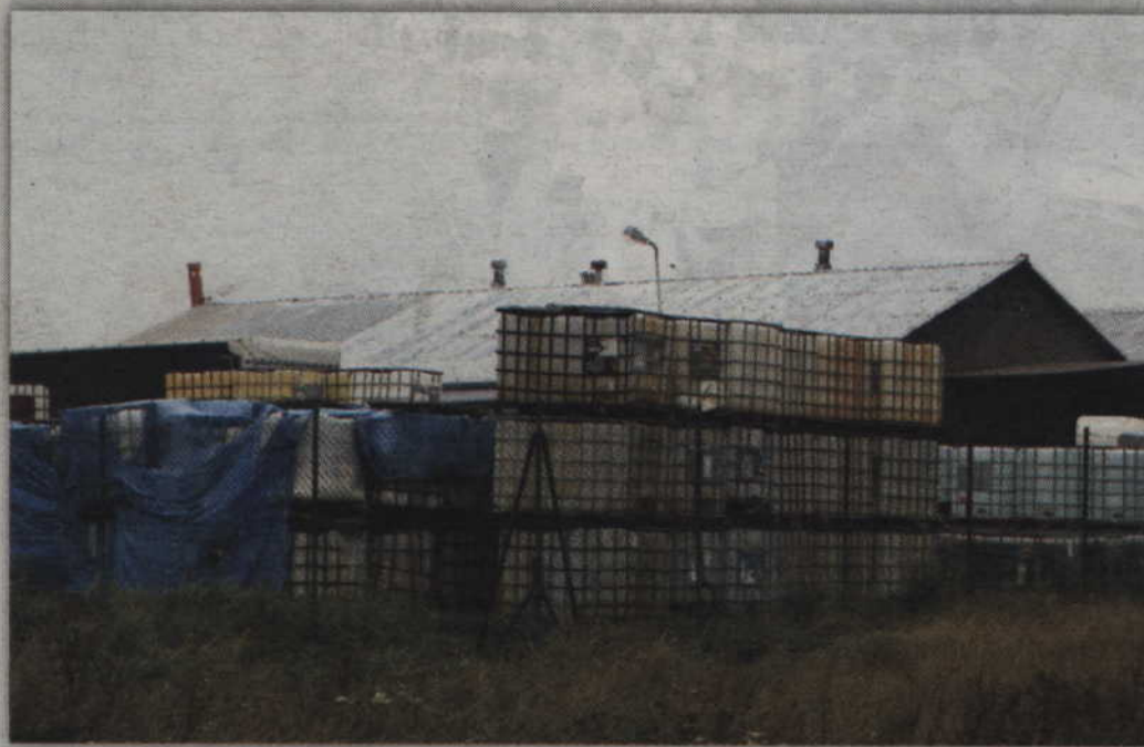
We wrześniu ubiegłego roku doszło do wycieku niebezpiecznych substancji chemicznych składowanych na terenie firmy „Fenix” w Kaniczkach.

Właściciel firmy przedstawił zaświadczenia według których zakład w Kaniczkach nie kwalifikuje się do tego, aby nazywać go zakładem o zwiększonym ryzyku wystąpienia niebezpieczeństwa