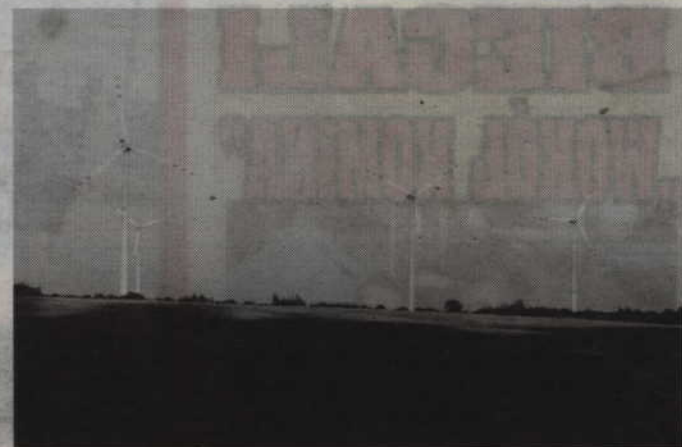
-Wokół naszego powiatu wszędzie stoją wiatraki. Dotyczy to powiatu sztumskiego, tczewskiego, iławskiego czy grudziądzkiego. Tylko u nas ich nie ma - podkreśla wicestarosta kwidzyński.