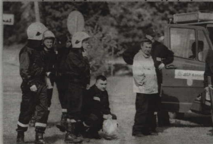
Druhowie z Kaniczek wywalczyli prawo startu w powiatowy zawodach sportowo-pożarniczych.