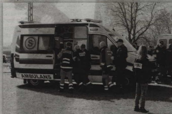
Podczas zawodów jeden ze strażaków stracił przytomność. Do czasu przyjazdu karetki pogotowia pomocy udzielali mu jego koledzy - druhowie.