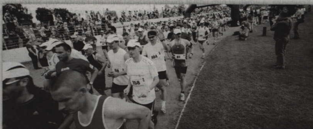
Jubileuszowe świętowanie tradycyjnie rozpocznie się od Biegu Papiernika.