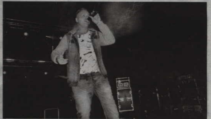
Miłośników disco polo ucieszył występ „Taste”.