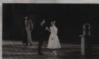
Baletowa adaptacja sławnej powieści Michaiła Lermontowa, składa się, tak jak i literacki pierwowzór, z kilku części: Bela, Tamań, Księżna Mary, przedstawiających różne oblicza głównej postaci. Warto też dodać, że w 2016 roku spektakl ten został nagrodzony aż trzema Złotymi Maskami, prestiżowymi rosyjskimi nagrodami teatralnymi. (n)

Carska Rosja. Młody oficer Pieczorin zostaje wysłany na Kaukaz. Bardziej niż służba pochłaniają go jednak przygody z kobietami, zarówno miejscowymi, jak i rosyjskimi damami. Znużony, niezdolny do głębszych uczuć rani nie tylko kolejne kochanki, ale także przyjaciół i siebie samego. To opowieść obnażająca tajniki rosyjskiej, melancholijnej duszy. Sam Pieczorin stał się zresztą pierwowzorem całej galerii rosyjskich bohaterów literackich: tzw. ludzi zbędnych, znużonych egzystencją, zimnych dandyśców, bez celu w życiu.