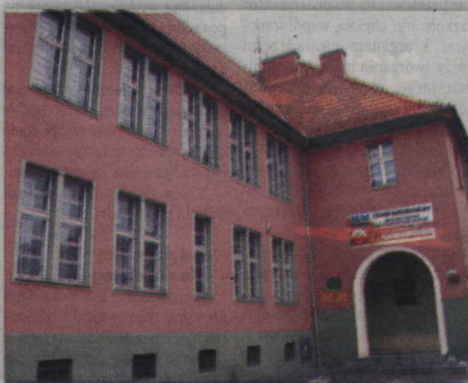
W budynku I LO część okien została wymieniona kilka lat temu.