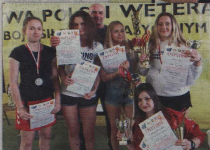
Dziewczęta z „Nadwiślanina” Kwidzyn zdobyły złoty medal drużynowo.