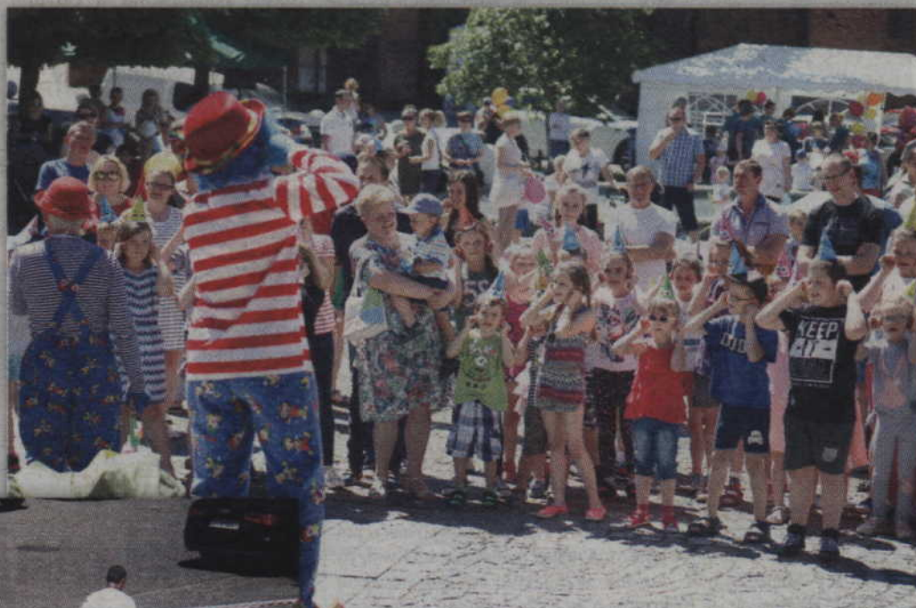
Wspólna zabawa z Rupherem i Rico.