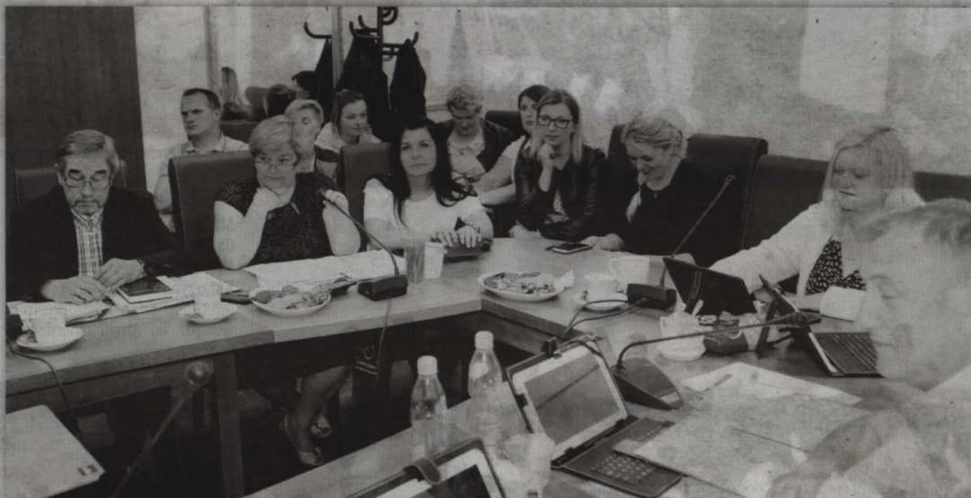
We wspólnym posiedzeniu komisji stałych gardejkiej rady gminy wzięli udział rodzice dzieci uczęszczających do szkoły w Trumiejach oraz pracownicy.