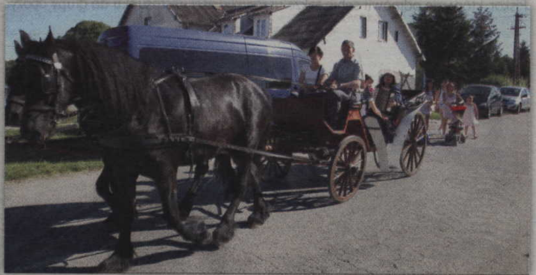
Podczas przeglądu można było także przejechać się bryczką.

VI Przegląd Piosenki Biesiadnej Cygany 2017 już za nami. Na scenie prezentowały się jednak nie tylko zespoły mające w swoim repertuarze piosenki biesiadne. Podczas przeglądu śpiewano bowiem także utwory wykonywane wcześniej przez znanych polskich artystów estradowych. Do Cygan (gm. Gardeja) przyjechały kapele, które z zaproszeń Gminnego Ośrodka Kultury w Gardei korzystają praktycznie od początku istnienia przeglądu. Jednym z takich zespołów jest „Echo Kwidzyna”. Zespół powstał w 2008 roku i w swoim repertuarze ma zarówno utwory biesiadne, jak i folklorystyczne. Na koncie ma też mnóstwo nagród i wyróżnień. Warto też dodać, że zespół współpracuje również z osobami chorymi na stwardnienie rozsiane i osobami niepełnosprawnymi.