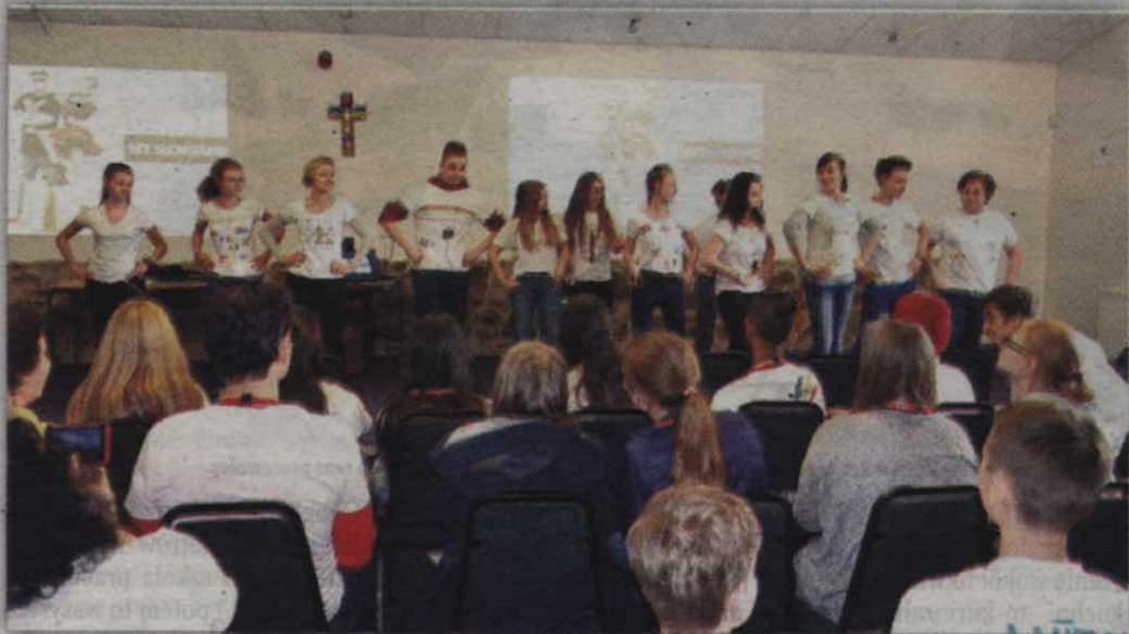
Prezentacja samodzielnie zaprojektowanych koszulek o tematyce projektu