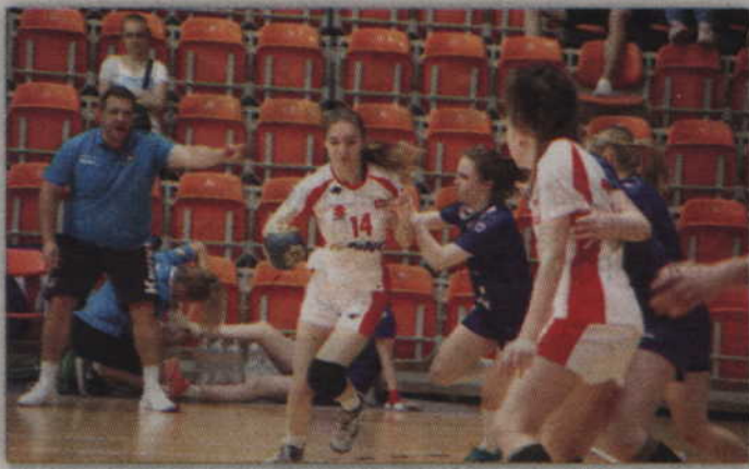
Drugie spotkanie Polski oraz Islandii zakończyło się remisem po 24.