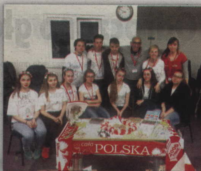
Wieczorek Przymaków Międzynarodowych - stół ze smakołykami z Polski.