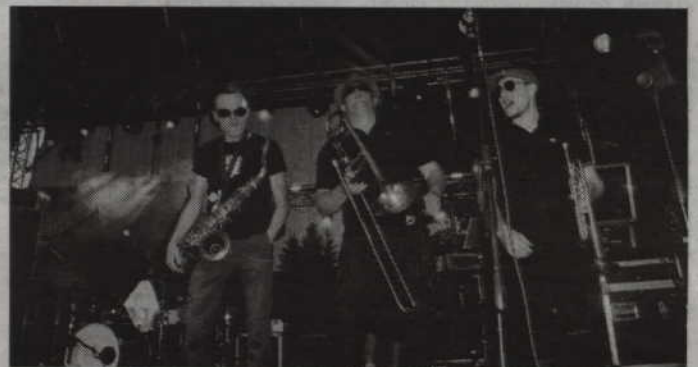
Rytm reggae to domena zespołu „Etna Kontrabande”.