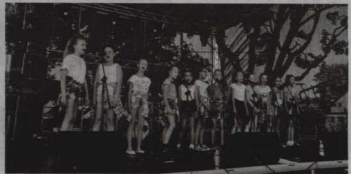
Na scenie wystąpiły grupy „Elfy” i „Iskierki” działające przy PCKiS.