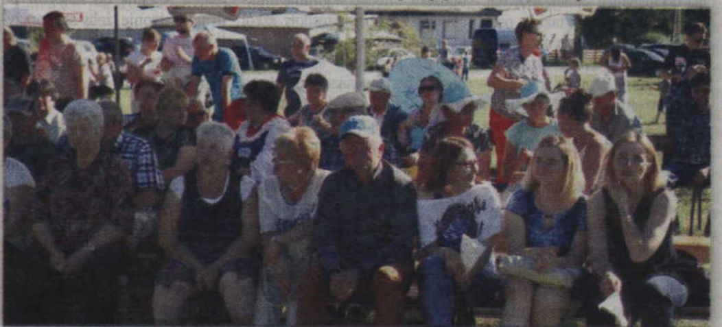
Choć dopisywała pogoda, to niestety na widowni brakowało publiczności.