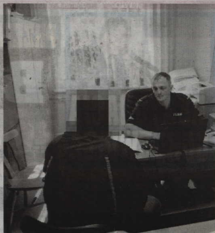
Zatrzymany 38-latek przyznał się do winy i dobrowolnie poddał się karze.