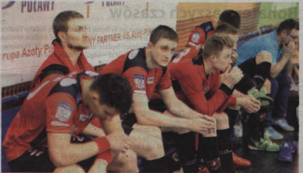
Po przegranym meczu zawodnicy MMTS długo nie mogli dojść do siebie. Każdy nadal przeżywał utraconą szansę na zdobycie medalu.