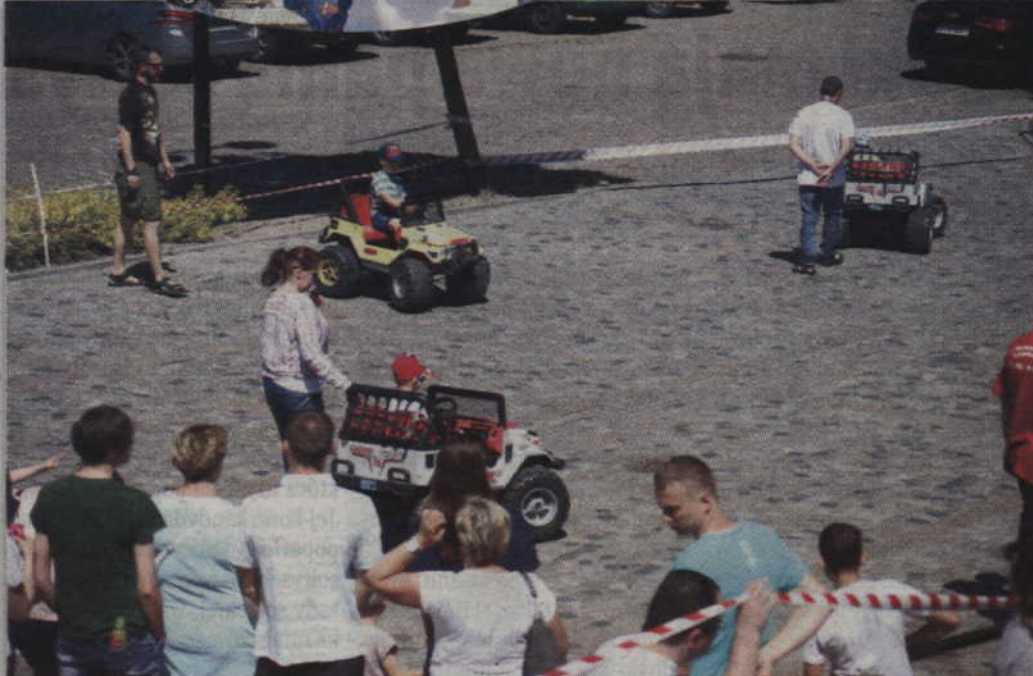
Nie zabrakło również innej stałej atrakcji festynowej – akumulatorowych samochodzików.