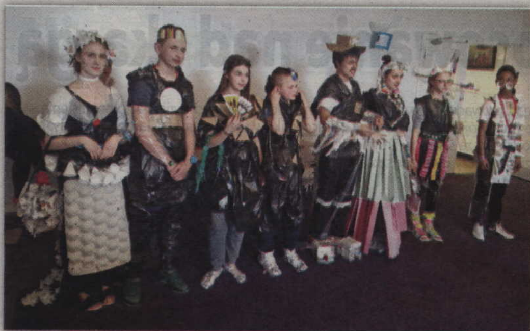
Trashion Show, czyli pokaz mody stworzony z odpadów.