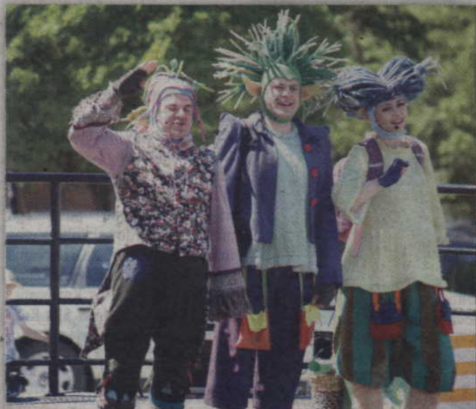
Dzieci z niecierliwością czekały, aż na scenie pojawią się Domisie.