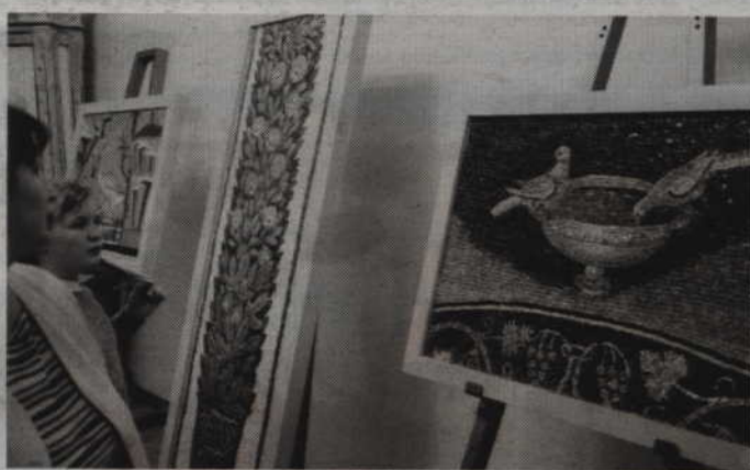
Mozaiki prezentowane były już widzom podczas tegorocznej Nocy Muzeów. stały wykonane przez Grupę Artystów Mozaikarzy z Akademii Sztuk Pięknych w latach pięćdziesiątych XX wieku. (n)

W salach muzealnych obejrzeć będzie można 25 kopii najszlachetniejszych mozaik pochodzących z budowli sakralnych w Rawennie. Oryginały zgromadzonych mozaik stanowią najbogatszy na świecie zespół wczesnych zabytków chrześcijańskich i zarazem najzasobniejszy, zachowany zbiór ikonografii chrześcijańskiej z V i VI wieku. Z tych powodów siedem budowli sakralnych z Rawenny, ozdobionych we wnętrzach mozaikami, zostało wpisanych na Listę Światowego Dziedzictwa Kulturowego i Przyrodniczego UNESCO. Warto dodać, że wystawiane kopie zo-