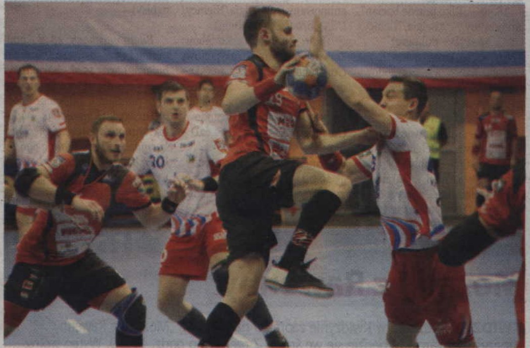
Kwidzynianie mieli olbrzymie problemy z przebieciem się przez defensywę gospodarzy.