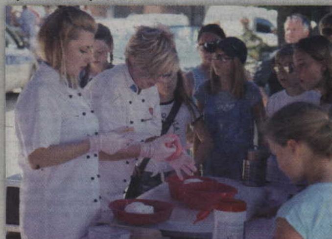
Mieszkańcy mogli zobaczyć jak ręcznie wyrabia się cukierki oraz lizaki.