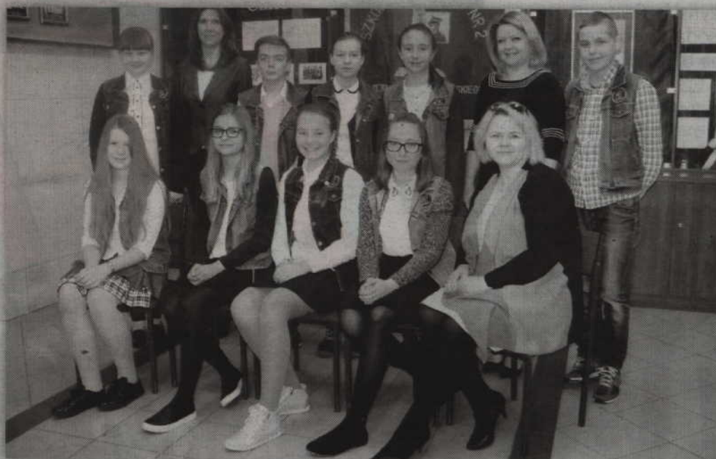
Finaliści i laureaci wojewódzkich konkursów przedmiotowych ze swoimi nauczycielami.