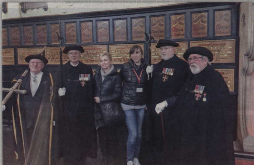
Spotkanie ze strażnikami burmistrza w ratuszu w Durham