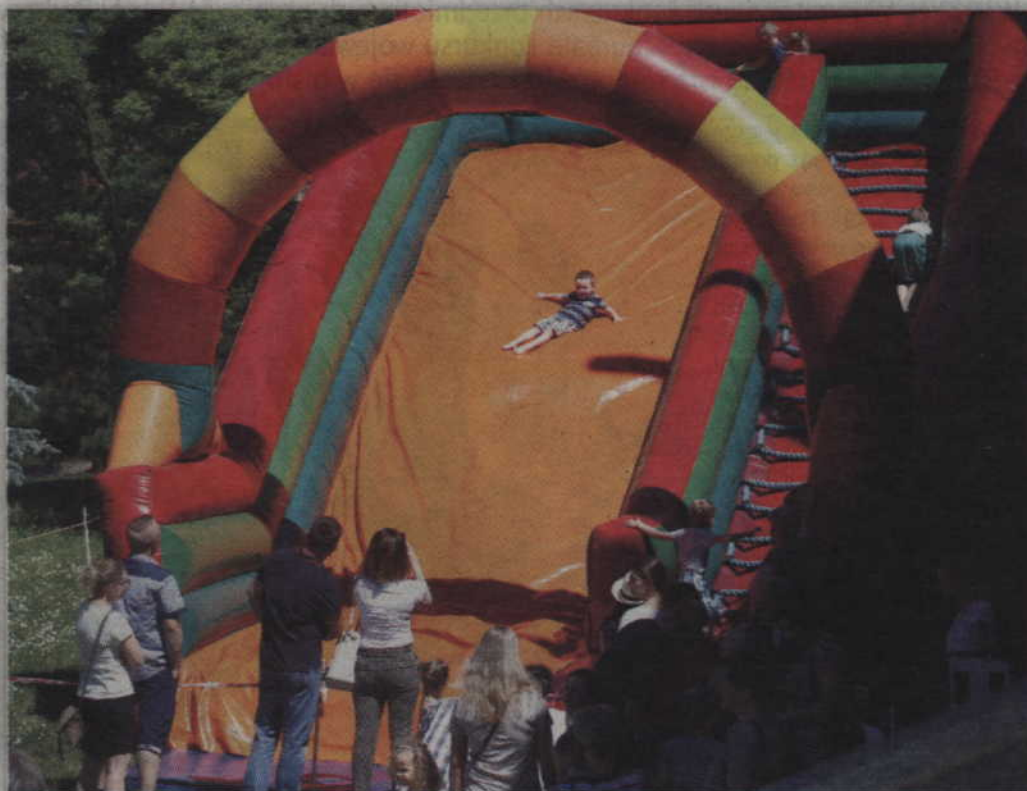
Dzieci mogły skorzystać m.in. z zabawy na dmuchanym zamku i zjeżdżalni.