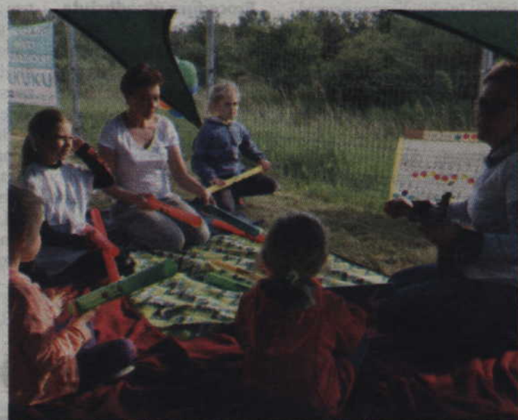
Nie zabrakło również wspólnego muzykowania.