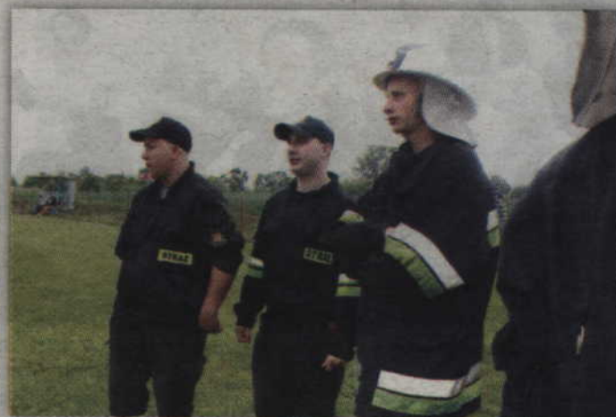
W tym roku gospodarzami zawodów sportowo-pożarniczych byli strażacy z OSP w Czarnem Dolnem.

W dniu zawodów pogoda była wyjątkowo kapryśna i deszczowa. Mimo tych niesprzyjających warunków a więc każdy zastęp OSP musiał wystawić drużynę składającą się z siedmiu osób. Zawody rozpoczęły się od ćwiczenia bojowego. Jego braki skutkowało obniżeniem punktacji.