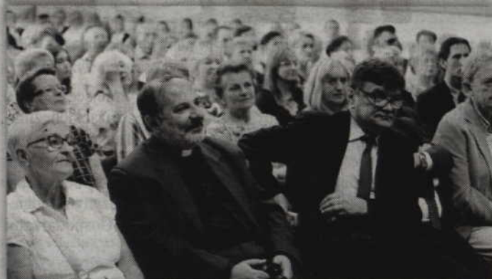
Od początku gościem honorowym prabuckiej konferencji kresowej jest ks. Tadeusz Isakowicz-Zaleski.