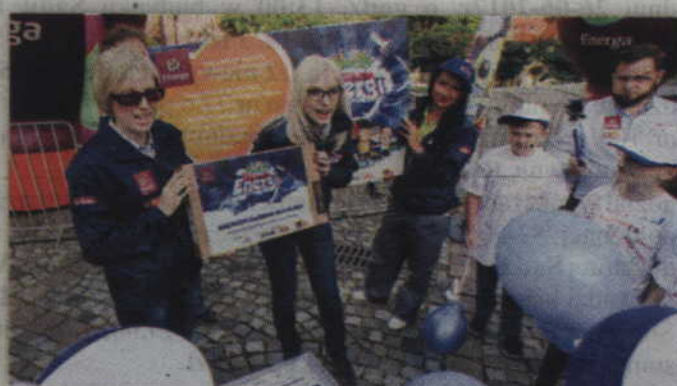
Nie obyło się również bez wręczenia nagrody głównej za zwycięstwo w konkursie.

Organizator przygotował także specjalny konkurs dla mieszkańców miast, które odwiedzi „Planeta Energii”. Jak się okazuje można w nim wywalczyć dodatkową nagrodę dla swojej zwycięskiej szkoły. Po godzinie 15:00 w każdym z miast, które odwiedzi mobilne centrum nauki pojawi się sztafeta złożona z 8 rower-