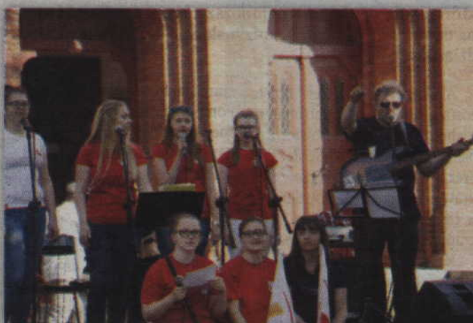
Podczas imprezy usłyszeć będzie można m.in. parafialny zespół „Trishagion”.