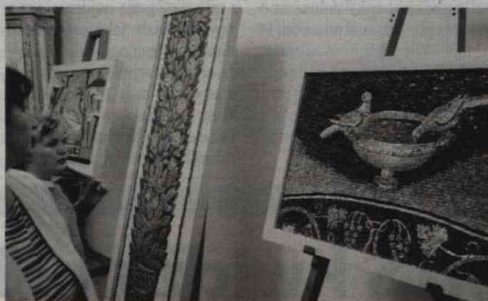
Mozaiki prezentowane były już widzom podczas tegorocznej Nocy Muzeów.

W salach muzealnych obejrzeć będzie można 25 kopii najsłynniejszych mozaik pochodzących z budowli sakralnych w Rawennie. Oryginały zgromadzonych mozaik stanowią najbogatszy na świecie zespół wczesnych zabytków chrześcijańskich i zarazem najzasobniejszy, zachowany zbiór ikonografii chrześcijańskiej z V i VI wieku. Z tych powodów siedem budowli sakralnych z Rawenny, ozdobionych we wnętrzach mozaikami, zostało wpisanych na Listę Światowego Dziedzictwa Kulturowego i Przyrodniczego UNESCO. Warto dodać, że wystawiane kopie zo-