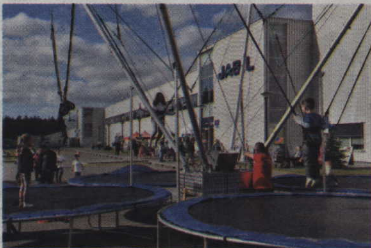
1 czerwca przed budynkiem Jabila pojawiły się atrakcje dla dzieci.