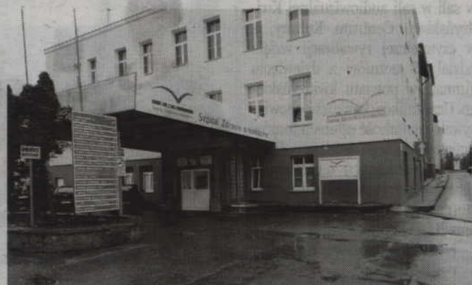
Podniesienie kapitału ma zwiększyć możliwości inwestowania w kwidzyński szpital.

-Chodzi o inwestycje w szpitalu. Teraz spółka zwróci się o objęcie udziałów do EMC i powiatu oraz pozostałych wspólników. Prawdopodobnie we wrześniu lub w październiku odbędzie się drugie zgromadzenie wspólników ponownie podwyższające kapitał. Przypomnę, że w umowie był warunek, że co najmniej 10 mln zł będzie wydanych na remonty w szpitalu. To ważne, abyśmy nie blokowali EMC możliwości inwestowania w szpital. Mamy obecnie 11 proc. udziałów. Oznacza to, że będziemy musieli przeznaczyć na podniesienie