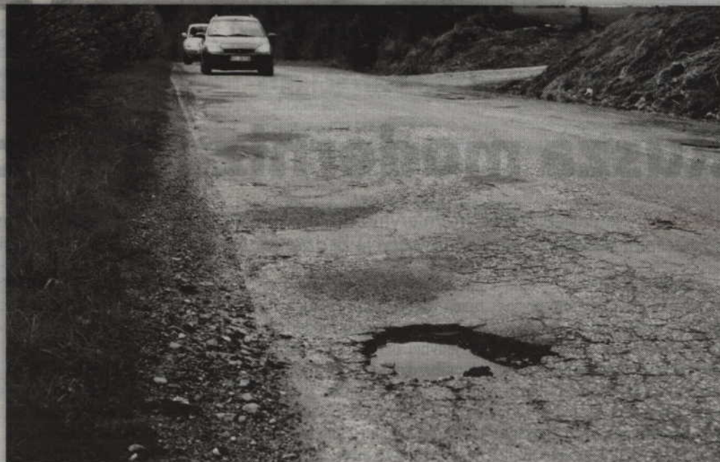
Droga wojewódzka nr 520 od lat wymaga gruntownego remontu.

Nie ukrywają, że wraz z rozpoczęciem generalnego remontu drogi wojewódzkiej nr 521 ich droga zostanie jeszcze bardziej zniszczona. Powód? Wielu kierowców chcąc ominąć