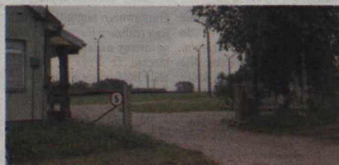
Wybudowana dwie dekady temu gminna oczyszczalnia nie jest w stanie przyjąć większej ilości ścieków.