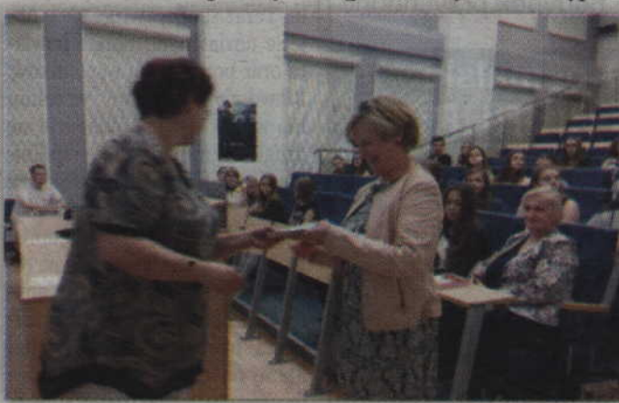
Podziękowania otrzymali także nauczyciele.