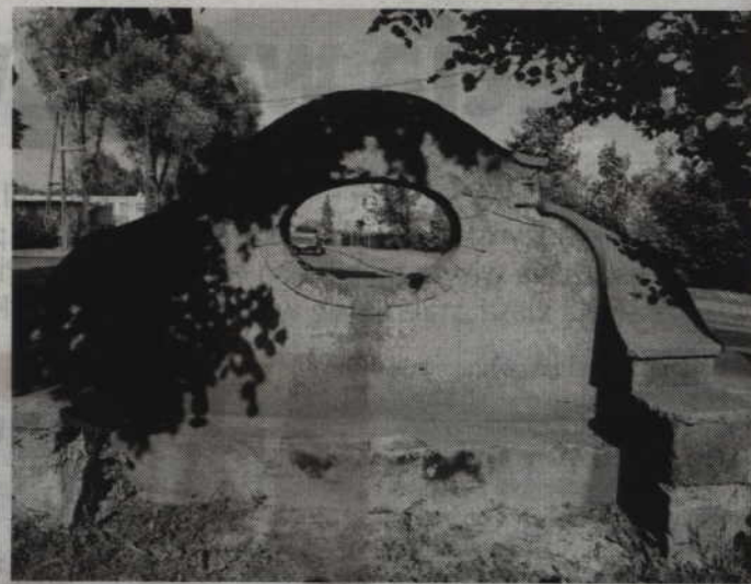
Prace przy budowie ronda spowodują przeniesienie modernizacji prabuckiej „Ławeczki miłości”.

-Prace przy budowie ronda rozpoczną się w przyszłym roku, a co za tym idzie wtedy także będziemy chcieli wyremontować ten cenny zabytek. Dlatego zasadne jest, aby w tym roku nie wydawać na renowację pieniędzy z Prabuckiego Budżetu Obywatelskiego. Mogę zapewnić także, że ławeczka nie zostanie zniszczona i uszkodzona podczas prac drogowych. Jej odnowienie zostanie przeprowadzone w przy-