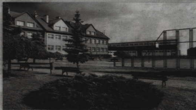
Planowana budowa biblioteki gminnej przy szkole w Sadlinkach będzie uzależniona od uzyskania dofinansowania z Ministerstwa Kultury i Dziedzictwa Narodowego.

- Ministerstwo ogłosiło konkurs na realizację takich inwestycji jak nasza, ale z rozbięciem na dwa lata. Dlatego zdecydowaliśmy się podzielić naszą inwestycję na dwie części. Pierwszy etap kosztowałby 306 tys. zł. To pozwoliłoby