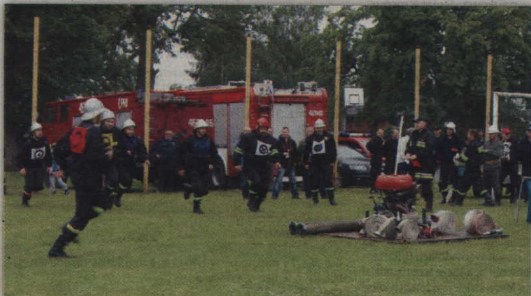
Ćwiczenie bojowe wykonują strażacy z OSP w Gardeji.

GARDEJA. Strażacy-ochotnicy z OSP Rozajny Wielkie wygrali gminne zawody sportowo-pożarnicze rozgrywane w Czarnem Dolnem. Zwycięzcy rywalizacji oraz strażacy z OSP Cygany już 10 czerwca reprezentować będą gminę Gardeja na szczeblu powiatu. Warto dodać, że w zawodach wzięło udział dziesięć zastępów strażackich, a sześć z nich rywalizowało w kategorii męskich drużyn pożarniczych.