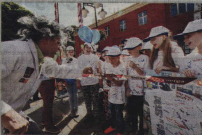
Uroczyste otwarcie „Planety Energii” na kwidzyńskim Placu Jana Pawła II.