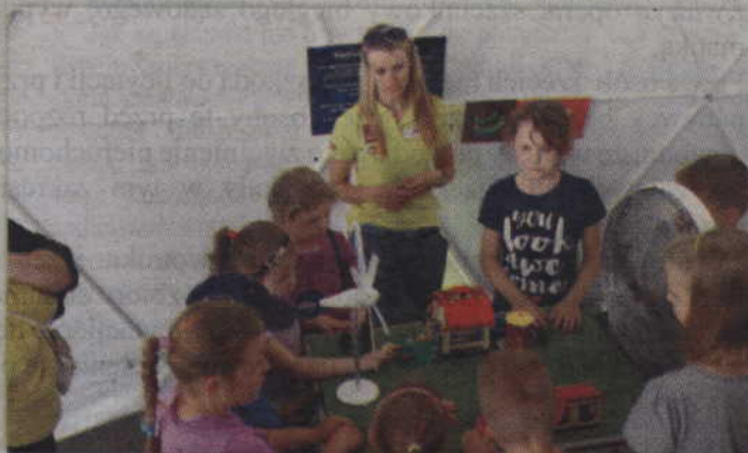
Jedno z przygotowanych stanowisk mówiło o elektrowniach wiatrowych.

która ilustruje prawo zachowania pędu czy maszyna elektrostatyczna, od której elektryzują się od włosy. Podczas pokazów i eksperymentów prowadzonych przez planetowych ekspertów, najmłodszy dowiedzieli się także co to są i w jaki sposób przemieszczają się ładunki elektryczne, jak prąd płynie w przewodzie, w jaki sposób można wytworzyć go w dużych ilościach oraz jak bezpiecznie