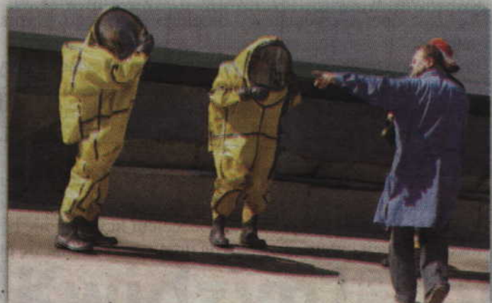
Ostatnie ćwiczenia sił ratowniczych i obrony cywilnej odbyły się w „Warmińskich” w roku 2012.

ul. Południowa, gdzie przemieszczać się będą siły ratownicze. Za powstałe utrudnienia przepraszamy. (fox)