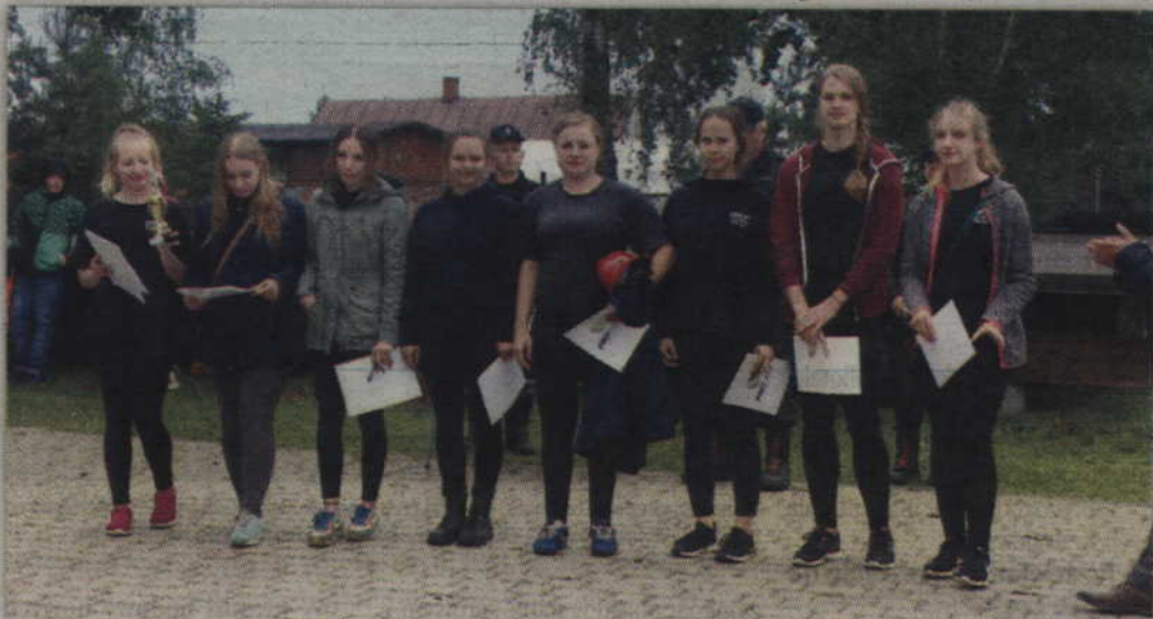
Kobieca drużyna pożarnicza wystawiona przez OSP Czarny Dolny.

W dniu zawodów pogoda była wyjątkowo kapryśna i deszczowa. Mimo tych niesprzyjających warunków a więc każdy zastęp OSP musiał wystawić drużynę składającą się z siedmiu osób. Zawody rozpoczęły się od ćwiczenia bojowego. Jego braki skutkowało obniżeniem punktacji.