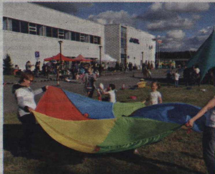
Zespół przedszkola „Akuku” zachęcał do wspólnych zabaw.