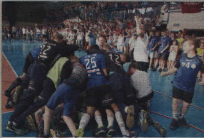
Przy ogłuszającym dopingu mistrzem Polski został zespół ŚKPR Świdnica.