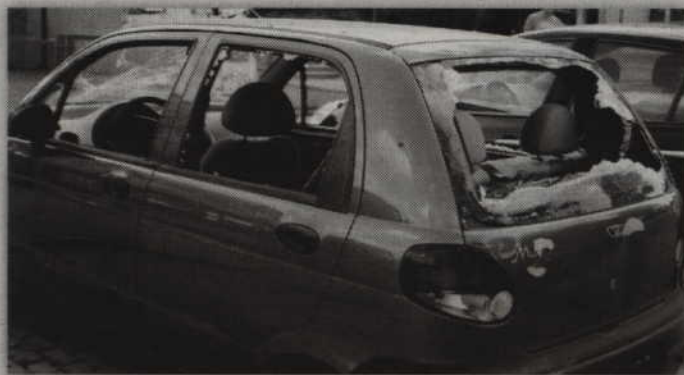
W nocy z 1 na 2 czerwca nieznaną sprawcą podpalili zaparkowanego dawno matiza. Wcześniej pojazd został natomiast dokładnie zniszczony.