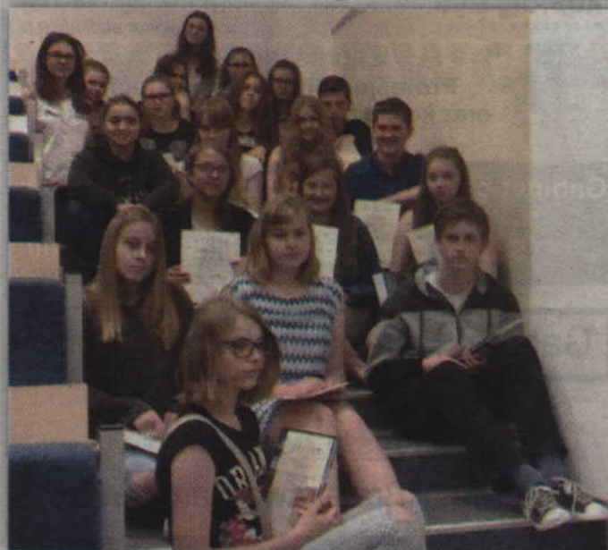
Laureaci oraz wyróżnieni w tegorocznym konkursie.

miejsce otrzymali dyplomy i zestaw książek (w zależności od zajętego miejsca: 5 książek - I miejsce, 4 książki - II miejsce i następnie: 3, 2; wyróżnieni - dyplom