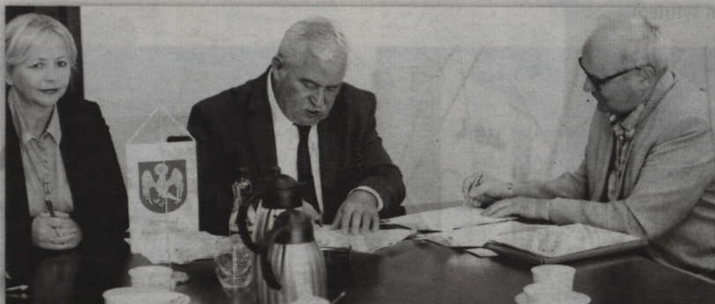
Dzięki podpisanej umowie firma NOVAPOL z Torunia zajmie się modernizacją wnętrza budynku Zespołu Szkół Ponadgimnazjalnych nr 1.

czekają nas w przypadku modernizacji gmachu Zespołu Szkół Ponadgimnazjalnych nr 2 w Kwidzynie. Jeżeli policzymy oszczędności z pierwszego przetargu, to będziemy musieli dołożyć jeszcze ok. 500 tys. zł. Fizycznie posiadamy te środki i możemy rozstrzygnąć przetarg, gdyż mamy zaplanowane pieniądze na zakup wyposażenia dla dwóch szkół, które zostaną zmodernizowane oraz Centrum Kształcenia Zawodowego i Ustawicznego. Za dwa miesiące będziemy jednak rozstrzygać przetarg na wyposażenie