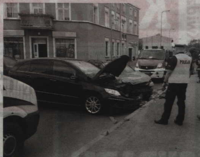
Do zderzenia dwóch aut doszło na skrzyżowaniu ulicy Sztumskiej z ulicą Żwirki i Wigury.

-Ze wstępnych ustaleń funkcjonariuszy wynika, że 34-letnia mieszkanka Kwidzyna kierująca mercedesem, wyjeżdżając z ulicy podporządkowanej (Żwirki i Wigury) w ulicę Sztumską wymusiła pierwszeństwo przejazdu 24-latkowi jadącemu oplem astra w kierunku Braterstwa Narodów - wyjaśnia mł. asp. Bożena Schab, Oficer Prasowy Komendanta Powiatowego Policji w Kwidzynie. - W wyniku zderzenia ucierpiała pasażerka opla. Z ogólnymi obrażeniami została przewieziona do szpitala, a następnie zwolniona do domu.