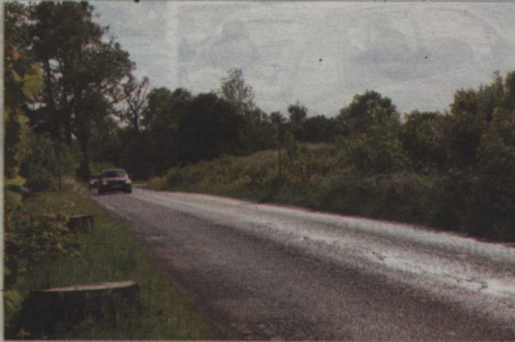
Drogowcy w pobliżu Raniewa wytną całą skarpe, więc niebezpieczny zakręt zniknie na zawsze.