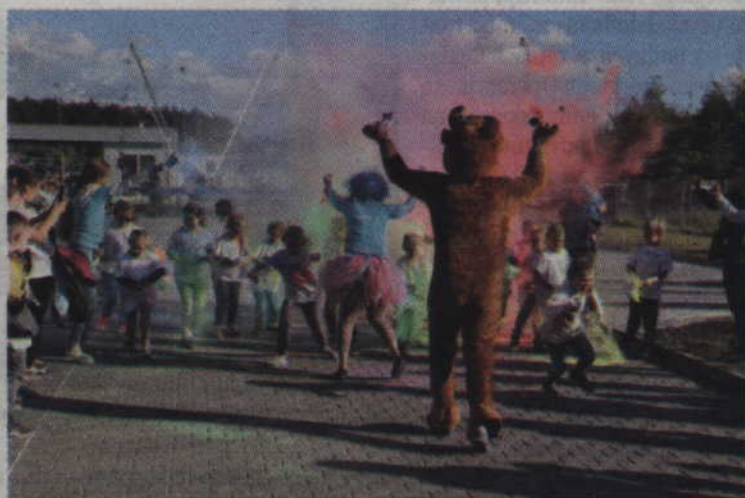
Zgodnie z tytułem imprezy nie brakowało również kolorów.