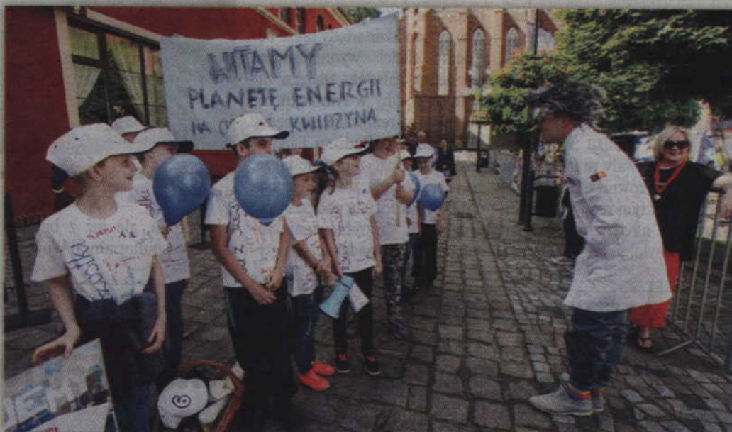
„Witamy Planetę Energii na orbicie Kwidzyna” – takim hasłem uczniowie klasy III A powitali mobilne centrum nauki.

Jak można było się przekonać w miasteczku „Planeta Energii” teoria łączyła się z praktyką poprzez eksperymenty, doświadczenia, pokazy, interaktywne zabawy i quizy z nagrodami. Na dzieci czekało także mnóstwo niecodziennych eksponatów, takich jak kula plazmowa, która pokazuje widowiskowe efekty wywołane przez wysokie napięcie, induktor Ruhmkorffa, który generuje miniatury „pioruny”, Kołyska Newtona,