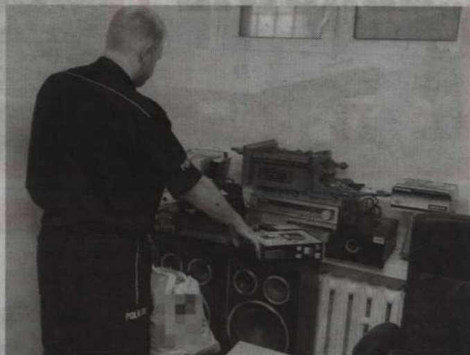
Kryminalnym udało się odzyskać całe mienie skradzione przez 20-latkę.

Mężczyzna przez dwa dni kilkakrotnie wchodził do mieszka-