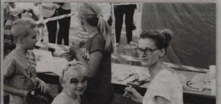
Malowanie twarzy to obowiązkowy punkt praktycznie każdego festynu.