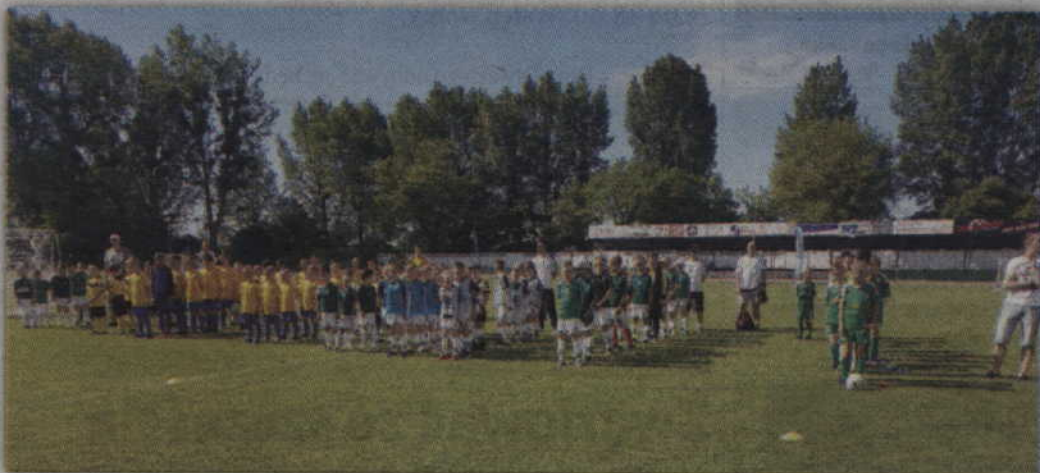
W kwizdzynskim turnieju wzięło udział 12 drużyn.

– Organizatorzy turnieju składają serdeczne podziękowania dla Starostwa Powiatowego za pomoc w przygotowaniu turnieju. Ciepły posiłek dla zawodników przygotowała Restauracja Miła, a dzięki firmie Cafe Sati zgromadzeni kibice mieli możliwość napić się gorącej kawy. W organizację turnieju włączy-