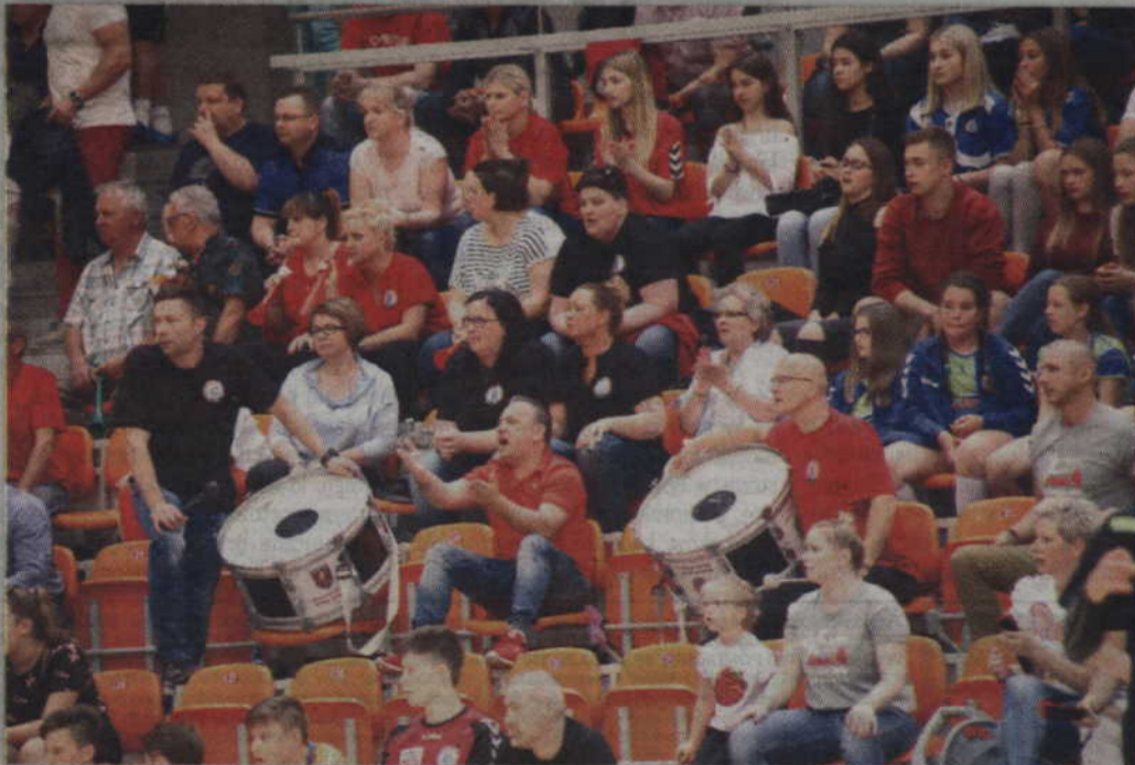
Występ młodzików MTS Kwidzyn gorąco wspierali rodzice.