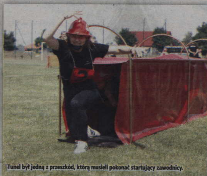
Tunel był jedną z przeszkód, którą musieli pokonać startujący zawodnicy.

Zawody rozegrane w Sadlinkach były również eliminacjami do rywalizacji na szczeblu wojewódzkim ale różniły się od tych, które rozgrywają seniorzy. Mimo