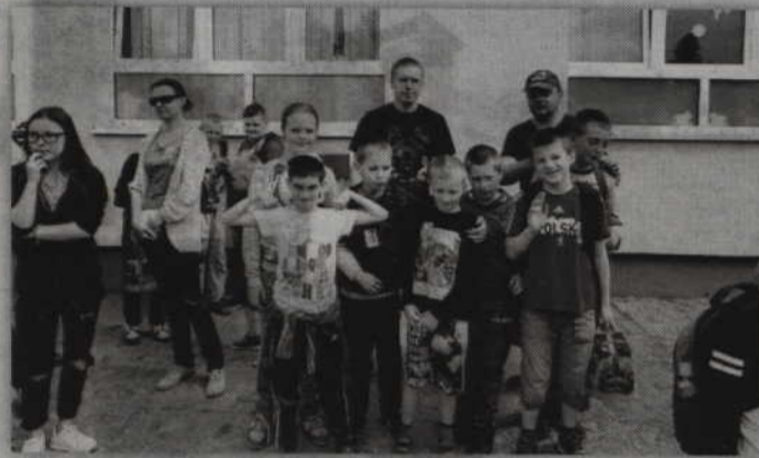
Najważniejsza była radość dzieci.

RYJEW. Festyn „Barcickie Lasy” to cykliczna impreza, którą organizuje Specjalny Ośrodek Szkolno-Wychowawczy w Barcicach. W tym roku odbył się po raz jedenasty. Od początku imprezie patronuje Nadleśnictwo Kwidzyn. Tegorocznym głównym zadaniem nie była wycieczka do lasu ale budowanie szalaszów. Do tego zadania przystąpiło 11 drużyn.