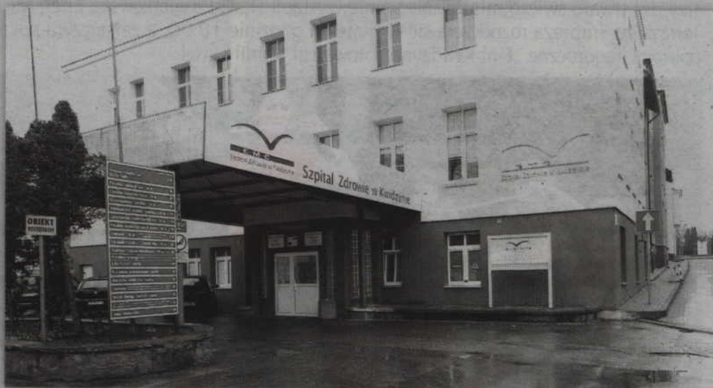
Dyrekcja szpitala nie spełniła żądań płacowych dwójki chirurgów