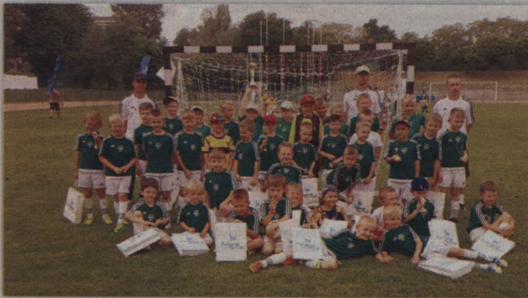
Zwycięska drużyna DSPN I Kwizdzyń.

PIŁKA NOŻNA. Drużyny DSPN I Kwizdzyń oraz AP Champion wygrały drugi turniej DSPN Kwizdzyń CUP 2017. W zawodach zorganizowanych na kwizdzynskim stadionie wzięło udział 12 drużyn rywalizujących w dwóch kategoriach wiekowych: rocznika 2007 i 2010.