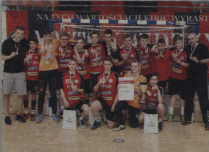
Wicemistrzowie czyli zespół MTS Kwidzyn.