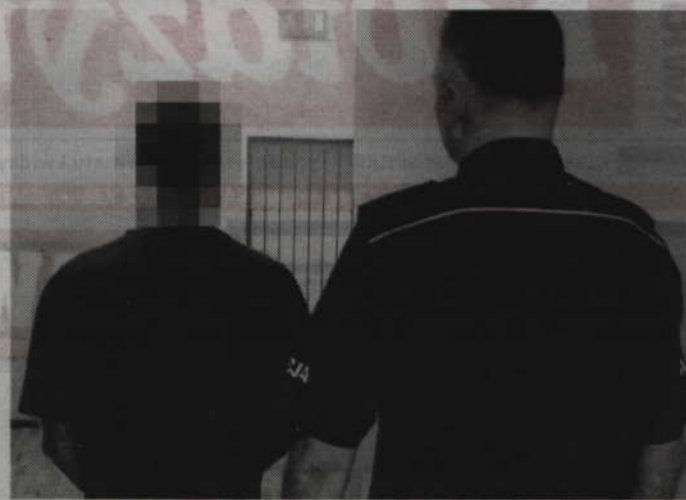
Zatrzymany diler narkotykowy może spędzić za kratkami nawet 10 lat.

W miejscu zamieszkania podejrzanego, podczas przeszukania, policjanci znaleźli reklamówkę ze sporą ilością zielono-brązowego suszu roślinnego i wagę elektroniczną. Po zbadaniu substancji testerem okazało się, że są to niedozwolone środki odurzające. Funkcjonariusze zabezpieczyli 63,65 gram marihuany i ponad tysiąc złotych pochodzące najprawdopodobniej ze sprzedaży zabronionej substancji. Policjanci ustalać będą teraz