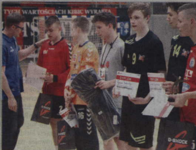
Nagrody indywidualne odebrali gracz wybrani do najlepszej siódemki turnieju.