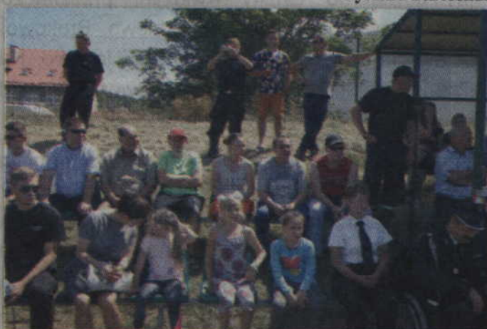
Ładna pogoda zachęciła wielu mieszkańców do przyścia na stadion Spójni Sadlinki.

Młodzieżowe drużyny pożarnicze zostały wystawione przez następujące jednostki OSP: Bronisławowo, Sypanica, Gardeja, Kaniczki, Tychnowy, Obrzynowo, Trzciano, Straszewo, Rakowiec, Nebrowo Wielkie, Czarne Dolne, Sadlinki, Benowo, Ryjewo. Gościnnie, w zawodach i szkoleniu uczestniczyli młodzi strażacy ze Straszewa (woj. kujawsko-pomorskie).