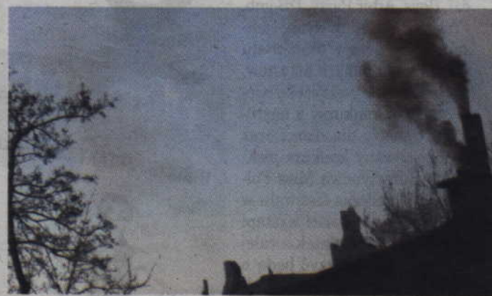
Kominy w miastach już dawno są na cenzurowanym. To właśnie one trują nas najbardziej.

Na Pomorzu Gdańskim, ze względu na uwarunkowania meteorologiczne, przede wszystkim silniejsze wiatry, nie występują trudne sytuacje smogowe. Nie można porównywać ich z tymi, z południa Polski, gdy zaleganiu smogu w powietrzu sprzyja bezwietrzna pogoda oraz brak opadów atmosferycznych - można było przeczytać na stronie internetowej Wojewódzkiego Inspektoratu Ochrony Środowiska w Gdańsku www.gdansk.wios.gov.pl . Czynnikiem najbardziej sprzyjającym powstawaniu smogu jest niska temperatura. Wtedy to właśnie uruchamia się procesy emisji zanieczyszczeń do powietrza. Zaczyna się intensywne spalanie paliw. Im niższe