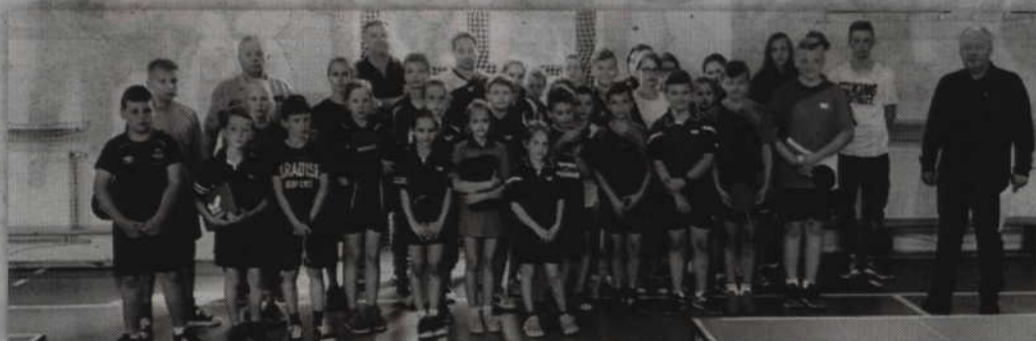
Młodzi sportowcy, którzy wzięli udział w kwidzyńskiej imprezie wywodzą się z uczniowskich klubów sportowych i sekcji tenisa stołowego MTS Kwidzyn.