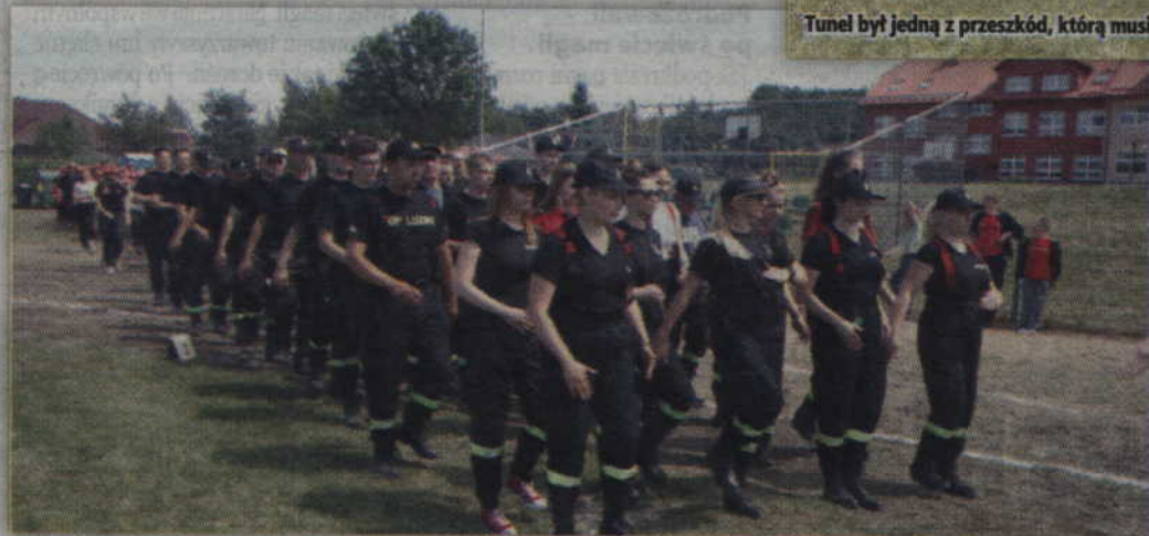
W organizacji zawodów pomagali strażacy z Luzina oraz uczniowie i absolwenci klasy mundurowej 2 LO w Kwidzynie.

część sportowa na szczeblu młodzieżowych drużyn pożarniczych na terenie powiatu nie była rozgrywana.