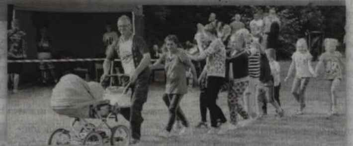
W pociąg bawili się starsi i młodszy.

Przedmiotowy wykaz został również zamieszczony na stronach www.bip.gminakwidzyn.pl Biuletynu Informacji Publicznej Gminy Kwidzyn, a informacja o wywieszeniu powyższego wykazu zostanie wywieszona na tablicach ogłoszeń w wyżej wskazanych miejscowościach. Szczegółowe informacje można uzyskać w Urzędzie Gminy Kwidzyn, w pokoju nr 8 lub pod numerem telefonu 55 261 41 58.