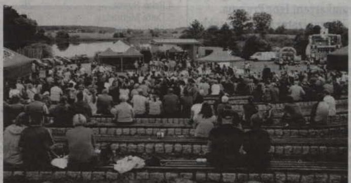
Gardejska Noc Świętojańska odbędzie się w amfiteatrze nad jeziorem Kamień.

nowały występy zespołów „Cristo Dance” i „4Ever”. O godz. 22.30 odbędzie się puszczenie lampionów szczęścia, a dziesięć minut później pokaz fajerwerków. Imprezę zakończy natomiast Biesiada Gardejska z zespołem „Etna”. Ponadto nie zabraknie także fotobudki, poszukiwania magicznego kwiatu paproci, wesołego miasteczka czy innych atrakcji. (fox)