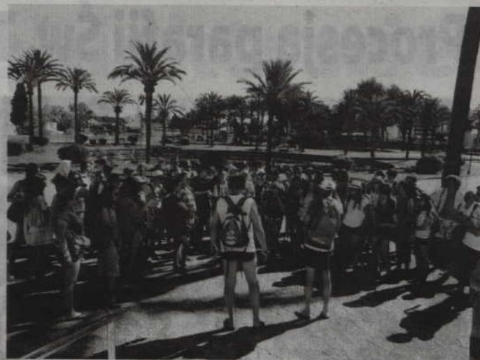
Pobyt na Majorce dla 70 uczniów KSS był nie tylko czasem wypoczynku ale przede wszystkim nauki.