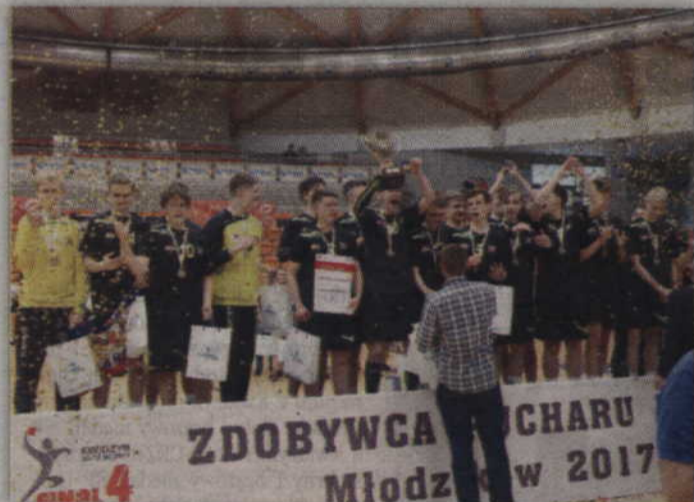
Tytuł mistrzowski trafił do graczy Wybrzeża Gdańsk.

MTS Kwidzyn wygrał 39:18 i Ich rywalami okazali się gracze gdańskiego Wybrzeża, który pokonali Vive Tauron Kielce