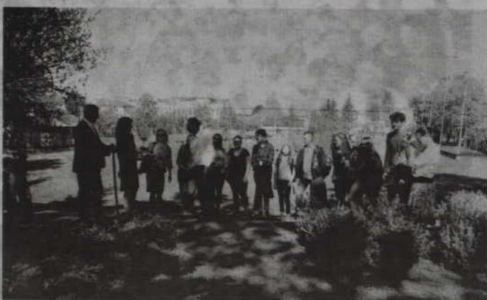
Młodzież z Celle poznawała historię naszego regionu