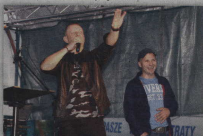
„Cristo Dance” przez godzinę bawił publiczność.

O godzinie 20. sceną zawładnęły tegoroczne muzyczne gwiazdy nocy świętojańskiej. Jako