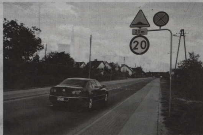
Na ulicy Chodkiewicza miasto zamontuje kolejne dwa progi zwalniające.

czenia prędkości do 50km/h, i problemu nie będzie. Progi zwalniające powinny być zakładane na ulicach osiedlowych, gdzie rzeczywiście istnieje wielkie ryzyko potrącenia pieszych, w tym także dzieci. W przypadku ulicy Chodkiewicza argument dorosłych, że na tej ulicy bawią się dzieci i mogą zostać potrącone przez nadjeżdżający samochód, do mnie nie przemawia. Moż-