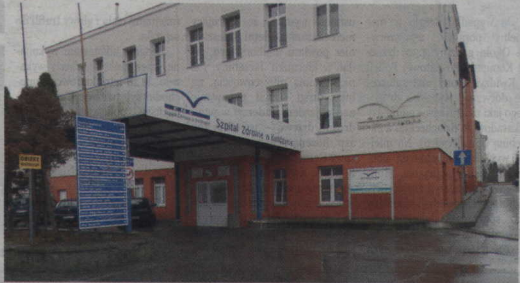
Pierwszy etap prac remontowych czyli utworzenie poradni POZ, centralnej recepcji oraz nowa lokalizacja dla gabinetów poradni specjalistycznych jest już zakończony. Uroczyste otwarcie tej części szpitala odbędzie się 29 czerwca.

W Kwidzynie do końca 2018 roku Grupa EMC planuje przebudowę i modernizację szpitala.