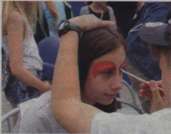
Można było malować twarze innych osób.