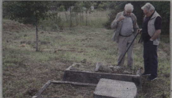
Byli mieszkańcy tych ziem odwiedzili m.in. cmentarz ewangelicki w Cyganach.