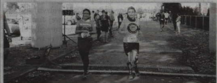
Ubiegłoroczny bieg traktora okazał się frekwencyjnym sukcesem