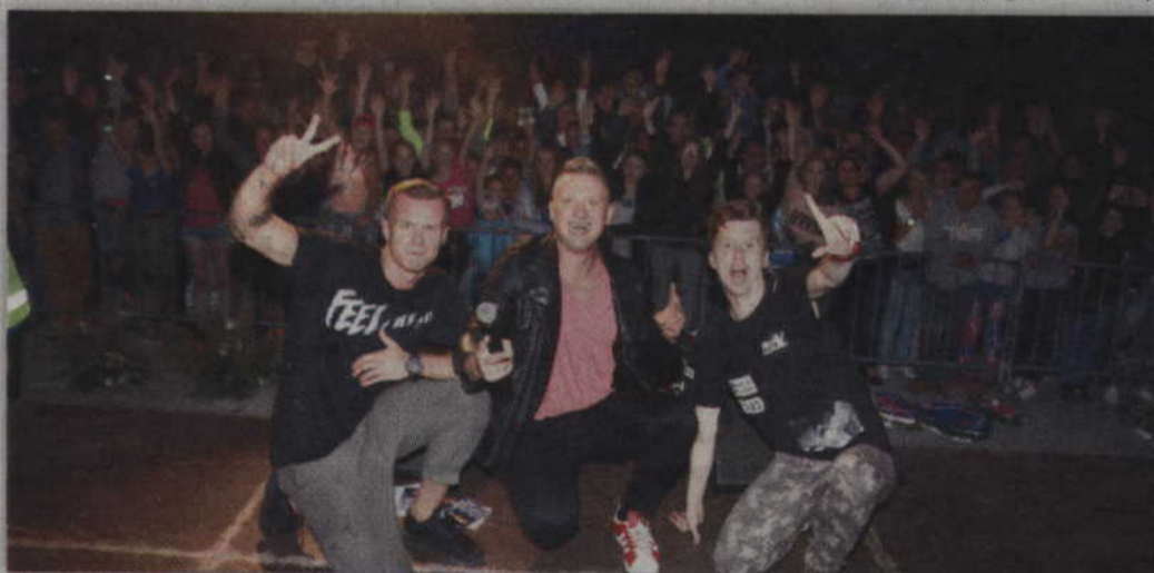
Gwiazdą wieczoru był zespół „4Ever”.

ni. Fajnie jest wracać do tych miejsc, gdzie na początku muzycznej kariery przecierało się pierwsze ścieżki w show biznesie