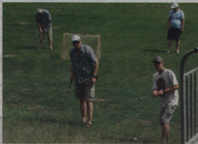
Podczas rywalizacji w mistrzostwach minigolf-crossa zawodnicy muszą pokonać dość znaczne odległości.

Drugiego dnia weekendu z minigolfem rozegrane zostaną XIX Indywidualne Mistrzostwa Kwidzyna. Zawody odbędą się w sobotę, 1 lipca o godz. 10.00, a każdy z uczestników będzie musiał pokonać tor czterokrotnie. W klasyfikacji ogólnej liczyć się będzie natomiast suma zdobytych punktów we wszystkich przejściach. Organizatorzy przewidują, że turniej rozegrany zostanie w kategorii open oraz Weteran