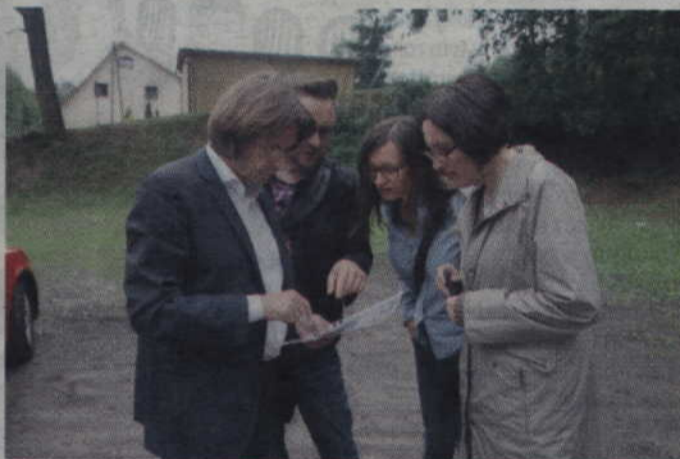
Na podstawie relacji elbląskiego rabina w 1938 roku można sobie wyobrazić, jak wyglądał cmentarz żydowski.