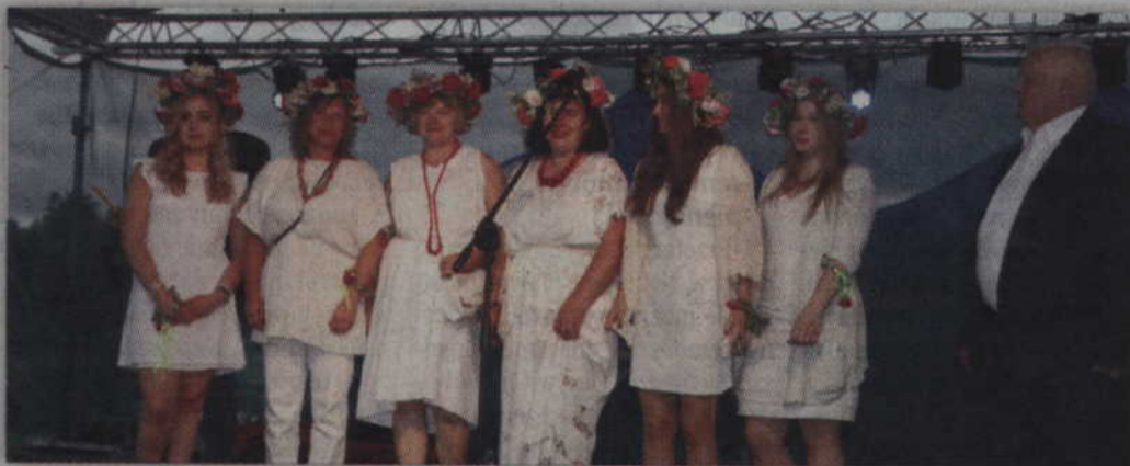
Panie z KGW w Czarnem Dolnem zwyciężyły w konkursie wianków świętojańskich.