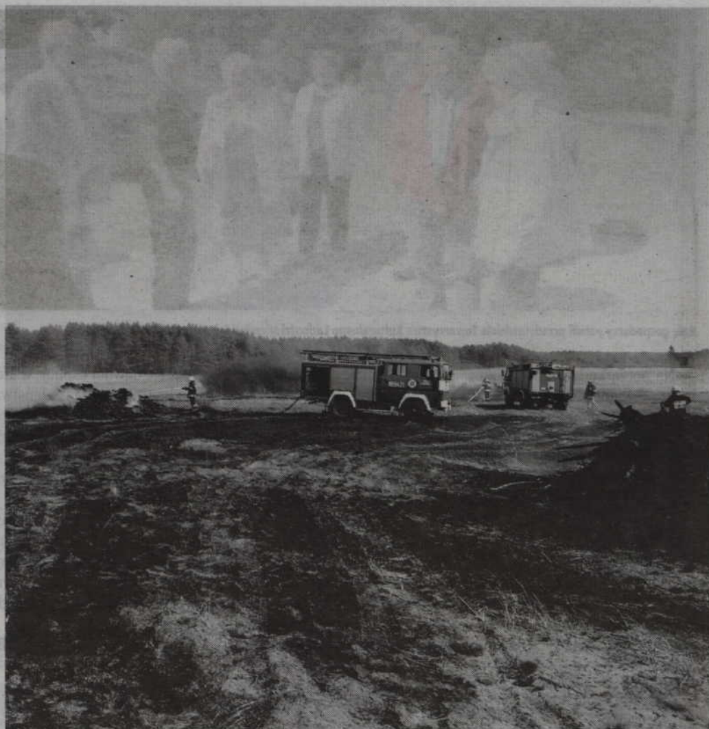
Strażacy przypominają, że ogniska można rozpalać w odległości nie mniejszej niż 100 m od lasu lub w miejscach do tego wyznaczonych. W przeciwnym razie ogień może łatwo się rozprzestrzenić.

-Przypominam, że takich znalezisk pod żadnym pozorem nie wolno dotykać, podnosić, prze-