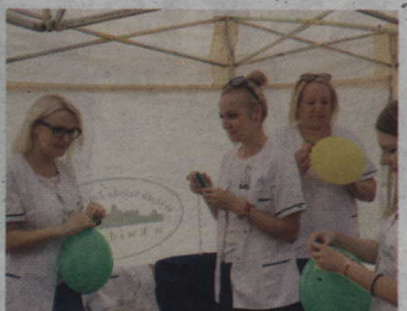
Swoje stoisko miała również Powiślańska Szkoła Wyższa, która pierwszego dnia obchodziła Juwenalia.