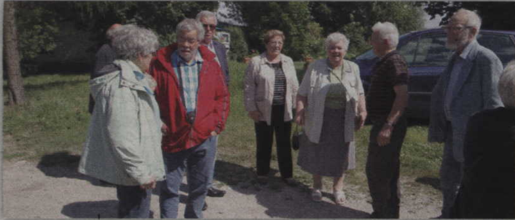
Rolę gospodarzy pełnili przedstawiciele Towarzystwa Kulturalnego Ludności Niemieckiej „Ojczyzna” z Kwidzyna.

POWIAT. Powiat kwidzyński odwiedzili goście z Niemiec. To byli mieszkańcy i ich potomkowie, którzy do 1945 roku mieszkali na Powiślu. Podczas swego pobytu w Kwidzynie zwiedzali nie tylko zabytki naszego miasta ale również odwiedzili cmentarz ewangelicki w Cyganach (gm. Gardeja). Przy tablicy pamiątkowej i umieszczonym tam krzyżu zapalono znicze.