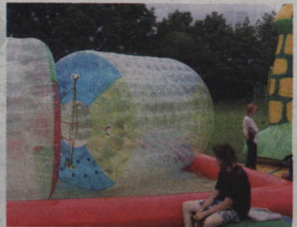
Dużą popularnością cieszyły się zabawy w kulach wypełnionych powietrzem.