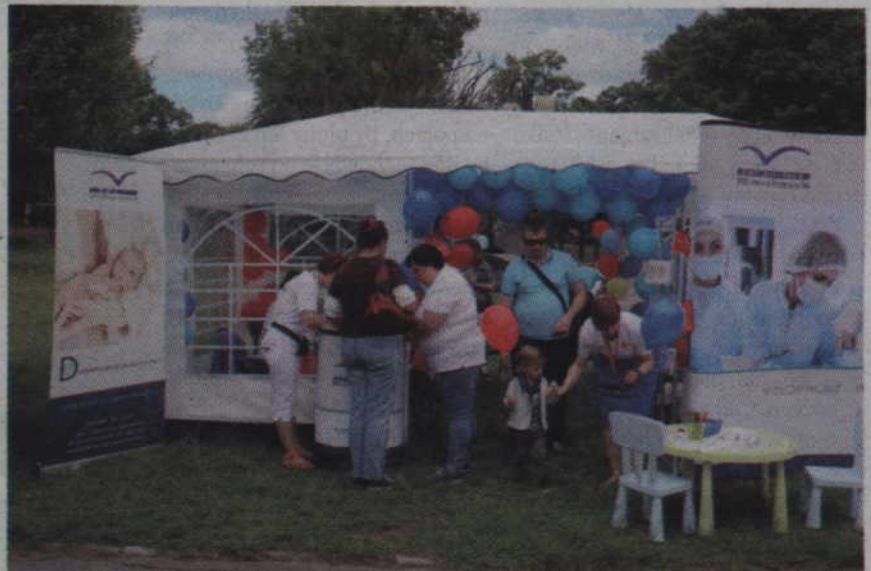
Swoje stanowisko na Dniach Kwidzyna miał również kwidzyński szpital.