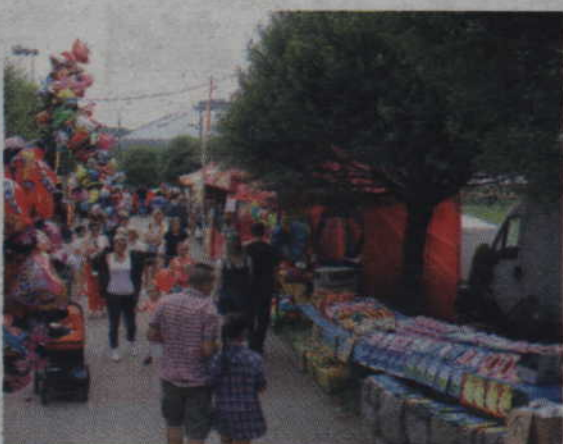
Wzdłuż pasażu dla pieszych nie brakowało stoisk z bibelotami oraz słodkościami.