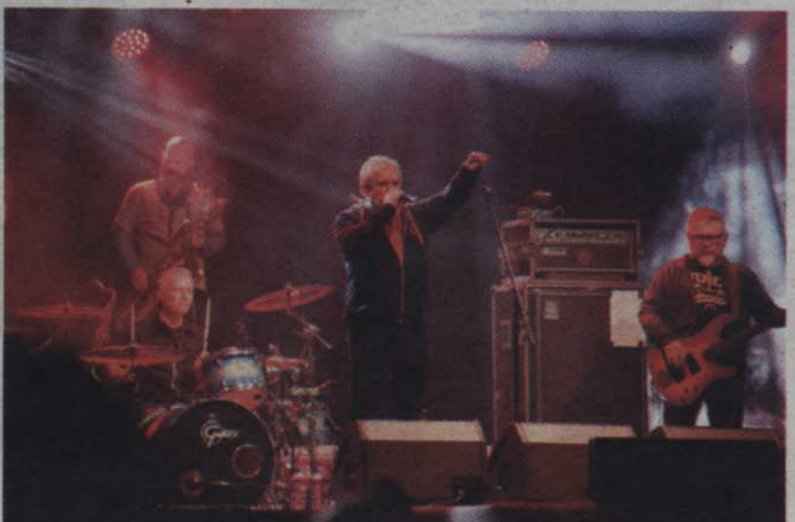
Dwugodzinny koncert Kultu zaspokoił wiernych fanów tego zespołu.