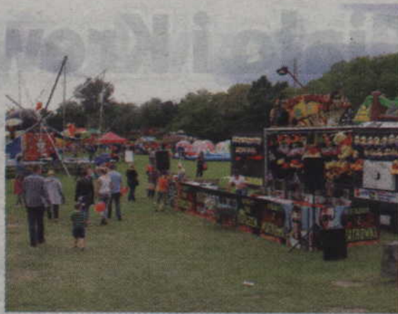
Górna płyta boiska wypełniona była atrakcjami dla najmłodszych.