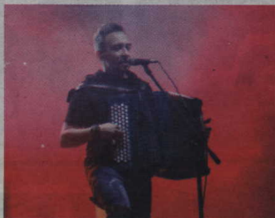
Koncert grupy Enej poruszył nawet najbardziej zatwardziałych przeciwników wspólnej zabawy.