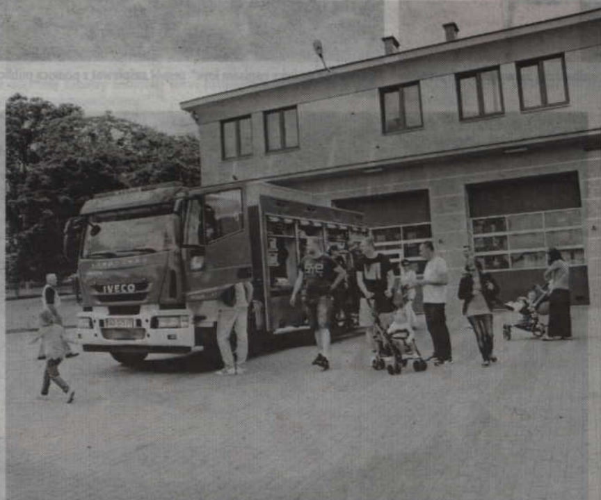
Mieszkańcy skorzystali z zaproszenia kwidzyńskich strażaków i chętnie odwiedzili budynek Komendy Powiatowej PSP.