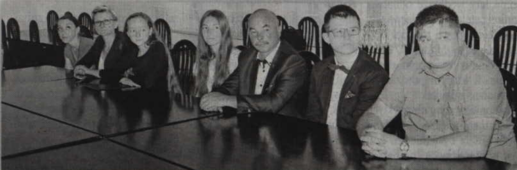
W sali obrad rady gminy Kwidzyn spotkali się najlepsi absolwenci gimnazjów i najlepsi uczniowie, którzy w tym roku ukończyli szóstą klasę szkoły podstawowej, a także rodzice oraz dyrektorzy szkół.