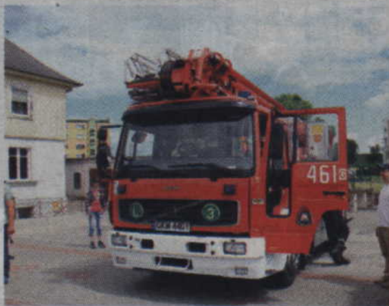
Podczas Dni Kwidzyna można było również zwiedzić kwidzińską komendę straży pożarnej.