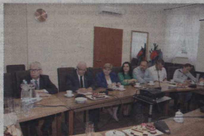
W spotkaniu z gośćmi z Niemiec wzięli udział gardejscy samorządowcy.