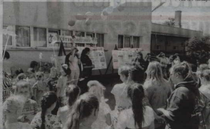
Podczas festynu rodzinnego w Czarnem Dolnem policjanci oceniali także prace konkursowe na temat „Bezpiecznych wakacji”.