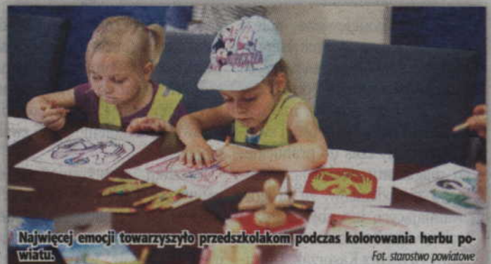
Najwięcej emocji towarzyszyło przedszkolakom podczas kolorowania herbu powiatu.

Furorę zrobiło jednak wspólne kolorowanie herbu powiatu kwidzyńskiego oraz przybijanie specjalnych pieczęci. Żegnając się ze starostą dzieci wręczyły mu w formie podziękowania laurkę. Zadowolone i uśmiechnięte opuściły także budynek starostwa z prezentami powiatowymi oraz słodyczami. (n)