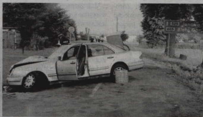
Do wypadku doszło na drodze Szkaradowo Szlacheckie - Jarzębina.