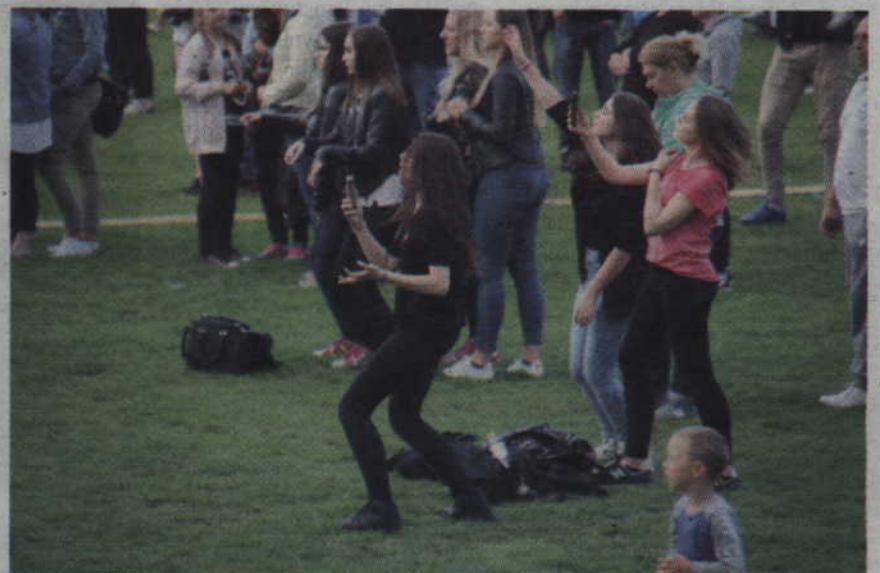
Młoda publiczność bawiła się doskonale.