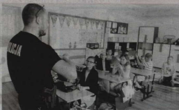
Funkcyjoniariusze rozmawiali z uczniami szkół w Trumiejach i Czarnem Dolnem.

Warto dodać, że podczas festynu rodzinnego w SP Czarne Dólne policjanci oceniali także konkursowe prace plastyczne uczniów na temat „Bezpiecznych wakacji”. Rozmowy funkcyjoniariuszy z uczniami odbyły się natomiast w ramach ogólnopolskiej kampanii „Kręci mnie