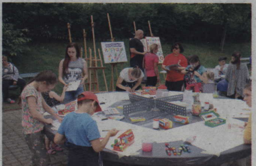
Pracownia plastyczna była pełna pracujących dzieci.