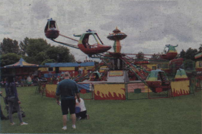
Z przejazdu helikopterami chętnie korzystali rodzice z małymi dziećmi.