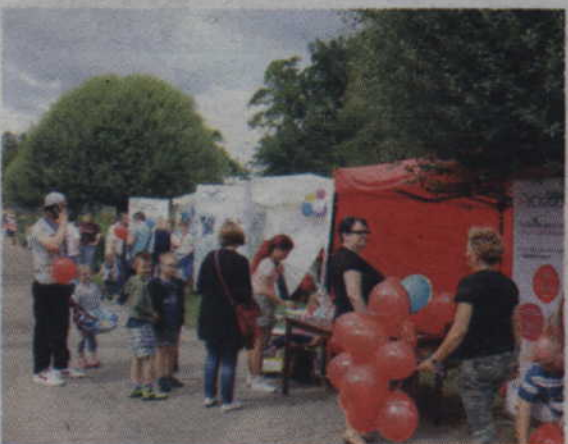
Do wspólnej zabawy zachęcali także pracownicy KCK rozdając przedmiotem czerwone balony.