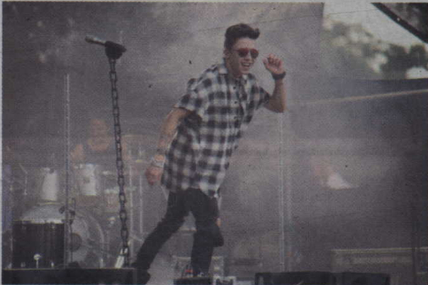
Jedna z gwiazd tegorocznego święta miasta - Dawid Kwiatkowski.