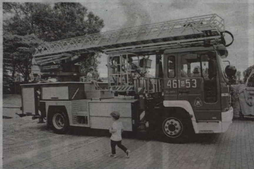
To jedyna okazja aby w jednym miejscu zobaczyć sprzęt oraz samochody strażackie.