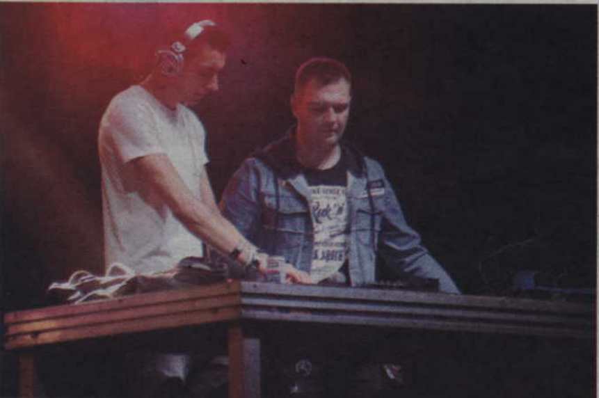
Sobotni wieczór zakończyła zabawa z DJ-ami.