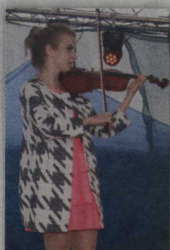
W zespole „Cristo Dance” wystąpiła również skrzypaczka.