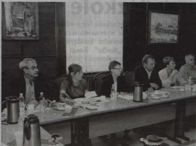
Prabucki radni wyrazili zgodę na emisję obligacji komunalnych.