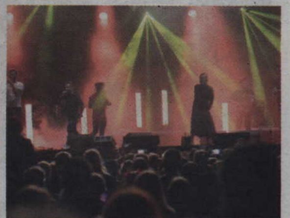
Finałowy „Kamień z napisem love” zespół zaśpiewał z pomocą publiczności.