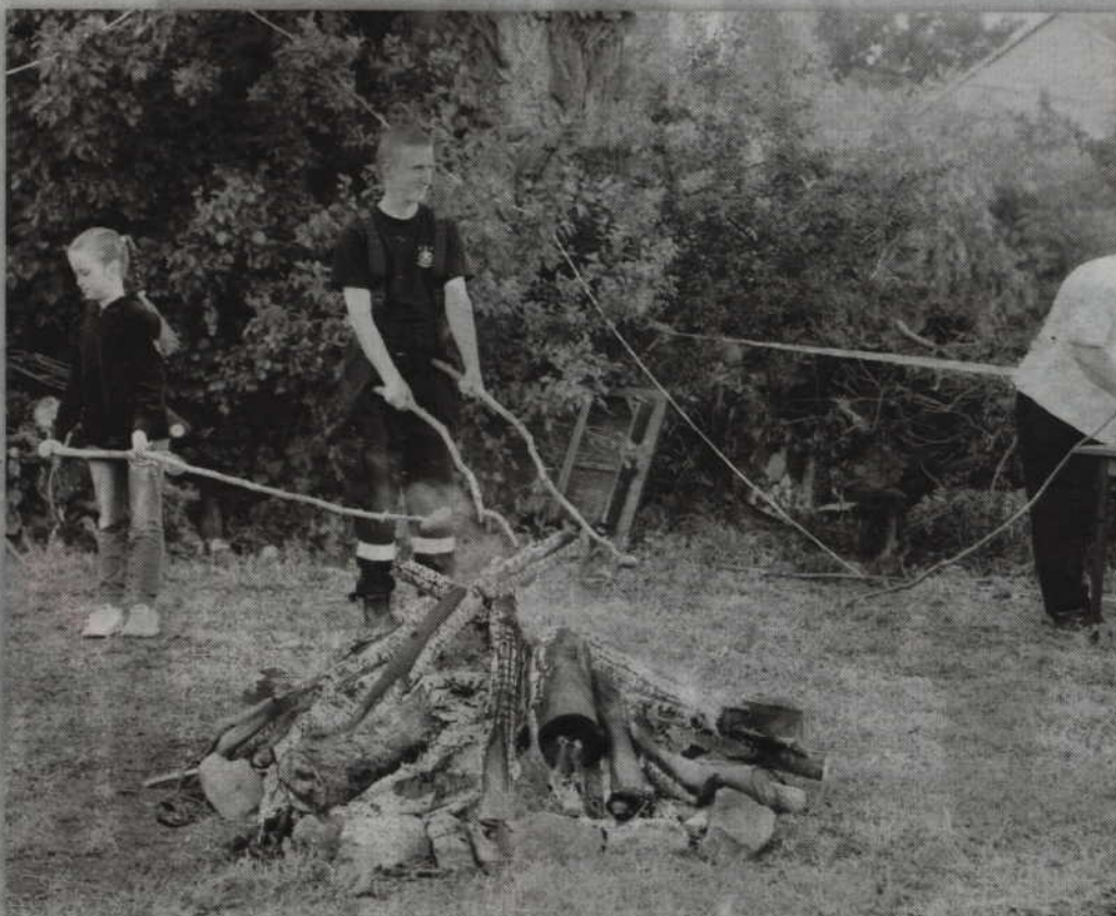
Dla chętnych przygotowano ognisko z możliwością upieczenia kiełbasek.