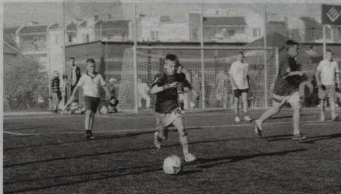
Rozgrywki piłkarskie rozpoczną się od Orlika znajdującego się przy ul. K. Wielkiego.