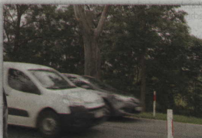
Jesienią z poboczy zniknie 68 drzew, które stanowią największe zagrożenie dla kierow- ców.

Początkowo remont drogi nr 55 na odcinku Bądky – Gardėja