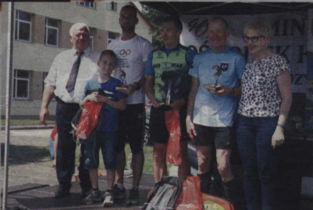
Najlepsi zawodnicy I Biegu Plebiscytowego w Janowie.