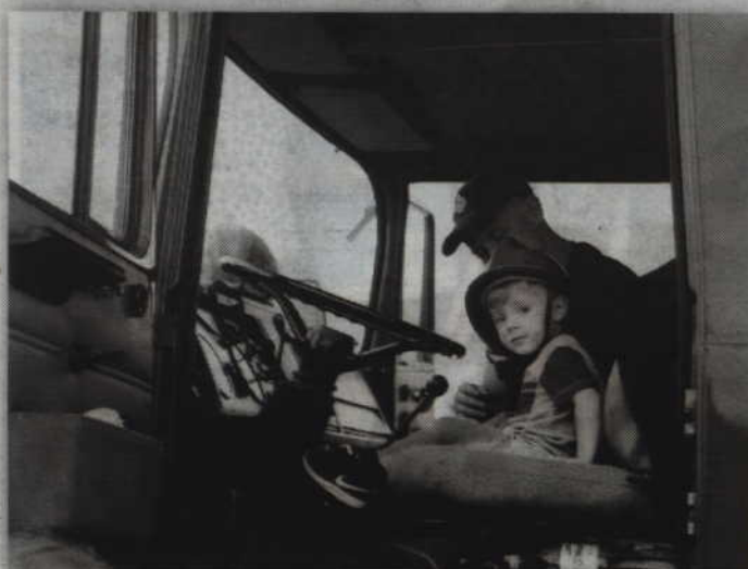
Można było zasiąść za kierownicą wozu bojowego i przez chwilę poczuć się jak jego kierowca.