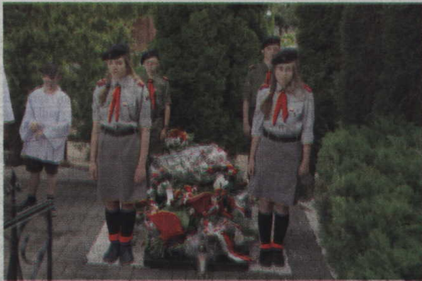
Przy symbolicznym grobie pomordowanych mieszkańców Janowa honorową wartę pełnili harcerze.

GMINA KWIDZYN. Mszą świętą, odprawioną w kościele pw. św. Jana Chrzciciela w Janowie, rozpoczęły się obchody 97 rocznicy plebiscytu na Warmii, Powiślu i Mazurach. Po nabożeństwie delegacje lokalnych samorządów, instytucji i organizacji złożyły kwiaty pod pomnikiem upamiętniającym pomordowanych mieszkańców Janowa. Rocznicowym obchodom przeprowadzenia plebiscytu towarzyszył także festyn oraz I Bieg Plebiscytowy.