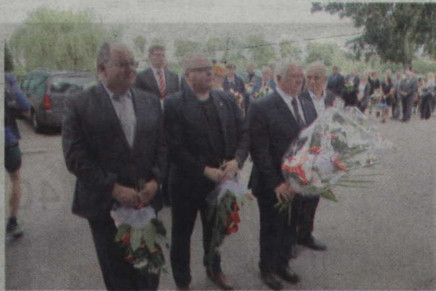
Wiązanki kwiatów złożyły delegacje kwidzyńskich samorządów, organizacji i stowarzyszeń.