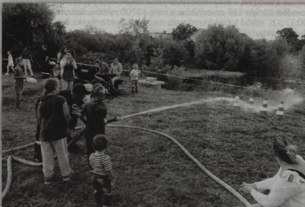
Przewracanie pacholków za pomocą strażackiej sikawki wzbudziło zainteresowanie wielu maluchów.

- Zorganizowaliśmy festyn strażacki po raz pierwszy. Mamy się jednak czym pochwalić, a nasza remiza zyskała nowe oblicze. Dysponujemy też sprzętem, który pozwala ratować nie tylko ludzki dobytek, ale również życie. W przyszłym roku OSP Nebrowo Wielkie zostanie także