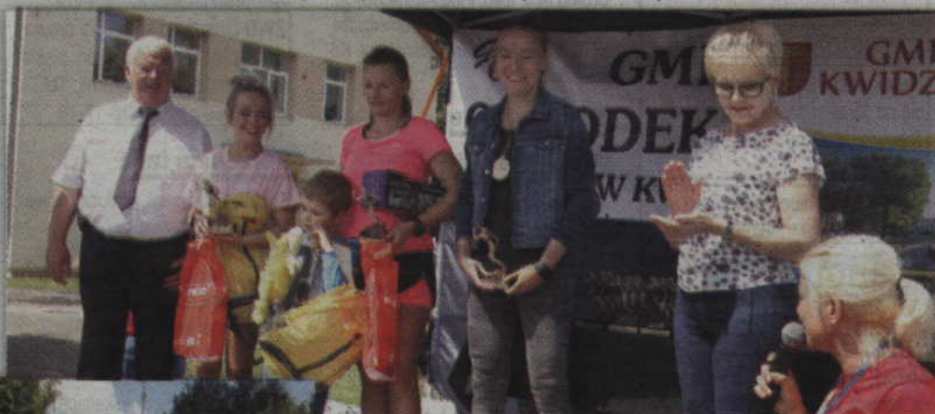
Najszybsze biegaczki w kategorii open - kobiet.