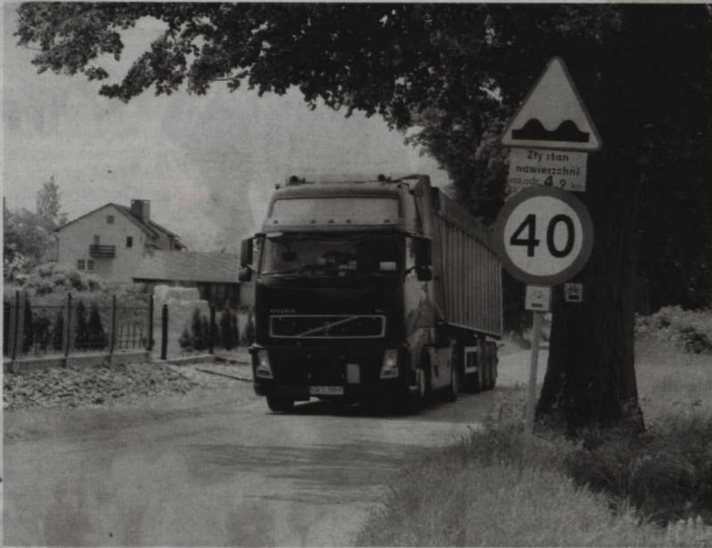
W tym roku ZDW w Gdańsku planuje tylko rozpoczęcie prac projektowych na drodze wojewódzkiej nr 520.

PRABUTY. Urząd Marszałkowski w Gdańsku odpowiedział na petycję mieszkańców Obrzynowa, Stańkowa, Jakubowa i Pachutek (gm. Prabuty). Na remont generalny drogi wojewódzkiej nr 520 mieszkańcy nie mają jednak co liczyć. Urzędnicy obiecali, że w tym roku rozpoczną się prace projektowe związane z remontem nawierzchni. Remont zostanie oczywiście wykonany, jak będą pieniądze!