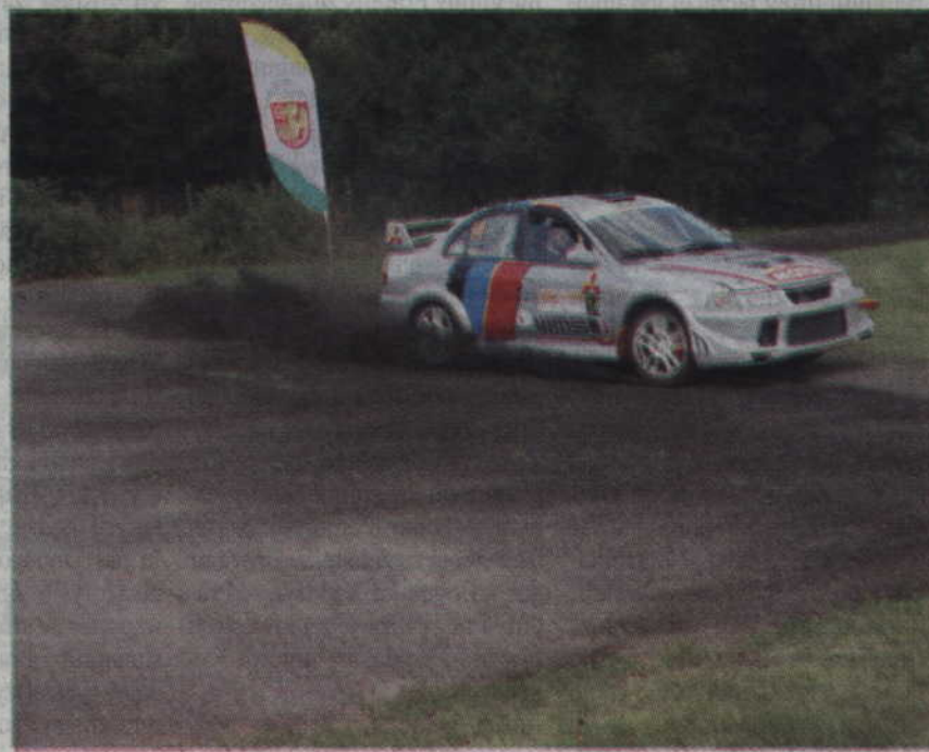
Atrakcją festynu były pokazy kunsztu rajdowego.