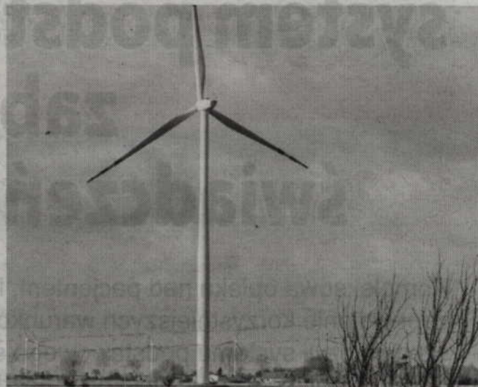
W pomorskim krajobrazie jest wiele takich wiatraków. W 2016 r. uruchomiona została druga elektrownia wiatrowa w Nowym Stawie. 14 turbin daje 28 megawatów mocy, która trafi do odbiorców. Może z niej skorzystać nawet 38 tys. gospodarstw.