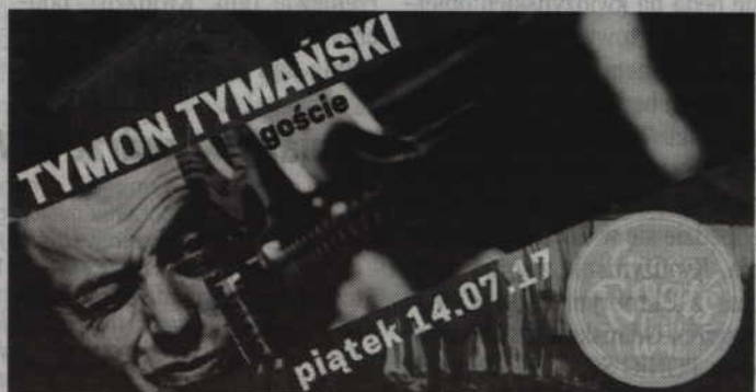
Jedną z gwiazd tegorocznego festiwalu będzie Tymon Tymański.