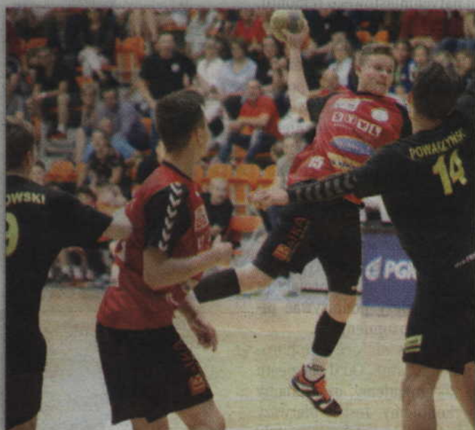
Wiodącą dyscypliną w szkole jest piłka ręczna, choć możliwe jest także uprawianie innych dyscyplin sportu..

- Największym problemem było utworzenie oddziałów mistrzostwa sportowego na wielu poziomach. Szkoła podstawowa tworzona jest od pierwszej klasy, dlatego zaszła konieczność aby przynajmniej część uczniów uprawiających piłkę ręczną przeszła do niej z innych szkół. Ze Szkoły Podstawowej nr 4 przeszli uczniowie przyszłych klas siódmych oraz piątej i szóstej, uprawiających tę dyscyplinę. Do tego dochodzą dwa najwyższe roczniki gimnazjum. Na bazie obecnych klas trzecich powstanie oddział w którym uprawiana będzie piłka ręczna. Będą też dotychczasowe grupy sportowe, w których dyscyplinami będą tenis oraz jazda konna. Utrzymamy także zajęcia dla naszych gimnazjalistów, dotyczące jazdy konnej, które odbywają się na Terenach Rekreacyjno-Wypoczynkowych „Miłosna”, w ramach wychowania fizycznego. Jest także