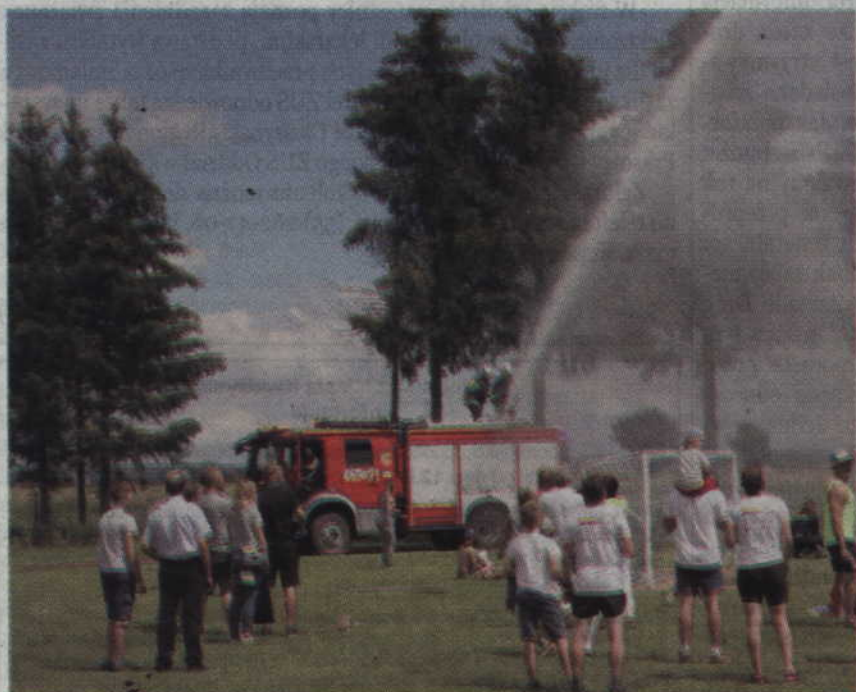
Podczas festynu na boisku przy szkole odbył się pokaz umiejętności strażackich.