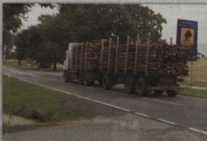
Już pod koniec sierpnia rozpoczną się długo oczekiwane prace remontowe na gardej- skim odcinku drogi krajowej nr 55.

- Odcinek drogi krajowej nr 55 pomiędzy Bądkami i Gardeją zostanie wyremontowany. Planujemy wykonanie remontu na przełomie sierpnia i września. Remont będzie przeprowadzony metodą nakładki bitumicznej i polegał będzie na częściowym sfrezowaniu starej nawierzchni