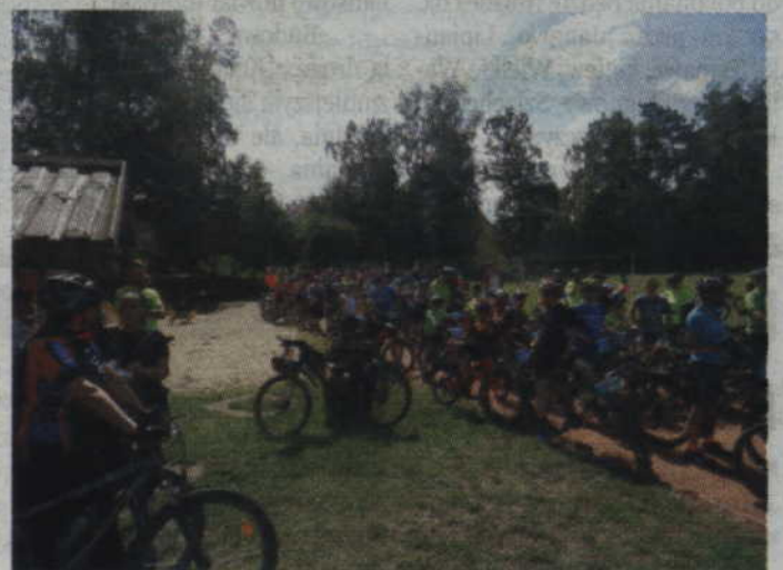
Liczba uczestników zaskoczyła organizatorów tegorocznego rajdu.