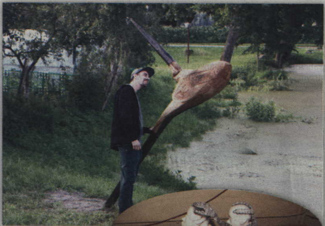
Efektowna rzeźba żaby stanęła nad stawem, który do życia chce przywrócić sołtys Rodowa.