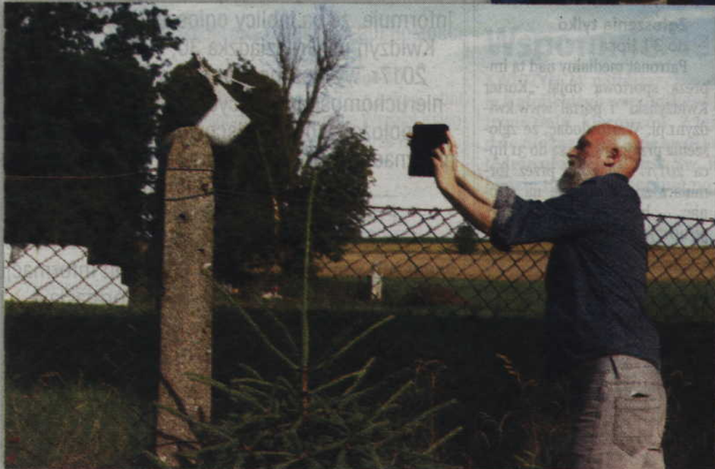
W tym roku wiele rzeźb miało niewielkie rozmiary.

- To jest takie trochę moje zagubienie. Każdy z nas ma w sobie,