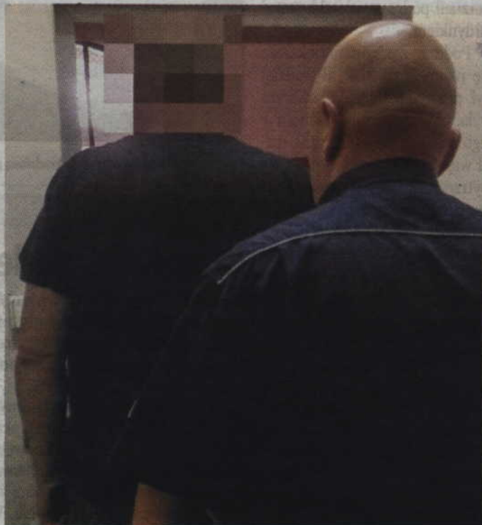
Wobec dwóch zatrzymanych osób sąd zastosował środek zapobiegawczy w postaci tymczasowego aresztowania.

Zatrzymane osoby zostały przewiezione do komendy, gdzie usłyszały zarzuty uprawy znacznej ilości narkotyków.