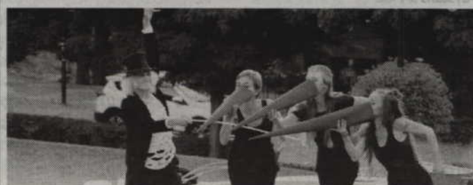
red. tech. KG

Impreza rozpocznie się o godz. 13.00, kiedy to swój program adresowany do dzieci przedstawią artyści z gdańskiego Teatru „Pinezka”. Klauni Ruphert i Rico odwiedzają Kwidzyn co roku i doskonale znani są publiczności. Artyści zaprezentują również swój spektakl „Pan Twardowski”. Nie zabraknie także innych stałych gości kwidzyńskiej imprezy takich jak krakowskie teatru „Nikoli” oraz „Scena Kalejdoskop”. Imprezę o północy zakończy natomiast fireshow w wykonaniu słupskiej grupy „Elding”. (fox)