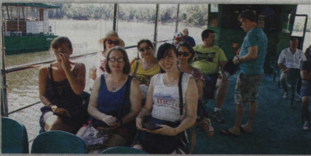
Nauczyciele odwiedzili m.in. miasto Vukovar oraz park natury „Kopački rit”.