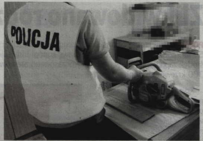
Policjantom udało się odzyskać skradzioną piłę.

Podczas zatrzymania okazało się również, że 21-letni złodziej był pijany. Badanie alko-testem wykazało 1,5 promila alkoholu w jego organizmie. Mężczyzna trafił więc do policyjnej celi. Kiedy wytrzeźwiał śledczy przedstawili mu zarzut kradzieży. Za to przestępstwo grozi mu do 5 lat pozbawienia wolności. (fox)