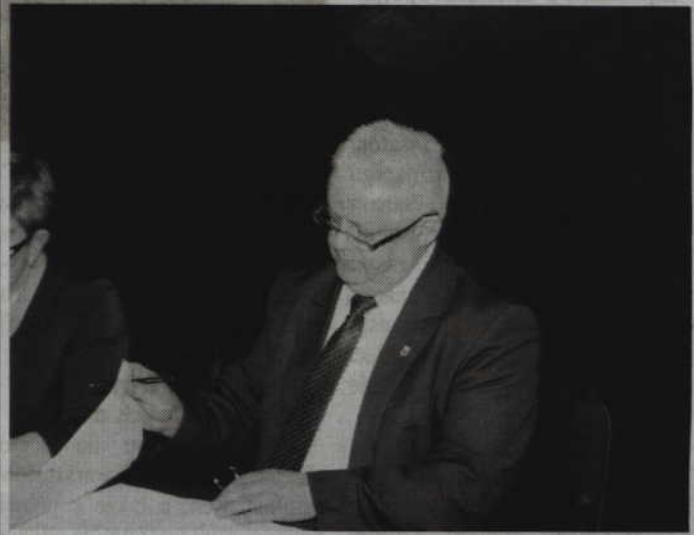
Gardejscy radni uznali, że budżet w 2016 roku był realizowany zgodnie z harmonogramem i podjęli uchwałę o udzieleniu wójtowi absolutorium.