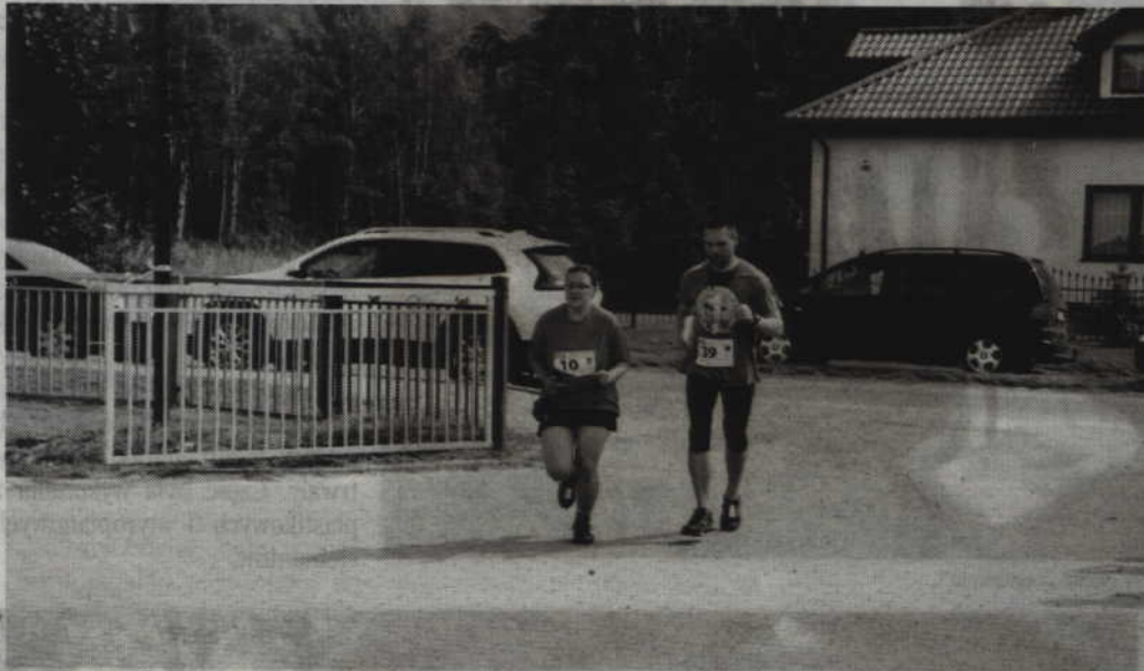
Ubiegłoroczny bieg odbywał się na trasie 5 km. W tym roku dystans będzie dwukrotnie dłuższy.

SADLINKI. 9 sierpnia odbędzie się II Otwarty Bieg Przelajowy o Puchar Wójta Gminy Sadlinki. Organizatorem zawodów jest urząd gminy oraz Traktor Team Gmina Kwidzyn, a patronat medialny nad imprezą sportową objął „Kurier Kwidzyński” oraz portal www.kwidzyn1.pl . Organizatorzy zaplanowali udział 300 zawodników, jednak już dziś zapisało się aż 291 osób! Można więc powiedzieć, że impreza będzie frekwencyjnym sukcesem.