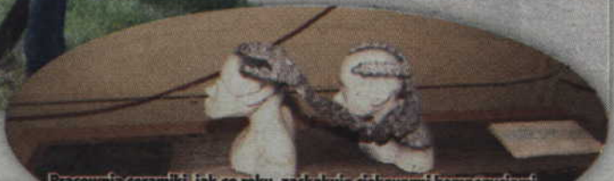
Pracownia ceramiki, jak co roku, zaskakuje ciekawymi kompozycjami.