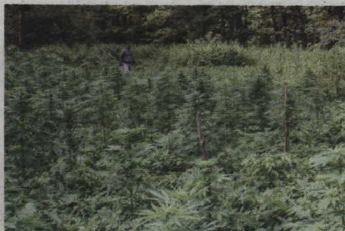
Na dwóch plantacjach znajdowało się ponad 300 krzewów konopi indyjskich.

Za tego typu przestępstwo grozi kara do 8 lat pozbawienia wolności. Warto również dodać, że wobec dwóch zatrzymanych osób sąd zastosował środek zapobiegawczy w postaci tymczasowego aresztowania. (fox)