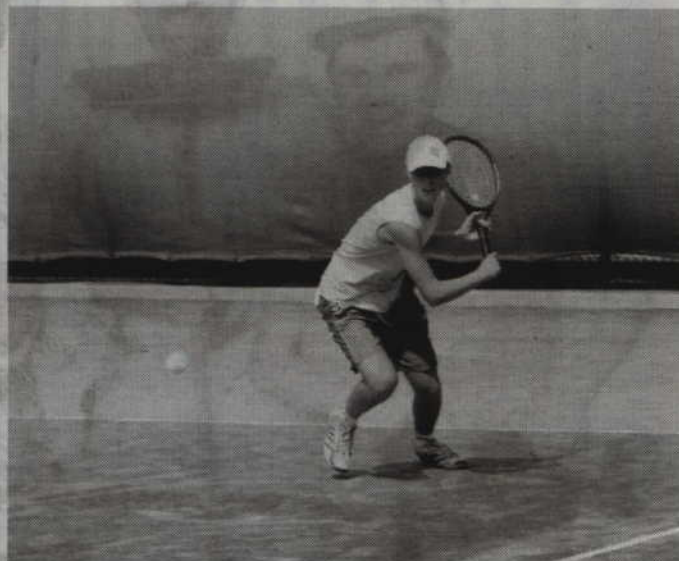
KCSiR zachęca m.in. do korzystania z kortów tenisowych oraz wypożyczalni sprzętu sportowego.

Zupełnie bezpłatne jest natomiast korzystanie z kortów tenisowych nad Liwą przy ul. Baczyńskiego. Korty czynne są codziennie w godz. 14.00-20.00. Boisko można natomiast rezerwować codziennie, wyłącznie osobiście, w godzinach otwarcia kortów. (fox)