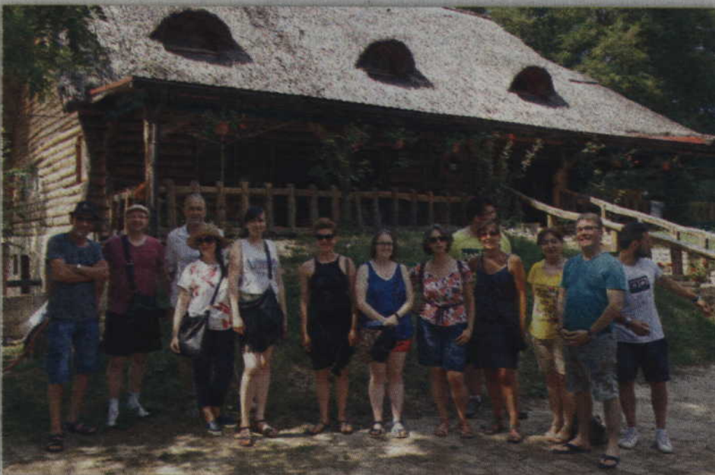
W podsumowaniu projektu uczestniczyli nauczyciele z ośmiu państw europejskich: Francji, Hiszpanii, Włoch, Grecji, Chorwacji, Anglii, Litwy oraz Polski.