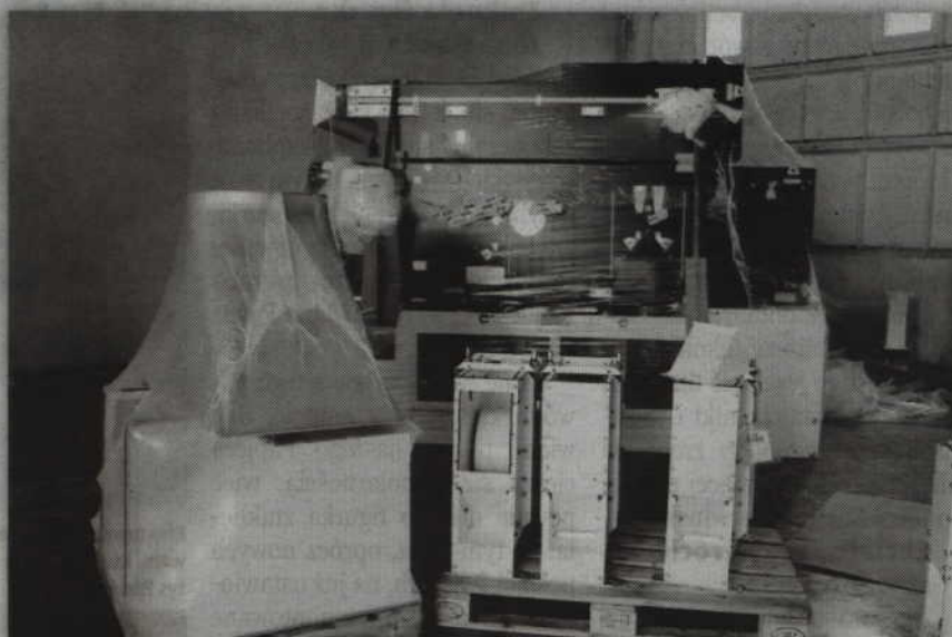
W Górkach powstaną m.in. nowe silosy zbożowe, a cały proces transportu, zasypu i wydania ziarna będzie można śledzić na ekranie monitora dzięki zastosowaniu wizualizacji graficznej.