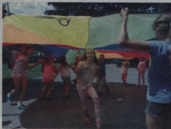
Zabawy z chustami zawsze dają dzieciom dużo radości.