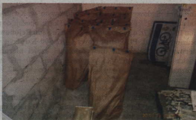
W trakcie przeszukań funkcjonariusze zabezpieczyli również nawozy oraz sprzęt służący do uprawy konopi.