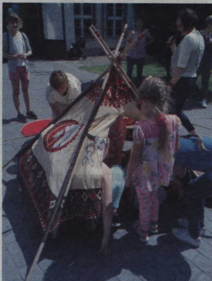
Budowa indiańskiego wigwamu nie było najłatwiejszym zadaniem.