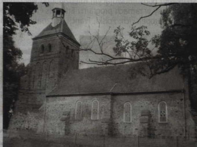
Dach na trumiejskim kościele po raz ostatni był remontowany pod koniec XIX wieku.

Kościół w Trumiejach pw. Chrystusa Króla jest kościołem filialnym, należącym do Parafii Rzymskokatolickiej pw. Trójcy Przenajświętszej w Trumiejach. Remont tego obiektu zabytko-