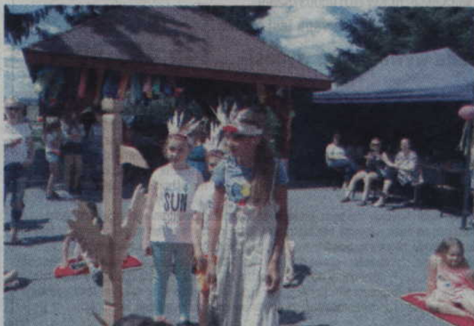
Indiańskie stroje i totemy zawładnęły uczestnikami „tęczowej soboty”.