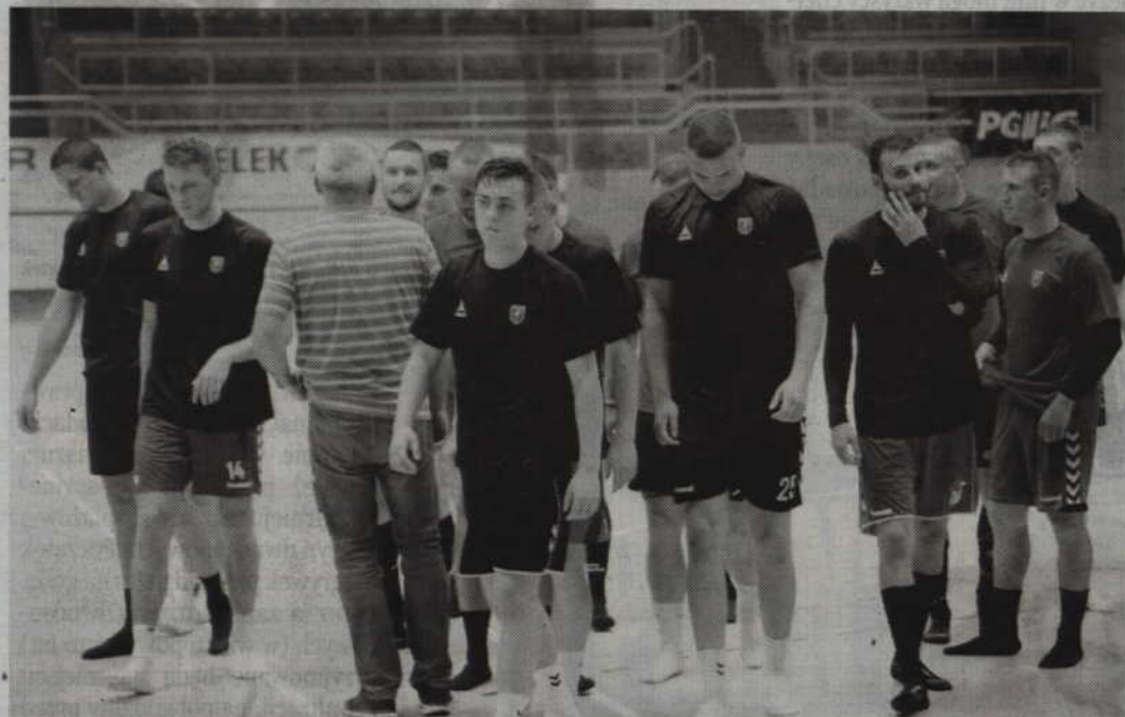
Gracze MMTS Kwidzyn zakończą pierwszy tydzień przygotowań sparingiem rozegranym w Gdyni.