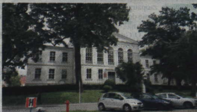
Jeden realizowanych projektów dotyczy modernizacji budynku Zespołu Szkół Ponadgimnazjalnych nr 1 wraz z zakupem niezbędnego wyposażenia.

Do Urzędu Marszałkowskiego wysłaliśmy specyfikację w celu jej sprawdzenia. Taka procedura obowiązuje przy wszystkich naszych inwestycjach na które uzyskaliśmy środki unijne. Po akceptacji specyfikacji ogłosimy przetarg. Urządzenia potrzebne nam są w drugiej połowie przyszłego roku, ale chcemy szybciej rozstrzygnąć przetarg i zakupić wyposażenie dla pracowni. Uważam, że w ciągu miesiąca przetarg powinien zostać ogłoszony. Wicestarosta kwidzyński do-