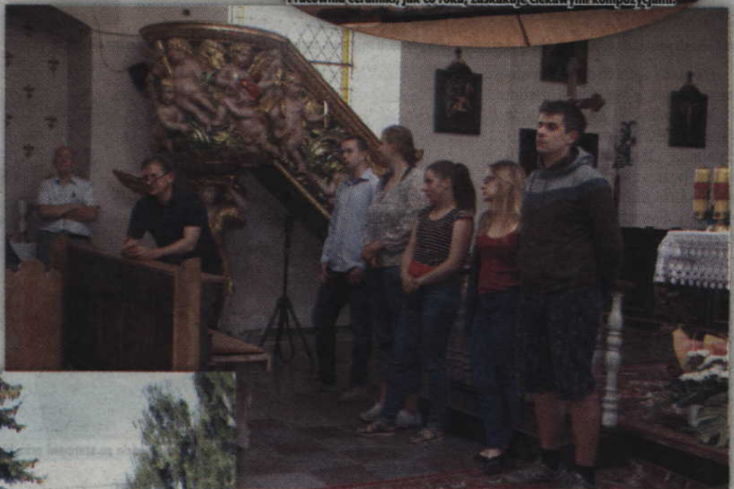
Podczas pleneru tradycyjnie już odnawiano kolejne elementy wyposażenia rodowskiego kościoła.