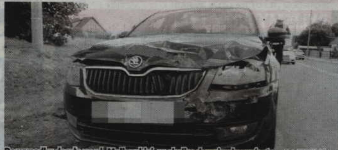
Do wypadku doszło na ul. Malborskiej, w okolicach wyjazdu z miasta.

-Ze wstępnych ustaleń policyjnych wynika, że 38-letni mieszkaniec Malborka, kierujący skodą octavią, nie zachował bezpiecznej odległości i uderzył w tył jadącego przed nim bmw. W wyniku zderzenia ranna została kobieta kierująca bmw. Poszkodo-