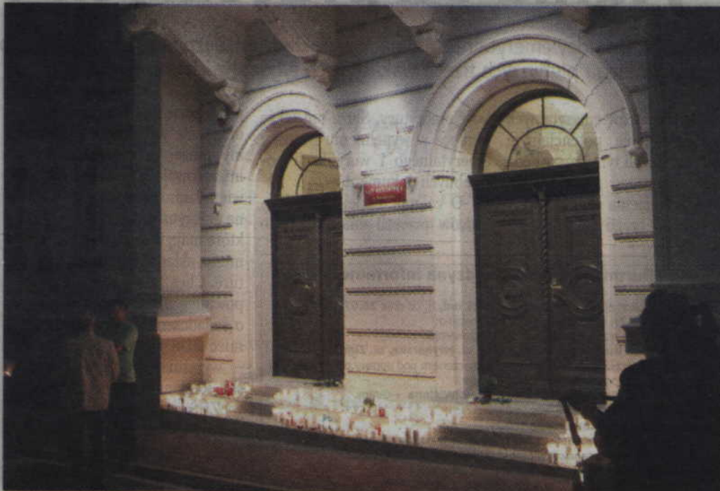
Na koniec protestujący zostawili zapalone świece na schodach gmachu sądu.