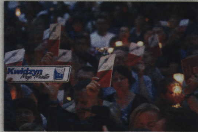
Protestujący przynieśli świece, teksty Konstytucji oraz flagi.

- Nie ja – odparł J. Borchuch. - Konstytucja, Konstytucja, Kon-