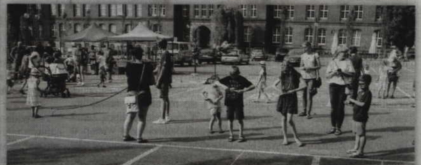
Maluchy chętnie brały udział w przygotowanych zabawach.