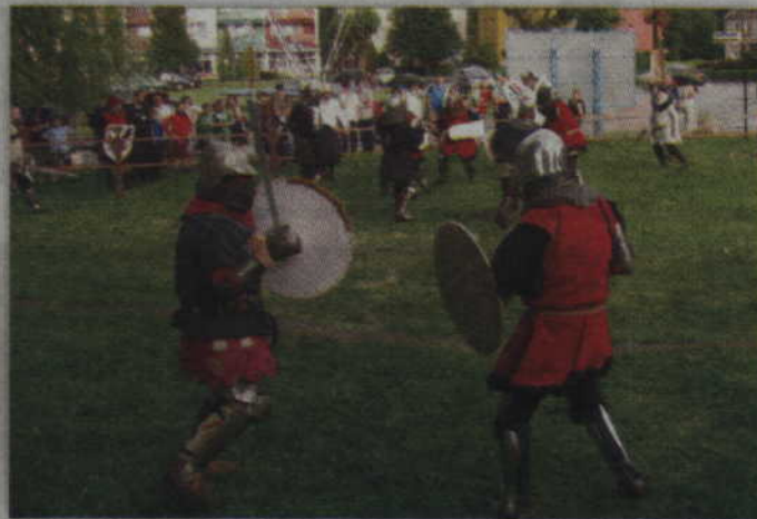
Sobotni festyn rycerski rozpocznie się o godz. 16.00.

PRABUTY. Prabuckie Centrum Kultury i Sportu zaprasza na piknik rycerski „Epoka Miecza i Krzyża”. Festyn odbędzie się w najbliższą sobotę, 29 lipca o godz. 16.00, na placu katedralnym w Prabutach. Wstęp wolny.