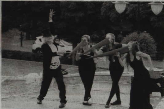
Jednym ze stałych gości kwidzyńskiej imprezy jest krakowski Teatr „Nikoli”.

Impreza rozpocznie się o godz. 13.00, kiedy to swój program adresowany do dzieci przedstawią artyści z gdańskiego Teatru „Pinezka”. Klauni Ruphert i Rico odwiedzają Kwidzyn co roku i doskonale znani są publiczności. Artyści zaprezentują również swój spektakl „Pan Twardowski”. Nie zabraknie także innych stałych gości kwidzyńskiej imprezy takich jak krakowskie teatru „Nikoli” oraz „Scena Kalejdoskop”. Imprezę o północy zakończy natomiast fireshow w wykonaniu słupskiej grupy „Elding”. (fox)