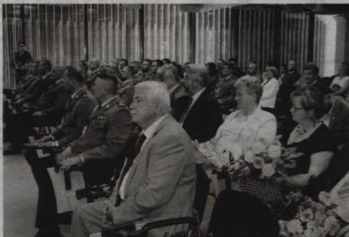
Uroczystości związane ze Świętem Policji odbyły się w sali Kwidzińskiego Parku Przemysłowo-Technologicznego.