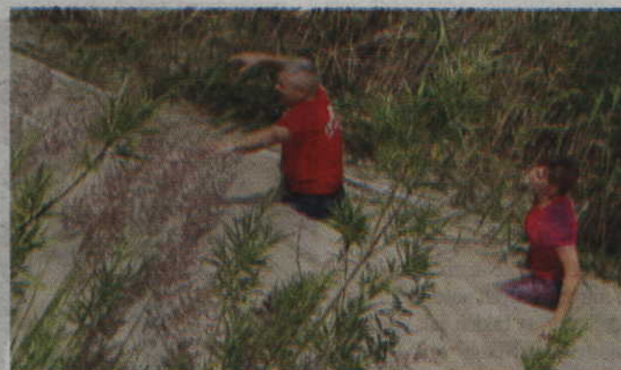
Jeden z odcinków to nic innego jak zbiornik wodny!

Organizatorzy pierwszego półmaratonu rozegranego w Parparach podkreślają, że nie chcą poprzestać tylko na jego jednej edycji. Na przyszły rok planują rozegranie drugiego półmaratonu. Chcą, aby ta impreza na stałe zagościła w kalendarzu imprez biegowych, organizowanych w naszej najbliższej okolicy. (RB)