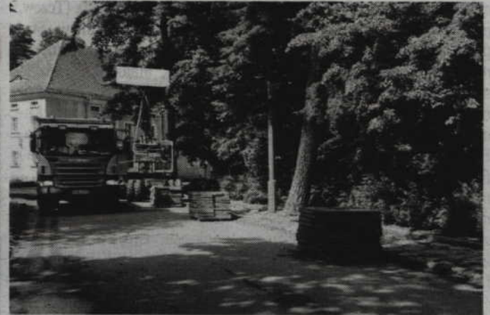
Na kilku prabuckich ulicach pojawiły się ekipy budowlane.