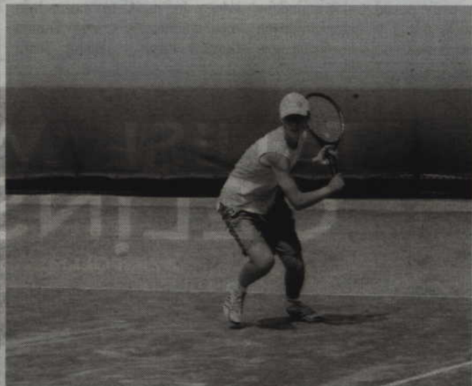
KCSiR zachęca m.in. do korzystania z kortów tenisowych oraz wypożyczalni sprzętu sportowego.

Zupełnie bezpłatne jest natomiast korzystanie z kortów tenisowych nad Liwą przy ul. Baczyńskiego. Korty czynne są codziennie w godz. 14.00-20.00. Boisko można natomiast rezerwować codziennie, wyłącznie osobiście, w godzinach otwarcia kortów. (fox)