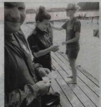
Kwidzińscy policjanci kontrolują kąpieliska, plaże oraz miejsca wypoczynku dzieci i młodzieży.

Podczas kontroli policjanci sprawdzają czy dzieci wypoczywają pod nadzorem osób dorosłych, a także czuwają nad prawidłową postawą młodzieży w trakcie szaleństw wodnych. Funkcjonariusze przestrzegali również, że kąpiel i korzystanie ze sprzętów wodnych po alkoholu jest zabroniona. Informowali również, że zbiorniki wodne nie posiadające żadnego zabezpieczenia i oznakowania mogą być bardzo niebezpieczne, a kąpiel w takich miejscach stanowi poważne zagrożenie dla naszego życia i zdrowia. Jak podkreśla rzeczniczka