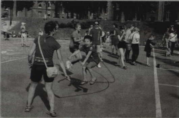
Dzieci chętnie próbowali swych sił w skokach przez sznur.