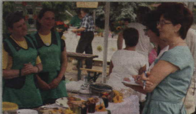
Potrawy przygotowane przez panie z kół gospodyń wiejskich są oceniane przez specjalną komisję konkursową.

RYJEW. Już po raz ósmy w Ryjewie odbędzie się Powiślański Turniej Gmin połączony z festiwalem disco-polo. - Zapraszamy jednak nie tylko sympatyków muzyki disco-polo. Zapowiada się doskonała zabawa – podkreśla Jerzy Luty, prezes Fundacji Powiślańskiej, głównego organizatora imprezy. Podobnie jak rok temu dwudniowa zabawa (28-3 lipca) odbywać się będzie na terenie starej cegielni przy ul. Różanej 8. Wstęp wolny.