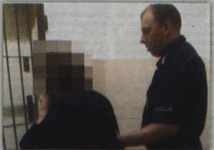
Kobieta odpowie za zabójstwo przed sądem. Grozi jej kara do 25 lat więzienia, a nawet dożywocie.

- W trakcie spożywania alkoholu pomiędzy sprawczynią a jej 42-letnim partnerem doszło do sprzeczki, podczas której kobieta raniła nożem swojego towarzysza w łydkę. Mężczyzna zmarł. Kobieta trafiła natomiast do policyjnego aresztu. W chwili zatrzymania była pijana. Badanie na zawartość alkoholu w jej organizmie wykazało ponad 1,6 promila - wyjaśnia mł. asp. Bo-