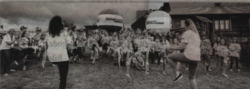
Część dzieci wypoczywać będzie w górskich miejscowościach: Murzasichle i Sierockie.