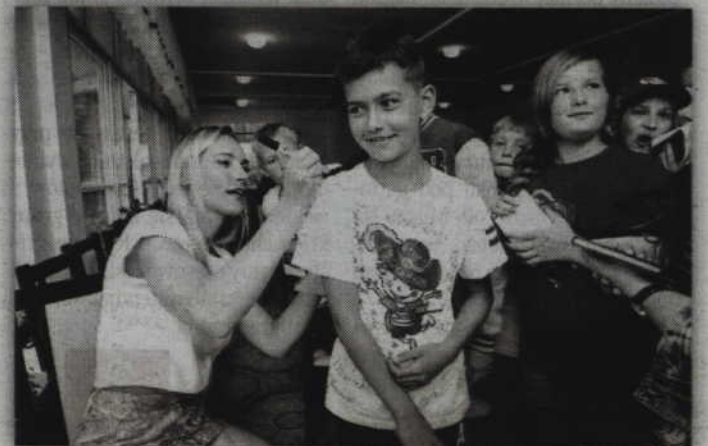
Akcję wspiera medalistka olimpijska Sylwia Gruchała.

– Pozornie to bardzo proste słowa: odwaga, uczynność, otwartość, wrażliwość, mądrość, sumienność, pracowitość i uczciwość, ale życie pokazuje, że najprostsze rzeczy są najtrudniejsze. Jeśli się ich nie zaszczepi, nie nauczy w młodym wieku pojawiają