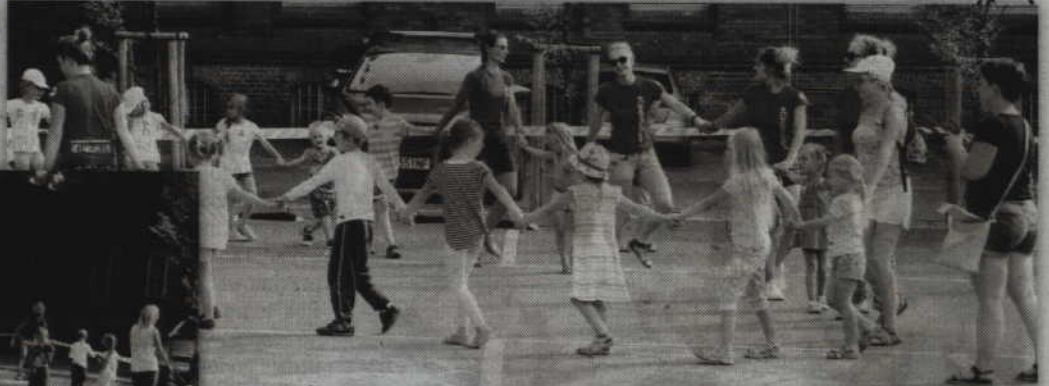
Instruktorki KCK prowadziły także zabawy taneczne.

KWIDZYN. Popularne zabawy podwórkowe, puszczenie baniek czy też zabawy taneczne to tylko niektóre z atrakcji przygotowanych przez Kwidzińskie Centrum Kultury z okazji Dnia Pszczółki Mai. Specjalny festyn zorganizowany z tej okazji odbył się na parkingu przed budynkiem KCK przy ul. 11 Listopada. Było więc miejsce na malowanie kredą, grę w gumę, w sznura czy też popularną zośkę.