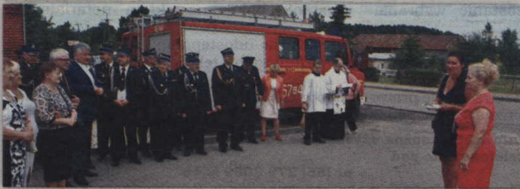
W rocznicowych uroczystościach wzięli udział nie tylko mieszkańcy, ale również przedstawiciele PSP w Kwidzynie, jednostek OSP z terenu gminy, rady gminy i rady powiatu.