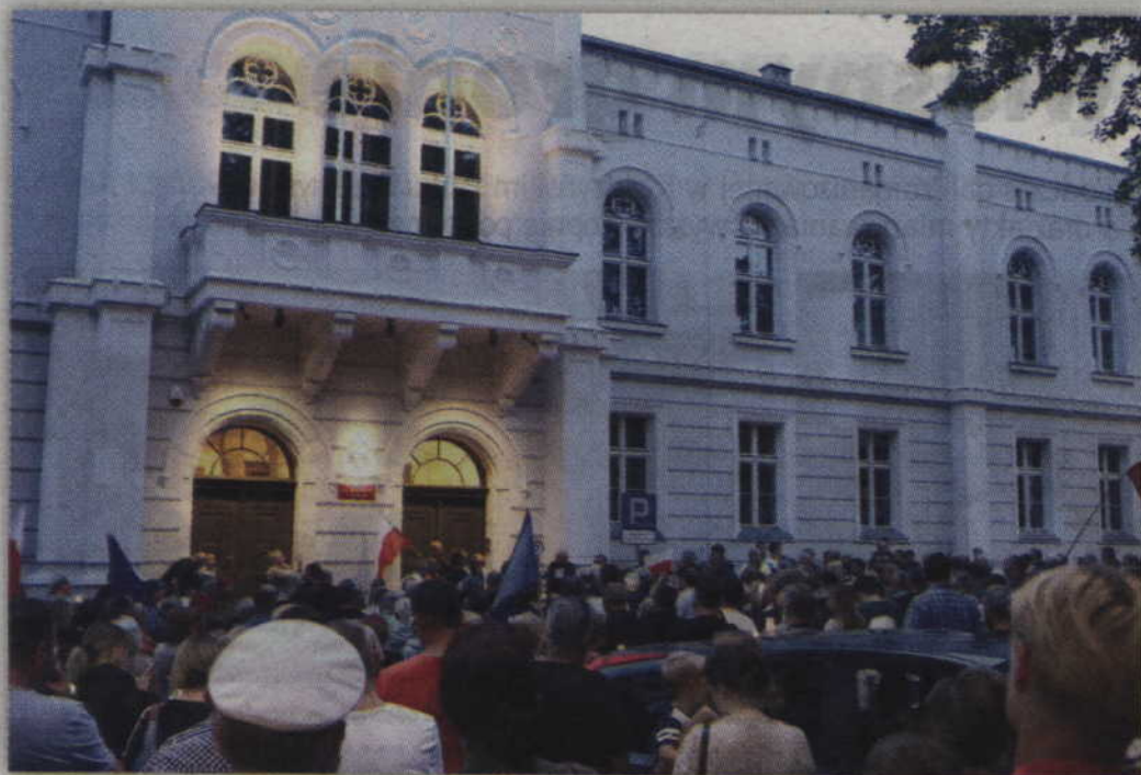
„Wolność – równość – demokracja”, „Chcemy weta” – to tylko niektóre okrzyki jakie skandowali zebrani.