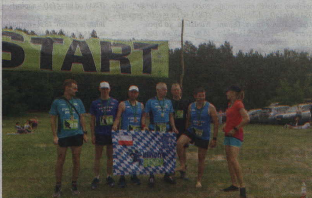
W I półmaratonie nie mogło zabraknąć zawodników ze stowarzyszenia Kwidzyn Biega.

Trasa nie należała do najłatwiejszych. Mówili o tym uczestnicy sportowego, leśnego aramgedonu. Na trasie były m.in. odcinki, na których trzeba było pokonywać przeszkody wodne. Organizatorzy zadbał także o to, aby bieg minimalnie ingerował w środowisko leśne. Uczestnicy dostosowali się do próśb i na trasie biegu wszystkie śmieci wy-