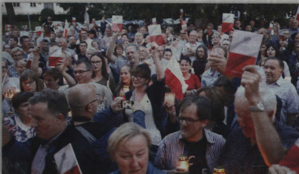
Protestująca grupa przeciwników ostatnich działań PiS zebrała się pod gmachem kwidzyńskiego sądu.