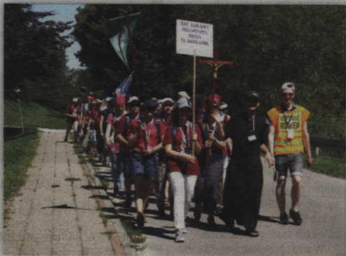
Z Kwidzyna na Jasną Górę wyruszyło kilkadziesiąt osób.