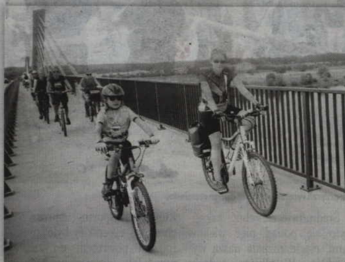
Rowerowa wyprawa organizowana jest na pamiątkę drogowego połączenia Powiśla z Kociewiem. Uczestnicy rajdu musieli więc oczywiście przejechać przez most łączący