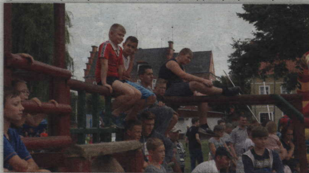
Oglądający pokazy rycerskie szukali jak najlepszych punktów widokowych.