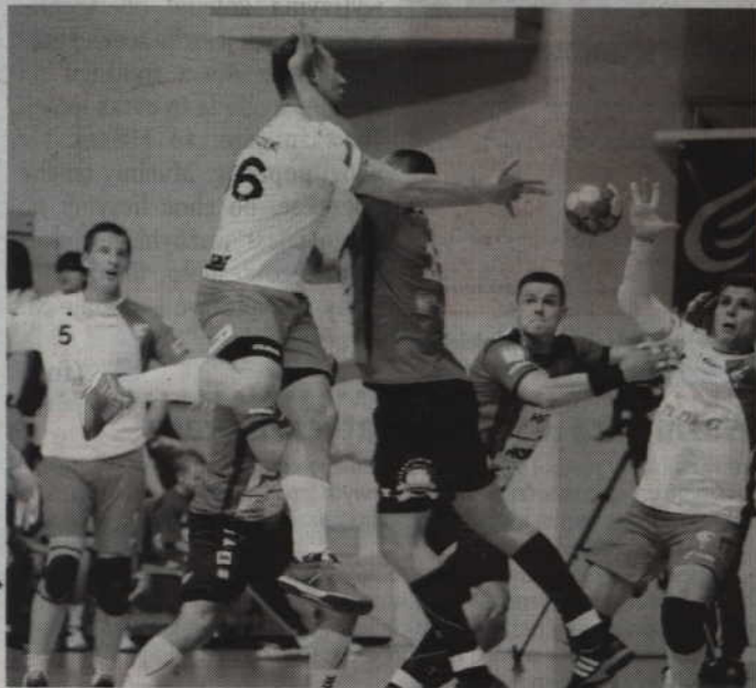
Zawodnicy MMTS Kwidzyn rozpoczną swoje ligowe zmagania 2 września od meczu z Górnikiem Zabrze.

PIŁKA RĘCZNA. Choć niektórzy zaczęli się już martwić przeciągającym się procesem licencyjnym klub MMTS Kwidzyn S.A. otrzymał w końcu prawo gry w PGNiG Superlidze Mężczyzn w sezonie 2017/2018. Razem z kwidzińskim zespołem licencję otrzymało także KPR Legionowo, które odwołało się od wcześniejszej odmowy Komisarza Ligi.