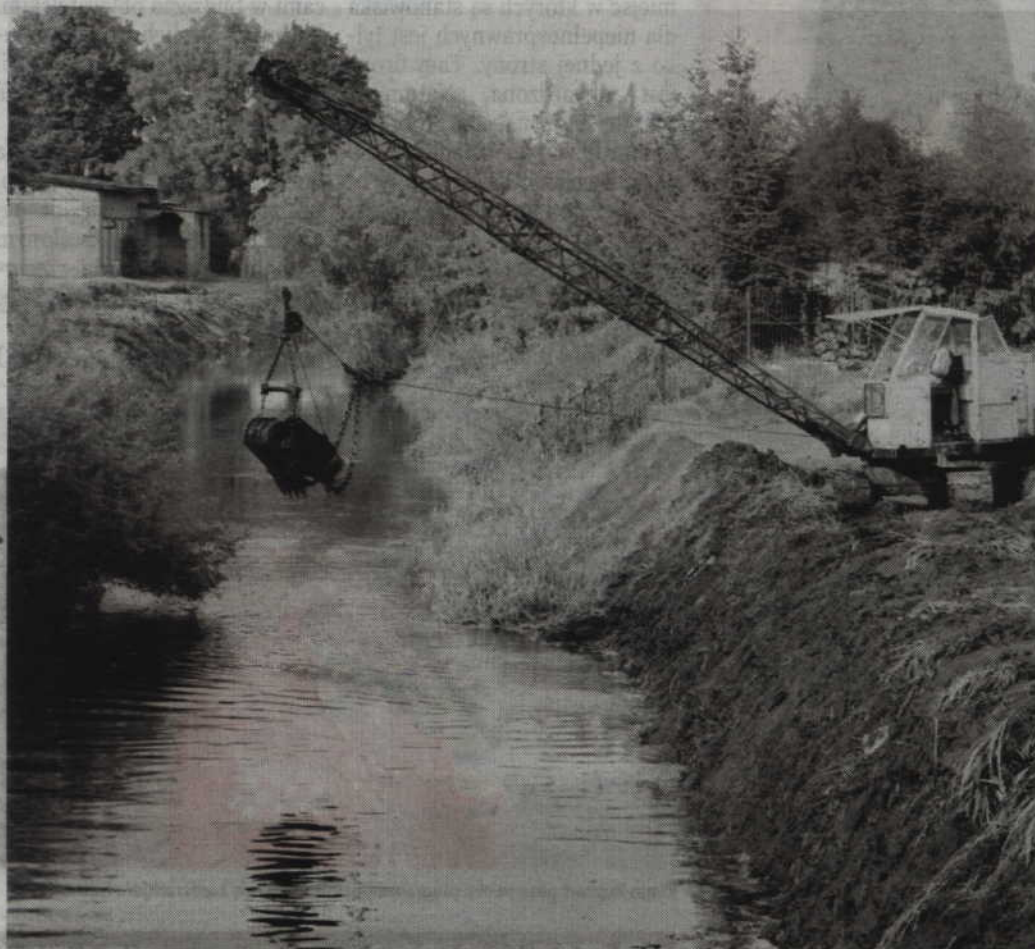
Sytuację poprawić ma tzw. hakowanie dna rzeki czyli usuwanie nadmiaru roślinności.

POWIAT. W ubiegły czwartek poziom wody w Liwie osiągnął 124 cm. Warto przy tym dodać, że już poziom 120 cm powoduje, że odpływ wody z rzeki staje się wolniejszy, a przy intensywnych opadach deszczu poziom ten może szybko wrosnąć. Dlatego kilka lat temu zawarto porozumienie z Regionalnym Zarządem Gospodarki Wodnej, dotyczące regulacji poziomu wody na jazie w Białej Górze, aby wody Liwy mogły spływać szybciej.