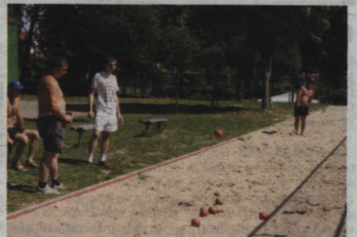
O godzinie 11.00 zaplanowano początek wakacyjnych rozgrywek w bocce na piasku.

Sobotnią rywalizację zamyka drugi wakacyjny turniej minigolfa, który zaplanowano na godzinę 16.00. Podobnie jak we wcześniejszych turniejach w zmaganiach mogą brać udział osoby mające powyżej 16 lat, przy czym nieletni muszą posiadać przy sobie podpisane pisemne oświadczenie o zgodzie na udział swych dzieci w rozgrywkach. Zapisy tak jak we wcześniejszych rozgrywkach przyjmowane są na pół godziny przed początkiem turnieju.