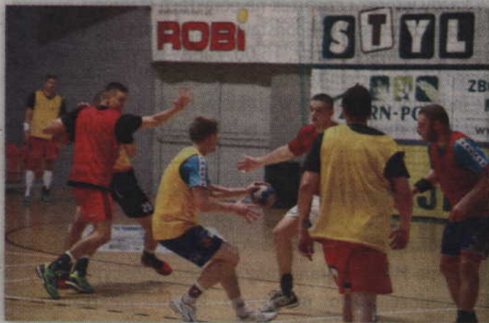
Wewnętrzna gierka zakończyła się zwycięstwem „Czerwonych” 32:26.