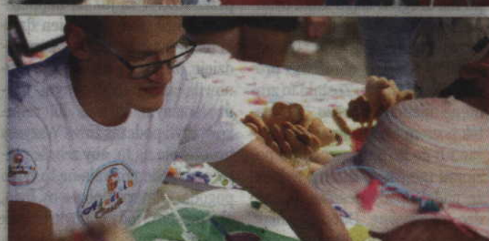
Warsztaty z lukrowania ciastek przyciągały zarówno dzieci, jak i nieco starszych.