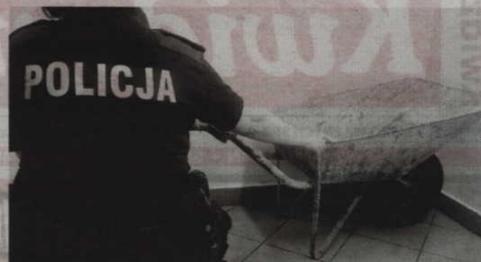
Jednym z odzyskanych łupów była taczka.