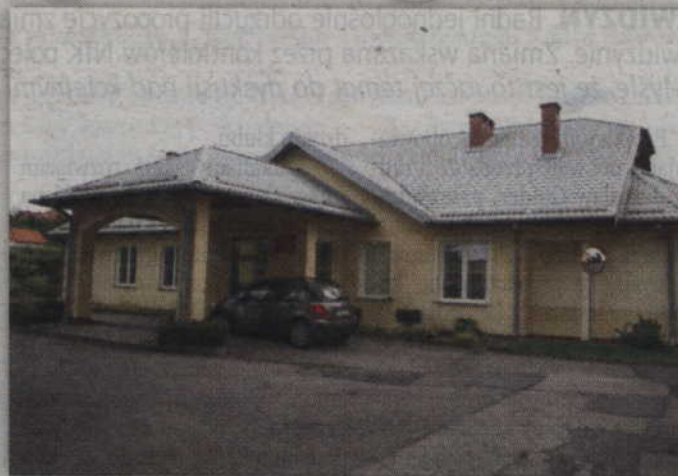
Starostwo powiatowe liczy, że uda się rozpocząć rozbudowę hospicjum już we wrześniu.