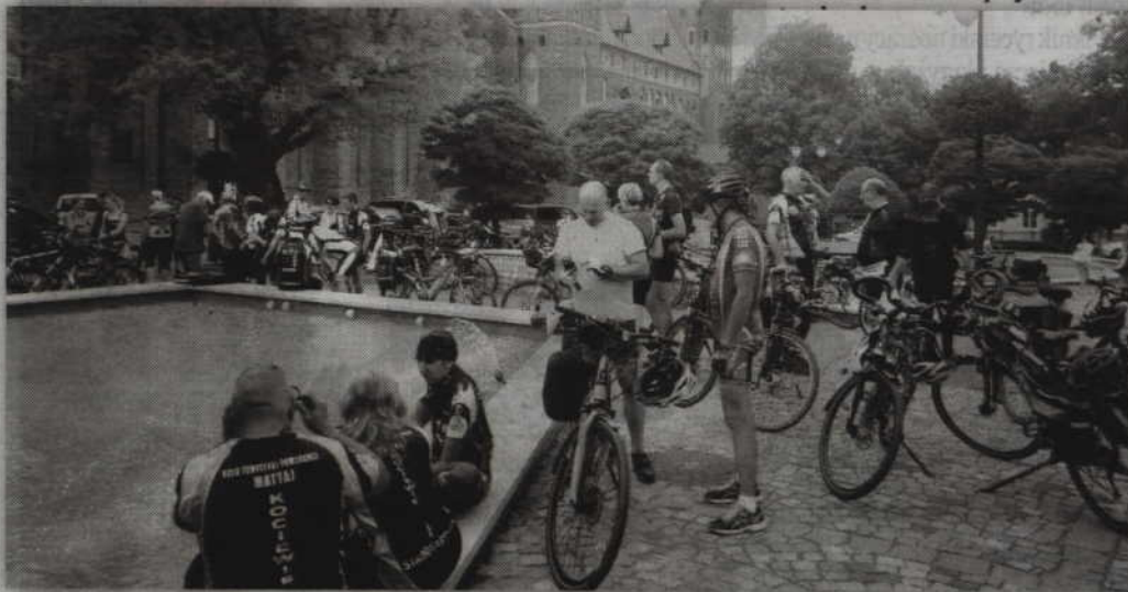
Uczestnicy tegorocznej edycji rajdu zatrzymali się m.in. na Placu Jana Pawła II.

Gniew oraz Gmina Morzeszczyn. Dodatkowo impreza została wsparta finansowo z budżetu Powiatu Tczewskiego.