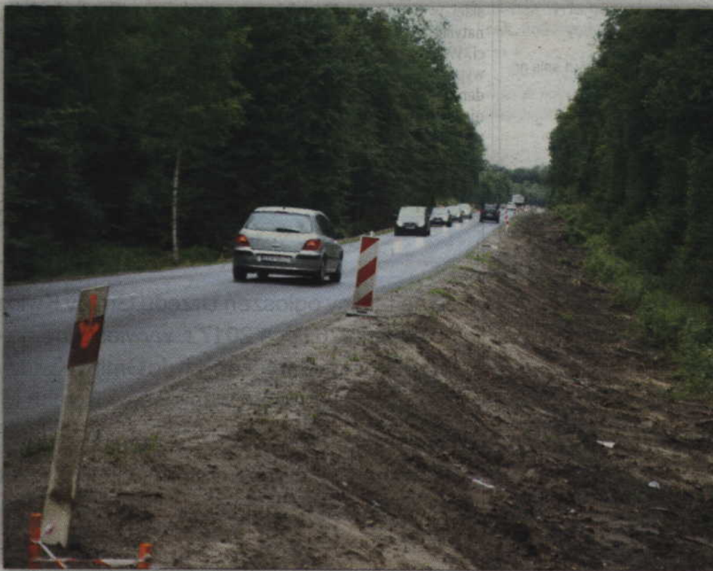
Prace drogowe rozpoczęły się na leśnym odcinku drogi wojewódzkiej nr 521 pomiędzy Liczem a Raniewem.