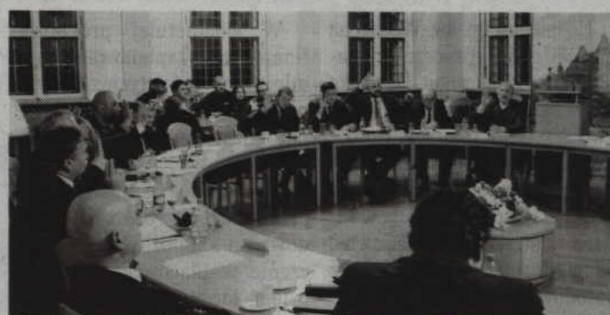
Radni zgodnie odrzucili propozycję zmian w regulaminie Kwidzińskiego Budżetu Obywatelskiego.

-O naszym budżecie można powiedzieć, że możemy go cały czas zmieniać, ulepszać. Jest jak ulica i trzeba go naprawiać, przebudowywać, ulepszać go do ludzkich potrzeb. Budżet to nauka mechanizmów demokratycznych dla całego społeczeństwa, więc wymaga czasu. Zamiast krytykować lepiej pracować nad tym, żeby był coraz lepszy, bardziej otwarty na ludzi, organizacje pozarządowe, grupy nieformalne.