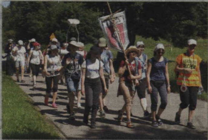
Pątnicy ze Sztumu to przede wszystkim młodzież.