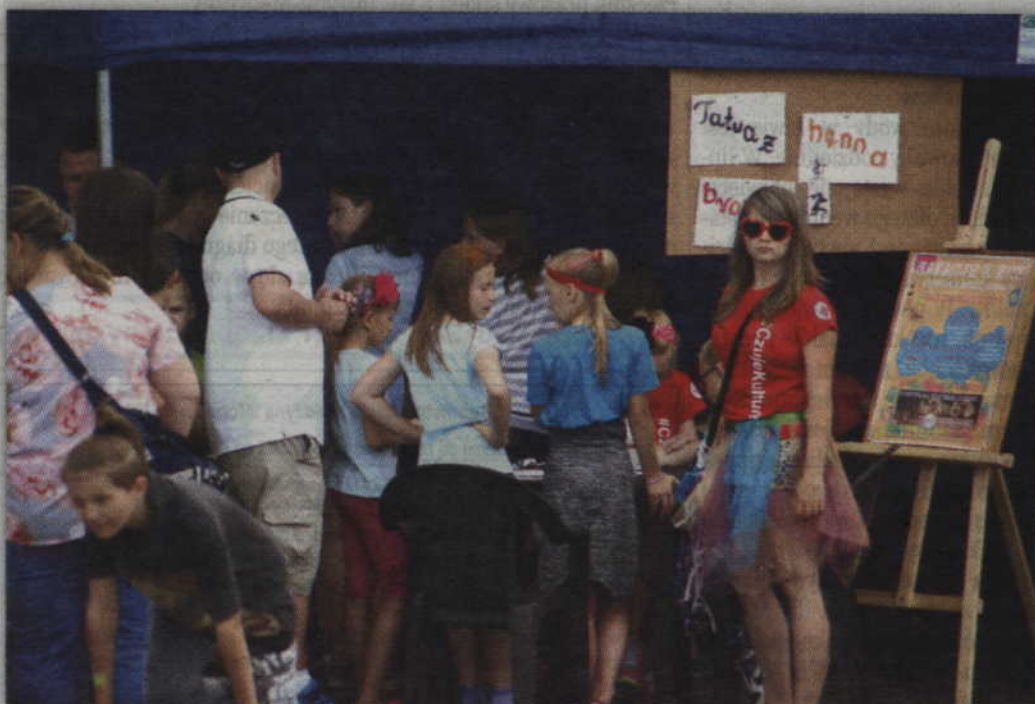
Chętnych do zrobienia tatuażu z henny nie brakowało. red. tech. BR