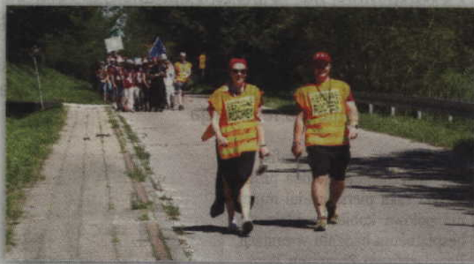
Pielgrzymka nie może się obejść bez osób odpowiedzialnych za bezpieczne poruszanie się po drogach.

- Po raz pierwszy wyruszyłem do Częstochowy gdy miałem 17 lat. W tym roku po raz drugi piel-