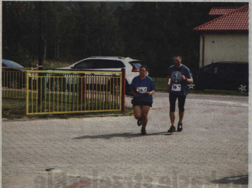
Do drugiej edycji biegu o puchar wójta gminy Sadlinki zapisało się 300 biegaczy.

Biuro zawodów usytuowane na terenie szkolnego boiska będzie czynne w dniu zawodów, 5 sierpnia od godz. 08.00-09.30. Trasa biegu wynosi 10 km (1 pętla) i prowadzi drogami leśnymi i asfaltowymi. Udział w biegu jest bezpłatny, a limit uczestników to