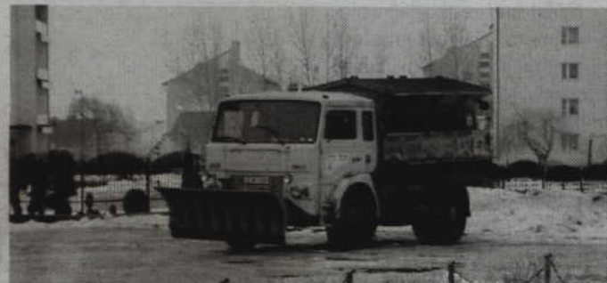
Jak podkreśla starostwo powiatowe w Kwidzynie, firmy, które wygrają przetargi, muszą mieć dostęp do sprzętu ciężkiego.

Standard zimowego utrzymania będzie taki sam jak w ubiegłym roku. Polega on na utrzymaniu przejezdności dróg i likwidacji śliskości jezdni. W 2014 roku samorząd powiatu postanowił zwiększyć zawartość soli w