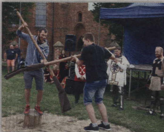
Tak przyszli rycerze uczyli się swego rzemiosła.