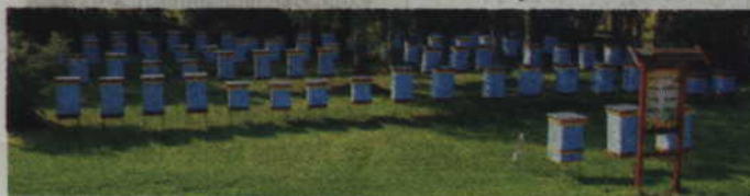
Pasieka w Lubaniu powstała w końcu lat 70. Na przełomie 2013 i 2014 r. przeszła gruntowną modernizację, zamieniając się w Pomorskie Centrum Pszczelarskie.

Jak informuje PODR, w Pomorskim Centrum Pszczelarstwa odbywają się konferencje, szkolenia i pokazy dla pszczelarzy. W pasiece można zwiedzić pszczelarską ścieżkę edukacyjną. Od samego początku działalności pasieki w Lubaniu, hodowano w niej matki pszczele. W chwili obecnej produkuje się ich ponad tysiąc w ciągu sezonu pasiecznego. Jak podkreślają specjaliści, utrzymuje się