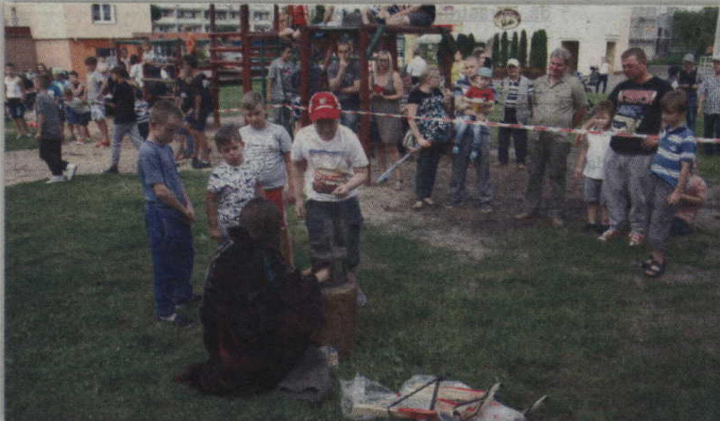
Na miejscu damy dworu wybijały także średniowieczne monety.