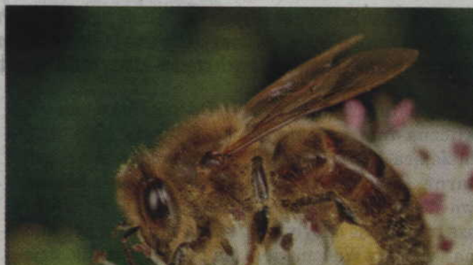
Choć pszczoły kojarzą się głównie z kwiatami, to zawdzięczamy im większość spożywanych przez ludzi pokarmów.

- Zawdzięczamy im warzywa, takie jak pomidory czy cukinia, owoce takie jak jabłka, orzechy – na przykład migdały czy ziola służące nam za przyprawę. Dotyczy to także olejów jadalnych – na przykład oleju rzepakowego. W samej Europie ponad cztery tysiące odmian warzyw zależy od zapylania przez pszczoły i inne owady. Jesteśmy od nich uzależnieni, a one umierają – w coraz większej skali. Śmierć pszczoł to nasz ludzki problem. Nasze życie zależy od ich istnienia – przypomina Greenpeace Polska.