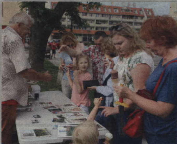
Na pikniku rycerskim można było nabyć publikacje związane z historią Prabut.