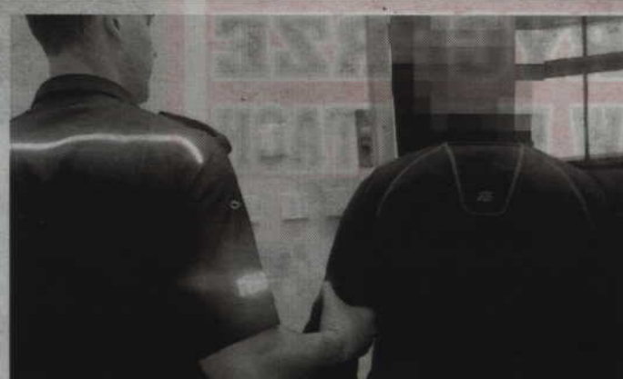
Sprawcy kradzieży: 44-letnia kobieta i 43-letni mężczyzna chcieli sprzedać kradzione elementy na skupie złomu.