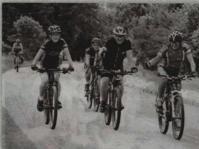
Wśród uczestników tegorocznej edycji rajdu nie zabrakło także kwidzyńskich rowerzystów.

Współorganizatorami tegorocznej edycji Rajdu Kociewsko-Powiślańskiego niektórzy z