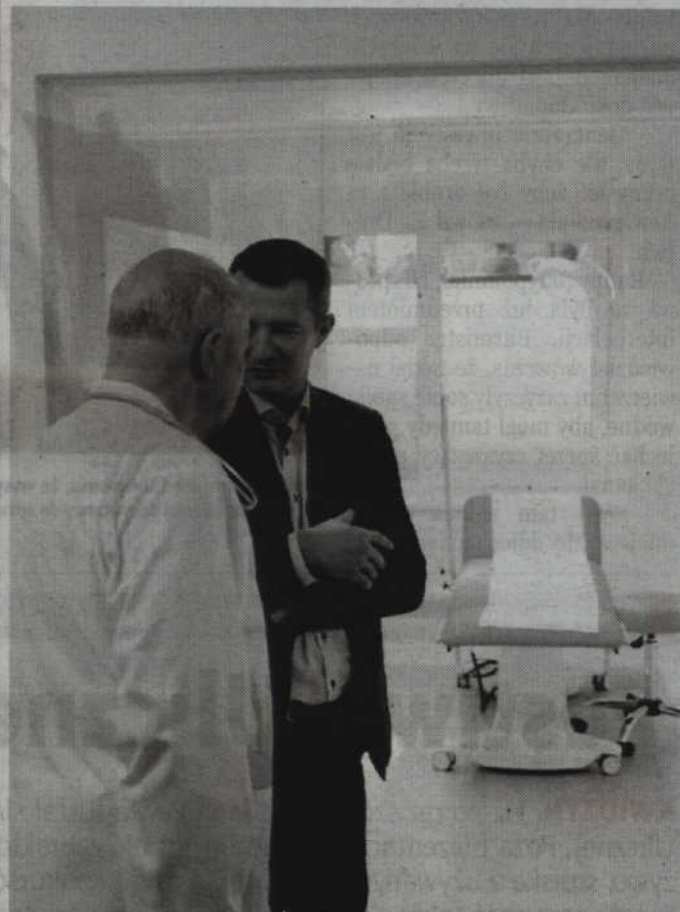
Gabinety nowej poradni POZ mieszczą się w wyremontowanej części szpitala, w której wcześniej funkcjonowała Izba Przyjęć.

KWIDZYN. Poradnia Podstawowej Opieki Zdrowotnej działająca w szpitalu „Zdrowie” w Kwidzynie jest już otwarta. 1 sierpnia ruszyły zapisy do internisty i pediatry, a także pielęgniarki i położnej.