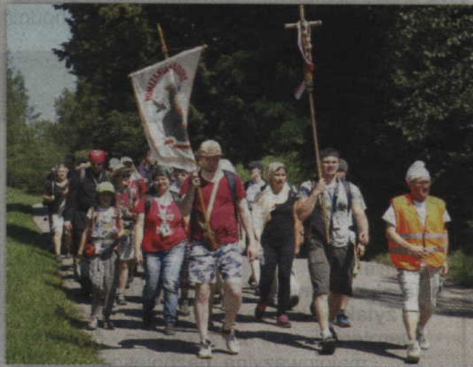
Pielgrzymi z malborskich parafii będą mieli do przejścia prawie pół tysiąca kilometrów.