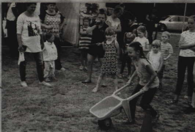
Kwidzyński GOK zadbało o to, aby podczas pszczelarskiej imprezy dożynkowej dzieci się nie nudziły.

pasiekach i czym różni się w Polsce i Niemczech.