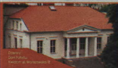
Dzienny Dom Pobytu Kwidzyn ul. Warszawska 18