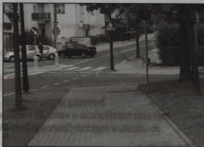
Dokonany został odbiór techniczny inwestycji.

Prace ziemne, które poprzedziły modernizację nawierzchni ulicy, objęły między innymi przebudowę sieci wodociągowej dla potrzeb zasilania w wodę osiedli mieszkaniowych i budowę kanalizacji deszczowej w ul. Hallera. Roboty instalacyjne objęły też sieć wodociągową na odcinku od ul. Radosnej do ul. Grudziądzkiej wraz z przyłączami do granicy działek budynków oraz kanalizację deszczową od ul. Sikorskiego do ul.