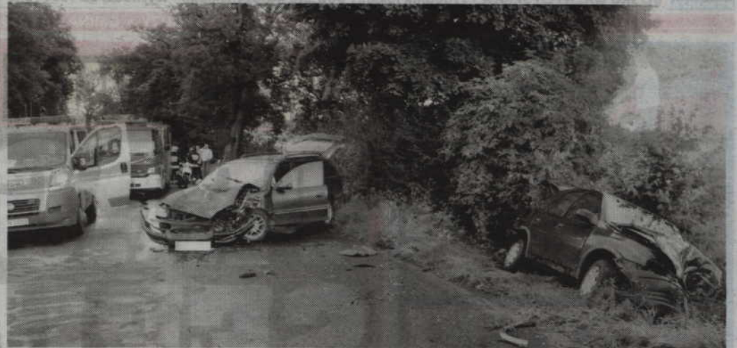
Do groźnego wypadku doszło na drodze wojewódzkiej nr 521 w Raniewie.

GMINA PRABUTY. Kierujący oplem omegą nagle zjechał na przeciwny pas ruchu i czołowo zderzył się z oplem corsą. W wyniku wypadku obrażeń ciała doznali kierowca i pasażerowie opla corsy, a także pasażerka opla omegi. Policjanci szczegółowo ustalają teraz wszystkie przyczyny i okoliczności tego zdarzenia.