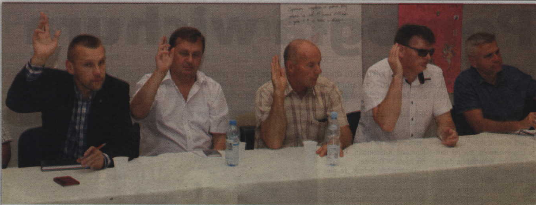
Radni jednogłośnie poparli przygotowane stanowisko.