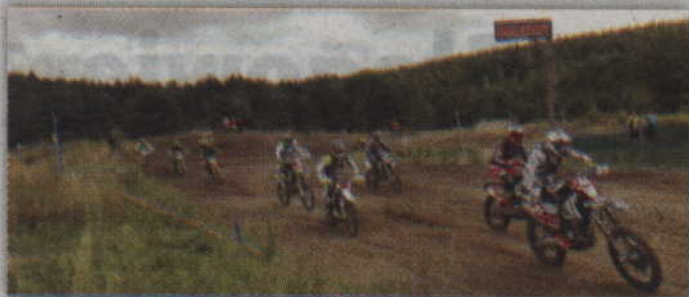
Kolejne rundy mistrzostw Polski w rajdach enduro odbyły się w Dąbrowie Górniczej.