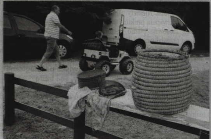
Festyn w Rozpędzinach był także okazją do zobaczenia zabytkowego sprzętu pszczelarskiego.

zakupić specjalne nalewki, wyroby wędliniarskie, najróżniejsze gatunki miodów, świece z pszczelego wosku, pyłek pszczeli i propolis. Strażacy z OSP w Pastwie przygotowali pokaz sprzętu pożarniczego, a koła gospodyń wiejskich z Tychnow i Sadlinek stoiska z ciastem i przekąskami. Można było także obejrzeć ekspozycję prezentującą stary sprzęt pszczelarski, w tym również ule mające kilkadziesiąt lat. O to, aby dzieci się nie nudziły zadbał natomiast instruktorzy z Gminnego Ośrodka Kultury w Kwidzynie, którzy przygotowali najmłodszym uczestnikom pszczelarskiego święta najróżniejsze konkurencje, sportowe i sprawnościowe. Dodajmy, że patronat medialny nad I Powiatowymi Dożynkami Pszczelarskimi sprawował „Kurier Kwidzyński” i portal www.kwidzyn1.pl, a impreza odbywała się także pod honorowym patronatem starosty powiatu kwidzyńskiego. (RB)