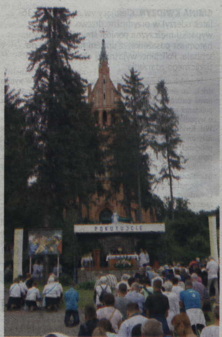
Suma odpustowa odprawiona została na kościelnym placu przed figurą Matki Bożej.

żają, łatwiej wychować nowego człowieka. Dziś już wiele się pisze, że mamy w Europie wojnę cywilizacji. Wojnę, w której kluczową rolę odgrywa rodzina. Upraszczać jest to konfrontacja młodego, zdrowego, dynamicznego, prężnego islamu ze stetrycznym, słabym, rozwodnionym i niestety zamierającym europejskim chrześcijaństwem. Zderzają się w Europie wiernie swojej religii wielodzietne, wielopokoleniowe i silne rodziny z rodzinami mikro, z rodzinami którzy nie chcą dzieci z różnych powodów. Konfrontują się nawzajem rodziny, w których jest miejsce dla dzieci i dla Boga, z rodzinami bez Boga i bez dzieci. Ta cywilizacyjna konfrontacja będzie miała fatalny finał jeśli Europa się nie otrząśnie, jeśli nie wróci do swoich chrześcijańskich korzeni, do sprawdzonych wartości, do myślenia zdroworozsądkowego. (...) Jeśli chrześcijańska Europa się nie obudzi i nie odrzuci ideologii samozagłady umrze. Wymrze. Przystanie istnieć. Walka o przetrwanie i zachowanie tożsamości wiedzy poprzez rodzinę. Nie ma innej drogi. Trzeba o tym mówić, trzeba wołać, także w tym miejscu, tutaj, dziś, w naszym diecezjalnym Sanktuarium Świętej Rodziny - podkreślił ks. W. Zawadzki.