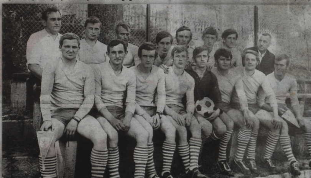
Gardejskie Orły z początków lat siedemdziesiątych.