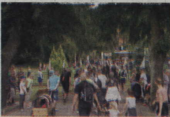
Licznie przybyli wierni wchodzą na teren ryjewskiej parafii.