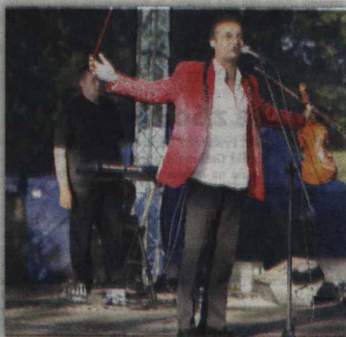
Zanim na scenie pojawił się Don Vasył, w rytm cygańskich piosenek wprowadził wszystkich Dziańi.