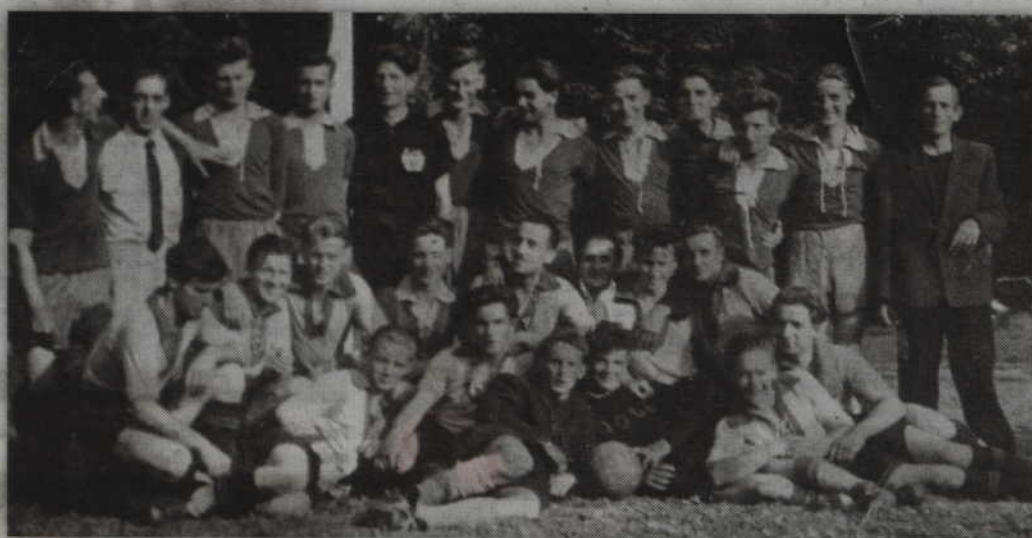
Pogoń Gardeja, drużyna piłki nożnej z lat 50. ubiegłego wieku.