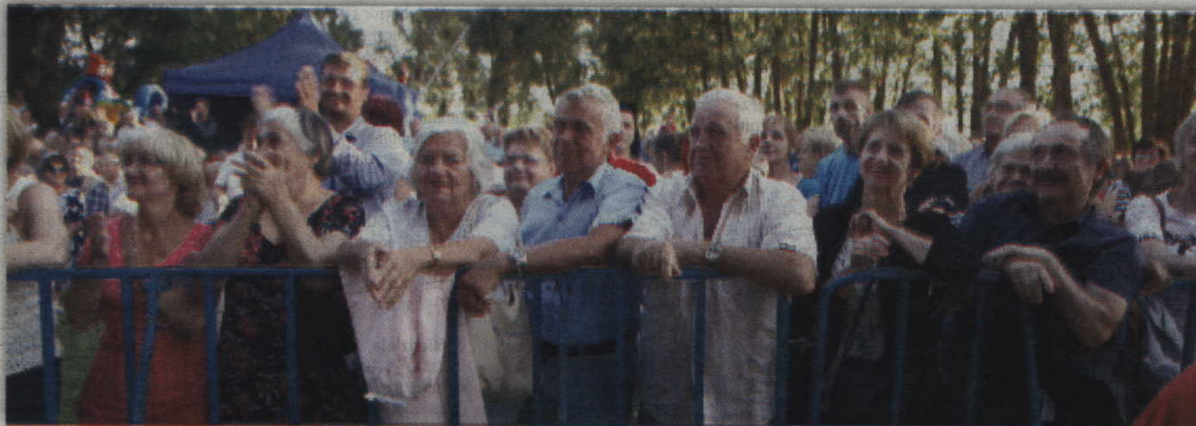
Publiczność doskonale bawiła się podczas koncertu przebojów muzyki cygańskiej.