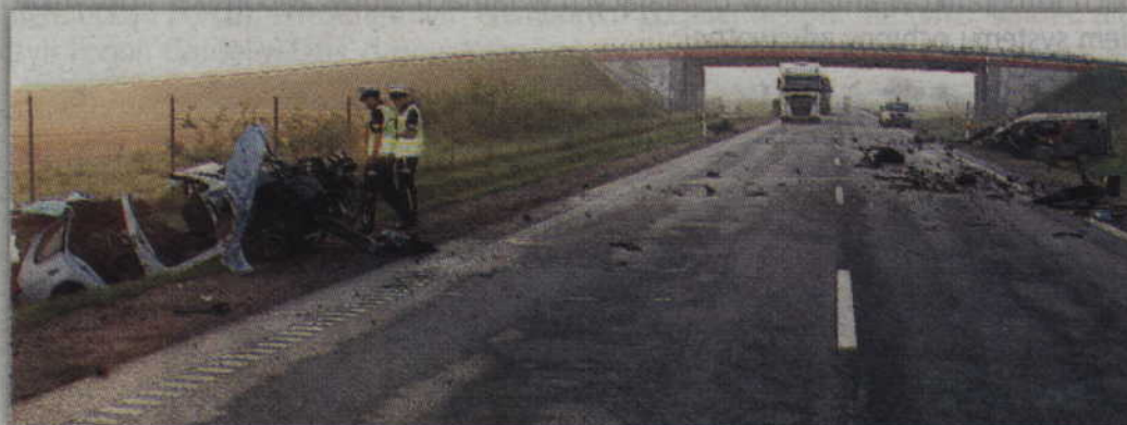
Do czołowego zderzenia aut doszło na drodze nr 90, prowadzącej do mostu na Wiśle.

- Ze wstępnych ustaleń funkcjonariuszy wynika, że kierujący vw golfem 33-letni mieszkaniec Warszawy, jadący z dwoma pasażerami, prawdopodobnie zasnął za kierownicą, zjechał na przeciwny pas drogi i zderzył się czołowo z jadącym z przeciwka samochodem renault trafik, którym kierował 67-letni mieszkaniec Kościerzyny. W wyniku wypadku kierujący golfem 33-latek, z poważnymi urazami głowy i kończyn, został przetransportowany przez lotnicze pogotowie ratunkowe do szpitala w Gdańsku. Kierowca