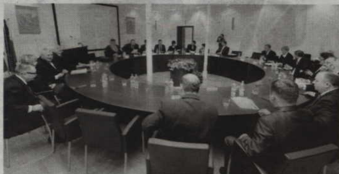
Samorządowcy z powiatu kwidzyńskiego chcą przekazać poszkodowanemu powiatowi 50 tys. złotych.

POWIAT. Samorządowcy z powiatu kwidzyńskiego chcą udzielić wsparcia mieszkańcom powiatu chojnickiego, którzy ucierpieli w wyniku nawałnicy. Zarząd przygotowuje projekt uchwały w tej sprawie.