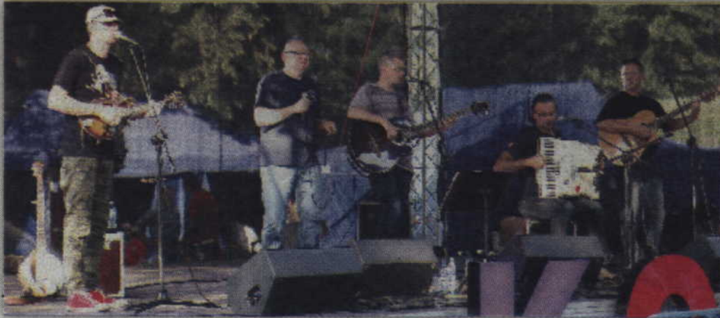
Przez półtorej godziny ze sceny płynęły dźwięki w wykonaniu zespołu „Mechanicy Shanty”.

GMINA KWIDZYN. Plenerowa Msza Święta, odprawiona na przystani promowej w Korzeniewie, rozpoczęły się tegoroczne obchody „Cudu nad Wisłą”. Przypomnijmy, że 15 sierpnia 1920 roku, w kościelne święto Wniebowstąpienia Najświętszej Marii Panny, rozpoczął się zwycięski kontratak Wojska Polskiego na nacierające na Warszawę wojska sowieckie.