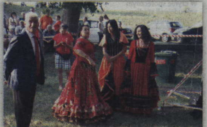
Jeśli na scenie króluje cygańska muzyka to nie może oczywiście zabraknąć efektownych strojów.