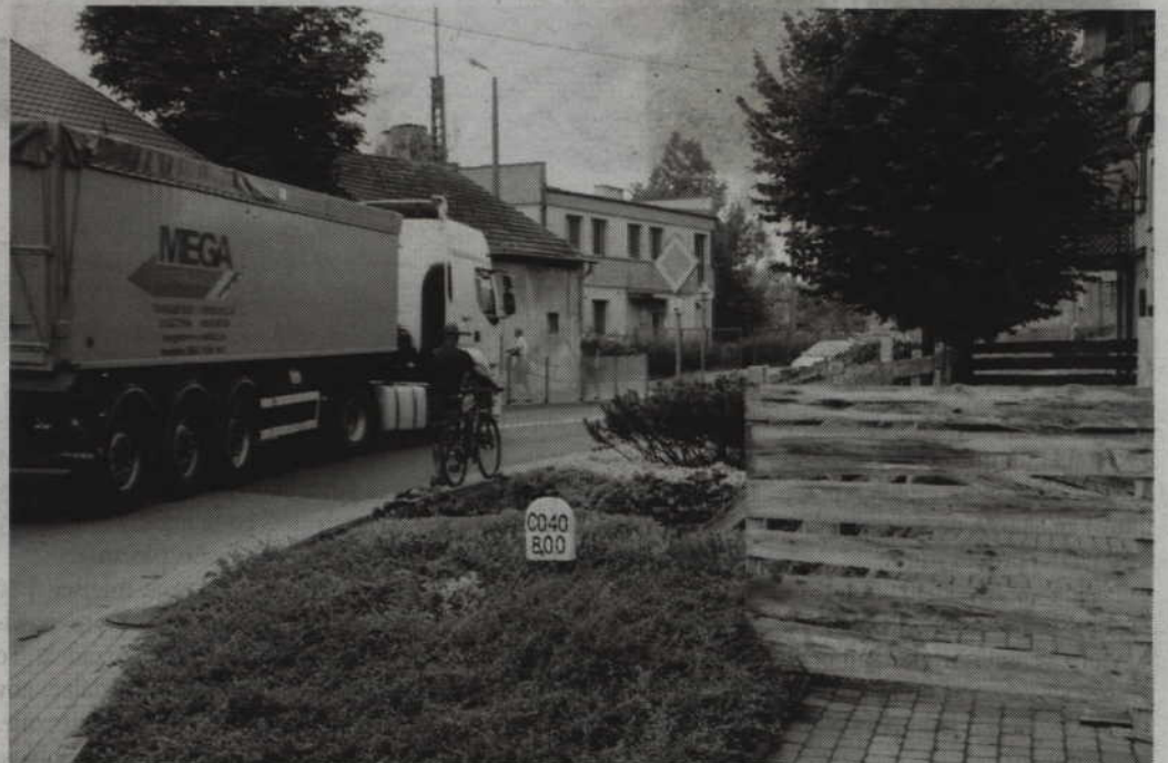
Choć opaska nie służy do ruchu pieszego, wielu mieszkańców chętnie z niej korzysta.

-Od pół roku budynek jest niezamieszkały. Kłopot z tym budynkiem i prawem własności polega jednak na tym, że wcześniej nie przeprowadzono postępowania spadkowego. Obecni właściciele raczej nie chcą go remontować. Stwierdziliśmy więc, że najrozsądniejszym wyjściem będzie wydanie nakazu rozbiórki domu. Taki nakaz trafi do właścicieli posesji w ciągu najbliższych dni. Zanim decyzja zostanie wydana jako nadzór budowlany musimy wystąpić o zgodę na jego wyburzenie do wojewódzkiego konserwatora zabytków, bowiem dom znajduje się w bezpośredniej strefie ochrony zabytków. Decyzja o wyburzeniu pustosta-