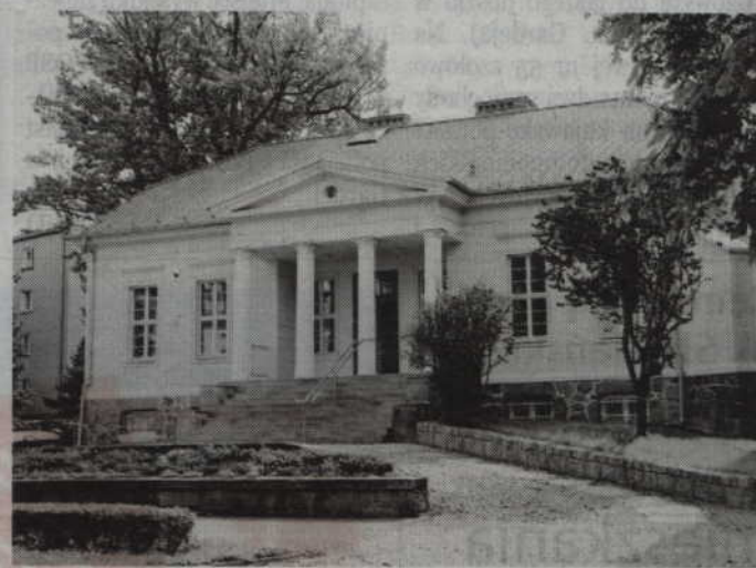
Uroczyste otwarcie placówki, która powstała w zmodernizowanym gmachu na ul. Warszawskiej, zaplanowano na 4 września.

Placówką będzie zawiadywał Miejski Ośrodek Pomocy Spo-