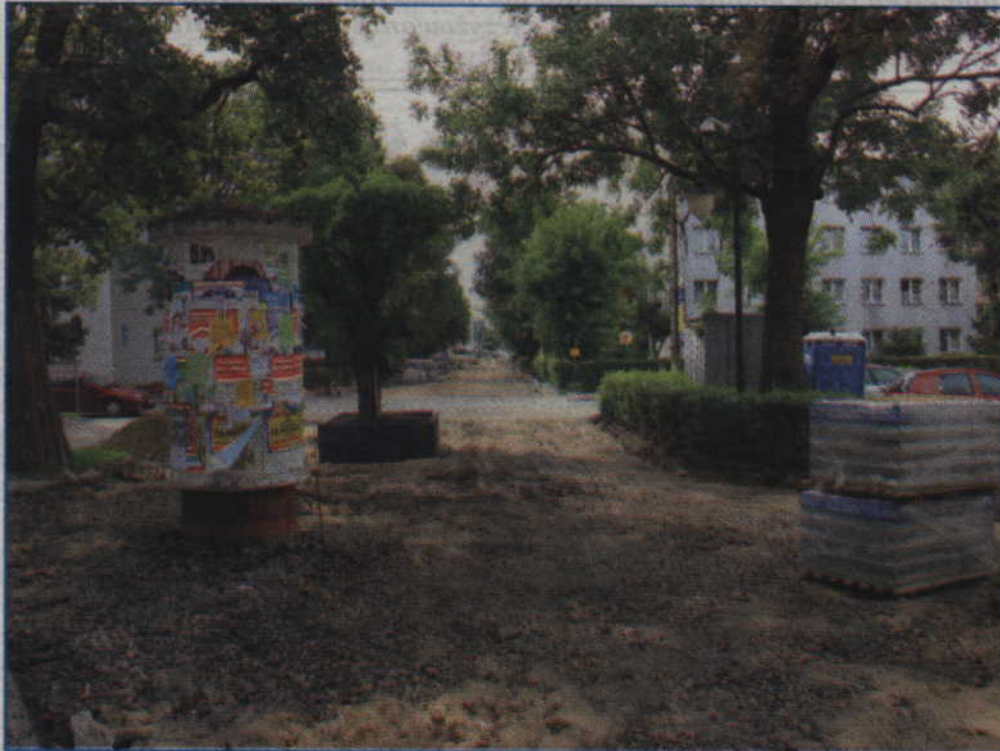
Trwa modernizacja deptaka przy ul. Spółdzielczej.

Trwa modernizacja deptaka przy ul. Spółdzielczej. Oprócz typowej funkcji przejścia łączącego ulice Spółdzielczą z 3 Maja, deptak będzie miejscem zabaw dzieci i rekreacji młodzieży. Inwestycja znalazła się w budżecie obywatelskim.