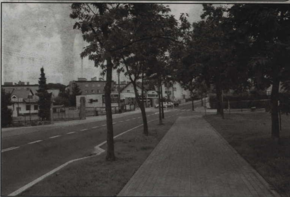
Zakończona została modernizacja ulicy Hallera.

Zakończona została modernizacja ulicy Hallera. To wspólna inwestycja samorządu województwa pomorskiego oraz miasta. Latem ubiegłego roku podpisane zostało porozumienie w tej sprawie. Prace wykonane zostały na odcinku od skrzyżowania z ulicą Batalionów Chłopskich do skrzyżowania z ul. Łużycką.