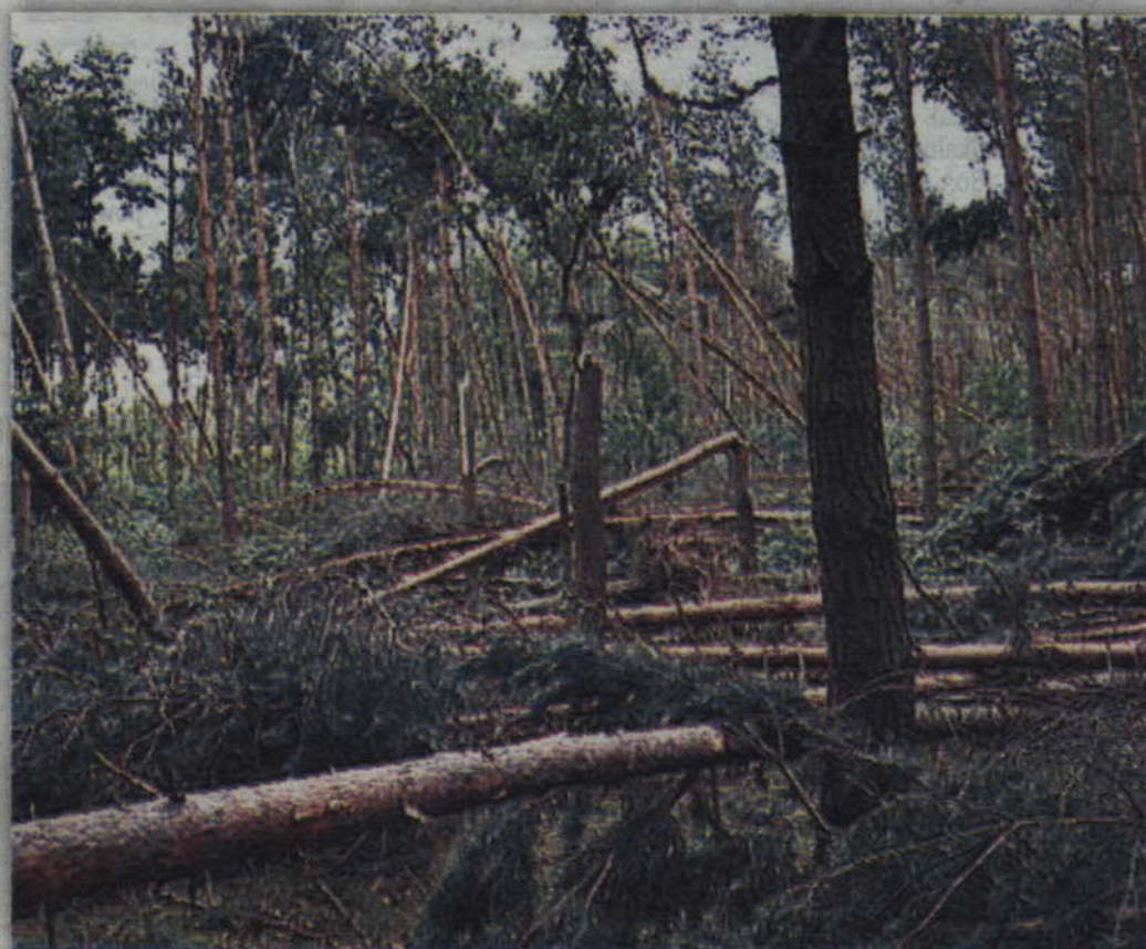
Jak widać na zdjęciu wichura nie oszczędziła także lasów w kwidzyńskim nadleśnictwie.