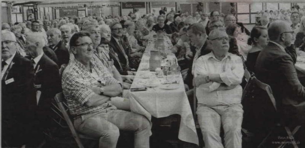
Delegacja z powiatu kwidzyńskiego uczestniczyła w dożynkach powiatowych.

jakielwiek porównania. System niemiecki bardzo różni się od naszego. Przede wszystkim niektóre zadania, jak chociażby badania wody pitnej, prowadzone przez odpowiednik naszego Sanepidu, realizowane są w ramach szpitala prowadzonego przez starostwo. Budżet szpitala, który posiada ok. 150 łóżek, to 21 mln euro. Nasz szpital to niecałe 30 mln zł, czyli szpital w powiecie Osterholz jest mniejszy, a ma prawie trzy razy większy budżet. Funkcjonuje tam również prywatny szpital. Wykonuje te same funkcje. Nie posiada chyba tylko oddziału