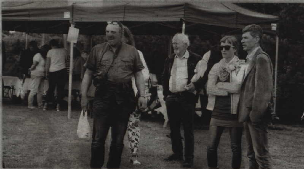
Niemieccy goście kwidzyńscy bartnicy uhonorowali statuetką św. Ambrożego, patrona pszczelarzy.