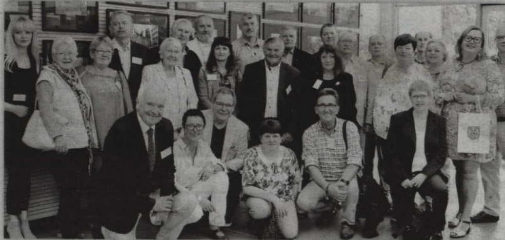
Przedstawiciele samorządu powiatowego byli gośćmi władz partnerskiego powiatu Osterholz.