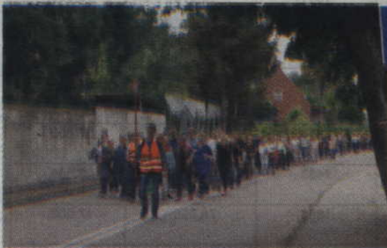
Do sanktuarium przybywa grupa pielgrzymów z Kwidzyna.