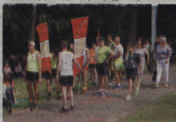
Zawodnicy klubu Zantyr Sztum do Ryjewa po prostu przybiegli.