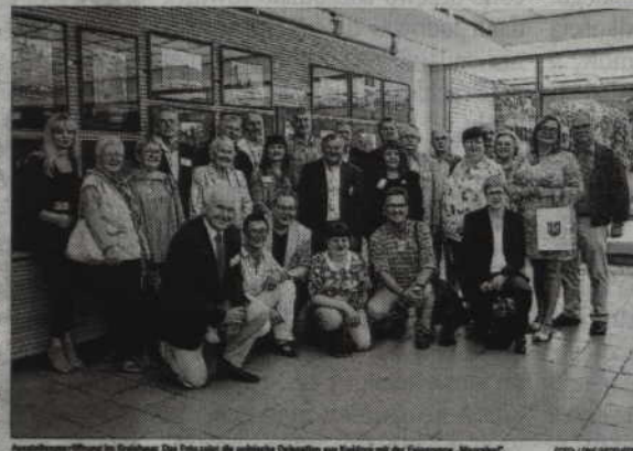
Ausstellungseröffnung im Kreishaus. Das Foto zeigt die politische Delegation aus Kwidzyn mit der Fotografin „Moorpixel“.

Osterholz-Scharmbeck. Heute ist zum Jahresende die Partnerschaft zwischen dem ostpreussischen Landkreis Osterholz und dem Landkreis Kwidzyn. Es ist doch, dass die Partnerschaft in großer Weise, nämlich durch den Kontakt der beiden Landkreise, die in Osterholz-Scharmbeck im Rahmen der Partnerschaft „Eine Reise nach Kwidzyn“ im Kreishaus eröffnet wurde. Die Aufnahmen stammen von der Fotografin Margarete, die im vergangenen Jahr in Kwidzyn gewesen ist.