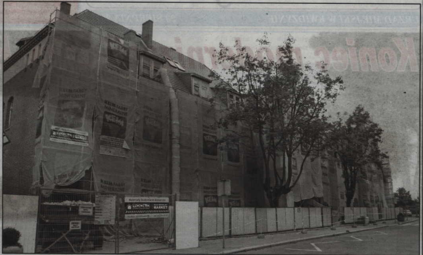
W gmachu dworca swoją nową siedzibę znajdzie Biblioteka Miejsko-Powiatowa, jednak budynek będzie także pełnił funkcje typowo kolejowe. Przewiduje się w nim między innymi pomieszczenia na kasy biletowe.

Na terenie budowanego węzła integracyjnego pojawiają się usprawnienia ko-