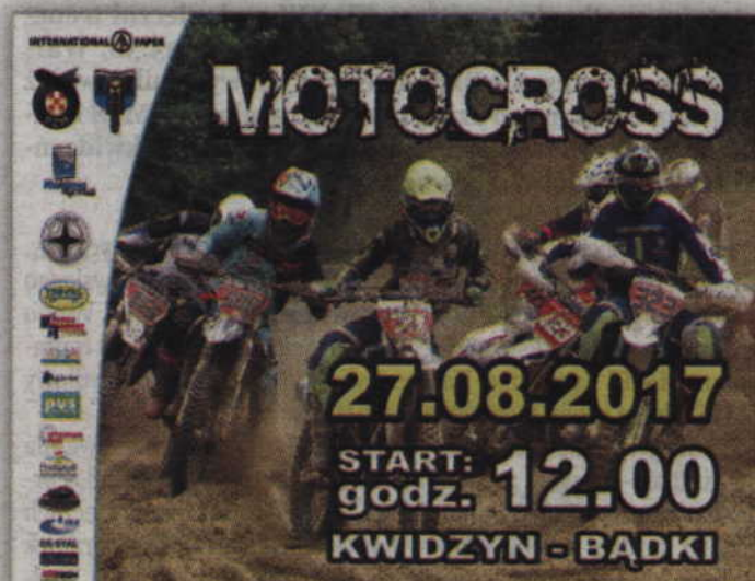
Rywalizacja strefy północnej w motocrossie ponownie odbywać się będzie w podkwidzyńskich Bądkach.

SPORTY MOTOROWE. Kwidzyński Klub Motorowy zaprasza na IX rundę Mistrzostw Strefy Północnej w motocrossie. Zawody odbędą się w najbliższą niedzielę, 27 sierpnia, na torze motocrossowym w Bądkach. Wstęp wolny.