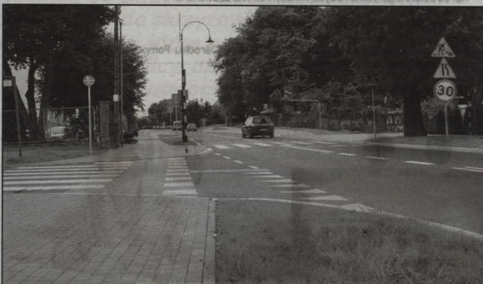
Łączny koszt udziału miasta w modernizacji ulicy to ok. 2,7 mln zł.

Grudziądzkiej wraz z przyłączami do granicy działek budynków. Łączny koszt udziału miasta w modernizacji ulicy to ok. 2,7 mln zł. (s)