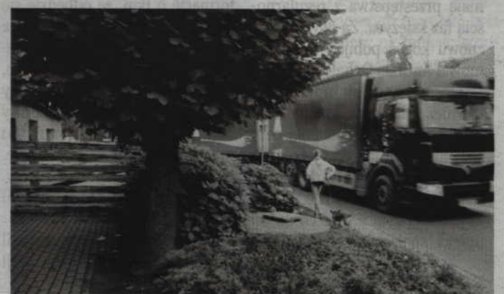
Czy to jest bezpieczna droga dla dziecka?

-Budynek nie jest własnością gminy tylko ma prywatnych właścicieli. Wiemy, że cztery osoby mają prawo do tej nieruchomości. Przed 16 laty zmarła matka obecnych współwłaścicieli, która widnieje w księgach wieczystych jako właścicielka i teraz muszą się odbyć przed sądem sprawy spadkowe. Powiatowy Inspektor Nadzoru Budowlanego w Kwidzynie do obecnych współwłaścicieli skierował pismo z nakazem zabezpieczenia grożącej zawaleniem nieruchomości. Właściciele budynku zwrócili się do urzędu gminy z prośbą o pomoc w jej