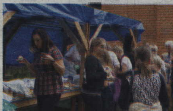
Pielgrzymi mogli posilić się na specjalnie przygotowanych stoiskach.