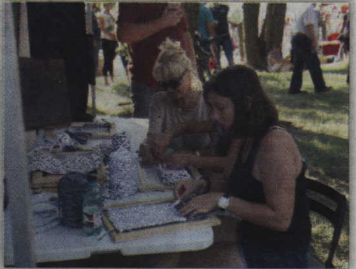
Przy stoisku Pracowni Haftu Artystycznego można było spróbować swoich umiejętności.