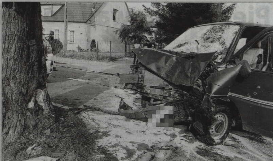
Uderzenie w drzewo okazało się śmiertelne dla 36-letniego kierowcy multivana.

Kwidzyńscy policjanci wyjaśniają teraz wszystkie okoliczności zdarzenia. Sekcja zwłok wykaże teraz, czy kierowca w chwili wypadku był trzeźwy, a także co było bezpośrednią przyczyną jego śmierci. (fox)