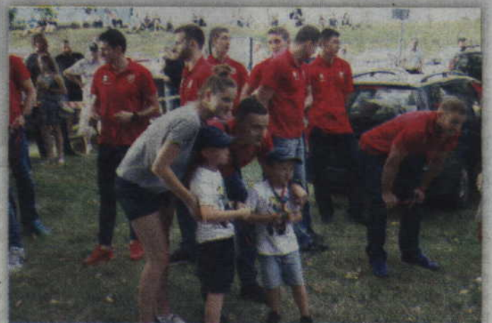
Po prezentacji zawodnicy MMTS Kwidzyn chętnie pozowali do pamiątkowych zdjęć.