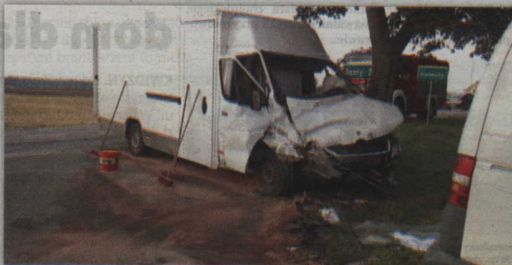
(RB) Do czołowego zderzenia dwóch samochodów dostawczych doszło na trasie Gardeja - Grudziądz.

mercedesie zniszczone zostały przednie maski samochodów. W wyniku wypadku obrażeń doznały również dwie osoby, które zostały przewiezione karetkami pogotowia do kwidzyńskiego szpitala. Miejsce wypadku zabezpieczyły trzy zastępy straży pożarnej, z PSP w Kwidzynie i OSP w Gardei. Czynności wyjaśniające sprawę prowadzili natomiast policjanci z Posterunku Policji w Gardei.