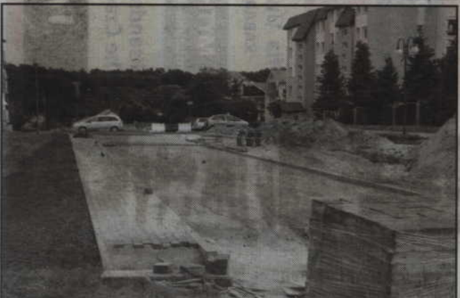
Budowa parkingu przy ul. Kazimierza Wielkiego.