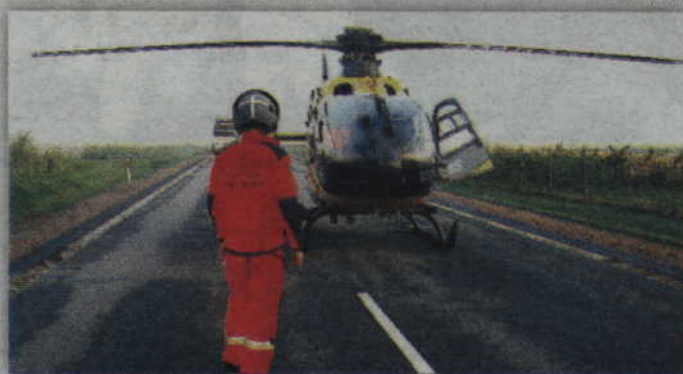
Poszkodowanego kierowcę golfa zabrał helikopter Lotniczego Pogotowia Ratunkowego.

Policjanci zabezpieczyli miejsce wypadku, przeprowadzili oględziny oraz sporządzili dokumentację fotograficzną. Na czas prowadzonych działań