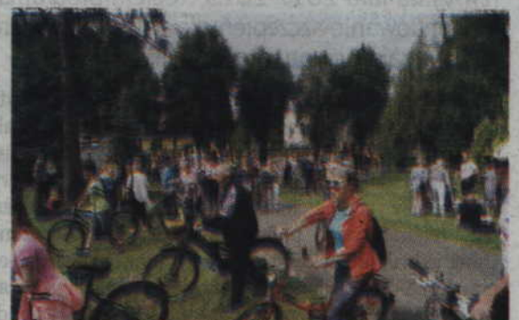
Grupa rowerzystów również robiła wrażenie.