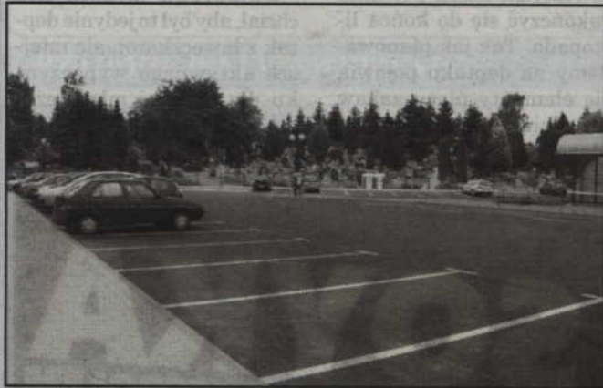
Zakończona została modernizacja parkingu przy ul. Furmańskiej.

Przebudowany został parking przy ul. Furmańskiej. Modernizacja objęła miejsca postojowe oraz chodniki wraz z drogami dojazdowymi. Inwestycję wykonało Kwidzyńskie Przedsiębiorstwo Robót Drogowo-Budowlanych „Strzelbud”.