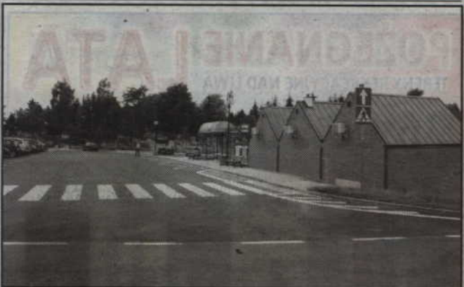
Przebudowa objęła miejsca postojowe oraz chodniki wraz z drogami dojazdowymi.