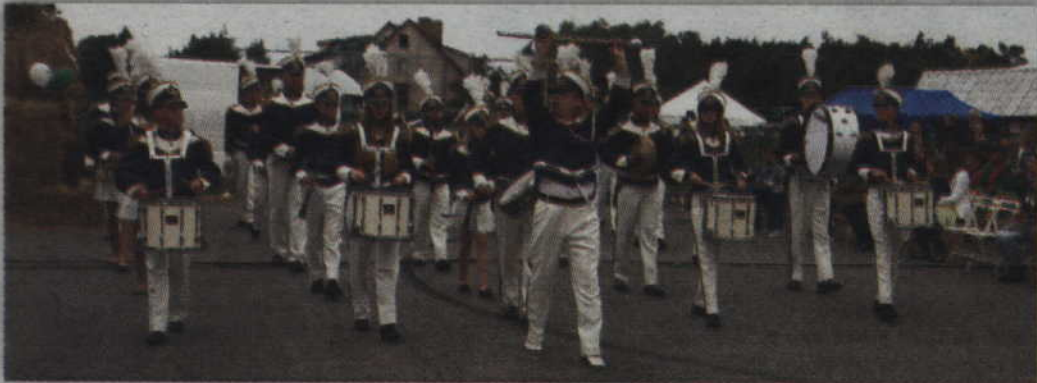
W Sadlinkach wystąpiła również Młodzieżowa Orkiestra Dęta „Helikon”.