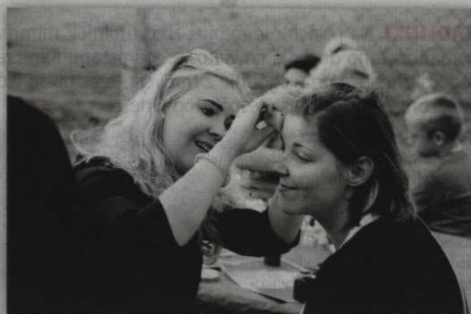
Malowanie twarzy zawsze cieszy się dużą popularnością na festynach.