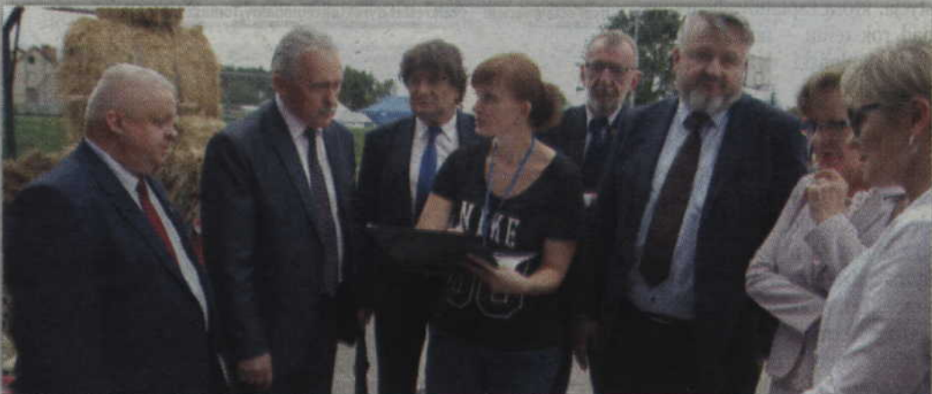
Komisja oceniająca wieńce dożynkowe miała problem z wyborem najładniejszej pracy.