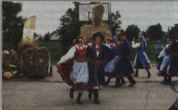
Zespół pieśni i tańca „Powiśle” bawił publiczność przez kilkadziesiąt minut.