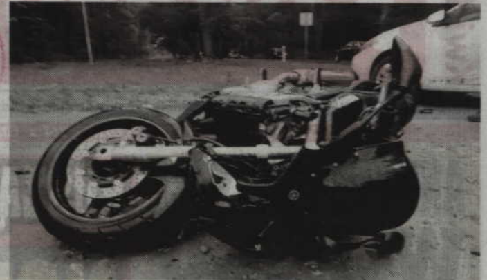
Kierowca motocykla i jego pasażerka przewiezieni zostali do szpitala.

-Sezon motocyklowy nadal trwa i nie należy zapominać, że na drogach w całym kraju można spotkać podróżujących jednośladami. Policjanci apelują o za-