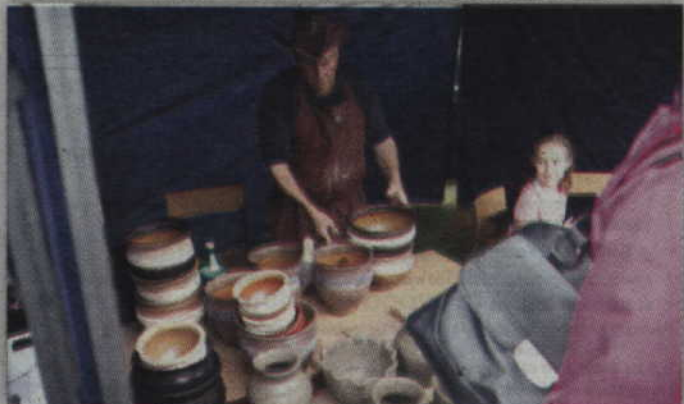
Podczas dożynek chętni mogli m.in. ulepić garnek z gliny.