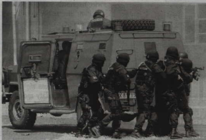
W ramach ćwiczeń policjanci antyterroryści odbijają zakładników przetrzymywanych w szkolnym budynku.