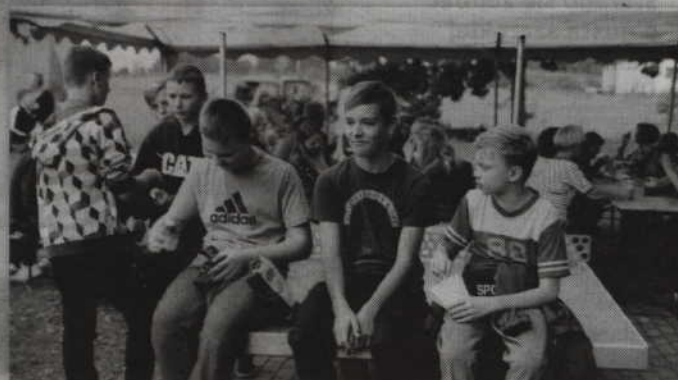
Najpopularniejszą potrawą ziemniaczaną wśród dzieci okazały się frytki.