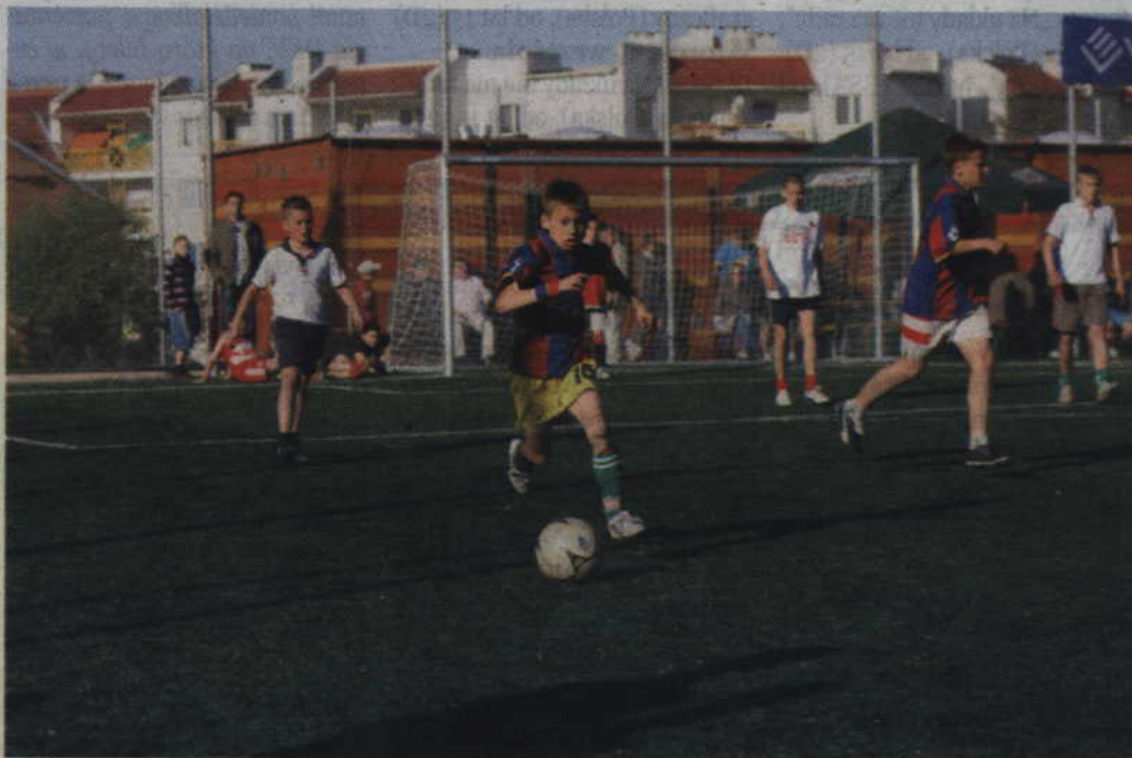
Zgłoszenia drużyn przyjmowane są tylko do 15 września.

PIĘKA NOŻNA. Powszechna Spółdzielnia Mieszkaniowa „Renawa” zaprasza na XXV Osiedlowy Turniej Piłki Nożnej. Zawody rozgrywane o puchar prezesa PSM Renawa” odbędą się na „Orliku” przy ul. Kazimierza Wielkiego w dniach 21-23 września. Zapisy zainteresowanych drużyn prowadzone będą do 15 września włącznie. Jak podkreślają organizatorzy jest to termin ostateczny, po którym nie będą przyjmowane dalsze zgłoszenia.