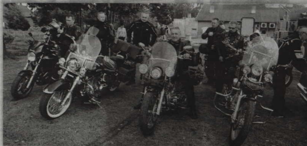
Na festyn do Czarnego Dolnego przyjechali m.in. motocykliści z Kwidzyna.