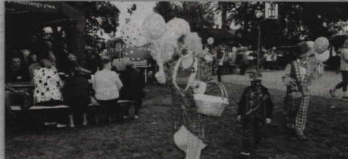
Panie z KGW, przebrane w kolorowe stroje, zachęcały dzieci do zabawy z bańkami mydlanymi.