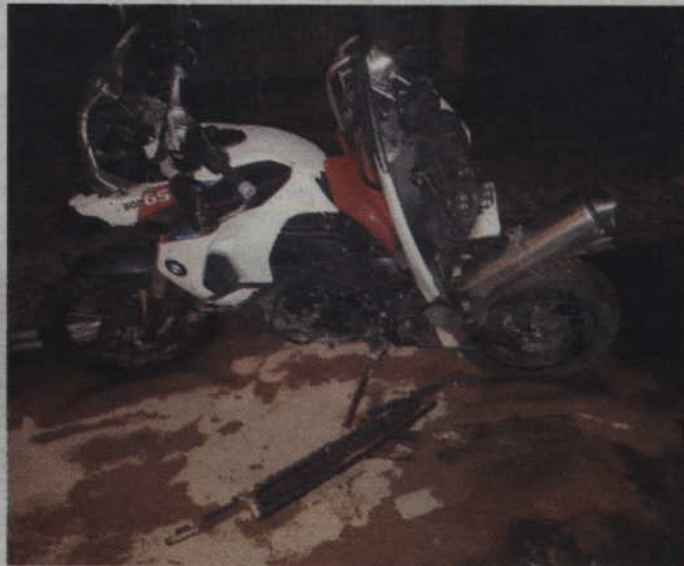
Do zderzenia motocykla i opla doszło w poniedziałkowy wieczór na trasie Kwidzyn - Bądky.

-Ze wstępnych ustaleń funkcjonariuszy wynika, że 46-letni kwidzynianin, kierując motocyklem bmw, nie dostosował prędkości do warunków panujących na drodze. W wyniku tego stracił panowanie nad jednośladem, prawdopodobnie wpadł w poślizg, obrócił się na tylnym kole i uderzył w nadjeżdżającego z naprzeciwka opla astrę, którym kierował 49-letni mieszkaniec gminy Gardeja - wyjaśnia mł. asp.