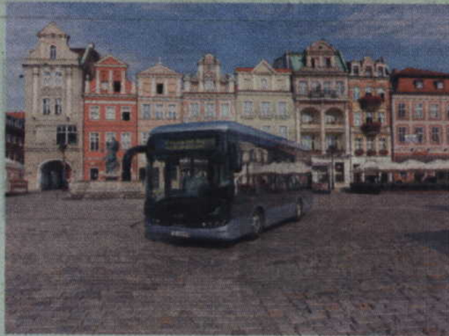
Polski autobus elektryczny Solaris.

Z zaplanowanych do rozdysponowania 200 mln zł na bezwrotne dotacje zostanie przeznaczonych 41 mln zł, a na pożyczki – 159 mln zł. Jak tłumaczy Fundusz, środki mogą zostać wydane na przedsięwzięcia zmierzające do obniżenia zużycia energii i paliw w publicznym transporcie zbiorowym – dotyczące taboru (zakup nowych autobusów elektrycznych, szkolenie kierowców pojazdów publicznego transportu zbiorowego z obsługi bezemisyjnego taboru) lub infrastruktury i zarządzania, w tym może to być modernizacja bądź budowa stacji ładowania pojazdów publicznego transportu zbiorowego w zakresie dostosowania do autobusów elektrycznych pod warunkiem, że stacja ładowania wykorzystywana będzie wyłącznie do obsługi publicznego transportu zbiorowego.