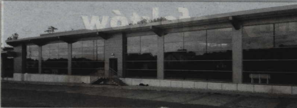
Pływalnia przy ul. Wiejskiej funkcjonuje bez przeszkód od 1 sierpnia.

KWIDZYN. Wprowadzenie nowych rozwiązań, które pozwalają skutecznie oczyszczać wodę w basenach, umożliwiło przestrzeganie rygorystycznych norm użytkowania pływalni. W dwóch obiektach wykonano niezbędne prace konserwacyjne. Dodatkowo w pływalni przy ul. Słowackiego zainstalowano nowe filtry potrzebne do oczyszczania wody.