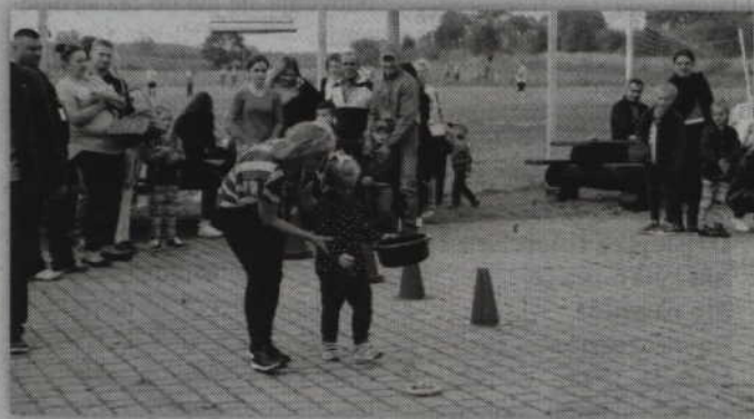
W konkurencjach sportowych czasami niezbędna była pomoc rodziców.