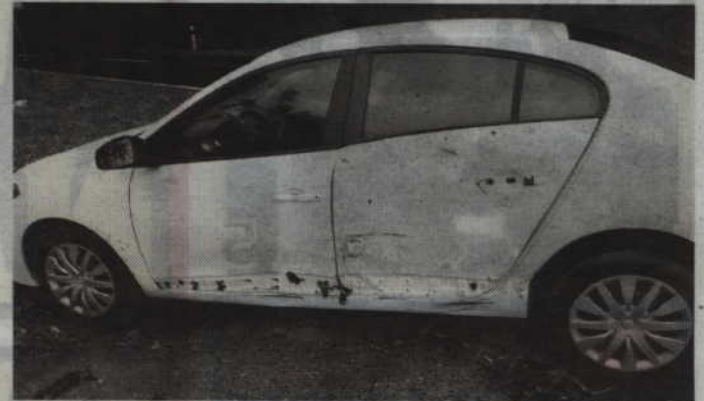
Kierujący renault fluence nie ustąpił pierwszeństwa przejazdu podczas skrętu w lewo.

chowanie szczególnej ostrożności wszystkich uczestników ruchu drogowego. Analizując statystyki wypadków, w których biorą udział motocykliści nasuwa się wniosek, że nie ma reguły, jeżeli chodzi o winę: leży tak po stronie kierowców motocykli, jak i innych uczestników ruchu