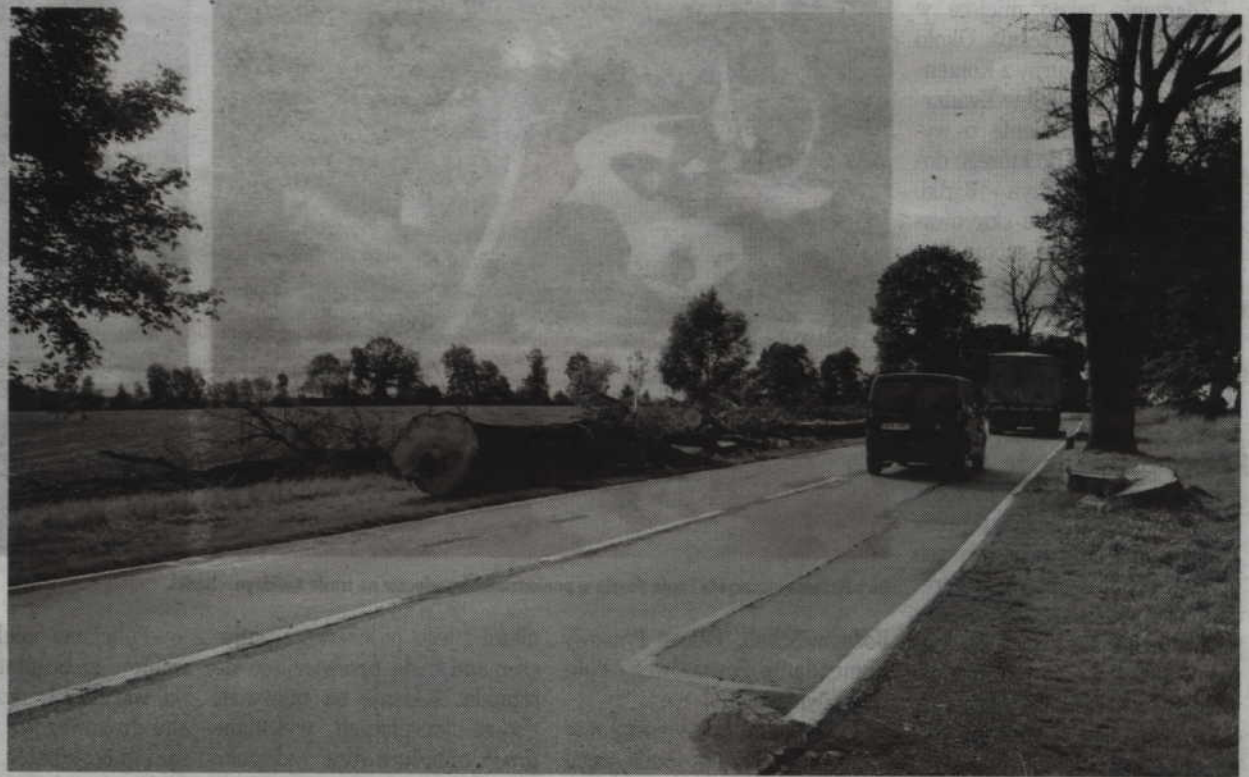
(RB) W kilku miejscach na usunięto już drzewa. Za kilka tygodni powstaną tam zatoczki autobusowe.

wybudowane zatoczki autobusowe. Do końca października pomiędzy Bądkami a Gardeją, na odcinku 8,5 km, będzie wykonany remont metodą nakładki bitumicznej. W czasie prac droga cały czas będzie przejezdna, a remont będzie wykonywany metodą połowkową. Najpierw jedna strona drogi, a następnie druga. W związku z tym trzeba się będzie liczyć z pewnymi utrudnieniami: ograniczeniem prędkości i ruchem wahadłowym – informuje Piotr Michalski, specjalista ds. komunikacji społecznej gdańskiego oddziału GDDKiA.