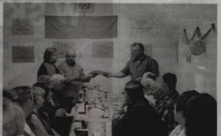
Wyróżniający się działkowicze otrzymali puchary, dyplomy oraz nagrody rzeczowe.