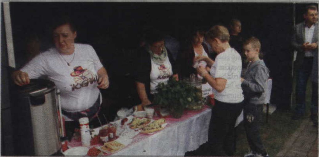
Na specjalnym stoisku swoje wyroby oferowały m.in. członkinie Koła Gospodyń Wiejskich w Sadlinkach