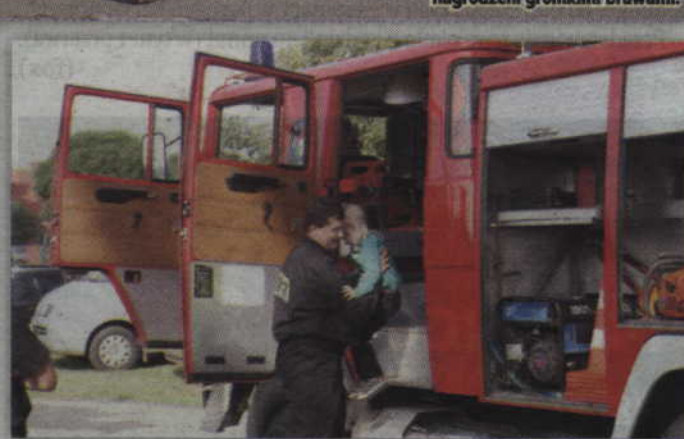
Strażacy z OSP w Rakowcu również włączyli się do organizacji festynu.