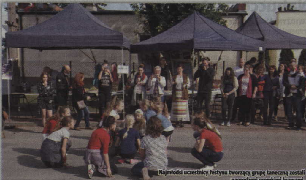
Najmłodszy uczestnicy festynu tworzący grupę taneczną zostali nagrodzeni gromkimi brawami.