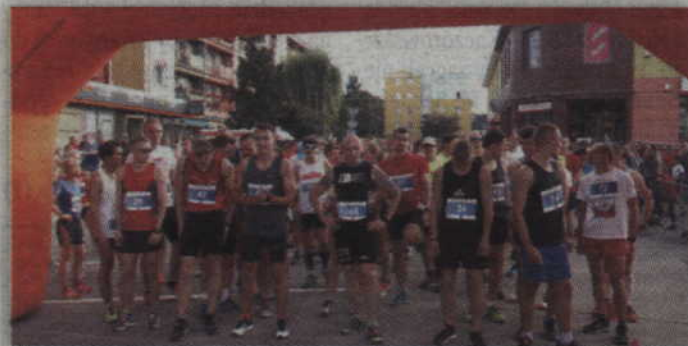
W poprzedniej edycji zawodów na starcie rywalizacji w kategorii open stanęło 118 biegaczy.