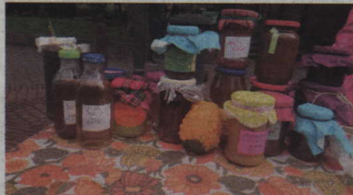
Przetwory królowały na wszystkich stoiskach przygotowanych przez uczniów.