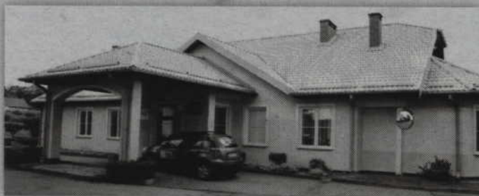
Obecnie w kwidzyńskim hospicjum przebywać może 11 osób. Dzięki rozbudowie liczba ta zwiększy się o kolejnych ośmiu pacjentów.