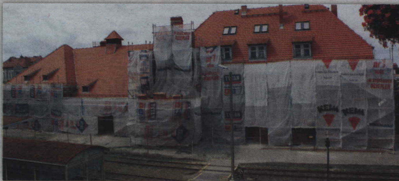
Trwa renowacja budynku dworca PKP oraz terenu wokół.