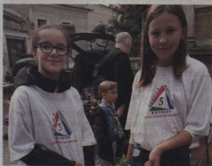
Na swej drodze spotkaliśmy m.in. uczennice SP 5.