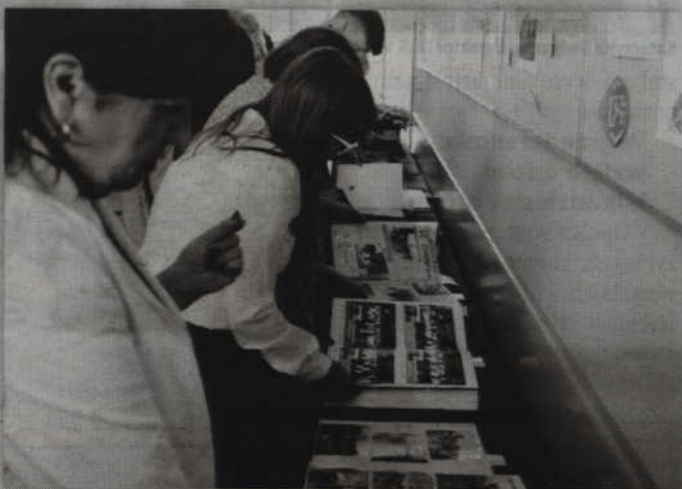
W szkolnych korytarzach można było m.in. przejrzeć archiwalne kroniki.