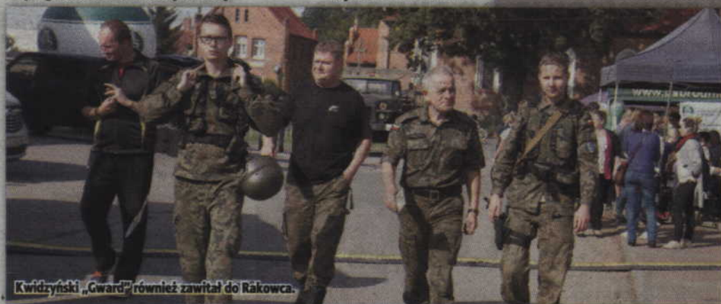
Kwidzyński „Gward” również zawitał do Rakowca.