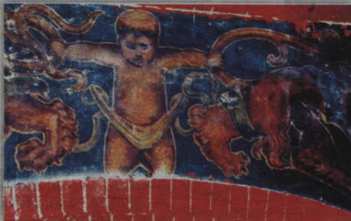
Wszystkie malowidła pokrywające ściany dworca, zgodnie z zaleceniami wojewódzkiego konserwatora zabytków, muszą zostać odkryte i odrestaurowane.

ozdobre malowidła pochodzące z początku okresu funkcjonowania dworca to będziemy musieli je odkryć i odtworzyć. Główny wykonawca musiał zatrudnić specjalistyczną firmę, która zajmuje się renowacją zabytków. Wykonane zostały odkrywki. Czekamy teraz na informacje o ewentualnych kosztach. To nie jest jednak zwykłe malowanie walkiem. Warstwy farby muszą zostać zdjęte i wszystkie ozdobne elementy pokrywające ściany muszą zostać odtworzone. Z odkrywek wynika, że zaraz po wybudowaniu dworca użyto jednolitej farby o błękitnym kolorze. Dopiero później pojawiły się malowidła. Na razie jednak nie wiadomo kiedy powstały i jak dużą powierzchnię ścian zajmują. Jeżeli nie będą to proste wzory, ale np. postacie ludzi, to ich odtworzenie będzie bardziej skomplikowane, a przez to bardziej