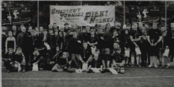
Wspólne zdjęcie uczestników XXV turnieju w pamiątkowych koszulkach.

pierwsze miejsca w obu grupach wiekowych wręczono puchary oraz medale. Wszystkim wymienionym wyżej drużynom wręczono także nagrody rzeczowe ufundowane przez Zakład Usługowo – Transportowy Roman Mi-