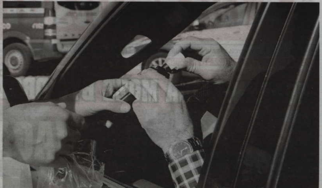
Zatrzymani kierowcy mieli od 0,5 do 1 promila alkoholu. Niebawem wszyscy staną przed sądem i odpowiedzą za jazdę w stanie nietrzeźwości.

POWIAT. Tylko w miniony weekend policjanci z Komendy Powiatowej w Kwidzynie zatrzymali trzech nietrzeźwych kierujących. Kierowcy staną niebawem przed sądem. Grozi im do 2 lat pozbawienia wolności i czasowy zakaz prowadzenia pojazdów.