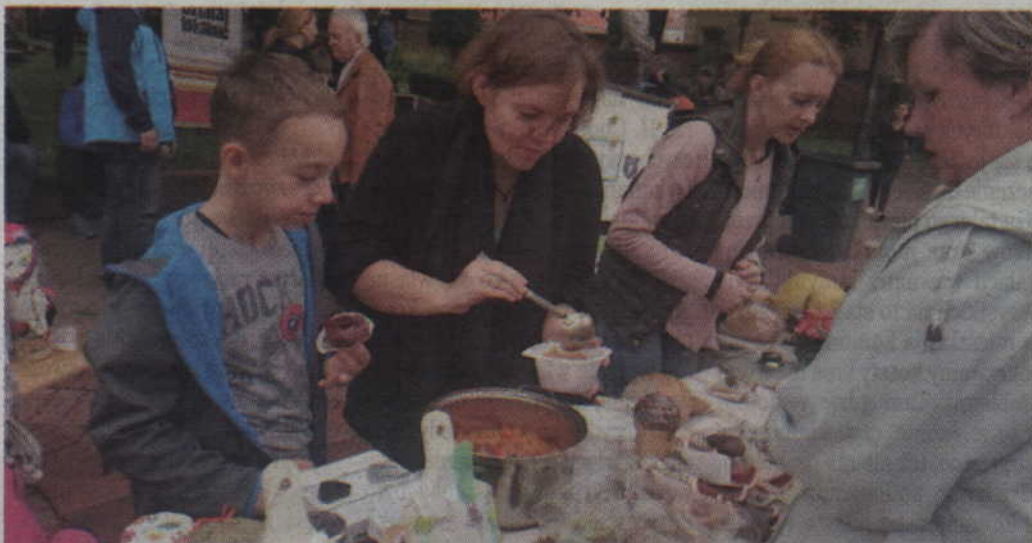
Mieszkańcy chętnie zaglądali do stoisk przygotowanych przez poszczególne szkoły.

KWIDZYN. Lokalna Fundacja Filantropijna „Projekt”, Kwidzyńskie Towarzystwo Kulturalne oraz Biblioteka Miejsko-Powiatowa w Kwidzynie już po raz kolejny zaprosili mieszkańców na festyn „Smaki Jesieni”. Jak zwykle nie zabrakło chleba, ciast, przetworów, staroci oraz dobrej muzyki.