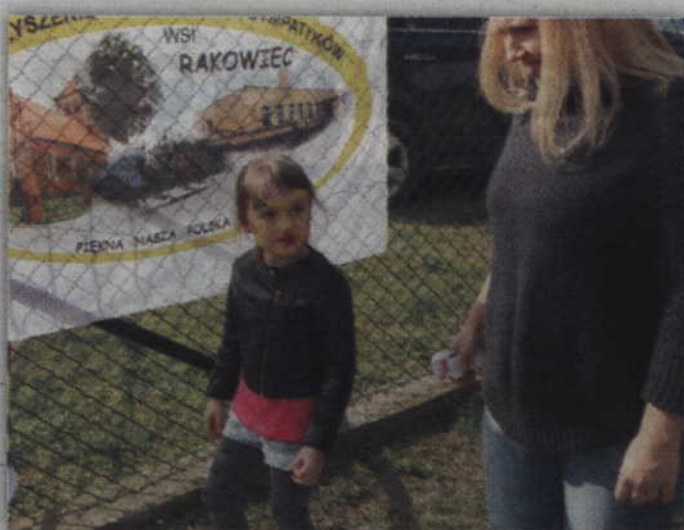
Dzieci nie trzeba było długo namawiać do pomalowania twarzy.

Przed tygodniem w Nebrowie Wielkim (gm. Sadlinki) po raz jedenasty zorganizowano Święto Nebrowskich Powieł. Tydzień później, w Rakowcu, odbyło się natomiast Święto Śliwki.