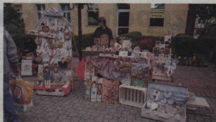
Naszą uwagę przykuło stoisko z ozdobami wykonanymi z drewna i filcu.