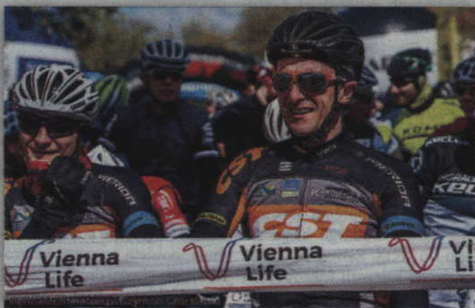
Starsi rywalizować będą na trzech trasach: MINI, MEDIO i GRAND FONDO.

- Idea jest taka, aby dzieci i młodzież miały okazję do rywalizacji MTB w wyjątkowych warunkach, w obecności najlepszych zawodowców i w niepowtarzalnej atmosferze. A to właśnie cechy