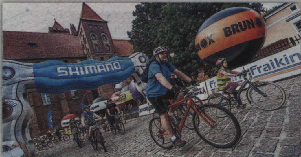
Dla najmłodszych przygotowano dystans rodzinny.

SPORTY ROWEROWE. Już w najbliższą sobotę, 30 września, Kwidzyn stanie się areną wielkiego finału Vienna Life Lang Team Maratonów Rowerowych MTB. Podczas kwidzyńskiego startu poznamy najlepszych zawodników sezonu we wszystkich kategoriach, a także zwycięzców Pucharu Polski. Nowością będzie wyścig o Puchar Ministra Sportu i Turystyki dla dzieci i młodzieży pod hasłem „Szukamy kolarskich talentów”. Dzień wcześniej, także w Kwidzynie, zostaną natomiast rozegrane Mistrzostwa Polski MTB szkółek kolarskich.