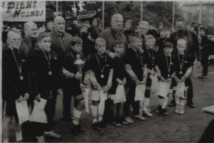
Rywalizację w Grupie Młodszej wygrał zespół DSPN Kwidzyn.