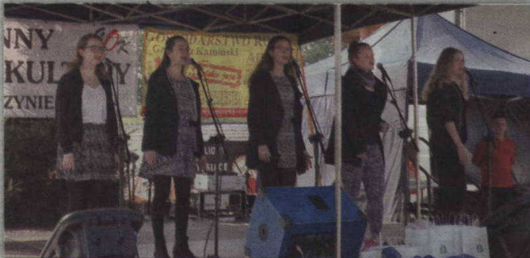
Występ grupy wokalne „Pas de Nom” jak zawsze stał na wysokim poziomie artystycznym.