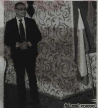
fol. mat. prasowe

RG: Korzyści tych zapewne jest wiele. Wznowienie studiów i