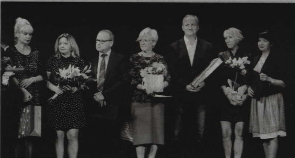
Gratulacje jubilatce złożyli dyrektorzy pozostałych kwidzyńskich szkół.

– Życzę, żeby na kolejne lata „Czwórka” miała marzenia nie tylko odnośnie hali sportowej, ale także wiele innych marzeń, które będzie się realizowało. (...) Bądźcie Państwo nadal tą wspaniałą „Czwórką”, która funkcjonuje w