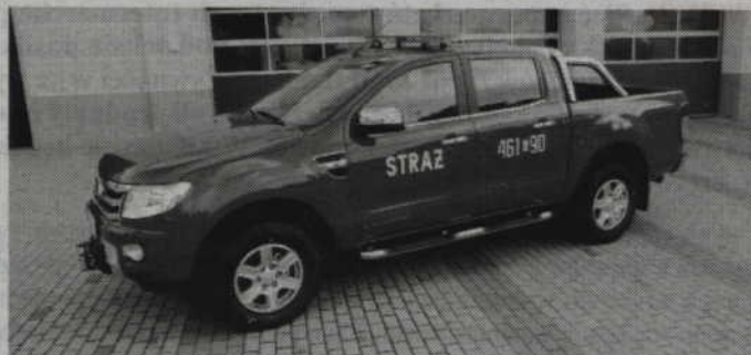
Nowy lekki samochód operacyjny SLOp Ford Ranger z silnikiem o mocy 200 KM oraz napędem terenowym 4x4 znajduje się już na wyposażeniu Komendy Powiatowej Państwowej Straży Pożarnej w Kwidzynie.

-To nowy lekki samochód operacyjny SLOp Ford Ranger z silnikiem o mocy 200 KM oraz napędem terenowym 4x4. Pojazd został zakupiony ze środków, które zostały przekazane na Fundusz Wsparcia Państwowej Straży Pożarnej województwa pomorskiego. Zakup w kwocie 45 tys. zł wsparł samorząd miasta Kwidzyna. Samorząd powiatu kwidzińskiego przekazał 25 tys. zł, natomiast środki z budżetu państwa to 20 tys. zł. Poza tym zakup został dofinansowany w kwocie 40 tys. zł ze środków firm ubezpieczeniowych, przyznanych z Komendy Głównej PSP w Warszawie. Nowy samochód specjalny będzie wykorzystywa-