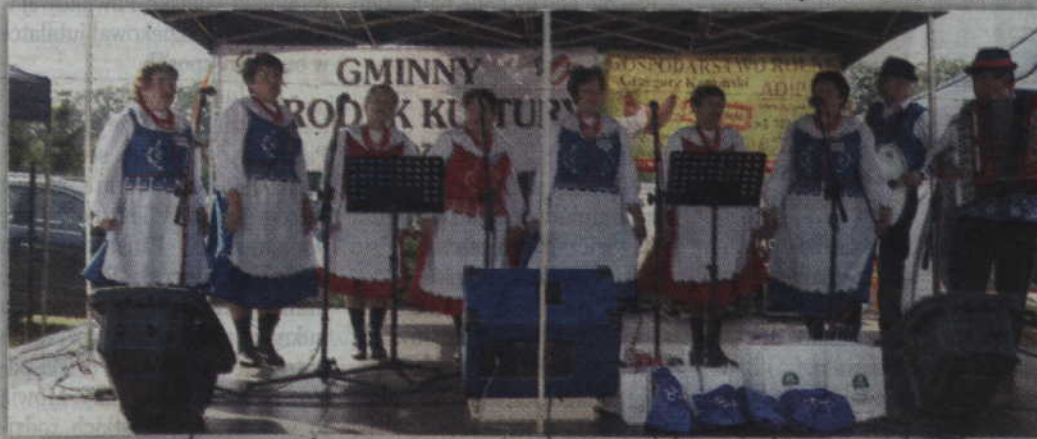
„Wesoła Gromadka” zaśpiewała m.in. utwór disco-polo „Ale..., Ale... Aleksandra”.