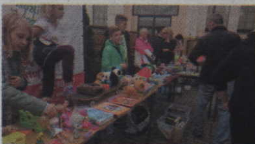
Dzieci „pchli targ” przykuwał uwagę nie tylko najmłodszych.