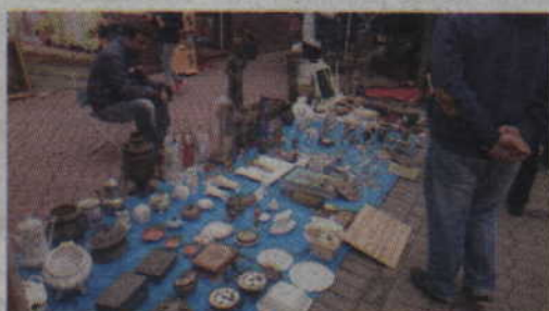
Nie brakowało także staroci. Można było kupić lub sprzedać prawie wszystko.

Wrześniowe „Smaki Jesieni” to wydarzenie, które wszystkich prowadzi w stronę kwidzyńskiego deptaka. To właśnie tam spotkać można stoiska wypełnione chlebami, bułkami, rogalami, przetworami, ciastami i innymi pysznościami domowej roboty. Nie brakuje również stoisk ze starociami, książkami czy płytami. Nowością tegoroczne-