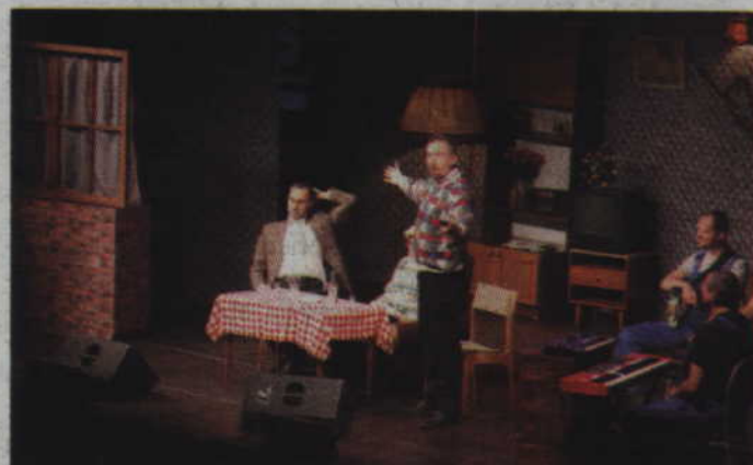
Kabaret „Neo-Nówka” przez prawie dwie godziny bawił kwidzińską publiczność.

także po okazjonalnej cenie. Jeden z nich jest jednak z 2016 roku, a drugi to kalendarz nauczycielski, obowiązujący tylko do czerwca 2017 roku. Najwięcej przywar obnażyła jednak wigilia w tradycyjnej polskiej rodzinie. Rozmowa dziadka, ojca i syna oraz zejście na tematykę polityczną jak zawsze skończyło się kłótnią. W ramach przygotowanego bisu, kabareciarze przenieśli nas natomiast do jednej z kwidzińskich