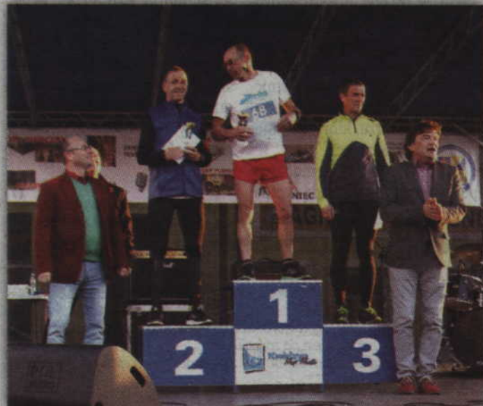
Najlepsi zawodnicy w kategorii 50-59 lat wśród mężczyzn.