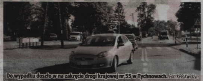
Do wypadku doszło w na zakręcie drogi krajowej nr 55 w Tychnowach.

-Ze wstępnych policyjnych ustaleń wynika, że 34-letnia kobieta kierująca oplem, jadąc po łuku drogi, nie zachowała bezpiecznej odległości i uderzyła w tył jadącego przed nią fiata, którym kierowała 55-latką. W wy-