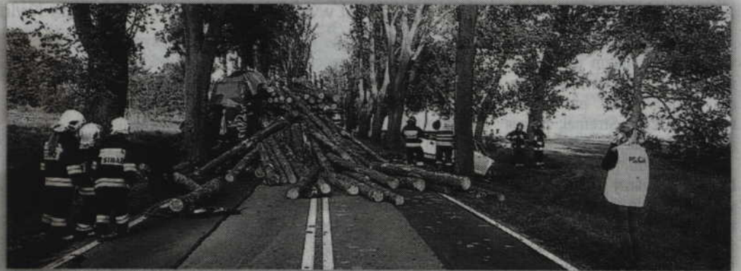
Do tragicznego wypadku doszło na trasie Kwidzyn - Sztum.

Do wypadku na trasie Sztum - Kwidzyn doszło w sobotę, 28 września, przed godziną 17.00. Na miejsce natychmiast skierowano policjantów oraz służby ratownicze. Mundurowi pod nadzorem prokuratora z Prokuratury Rejonowej w Sztumie zabezpieczyli miejsce zdarzenia. Technik kryminalistyki sporządził także szkic