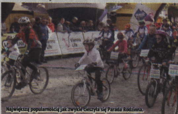
Największą popularnością jak zwykle cieszyła się Parada Rodzinną.