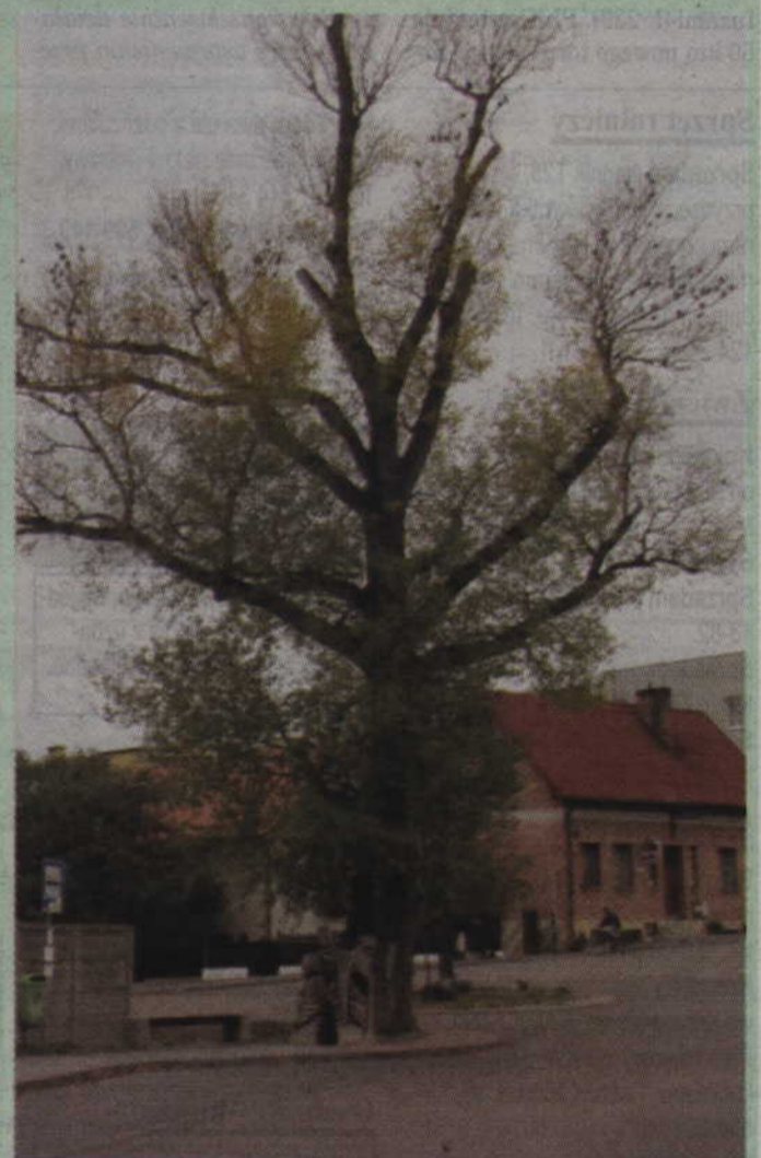
Topola Helena z Helu zyskała największą liczbę sympatyków w tegorocznym konkursie Drzewo Roku Klubu Gaja.