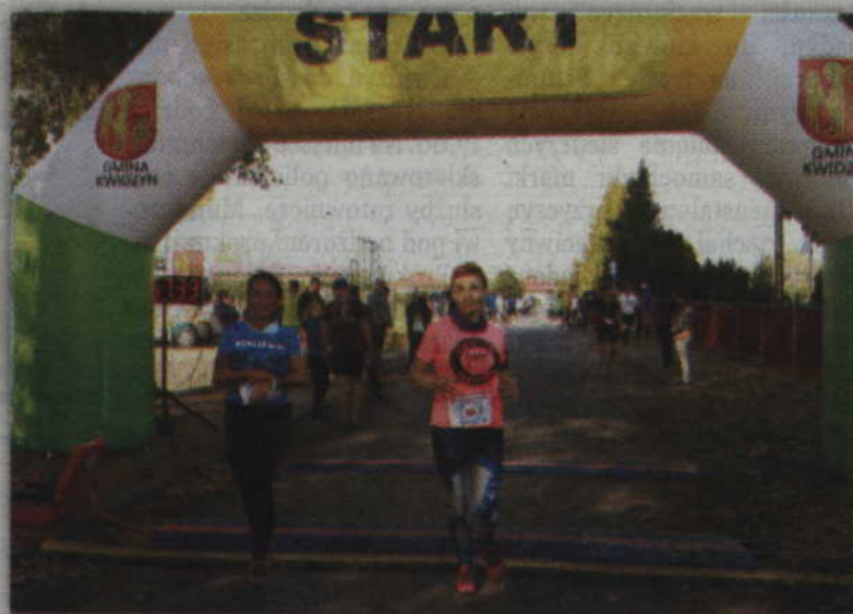
Ubiegłoroczny bieg „Traktora” okazał się frekwencyjnym sukcesem.

Bieg dla dzieci i młodzieży odbędzie się o godzinie 11.00. Rywalizować w nim będą zawodnicy z roczników: 0-6 lat, 7-10 lat oraz 11+. Dla każdego dziecka organizatorzy przewidzieli pamiątkowy medal, soczek i słodycze. Warto dodać, że dorośli rywalizować będą natomiast w kategoriach 16-20, 21-30, 31-40, 41-50 i 51+.