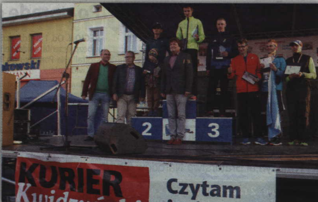
Najszybsza „szóstka” w kategorii open mężczyzn.

- Biegacze podkreślali, że tegoroczna aura pogodowa była wprost idealna do biegania. Nie było zbyt gorąco i przede wszystkim nie padał deszcz. Miło było także słyszeć z ust osób, które przyjechały do nas na zawody, że impreza była bardzo dobrze zorganizowana, a atmosfera na nich wyjątkowa. Chociaż dziewiąty bieg mamy już za sobą to nie pozostaje mi nic innego jak tylko zaprosić wszystkich na kolejny bieg. W 2018 roku będziemy obchodzili swój pierwszy jubileusz czyli bieg „Liwa Cup” zorganizujemy po raz dziesiąty. Dziękuję i pozdrawiam cały sportowy świat biegaczy, jednocześnie zazdraszczając biegaczom tego co robią. Życzę im również samych sukcesów