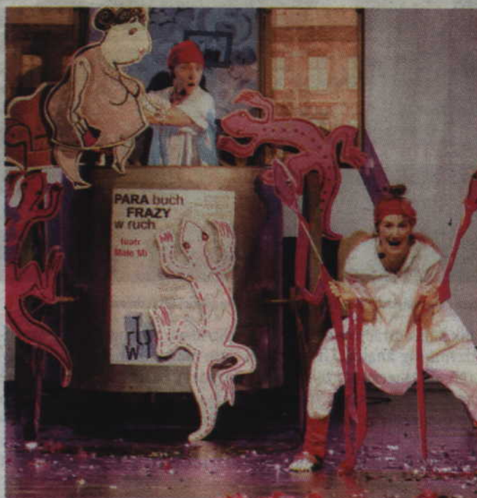
Spektakle adresowane do młodszych widzów zaplanowano na godzinę 10.30. Na zdjęciu fragment spektaklu Teatru Małe Mi „Tuwim Julek para buch frazy w ruch”.