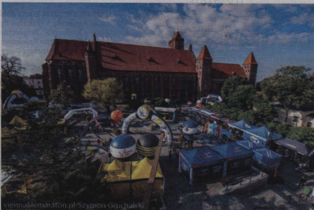
Rowerowe miasteczko zajęło cały Plac Jana Pawła II.