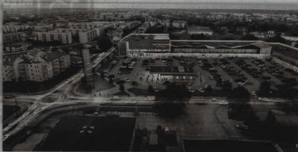
Już za dwa lata ta wyglądać ma teren po byłych „Warmińskich” przy skrzyżowaniu ulic Toruńskiej i Południowej.

W maju przyszłego roku ruszą prace nad budową nowego obiektu w Kwidzynie. Jak się okazuje budynek będzie prawie dwukrotnie większy od działającego już w mieście centrum handlowego. W Metropolitan Park Kwidzyn zaplanowano 40 sklepów, punktów usługowych i gastronomicznych, market spożywczy, jedyne w regionie wielosalowe kino, klub fitness, dużą strefę dziecięcą oraz restaurację typu drive-thru. W ramach projektu powstanie także 350 komfortowych i bezpłatnych miejsc parkingowych. Inwestycja położona jest przy jednym z głównych skrzyżowań miasta u zbiegu ulic Toruńskiej i Południowej. W pobliżu znajdują się osiedla mieszkalne, Kwidzyńskie Centrum Sportu i Rekreacji oraz Specjalna Strefa Ekonomiczna. Otwarcie Metropolitan Park Kwidzyn zaplano-