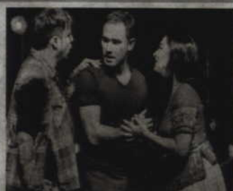
Przedstawienie trwa około 2 godzin i 45 minut (w tym 1 przerwa).

„Poławiacz perel” to kwintesjencja opery francuskiej – melodyjnej, pełnej subtelnych motywów i wpadających w ucho fragmentów, wśród których najsłynniejszym jest romans Nadira, wymagający od tenora niezwykłej lekkości i śpiewu piana. Trudno dziś zrozumieć, dlaczego opera po swej premierze w 1863 roku aż na 20 lat zesza ze sceny. Powróciła dopiero na fali niezwykłego powodzenia innego dzieła Bizeta – „Carmen”. Romantyczna historia dwóch przyjaciół zakochanych w tej samej kapłance, która ślubowała czystość, staje się pretekstem do serii barwnych obrazów na tle cejlońskiej wioski rybackiej. W ro-