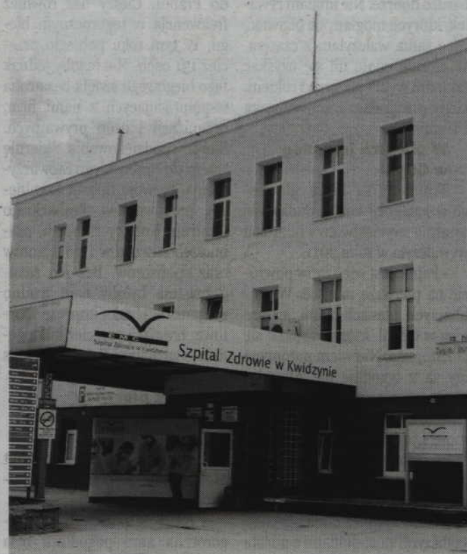
W powiecie kwidzińskim świadczenia nocnej i świątecznej opieki zdrowotnej prowadzi szpital w Kwidzynie.

Dyżurujący w przychodni lekarz udziela porad w warunkach ambulatoryjnych, telefonicznie, a w przypadkach medycznie uzasadnionych, także w domu pacjenta. W razie konieczności lekarz lub pielęgniarka udzielają pomocy w ramach nocnej i świątecznej opieki zdrowotnej w domu chorego. Pomoc wyjazdowa udzielana jest jednak przez właściwy punkt nocnej i świątecznej pomocy przypisany do konkretnego obszaru. Lekarz