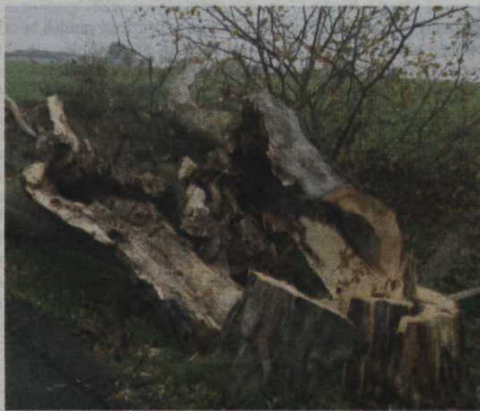
Wycięte drzewa w środku są puste, ale właśnie w takich żyje pachnica dębowa.

– Problemem dla tego odcinka drogi krajowej nr 55 jest występowanie w drzewach chronionego gatunku chrząszcza czyli pachnicy dębowej. Ten owad żyje w drzewach na pół obumarłych, a takie właśnie występują na poboczach. Wcześniej występowaliśmy o zgodę na usunięcie 68 drzew, które były praktycznie całkowicie obumarłe. Ta zgoda była nam potrzebna do wykonania kilkukilometrowego odcinka drogi. Część drzew została wycięta przed 15 października, a to z racji tego, że musieliśmy przygotować miejsca pod cztery zatoczki autobusowe. Pozostałe drzewa są aktualnie usuwane. Na chwilę obecną nie przewidujemy występowania do gdańskiej dyrekcji ochrony środowiska o wyda-