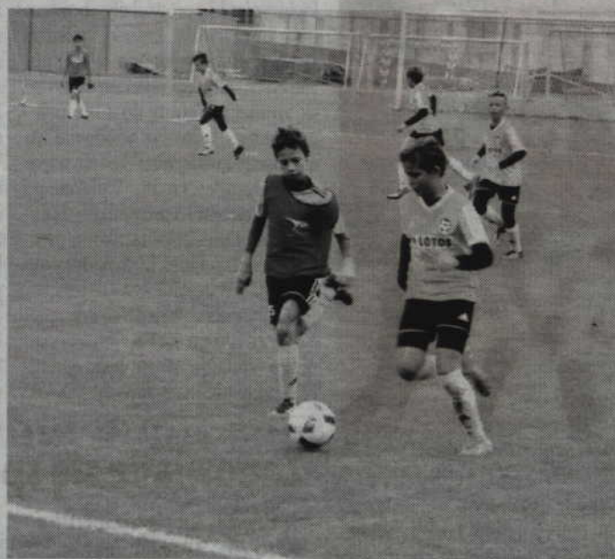
Pomorski Związek Piłki Nożnej ukarał kwidzyński klub za wydarzenia do których doszło po meczu Rodła z Pomezanią Malbork.