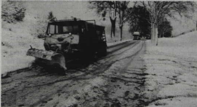
Zimowe utrzymanie obejmuje ok. 230 km dróg w całym powiecie kwidzyńskim.

POWIAT. Samorząd powiatu w przyszłym roku będzie prawdopodobnie płacił firmom za gotowość do zimowego utrzymania dróg. Powodem tego są łagodne zimy. Firmy sygnalizują bowiem, że obecne umowy z powiatem są dla nich nieopłacalne. W efekcie samorządowi coraz trudniej znaleźć wykonawców.