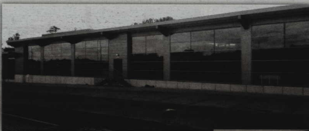
Coraz więcej posiadaczy Kwidzyńskiej Karty Dużej Rodziny korzysta ze zniżek na pływalni miejskiej oraz zakupu biletów na spektakle filmowe i teatralne.