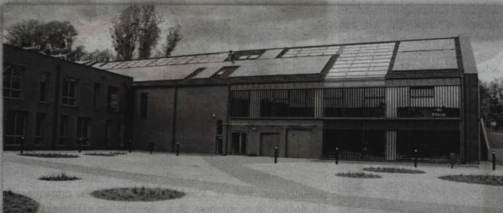
Udziałowcy Kwidzyńskiego Parku Przemysłowo-Technologicznego w Górkach zatwierdzili nowy regulamin dotyczący sprzedaży działek dla inwestorów.

- Nowy regulamin zaproponował zarząd spółki. Oczywiście zatwierdzając dokument musimy przestrzegać zapisów ustawy o gospodarce nieruchomościami, dlatego nie można dokonywać w nim dowolnych zmian. Było to raczej uporządkowanie zapisów sprzed dwóch czy trzech lat. Zgodziliśmy się także na zaproponowane przez zarząd nowe ceny działek. Nowa wycena została przygotowana przez rzeczoznawcę. Zarząd został upoważniony do podjęcia działań, które mają doprowadzić do ich zbycia. Niestety procedura ich sprzedaży jest dość długa. Po zatwierdzeniu nowego regulaminu, w moim przekonaniu, park potrzebuje ok. trzech miesięcy, aby doprowadzić do przetargu. Nowy podział działek i co za tym idzie wycena