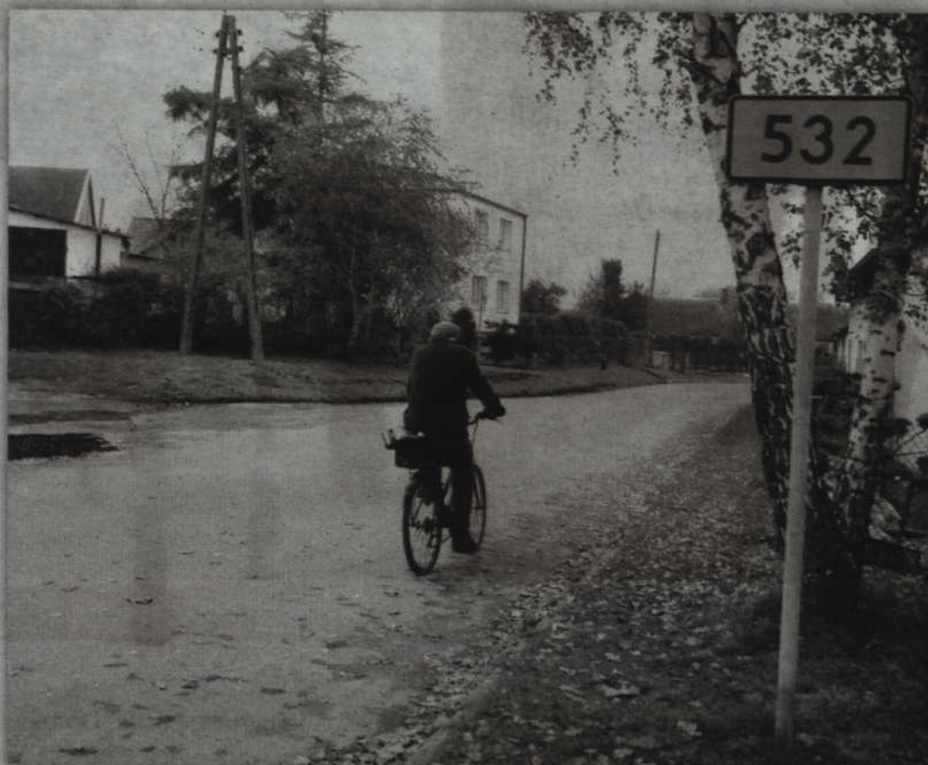
Ulica Piastowska, będąca częścią drogi wojewódzkiej nr 532, w najbliższych latach nie zostanie wyremontowana.