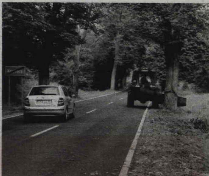
Samorząd powiatu zamierza przeprowadzić zabieg polegający na tzw. ścinaniu poboczy, czyli ich oczyszczeniu, aby woda mogła swobodnie odpływać.

POWIAT. Dobięły końca jesienne remonty dróg powiatowych. Samorząd powiatu zamierza jednak przeprowadzić jeszcze zabieg polegający na tzw. ścinaniu poboczy, czyli ich oczyszczeniu, aby woda mogła swobodnie odpływać. To kolejny w tym roku zabieg konserwacyjny po odtwarzaniu rowów przydrożnych i koszeniu poboczy.