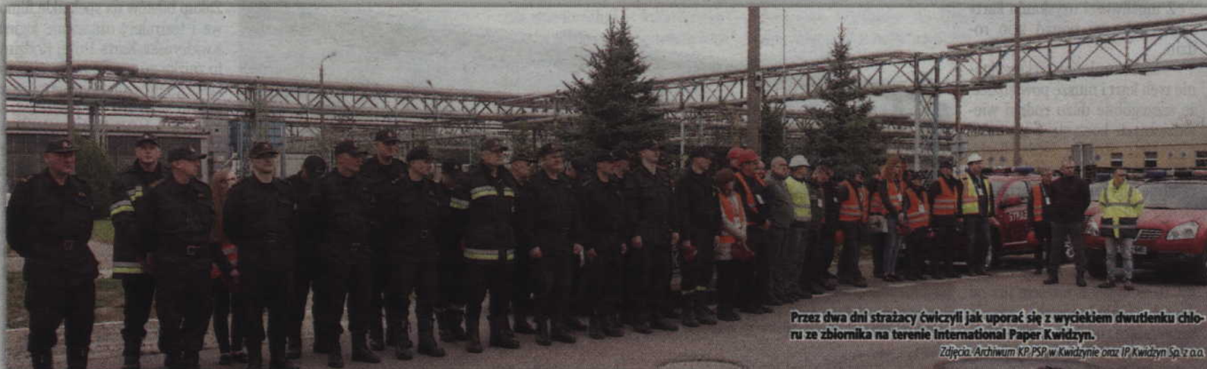
Przez dwa dni strażacy ćwiczyli jak uporać się z wyciekami dwutlenku chloru ze zbiornika na terenie International Paper Kwidzyn.

KWIDZYN. Poważna awaria, której skutkiem był wyciek dwutlenku chloru na terenie International Paper Kwidzyn, postawiła na nogi strażaków nie tylko z Kwidzyna, ale również ze Starogardu Gdańskiego, Malborka i Sztumu. Na szczęście były to tylko ćwiczenia zarządzone przez komendanta pomorskiego Państwowej Straży Pożarnej w Gdańsku.