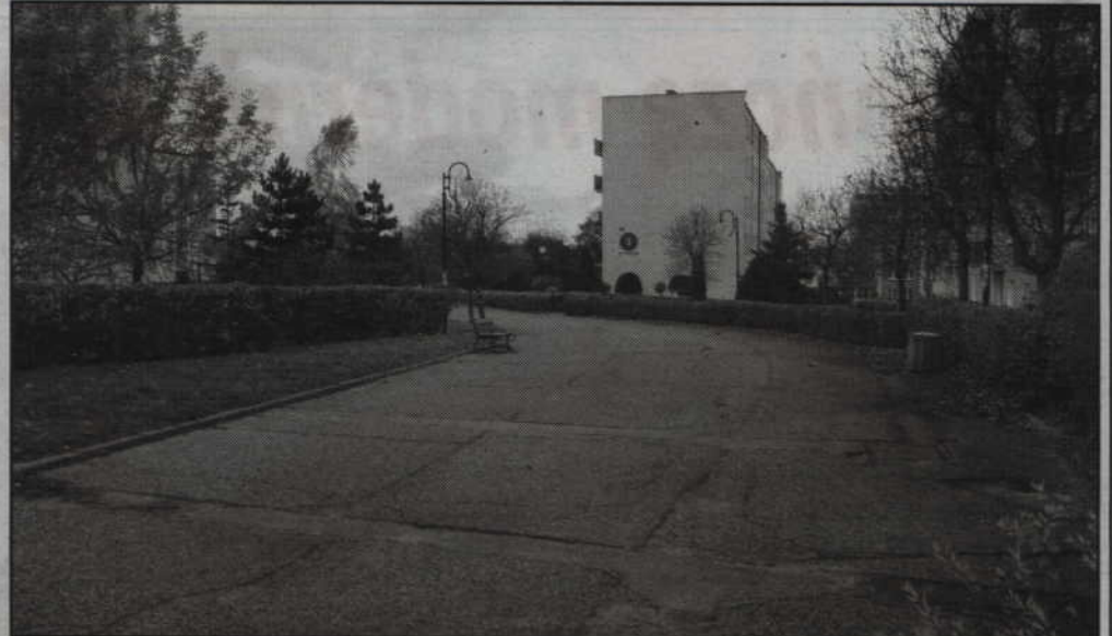
Przebudowa deptaka na ul. Miedzianej, łączącego ulice Toruńską i Kamienną, znalazła się wśród wybranych do realizacji inwestycji.

Szesnaście projektów zgłoszono do trzeciej edycji Kwidzyńskiego Budżetu Obywatelskiego. Ostatecznie zrealizowanych zostanie siedem, które uzyskały najwięcej głosów mieszkańców. Podobnie jak w drugiej edycji dominują inwestycje. Na poszczególne projekty oddano 2888 głosów ważnych, na 1237 ważnych kartach do głosowania. Na każdej karcie można było dokonać wyboru maksymalnie trzech projektów. Najwięcej głosów uzyskały przebudowa deptaka na ul. Miedzianej, łączącego ulice Toruńską i Kamienną oraz budowa zadaszenia nad kortem do tenisa ziemnego.