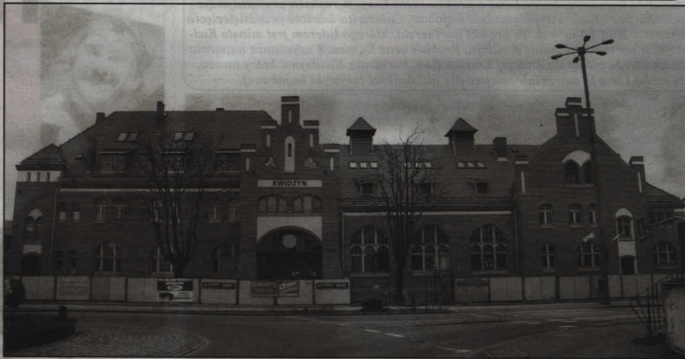
W przyszłym roku dokończona zostanie modernizacja zabytkowego budynku dworca PKP.

- Jest to projekt partnerski, którego jako miasto jesteśmy liderem. Naszymi partnerami są gminy Kwidzyn, Ryjewo i Prabuty. Wartość projektu to ponad 1,5 mln zł. Otrzymaliśmy dofinansowanie w kwocie ponad 1,2 mln zł. Zadanie to będzie realizowane w latach 2018-2019. Powstaną przystanki i miejsca, w których będzie można