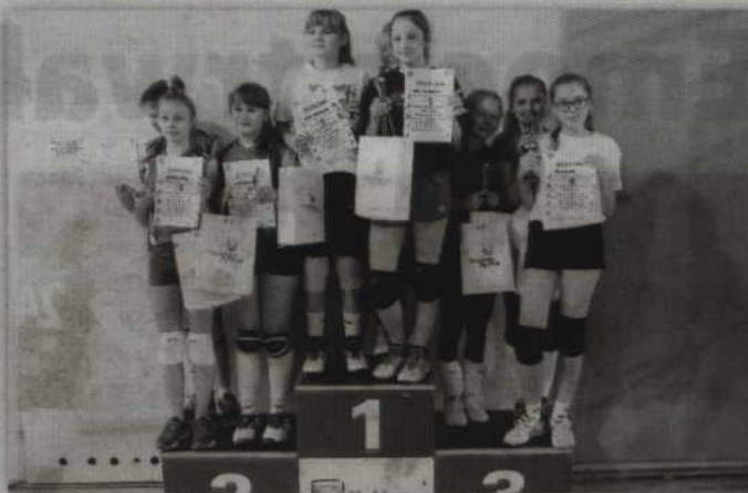
Podium w kategorii dziewcząt rocznika 2005 i młodsze.