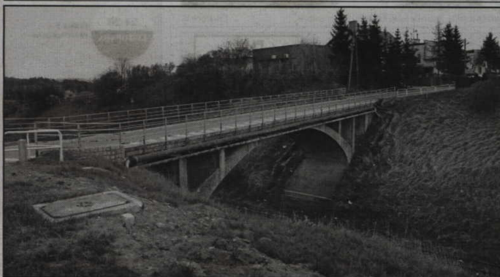
Budowa nowego mostu na ul. Owczej to jedna z priorytetowych inwestycji planowanych w przyszłym roku.