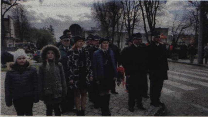
Kwiaty pod Pomnikiem Pamięci, który znajduje się przy urzędzie miasta, kwiaty złożyli strażacy z prabuczych jednostek OSP.

POWIAT. Patriotycznie, na sportowo, a także uczestnicząc w akcji charytatywnej – tak Narodowe Święto Niepodległości obchodzili mieszkańcy powiatu kwidzyńskiego.