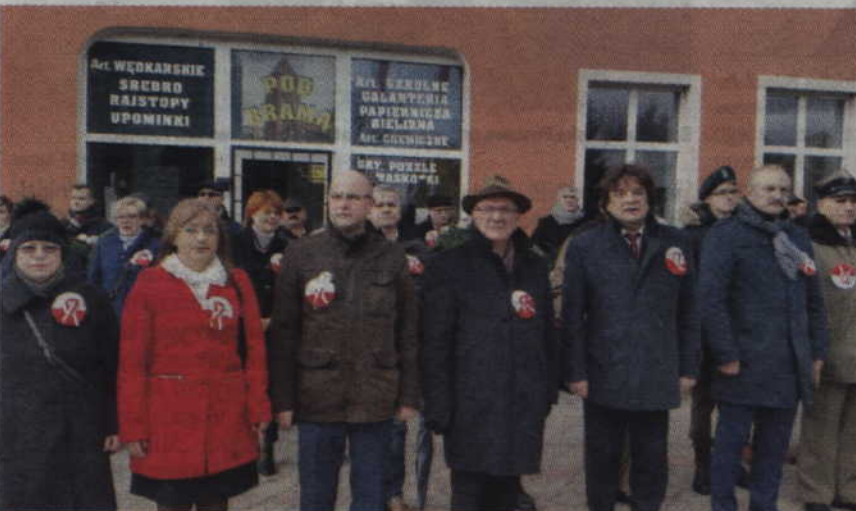
W Prabutach kwiaty pod Pomnikiem Pamięci złożył również Jerzy Kozdroń, zastępca przewodniczącego Trybunału Stanu.