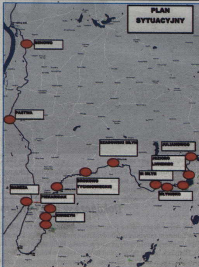
Projekt przewiduje kompleksowe zagospodarowanie szlaku wodnego dla rozwoju turystyki kajakowej na rzece Liwie.

Projekt przewiduje kompleksowe zagospodarowanie szlaku wodnego dla rozwoju turystyki kajakowej na rzece Liwie. Początek szlaku zaplanowano w miejscowości Julianowo na terenie gminy Prabuty. Następnie szlak będzie prowadził przez Szadowski Młyn, Brokovo, Piekarniak, Białki, Marezę, Benowo, by zakończyć się przy śluźwie w Białej Górze. W ramach przedsięwzięcia na całej trasie wykonane zo-