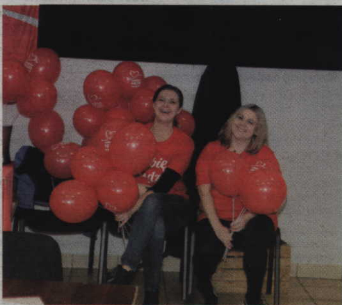
W tak ważnej akcji charytatywnej nie mogło zabraknąć działaczek z Prabuckiej Szlachetnej Paczki.