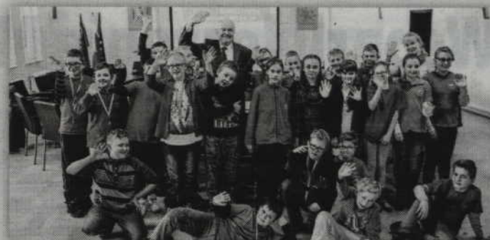
Uczniowie klasy piątej Szkoły Podstawowej nr 6 w Kwidzynie spotkali się z Jerzym Godzikiem, starostą kwidzyńskim.

- Dzieci miały okazję spotkać się ze starostą kwidzyńskim i zadać mu różne pytania dotyczące funkcjonowania urzędu. Zwiedzili także salę obrad rady powiatu. Wizyta w starostwie to część „Lekcji samorządności”, prowadzonej w szkole. Uczniom zostały przedstawione informacje dotyczące działalności starostwa, poszczególnych wydziałów oraz jednostek organizacyjnych. Starosta kwidzyński przybliżył im sprawy, które można załatwić w urzędzie. Wizyta w urzędzie była dla dzieci nie tylko zabawą, ale też częścią programu edukacyjnego. Każdy z uczniów miał okazję poczuć się przez chwilę urzędnikiem i przybić pamiętko-