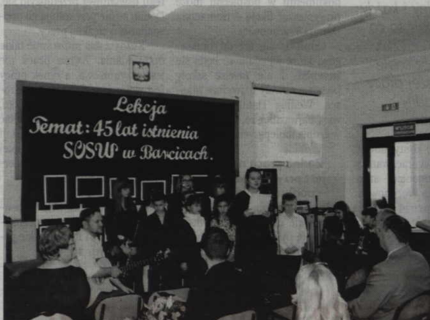
Podczas jubileuszowego spotkania nie zabrakło m.in. występów artystycznych.

RYJEW. Specjalny Ośrodek Szkolno-Wychowawczy w Barcicach obchodził 45-lecie swojego istnienia. Z tej okazji w ośrodku odbyła się specjalna uroczystość połączona z występami dzieci. Podczas święta placówki podziękowano również tym pracownikom ośrodka, którzy w murach tej szkoły spędzili najwięcej lat.