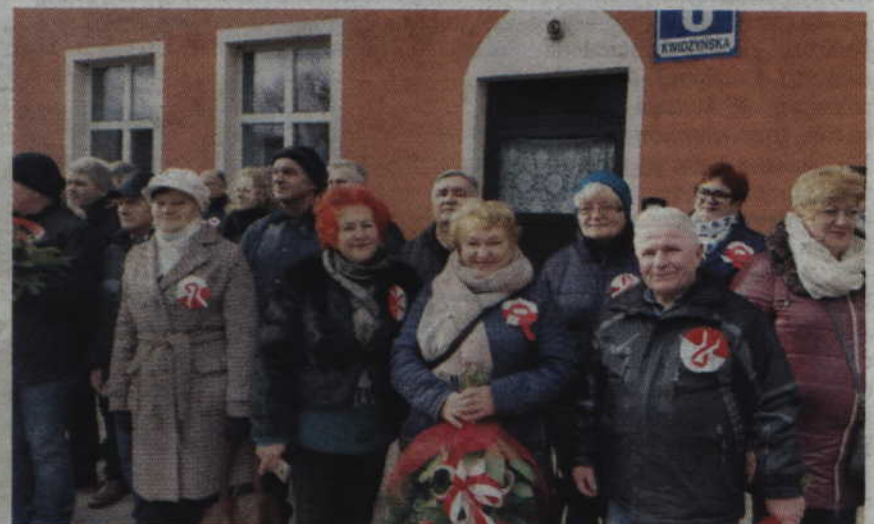
Jest już tradycją, że w dniu 11 listopada nosi się biało-czerwone kotyliony.