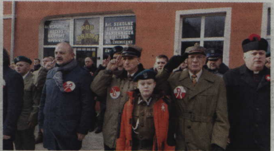
Na uroczystościach nie zabrakło kombatantów i byłych żołnierzy Wojska Polskiego.