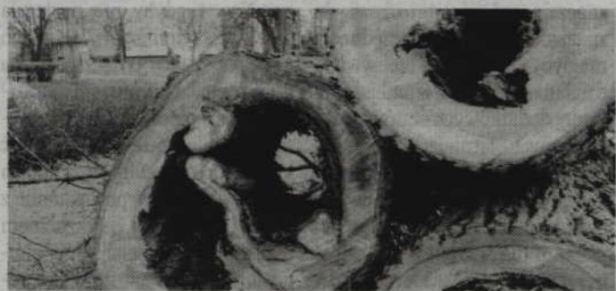
Wiele drzew przy wszystkich drogach na terenie powiatu jest uschniętych. Wycinka drzew przy drodze wojewódzkiej z Kwidzyna do Prabut pokazała jak wiele z nich miało puste wnętrza pnia.