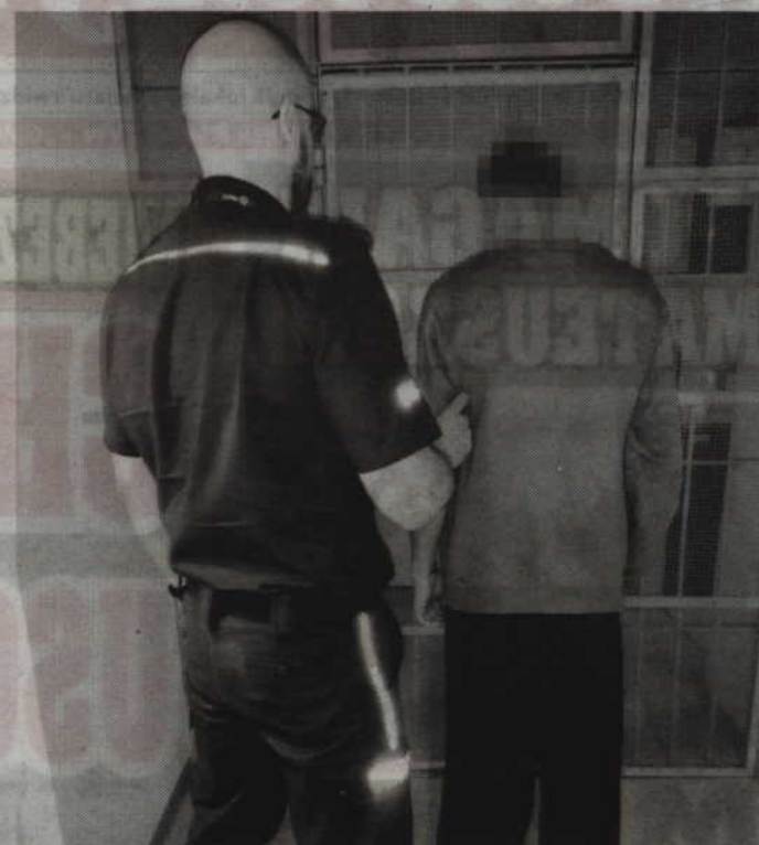
Siedemnastoletni przestępca usłyszał 8 zarzutów kradzieży z włamaniem.

Mężczyzna został zatrzymany i trafił do policyjnego aresztu. Podczas czynności policyjnych mundurowi ustalili, że nastolatek swoją przestępczą działalność rozpoczął na początku października i odpowiedzialny jest również za szereg innych