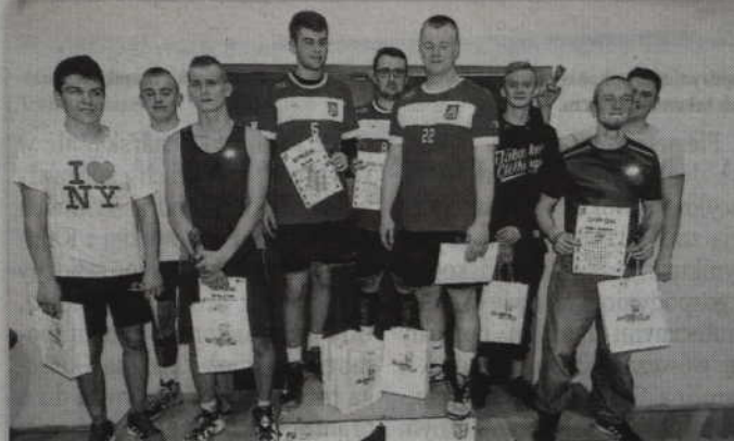
Największa rywalizacja odbywała się w kategorii open mężczyzn. Ostatecznie wygrał zespół ASIMP z Prabutu, przed Papis Team (również Prabuty) oraz Easy Players (Sadlinki).

miast udział w analogicznej kategorii wśród pań. Do rozgrywek nie zgłosiła się bowiem żadna drużyna. Nieco lepiej było w kategorii