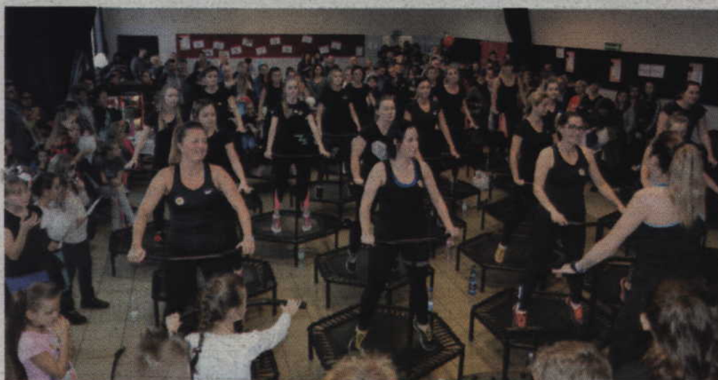
Pierwsze prabuckie bicie rekordu w tańczeniu zumbi.