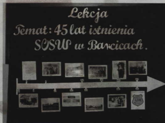
Oś czasu z zaznaczonymi najważniejszymi wydarzeniami z 45-letniej historii ośrodka szkolno-wychowawczego w Barcicach.