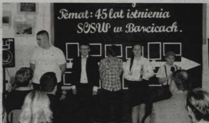
Uczniowie wykonali m.in. piosenkę „Nasza szkoła jest kolorowa”.

stawiciele Pomorskiego Kuratorium Oświaty i powiatu kwizdyńskiego. Słowa podziękowań płynęły również ze strony przedstawicieli samorządów lokalnych oraz Nadleśnictwa Kwizdyn. Dal- szych samych sukcesów w pracy