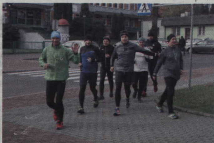
W biegu „wokół chłopka” wzięło udział kilkudziesięciu biegaczy.