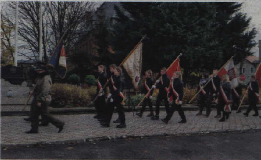
W uroczystościach wzięły udział poczty sztandarowe.