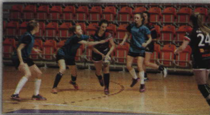
Kwidzynianki pokonały drużynę Sambora Tczew rzucając zwycięską bramkę w ostatnich sekundach meczu.

Pierwszy kwadrans meczu był dość wyrównany, a wynik oscylował wokół remisu. Sytuacja zmieniła się jednak gdy po wyniku 7:7 tczewianki odskoczyły gospodyniom na dwie bramki. Skutecznymi rzutami popisały się wówczas Kinga Wańczyk i Karolina Górecka. Kwidzynianki odpowiedziały skutecznym rzutem karnym wykonanym