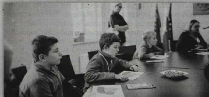
Uczniom zostały przedstawione informacje dotyczące działalności starostwa, poszczególnych wydziałów oraz jednostek organizacyjnych.