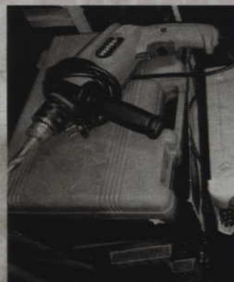
Funkcjonariusze odzyskali część skradzionych łupów.