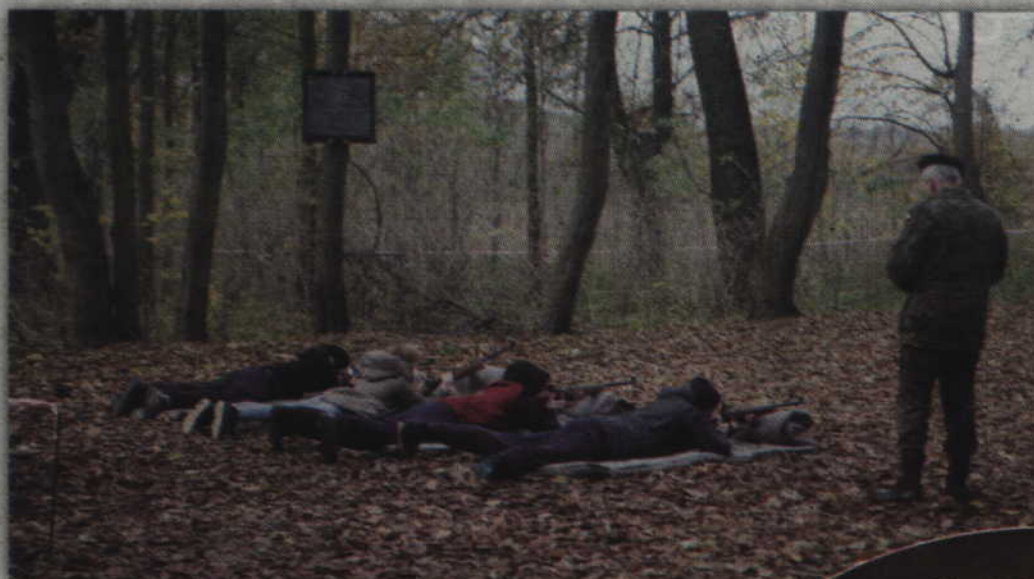
11 listopada na strzelnicy odbyły się zawody strzeleckie, które zorganizował kwidziński GWARD.