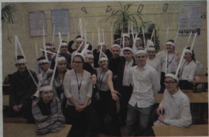
Beaństwo to w I LO kilkudziesięcioletnia tradycja.