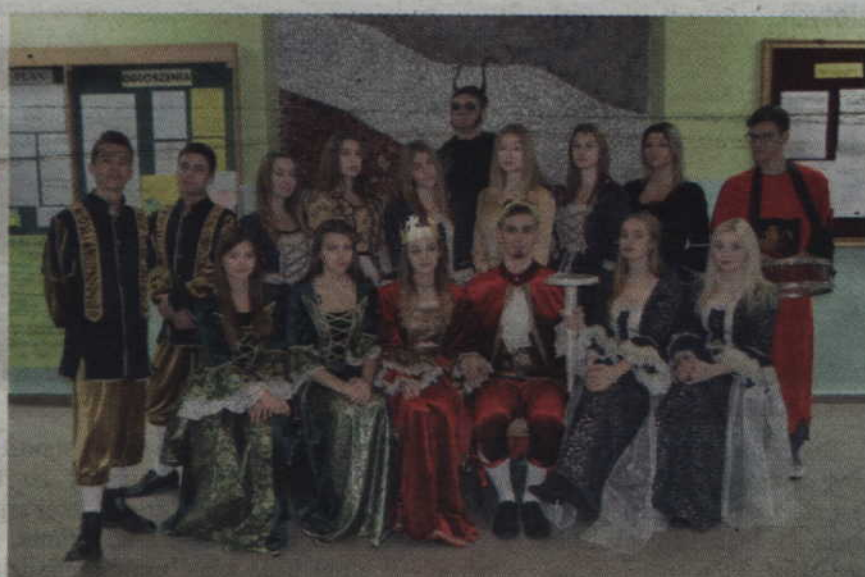
Kwidyn Wielki i Kwidyńowa w otoczeniu najbliższego dworu.