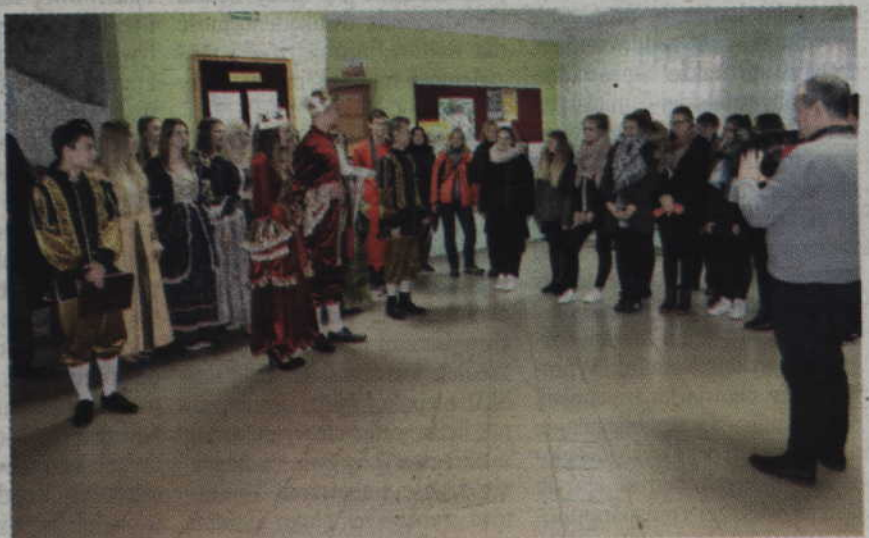
Podczas chrztu pierwszoklasistów nie mogło zabraknąć kabaretu.