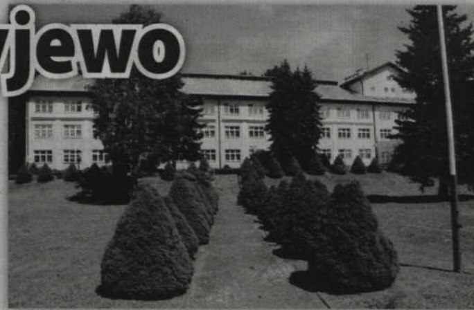
Obecnie Warsztat Terapii Zajęciowej funkcjonuje w pomieszczeniach Domu Pomocy Społecznej w Ryjewie.

komputerowej, fotograficznej, krawiecko-dziewiarskiej, fryzjersko-kosmetycznej oraz stolarsko-ogrodniczej. W zajęciach uczestniczą głównie niepełnosprawni z powiatu kwidzyńskiego, którzy stanowią 75 proc. uczestników. Pozostali uczestnicy to mieszkańcy Domu Pomocy Społecznej „Słoneczne Wzgórze”.