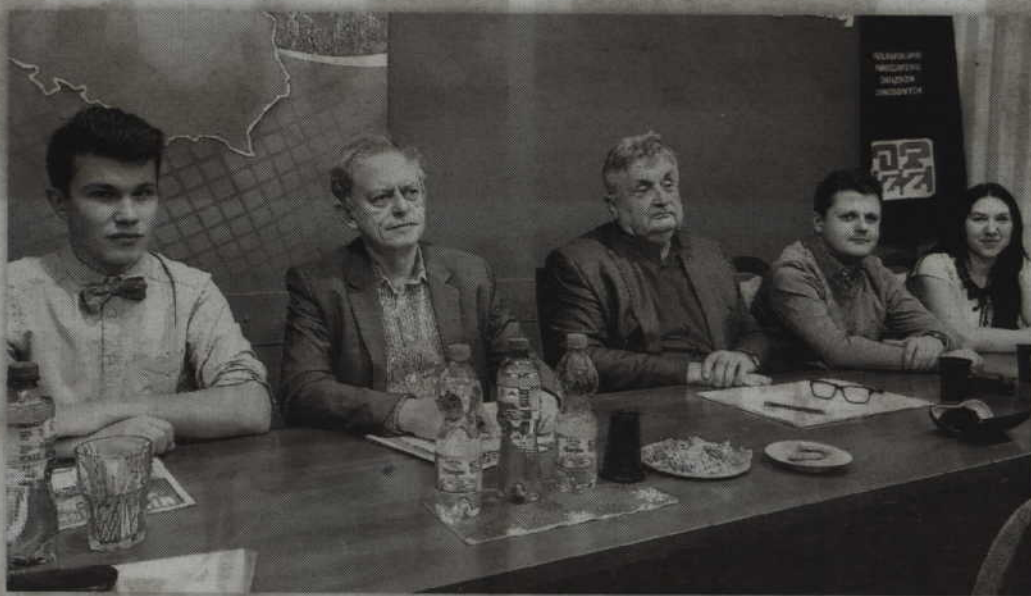
Kwidzińska lewica przygotowuje się już do nadchodzących wyborów samorządowych.

- Zapowiedź powrotu do wyborów proporcjonalnych w gminach powyżej 20 tys. mieszkańców oznacza nic innego jak na przykład likwidację okręgów jednomandatowych w Kwidzynie. Jako lewica tę propozycję przyjmujemy z zadowoleniem. Dotyczy to także wprowadzenia obywatelskiej inicjatywy uchwałodawczej, ustawowego uregulowania instytucji budżetu obywatelskiego. Ciekawą propozycją, która ma się znaleźć w nowelizowanej ordynacji wyborczej będą na pewno coroczne debaty o stanie samorządu połączone z udzielaniem wotum zaufania organowi wykonawczemu. Wprowadzenie obowiązku transmisji, nagrywania i upubliczniania nagrań z sesji oraz wykazów głosowań radnych będzie służyło jeszcze większej transparentności naszej lokalnej samorządno-