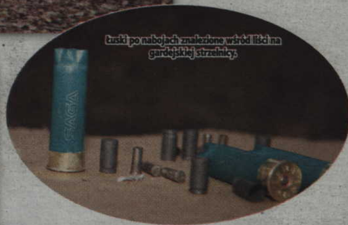
Łuski po nabojach znalezione wśród liści na gardejskiej strzelnicy.

W minione święto niepodległości odbywały się tam zawody strzeleckie, którego organizatorem było kwidzińskie stowarzy-