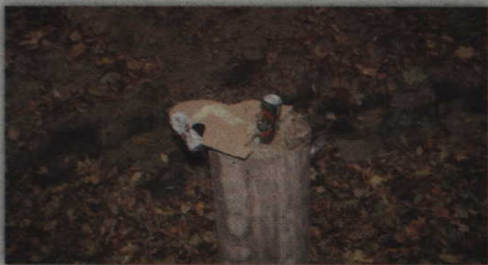
Podczas strzelań, które z legalnością nie mają nic wspólnego za cele zamiast tarcz służą puszki po piwie.

kilkaset metrów od strzelnicy. Zbłąkana kula może zranić także osoby postronne, przechadzające się po polach, które nie mają świadomości, że ktoś strzela z ostrej broni.