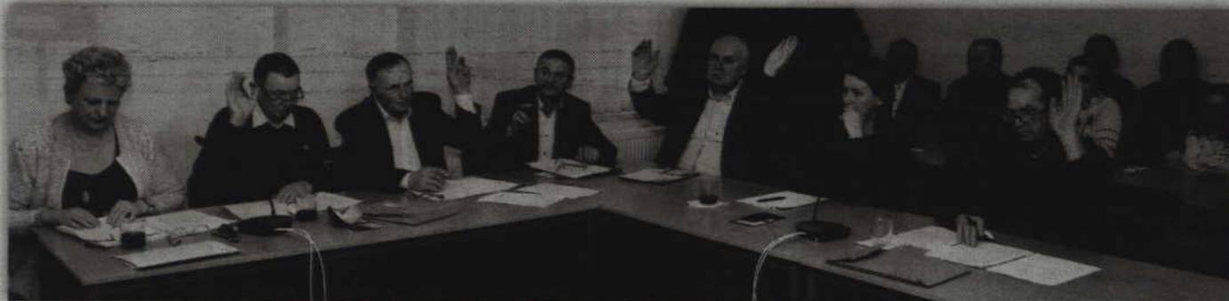
Radni byli jednomyślni głosując za nowymi stawkami podatków.

SADLINKI. Mieszkańcy gminy Sadlinki nowy rok przywitają z podwyżkami lokalnych podatków. Nie będą to jednak drastyczne zmiany i ulegną one zwiększeniu tylko w czterech dziedzinach. Podwyżka, w zależności od tego czego będzie dotyczyła wyniesie od 1 grosza do 10 złotych.