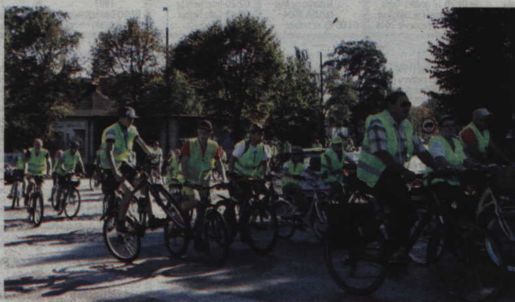
Rowerzyści na ulicach Tczewa świętują „Europejski dzień bez samochodu”

że uda się wyłonić operatora i uruchomić system w przeciągu roku, choć oczywiście negocjacje mogą mieć różny przebieg. Na razie pilotaż systemu planujemy