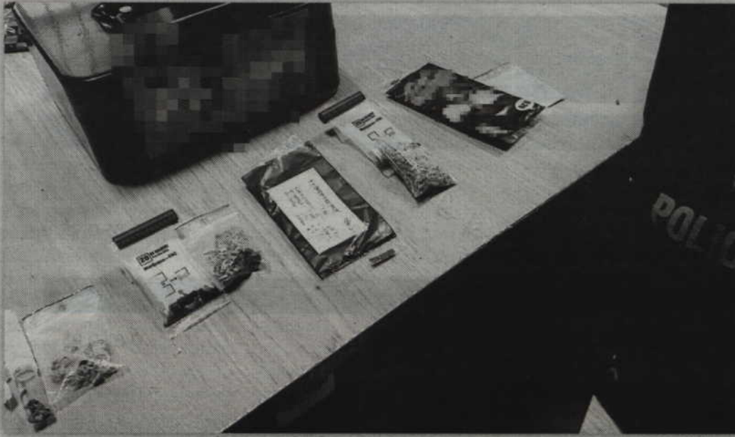
W mieszkaniu policjanci znaleźli środki odurzające.