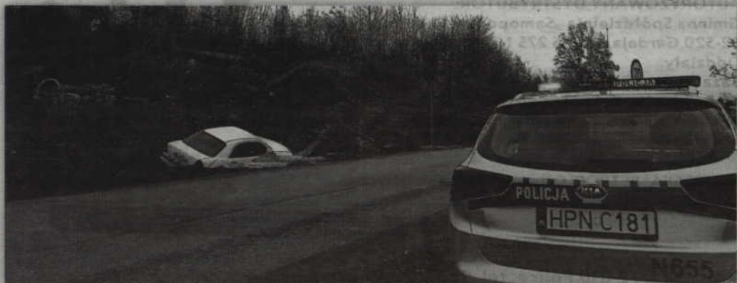
Wyglądało groźnie, na szczęście skończyło się tylko uszkodzeniem auta.