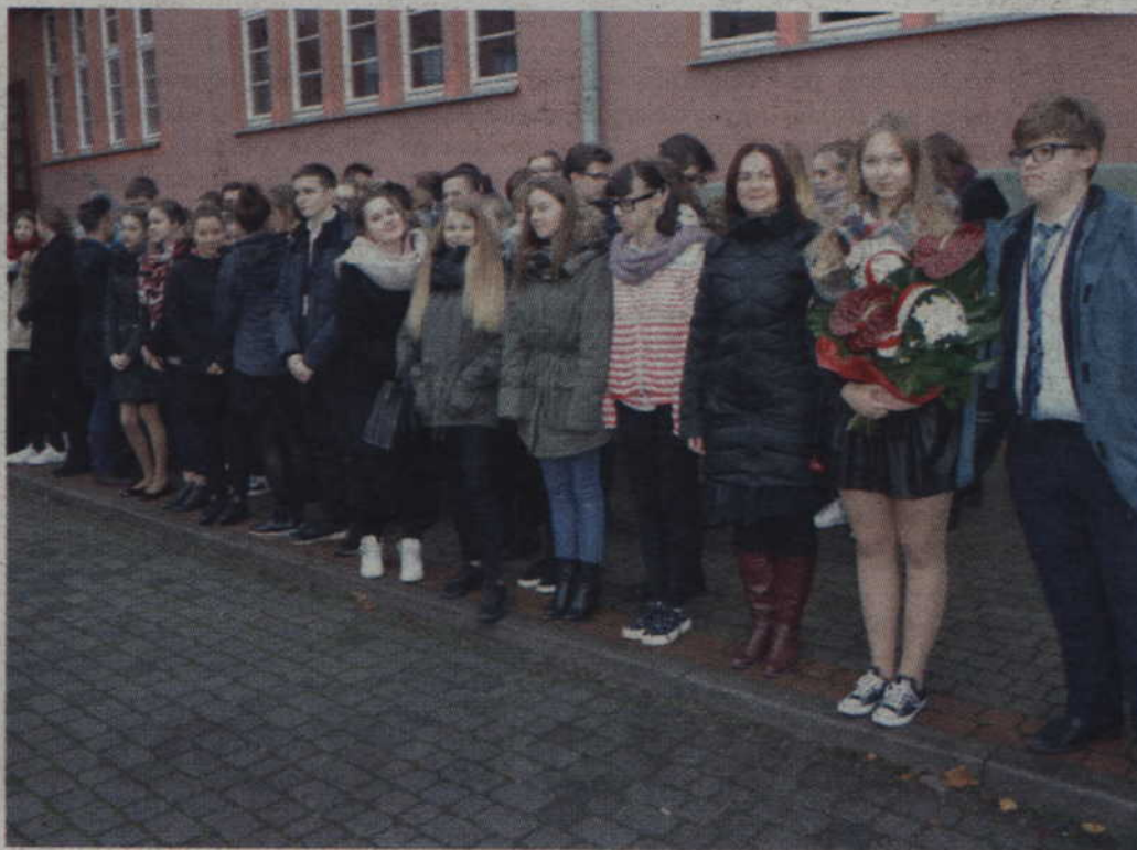
Uroczysty apel zgromadził całą szkolną społeczność.