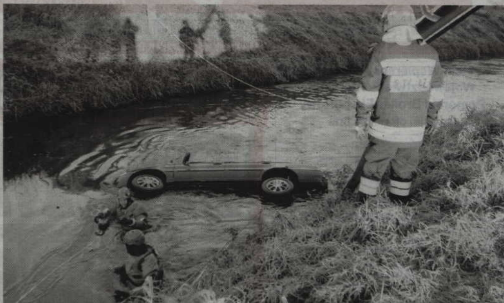
Strażacy ze Specjalistycznej Grupy Ratownictwa Technicznego z Komendy Powiatowej Państwowej Straży Pożarnej w Tczewie musieli wyciągać z rzeki Liwy auto.