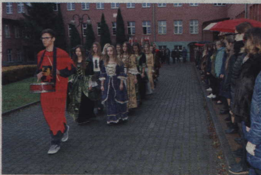
Kwidynowej i Kwidyńowi zawsze towarzyszy specjalny orszak.