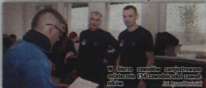
W biurze zawodów zarejestrowano ostatecznie 154 zawodniczek i zawodników.