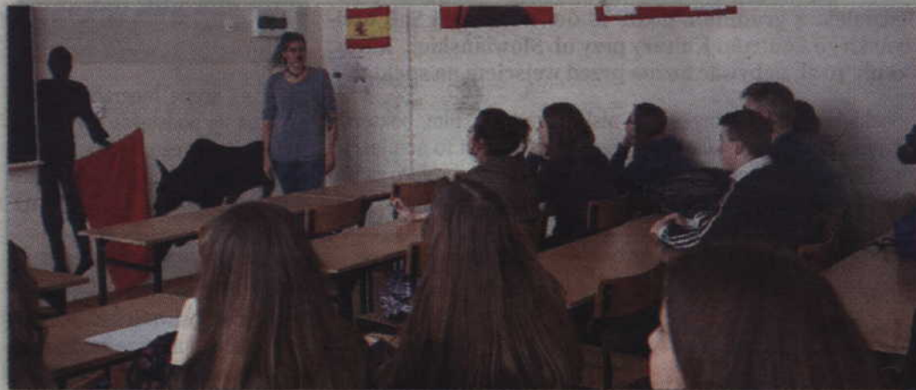
Podczas quizu uczniowie mieli odgadnąć czy prezentowane zdjęcia przedstawiają Polskę czy Hiszpanię.