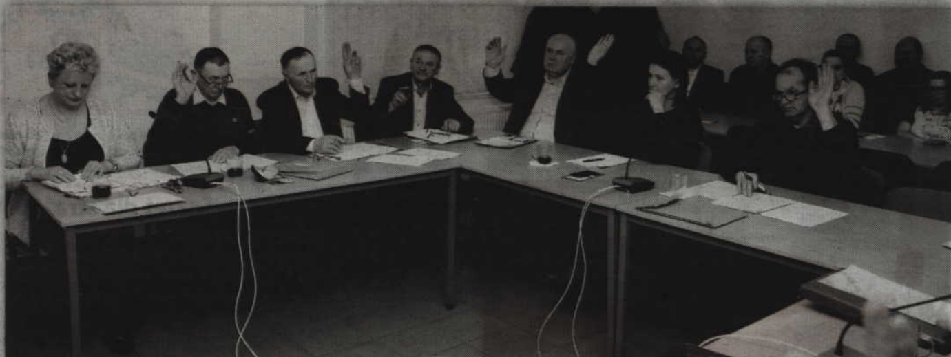
Radni wysłuchali sprawozdania o stanie bezpieczeństwa na terenie gminy Sadlinki.

Niestety kierownik Posterunku Policji w Sadlinkach nie miał dla radnych dobrych wiadomości