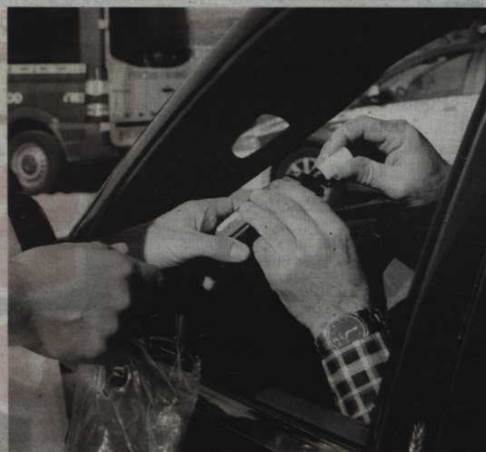
Mimo apeli kierowcy nadal wsiadają za kierownicę będąc pod wpływem alkoholu.

Przejeżdżając przez przejazd kolejowy w Sadlinkach na uli-