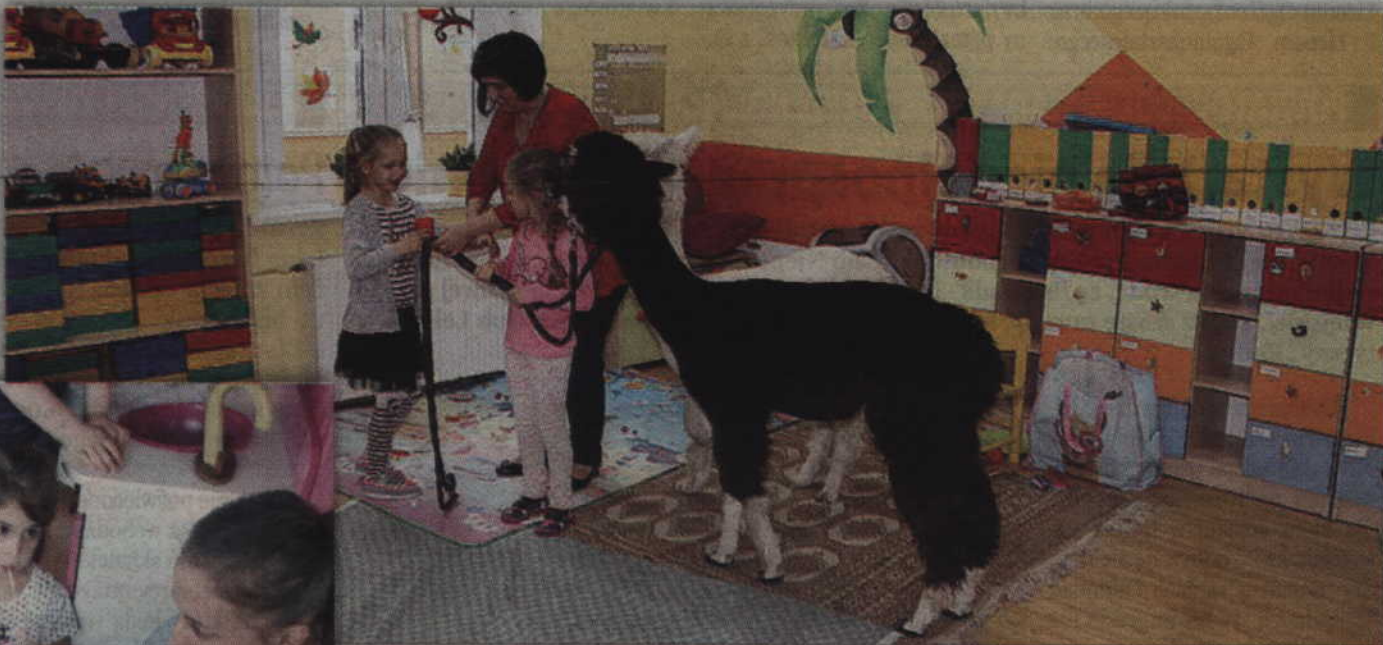
Dzięki uprzejmości Iwony Rożak w przedszkolu pojawiły się alpaki Manu oraz Kumys. Fot. Przedszkole z Oddziałami Integracyjnymi w Kwidzynie

Fot. Przedszkole z Oddziałami Integracyjnymi w Kwidzynie