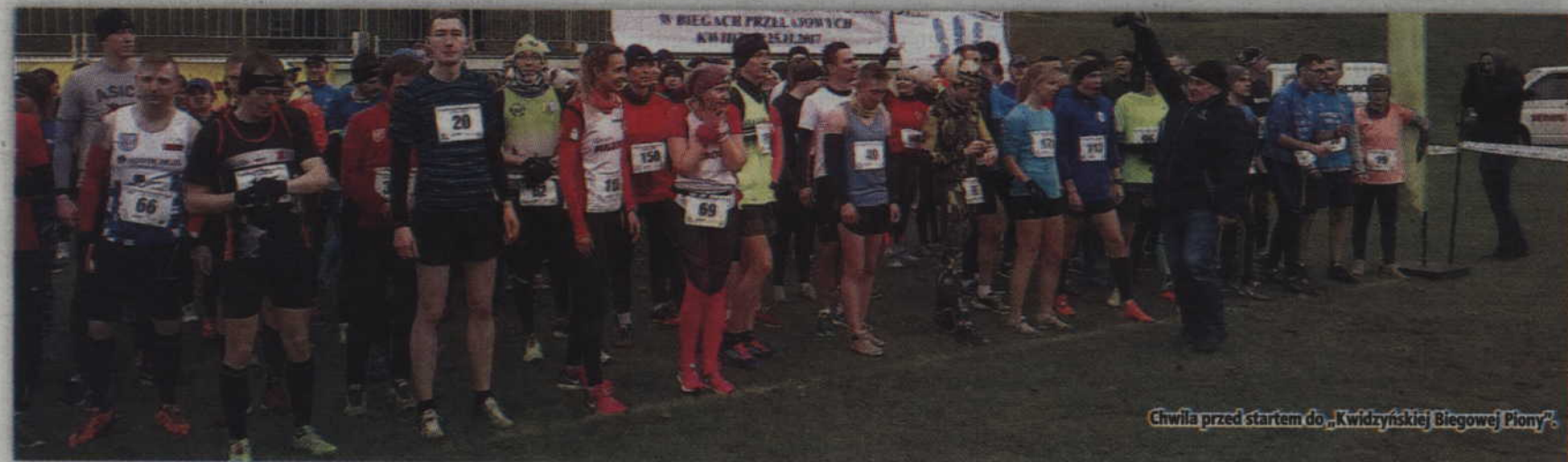
Chwila przed startem do „Kwidzyńskiej Biegowej Piony”.