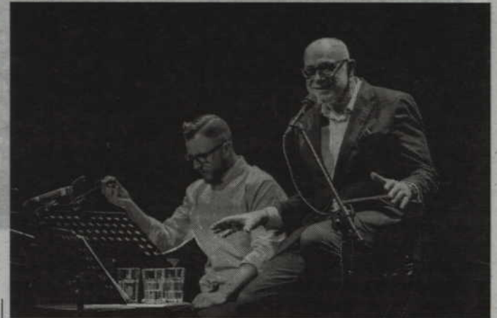
Gwiazdą tegorocznej Giełdy będzie Piotr Machalica.

Część turniejowa Giełdy obejmuje dwie kategorie: młodzieżową (14-18 lat) oraz dorosłych (19-35 lat). Na scenie uczestnicy pre-