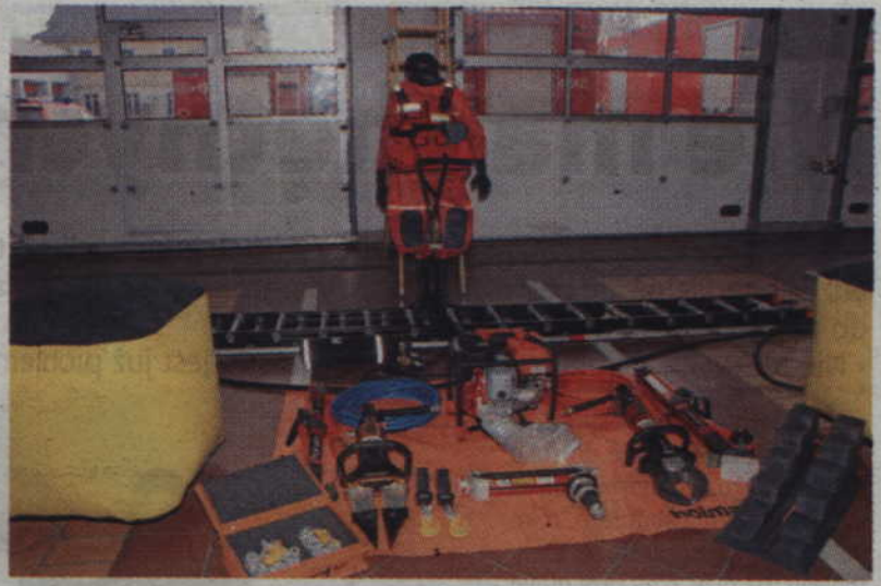
Nowo zakupiony sprzęt to nie tylko samochód, ale m.in. zestaw narzędzi hydraulicznych Holmatro, zestaw poduszek pneumatycznych LAB-6, przenośna 10-metrowa drabina oraz ubrania specjalne do pracy w wodzie i ratownictwa lodowego.