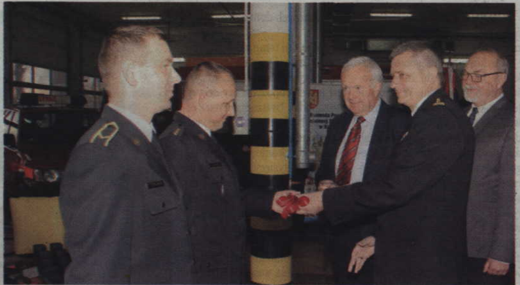
St. bryg. Piotr Socha, zastępca Pomorskiego Komendanta Wojewódzkiego, wręcza kluczyki od nowego samochodu operacyjnego Ford Ranger.

Podziękował także wszystkim strażakom za udział w działaniach ratowniczych po ostatnich nawalnicach, które dotknęły Pomorze.