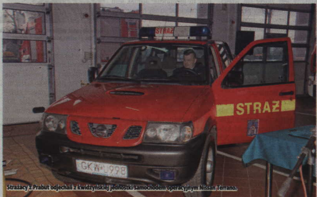
Strażacy z Prabut odjeżdżają z kwidzyńskiej jednostki samochodem operacyjnym Nissan Terrano.