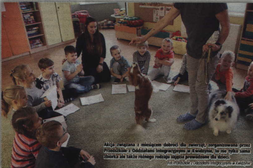
Akcja związana z miesiącem dobroci dla zwierząt, zorganizowana przez Przedszkole z Oddziałami Integracyjnymi w Kwidzynie, to nie tylko sama zbiórka ale także różnego rodzaju zajęcia prowadzone dla dzieci.

- Jako nauczyciele mamy możliwość kształtowania w dzieciach