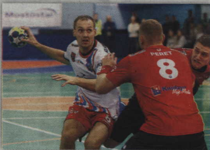
Kwidzynianie nie potrafili powstrzymać skutecznych ataków gospodarzy.