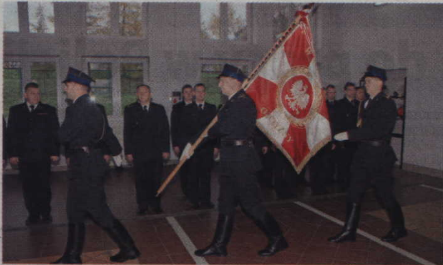
Uroczystość przekazania strażackiego sprzętu odbyła się w Komendzie Powiatowej Państwowej Straży Pożarnej w Kwidzynie.