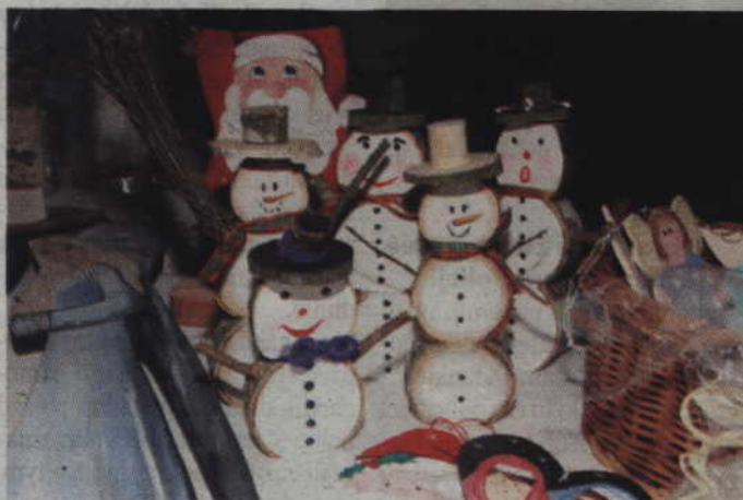
Podczas kiermaszu będzie można kupić oryginalne ozdoby świąteczne wykonane w Warsztacie Terapii Zajęciowej w Kwidzynie oraz Świetlicach Środowiskowych Stowarzyszenia Rodzin Katolickich.

Siedziba kwidzińskiego Warsztatu Terapii Zajęci-