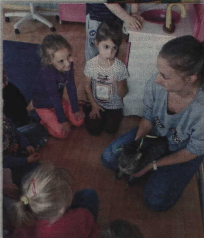
Pomoc dla zwierząt nie kończy się na jednej akcji, ale będzie trwała nadal.

wielu postaw, jednakże największą rolę w ich życiu odgrywają rodzice. Dlatego zaprosiliśmy ich do współpracy polegającej na czytaniu dzieciom. Dzięki wsparciu ze strony Biblioteki Publicznej Gminy Kwidzyn otrzymaliśmy mnóstwo książek o tematyce zwierzęcej, które następnie zostały przekazane poszczególnym grupom. Wszystko po to, aby dodatkowo zachęcić dzieci do sięgania po książki oraz promować współpracę nauczycieli oraz rodziców we wspólnym kształtowaniu wrażliwości i dobroci.