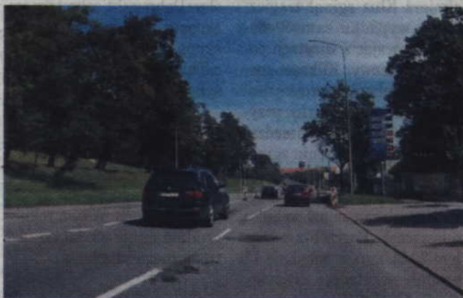
Fot. Trakt Św. Wojciecha / archiwum portalpomorza.pl

GDAŃSK 6 listopada 2017 roku około godz. 14:00 w Gdańsku na ul. Trakt św. Wojciecha miał miejsce wypadek drogowy.