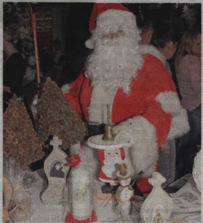
W „Liwie” pojawi się również Mikołaj, a dochód ze sprzedaży ozdób przeznaczony zostanie na rehabilitację niepełnosprawnych uczestników WTZ w Kwidzynie.