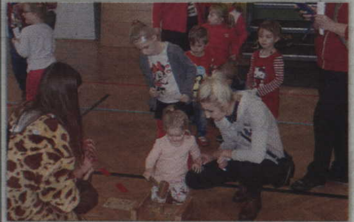
Tak uczestnicy bawili się na ubiegłorocznej imprezie „Umiem wszystko”.

KWIDZYN. Kwidzyńskie Centrum Sportu i Rekreacji zaprasza wszystkich przedszkolaków na zabawę sportowo-rekreacyjną z Mikołajem odbywającą się pod hasłem „Umiem wszystko”. Spotkanie odbędzie się w sobotę, 2 grudnia o godz. 10.00 w hali sportowej przy ul. Żeromskiego. Wstęp wolny.