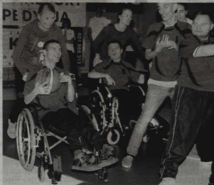
Powiatowa Olimpiada Kół i Środowisk Osób Niepełnosprawnych odbędzie się w hali widowiskowo-sportowej przy ul. Wiejskiej.

Większość konkurencji doskonale znana jest uczestnikom zawodów. To między innymi toczenie piłki nogami, przekazywanie piłki górną ręką czy sztafetowy wyścig z