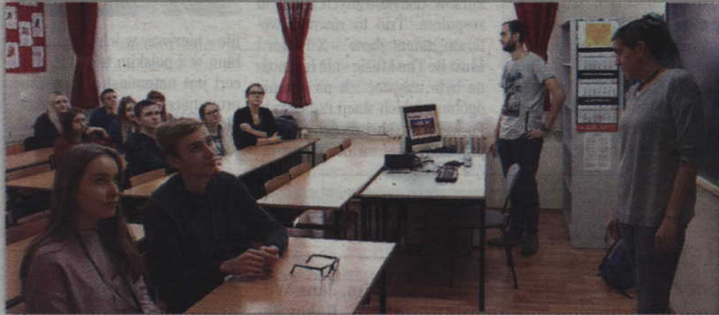
W spotkaniu wzięli udział uczniowie szkolnego Kółka Języka Hiszpańskiego.