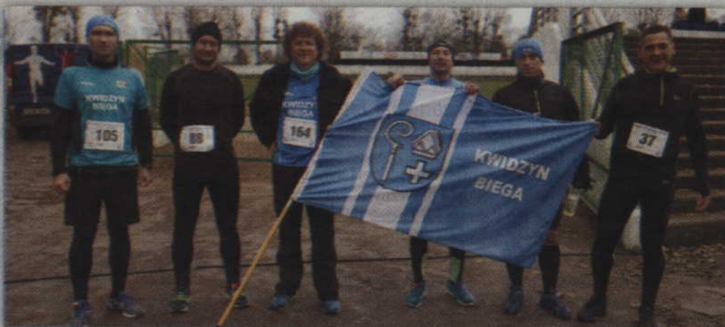
Drużyna „Kwidzyn Biega”.