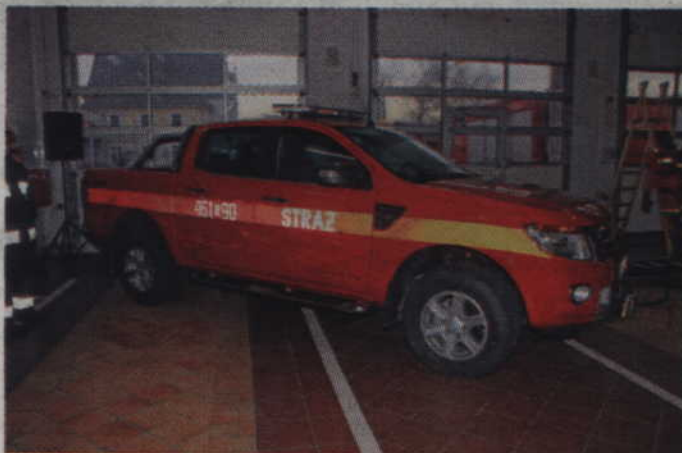
Ford Ranger ma silnik o mocy 200 KM oraz napęd terenowy 4x4. Jego koszt to 130 tys. zł.