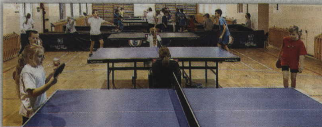
W rywalizacji Grand Prix powiatu wzięło udział 45 uczestników z sześciu szkół.