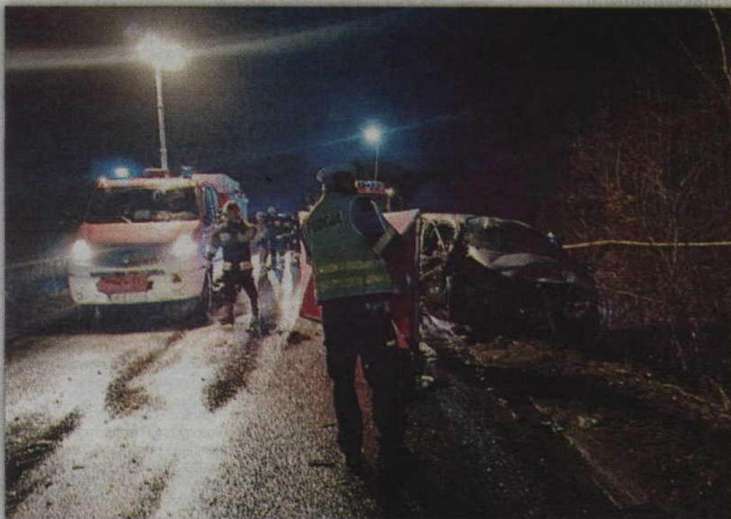
Do tragicznego wypadku doszło na drodze nr 521 z Prabuty do Kwidzyna.