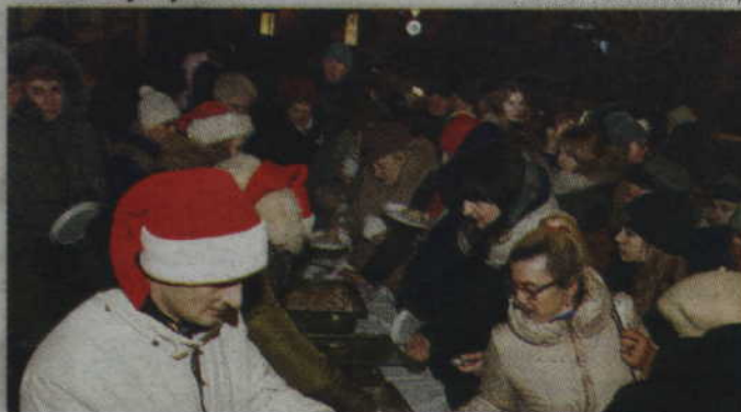
Podczas spotkania można było spróbować m.in. świątecznego barszczu oraz pierogów.