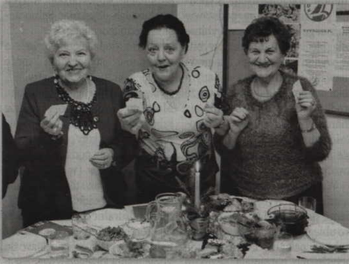
Jak przystało na spotkanie wigilijne nie zabrakło na nim również łamania się opłatkiem.