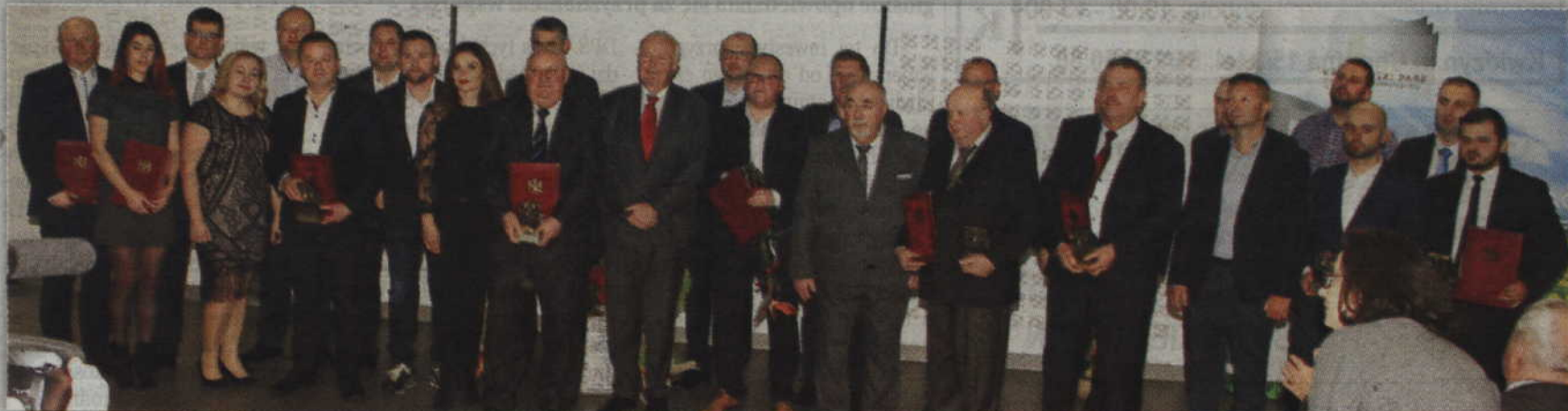
Wszyscy nagrodzeni w dziedzinach przedsiębiorczość i rynek pracy.