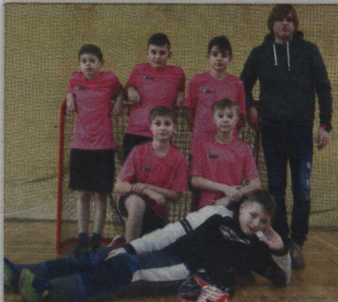
Unihokeiści z Trumiej wygrali turniej w Subkowach.

UNIHOKEJ. Kilkunastu miłośników unihokeja ze szkół w Trumiejach i Gardei zagrało w turnieju mikołajkowym rozgrywanym w Subkowach. Nie do pokonania okazali się zawodnicy ze szkoły w Trumiejach, którzy turniej wygrali, nie tracąc przy tym żadnej bramki.