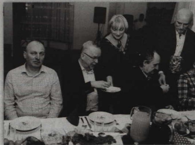
Uczestnikom spotkania rozdano opłatek oraz pamiątkowe otwieracze.