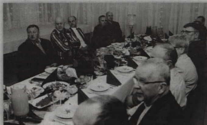
Na spotkaniu opłatkowym spotkało się grono ok. 30 osób.