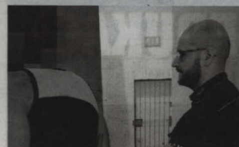
Obaj mężczyźni po wytrzeźwieniu trafili do zakładu karnego.

Z głębokim żalem przyjęliśmy wiadomość o śmierci