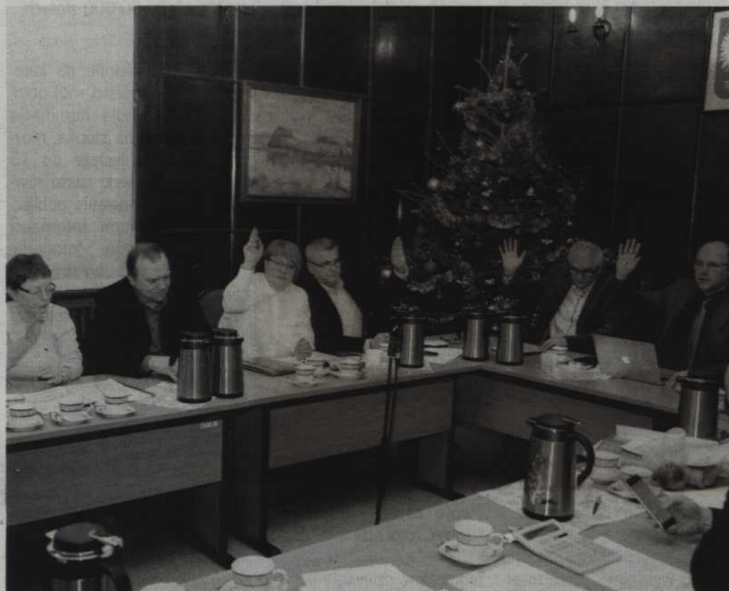
Dwunastu prabuckich radnych głosowało za przyjęciem budżetu na 2018 rok.

PRABUTY. Prabuccy radni pozytywnie zaopiniowali budżet miasta i gminy na rok 2018. Dochody miasta i gminy zostały zaplanowane w wysokości 54 mln zł, a wydatki na kwotę 62 mln zł. Deficyt budżetowy w wysokości 8,2 mln zł zostanie pokryty z emisji papierów wartościowych. Przewidywane zadłużenie na koniec 2018 roku może wynieść 30,5 %. Za budżetem w takim kształcie głosowało 12 radnych, a jedna osoba wstrzymała się od głosu.