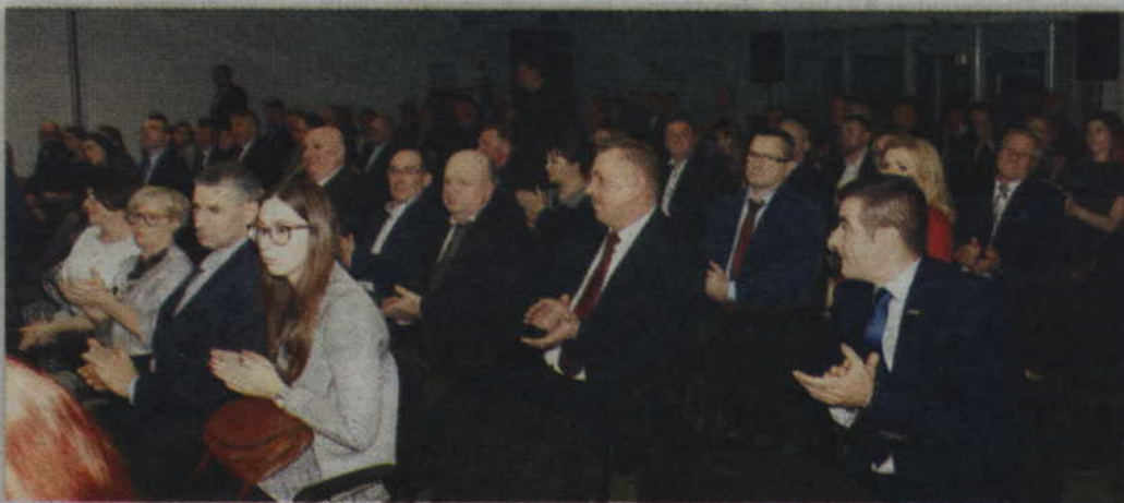
Nagrody starosty kwidzińskiego wręczone zostały w Kwidzińskim Parku Przemysłowo-Technologicznym.