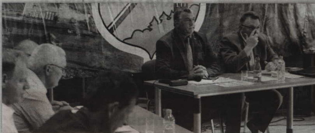
Radni gminy przyjęli nowe stawki podatku od nieruchomości. red. tech. BR