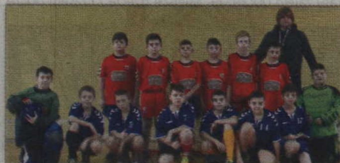
Uczniowie z 4 klasy SP w Gardej, trenujący unihokeja zajęli V i VIII miejsce.

- Na turniej pojechało tak dużo moich zawodników z klasy sportowej, że utworzyłem dwie drużyny: Gardeja I i Gardeja