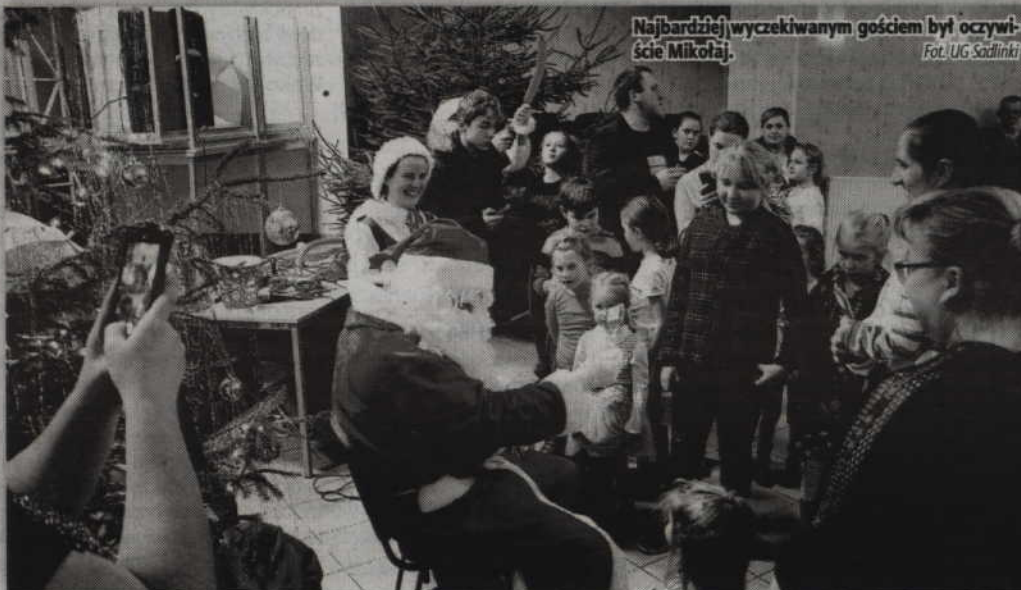
Najbardziej wyczekiwany gościem był oczywiście Mikołaj.