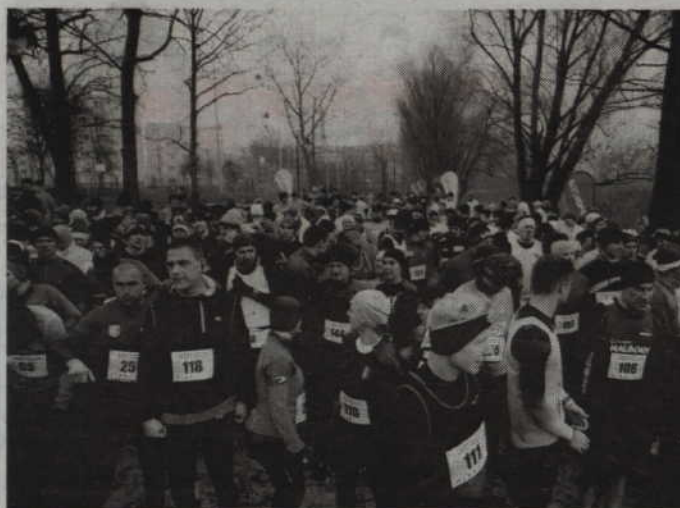
Na starcie XIX Zimowego Grand Prix Sztumu w Biegach Przełajowych stanęło 288 biegaczy.

Trasa grudniowego biegu, tak jak w roku ubiegłym, została wytyczona wokół jeziora Zajezierskiego. Biegacze mieli do pokonania dwie pętle, po 4600 metrów każda. Start był umiejscowiony na miejskiej plaży. W tym roku na starcie pierwsze-