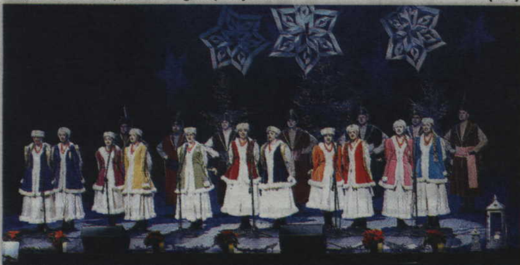
Zespół Pieśni i Tańca „Powiśle” najpierw zaśpiewał kolędy w kwidzyńskim teatrze, po czym pojawił się również na Placu Jana Pawła II.