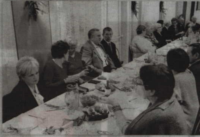
Spotkanie wigilijne odbyło się w pomieszczeniach Kwidzyńskiego Centrum Seniora.