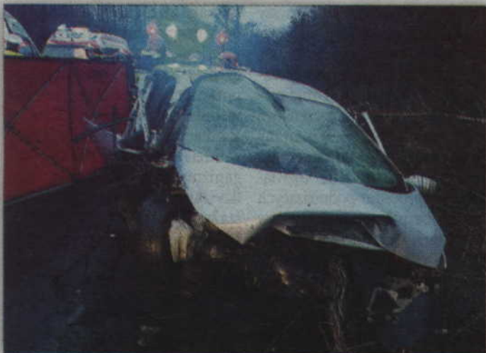
Śmierć poniosły cztery osoby jadące prawidłowo autem marki renault.

GMINA PRABUTY. Cztery osoby zginęły w wypadku samochodowym w Raniewie. Jak ustalono kierowca bmw zjechał na przeciwny pas ruchu i czołowo zderzył się z jadącym prawidłowo renault scenic. Wracające z pogrzebu dwa małżeństwa poniosły śmierć na miejscu. 32-letniemu kierowcy bmw, Prokuratora postawiła zarzut umyślnego naruszenia zasad bezpieczeństwa w ruchu lądowym. Grozi mu do 12 lat więzienia.