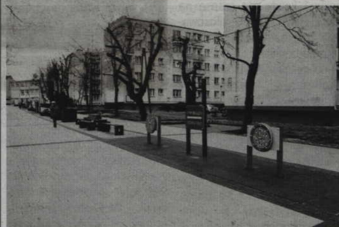
Zdjęcia: UM w Kwizdynie red. tech. KG