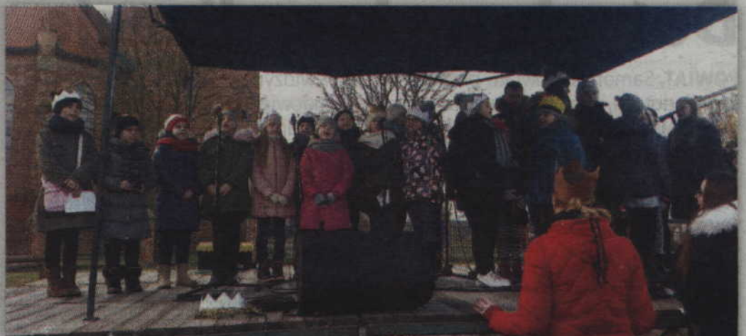
Uroczystość święta Trzech Króli uświetniły występy zespołów wokalnych działających przy PCKiS oraz prabuckiej Scholi.