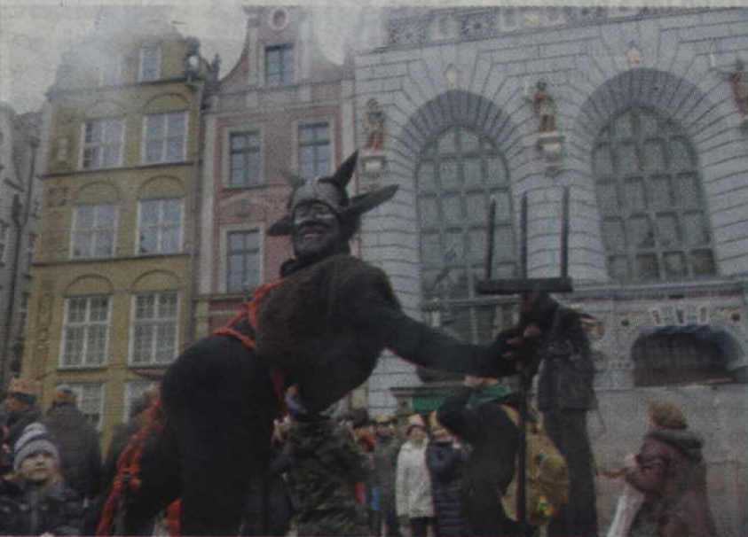
Na drodze korowodu stanął diabeł, za którym walkę stoczył anioł