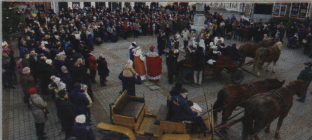
Jak co roku Orszak Trzech Króli zatrzymał się na placu przy ul. Tęczowej.