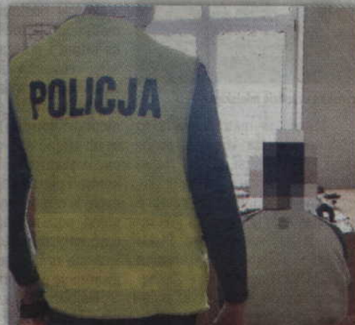
Zatrzymany 20-latek odpowie za posiadanie, udostępnianie i handel substancjami psychotropowymi.