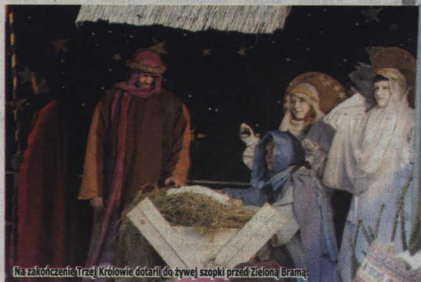
Na zakończenie Trzej Królowie dotarli do żywej szopki przed Zieloną Bramą.