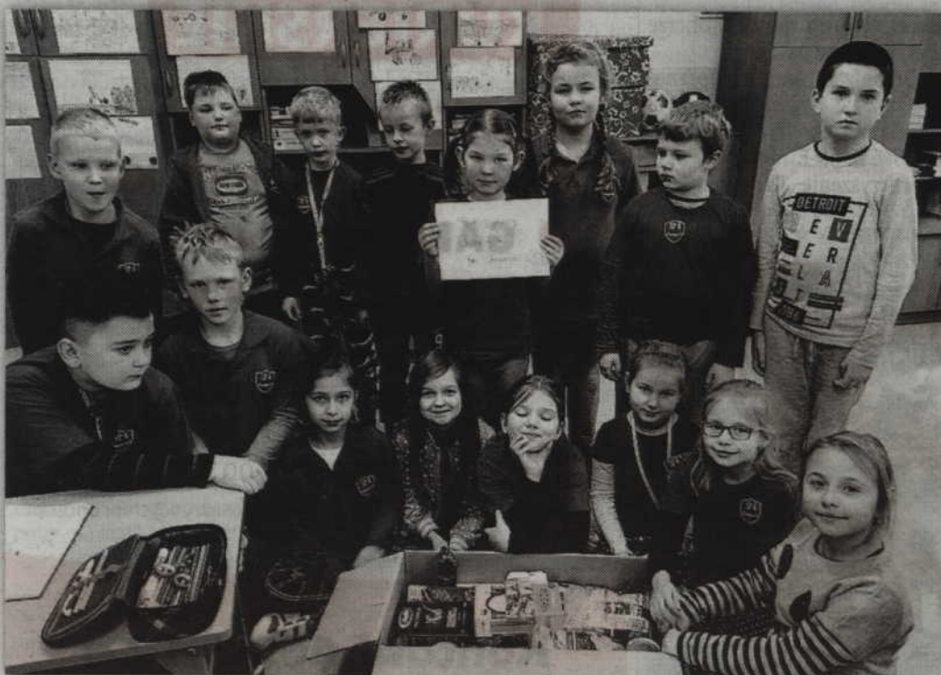
Rodakom na Kresach pomogli również uczniowie klasy IV a z kwidzińskiej „szóstk”.