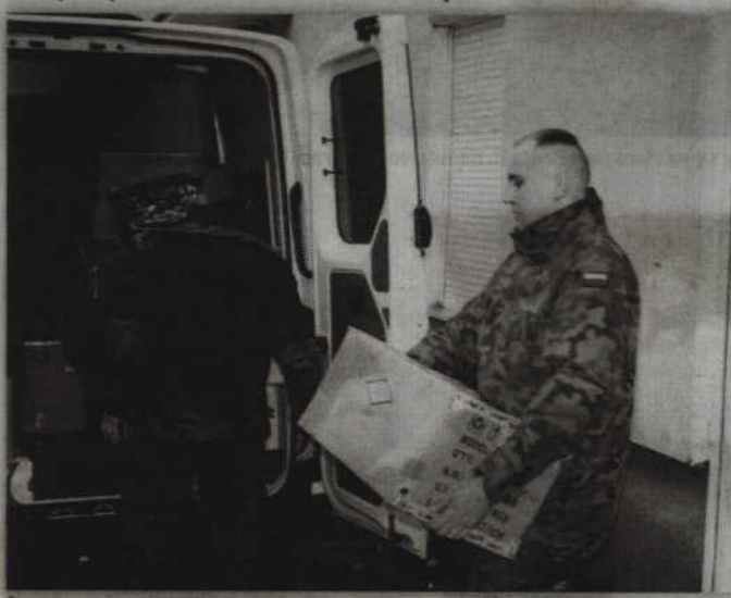
Żołnierze zapakowali przygotowane paczki i przewieźli je do Przecławia k/Szczecina.