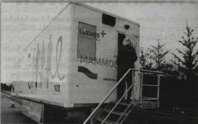
Mammobus pojawi się na parkingu przy kwidzyńskim urzędzie miejskim.

Jak podkreśla firma LUX MED. Diagnostyka tylko niespełna 39 % uprawionych Polek zgłosiło się na badania mammograficzne w ramach Populacyjnego Programu Wczesnego Wykrywania Raka Piersi nadzorowanego przez Ministerstwo Zdrowia. Waga i znaczenie programu dla zdrowia i życia Polek jest nie do przecenienia. Kobiety w wieku 50 – 69 lat są bowiem najbardziej narażone na ryzyko zachorowania.