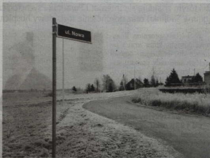
Do remontu drogi w Gardej 1 chce się dołożyć właściciel gospodarstwa rolnego.

-Mieszkańcy naszej gminy złożyli petycje i powinny one natychmiast się znaleźć w specjalnej zakładce w Biuletynie Informacji Publicznej. Niestety petycji mieszkańców Wandowa i Gardei 1 tam nie ma. Ponadto wójt, w przypadku petycji, ma czas do 3 miesięcy na udzielenie odpowiedzi. Co ciekawe, ta odpowiedź musi się również znaleźć w BIP-ie. To jest in-