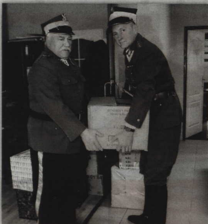
Paczki ufundowali również członkowie Kwidzińskiego Ochotniczego Szwadronu Kawalerii.

Akcja wspiera naszych Rodaków na Wileńszczyźnie, w tym kombatantów, byłych żołnierzy AK i innych formacji którzy pozostali na Kresach Utraconych. Paczki trafią także do polskiego hospicjum dla dzieci, polskich szkół i ludzi ubogich polskiego pochodzenia. Akcja odbywa się pod honorowym patronatem małżonki Prezydenta RP Agaty Kornhauser-Dudy.