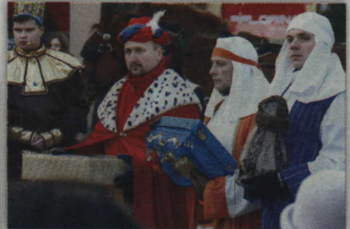
Trzej Mędrcy przybyli ze Wschodu aby oddać pokłon Książęciu Pokoju.