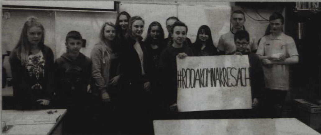
W akcji wzięli udział m.in. uczniowie SP 5 w Kwidzynie.

REGION. Ponad 100 paczek czyli ponad 1 tonę darów zebrali wspólnie mieszkańcy powiatu kwidzińskiego oraz jeden z mieszkańców Gniewa, w ramach akcji „Paczka dla Rodaka i Bohatera na Kresach”. Powiatowym koordynatorem akcji organizowanej przez Fundację Polskich Wartości było Stowarzyszenie Kresowiaków w Kwidzynie.