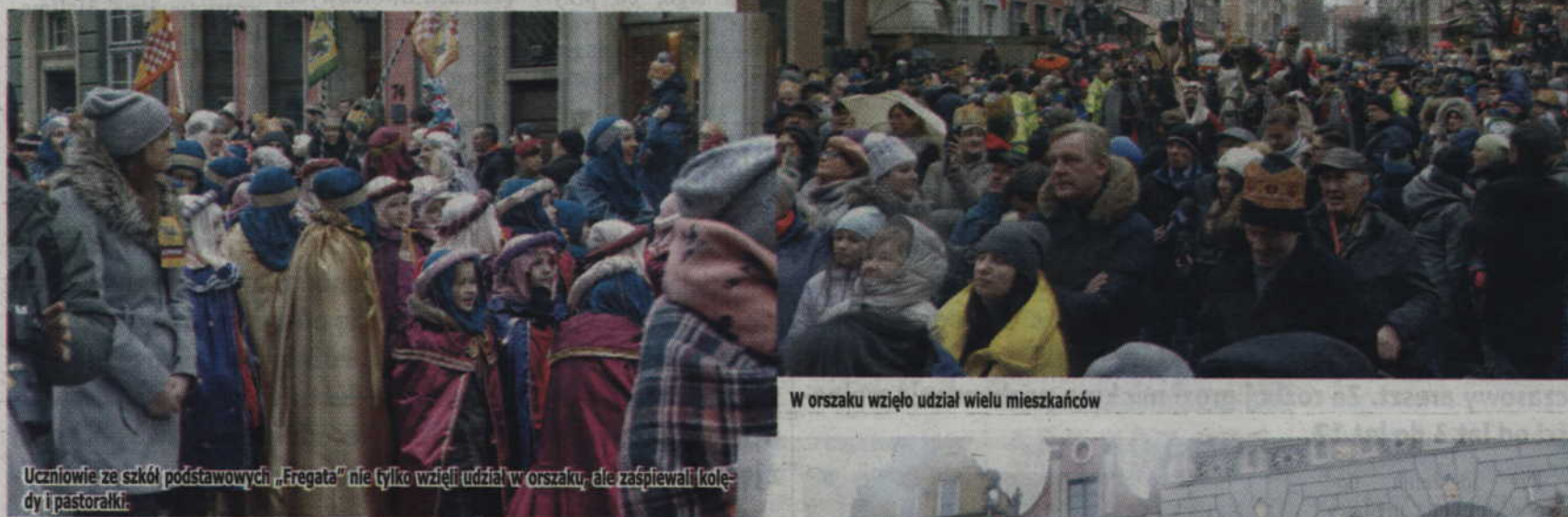
W orszaku wzięło udział wielu mieszkańców