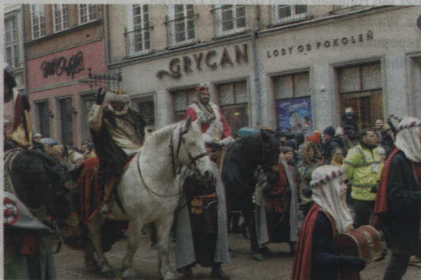
Ulicami Głównego Miasta Gdańska po raz ósmy przeszedł Orszak Trzech Króli