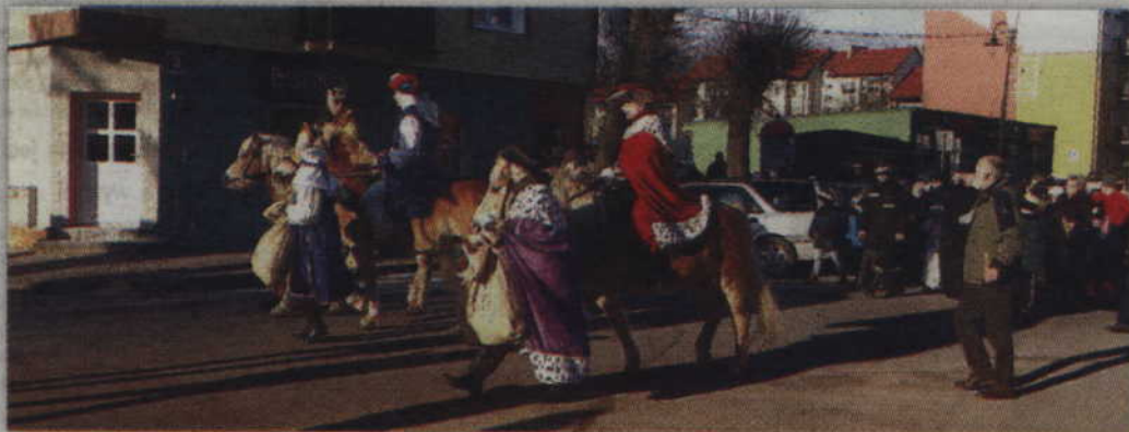
W rolę Trzech Króli wcielili się pracownicy Klubu Jeździeckiego w Julianowie.

Po raz czwarty, wierni mogli również uczestniczyć w religijnym przemarszu także ulicami Prabut. Początek tym niezwykłym uroczystościom dała Msza św. odprawiona w kościele pw.