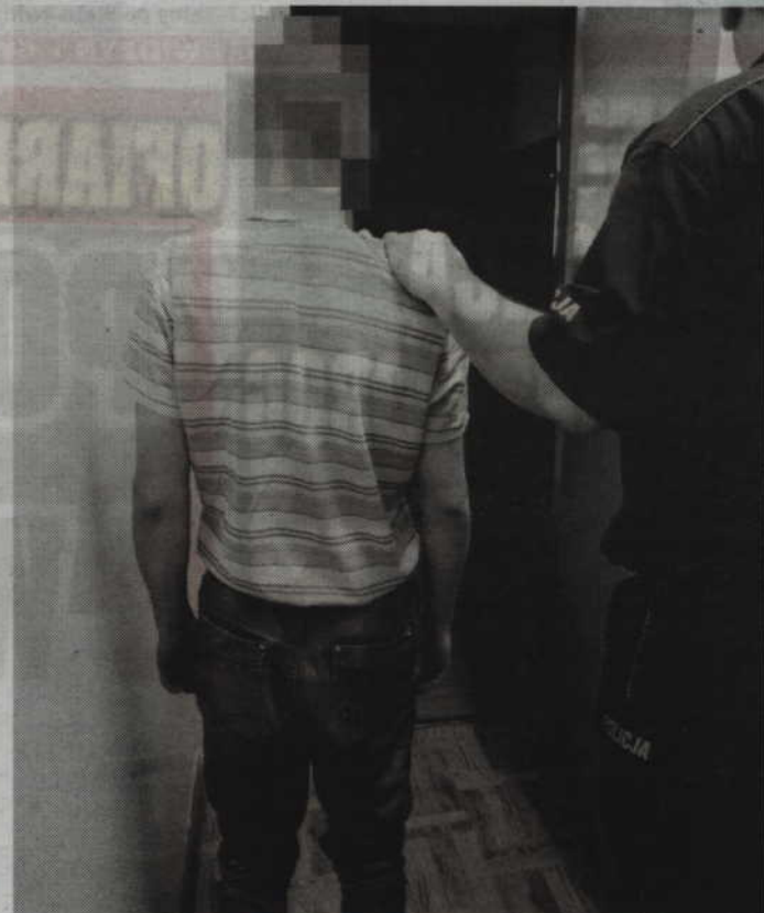
Póki co wobec 19-letniego napastnika sąd orzekł miesiąc tymczasowego aresztu. Za popełniony czyn mężczyźnie grozi jednak od 3 do 12 lat więzienia.

-Za to przestępstwo grozi mu kara pozbawienia wol-