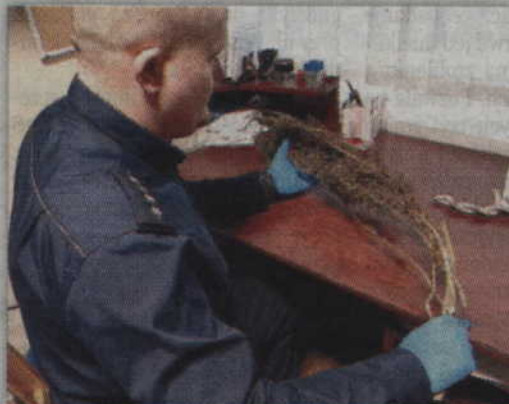
W domu zatrzymanego odnaleziono m.in. ok. 35 gram zielono-brązowego suszu roślinnego, ponad 55 gram białego proszku, 60 żółtych tabletek oraz wysuszony krzak roślinny.