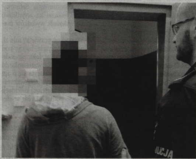
Trójka sprawców odpowie za rozbój i pozbawienie 50-latka wolności. Sprawcom grozi od 3 do 12 lat więzienia.

Oprawy, po tym jak zabrali mężczyźni 130 złotych, telefon komórkowy, dowód osobisty i karty bankomatowe, wozili jeszcze 50-latkę po mieście i próbowali wypłacić pieniądze z jego konta. Ostatecznie wywieźli mężczyznę za miasto i porzucili w lesie. Poturbowany „okazją” wrócił do Kwidzyna i zgłosił się na Policję.