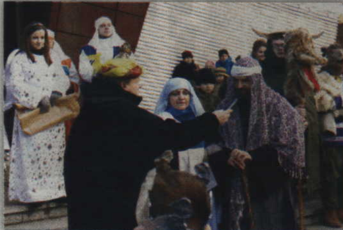
- Mam nadzieję, że to dziecię, które się narodzi, spełni tę obietnicę i będzie pokój na świecie - powiedział Józef przepytany przez narratora.

Jak czytamy w Ewangelii Św. Łukasza: „W tej samej okolicy przebywali w polu pasterze i trzymali straż nocną nad swoją trzodą. Wtem stanął przy nich anioł Pański i chwala Pańska zewsząd ich oświeciła, tak że bardzo się przestraszyli. I rzekł do nich anioł: „Nie bójcie się! Oto zwiastuję wam radość wielką, która będzie udziałem całego narodu: dziś bowiem w mieście Dawida narodził się wam Zbawiciel, którym jest Mesjasz, Pan. A to będzie znakiem dla was: znajdziecie Niemowlę owinięte w pieluszki i leżące w żłobie.”