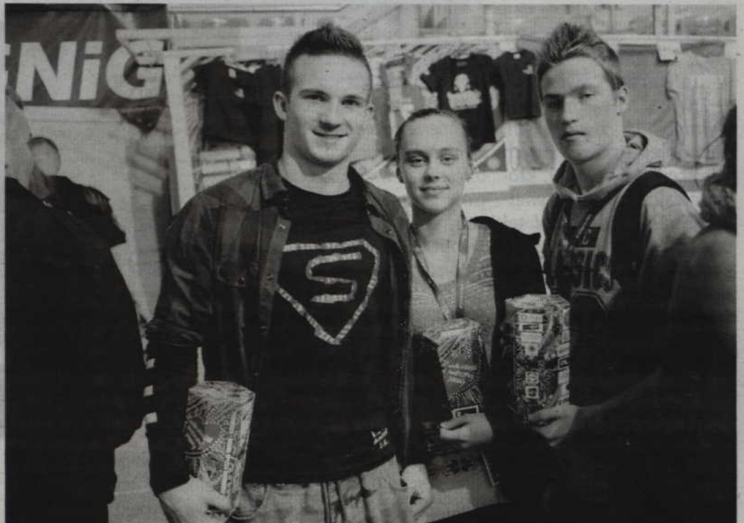
W tym roku wolontariusze zbierać będą pieniądze na wyrównanie szans w leczeniu noworodków.

Punktualnie w samo południe wystartuje natomiast bieg „Policz się z cukrzycą i ucz się pierwszej pomocy”. Uczestnicy przebiegną symboliczną trasę 2 km ulicami miasta, którą będzie można pokonać w dowolny sposób: sprintem, marszobiegami, spacerem, na wózkach inwalidzkim czy też z kijkami Nordic Walking. -Chociaż wszyscy sportowcy są mile widziani, tym razem nie biegniemy żeby rywalizować. Ważniejsze od bicia rekordów czasowych jest uczestnictwo, dla siebie, dla zdrowia, dla wsparcia ludzi zmagających się z cukrzycą. Na doping i gorące podziękowania może liczyć każdy, kto tego dnia, pomimo zimowej pogody,