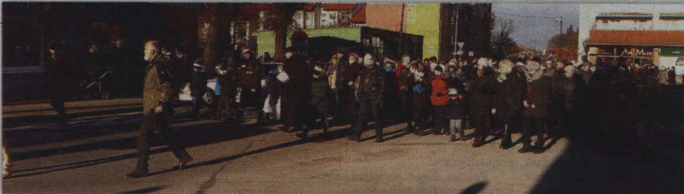
Słoneczny i wyjątkowo ciepły dzień zachęcał do wzięcia udziału w Orszaku Trzech Króli.