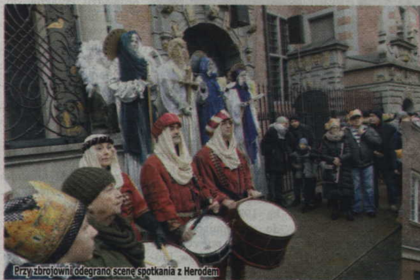
Przy zbrojowni odegrano scenę spotkania z Herodem