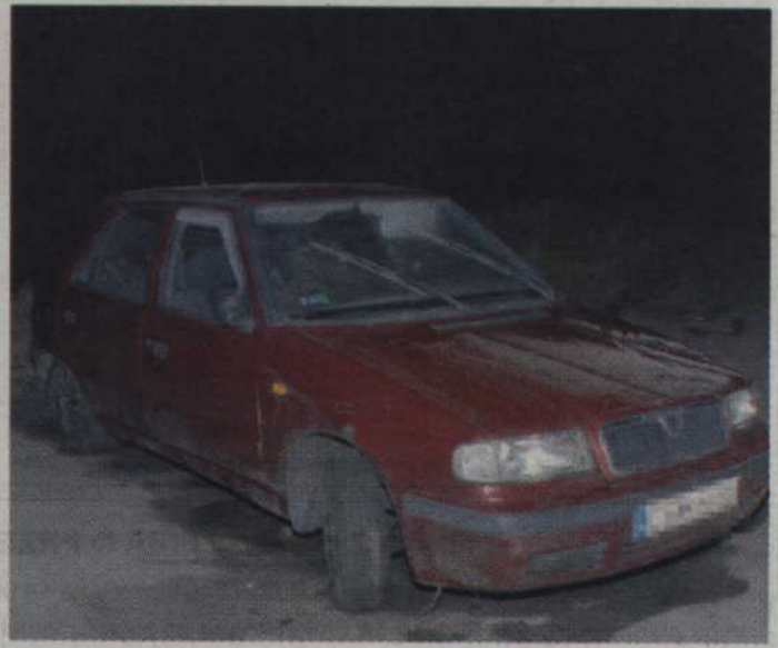
Właściciel skody został ukarany mandatem za spowodowanie zagrożenia w ruchu lądowym.

mochód na brzeg rzeki okazało się, że w środku nikogo nie ma, a tylna szyba jest wybita. Gdy w pobliżu nie znaleziono śladów kierowcy policjanci ustalili dane właściciela zatopionej skody i sprawdzili jego adres zamieszkania. W domu nikogo nie zastano. Dzień później, przed południem,