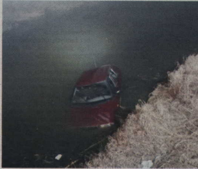
Auto znajdowało się w Kanału Palemona pomiędzy Rozpędzinami a Nowym Dworem.

-Strażacy weszli do Kanału Palemona w ubraniach do pracy w wodzie, po czym sprawdzili wnętrze pojazdu po kącie przebywania w nim osób poszkodowanych. Następnie auto zostało podczipione za przednie zawieszenie oraz wydobyte na brzeg. Jednocześnie przeszukano oba brzegi kanału na odcinku około 500 m w kierunku Kwidzyna, zgodnie z nurtem oraz w przeciwną stronę - informuje st. sekc. Anna Jackowska, oficer prasowy Komendanta Powiatowego Pań-