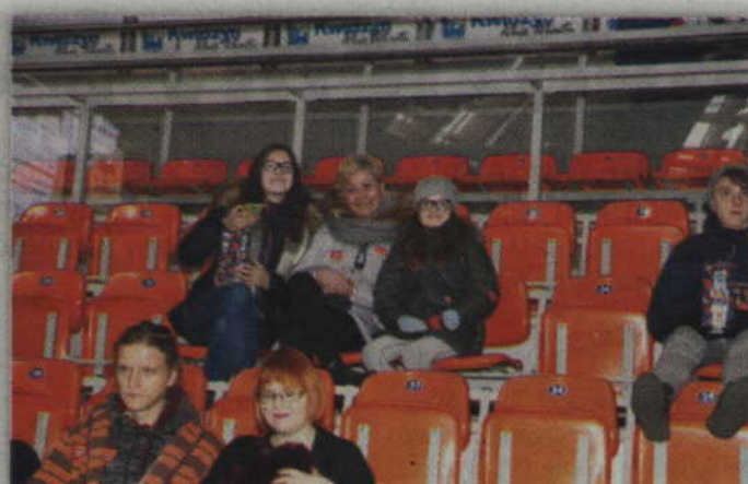
Niektórzy kwestujący zasiedli także na widowni, aby choć przez chwilę obserwować to co działo się na scenie głównej.