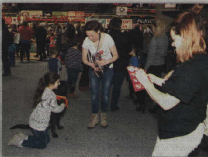
(fox) Wśród wspierających Orkiestrę można było także spotkać czworonogi.

Na koniec warto także podkreślić, że tegoroczny kwidzyński finał WOŚP przyniósł 146 357,66 zł. To więcej niż rok wcześniej, a nie jest to kwota ostateczna. Poznamy ją dopiero po zakończeniu wszystkich aukcji internetowych oraz podliczeniu wszystkich zebranych środków.