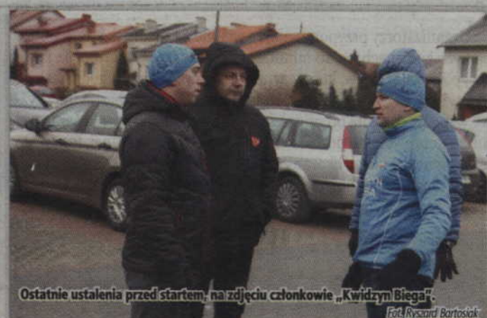
Ostatnie ustalenia przed startem, na zdjęciu członkowie „Kwidzyn Biega”.