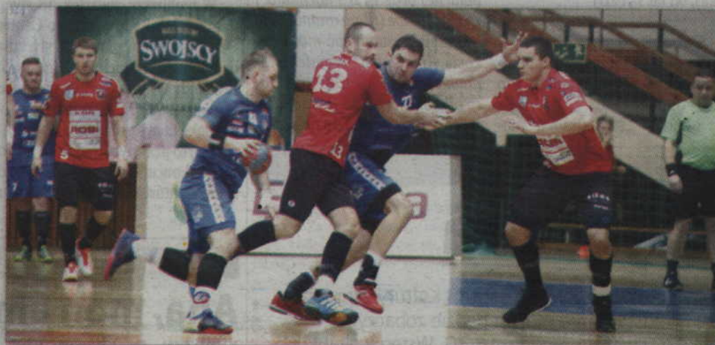
Kwidzyńska obrona nie potrafiła powstrzymać skutecznych ataków Warmii.

Niestety przewaga MMTS nie trwała zbyt długo, bowiem