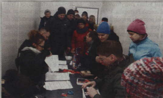
Liczba chętnych przerosła najsmiesznie oczekiwania organizatorów biegu.