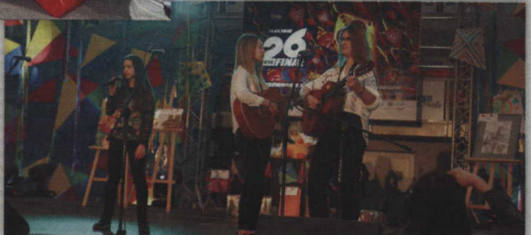
Na orkiestrowej scenie prezentowały się m.in. zespoły muzyczne.

W hali przez cały dzień trwały także prezentacje i występy szkół czy też grup muzycznych lub tanecznych. Licytowano również