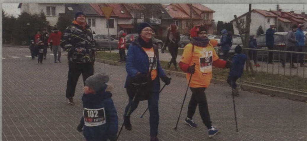
Trasę 2 km pokonali także miłośnicy nordic walking.