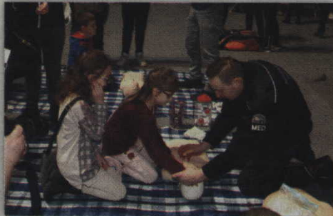
Chętni mogli skorzystać także z krótkiego kursu ratownictwa medycznego.