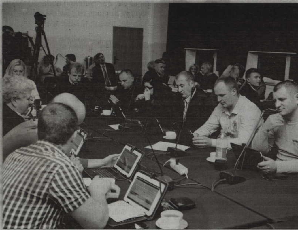
Radni postawili na swoim i wójt zaakceptował ich wnioski budżetowe.