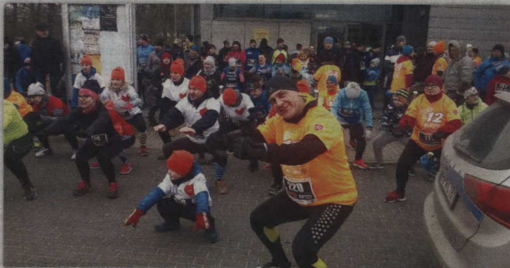
Wspólna rozgrzewka w mroźny dzień była bardzo potrzebna.

BIEGI. Prawie 400 osób wzięło udział w biegu „Policz się z cukrzycą i ucz się pierwszej pomocy” towarzysząc tegorocznemu Finałowi Wielkiej Orkiestry Świątecznej Pomocy. Uczestnicy ścigali się na 2 km trasie, którą pokonać można było w dowolny sposób. W całej Polsce podobne zawody zorganizowano w prawie dwustu miejscach.