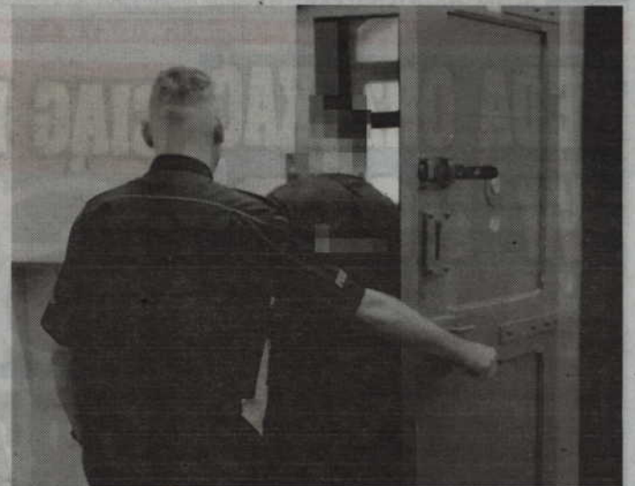
Zarówno 22-letni złodziej, jak i 29-letni paser trafili do policyjnego aresztu.

– Zarówno złodziej jak i paser trafili do policyjnego aresztu – wyjaśnia mł. asp. Bożena Schab, Oficer Prasowy Komendanta Powiatowego Policji w Kwidzynie. – W toku dalszych czynności funkcjonariusze ustalili, że zatrzymani 22-latek ma na swoim koncie także inne przestępstwa, do których doszło na terenie powiatu kwidzińskiego. Jak ustalono młody mężczyzna, wspólnie z dwoma innymi kompanami w wieku 31 i 32 lat, na przełomie października i listopada 2017 roku, włamał się do domu mieszkalnego w gminie Sadlinki skąd ukradł m.in. kable, tele-