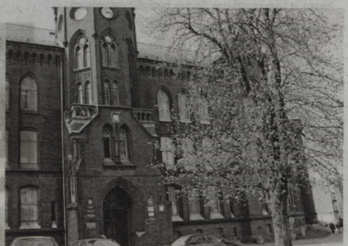
Dyżury pracowników Powiatowego Zespołu Ds. Orzekania o Niepełnosprawności w Malborku będą odbywały się w kwidzyńskim Powiatowym Centrum Pomocy Rodzinie znajdującym się przy ul. Grudziądzkiej.

nicy Powiatowego Zespołu ds. Orzekania o Niepełnosprawności będą w pierwszej kolejności przyjmować wnioski o wydanie legitymacji osoby niepełnosprawnej, wnioski o wydanie karty parkingowej oraz wydawać legitymacje osoby niepełnosprawnej i karty parkingowe. Wnioski o wydanie legitymacji osoby niepełnosprawnej i wydanie karty parkingowej oraz odbiór legitymacji osoby niepełnosprawnej, karty parkingowej muszą być złożone i odebrane osobiście przez osobę niepełnosprawną lub jej przedstawiciela. Z uwagi na możliwość wysłania pocztą wniosku o wydanie orzeczenia o stopniu niepełnosprawności, wnioski te będą przyjmowane pod koniec dyżuru. Dyżury prowadzone w siedzibie Powiatowe-