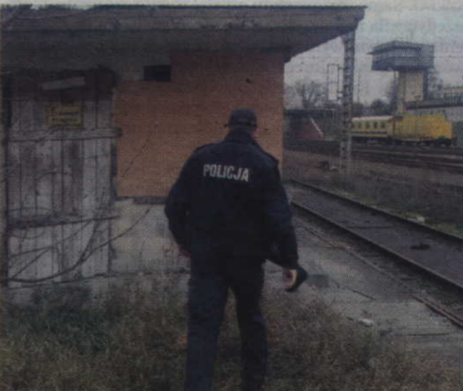
Policjanci sprawdzają miejsca, w których przebywać mogą osoby bezdomne.

KWIDZYN. Policjanci kontrolują miejsca, w których mogą przebywać bezdomni. Funkcjonariusze podkreślają, że niskie temperatury i zimowe warunki często stają się przyczyną nieszczęśliwych zdarzeń z udziałem osób znajdujących się w trudnej sytuacji życiowej. Jest to więc szczególnie niebezpieczny czas dla osób bezdomnych, nietrzeźwych czy też śpiących na ulicy.