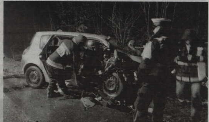
W wyniku tragicznego wypadku w Raniewie śmierć poniosły dwa małżeństwa wracające z pogrzebu.