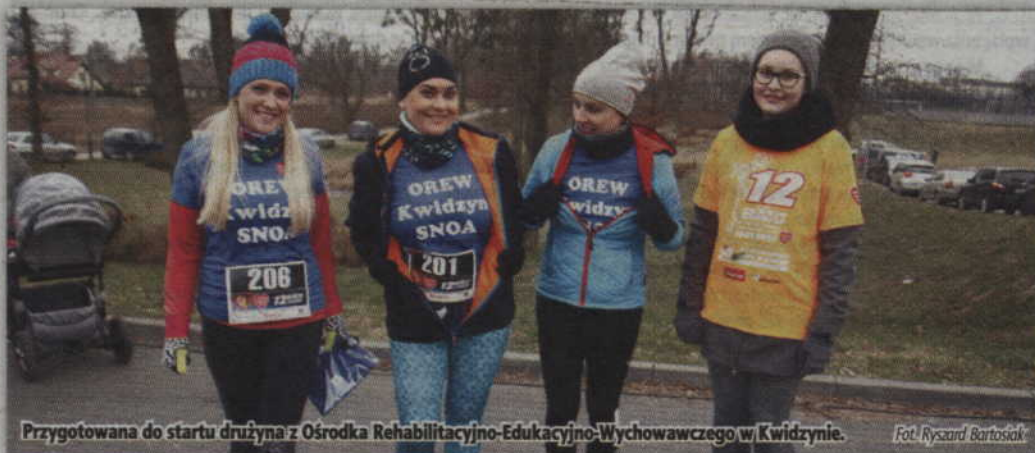
Przygotowana do startu drużyna z Ośrodka Rehabilitacyjno-Edukacyjno-Wychowawczego w Kwidzynie.