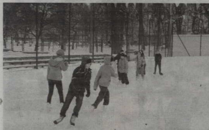
Z płyty lodowiska korzystać można bezpłatnie.