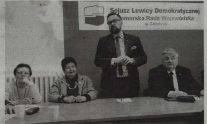
-Niestety mimo wyciągniętej ręki, nadal nie można zawrzeć porozumienia z partią „Razem” i jej liderem Adrianem Zandbergiem, którzy wbrew swojej nazwie chcą iść osobno, co na pewno nie jest dla lewicy dobre – zauważył Marcin Kulasek.

-Ostatnie głosowania sejmowe nad tzw. ustawami aborcyjnymi wykazały nieporadność i brak spójności zarówno PO, jak i Nowoczesnej, które dały się ogrzać Jarosławowi Kaczyńskiemu. Osłabienie tych ugrupowań daje szansę szeroko pojętej lewicy na powiększenie swojego elektoratu. Tzw. Zjednoczona Prawi-