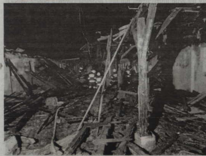
Straty jakie spowodował pożar oszacowano wstępnie na 20 tys. zł.

-Jak ustalili funkcjonariusze mężczyzna schował się w pomieszczeniu socjalnym, przed zamknięciem jednego z supermarketów. Po pewnym czasie postanowił z niego wyjść, ale pomieszczenie zostało zamknięte na klucz. Mężczyzna uszkodził więc kasetony w suficie i w ten sposób włamał się na salę sprze-