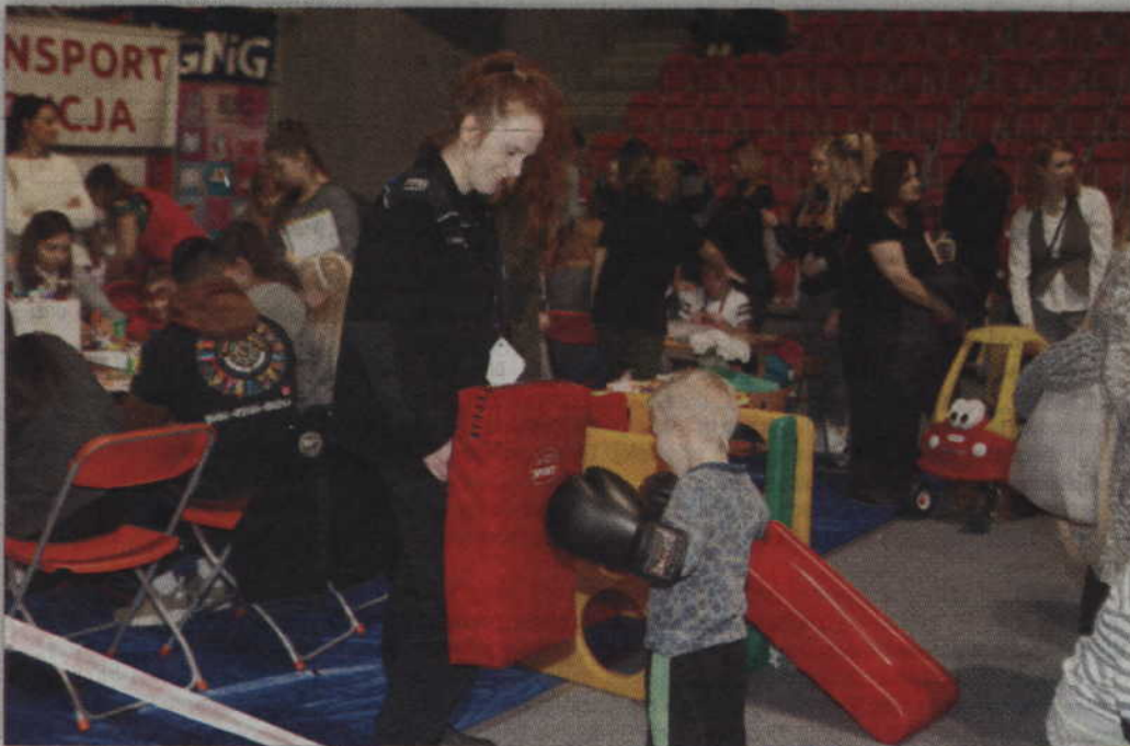
Najmłodsi mogli spędzić trochę czasu w kąciku zabaw.