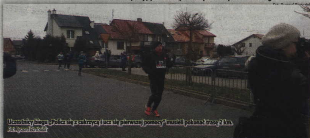
Uczestnicy biegu „Policz się z cukrzycą i ucz się pierwszej pomocy” musieli pokonać trasę 2 km.