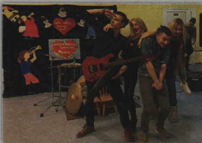
Kwidzyński zespół „Time Light” zagrał kilkanaście rockowych utworów.