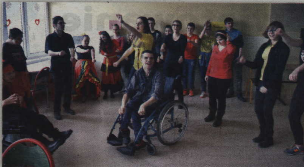
Dzięki wolontariuszom uczniowie ZSS w Kwidzynie poznawali m.in. kulturę i zwyczaje Hiszpanii.