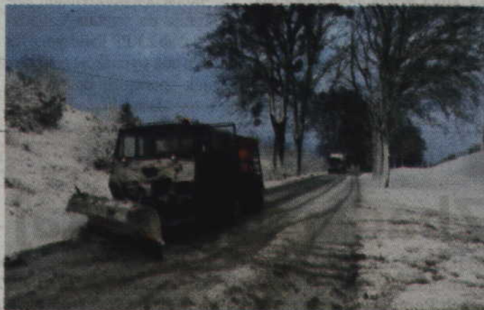
Zimowe utrzymanie obejmuje ok. 230 km dróg w całym powiecie kwidzyńskim.