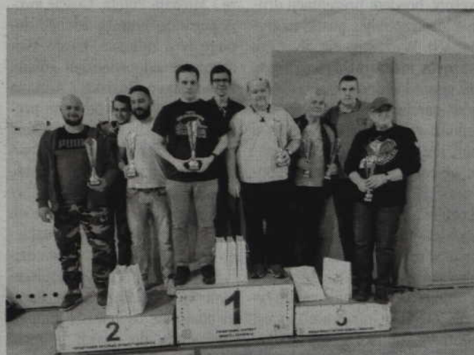
Rywalizację drużynową wygrała ekipa „3M”, która wyprzedziła „Czadowych Chłopaków” i „Starszych Panów”.