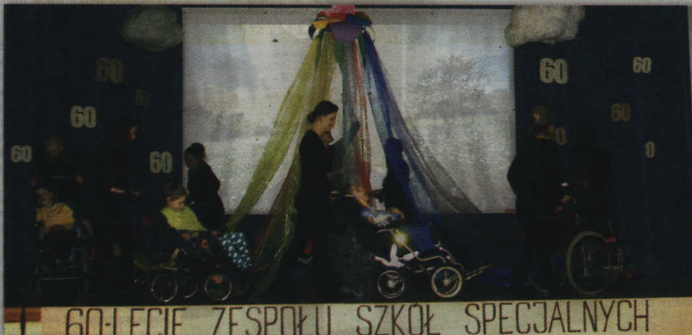
W listopadzie ubiegłego roku Zespół Szkół Specjalnych w Kwidzynie świętował 60-lecie swego istnienia.

Nie wszyscy jednak podzielali ten pogląd twierząc, że proponowane rozwiązanie nie jest korzystne dla dzieci i ich rodziców. Grupa mieszkańców złożyła wniosek, w którym opowiada się za powstaniem szkoły podstawowej