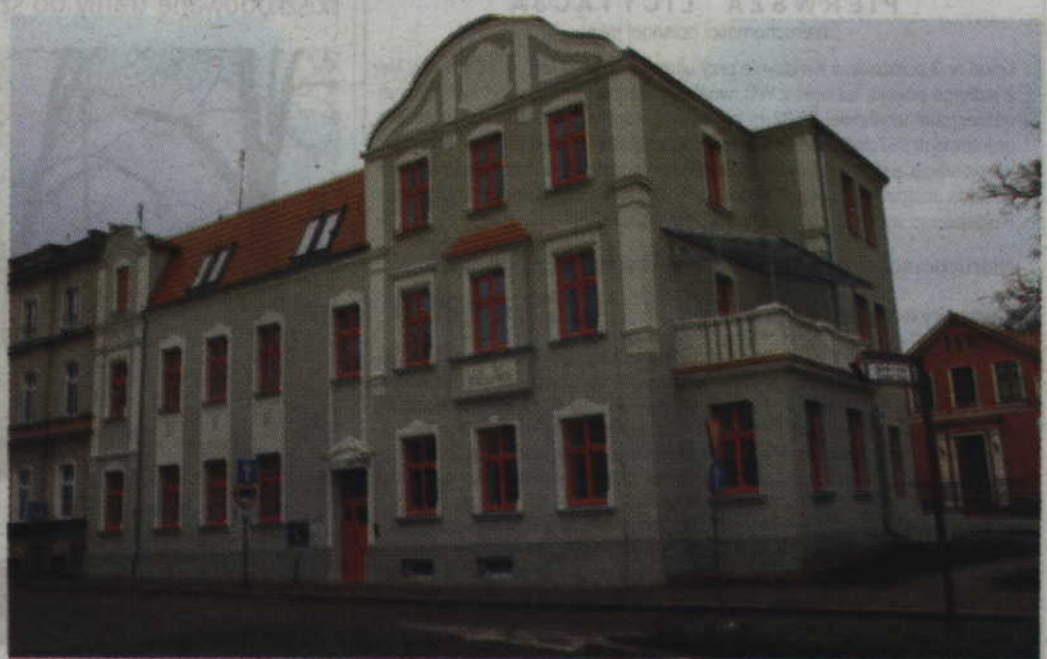
Oczekującym na mieszkania komunalne wskazane zostaną między innymi nowe lokale, które powstały w zakupionej i wyremontowanej przez miasto kamienicy u zbiegu ulic Słowiańskiej i Kościelnej.

-Dwa lokale są dostosowane do potrzeb osób niepełnosprawnych. Kandydaci do przydziału takiego lokalu zabiegają o to od kilku lat. Mamy dwa takie pilne przypadki. W jednym z nich analizowana jest jeszcze złożona dokumentacja. Jedno mieszkanie w tej kamienicy planujemy, na zasadzie zamiany, przekazać rodzinie, która mieszka w budynku jednorodzinny przy ul. Podgórznej. Budynek jest w bardzo złym stanie technicznym. Uwolniona zostanie dzięki temu duża działka i cała nieruchomości prawdopodobnie zostanie zbyta w drodze przetargu nieograniczonego - twierdzi