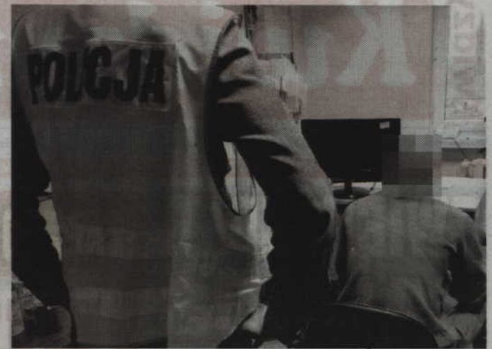
Zatrzymany 39-latek odpowie nie tylko za przebicie opon, ale także trzy inne przestępstwa.

Ponadto funkcjonariusze odkryli, że mężczyzna nielegalnie podłączył się do instalacji ener-