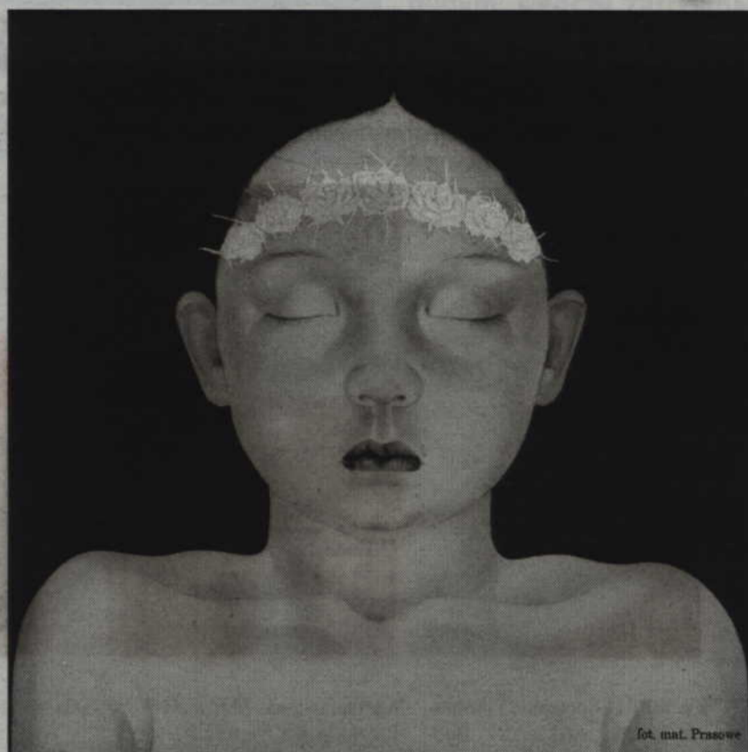
fol. mat. Prasowe

Białecka jest się artystką wyjątkową. Stworzyła oryginalny i wyrazisty styl. Wyróżnia ją niezwykle zdol-