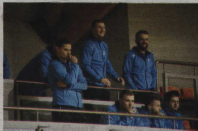
Drugą połowę meczu oglądali także zawodnicy Chrobrego Głogów, z którym MMTS zmierzy się już w najbliższą sobotę - 3 lutego.

sionego zwycięstwa. Zaznaczał jednak, że w najbliższą sobotę (3 lutego o godz. 17.00) czerwono-czarnych czeka jeszcze trudniejsze spotkanie. MMTS gościć będzie u siebie Chrobrego Głogów, który w ostatniej kolejce rozbił Spójnię Gdańsk 26:29 (głogowianie w drodze na mecz do Gdy-