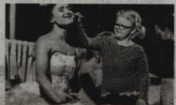
„Opera jak z bajki” to kolaż operowy przygotowany z myślą o najmłodszych.

wiadania. Aby arie, duety i tercety były zrozumiałe, oryginalny tekst został zastąpiony autorskimi tekstami w języku polskim. Wszystkie dialogi, zarówno te z dziećmi jak i na scenie, są w postaci improwizowanych recytatywów (śpiewnej melodeklamacji), również w języku polskim.