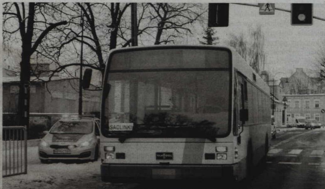
Do potrącenia 10-latkę doszło na przejściu dla pieszych znajdującym się na ul. Hallera, w pobliżu Szkoły Podstawowej nr 5.

KWIDZYN. Dziesięcioletnia dziewczynka wbiegła na czerwonym świetle wprost pod nadjeżdżający autobus. W innym miejscu kierowca peugeota potrącił przechodzącą przez przejście dla pieszych 50-latkę. W obu przypadkach poszkodowane trafiły do szpitala z obrażeniami głowy.