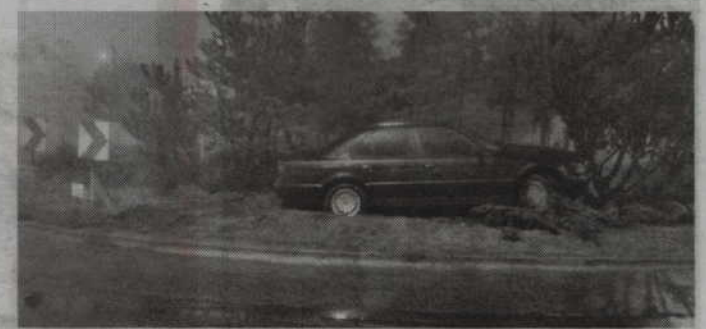
23-letni kierowca bmw nie zapanował nad swym autem i wjechał na wyspę Ronda Jana Pawła II.

Niebawem obaj przestępcy drogowi odpowiedzą przed są-