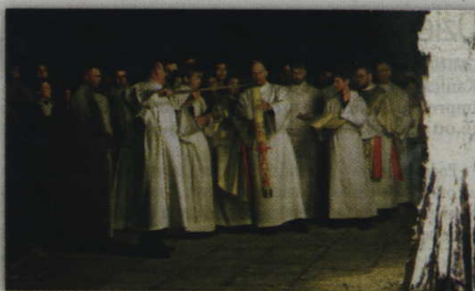
Najuroczystszym momentem apoteozy Chrystusa jako światła, który oświeca narody, jest podniosły obrzęd Wigilii Paschalnej.

Według podania procesja z zapalonymi świecami była znana w Rzymie już w czasach papieża św. Gelazego w 492 r. Od X w. upowszechnił się obrzęd poświęcania świec, których płomień symbolizuje Jezusa - Światłość świata, Chrystusa, który uciszał burze, był, jest i na zawsze pozostanie Panem wszystkich praw natury.