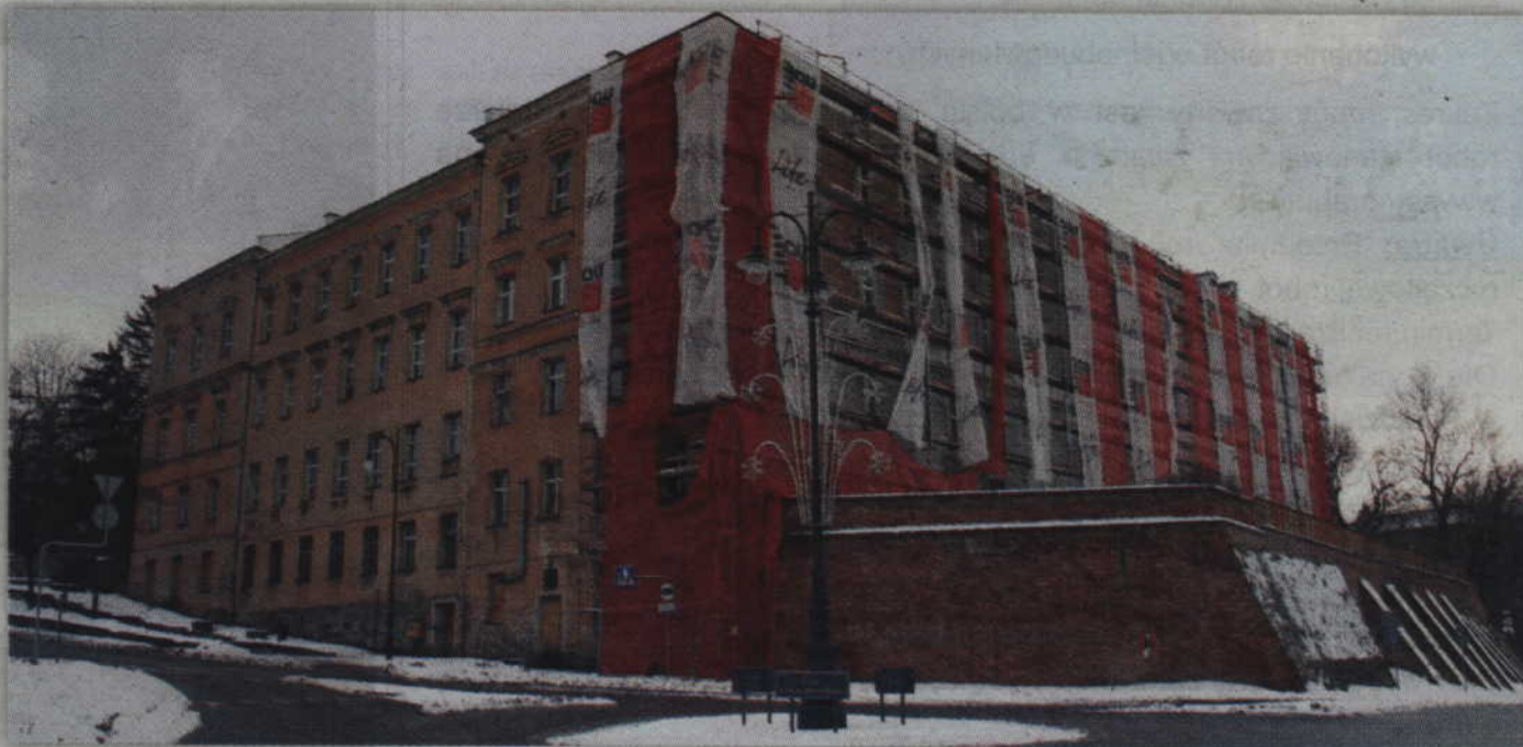
Trwa modernizacja gmachu Zespołu Szkół Ponadgimnazjalnych nr 2 w Kwidzynie. Prace rozpoczęły się w ubiegłym roku. Powinny zostać zakończone do października bieżącego roku.

- Podpisaliśmy aneks dotyczący rozszerzenia zakresu prac w budynku Zespołu Szkół Ponadgimnazjalnych nr 2, a niedługo to samo zrobimy w przypadku Zespołu Szkół Ponadgimnazjalnych nr 1. Zakres prac rozszerzamy o elementy związane z ochroną przeciwpożarową. To wymogi, które wynikają z ustawy, ale warunki jakie musimy spełnić określiła Komenda Wojewódzka Państwowej Straży Pożarnej w Gdańsku. Trzeba było uzupełnić wiele elementów, aby były zgodne z aktualnymi przepisami przeciwpożarowymi. Koszt dodatkowych prac w ZSP nr 2 to ok. 1,7 mln zł. W przypadku ZSP nr 1 koszty wyniosą w gra-