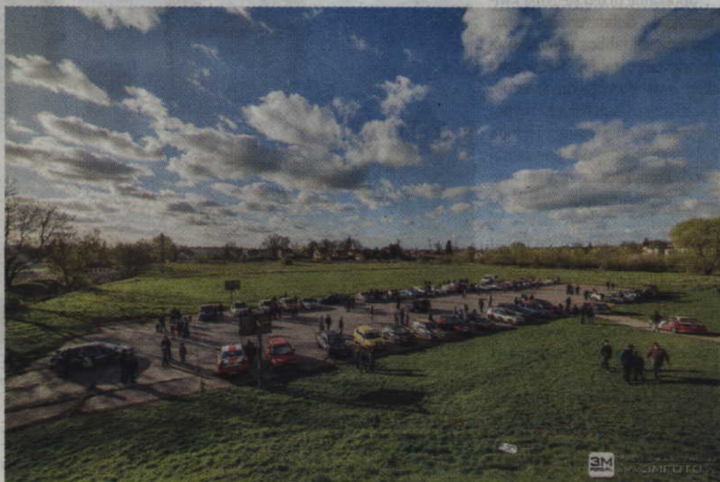
Na boisku przy ul. Gdańskiej odbywać się będą atrakcje towarzyszące zawodom. Na miejscu będzie można również porozmawiać z zawodnikami oraz obejrzeć startujące auta.