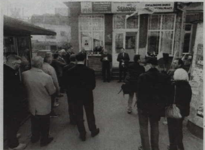
Podczas spotkania przed siedzibą kwidzyńskiej Solidarności odczytano m.in. nazwiska osób poległych w katastrofie lotniczej z 2010 roku.