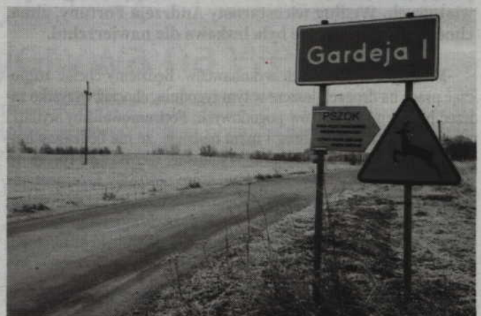
Ulice Osiedlowa i Nowa mogą być wyremontowane dopiero wówczas gdy w gminnym budżecie pojawią się pieniądze czyli dopiero za kilka lat.

cy przystąpili geodeci okazało się bowiem, że część drogi przebiega poza gruntem gminnym. Aby doszło tam do prac modernizacyjnych, zatrudnieni przez gminę geodeci musieli wytyczyć prawidłowy przebieg drogi. W przypadku tej petycji, za jej słusznością głosowało 9 radnych, a 4 z nich było przeciwnych. Nieco inaczej przebiegało głosowanie w sprawie petycji dotyczącej Gardei 1, a konkretnie dwóch ulic: Osiedlowej i Nowej. Za zasadnością opowiedziało się 6 rad-