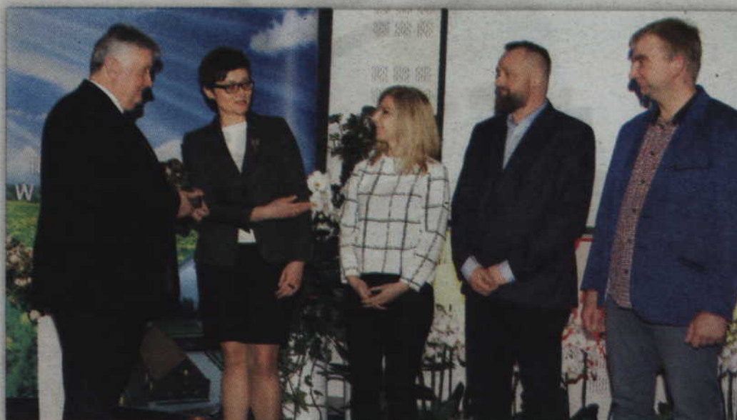
21 osób i instytucji otrzymało Honorową Nagrodę Przewodniczącego Rady Powiatu Kwidzyńskiego i Starosty Kwidzyńskiego. Na zdjęciu członkowie wyróżnionego stowarzyszenia „Zakątek Dankowo”.

- To dla mnie prawdziwy zaszczyt i przyjemność wręczyć nagrody przewodniczącego rady powiatu, móc uhonorować osoby,