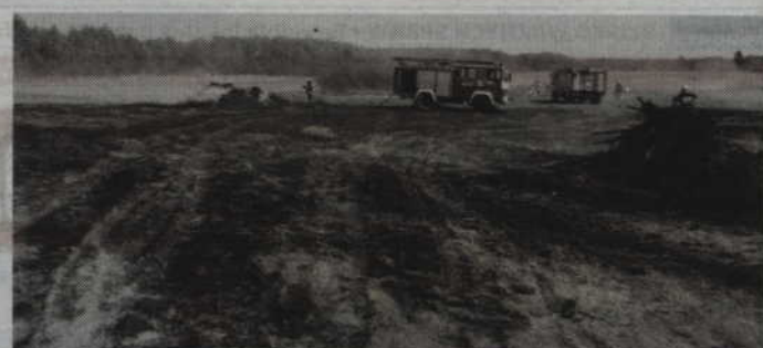
Policjanci przypominają, że wypalanie traw jest prawnie zabronione.

-Niezależnie od olbrzymich strat w środowisku, wzniesienie pożarów niesie również realne niebezpieczeństwo dla ludzi.