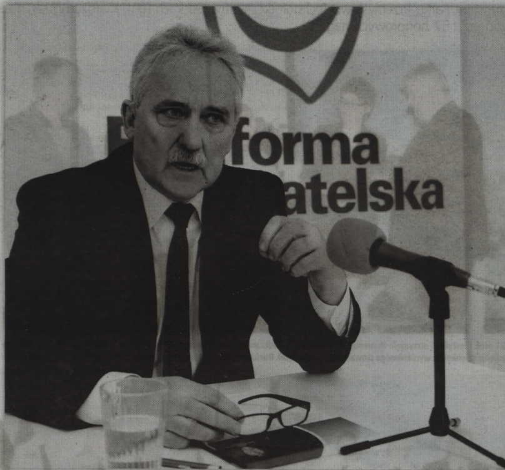
Jeżeli władza ustawodawcza, wykonawcza i sądownicza znajdują się w jednych rękach, to każdy powinien się bać - twierdzi senator Leszek Czarnobaj.

- Chcę przede wszystkim podkreślić, że o tym czy jest łamana praworządność w Polsce orzekają sądy. Są jednak grupy osób, które uważają, że zostały pokrzywdzone przez państwo polskie. Jako zespół założyliśmy sobie, że nie będziemy zajmowali się łamaniem, w naszej ocenie, praworządności np. w zakresie sądownictwa. Uznaliśmy, że spróbujemy wysłuchać wszystkich stron konfliktu. Nie zajmujemy się jednostkowymi sprawami, gdyż to leży w gestii Rzecznika Praw Obywatelskich, ale określonych grup społecznych czy też instytucji, które sygnalizują nam, że w ich ocenie nagminnie łamane jest prawo. Nasze zadanie to zebranie w jednym miejscu i czasie przedstawicieli rządu, danej grupy społecznej, instytucji czy organizacji. Zapraszamy też