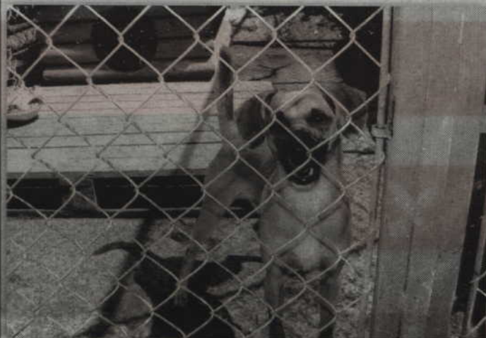
Wolontariusze pojawili się na obradach Komisji zaniepokojeni losem przytuliska dla zwierząt w Miłosnej.

Wszyscy oferenci mogą zapoznać się z Regulaminem Przetargu, który znajduje się w Dziale Członkowskim.