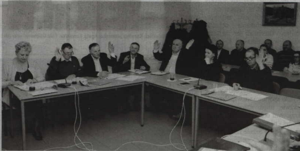
Sadlińscy radni nie kryli swego niezadowolenia z faktu, iż na ich sesji nie pojawiła się osoba odpowiedzialna za konkretne remonty na drogach wojewódzkich.