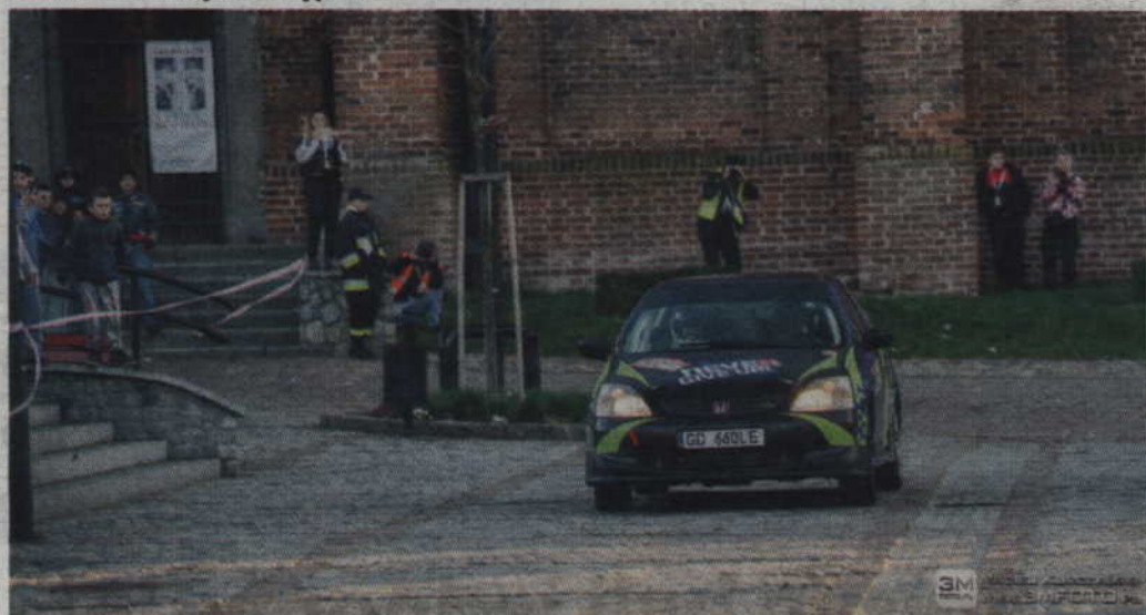
Sobotni prolog odbędzie się na ulicach Kwidzyna.

Podobnie jak w zeszłych latach, część sportowa rajdu zaliczanej do cyklu Rajdowych Samochodowych Mistrzostw Pomorza, rozpocznie się od widowiskowego, sobotniego (14 kwietnia) prologu w samym centrum Kwidzyna. Rozpoczęcie głównej części zaplanowane jest na godzinę 18.45, jednak wcześniej odbędą się atrakcje towarzyszące oraz możliwość odwiedzenia zawodników i ich pojazdów w parku przedstartowym przy ulicy Gdańskiej.