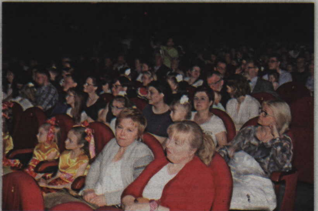
Festiwalowa publiczność żywiłowo reagowała na występy każdego z uczestników.