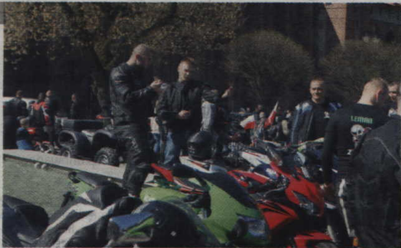
Spotkanie w Kwidzynie to także okazja do ciekawych rozmów.