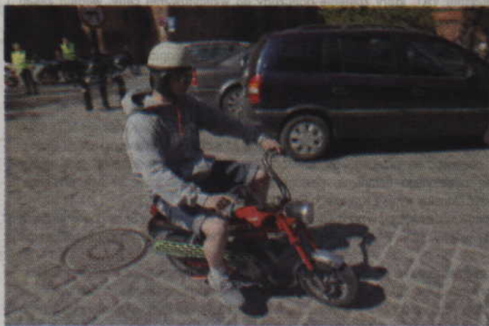
Pocziwy stary Romet to także jednoślad.