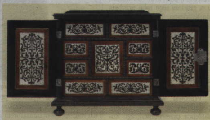
Tematem spotkania będzie odrestaurowany kabinet stołowy z XVII wieku.

kwidzińskim muzeum dodają ne zostaną wydawnictwa muze- również, że wśród uczestników alne. (fox)