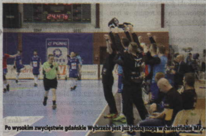
Po wysokim zwycięstwie gdańskie Wybrzeże jest już jedną nogą w ćwierćfinale MP.