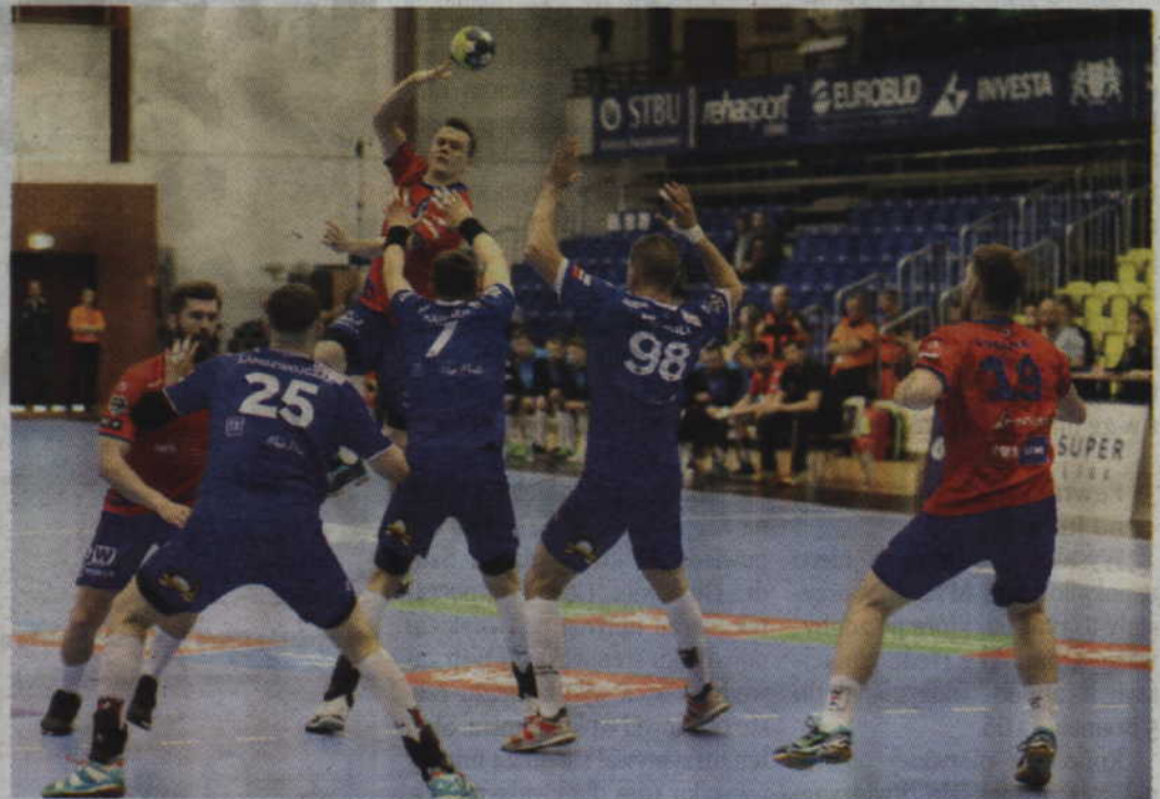
Gdańszczanie zaatakowali MMTS już od pierwszej minuty meczu.