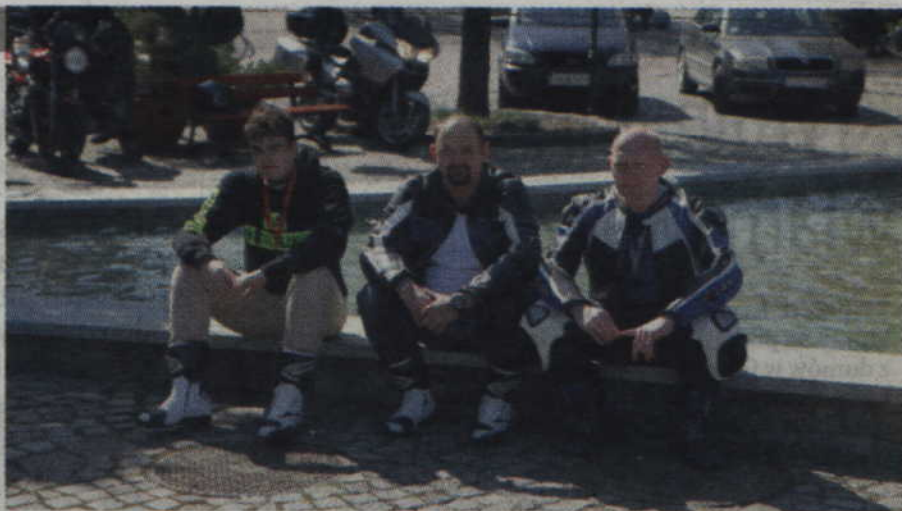
Po długiej jeździe należy się chwila odpoczynku.