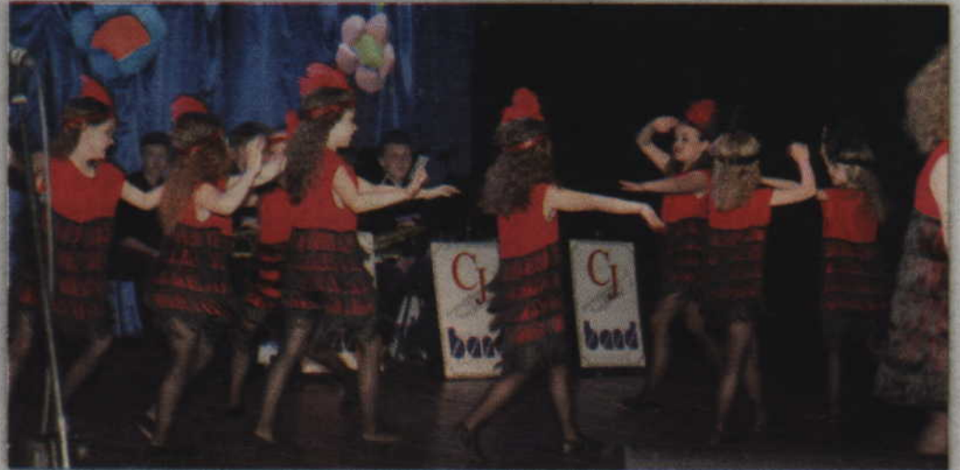
Zespół „Promyki” z Przedszkola Niepublicznego „Promyk” w Kwidzynie.

KWIDZYN. „Magiczna podróż”, „Brazylijska samba”, „Marzenia butów” czy „Piosenka na cztery kopyta i wiatr” to tylko niektóre z utworów jakie w minioną sobotę usłyszeć można było w kwidzyńskim teatrze. Okazją do tego był XXIV Pomorski Festiwal Piosenki Dziecięcej, którego organizatorem jest Niepubliczne Przedszkole nr 2 w Kwidzynie. Grand Prix tegorocznego festiwalu zdobyło Przedszkole z Oddziałami Integracyjnymi w Kwidzynie.