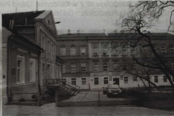
Władze powiatu mają problemy z zakupem wyposażenia do pracowni w ZSP nr 2, przeznaczoną dla przyszłych techników papierników.

Środki przyznano na realizację dwóch projektów oświatowych: „Podniesienie jakości szkolnictwa zawodowego w powiecie kwidzyńskim - modernizacja obiektów szkolnych wraz z wyposażeniem”, dotyczący modernizacji budynków ZSP nr 1 i 2 oraz zakupu wyposażenia dla ZSP nr 1 i 2 i Centrum Kształcenia Zawodowego i Ustawicznego oraz „Podniesienie jakości szkolnictwa zawodowego w powiecie kwidzyńskim - większa zatrudnialność uczniów”, obejmujący między innymi dofinansowania praktyk zawodowych i różnego rodzaju zajęć dla uczniów oraz szkoleń dla nauczycieli,