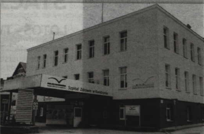
Kwidziński szpital przyłącza się do kampanii „Chroń życie – myj ręce” prowadzoną przez Światową Organizację Zdrowia.

KWIDZYN. Szpital „Zdrowie” w Kwidzynie przyłącza się do kampanii „Chroń życie – myj ręce” prowadzoną przez Światową Organizację Zdrowia. Akcja poświęcona jest prewencji sepsy, którą dotyka 30 mln pacjentów rocznie. We środę, 25 kwietnia, przy stoisku w holu kwidzińskiego szpitala, już od godziny 9.00 rano, będzie można uzyskać od konsultantów informacje na temat higieny rąk.