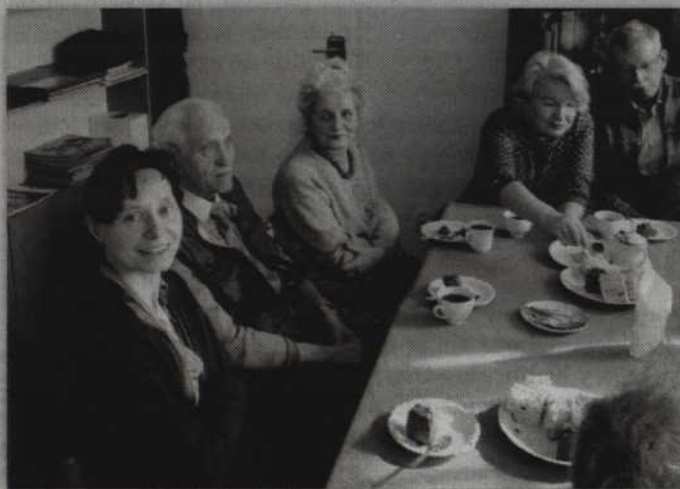
Jubilat podczas spotkania z działaczami PTTK i TMZK.