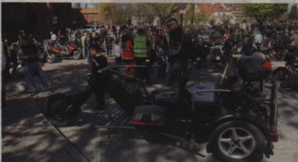
Efektowny trójkołowiec wzbudzał zainteresowanie nie tylko kwidzyńskich.