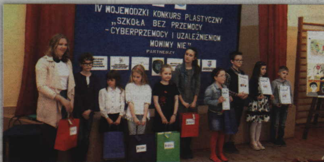
Wspólne zdjęcie laureatów IV Wojewódzkiego Konkursu Plastycznego „Szkoła bez przemocy – cyberprzemocy i uzależnieniom mówimy nie!”