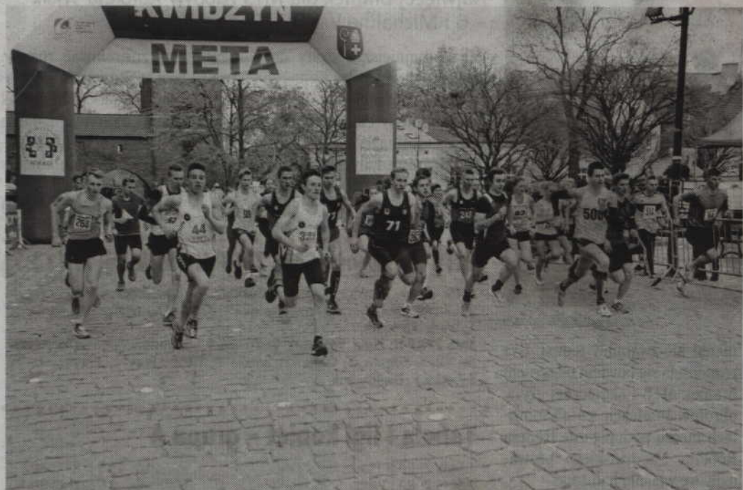
Start i meta zawodów unijnych umiejscowiona zostanie przy kwidzyńskim kościele katedralnym.

LEKKOATLETYKA. Kwidzyński Klub Lekkoatletyczny „Rodło” zaprasza na XV Unijny Ogólnopolski Bieg Uliczny oraz XIII Ogólnopolski Unijny Bieg Osób Niepełnosprawnych. Zawody odbędą się w najbliższą niedzielę, 29 kwietnia, a start i meta zlokalizowane zostaną przy Placu Św. Jana Pawła II (ul. Katedralna). Wstęp wolny.