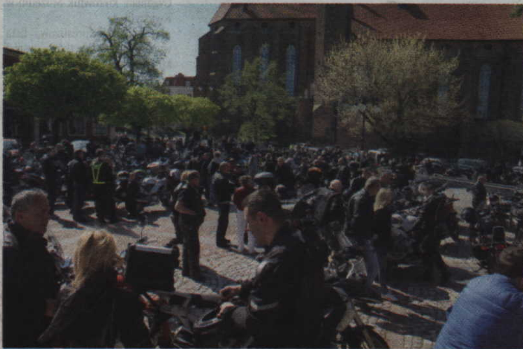
Plac św. Jana Pawła II dosłownie zapelniał się motocyklami.