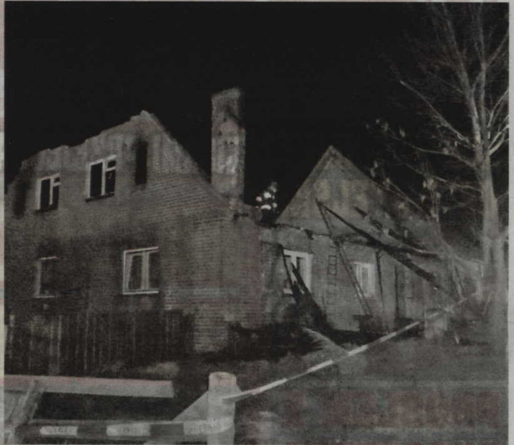
Na ok. 500 tys. zł oszacowano wstępnie straty jakie spowodował pożar budynku mieszkalnego w Barcicach.

GMINA RYJEWO. Na ok. 500 tys. zł oszacowano wstępnie straty jakie spowodował pożar budynku mieszkalnego w Barcicach. Do zdarzenia doszło 10 kwietnia. W wyniku pożaru na szczęście nikt nie ucierpiał.