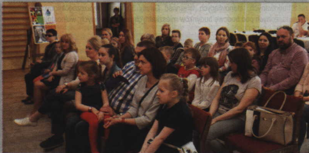
Podsumowanie konkursu odbyło się w Szkole Podstawowej w Czarnem Dolnym.

- Ze względu na wiek dzieci biorących udział w konkursie został on podzielony na dwie kategorie. W pierwszej z nich, obejmującej klasy I-III szkoły podstawowej głównym tematem była bezpieczna szkoła. Cyberprzemoc została zarezerwowana dla uczniów z klas IV-VII szkoły podstawowej. Nadesłane prace przekazaliśmy do oceny komisji