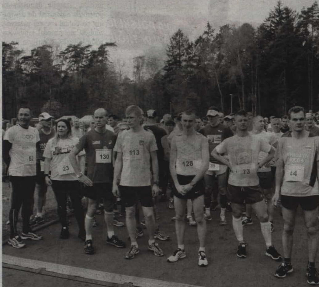
W ubiegłym roku na starcie I Prabuckiego Biegu Przelajowego „Wokół Komina” stanęło 126 zawodników.

BIEGI. Prabuckie Centrum Kultury i Sportu, Urząd Miasta i Gminy Prabuty, Traktor Team Gmina Kwidzyn oraz Towarzystwo Rozwoju Sportu Szkolnego w Prabutach zapraszają na II Prabucki Bieg Przelajowy „Wokół Komina”. Zawody odbędą się w najbliższy piątek, 5 maja, a start i meta zlokalizowane zostaną na stadionie przy sanatorium.