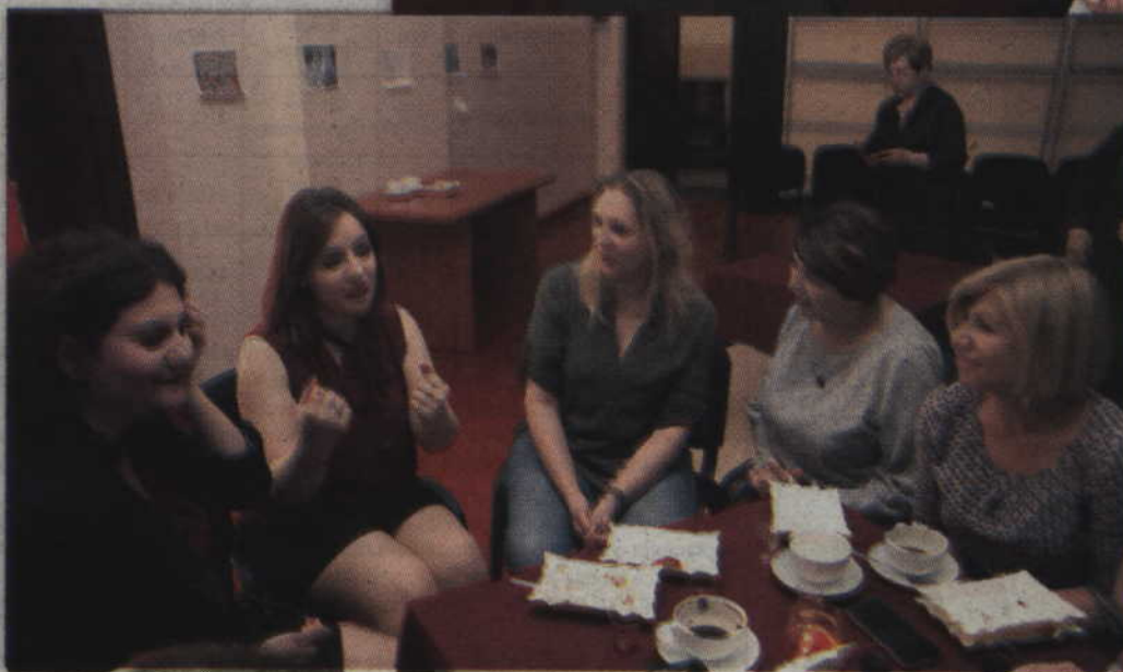
Polacy ciągle się uśmiechają, są bardzo życzliwi i pomocni – tak twierdzą wolontariuszki z Armenii.

w Turcji. Kolejną ciekawostką związaną jest z religią, bowiem Armenia była pierwszym krajem który pod koniec starożytności przyjął chrześcijaństwo. Ormiańska flaga składająca się z trzech kolorów ma także odniesienie do przeszłości tego kraju.