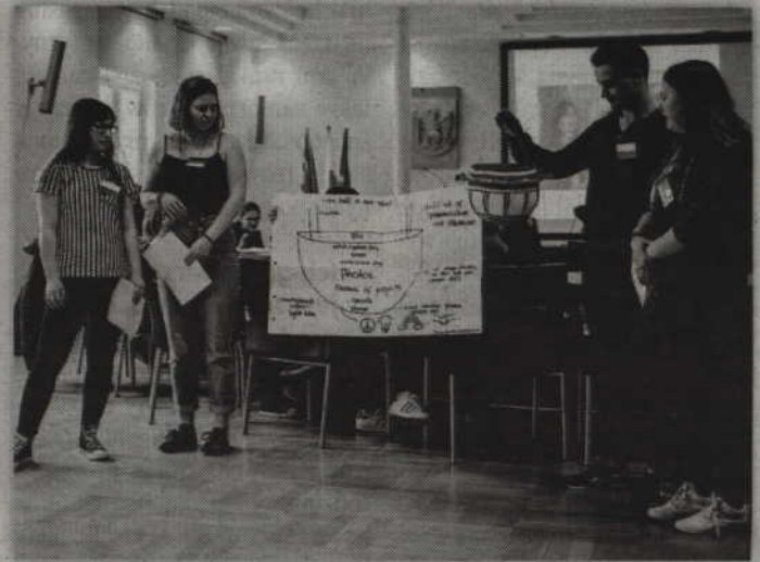
Modele pomnika zostały zaprezentowane w Starostwie Powiatowym w Kwidzynie.

- Chodzi w nim również o utrwalanie języka niemieckiego, poznanie innych ludzi, współpracę młodzieży oraz pobudzanie własnej kreatywności, a także in-