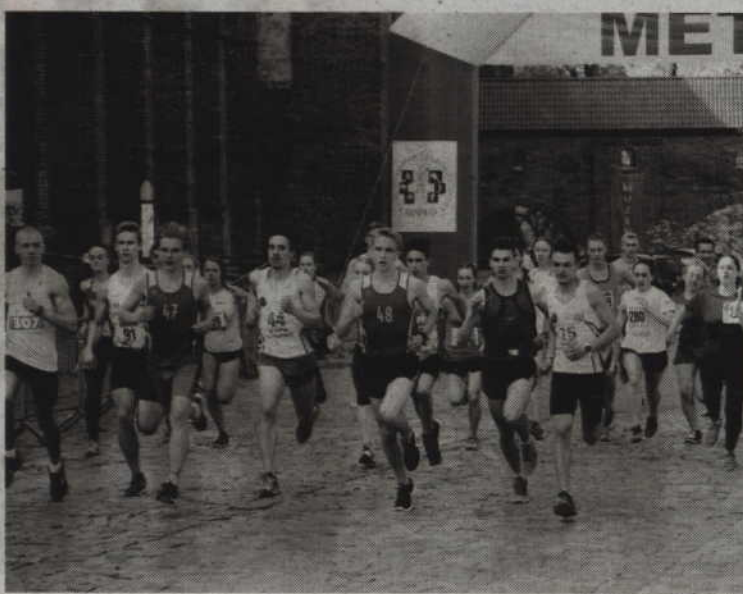
Najstarsi z uczestników biegu rywalizowali na trasie 2 km.

Więcej o zawodach przeczytacie Państwo w kolejnym numerze „Kuriera Kwidzyńskiego”. (fox)