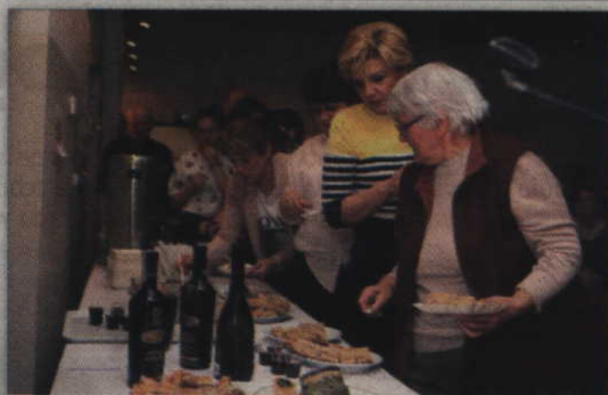
Degustacja dań kuchni z kraju, z którego pochodzą bohaterowie sąsiedzkich spotkań to prawdziwa kulinarna uczta.