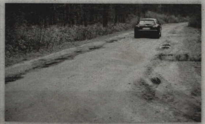
Droga nr 611, prowadząca do Okrągłej Łąki w niektórych miejscach ma mniej niż 3 metry szerokości.

- Każdego roku składamy wnioski do Ministerstwa Obrony Narodowej, aby z tych dróg zdjąć zależność wojskową. Otrzymujemy jednak decyzje odmowne. Tak naprawdę zderzamy się ze ścianą. Według nowych wytycznych droga wojewódzka powinna mieć minimum 6 metrów szerokości,