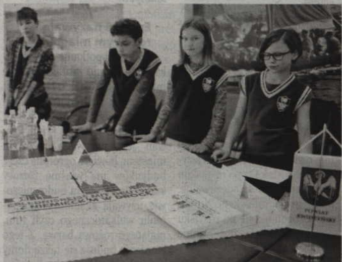
Lekcja języka niemieckiego prowadzona była metodą stacji wykorzystując materiały dydaktyczne z konkursu Erlebnisreise mit Deutsch

Lekcja języka niemieckiego odbyła się w siedzibie Starostwa Powiatowego w Kwidzynie.