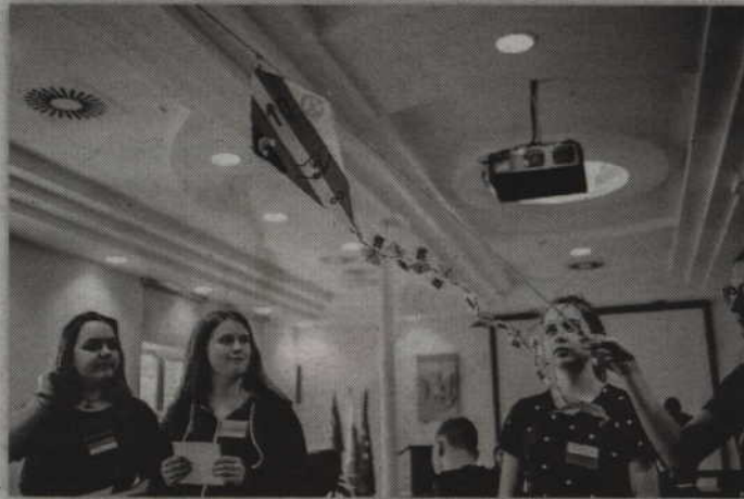
Latawiec, który zostanie wykonany w czerwcu tego roku w Niemczech będzie symbolizował współpracę pomiędzy szkołą Integrierten GesamtSchule Osterholz-Scharmbeck, Ośrodkiem Szkoleniowym Bredbeck w powiecie Osterholz i II Liceum Ogólnokształcącym w Kwidzynie.