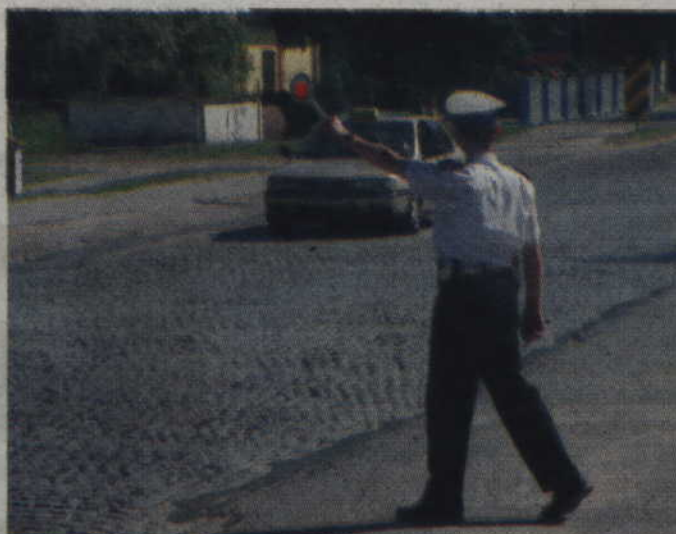
Wiele zgłoszeń w Krajowej Mapie Zagrożeń dotyczy bezpieczeństwa w ruchu drogowym, w tym przekraczania dozwolonej prędkości.

Według przepisów kierowanie pojazdem pomimo zatrzymania prawa jazdy powoduje wydłużenie okresu zatrzymania do 6 miesięcy. Jeżeli dana osoba będzie kolejny raz kierować w tym okresie, starosta wyda decyzję administracyjną o cofnięciu uprawnień, a kierowanie pomimo tego stanowi przestępstwo i