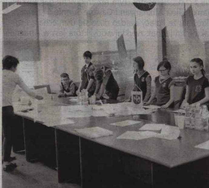
Uczniowie klasy 5a Społecznej Szkoły Podstawowej im. Polskich Noblistów w Kwidzynie odbyli nietypową lekcję języka niemieckiego w Starostwie Powiatowym w Kwidzynie.

POWIAT. Uczniowie klasy 5a Społecznej Szkoły Podstawowej im. Polskich Noblistów w Kwidzynie odbyli nietypową lekcję języka niemieckiego. Nie było zeszytów i książek. Zamiast tego wykorzystano plakaty i karty dostępne w ramach konkursu Erlebnisreise mit Deutsch, który pozwala na bardziej zabawowy i kreatywny sposób nauki języka.