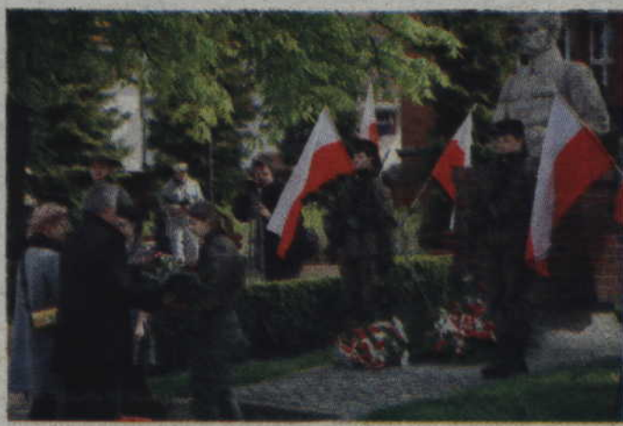
Podczas uroczystości delegacje złożą kwiaty m.in. pod pomnikiem Marszałka Józefa Piłsudskiego.

Uroczystości rozpoczną się spotkaniem na Skwerze Kombatantów, gdzie wygłoszony zostanie referat okolicznościowy. Delegacje symbolicznie złożą również wieńce i kwiaty. Następnie zebrani przejdą ulicami miasta pod pomnik Marszałka Józefa Piłsudskiego, gdzie również złożone zostaną kwiaty. Ostatnim przystankiem orszaku prowadzonego przez Orkiestrę Dętą „Helikon” będzie Msza św. sprawowana w kościele pw. Św. Jana Ewangelisty o godzinie 11.00. Po Nabożeństwie, na Placu Św. Jana Pawła II odbędzie się natomiast koncert patriotyczny. Na scenie wystąpi Zespół Kameralny Orkiestry im. Johanna Straus-