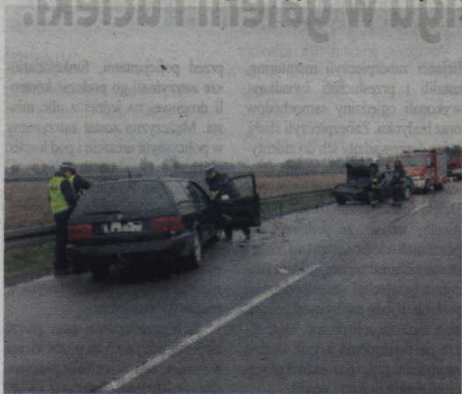
fol. KMP Elbląg

Przez ponad godzinę trwały utrudnienia w ruchu na drodze K-22 do Malborka. 25 kwietnia br. doszło tam do zderzenia dwóch pojazdów: vw passata i vw bory. W wyniku tego 3 osoby przewieziono do szpitala.