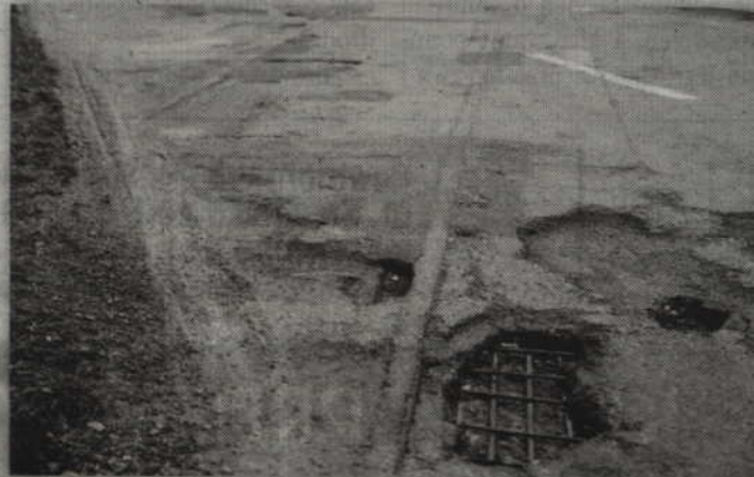
Tory po torowisku prowadzącym do dawnego tartaku powinny zniknąć już w maju.

kład chodnika i właściwie tylko tyle mam dobrych informacji. Nie mogę niestety obiecać jakichkolwiek gruntownych remontów czy wykonania nakładek na najbardziej zniszczonych odcinkach – poinformował Tomasz Miler.