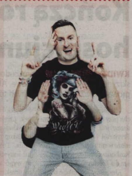
Jedną z gwiazd tegorocznych Dni Prabut będzie NORBI.

Niedziela, 3 czerwca III Prabucka Senioriada „Pomorskie dla zdrowia” 10.00–18.00 Lekarskie konsultacje specjalistów (m.in. onkolog, dermatolog) 13.00 – Msza Św. w intencji uczestników Senioriady (Konkatedra Św. Wojciecha) 14.00 – Otwarcie III Prabuckiej Senioriady 14.15 – Rozpoczęcie zmagani rekreacyjno-sportowych 14.30 – Pomorskie dla Zdrowia (wręczenie „Złotych Czepeków”) 15.00 – Prezentacje sceniczne uczestników Senioriady 17.30 – Ogłoszenie wyników 18.00 – koncert zespołu „No To Co” 20.00 – Zabawa plenerowa