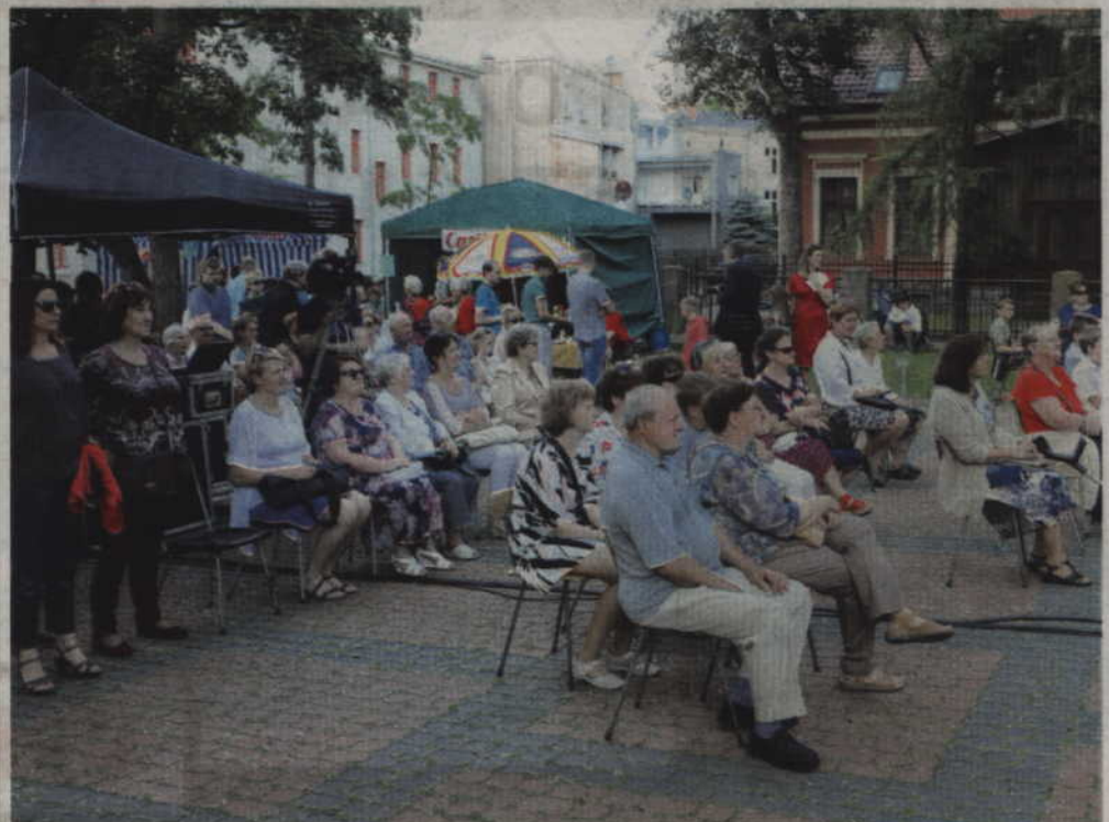
Wierni przysłuchujący się koncertowi Harfy Gospel Choir.