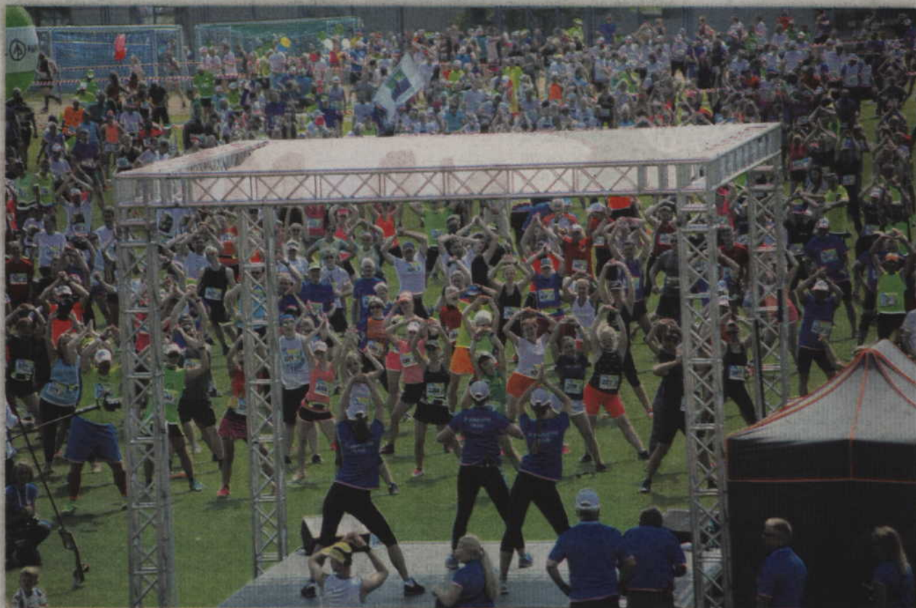
Efektowna rozgrzewka odbywała się na płycie głównej kwidzyńskiego stadionu.

- W tym roku nie liczyłam na poprawę swoich wyników