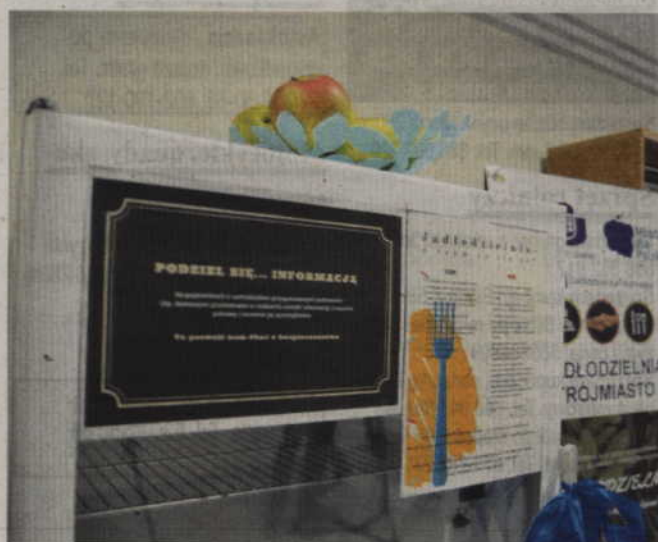
Tak wygląda jadłodzielnia działająca na UG.

Uruchomienie jadłodzielni nie wymaga zbyt wielu formalności. Potrzebne jest gniazdko z prądem do włączenia lodówki i trochę miejsca na regał z półkami na produkty nie wymagające schła-