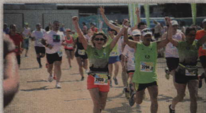
Przekroczenie mety zawsze wyzwała w zawodnikach dodatkowe emocje.