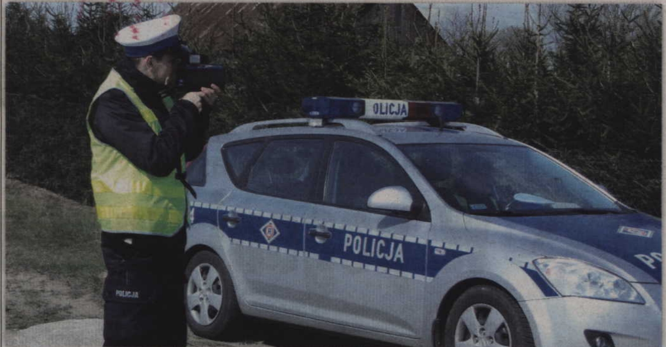
Policjanci z drogówki ukarali 21-letniego kierowcę mandatem karnym w kwocie 500 zł i 10 punktami karnymi. Mężczyzna stracił również prawo jazdy.

GMINA GARDEJA. Kwidzyńscy policjanci zatrzymali pirata drogowego, który w terenie zabudowanym jechał z prędkością 102 km/h. Tym samym przekroczył przepisy aż o 52 km/h! Jak się okazało zatrzymany kierowca opla już po raz drugi stracił prawo jazdy na trzy miesiące. Funkcjonariusze ukarali mężczyznę wysokim mandatem i punktami karnymi.