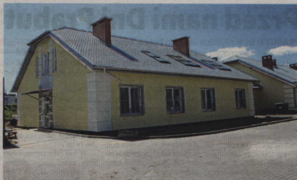
Dobiega końca rozbudowa kwidzyńskiego hospicjum. Nowe skrzydło obiektu jest gotowe. Trwają odbiory techniczne.

-Została zaprojektowana kaptura, która zostanie przeniesiona do nowego skrzydła z głównej części budynku. Na podda-