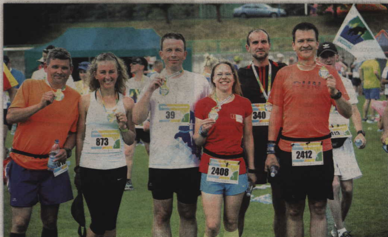
Zdobytą medal i pokonanie 10 km trasy to zawsze jest powód do dumy.