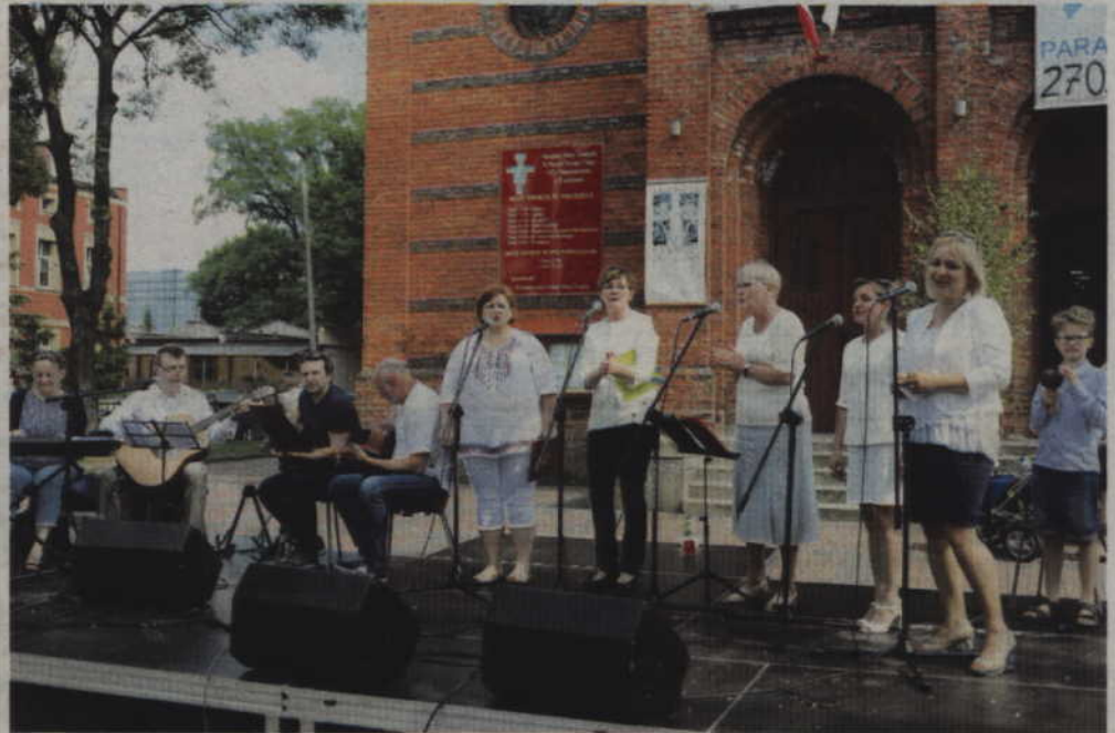
Podczas tegorocznej Parafiiady wystąpił m.in. członkowie Odnowy w Duchu Świętym (Górze Jeruzalem).