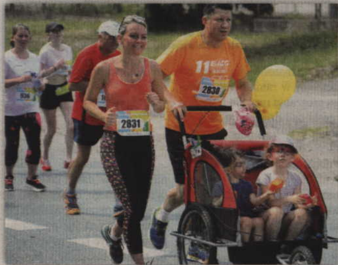
Na trasie nie brakowało całych rodzin.